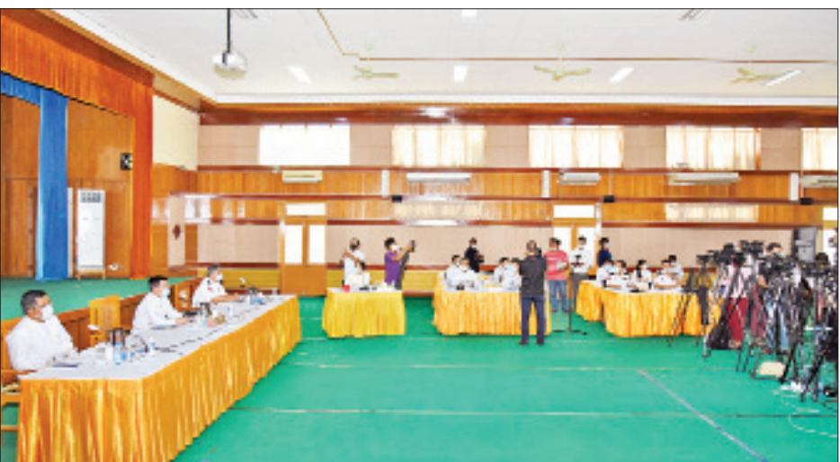
အလုပ်သမား၊ လူဝင်မှုကြီးကြပ်ရေးနှင့် ပြည်သူ့အင်အားဝန်ကြီးဌာန၏ စတုတ္ထ (၁)နှစ်တာကာလ ဆောင်ရွက်ခဲ့မှုများနှင့် စပ်လျဉ်း၍ ဒုတိယဝန်ကြီး ဦးမြင့်ကြိုင် ရှင်းလင်းပြောကြားစဉ်။

ပြည်ဝင်/ပြည်ထွက် ခွင့်ပြုမှုအနေဖြင့် အပြည်ပြည်ဆိုင်ရာလေဆိပ် သုံးခုကို ရန်ကုန်၊ မန္တလေးနှင့် နေပြည်တော်တွင်လည်းကောင်း၊ အပြည်ပြည်ဆိုင်ရာဆိပ်ကမ်းတစ်ခုကို ရန်ကုန်တွင်လည်းကောင်း၊ အပြည်ပြည်ဆိုင်ရာ နယ်စပ် ဝင်/ ထွက်ပေါက်ခြောက်ခုကို တာချီလိတ်၊ မြဝတီ၊ ကော့သောင်း၊ ထီးခီး၊ တမူး၊ ရဲခေါင်ရိတ်တွင် ဖွင့်လှစ်ထားရှိပါကြောင်း၊ မြန်မာ - လာအိုနယ်စပ် ကျိုင်းလပ်-စီအင်ကောက်နယ်စပ်ဂိတ်ကို အပြည်ပြည် ဆိုင်ရာနယ်စပ် ဝင်/ထွက်ပေါက်