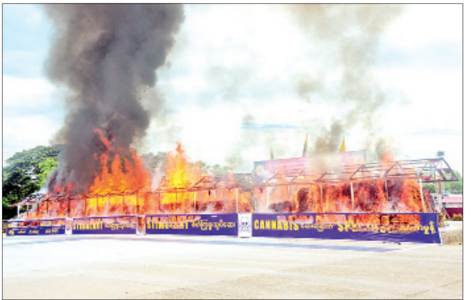
ရန်ကုန်တိုင်းဒေသကြီး လှိုင်သာယာမြို့နယ်ရှိ ရန်ကုန်အနောက်ပိုင်း ကုန်တင်ယာဉ်ရပ်နားကွင်း၌ ဖမ်းဆီးရမိ မူးယစ်ဆေးဝါးနှင့် ဓာတုပစ္စည်းများ မီးရှို့ဖျက်ဆီးစဉ်။

ကျော်၊ ဘိန်းစာမှုန့် ၃၀၄၂ ကီလိုခန့်၊ ကတ်တမင်း ၅၁၅ ကီလိုကျော် အပါအဝင် မူးယစ်ဆေးဝါး ၂၆ မျိုးနှင့် ဓာတုပစ္စည်း ၂ မျိုးတို့၏ စုစုပေါင်းတန်ဖိုး မြန်မာငွေကျပ် ၂၀၈ ဒသမ ၈၇ ဘီလီယံ (အမေရိကန် ဒေါ်လာ ၁၄၄ သန်းကျော်)အား ဖျက်ဆီးခဲ့သည်။ မန္တလေးတိုင်းဒေသကြီး အောင်မြေ သာစံမြို့နယ် ဥပုသ်တော်ရပ်ကွက်ရှိ