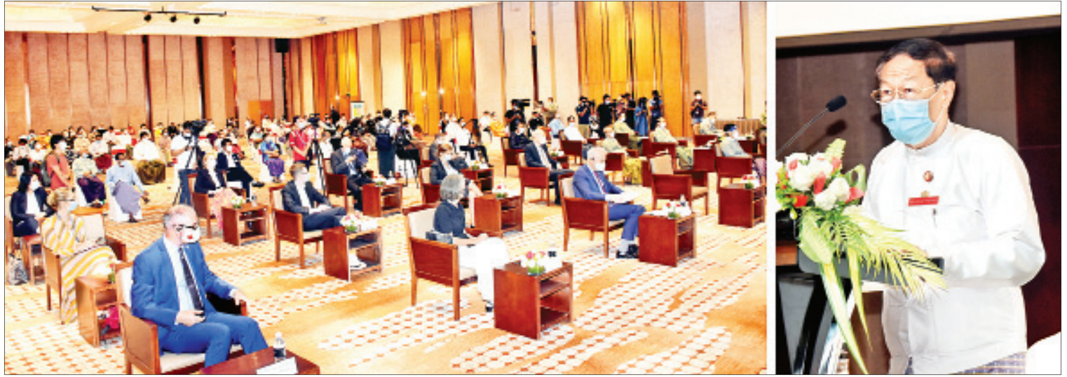
ပြည်ထောင်စုရွေးကောက်ပွဲကော်မရှင်ဥက္ကဋ္ဌ ဦးလှသိန်း နိုင်ငံရေးပါတီများနှင့် ကိုယ်စားလှယ်လောင်းများအတွက် ကျင့်ဝတ် Code of Conduct (CoC) လက်မှတ်ရေးထိုးပွဲအခမ်းအနားတွင် အမှာစကားပြောကြားစဉ်။

ရန်ကုန် ဇွန် ၂၆ ပြည်ထောင်စုရွေးကောက်ပွဲကော်မရှင်နှင့် ဆွစ်ဇာလန်နိုင်ငံသံရုံးတို့ ပူးပေါင်းကျင်းပသည့် နိုင်ငံရေးပါတီများနှင့် ကိုယ်စားလှယ်လောင်းများအတွက် ကျင့်ဝတ် Code of Conduct (CoC) လက်မှတ်ရေးထိုးပွဲအခမ်းအနားကို ယနေ့ မွန်းလွဲ ၁ နာရီခွဲတွင် ရန်ကုန်မြို့ရှိ Melia ဟိုတယ်၌ ကျင်းပသည်။ လက်မှတ်ရေးထိုးပွဲသို့ ပြည်ထောင်စုရွေးကော်မရှင်ဥက္ကဋ္ဌ ဦးလှသိန်း၊ ပြည်ထောင်စုရွေးကော်မရှင်အဖွဲ့ဝင်များ၊ နိုင်ငံတကာသံရုံးများမှ သံအမတ်ကြီးများ၊ နိုင်ငံတကာအဖွဲ့အစည်းများမှ တာဝန်ရှိသူများ၊ ကော်မရှင်ရုံးနှင့် ရန်ကုန်တိုင်းဒေသကြီး ရွေးကော်မရှင်အဖွဲ့ခွဲမှ တာဝန်ရှိသူများ၊ နိုင်ငံရေးပါတီ ၈၃ ပါတီမှ တာဝန်ရှိသူများနှင့် ဖိတ်ကြားထားသူများ တက်ရောက်ကြသည်။