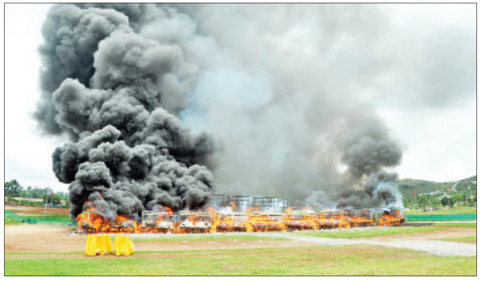
ရှမ်းပြည်နယ် တောင်ကြီးမြို့ရှိ အဝေရာမီးပုံးပျံကွင်း၌ ဖမ်းဆီးရမိ မူးယစ်ဆေးဝါးနှင့် ဓာတုပစ္စည်းများ မီးရှို့ဖျက်ဆီးစဉ်။

ကဖင်း ၂၂၀၂ ကီလိုကျော် အပါအဝင် မူးယစ်ဆေးဝါး ၁၄ မျိုး စုစုပေါင်း တန်ဖိုး မြန်မာငွေကျပ် ၆၀၈ ဒသမ ၉၄၈ ဘီလီယံ (အမေရိကန် ဒေါ်လာ သန်း ၄၂၀)အား ဖျက်ဆီးခဲ့သည်။ ၂၈ မျိုး ဖျက်ဆီး ရန်ကုန်တိုင်းဒေသကြီး လှိုင်သာယာမြို့နယ်ရှိ ရန်ကုန်အနောက်ပိုင်း ကုန်တင်ယာဉ်ရပ်နားကွင်း၌ ပြုလုပ်သည့် မီးရှို့ဖျက်ဆီးခြင်းတွင် ရန်ကုန်တိုင်းဒေသကြီးဝန်ကြီးချုပ် ဦးပြီးမင်းသိန်း တက်ရောက်၍ ရန်ကုန်တိုင်းဒေသကြီး၊ ဧရာဝတီတိုင်းဒေသကြီး၊ ရခိုင်ပြည်နယ်နှင့် မြန်မာနိုင်ငံအောက်ပိုင်းဒေသများမှ ဖမ်းဆီးရမိသော ဘိန်း ၄၆ ကီလိုကျော်၊ ဘိန်းဖြူ ၂၃ ကီလိုကျော်၊ စိတ်ကြွရှူးသွပ်ဆေးပြား ၄၇ သန်းခန့်၊ အိုက်စ် ၂၉၈၂ ကီလို