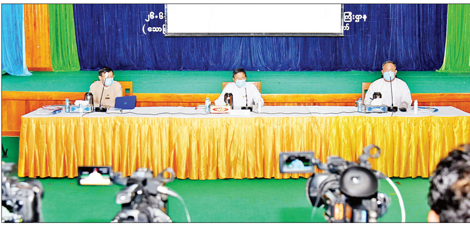
စိုက်ပျိုးရေး၊ မွေးမြူရေးနှင့် ဆည်မြောင်းဝန်ကြီးဌာန၏ စတုတ္ထ(၁)နှစ်တာကာလ ဆောင်ရွက်ခဲ့မှုများနှင့်ပတ်သက်သည့် ဒုတိယဝန်ကြီး ဦးလှကျော် ရှင်းလင်းပြောကြားစဉ်။

နေပြည်တော် ဇွန် ၂၆ ပြည်သူ့အတွက် စတုတ္ထ (၁) နှစ်တာကာလအတွင်း ဆောင်ရွက်ခဲ့မှုများနှင့် ပတ်သက်သည့် စိုက်ပျိုးရေး၊ မွေးမြူရေးနှင့် ဆည်မြောင်းဝန်ကြီးဌာန၊ အလုပ်သမား၊ လူဝင်မှုကြီးကြပ်ရေးနှင့် ပြည်သူ့အင်အားဝန်ကြီးဌာနနှင့် နိုင်ငံတော်အတိုင်ပင်ခံရုံး ဝန်ကြီးဌာနတို့၏ သတင်းစာရှင်းလင်းပွဲကို ယနေ့ ဝမ်းလှမ်းလှည့် ၁ နာရီတွင် နေပြည်တော်ရှိ ပြန်ကြားရေးဝန်ကြီးဌာန အစည်းအဝေးခန်းမ၌ ကျင်းပသည်။