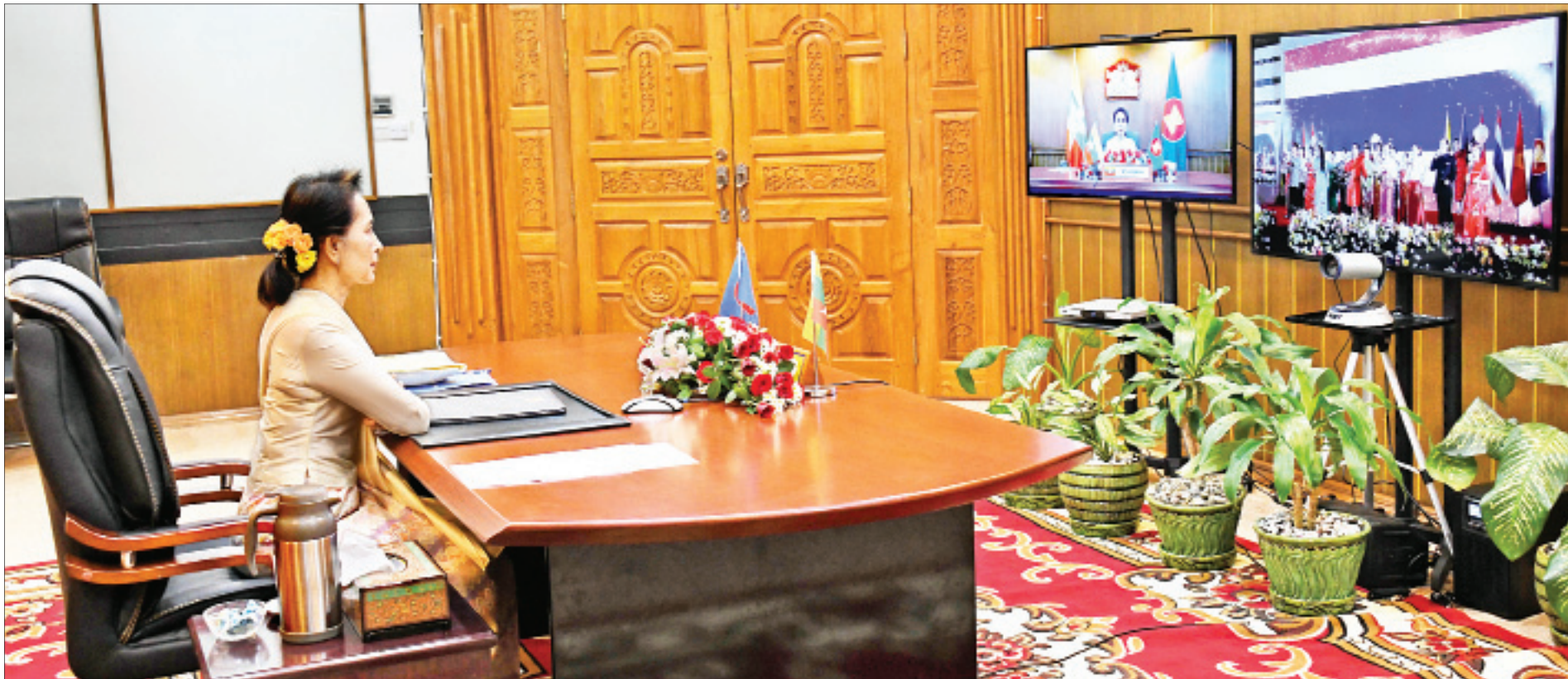
နိုင်ငံတော်၏အတိုင်ပင်ခံပုဂ္ဂိုလ် ဒေါ်အောင်ဆန်းစုကြည် Video Conferencing စနစ်ဖြင့် ကျင်းပပြုလုပ်သည့် (၃၆)ကြိမ်မြောက် အာဆီယံထိပ်သီးအစည်းအဝေး၏ ဖွင့်ပွဲအခမ်းအနားသို့ ပါဝင်တက်ရောက်စဉ်။

နေပြည်တော် ၅ ဇွန် ၂၆ နိုင်ငံတော်၏အတိုင်ပင်ခံပုဂ္ဂိုလ် ဒေါ်အောင်ဆန်းစုကြည် သည် ယနေ့နံနက် ၈ နာရီတွင် Video Conferencing စနစ် ဖြင့် ကျင်းပပြုလုပ်သည့် (၃၆)ကြိမ်မြောက် အာဆီယံထိပ်သီး အစည်းအဝေး၏ ဖွင့်ပွဲအခမ်းအနား၊ (၃၆)ကြိမ်မြောက် အာဆီယံထိပ်သီးအစည်းအဝေးနှင့် ဒစ်ဂျစ်တယ်ခေတ်တွင် အမျိုးသမီးများ၏ စွမ်းဆောင်ရည်မြှင့်တင်ရေးဆိုင်ရာ အာဆီယံခေါင်းဆောင်များ၏ အထူးအစည်းအဝေးတို့သို့ နေပြည်တော်ရှိ နိုင်ငံခြားရေးဝန်ကြီးဌာနမှ ပါဝင် တက်ရောက်သည်။