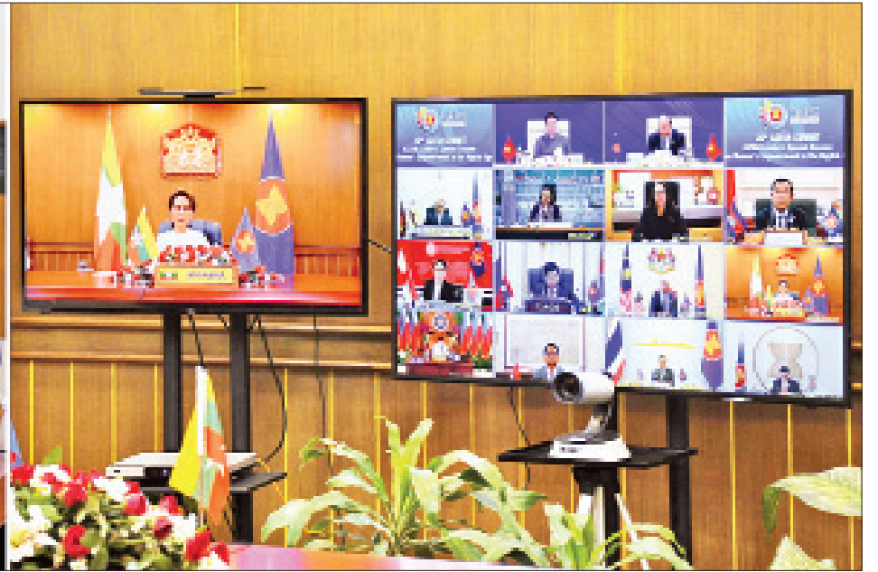
နိုင်ငံတော်၏အတိုင်ပင်ခံပုဂ္ဂိုလ် ဒေါ်အောင်ဆန်းစုကြည် ဒစ်ဂျစ်တယ်ခေတ်တွင် အမျိုးသမီးများ၏ စွမ်းဆောင်ရည်မြှင့်တင်ရေးဆိုင်ရာ အာဆီယံခေါင်းဆောင်များ၏ အထူးအစည်းအဝေးသို့ ပါဝင်တက်ရောက်စဉ်။

★ ရှေ့ဖွဲ့မှ (၃၆)ကြိမ်မြောက် အာဆီယံထိပ်သီးအစည်းအဝေးသို့ ပါဝင်တက်ရောက်သည်။