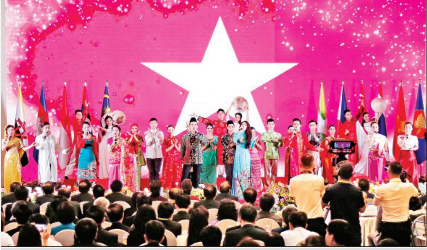
(၃၆)ကြိမ်မြောက် အာဆီယံထိပ်သီးအစည်းအဝေး၏ ဖွင့်ပွဲအခမ်းအနားတွင် ဗီယက်နမ် ရိုးရာအနုပညာအကများဖြင့် ဖျော်ဖြေတင်ဆက်စဉ်။

အထူးအစည်းအဝေးတွင် နိုင်ငံတော်၏အတိုင်ပင်ခံပုဂ္ဂိုလ်က ပါဝင်ဆွေးနွေးရာ၌ သက်ဆိုင်သူအားလုံးပါဝင်ပြီး စာမျက်နှာ ၄ သို့ >>>