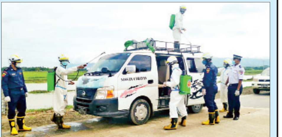
မန္တလေးတိုင်းဒေသကြီး ချမ်းအေးသာစံမြို့နယ်၌ ဇွန် ၂၁ ရက်က ကိုဗစ်-၁၉ ရောဂါကာကွယ်ရေးပိုးသတ် ဆေးဖျန်းစဉ်။