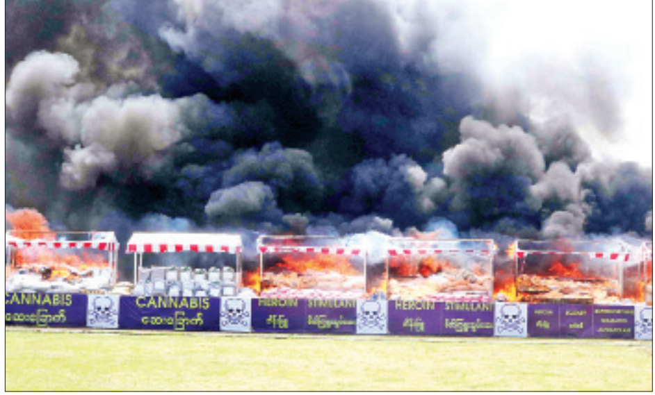
မန္တလေးတိုင်းဒေသကြီး အောင်မြေသာစံမြို့နယ် ဥပုသ်တော်ရပ်ကွက်ရှိ ရွှေမန်းတောင် အားကစားကွင်း၌ ဖမ်းဆီးရမိ မူးယစ်ဆေးဝါးနှင့် ဓာတုပစ္စည်းများ မီးရှို့ဖျက်ဆီးစဉ်။

ရွှေမန်းတောင် အားကစားကွင်း၌ ပြုလုပ်သည့် မီးရှို့ဖျက်ဆီးခြင်းတွင် မန္တလေးတိုင်းဒေသကြီး ဝန်ကြီးချုပ် ဒေါက်တာဇော်မြင့်မောင် တက်ရောက်၍ မန္တလေးတိုင်းဒေသကြီး၊ စစ်ကိုင်းတိုင်းဒေသကြီး၊ ကချင်ပြည်နယ်နှင့် မြန်မာနိုင်ငံ အထက်ပိုင်းဒေသများ၊ အလယ်ပိုင်းဒေသများမှ ဖမ်းဆီးရမိ