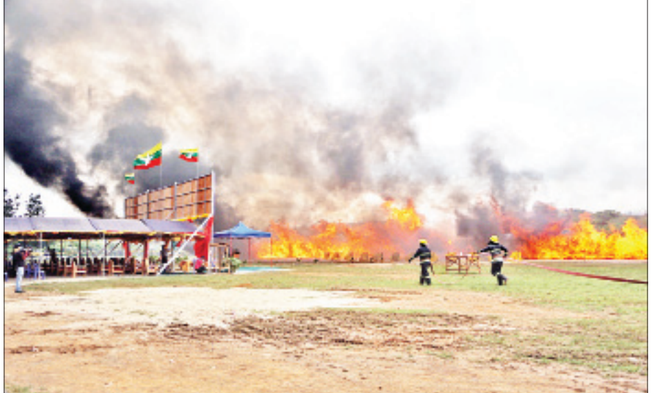
ရှမ်းပြည်နယ်(မြောက်ပိုင်း) လားရှိုးမြို့ နယ်မြေခံတပ်ရင်းရှေ့ရှိ ဘောလုံးကွင်း၌ ဖမ်းဆီးရမိ မူးယစ်ဆေးဝါးနှင့် ဓာတုပစ္စည်းများ မီးရှို့ဖျက်ဆီးစဉ်။

သည့် ဘိန်း ၅၃၉ ကီလိုကျော်၊ ဘိန်းဖြူ ၂၆၂ ကီလိုကျော်၊ စိတ်ကြွရှူးသွပ်ဆေးပြား ၁၆ သန်းကျော်၊ အိုက်စ် ၂၀ ကီလိုကျော်၊ ကတ်တမင်း ၃၅ ကီလိုကျော် အပါအဝင် မူးယစ်ဆေးဝါး ၂၆ မျိုးနှင့် ဓာတုပစ္စည်း ၁၇ မျိုးတို့၏ စုစုပေါင်းတန်ဖိုး မြန်မာငွေကျပ် ၅၉ ဒသမ ၁၃ ဘီလီယံ (အမေရိကန် ဒေါ်လာ သန်း ၄၀ ကျော်)အား ဖျက်ဆီးခဲ့သည်။ ၄၉ မျိုး ဖျက်ဆီး ရှမ်းပြည်နယ် တောင်ကြီးမြို့ရှိ အဝေရာမီးပုံးပျံကွင်း၌ ပြုလုပ်သည့် မီးရှို့ဖျက်ဆီးခြင်းတွင် ရှမ်းပြည်နယ် ဝန်ကြီးချုပ် ဒေါက်တာလင်းထွဋ်နှင့် အရှေ့ပိုင်းတိုင်းစစ်ဌာနချုပ် တိုင်းမှူး ဗိုလ်ချုပ်လင်းအောင်တို့ တက်ရောက်၍ ရှမ်းပြည်နယ်၊ ကယားပြည်နယ် တို့မှ ဖမ်းဆီးရမိသည့် ဘိန်း ၂၄၀၁