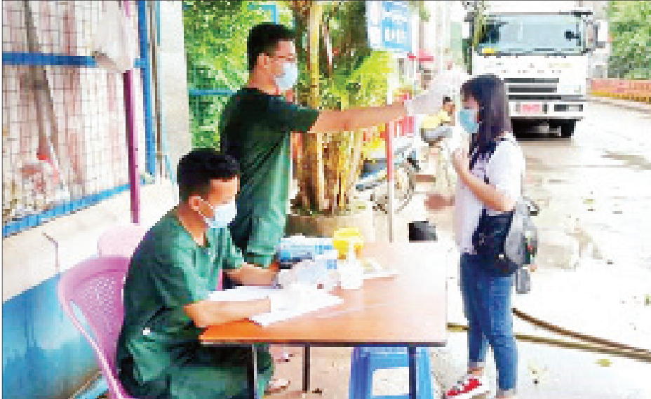
ချင်းရွှေဟော် နယ်စပ်ဂိတ်တွင် နေရပ်ပြန်ပြည်သူတစ်ဦးအား ကိုယ်အပူချိန်တိုင်းတာစစ်ဆေးစဉ်။

ချင်းရွှေဟော် ဇွန် ၂၅ တရုတ်နိုင်ငံမှ မြန်မာနိုင်ငံရောက်လာ သည့် မြန်မာနိုင်ငံသား နေရပ်ပြန် ပြည်သူများသည် ကိုးကန့်ကိုယ်ပိုင် အုပ်ချုပ်ခွင့်ရဒေသ လောက်ကိုင် မြို့နယ် ချင်းရွှေဟော်မြို့ မြန်မာ- တရုတ် နယ်စပ်ဂိတ်ပေါက်မှ နေ့စဉ်ဝင်ရောက်လျက်ရှိရာ ယမန်နေ့ ညနေ ၆ နာရီတွင် ၇၇ ဦးနှင့် ယနေ့ မွန်းလွဲ ၁ နာရီခွဲတွင် ၂၃ ဦး စုစုပေါင်းနေရပ်ပြန်ပြည်သူ ၁၀၀ ထပ်မံဝင်ရောက်လာခဲ့ကြောင်း သိရ သည်။ အဆိုပါ နေရပ်ပြန်ပြည်သူ ၁၀၀ တို့မှာ အမျိုးသား ၅၀၊ အမျိုးသမီး ၅၀ ဖြစ်ပြီး မန္တလေးတိုင်းဒေသကြီးမှ သုံးဦး၊ စစ်ကိုင်းတိုင်းဒေသကြီးမှ နှစ်ဦး၊ ပဲခူးတိုင်းဒေသကြီးမှ ကိုးဦး၊ စာမျက်နှာ ၁၇ ကော်လံ ၁ သို့ ၀