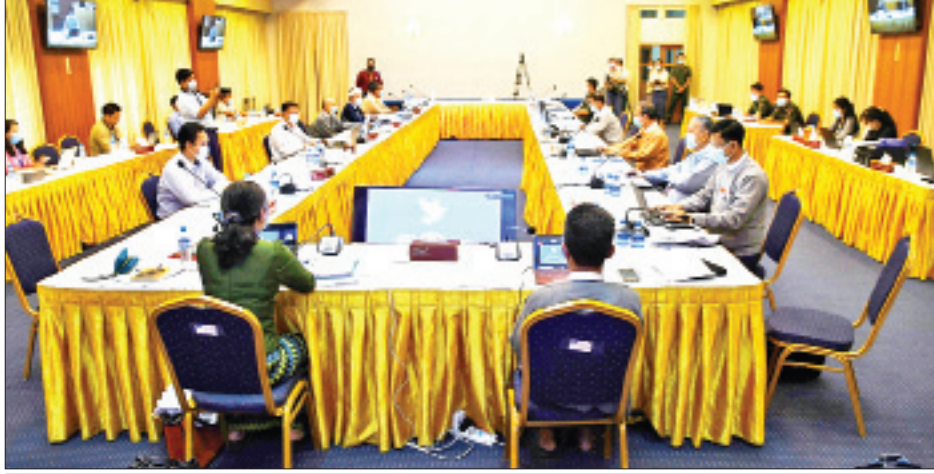
အစိုးရကိုယ်စားလှယ်များနှင့် NCA လက်မှတ်ရေးထိုးထားသည့် တိုင်းရင်းသားလက်နက်ကိုင်အဖွဲ့အစည်း ကိုယ်စားလှယ်များ (NCA - S EAO)၏ စတုတ္ထအကြိမ် အလုပ်အဖွဲ့ ညှိနှိုင်းအစည်းအဝေး ကျင်းပစဉ်။

ရန်ကုန် ဇွန် ၂၅ အစိုးရကိုယ်စားလှယ်များနှင့် NCA လက်မှတ်ရေးထိုးထားသည့် တိုင်းရင်းသားလက်နက်ကိုင်အဖွဲ့အစည်း ကိုယ်စားလှယ်များ (NCA - S EAO) ၏ စတုတ္ထအကြိမ် အလုပ်အဖွဲ့ ညှိနှိုင်းအစည်းအဝေးကို ယနေ့နံနက် ၁၀ နာရီက ရန်ကုန်မြို့၊ ရွှေလီလမ်းရှိ အမျိုးသားပြန်လည်သင့်မြတ်ရေးနှင့် ငြိမ်းချမ်းရေးဗဟိုဌာန(NRPC)တွင် ဆက်လက်ကျင်းပသည်။