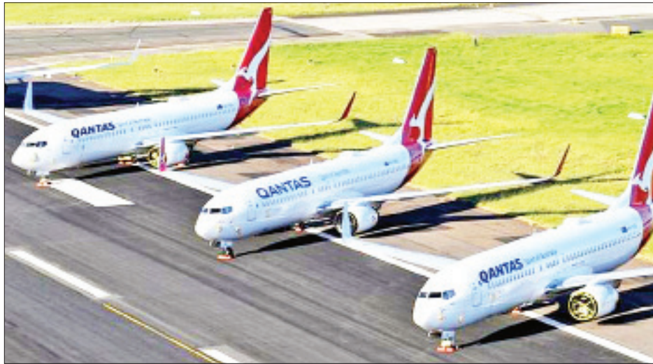
နယူးဇီလန်သို့ ပြေးဆွဲပျံသန်းနေသည့် လေကြောင်းလိုင်းများအားလုံးကို အောက်တိုဘာလနောက်ပိုင်းအထိ ရပ်နားထားရန် စီစဉ်ထားသည်။ လာမည့်သုံးနှစ်တာကာလအတွင်း

ဆစ်ဒနီ ဇွန် ၂၅ သြစတြေးလျကွန်တက်လေကြောင်းလိုင်းသည် ကိုဗစ်-၁၉ ကပ်ရောဂါ ကျော်လွှားနိုင်ရေးအတွက် လေကြောင်းလိုင်း၏ အစီအစဉ်များအနက်မှ တစ်စိတ်တစ်ဒေသအဖြစ် အလုပ်အကိုင် ၆၀၀၀ လျော့ချသွားမည်ဖြစ်ကြောင်း အဆိုပါ လေကြောင်းလိုင်းက ပြောကြားခဲ့သည်။