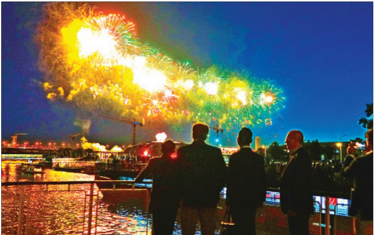
တပ်မတော်ကာကွယ်ရေးဦးစီးချုပ် ဗိုလ်ချုပ်မှူးကြီးမင်းအောင်လှိုင် Victory Day of Great Patriotic War (၇၅)နှစ်မြောက်အထိမ်းအမှတ် စစ်ရေးပြ အခမ်းအနား အောင်မြင်သည့်အနေဖြင့် မီးရှူးမီးပန်းများ ရုတ်ပြုလွှတ်တင်ပစ်ဖောက်မှုကို ကြည့်ရှုစဉ်။

ထို့နောက် တပ်မတော်ကာကွယ်ရေးဦးစီးချုပ်နှင့် အဖွဲ့ဝင်များအား Interstate Corporation Developments ညွှန်ကြားရေးမှူးချုပ်က အပျော်စီး မြစ်တွင်းသွား အမြန်ရေယာဉ်ပေါ်တွင် ညစာဖြင့် တည်ခင်းဧည့်ခံပြီး မော်စကို မြစ်ကြောင်းတစ်လျှောက် လှည့်လည်၍ မြို့ပြလူနေမှုစနစ်ဖွံ့ဖြိုးတိုးတက်မှု