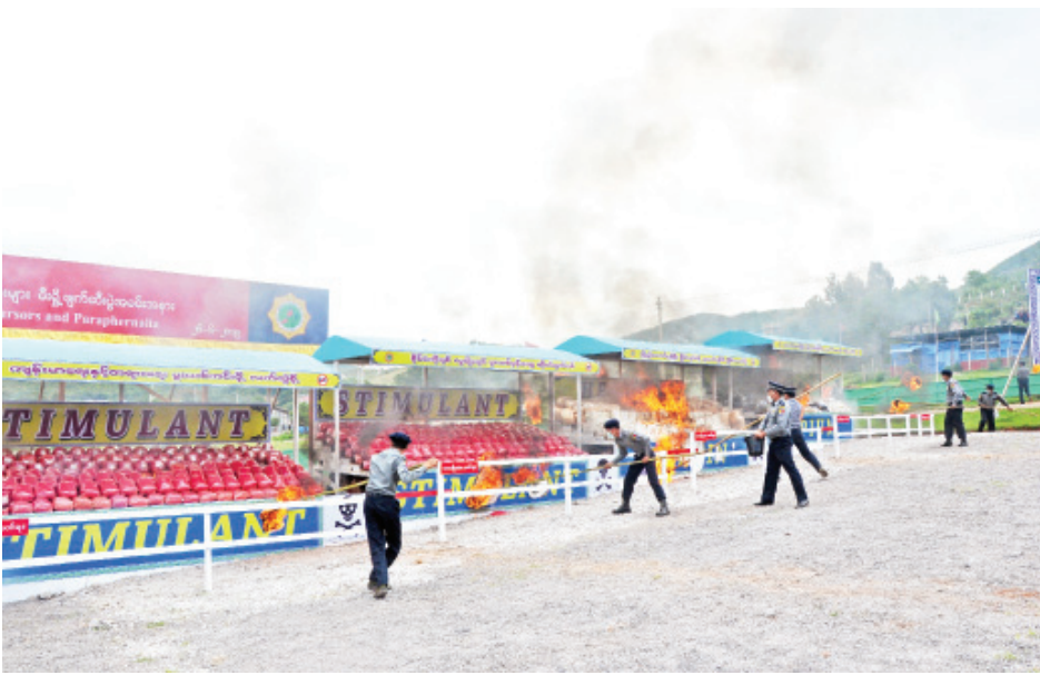
ဖမ်းဆီးရမိသည့် မူးယစ်ဆေးဝါးများအား စီးရီးဖျက်ဆီးစဉ်။

နိုင်ငံတော်သမ္မတ၏ လမ်းညွှန်မှုနှင့်အညီ တားဆီး နှိမ်နင်းရေးလုပ်ငန်းများကို အရှိန်အဟုန်ဖြင့် ဆောင်ရွက် ခဲ့ရာ ၂၀၁၉ ခုနှစ် နှစ်ကုန်ပိုင်းနှင့် ၂၀၂၀ ပြည့်နှစ်၏ ပထမ