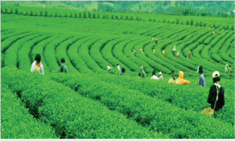
ဘိန်းအစားထိုး လက်ဖက်စိုက်ခင်းများ အောင်မြင်ဖြစ်ထွန်းနေသည်ကို တွေ့ရစဉ်။

မူးယစ်ဆေးဝါးကို မြန်မာ့မြေပေါ်မှာသာမက ကမ္ဘာပေါ်တွင်ပျောက်သွားရန် နိုင်ငံအသီးသီး လက်တွဲဆောင်ရွက်ခြင်းဖြင့် ကမ္ဘာလုံးဆိုင်ရာ မူးယစ်ဆေးဝါးအန္တရာယ် ကင်းဝေးစေမည်ဖြစ်သည်။ ပထမဆုံးအကြိမ်ဆောင်ရွက်ခဲ့သော “Operation 1511” စစ်ဆင်ရေးသည် စိန်ခေါ်မှုများစွာ၊ အခက်အခဲပေါင်းများစွာဖြင့် ဆောင်ရွက်ခဲ့ရသော စစ်ဆင်ရေးတစ်ရပ်လည်း ဖြစ်သည်။ အခြားနိုင်ငံများနှင့် မတူညီသည့် မြန်မာနိုင်ငံ၏ အခြေအနေအပေါ်တွင် တပ်မတော်နှင့် မြန်မာနိုင်ငံရဲတပ်ဖွဲ့တို့၏ စွမ်းဆောင်ရည်ကို ထုတ်ဖော်ပြသခွင့်ရခဲ့၍ ဒေသတွင်းနိုင်ငံများ