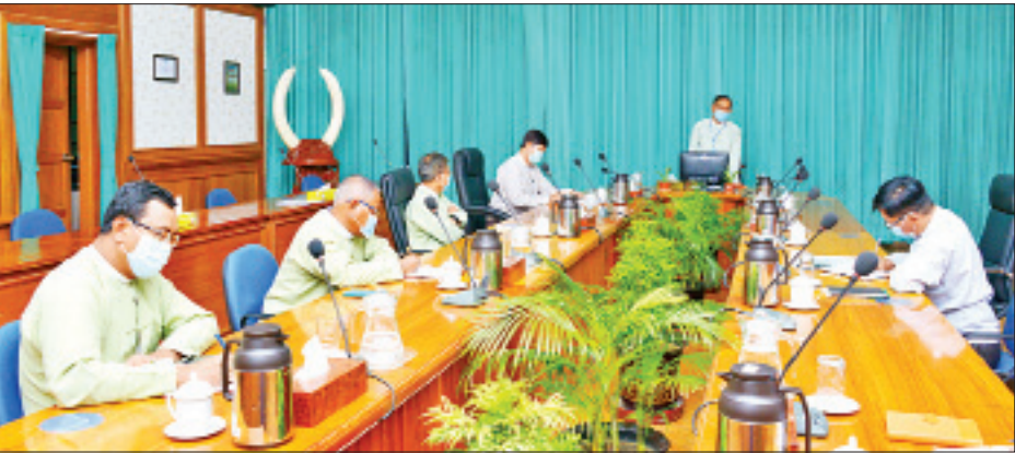
သက်ဆိုင်ရာ သစ်တောဦးစီးဌာနမှ အသုံးပြုနေသော နယ်နိမိတ်များ ကွဲပြားခြင်းများအား စိစစ်၍ တစ်သမတ် တည်းဖြစ်စေရန် ပူးပေါင်းဆောင်ရွက် သွားမည်ဖြစ်ပါကြောင်း မြေပုံ နမူနာများဖြင့် တင်ပြဆွေးနွေးသည်။ အဆိုပါ တင်ပြချက်များနှင့် စပ်လျဉ်း၍ ပြည်ထောင်စုဝန်ကြီးက သစ်တောကဏ္ဍ Spatial Database စနစ်တည်ဆောက်ရန် စိစစ်ရာတွင် ကြုံတွေ့ရသည့် အခက်အခဲများအပေါ် ဖြေရှင်းနိုင်မည့် နည်းလမ်းများအား ကျွမ်းကျင်ပညာရှင်များနှင့် ညှိနှိုင်း ဆောင်ရွက်ရန် မှာကြားခဲ့ကြောင်း သိရသည်။ သတင်းစဉ်

ဆောင်ရွက်ရန်အတွက် Geodatabase တည်ဆောက်ခြင်းအား ဆောင်ရွက် လျက်ရှိပြီး မြေပြင်ဆိုင်ရာသတင်း အချက်အလက် ၅၆ မျိုး အသုံးပြု လျက်ရှိပြီး ကြိုးဝိုင်း၊ ကြိုးပြင် ကာကွယ် တောနှင့် သဘာဝထိန်းသိမ်းရေး နယ်မြေဆိုင်ရာ အချက်အလက်များ သည် အဓိက အကျဆုံးဖြစ်ပါကြောင်း၊ မြေပုံနှင့် ဆက်စပ်ကိန်းဂဏန်းအချက် အလက်များအား ဒစ်ဂျစ်တယ်စနစ်သို့ ကူးပြောင်းခြင်းဆိုင်ရာ လုပ်ငန်းများ ဆောင်ရွက်နေပါကြောင်း၊ ယင်းအပြင် နယ်နိမိတ် Shape File များစစ်ဆေး ခြင်းနှင့် အမိန့်ကြော်ငြာစာများ စုစည်း ခြင်းလုပ်ငန်းများ ဖြစ်ပါကြောင်း၊ အဆိုပါ လုပ်ငန်းများအား ကာလတို/ ကာလရှည် ရည်မှန်းချက်ဖြင့် ဆောင်ရွက် လျက်ရှိကြောင်း၊