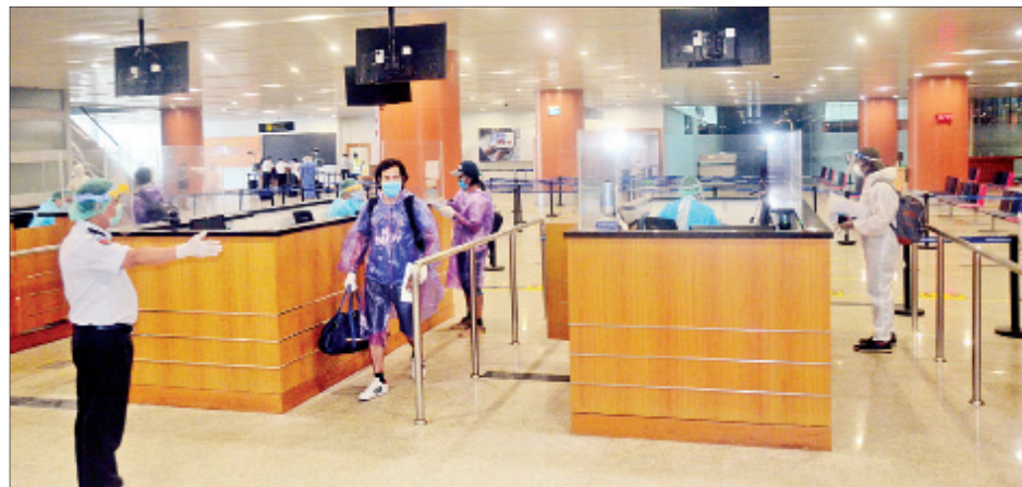
ဘင်္ဂလားဒေ့ရှ်နိုင်ငံမှ ပြန်လည်ရောက်ရှိလာသော မြန်မာနိုင်ငံသားများအား ရန်ကုန်အပြည်ပြည်ဆိုင်ရာလေဆိပ်၌ တွေ့ရစဉ်။

နေပြည်တော် ၉ နံနက် ၂၅ ကိုဗစ်-၁၉ ရောဂါ ကူးစက်ပြန့်ပွားမှု အန္တရာယ် ကာကွယ်စောင့်ရှောက် နိုင်ရေးအတွက် အစီအမံများကို ဆက်လက်ချမှတ် ဆောင်ရွက်လျက် ရှိရာ မြန်မာနိုင်ငံသို့ ပျံသန်းသည့် ခရီးစဉ်များ ယာယီရပ်ဆိုင်းမှုကြောင့် အာရပ်စော်ဘွားများ ပြည်ထောင်စုနှင့် ဘာရိန်းနိုင်ငံတို့တွင် ရောက်ရှိနေသည့် မြန်မာနိုင်ငံသား ၁၄၃ ဦးအား ဒီဟာ အပြည်ပြည်ဆိုင်ရာ လေဆိပ်မှ တစ်ဆင့် မြန်မာအပြည်ပြည်ဆိုင်ရာ လေကြောင်းလိုင်း(MAI) ကယ်ဆယ် ရေးလေယာဉ်ဖြင့် ပြန်လည်ခေါ် ဆောင်ခဲ့ရာ ယနေ့နံနက် ၁ နာရီတွင် စာမျက်နှာ ၁၈ ကော်လံ ၁ သို့ □