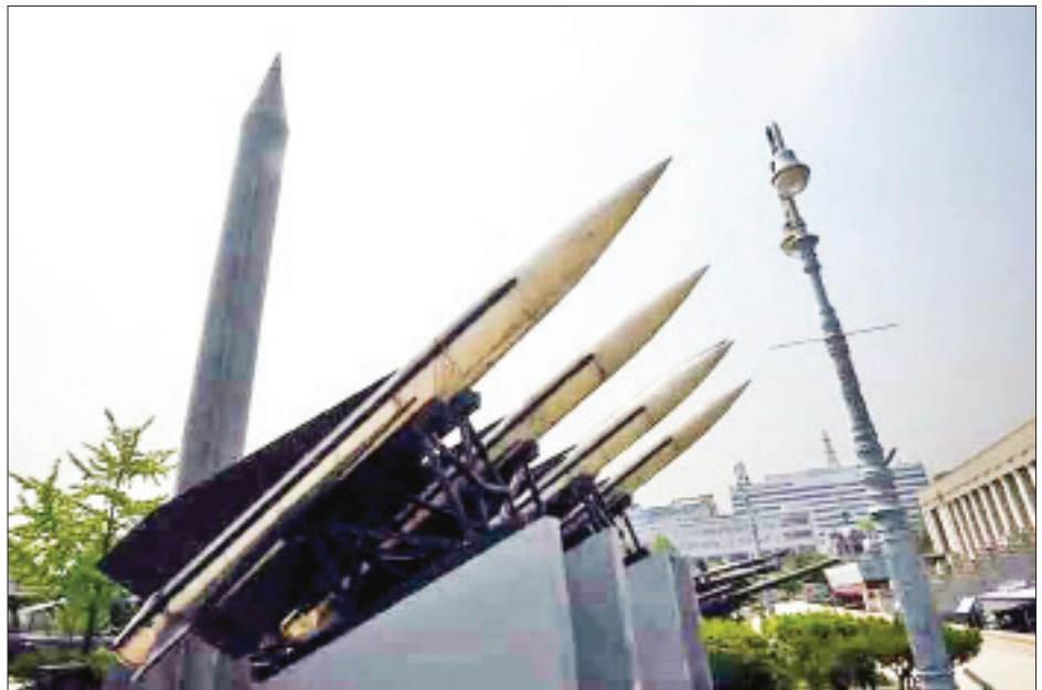
အေးဂျစ် ခိုးကျည်ကာကွယ်ရေးစနစ်နေရာတွင် အစားထိုးရွေးချယ်မှုများပြုလုပ်ရန် အစိုးရက သန့်ဌာန်ချထားကြောင်း ဂျပန်ဝန်ကြီးချုပ် ရှင်နိုအဘေးက ပြီးခဲ့သည့်အပတ်တွင် ပြောကြားခဲ့သည်။

ကိုးကား - အင်န်အိတ်ချီကော ဘာသာပြန် - အောင်ကျော်ကျော်