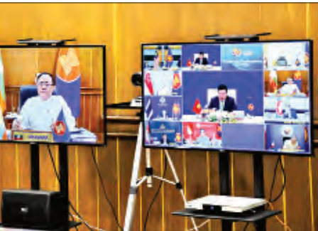
မူများ တားဆီးနှိမ်နင်းရေးတွင် ပူးပေါင်းဆောင်ရွက်မှုဖြင့်တင်ရန် လိုအပ်ချက် အပါအဝင်မြန်မာနိုင်ငံ၏ရပ်တည်ချက်များကို အသိပေးဆွေးနွေးပြောကြားသည်။

ရခိုင်ပြည်နယ်အရေးကိစ္စနှင့်စပ်လျဉ်း၍ ပြည်ထောင်စုဝန်ကြီးက ပြန်လည်ဝင်ရောက်လာသူများအတွက် ကောင်းမွန်သည့် ပတ်ဝန်းကျင်တစ်ရပ် ဖန်တီးရာတွင် အစိုးရ၏ကြိုးပမ်းဆောင်ရွက်ချက်များ၊ နှစ်နိုင်ငံသဘော တူညီချက်နှင့်အညီ နေရပ်စွန့်ခွာသူများ ပြန်လည်လက်ခံရေးလုပ်ငန်းစဉ်ကို စတင်နိုင်ရေးအတွက် ဘက်လားရွှေ့နိုင်ငံနှင့် နှစ်နိုင်ငံအကြား ဆွေးနွေးညှိနှိုင်း လျက်ရှိသည့် အခြေအနေများ၊ မြန်မာနိုင်ငံဘက်မှ စီစဉ်အောင်မြင်မှုဖြစ်သည့် နေရပ်စွန့်ခွာသူများစာရင်းကို ဘက်လားရွှေ့နိုင်ငံသို့ ပေးပို့ထားသည့် အခြေအနေ များ၊ နေရပ်စွန့်ခွာသူများ ပြန်လည်လက်ခံရေးလုပ်ငန်းစဉ်တွင် အာဆီယံနှင့် မြန်မာနိုင်ငံအကြား ပူးပေါင်းဆောင်ရွက်နိုင်မည့် နယ်ပယ်များကို လေ့လာသည့် ပဏာမဆန်းစစ်လေ့လာရေးအဖွဲ့၏ အစီရင်ခံစာပါ အကြံပြုချက်များကို အကောင်အထည်ဖော်ရာတွင် မြန်မာနှင့်အာဆီယံအကြား ပူးပေါင်းဆောင်ရွက် နေမှုများ UNDP/ UNHCR တို့နှင့်ပူးပေါင်း၍ ရခိုင်ပြည်နယ်တွင် Quick Impact Project များနှင့် Pilot Project များ ဖော်ဆောင်လျက်ရှိသည့် အခြေအနေများ၊ IDP စခန်းများ ပိတ်သိမ်းရေးအတွက် အစိုးရအနေဖြင့် မဟာဗျူဟာချမှတ်၍ ဆောင်ရွက်နေမှုများ၊ IDP စခန်းများတွင် COVID-19 ကူးစက်ရောဂါ ထိန်းချုပ်ရေး အတွက် ICRC နှင့်ပူးပေါင်း၍ အစိုးရက ကြိုးပမ်းဆောင်ရွက်နေမှုများနှင့် လေ့စီးဒုက္ခသည်များပြုသော အား ကာကွယ်တားဆီးရေးအတွက် လူကုန်ကူး