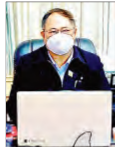
ဒုတိယညွှန်ကြားရေးမှူးချုပ် ဦးကျော်စိုး

များပြီး သွားလာရခက်ခဲသော ချင်း ပြည်နယ်သို့ သွားလာရလွယ်ကူရန်၊ ဒေသခံပြည်သူများ လမ်းပန်း ဆက်သွယ်ရေး အဆင်ပြေချောမွေ့ပြီး လူမှုရေး၊ ကျန်းမာရေး၊ အုပ်ချုပ်ရေး ကိစ္စများ၊ စီးပွားရေး၊ ကုန်သွယ်ရေး၊ ခရီးသွားလာရေးလုပ်ငန်းနှင့် အရေး ပေါ် ကယ်ဆယ်ရေးလုပ်ငန်းများ ဆောင်ရွက်နိုင်ရန် တည်ဆောက်ခဲ့ခြင်း ဖြစ်ပြီး ဆူရ်ဘုန်းလေဆိပ်သစ်ကြီးကို မကြာမီ ဖွင့်လှစ်နိုင်မည်ဖြစ်ကြောင်း သိရသည်။ ဆူရ်ဘုန်း(ဖလမ်း) လေဆိပ်ကို ဖလမ်းမြို့နယ်ရှိ ရှေ့ဧက ၁၂၉၉ ဒဿ ၅ ဧကတွင် စီမံကိန်းကို ငွေကျပ် ၃၂ ဒဿမ ၃၆ ဘီလီယံနှင့် အမေရိကန် ဒေါ်လာ ၁ ဒဿမ ၁၉ သန်း အကုန် အကျခံ၍ အကောင်အထည်ဖော် ဆောင်ရွက်ခြင်းဖြစ်ကြောင်း သိရ သည်။ ဆူရ်ဘုန်းလေဆိပ်ကွင်းကို ATR-72 လေယာဉ်များ ဆင်း/တက် အသုံး ပြုနိုင်ရန်အတွက် လေယာဉ်ပြေးလမ်း အလျားပေ ၆၀၀၀၊ အကျယ်ပေ ၁၀၀၊ လေယာဉ်ဝင်/ထွက်လမ်းနှင့် လေယာဉ် ရပ်နားရန်နေရာ အလျားပေ ၂၅၀၊ အကျယ်ပေ ၂၅၀ တို့အား နိုင်ငံလွန် ကတ္တရာခင်း တည်ဆောက်လျက်ရှိ ပြီး Compaction Method ဖြင့် Slope Stability Gabion Retaining Wall