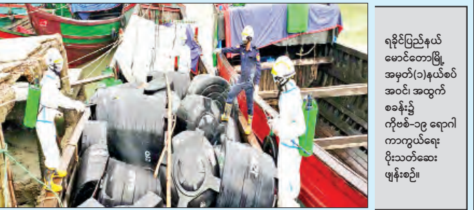
ရခိုင်ပြည်နယ် မောင်တောမြို့ အမှတ်(၁)နယ်စပ် အဝင်း အထွက် စခန်း၌ ကိုဗစ်-၁၉ ရောဂါ ကာကွယ်ရေး ပိုးသတ်ဆေးဖျန်းစဉ်။