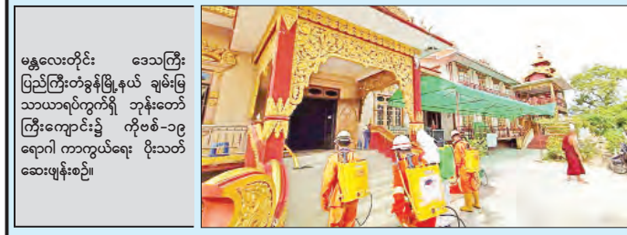
မန္တလေးတိုင်း ဒေသကြီး ပြည်ကြီးတံခွန်မြို့နယ် ချမ်းမြသာယာရပ်ကွက်ရှိ ဘုန်းတော်ကြီးကျောင်း၌ ကိုဗစ်-၁၉ ရောဂါ ကာကွယ်ရေး ပိုးသတ်ဆေးဖျန်းစဉ်။