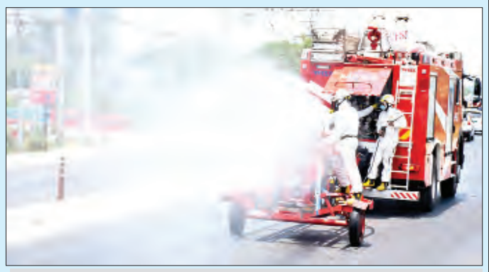
ရန်ကုန်တိုင်းဒေသကြီး အင်းစိန်မြို့နယ်၌ ကိုဗစ်-၁၉ ရောဂါ ကာကွယ်ရေး ပိုးသတ်ဆေးဖျန်းစဉ်။

နေပြည်တော် ဇွန် ၂၄ သက်ဆိုင်ရာ တိုင်းစစ်ဌာနချုပ်အသီးသီးမှ တပ်မတော်သားများ၊ မီးသတ်တပ်ဖွဲ့ဝင်များ၊ ဌာန၊ အဖွဲ့အစည်းများ ပူးပေါင်း၍ ကိုဗစ်-၁၉ ရောဂါကာကွယ်ထိန်းချုပ်နိုင်ရေးအတွက် ဇွန် ၁၉ ရက်က ပိုးသတ်ဆေးဖျန်းခြင်းလုပ်ငန်းများကို နေပြည်တော်၊ တိုင်းဒေသကြီး/ပြည်နယ်များမှ မြို့နယ် ၂၈ မြို့နယ်ရှိ နေရာ ၇၁ နေရာတို့တွင် မီးသတ်ယာဉ်များ၊ မီးသတ်ပစ္စည်းကိရိယာများဖြင့် ဆောင်ရွက်ခဲ့ရာ ပိုးသတ်ဆေးရည် ၆၇ ဂါလန်နှင့် ပိုးသတ်ဆေးမှုန့် ၅၈၀ ကီလိုဂရမ်သုံးစွဲခဲ့ပြီး ပိုးသတ်ဆေးဖျန်းခြင်းလုပ်ငန်းများကို တာဝန်ရှိသူများက လိုက်လံကြည့်ရှုအားပေးခဲ့ကြောင်း သိရသည်။