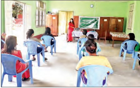
အမျိုးသမီး ၂၂ ဦးကို သင်ကြားပို့ချပေးခဲ့သည်။ ဆက်လက်ပြီး ဆင့်ပွားသင်တန်းအဖြစ် ဘက်စုံသုံးဆပ်ပြာရည်

မဲခေါင်-လန်ချန်း ပူးပေါင်းဆောင်ရွက်မှုအစီအစဉ်အရ ကယားပြည်နယ်အတွင်း သမဝါယမအသင်းများရှိ အမျိုးသမီးများ၏ စွမ်းဆောင်ရည်မြှင့်တင်ရေးနှင့် စွမ်းရည်တည်ဆောက်ရေးစီမံခန့်ခွဲရေးအဖွဲ့အစည်းအဖွဲ့ဝင်များအား အကောင်အထည်ဖော်ဆောင်ရွက်လျက်ရှိရာ သီရိမေအမျိုးသမီးများ ဖွံ့ဖြိုးတိုးတက်ရေးသမဝါယမအသင်းလီမိတက်(ရန်ကုန်) မှ လက်သန့်ဆေးရည် ပြုလုပ်နည်းသင်တန်းကို ဒီးမော့ဆိုမြို့နယ်ခေါက်လောကျေးရွာရှိ ဒီးမော့မေအမျိုးသမီးများ ဖွဲ့စည်းပေးသည့် အထွေထွေလုပ်ငန်း သမဝါယမအသင်းလီမိတက်မှ အသင်းသား