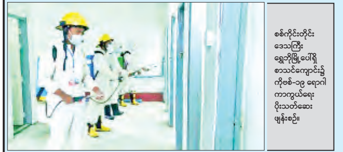
စစ်ကိုင်းတိုင်း ဒေသကြီး ရွှေဘိုမြို့ပေါ်ရှိ စာသင်ကျောင်း၌ ကိုဗစ်-၁၉ ရောဂါ ကာကွယ်ရေး ပိုးသတ်ဆေးဖျန်းစဉ်။