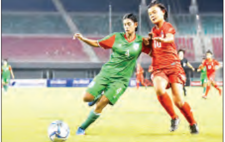
၂၀၁၉ အာရှ ယူ-၁၆ အမျိုးသမီးခြေစစ်ပွဲ ဒုတိယအဆင့်တွင် မြန်မာအသင်းနှင့် တက်လားဒေ့ရှ်အသင်း ယှဉ်ပြိုင်စဉ်။

အာရှဘောလုံးအဖွဲ့ချုပ်သည် ယင်းပြိုင်ပွဲနှစ်ခုကို လူငယ်အမျိုးသမီး