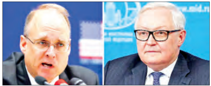
အမေရိကန်အစိုးရကလည်းကောင်း၊ မာရှယ်ဘီလစ်လီလာ နှင့် ရုရှားဒုတိယနိုင်ငံခြားရေးဝန်ကြီး ရယ်ကီရို

သို့သော် ဝါရှင်တန်နှင့် မော်စကိုတို့က အဆိုပါ မျှတလေးယားလက်နက်ထိန်းချုပ်ရေး သဘောတူညီမှုကို