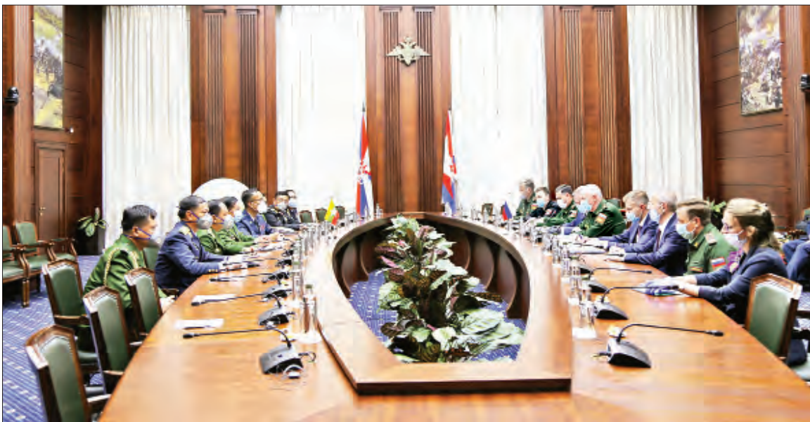
တပ်မတော်ကာကွယ်ရေးဦးစီးချုပ် ဗိုလ်ချုပ်မှူးကြီးမင်းအောင်လှိုင် ဦးဆောင်သောအဖွဲ့နှင့် ရုရှားဖက်ဒရေးရှင်းနိုင်ငံ ကာကွယ်ရေးဝန်ကြီးဌာန ခုတီယဝန်ကြီး Colonel General Alexander V.Fomin ဦးဆောင်သောအဖွဲ့တို့ တွေ့ဆုံဆွေးနွေးခဲ့သည်။

နေပြည်တော် ၇ ဇွန် ၂၀ ရုရှားဖက်ဒရေးရှင်းနိုင်ငံ Victory Day of Great Patriotic War (၇၅) နှစ်မြောက် အထိမ်းအမှတ် စစ်ရေးပြအခမ်းအနားသို့ တက်ရောက်ရန် ရုရှားဖက်ဒရေးရှင်းနိုင်ငံရှိ ရောက်ရှိနေသည့် တပ်မတော်ကာကွယ်ရေးဦးစီးချုပ် ဗိုလ်ချုပ်မှူးကြီးမင်းအောင်လှိုင်နှင့်အဖွဲ့သည် ယမန်နေ့ ညနေပိုင်းတွင် ရုရှားဖက်ဒရေးရှင်းနိုင်ငံ ကာကွယ်ရေးဝန်ကြီးဌာန ခုတီယဝန်ကြီး Colonel General Alexander V.Fomin အား ရုရှားဖက်ဒရေးရှင်းနိုင်ငံ ကာကွယ်ရေးဝန်ကြီးဌာနတွင် သွားရောက်တွေ့ဆုံဆွေးနွေးခဲ့သည်။