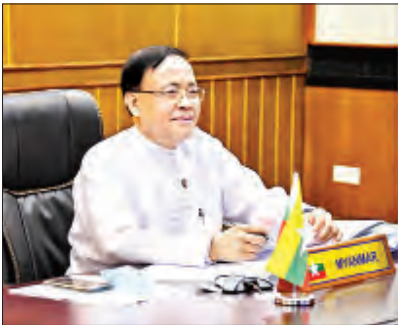
ဆွေးနွေးပြောကြားသည်။

ဒေသတွင်းနှင့် နိုင်ငံတကာရေးရာကိစ္စရပ်များနှင့်ပတ်သက်၍ ပြည်ထောင်စုဝန်ကြီးက ကမ္ဘာတစ်ဝန်း ကိုဗစ်-၁၉ ကပ်ရောဂါပြန့်ပွားလာမှု၊ ဒေသတွင်း၌ အင်အားကြီးနိုင်ငံများအကြား ဖြိုင့်ဆိုင်မှု၊ တင်းမာမှုနှင့် အငြင်းပွားမှုများ မြင့်တက်လာခြင်းတို့က ဒေသတွင်း တည်ငြိမ်အေးချမ်းမှုကို ဖြိမ်းခြောက်လျက်ရှိပြီး အာဆီယံအနေဖြင့် ပိုမိုပြီးတားဆီးသည့် စီမံခန့်ခွဲမှုများနှင့် ရင်ဆိုင်လာရမည်ရှိကြောင်း၊ သို့ဖြစ်၍ ယခုအချိန်တွင် အာဆီယံ၏ စည်းလုံးညီညွတ်မှု၊ အချက်အချာမှုနှင့် ပြောင်းလဲနေသည့် ဒေသတွင်းစီမံကိန်းပုံစံတွင် အဓိကမောင်းနှင်အားအဖြစ် ပါဝင်မှုတို့မှာ ပိုမိုအရေးကြီးလာကြောင်း၊ တင်းမာမှုများ လျော့ပါးသကဲ့သို့သောအရေးအတွက် အာဆီယံအနေဖြင့် ငြင်းခုံယန္တရားများ အထူးသဖြင့် အာဆီယံဒေသဆိုင်ရာ ဖိုရမ်နှင့် အရှေ့အာရှတိုက်သီးအစည်းအဝေးတို့မှတစ်ဆင့် ပိုမိုအရေးပါသည့် အခန်းကဏ္ဍမှ ပါဝင်သင့်ကြောင်း၊ အရှေ့တောင်အာရှ ချစ်ကြည်ရေးနှင့် ပူးပေါင်းဆောင်ရွက်ရေးစာချုပ်နှင့် အင်ဒို-ပစိဖိတ်ဆိုင်ရာ အာဆီယံ၏ သဘောထားအမြင်တို့တွင် ပါဝင်သည့် မူ (principle) များကို အာဆီယံအနေဖြင့် ဆက်လက်တိုးမြှင့်ဖော်ဆောင်သွားသင့်ကြောင်း