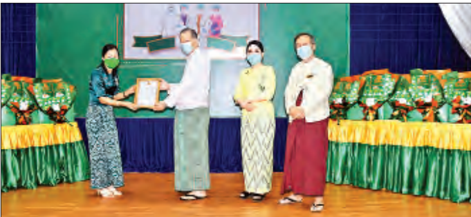
ဆေးသုတေသနဦးစီးဌာနတွင် တာဝန်ထမ်းဆောင်နေသူများအား ငွေကျပ် သိန်း ၃၀ နှင့် အသင့်ဖျော်သောက် လက်ဖက်ရည်ထုပ်များ လှူဒါန်း

ရန်ကုန် ၈၆ ၂၃ ကိုဗစ်-၁၉ ရောဂါကာကွယ် ထိန်းချုပ်၊ ကုသရေးအတွက် ကြိုးပမ်းဆောင်ရွက်နေသော ကျန်းမာရေးနှင့် အားကစား ဝန်ကြီးဌာန ဆေးသုတေသနဦးစီးဌာနတွင် တာဝန်ထမ်းဆောင် နေသူများအား ငွေကျပ် သိန်း ၃၀ နှင့် အသင့်ဖျော်သောက် လက်ဖက်ရည်ထုပ်များ ပေးအပ်လှူဒါန်းပွဲကို ယနေ့ နံနက် ၁၀ နာရီက ရန်ကုန်မြို့ ဒဂုံမြို့နယ်ရှိ ဆေးသုတေသန ဦးစီးဌာန(ရုံးချုပ်) အစည်းအဝေးခန်းမ၌ ကျင်းပသည်။ အခမ်းအနားတွင် ဆေးသုတေသနဦးစီးဌာန ညွှန်ကြားရေးမှူးချုပ် ပါမောက္ခ ဒေါက်တာဇော်သန်းထွန်းက အမှာစကားပြောပြီး အလှူရှင် Royal Myanmar Tea Mix မှ တာဝန်ရှိသူက လှူဒါန်းခြင်းနှင့်စပ်လျဉ်း၍ ရှင်းလင်းပြောကြားသည်။ ထို့နောက် ဆေးသုတေသနဦးစီးဌာန ညွှန်ကြားရေး မှူးချုပ် ပါမောက္ခ ဒေါက်တာဇော်သန်းထွန်းထံ အလှူရှင်က