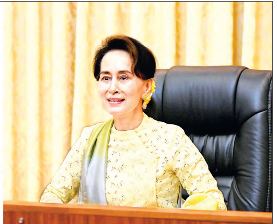
Coronavirus Disease 2019 (COVID-19) ကာကွယ်၊ ထိန်းချုပ်၊ ကုသရေး အမျိုးသားအဆင့်ဗဟိုကော်မတီဥက္ကဋ္ဌ၊ နိုင်ငံတော်၏အတိုင်ပင်ခံပုဂ္ဂိုလ် ဒေါ်အောင်ဆန်းစုကြည် COVID-19 နှင့် ကုန်သွယ်ရေးကဏ္ဍအပေါ် သက်ရောက်မှု များနှင့်စပ်လျဉ်း၍ ဒုတိယဝန်ကြီး ဦးအောင်ထူး၊ City Mart Managing Director ဒေါ်ဝင်းဝင်းတင့်၊ SME လုပ်ငန်းရှင် ဒေါ်သက်စုဌေးတို့နှင့် အပြန်အလှန်ဆွေးနွေးစဉ်။

နေပြည်တော် ၈ ဇွန် ၂၀ Coronavirus Disease 2019 (COVID-19) ကာကွယ်၊ ထိန်းချုပ်၊ ကုသရေး အမျိုးသားအဆင့် ဗဟိုကော်မတီဥက္ကဋ္ဌ၊ နိုင်ငံတော်၏အတိုင်ပင်ခံပုဂ္ဂိုလ် ဒေါ်အောင်ဆန်းစုကြည်သည် COVID-19 နှင့် ကုန်သွယ်ရေးကဏ္ဍအပေါ် သက်ရောက်မှုများနှင့်စပ်လျဉ်း၍ စီးပွားရေးနှင့် ကူးသန်း ရောင်းဝယ်ရေးဝန်ကြီးဌာန ဒုတိယဝန်ကြီး ဦးအောင်ထူး၊ ပြည်တွင်းကုန်သွယ်မှု Supply Chain တွင် ပါဝင်ဆောင်ရွက်နေသော City Mart Managing Director ဒေါ်ဝင်းဝင်းတင့်နှင့် သဘာဝ မန်ကျည်းနှင့် ဆီးဖျော်ရည်၊ ပဲကြော်နှင့် ပိုးရည်ကြီးထုတ်လုပ်ဖြန့်ဖြူးနေသည့် SME လုပ်ငန်းရှင် ဒေါ်သက်စုဌေးတို့နှင့် ယနေ့ နံနက်ပိုင်းတွင် နေပြည်တော်ရှိ နိုင်ငံတော်သမ္မတအိမ်တော် အစည်းအဝေးခန်းမ၌ Video Conferencing စနစ်ဖြင့် ချိတ်ဆက်တွေ့ဆုံ၍ လက်တွေ့အခြေ အနေများကို အပြန်အလှန်ဆွေးနွေးသည်။ စာမျက်နှာ ၃ ကော်လံ ၁ သို့ *