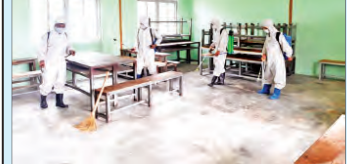
စစ်ကိုင်းတိုင်းဒေသကြီး ရွှေဘိုမြို့နယ်အတွင်းရှိ စာသင်ကျောင်းများ၌ ဇွန် ၁၈ ရက်က ကိုဗစ်-၁၉ ရောဂါ ကာကွယ်ရေး ပိုးသတ်ဆေးဖျန်းစဉ်။