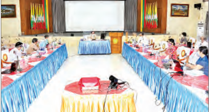
နည်းပညာတက္ကသိုလ်(ရန်ကုန်) နှင့် ဆေးဘက်ဆိုင်ရာ နည်းပညာတက္ကသိုလ် (မန္တလေး) တို့တွင် ၂၀၁၈ ခုနှစ်မှ စတင်၍ ဆေးဘက်ဆိုင်ရာနည်းပညာ (ကျန်းမာရေးသတင်းအချက်အလက်) [B.Med.Tech (Health Information)] လေးနှစ်သင်တန်းများဖြင့် လေ့ကျင့်မွေးထုတ်နေမှုတို့အားလည်းကောင်း ရှင်းလင်းတင်ပြသည်။

နေပြည်တော် ဇွန် ၂၃ ဝန်ကြီးဌာန၏ နိုင်ငံတစ်ဝန်းတွင် ကျန်းမာရေးသတင်းအချက်အလက်စနစ်နှင့်ပတ်သက်၍ ဆောင်ရွက်နေသော လုပ်ငန်းများ ပိုမိုတိုးတက်ကောင်းမွန်စေရေးနှင့် ဆက်လက်ဆောင်ရွက်မည့်လုပ်ငန်းများနှင့်ပတ်သက်၍ ရှင်းလင်းတင်ပြ ဆွေးနွေးပွဲကို ယနေ့မနက်ပိုင်းတွင် နေပြည်တော်ရှိ ကျန်းမာရေးဝန်ကြီးဌာန၌ ပြုလုပ်သည်။