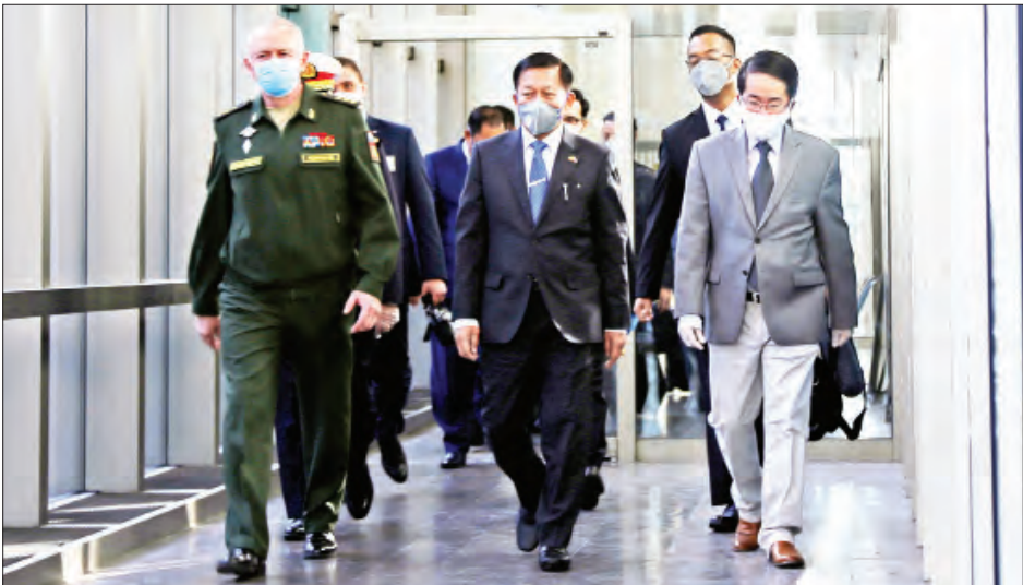
တပ်မတော်ကာကွယ်ရေးဦးစီးချုပ် ဗိုလ်ချုပ်မှူးကြီးမင်းအောင်လှိုင်အား ရုရှားဖက်ဒရေးရှင်းနိုင်ငံ ကာကွယ်ရေးဝန်ကြီး Colonel General Alexander V.Fomini နှင့် တာဝန်ရှိသူများက မော်စကိုမြို့၊ Sheremetyevo အပြည်ပြည်ဆိုင်ရာလေဆိပ်၌ ကြိုဆိုကြစဉ်။

ယနေ့ နံနက်ပိုင်းတွင် တပ်မတော်ကာကွယ်ရေးဦးစီးချုပ် ဗိုလ်ချုပ်မှူးကြီးမင်းအောင်လှိုင်သည် Arguments and Facts သတင်းဌာန၊ ZVEZDA သတင်းဌာန၊ RT သတင်းဌာန၊ Red star သတင်းဌာနနှင့် Politic မဂ္ဂဇင်းတို့မှ အယ်ဒီတာချုပ်များနှင့် သတင်းထောက်တို့အား Crowne Plaza Hotel ၌ သီးခြားစီတွေ့ဆုံ၍ စာမျက်နှာ ၅ ကော်လံ ၁ သို့