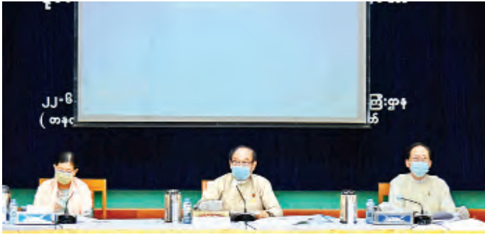
ကျန်းမာရေးနှင့် အားကစားဝန်ကြီးဌာန၏ စတုတ္ထ(၁)နှစ်တာကာလ ဆောင်ရွက်ခဲ့မှုများနှင့်စပ်လျဉ်း၍ ပြည်ထောင်စုဝန်ကြီး ဒေါက်တာမြင့်ထွေး ရှင်းလင်းပြောကြားစဉ်။

နေပြည်တော် ဇွန် ၂၃ ပြည်သူ့အတွက် စတုတ္ထ(၁)နှစ်တာ ကာလအတွင်း ဆောင်ရွက်ချက်များနှင့် ပတ်သက်သည့် သတင်းစာရှင်းလင်းပွဲကို ယနေ့နေ့က နေပြည်တော်ရှိ ပြန်ကြားရေးဝန်ကြီးဌာန အစည်းအဝေးခန်းမ၌ ကျင်းပခဲ့သည်။ အဆိုပါ သတင်းစာရှင်းလင်းပွဲတွင် ကျန်းမာရေးနှင့် အားကစားဝန်ကြီးဌာန ပြည်ထောင်စုဝန်ကြီး ဒေါက်တာမြင့်ထွေး၏ ရှင်းလင်းပြောကြားချက်ကို အောက်ပါအတိုင်း ဖော်ပြလိုက်ရပါမည်။