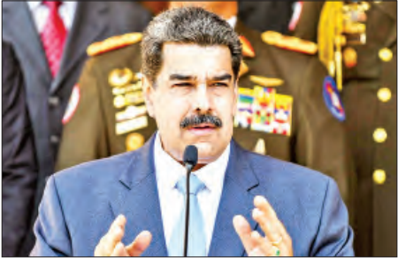
ပင်နီစွဲလားသမ္မတ နီကိုလစ်မာဒူဂို

ကရာကတ်စ် ဇွန် ၂၃ ပင်နီစွဲလားသမ္မတ နီကိုလစ်မာဒူဂိုသည် အမေရိကန်သမ္မတ ဒေါ်နယ်ထရမ်နှင့် တွေ့ဆုံရန် ဆန္ဒရှိကြောင်း ပြောကြားခဲ့သည်။ “၂၀၁၅ ခုနှစ်မှာ အမေရိကန် ဒုတိယသမ္မတဟောင်း ဂျိုးဘိုင်ဒင်နဲ့ သာတွေ့ဆုံခဲ့ဖူးလို့ သမ္မတဒေါ်နယ်ထရမ်နဲ့ ကျွန်တော် တွေ့ဆုံပါတယ်” ဟု မာဒူဂိုက ပြောသည်။ ဘရာဇီးသမ္မတ ဒီလ်မာရှာဆက်ခံမိတ် ဒုတိယသက်တမ်း ကျမ်းသစ္စာကျိန်ဆိုပွဲ အခမ်းအနားအတွင်း မာဒူဂိုက ဘိုင်ဒင်နှင့် တွေ့ဆုံခဲ့ခြင်းဖြစ်သည်။