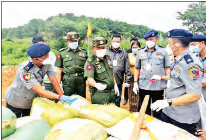
စစ်ဆေးရေးပြုလုပ်သိမ်းဆည်းရမိသော ဓာတုပစ္စည်း ၄၇ ခုနှင့် မူးယစ်ဆေးဝါးထုတ်လုပ်ရာတွင် အသုံးပြုသည့် ဆက်စပ်ပစ္စည်းအမျိုး ၅၀၊ တန်ဖိုးငွေကျပ်သန်းပေါင်း ၂၃၁၅ သန်းခန့် (အမေရိကန် ဒေါ်လာ ၂၁၁၁ သန်းကျော်) တို့ဖြစ်ကြောင်း သတင်းရရှိသည်။ သတင်းစဉ်

အခမ်းအနားတွင် ရှမ်းပြည်နယ်(မြောက်ပိုင်း) ပြည်နယ်ဒုတိယအုပ်ချုပ်ရေးမှူး ဦးကျော်သူဇော်က အဖွင့် အမှာစကားပြောကြားပြီး မူးယစ်ဆေးဝါးထုတ်လုပ်ရာတွင် အသုံးပြုသော ဆက်စပ်ပစ္စည်းများနှင့် မူးယစ်ဆေးဝါးထုတ်လုပ်ရာတွင် အသုံးပြုသည့် ဆက်စပ်ပစ္စည်းများ ပျက်ဆီးမှုနှင့် ပတ်သက်၍ ရှင်းလင်း ပြောကြားသည်။