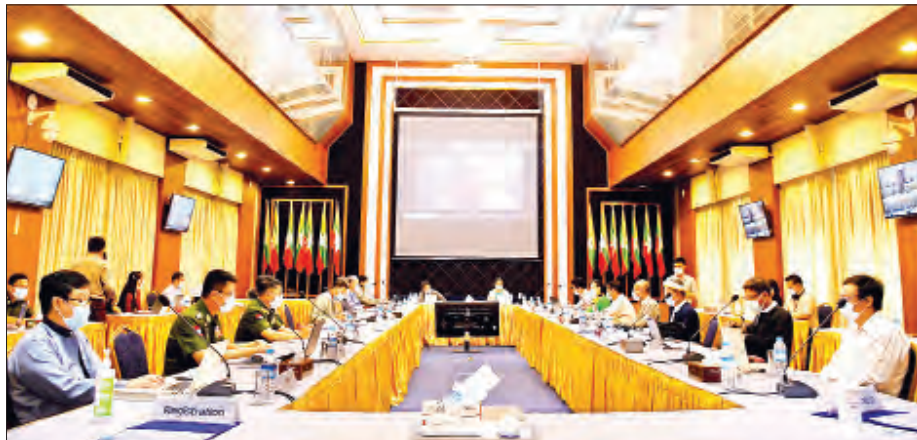
အစိုးရနှင့် NCA-S EAO ကိုယ်စားလှယ်များ၏ စတုတ္ထအကြိမ် အလုပ်အဖွဲ့ ညှိနှိုင်းအစည်းအဝေးကျင်းပစဉ်။

ရန်ကုန် ဇွန် ၂၃ အစိုးရကိုယ်စားလှယ်များနှင့် NCA လက်မှတ်ရေးထိုးထားသည့် တိုင်းရင်းသား လက်နက်ကိုင်အဖွဲ့အစည်းကိုယ်စားလှယ်များ (NCA - S EAO)၏ စတုတ္ထအကြိမ် အလုပ်အဖွဲ့ ညှိနှိုင်းအစည်းအဝေးကို ယနေ့နံနက် ၁၀ နာရီတွင် ရန်ကုန်မြို့ ရွှေလီလမ်းရှိ အမျိုးသားပြန်လည်သင့်မြတ်ရေးနှင့် ငြိမ်းချမ်းရေးဗဟိုဌာန (NRPC) ၌ ကျင်းပသည်။ အစည်းအဝေးသို့ အစိုးရကိုယ်စားလှယ်များအဖြစ် အမျိုးသားပြန်လည်သင့်မြတ်ရေးနှင့် ငြိမ်းချမ်းရေး ဗဟိုဌာန ဒုတိယဥက္ကဋ္ဌ ပြည်ထောင်စုရေဒေချုပ် ဦးထွန်းထွန်းဦး၊ ကာကွယ်ရေးဦးစီးချုပ်ကြီး(ကြည်း)မှ ဒုတိယဗိုလ်ချုပ်ကြီး ရာပြည့်၊ ဒုတိယဗိုလ်ချုပ်ကြီး မင်းနောင်နှင့် ဒုတိယဗိုလ်ချုပ်ကြီး တင်မောင်ဝင်း၊ ပြည်သူ့လွှတ်တော်ကိုယ်စားလှယ် ဦးမြိုးမျိုး(ခ)ဦးဌေးဝင်းအောင်၊ ငြိမ်းချမ်းရေးကော်မရှင်