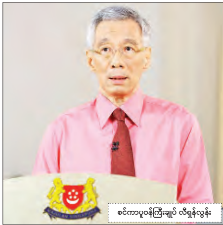
စင်ကာပူဝန်ကြီးချုပ် လီရှန်လွန်း