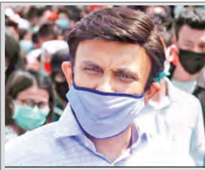
ကာနာတာကာ ပြည်နယ် ပညာရေးဝန်ကြီး ကောဆွဒါကာ