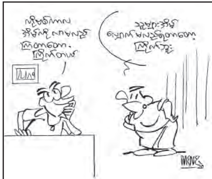
ကိုဗစ်-၁၉ ရောဂါကာကွယ်ဖို့ စနစ်တကျ လက်ဆေးစို့

အသင့်ဖျော်သောက် လက်ဖက်ရည်ထုပ်များနှင့် ငွေကျပ် သိန်း ၃၀ ကို ပေးအပ်လှူဒါန်းပြီး ညွှန်ကြားရေးမှူးချုပ် ပါမောက္ခ ဒေါက်တာဇော်သန်းထွန်းက ဂုဏ်ပြုမှတ်တမ်းလွှာ ပေးအပ်သည်။ ယနေ့ လှူဒါန်းပွဲတွင် Royal Myanmar Tea Mix က ကိုဗစ်-၁၉ ရောဂါ ကာကွယ် ထိန်းချုပ်၊ ကုသရေးအတွက် ကြိုးပမ်းဆောင်ရွက်နေသော ကျန်းမာရေးနှင့် အားကစား ဝန်ကြီးဌာန ဆေးသုတေသနဦးစီးဌာန National COVID-19 Call Centre နှင့် Molecular Laboratory Team တို့တွင် တာဝန်ထမ်းဆောင်နေသူများအား ဂုဏ်ပြုသောအားဖြင့် ငွေကျပ် သိန်း ၃၀ နှင့် (ငွေကျပ် သုံးဆယ့်သုံးသိန်း တစ်သောင်းငါးထောင် တန်ဖိုးရှိ) လက်ဖက်ရည်ထုပ်များနှင့် တစ်နေ့တာ အကျွေးအမွှေး စရိတ်တို့ကို လှူဒါန်းခဲ့ခြင်းဖြစ်ကြောင်း သိရသည်။ သတင်းနှင့်ဆက်သွယ်ရေးဝန်ကြီးဌာန (MNA)