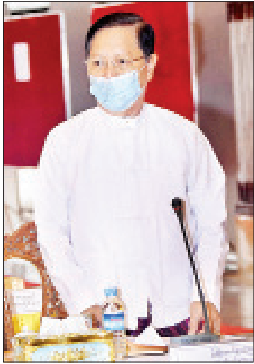
ပြည်ထောင်စုဝန်ကြီး သူရဦးအောင်ကို

(၇၃)နှစ်မြောက် အာဇာနည်နေ့ အခမ်းအနားကျင်းပရေးဗဟိုကော်မတီ၏ ပထမအကြိမ် လုပ်ငန်းညှိနှိုင်းအစည်းအဝေးကို ဇွန် ၃ ရက်တွင် နေပြည်တော်၌ ကျင်းပခဲ့ပြီး အစည်းအဝေးဆုံးဖြတ်ချက် ၂၆ ချက် ချမှတ်ခဲ့ပါကြောင်း၊ အဆိုပါ အစည်းအဝေး ဆုံးဖြတ်ချက်များနှင့် ချမှတ်ထားသည့် လုပ်ငန်းတာဝန်များကို သတ်မှတ်ချိန်အတွင်း အကောင်အထည်ဖော် ဆောင်ရွက်နိုင်ရန်အတွက် (၇၃)နှစ်မြောက် အာဇာနည်နေ့အခမ်းအနားကျင်းပရေး လုပ်ငန်းကော်မတီနှင့် ဆက်ဆံရေးအဖွဲ့အစည်းအဝေးကို ဇွန် ၁၅ ရက်တွင် လုပ်ငန်းကော်မတီဥက္ကဋ္ဌ ရန်ကုန်တိုင်းဒေသကြီး ဝန်ကြီးချုပ် ဦးမြိုးမင်းသိန်း ဦးဆောင်၍လည်းကောင်း၊ ဇွန် ၁၇ ရက်တွင် ဗဟိုကော်မတီဥက္ကဋ္ဌ သာသနာရေးနှင့် ယဉ်ကျေးမှုဝန်ကြီးဌာန ပြည်ထောင်စုဝန်ကြီး သူရဦးအောင်ကို ဦးဆောင်၍လည်းကောင်း အစည်းအဝေးများ ကျင်းပပြုလုပ်ခဲ့သည်ကို သိရှိရပါကြောင်း၊ သက်ဆိုင်ရာ ကော်မတီများနှင့် ဆက်ဆံရေးအဖွဲ့အစည်းအဝေး ဆုံးဖြတ်ချက်များနှင့် ဆောင်ရွက်ဆဲလုပ်ငန်းများကို သတ်မှတ်ချိန်အတွင်းပြီးစီးရေး ပေါင်းစပ်ညှိနှိုင်း ဆောင်ရွက်သွားကြရန် တိုက်တွန်းပြောကြားလိုပါကြောင်း။