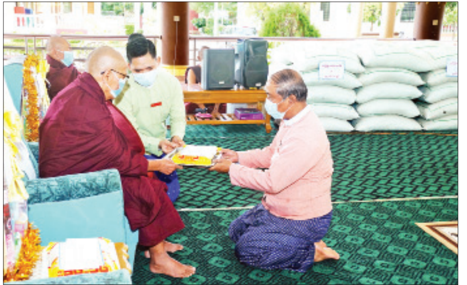
ကျောင်း ၆၉ ကျောင်း၊ သီလရှင်ကျောင်း ငါးကျောင်းတွင် သီလရှင် ၉၁ ပါးတို့အား ဆွမ်းဆန်တော် ၁၆၄ အိတ် လှူဒါန်း သီတင်းသုံးတော်မူကြသည့် ရဟန်း၊ သာမဏေ ၇၄၈ ပါးနှင့် ခွဲကြောင်း သိရသည်။ မြို့နယ်(ပြန်/ဆက်)

အဆိုပါ ဆွမ်းဆန်တော်လှူဒါန်းပွဲအခမ်းအနား တွင် ကိုဗစ်-၁၉ ရောဂါ ကာကွယ်နေစဉ်ကာလအတွင်း နေပြည်တော် တပ်ကုန်းမြို့နယ်အတွင်းရှိ ဘုန်းတော်ကြီး