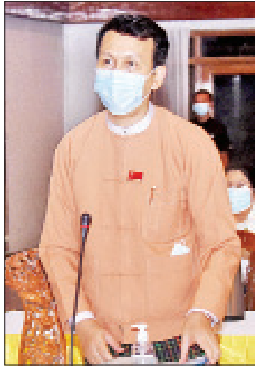
ရန်ကုန်တိုင်းဒေသကြီး ဝန်ကြီးချုပ် ဦးမြိုးမင်းသိန်း

အလံတင်ခြင်းနှင့် အလေးပြုခြင်း အခမ်းအနား၊ နေပြည်တော်ကောင်စီရုံး ဇေယျသီရိခန်းမနှင့် ရန်ကုန်မြို့ မြို့တော်ခန်းမတို့တွင် အာဇာနည်ခေါင်းဆောင်ကြီးများကို ရည်စူး၍ သံဃာတော်များအား ဆွမ်းဆက်ကပ်လှူဒါန်းခြင်းများကို သာ ဆောင်ရွက်သွားမည်ဖြစ်ပါကြောင်း။