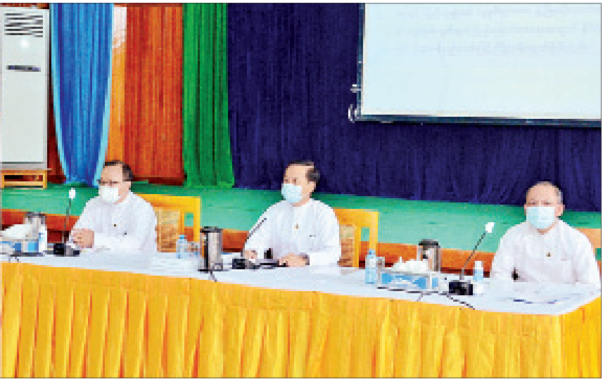
နိုင်ငံခြားရေးဝန်ကြီးဌာန/အပြည်ပြည်ဆိုင်ရာ ပူးပေါင်းဆောင်ရွက်ရေးဝန်ကြီးဌာနတို့၏ စတုတ္ထ(၁)နှစ်တာကာလ ဆောင်ရွက်ခဲ့မှုများနှင့်ပတ်သက်သည့် နိုင်ငံခြားရေးဝန်ကြီးဌာန အမြဲတမ်းအတွင်းဝန် ဦးစိုးဟန် ရှင်းလင်းပြောကြားစဉ်။

ပြည်ထောင်စုရာထူးဝန်အဖွဲ့ သတင်းစာ ရှင်းလင်းပွဲ၌ ပြည်ထောင်စုရာထူးဝန်အဖွဲ့၏ ပြည်သူ့အတွက် စတုတ္ထ(၁)နှစ်တာ ကာလအတွင်း ဆောင်ရွက်ခဲ့မှုနှင့်ပတ်သက်သည့် ပြည်ထောင်စုရာထူးဝန်အဖွဲ့မှ အဖွဲ့ဝင် စာမျက်နှာ ၄ ကော်လံ ၁ သို့ ❖