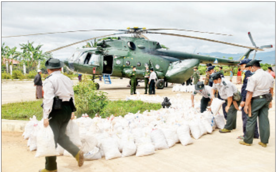
ဖြစ်ကြောင်း၊ လူအင်အားဖြင့် ဆူးထိုးစိုက်ပျိုးရန် လျာထားချက်အနက် ကျန်ရှိသည့် သစ်စေ့မြေလုံး ၃၀၀၀၀ လုံးကို နေပြည်တော်တွင် ဆက်လက်ဆောင်ရွက်လျက်ရှိကြောင်း သိရသည်။

သစ်ပင်ပေါက်ရောက်မှုမရှိသော နေရာ ကိုးနေရာ ဧရိယာဧက ၄၈၀ တွင် ဘောစကိုင်း၊ ရှား၊ ဆူဖြူမျိုးစေ့ပါဝင်သော သစ်စေ့မြေလုံး တစ်သိန်းအား ရဟတ်ယာဉ်ဖြင့် ကြေချခဲ့ကြောင်း သိရှိရသည်။