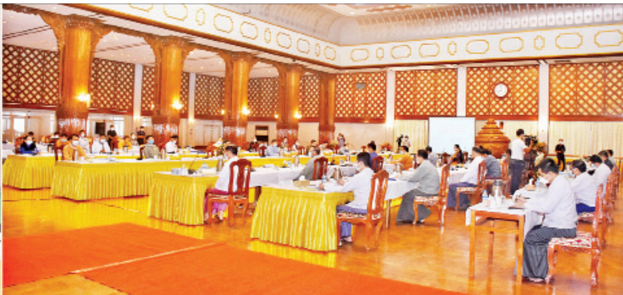
ဒုတိယသမ္မတ ဦးမြင့်ဆွေ (၇၃)နှစ်မြောက် အာဇာနည်နေ့ အခမ်းအနားကျင်းပရေး ဗဟိုကော်မတီ၏ ဒုတိယအကြိမ် လုပ်ငန်းညှိနှိုင်းအစည်းအဝေးတွင် အမှာစကားပြောကြားစဉ်။

ရန်ကုန် ဇွန် ၁၉ ၂၀၂၀ ပြည့်နှစ် (၇၃)နှစ်မြောက် အာဇာနည်နေ့အခမ်းအနား အောင်မြင်စွာကျင်းပနိုင်ရေးအတွက် (၇၃)နှစ်မြောက် အာဇာနည်နေ့အခမ်းအနား ကျင်းပရေး ဗဟိုကော်မတီ၏ ဒုတိယအကြိမ် လုပ်ငန်းညှိနှိုင်းအစည်းအဝေးကို ယနေ့နံနက် ၈ နာရီတွင် ရန်ကုန်တိုင်းဒေသကြီးအစိုးရအဖွဲ့ရုံး မင်္ဂလာခန်းမ၌ ကျင်းပရာ ဗဟိုကော်မတီနာယက ဒုတိယသမ္မတ ဦးမြင့်ဆွေ တက်ရောက်အမှာစကား ပြောကြားသည်။ အစည်းအဝေးသို့ (၇၃)နှစ်မြောက် အာဇာနည်နေ့အခမ်းအနားကျင်းပရေး