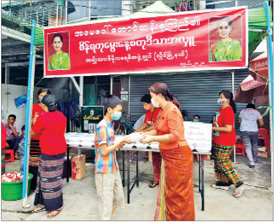
များ၌ နိုင်ငံတော်၏အတိုင်ပင်ခံပုဂ္ဂိုလ် ဒေါ်အောင်ဆန်း စုကြည်၏ (၇၅)နှစ်ပြည့် စိန်ရတုမွေးနေ့မင်္ဂလာ အထိမ်း အမှတ်အဖြစ် စတုဒိသာ အလှူကို ပြည်သူများ စုပေါင်းကာ ပြုလုပ်ခဲ့ကြသည်။ သတင်း-ဇော်ကြီး၊ ဓာတ်ပုံ-ဖေဇော်

ထို့အပြင် စတုဒိသာအလှူအဖြစ် ကြာဆံကြော်ဘူးများ ကို အဆိုပါမြို့နယ်ရှိ ရဲတပ်ဖွဲ့ဝင်များ၊ အချုပ်သားများနှင့် စည်ပင်သာယာဝန်ထမ်းများ၊ အထွေထွေအုပ်ချုပ်ရေး ဦးစီးဌာနရှိ ဝန်ထမ်းများအတွက် သက်ဆိုင်ရာဌာနများသို့ ပေးပို့လှူဒါန်းခဲ့ကြောင်း ဒေါ်ခိုင်မာဌေးက ပြောသည်။ အလားတူ နံနက်ပိုင်းကလည်း ရန်ကုန်မြို့ရှိ မြို့နယ်