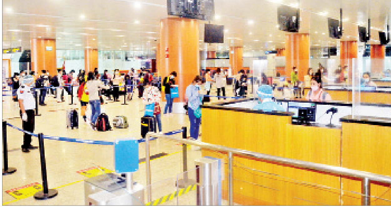
မလေးရှားနိုင်ငံမှ ပြန်လည်ရောက်ရှိလာသည့် မြန်မာနိုင်ငံသားများအား ရန်ကုန်အပြည်ပြည်ဆိုင်ရာလေဆိပ်၌ တွေ့ရစဉ်။

နိုင်ငံခြားရေးဝန်ကြီးဌာနအနေဖြင့် သက်ဆိုင်ရာနိုင်ငံများရှိ မြန်မာသံရုံးများနှင့် မြန်မာနိုင်ငံရှိ သက်ဆိုင်ရာဝန်ကြီးဌာနတို့နှင့် ပူးပေါင်းညှိနှိုင်းဆောင်ရွက်ပေးမှုဖြင့် ပြည်ပနိုင်ငံအသီးသီးတွင် အမှန်တကယ် အခက်အခဲကြုံတွေ့နေရသည့် မြန်မာနိုင်ငံသား ၄၁၇ ဦးအား ကယ်ဆယ်ရေးလေယာဉ်များဖြင့် မြန်မာနိုင်ငံသို့ ပြန်လည်ခေါ်ဆောင်ပေးခဲ့ပြီးဖြစ်သည်။ စာမျက်နှာ ၁၅ ကော်လံ ၁ သို့ □