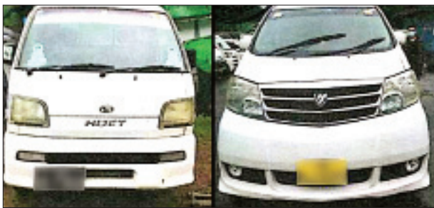
တရားဝင်စာရွက်စာတမ်းအထောက်အထား တင်ပြနိုင်ခြင်းမရှိသည့် လိုင်စင်မဲ့ Daihatsu Hijet နှင့် Toyota Alphard ယာဉ်တို့ကို တွေ့ရစဉ်။

ရှိသည်။ အဆိုပါ စစ်ဆေးရေးစခန်းများက တင်သွင်း/တင်ပို့သော ကုန်ပစ္စည်းများကို စစ်ဆေးမှု ပြုလုပ်ဆောင်ရွက်လျက် ရှိရာ ဇွန် ၁၈ ရက်တွင် မရမ်းချောင် အမြဲတမ်း စစ်ဆေးရေးစခန်းက တားဆီးမှု ငါးမူ (ခန့်မှန်းတန်ဖိုး ငွေကျပ် ၄၃ ဒသမ ၈၆၅ သန်း)အား စစ်ဆေးတွေ့ရှိ၍ ဖမ်းဆီးရမိခဲ့ပြီး ထူးခြားဖမ်းဆီးမှုအနေဖြင့် တရားဝင် စာရွက်စာတမ်း အထောက်အထား တစ်စုံတစ်ရာ တင်ပြနိုင်ခြင်းမရှိသည့် လိုင်စင်မဲ့ယာဉ်များဖြစ်သော Daihatsu