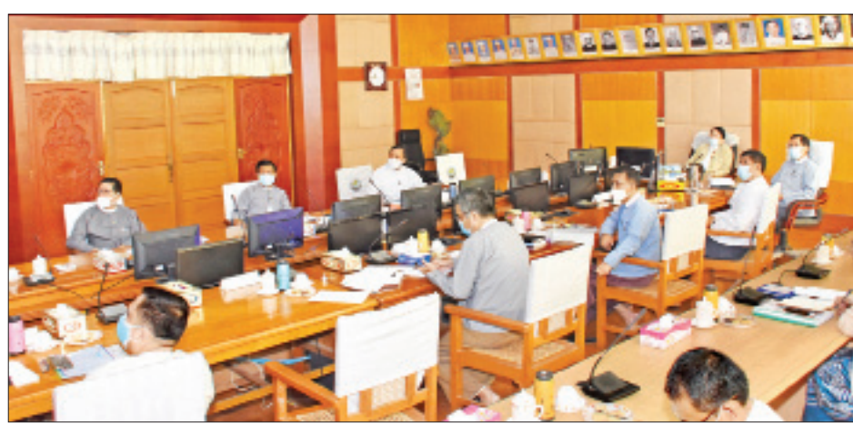
ပေး အစီအစဉ်များကို ယခုလ ၁၇ ရက်မှ စတင်ထုတ်လွှင့်ပြသမှု၊ ရွေးကောက်ပွဲဆိုင်ရာ လှုံ့ဆော်ရေးတေးသီချင်းများနှင့် ဇာတ်လမ်းတိုများကို ဇူလိုင်လဆန်းမှစ၍ ထုတ်လွှင့်ပြသနိုင်ရန် စီစဉ်ဆောင်ရွက်မှုအခြေအနေတို့ကို ရှင်းလင်း

နေပြည်တော် ဇွန် ၁၉ ၂၀၂၀ ပြည့်နှစ် အထွေထွေရွေးကောက်ပွဲဆိုင်ရာ အသိပညာပေးလှုံ့ဆော်ရေးအစီအစဉ်များ ရိုက်ကူးထုတ်လွှင့်မှုနှင့် ပတ်သက်၍ တင်ပြဆွေးနွေးခြင်းကို ယနေ့နံနက်ပိုင်းတွင် နေပြည်တော်ရှိ ပြန်ကြားရေးဝန်ကြီးဌာန ဝန်ကြီးရုံးအစည်းအဝေးခန်းမ၌ ပြုလုပ်သည်။