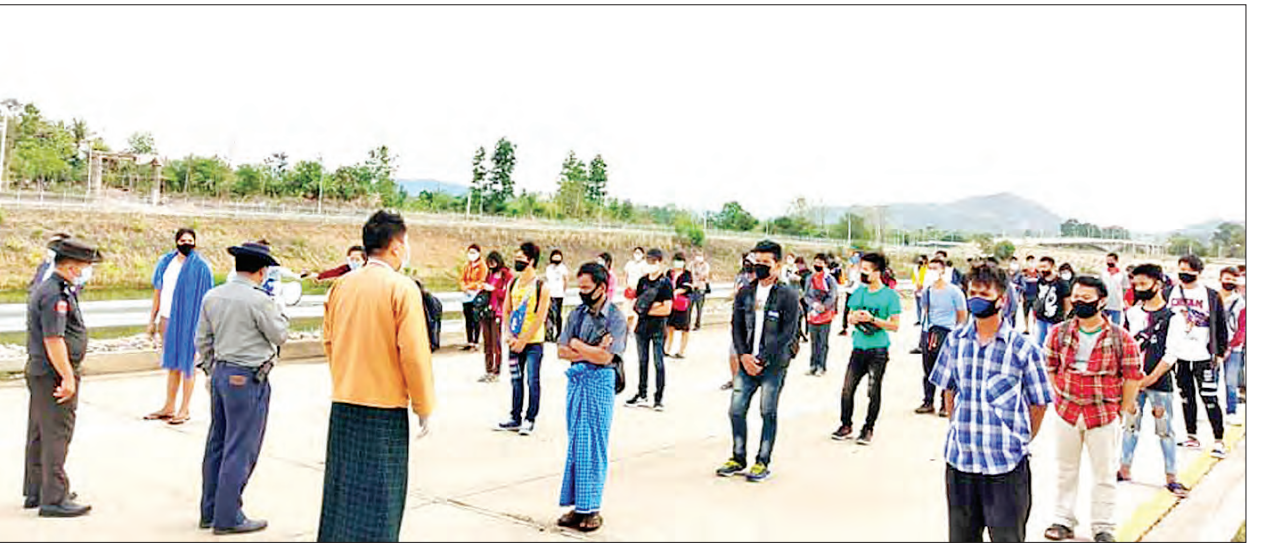
ဝင်ရောက်ခဲ့ပြီးဖြစ်သည်။ ယနေ့ ပြန်လည်ဝင်ရောက်သူများအနေဖြင့် တိုင်းဒေသကြီး၊ ပြည်နယ် အသီးသီးမှ အမျိုးသား ၄၂၅ ဦး၊ အမျိုးသမီး ၂၄၅ ဦး စုစုပေါင်း ၆၇၀ ဖြစ်ကြောင်း ထိန်းလင်းအောင်(ပြန်/ဆက်)