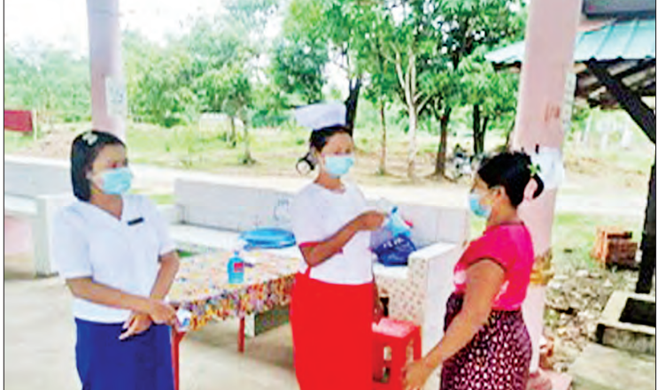
ကျန်းမာရေးနှင့်အားကစားဝန်ကြီးဌာနမှ ညွှန်ကြားချက်များနှင့်အညီ ကျန်းမာရေးဝန်ထမ်း များက ငွေထုတ်ချေးယူမည့် ကျေးရွာသူ ကျေးရွာသားများအား အပူချိန်တိုင်းပေးစဉ်။

ကိုဗစ်-၁၉ ရောဂါဖြစ်ပွားနေသည့်အချိန်တွင် အလုပ်အကိုင်အခွင့်အလမ်းများ ရပ်နားထားပြီး ရောင်းဝယ် ဖောက်ကားမှု နှောင့်နှေးခြင်း၊ ဝင်ငွေလျော့နည်းပြီး ဝင်ငွေနှင့်ထွက်ငွေ မမျှခြင်းတို့ကြောင့် ကျေးရွာနေပြည်သူများအား ဝင်ငွေနည်းနေချိန်တွင် ထွက်ငွေဘက်မှ တစ်ဖက်တစ်လမ်းမှ သက်သာ သွားစေဖို့ ကူညီထောက်ပံ့ပေးရန် မြစ်မီးရောင်ကျေးရွာ စီမံကိန်းဆောင်ရွက်နေသည့် ကျေးရွာများတွင် ချေးငွေအတွက် ငွေကျပ် ၁၀၀ တွင် တစ်လလျှင် အတိုးနှုန်းကို ပြား ၅၀ ဖြင့် တစ်ပြေးညီ သတ်မှတ် ပေးခဲ့ပါသည်။ လက်ရှိသတ်မှတ်သည့် အတိုးနှုန်းကို တစ်နှစ်တိတိ လျှော့ပေါ့ပေးခြင်းဖြစ်ပါသည်။