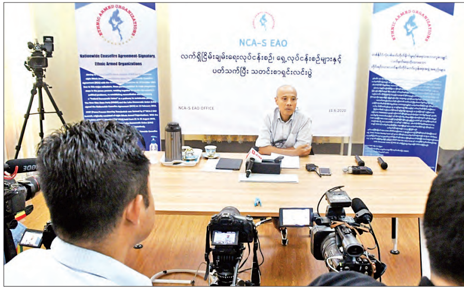
လက်ရှိငြိမ်းချမ်းရေးလုပ်ငန်းစဉ် ရှေ့လုပ်ငန်းစဉ်များနှင့် ပတ်သက်ပြီး သတင်းစာရှင်းလင်းပွဲ

(၈) ကြိမ်မြောက် တစ်နိုင်ငံလုံး ပစ်ခတ်တိုက်ခိုက်မှုရပ်စဲရေး သဘောတူစာချုပ် အကောင်အထည်ဖော်မှုဆိုင်ရာ ညှိနှိုင်းအစည်းအဝေး (JICM) ကို ဇန်နဝါရီ ၈ ရက်က နေပြည်တော်တွင် ကျင်းပခဲ့ပြီး ပြည်ထောင်စုငြိမ်းချမ်းရေးညီလာခံ-(၂၁)ရာစုပင်လုံ စတုတ္ထအစည်းအဝေးတွင် ပြည်ထောင်စုသဘောတူစာချုပ် အစိတ်အပိုင်း(၃)ကို အပိုင်းသုံးပိုင်းဖြင့် ချုပ်ဆိုသွားရန် သဘောတူညီခဲ့ကြသည်။