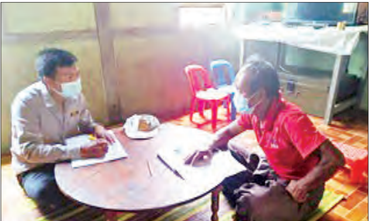
ကျေးရွာရန်ပုံငွေကြီးကြပ်မှု ကော်မတီဝင်တစ်ဦးက အသင်းသားတစ်ဦးအား အိမ်တိုင် ရာရောက် ငွေထုတ်ချေးပေးစဉ်။

ဝယ်လို့မရဖြစ်နေတာပါ။ စိုက်ပျိုးထားတဲ့ သီးနှံတွေက ရောင်းမထွက်တော့ ဝင်ငွေမရှိ တာနဲ့ အခက်အခဲကြုံနေပါတယ်။ အဲဒါ ကျေးလက်ဦးစီးဌာနက မြစ်မီးရောင်ချေးငွေကို ပြား ၅၀ အတိုးနှုန်းနဲ့ ငွေကျပ် ၁၅ သိန်း ချေးပေးတဲ့အတွက် လုပ်ငန်းပြန်လည် လည်ပတ်နိုင်ပါတယ်။ အခက်အခဲကြုံနေတဲ့ အချိန်မှာ အတိုးနှုန်းသက်သာစွာနဲ့ ငွေထုတ် ချေးပေးတဲ့အတွက် ကျေးလက်ဒေသဖွံ့ဖြိုး တိုးတက်ရေးဦးစီးဌာနကို တကယ်ပဲကျေးဇူး တင်ပါတယ်။”