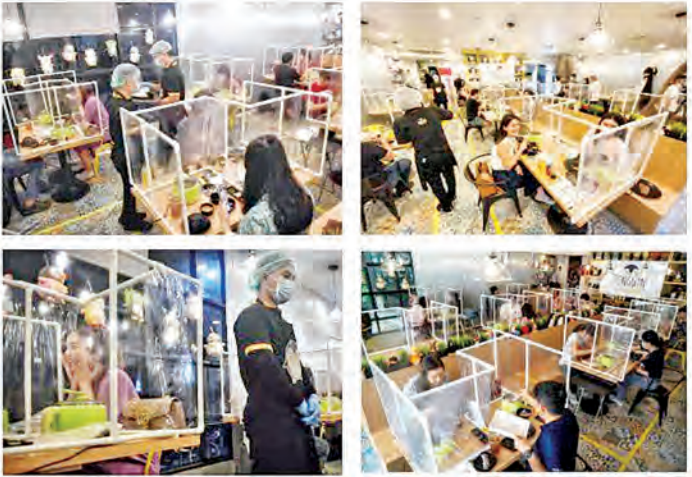
စားသောက်ဆိုင်များတွင် Physical Distancing နမူနာပုံစံများ

ကျန်းမာရေးနှင့်အားကစားဝန်ကြီးဌာန ၁၁-၆-၂၀၂၀