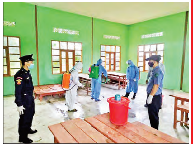
ကချင်ပြည်နယ် မိုးမောက်မြို့နယ် ဒေါ်ဖုန်းယန်မြို့၌ ကိုဗစ်-၁၉ ရောဂါ ကာကွယ်ရေး ပိုးသတ်ဆေးဖျန်းစဉ်။