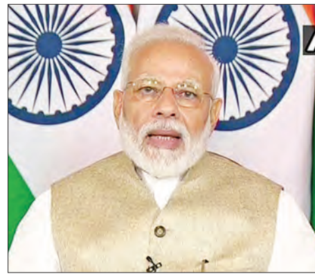
အိန္ဒိယဝန်ကြီးချုပ် နာရန်ဒရာမိုဒီ

သို့သော် ကမ္ဘောဒီးယားနိုင်ငံ၌ နေထိုင်ကြသော အိန္ဒိယနိုင်ငံသားတချို့သည် ဖေဖော်ဝါရီ ၂၅ ယနေ့ထွက်ခွာသွားပြီး ကျန်တချို့သည် ဇွန် ၁၉ ရက်တွင် ကမ္ဘောဒီးယားမှ အိန္ဒိယနိုင်ငံသို့ ထွက်ခွာကြမည်ဖြစ်သည်။ ထို့အပြင် နှစ်နိုင်ငံခေါင်းဆောင်တို့သည် ကမ္ဘောဒီးယား