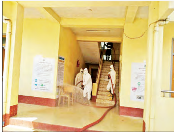
ချင်းပြည်နယ် ဟားခါးမြို့၌ ကိုဗစ်-၁၉ ရောဂါ ကာကွယ်ရေး ပိုးသတ်ဆေးဖျန်းစဉ်။