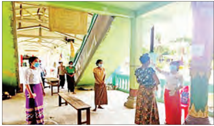
ဘုန်းတော်ကြီးကျောင်းအတွင်း၌ ကျန်းမာရေးဝန်ထမ်းများက ငွေထုတ်ချေးယူမည့် ကျေးရွာသူ ကျေးရွာသားများအား ခြောက်ပေအကွာစီခြား၍ အပူချိန်တိုင်းပေးစဉ်။

ကျေးလက်ဒေသဖွံ့ဖြိုးတိုးတက်ရေး ဦးစီးဌာနမှ ကိုဗစ်-၁၉ ရောဂါဖြစ်ပွားနေသည့် အခက်ခဲဆုံး ကာလအတွင်း ကျေးရွာ အရောက် မြို့နယ် ၂၃၃ မြို့နယ်၊ ကျေးရွာ ၁၆၅၆ ရွာရှိ ကျေးလက်နေပြည်သူ ၁၇၃၀၀ ဦးအား အတိုးနှုန်း ပြား ၅၀ နှုန်းဖြင့် ထုတ် ချေးပေးနိုင်ခဲ့သဖြင့် ကျေးလက်နေပြည်သူ များ မိသားစုဝင်ငွေတိုးလုပ်ငန်းများ ဆောင် ရွက်နိုင်ပြီဖြစ်ကြောင်း တင်ပြလိုက်ရ ပါသည်။ ။