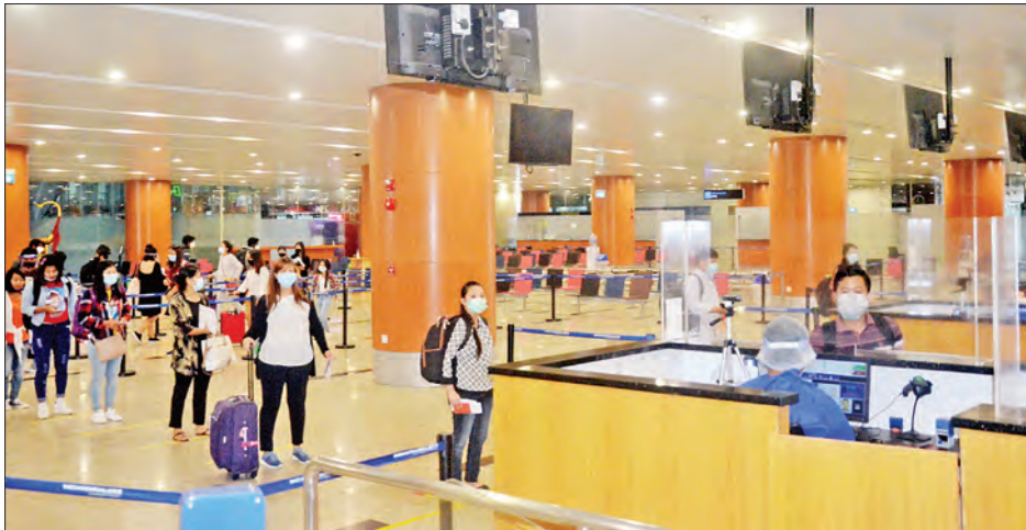
စင်ကာပူနိုင်ငံမှ ပြန်လည်ရောက်ရှိလာသော မြန်မာနိုင်ငံသားများအား ရန်ကုန်အပြည်ပြည်ဆိုင်ရာလေဆိပ်၌ တွေ့ရစဉ်။

ရန်ကုန်အပြည်ပြည်ဆိုင်ရာလေဆိပ်သို့ အဆင်ပြေချောမွေ့စွာ ပြန်လည်ရောက်ရှိကြသည်။ ၎င်းတို့ ရန်ကုန်အပြည်ပြည်ဆိုင်ရာလေဆိပ်သို့ ရောက်ရှိချိန်တွင် လူဝင်မှုကြီးကြပ်ရေး၊ ကျန်းမာရေး စစ်ဆေးရေးနှင့် ၂၁ ရက်တာ အသွားအလာကန့်သတ်နေထိုင်ရေးတို့ကို အလုပ်သမား၊ လူဝင်မှုကြီးကြပ်ရေးနှင့် ပြည်သူ့အင်အားဝန်ကြီးဌာန၊ ကျန်းမာရေးနှင့်အားကစားဝန်ကြီးဌာနနှင့် ရန်ကုန်တိုင်းဒေသကြီးအစိုးရအဖွဲ့တို့က သက်ဆိုင်ရာအခန်းကဏ္ဍအလိုက် တာဝန်ယူဆောင်ရွက်ပေးခဲ့သည်။ စာမျက်နှာ ၈ ကော်လံ ၅ သို့ ❖