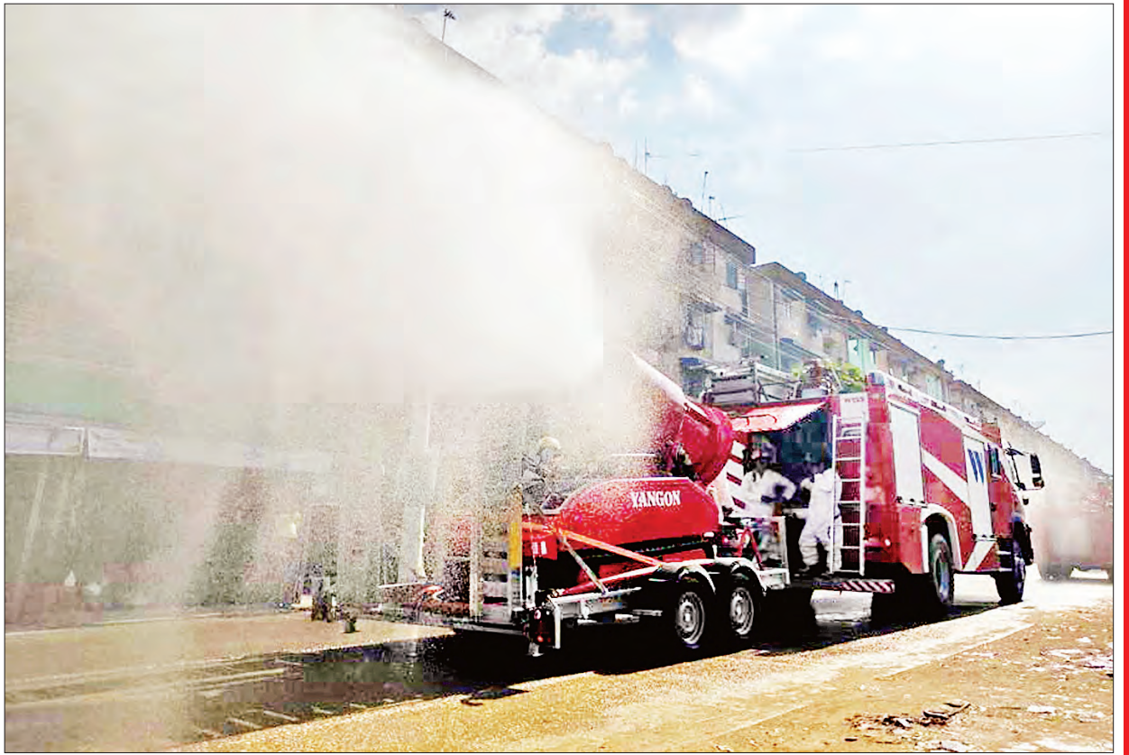
ရန်ကုန်တိုင်းဒေသကြီး သန်လျင်မြို့နယ်၌ ကိုဗစ်-၁၉ ရောဂါ ကာကွယ်ရေး ပိုးသတ်ဆေးဖျန်းစဉ်။