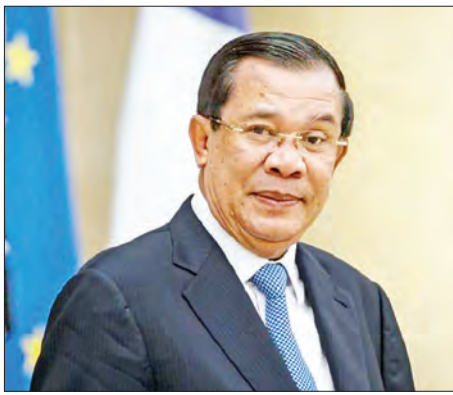
ကမ္ဘောဒီးယားဝန်ကြီးချုပ် ဆမ်ဒက်ဟွန်ဆန်

ကမ္ဘောဒီးယားအစိုးရသည်ကျောင်းသားများအပေါ်အထက် ကမ္ဘောဒီးယားနိုင်ငံသား ၆၀ ခန့်ကို ဇွန် ၁၂ ရက်တွင် စင်းလုံးငှားလေယာဉ်တစ်စင်းဖြင့် အိန္ဒိယနိုင်ငံမှ ကမ္ဘောဒီးယားနိုင်ငံသို့ ခေါ်ဆောင်လာမည်ဖြစ်ကြောင်း သိရသည်။ ထို့အတူ အိန္ဒိယအစိုးရသည်လည်း ကမ္ဘောဒီးယားနိုင်ငံ၌ နေထိုင်ကြသော အိန္ဒိယနိုင်ငံသား ၂၈၀ ခန့်ကို မကြာမီရက်များအတွင်း အိန္ဒိယနိုင်ငံသို့ ပြန်ခေါ်မည်ဖြစ်သည်။