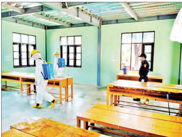
နေပြည်တော် ဇေယျာသီရိမြို့နယ် ကျောက်ချက်အခြေခံပညာအထက်တန်းကျောင်း၌ ကိုဗစ်-၁၉ ရောဂါ ကာကွယ်ရေး ပိုးသတ်ဆေးဖျန်းစဉ်။