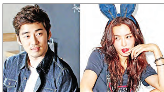
အေးပြည့် - စုစည်းသည်

တောင်ကိုရီးယားရဲ့ ကျော်ကြားတဲ့ ကြယ်ပွင့်စုံတွဲတစ်တွဲဖြစ်တဲ့ မင်းသား ယွန်းကေဆန်းနဲ့ မင်းသမီး ဟန်နီလီတို့ဟာ လတ်တလောမှာတော့ ခုနစ်နှစ်ကြာ ဖြတ်သန်းလာခဲ့တဲ့ ဆက်ဆံရေးတစ်ခုကို အဆုံးသတ်ကာ လမ်းခွဲလိုက်ပြီဖြစ်ကြောင်း အော့ကေပေါ့ဒေါ့ကွန်းရဲ့ ရေးသားဖော်ပြချက်တွေအရ သိရပါတယ်။ တေးသီချင်းနဲ့ သရုပ်ဆောင်တစ်ဦးဖြစ်သူ ယွန်းကေဆန်းနဲ့ မော်ဒယ်လ်နဲ့ သရုပ်ဆောင်တစ်ဦးဖြစ်သူ ဟန်နီလီတို့ဟာ ချစ်သူတွေ အဖြစ် ခုနစ်နှစ်ကြာ လက်တွဲခဲ့ပြီးနောက် လတ်တလောမှာ လမ်းခွဲလိုက်တာဖြစ်ပါတယ်။ ဒီသတင်းတွေကို ကြယ်ပွင့်တွေရဲ့ အေဂျင်စီကလည်း မှန်ကန်ကြောင်း ဇွန် ၁၁ ရက်မှာ အတည်ပြုပေးခဲ့တယ်လို့ သိရပါတယ်။ နှစ်ဦးသား လမ်းခွဲလိုက်ရတဲ့ အကြောင်းရင်းကိုတော့ အေဂျင်စီဘက်က ထုတ်ဖော်ပြောကြားခဲ့ခြင်း မရှိပါဘူး။ ၂၀၁၃ ခုနှစ်အတွင်း ချစ်သူတွေဖြစ်နေကြောင်း အတည်ပြုပြောကြားခဲ့ပြီးနောက် ယွန်းကေဆန်းနဲ့ ဟန်နီလီတို့က တောင်ကိုရီးယားအနုပညာ အသိုင်းအဝိုင်းမှာ သက်တမ်းရှည်စွာ လက်တွဲနိုင်ခဲ့ကြတဲ့ စုံတွဲတစ်တွဲ အဖြစ် အမြဲအသိအမှတ်ပြု ပြောကြားခဲ့ကြပါတယ်။