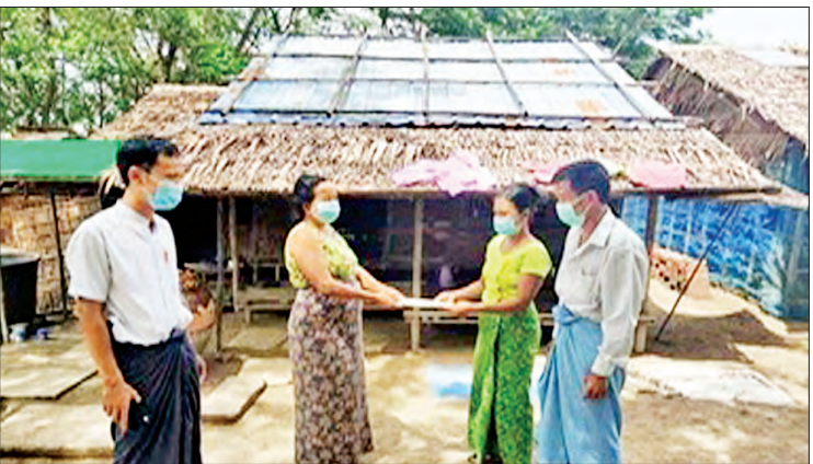
ကျေးရွာရန်ပုံငွေကြီးကြပ်မှု ကော်မတီဝင်များက ကျေးရွာသူ ကျေးရွာသားများအား အိမ်တိုင်ရာရောက် ငွေထုတ်ချေးပေးစဉ်။

ကိုဗစ်-၁၉ ရောဂါ ဖြစ်ပွားနေသည့် အချိန်တွင် အလုပ်အကိုင်အခွင့်အလမ်းများ ရပ်နားထားပြီး ရောင်းဝယ်ဖောက်ကားမှု နှောင့်နှေးခြင်း၊ ဝင်ငွေလျော့နည်းပြီး ဝင်ငွေနှင့်ထွက်ငွေ မမျှတခြင်းတို့ကြောင့် ကျေးရွာနေပြည်သူများအား ဝင်ငွေနည်း နေချိန်တွင် ထွက်ငွေဘက်မှ တစ်ဖက် တစ်လမ်းမှ သက်သာသွားစေဖို့ ကူညီ ထောက်ပံ့ပေးရန် မြစ်မီးရောင်ကျေးရွာ စီမံကိန်းဆောင်ရွက်နေသည့် ကျေးရွာများ တွင် ချေးငွေအတွက် ငွေကျပ် ၁၀၀ တွင် တစ်လလျှင် အတိုးနှုန်းကို ပြား ၅၀ ဖြင့် တစ်ပြေးညီ သတ်မှတ်ပေးခဲ့ပါသည်။ လက်ရှိ သတ်မှတ်သည့် အတိုးနှုန်းကို တစ်နှစ်တိတိ လျှော့ပေါ့ပေးခြင်း ဖြစ်ပါသည်။