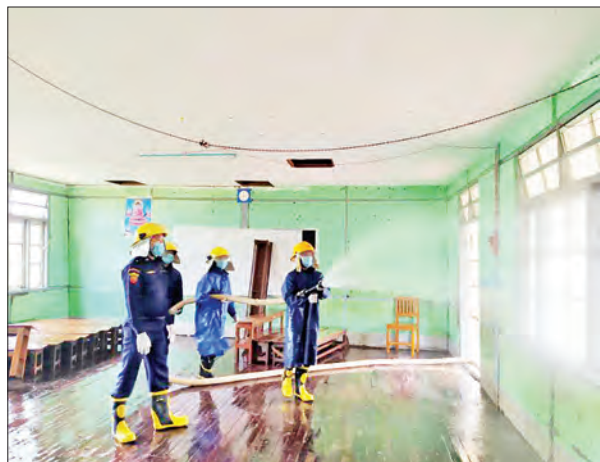
မကွေးတိုင်းဒေသကြီး သရက်မြို့နယ် ရေနံမကျေးရွာအခြေခံပညာအထက်တန်းကျောင်း၌ ကိုဗစ်-၁၉ ရောဂါ ကာကွယ်ရေး ပိုးသတ်ဆေးဖျန်းစဉ်။