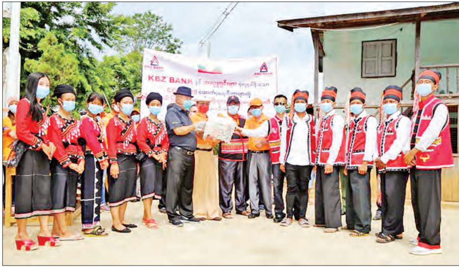
လှူဒါန်းခဲ့ကြသည်။ ထိုမှတစ်ဆင့် ပြည်နယ်ဝန်ကြီးချုပ်နှင့်အဖွဲ့သည် ရှမ်းချယ်ရီပရဟိတကျောင်းသို့ ရောက်ရှိကာ အဲန်၊ လားဟူ၊ အာခါ၊ လွယ်၊ ရှမ်း စသည့် တိုင်းရင်းသားကျောင်းသား

ကျိုင်းတုံ ဇွန် ၁၁ ရှမ်းပြည်နယ်ဝန်ကြီးချုပ် ဒေါက်တာလင်းထွဋ်၊ ရှမ်းပြည်နယ် လွှတ်တော်ဥက္ကဋ္ဌ ဦးစိုင်းလုံးဆိုင်၊ ပြည်နယ်အစိုးရအဖွဲ့ဝင် ဝန်ကြီးများ၊ လွှတ်တော်ကိုယ်စားလှယ်များ၊ ကမ္ဘောဇဘဏ် နာယက ဦးအောင်ကိုဝင်း၊ အကြီးတန်းအုပ်ချုပ်မှုဒါရိုက်တာ ဦးညိုမြင့်နှင့် တာဝန်ရှိသူများ၊ ရှမ်းပြည်နယ် ပြည်သူ့ထု စားနပ်ရိက္ခာထောက်ပံ့ရေးကော်မတီဝင်များ၊ ပရဟိတ အဖွဲ့ဝင်များသည် ယနေ့တွင် ရှမ်းပြည်နယ်(အရှေ့ပိုင်း)ရှိ ရှမ်း၊ လားဟူ၊ လားဟူရီ၊ ဝါ အာခါ၊ လွယ်၊ အဲန် စသည့် တိုင်းရင်းသားများနေထိုင်ရာဒေသများသို့ သွားရောက်၍ အခြေခံပြည်သူများအား ဆန်၊ ဆီ၊ ဆားနှင့် ကုလားပဲများ ပါဝင်သည့် စားနပ်ရိက္ခာများ ထောက်ပံ့ပေးအပ်လှူဒါန်း သည်။