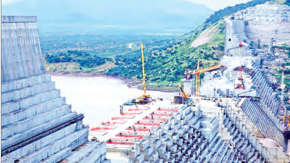
နိုင်ငံမြစ်တွင် တည်ဆောက်ထားသည့် အိသီယိုးပီးယားနိုင်ငံ၏ ရေကာတာကို တွေ့ရစဉ်။

ယူကရိန်း၌ တစ်ရက်အတွင်း ကိုဗစ်-၁၉ ရောဂါ ကူးစက်ခံရသူ ၆၉၉ ဦး စံချိန်တင် စမ်းသပ်တွေ့ရှိ ကိုယက်စ် ဇွန် ၁၁ ယူကရိန်းနိုင်ငံ၌ တစ်ရက်အတွင်း ကိုဗစ်-၁၉ ရောဂါ ကူးစက်ခံရသူ ၆၉၉ ဦး ထပ်မံ စမ်းသပ်တွေ့ရှိခဲ့ရာ နိုင်ငံအတွင်း ကိုဗစ်-၁၉ ရောဂါ စတင်တွေ့ရှိခဲ့ချိန်ကတည်းက တစ်ရက်တာအတွင်း ကိုဗစ်-၁၉ ရောဂါ ကူးစက်မှုနှုန်း အများဆုံးဖြစ်လာကြောင်း ယူကရိန်းကျန်းမာရေးဝန်ကြီး မာဒ်ဆိမ်စတီပီနော့ဗစ်က ယနေ့ ပြောကြားသည်။ “ကိုဗစ်-၁၉ ရောဂါ ကူးစက်ပျံ့နှံ့မှုအခြေအနေ အဆိုးရွားဆုံးနဲ့ အခက်ခဲဆုံး ဖြစ်တဲ့ ဧပြီလမှာ တစ်ရက်အတွင်း လူ ၆၈၉ ဦး ကူးစက်ခံခဲ့ရတယ်။ ဒီလိုစံချိန် ချိုးခဲ့တာမျိုးကို တစ်ခါမှ ကျွန်တော်တို့ မကြုံဖူးပါဘူး”ဟု ကျန်းမာရေးဝန်ကြီး မာဒ်ဆိမ်စတီပီနော့ဗစ်က နေ့စဉ် သတင်းစာရှင်းလင်းပွဲတစ်ရပ်တွင် ယနေ့ ပြောကြားသည်။ လက်ရှိအချိန်အထိ ယူကရိန်းနိုင်ငံ၌ ကိုဗစ်-၁၉ ရောဂါ ကူးစက်ခံရသူ ၂၉၀၇၀ ရှိပြီး ၎င်းတို့အနက် ၈၅၄ ဦးသည် အဆိုပါရောဂါကြောင့် သေဆုံးခဲ့ ကြောင်း၊ ရောဂါကူးစက်ခံရသူ ၁၃၀၄၁ ဦးသည် ရောဂါကင်းစင်ပြီး ဆေးရုံများမှ ဆင်းသွားပြီဖြစ်ကြောင်း သိရသည်။ ကိုးကား - ဆင်ပွာ၊ ဘာသာပြန် - ဂျေတီ