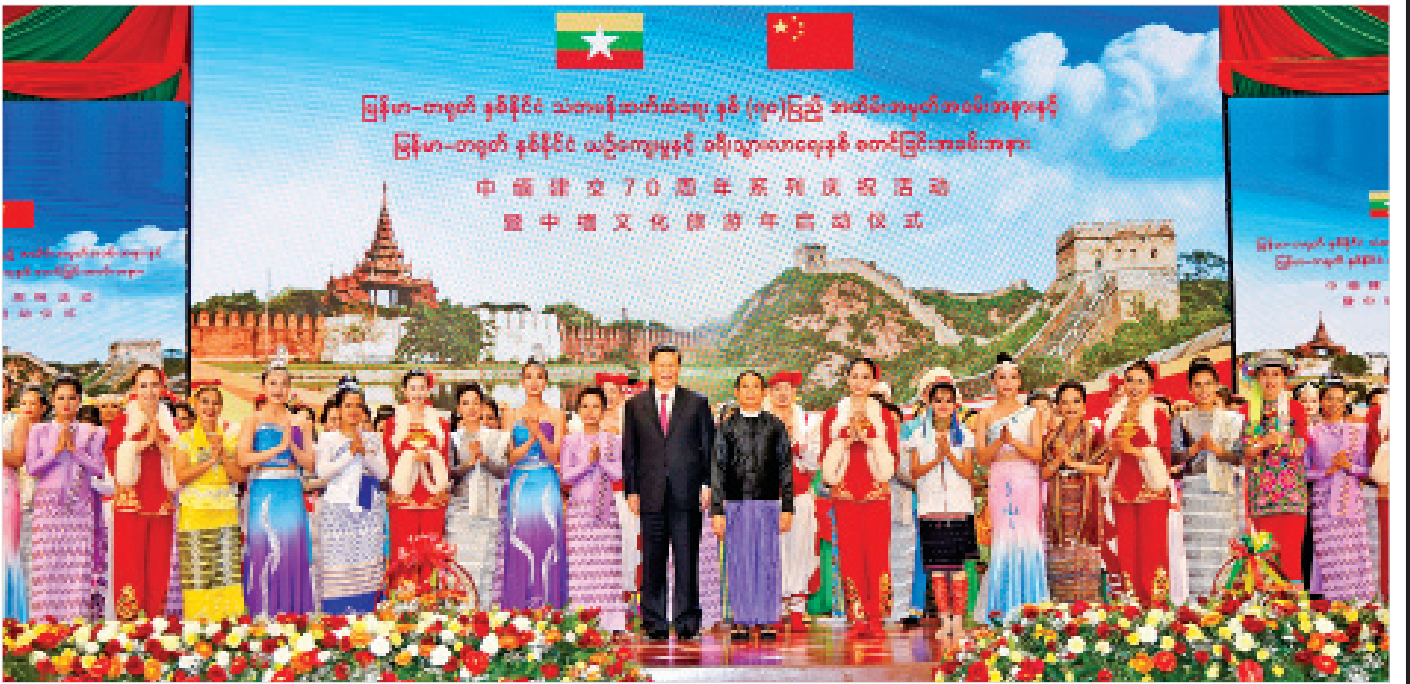
၂၀၂၀ ပြည့်နှစ် ဇန်နဝါရီ ၁၇ ရက် ညပိုင်းတွင် မြန်မာ-တရုတ် နှစ်နိုင်ငံ သံတမန်ဆက်ဆံရေး နှစ်(၇၀)ပြည့် အထိမ်းအမှတ်အခမ်းအနားနှင့် မြန်မာ-တရုတ်နှစ်နိုင်ငံ ယဉ်ကျေးမှုနှင့် ခရီးသွားလာရေးနှစ် စတင်ခြင်းအခမ်းအနား ပြီးဆုံးပြီးနောက် နိုင်ငံတော်သမ္မတ ဦးဝင်းမြင့်နှင့် တရုတ်နိုင်ငံသမ္မတ မစ္စတာ ရှီကျင့်ဖျင်တို့ နှစ်နိုင်ငံ ယဉ်ကျေးမှုအကူအညီ ဝင်များနှင့် စုပေါင်းမှတ်တမ်းတင်ဓာတ်ပုံရိုက်စဉ်။

ကျွန်တော်ပါဝင်ခဲ့သည့် (၂+၂) အဆင့်မြင့်ဆွေးနွေးပွဲများ မြန်မာနိုင်ငံ၏ အမျိုးသားပြန်လည်သင့်မြတ်ရေးနှင့် ငြိမ်းချမ်းရေးလုပ်ငန်းစဉ်များအတွက် အရေးကြီးသည့်