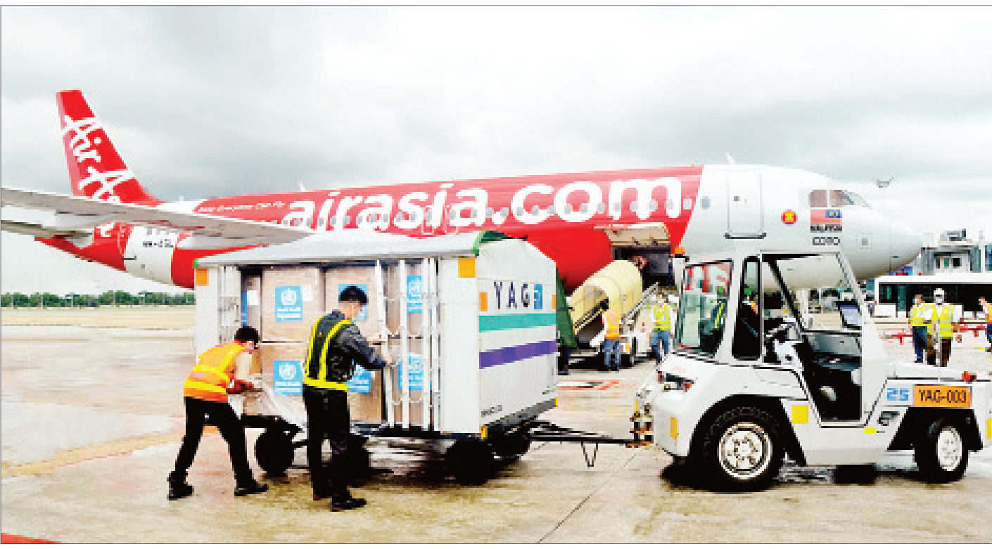
ကိုဗစ်-၁၉ ရောဂါ ကာကွယ်၊ ထိန်းချုပ်ရေးလုပ်ငန်းများ ဆောင်ရွက်ရာတွင် အသုံးပြုရန်အတွက် ကမ္ဘာ့ကျန်းမာရေးအဖွဲ့က ထောက်ပံ့ကူညီသည့် ဆေးဝါးနှင့် အထောက်အကူပြုပစ္စည်းများတင်ဆောင်လာသော လူသားချင်းစာနာထောက်ထားမှုဆိုင်ရာ အထူးလေယာဉ် ရန်ကုန်အပြည်ပြည်ဆိုင်ရာလေဆိပ်သို့ ဆိုက်ရောက်စဉ်။

နေပြည်တော် ၈ ဇွန် ၈ ၂၀၂၀ ပြည့်နှစ် ၈ ဇွန်လ ၈ ရက်နေ့တွင် ကျရောက်သော ပြည်ထောင်စုသမ္မတမြန်မာနိုင်ငံတော်နှင့် တရုတ်ပြည်သူ့သမ္မတနိုင်ငံတို့အကြား သံတမန်ဆက်သွယ်မှုထူထောင်သည့် နှစ် (၇၀) ပြည့်မြောက် အခါသမယတွင် နိုင်ငံတော်သမ္မတ ဦးဝင်းမြင့်နှင့် တရုတ်ပြည်သူ့သမ္မတနိုင်ငံ သမ္မတ မစ္စတာ ရှီကျင့်ဖျင်တို့သည် လည်းကောင်း၊ နိုင်ငံတော်၏အတိုင်ပင်ခံပုဂ္ဂိုလ် ဒေါ်အောင်ဆန်းစုကြည်နှင့် တရုတ်ပြည်သူ့သမ္မတနိုင်ငံ နိုင်ငံတော်ကောင်စီ ဝန်ကြီးချုပ် လီချန်းတို့သည် လည်းကောင်း ဝမ်းမြောက်ကြောင်းသဝဏ်လွှာများ အသီးသီးအပြန်အလှန်ပေးပို့ခဲ့ကြသည်။