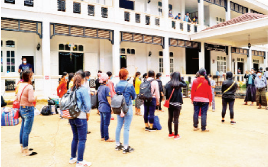
အဆိုပါ နေရပ်ပြန်ပြည်သူများသည် မြဝတီမြို့ အမှတ်(၂) ချစ်ကြည်ရေး တံတားမှဝင်ရောက်လာပြီး ပြည်နယ်အစိုးရအဖွဲ့၏ စီစဉ်မှုဖြင့် ပြန်လည်ပို့ဆောင်ခဲ့ကြောင်း၊ နေရပ် ပြန် ပြည်သူများတွင် ရှမ်းပြည်နယ် (တောင်ပိုင်း)မှ ၇၆ ဦးနှင့် ရှမ်းပြည်နယ် (မြောက်ပိုင်း)မှ ၁၂ ဦး ဖြစ်ကြောင်း သိရသည်။ နေမင်းထွန်း(ဟိုပုံး)

နေရပ်ပြန်ပြည်သူများကို မြို့နယ် ကိုဗစ်-၁၉ ရောဂါ ကာကွယ်ထိန်းချုပ် ကုသရေး ကြီးကြပ်မှု ကော်မတီဝင်များ၊ ကျန်းမာရေး ဝန်ထမ်းများ၊ အရပ်ဘက် လူမှုအဖွဲ့ အစည်းများ၊ ပရဟိတလူငယ်များက ကျန်းမာရေးစစ်ဆေးခြင်း၊ သတ်မှတ် အဆောင် အသီးသီးတွင် နေရာချ ထားပေးခြင်း၊ အသွားအလာကန့်သတ် ထားစဉ်လိုက်နာ ဆောင်ရွက်ရမည့် အချက်များ ရှင်းလင်းခြင်းတို့ကို ဆောင်ရွက်ပေးခဲ့သည်။