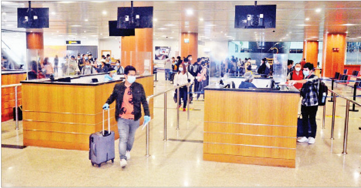
ပြင်သစ်နိုင်ငံမှ ပြန်လည်ရောက်ရှိလာသည့် မြန်မာနိုင်ငံသားများအား ရန်ကုန်အပြည်ပြည်ဆိုင်ရာလေဆိပ်၌ တွေ့ရစဉ်။

နေပြည်တော် ဇွန် ၇ ပြည်ပနိုင်ငံများတွင် အခက်အခဲကြုံတွေ့နေရသည့် မြန်မာနိုင်ငံသားများအား ပြန်လည်ခေါ်ဆောင်နိုင်ရေးအတွက် Coronavirus Disease 2019 (COVID-19) ကာကွယ်ထိန်းချုပ်၊ ကုသရေးအမျိုးသားအဆင့် ဗဟိုကော်မတီ၏ လမ်းညွှန်ချက်နှင့်အညီ နိုင်ငံခြားရေးဝန်ကြီးဌာနအနေဖြင့် သက်ဆိုင်ရာဝန်ကြီးဌာနများ၊ သက်ဆိုင်ရာနိုင်ငံများရှိ မြန်မာသံရုံးများနှင့် ပူးပေါင်းညှိနှိုင်း၍ ဆောင်ရွက်ပေးလျက်ရှိသည်။