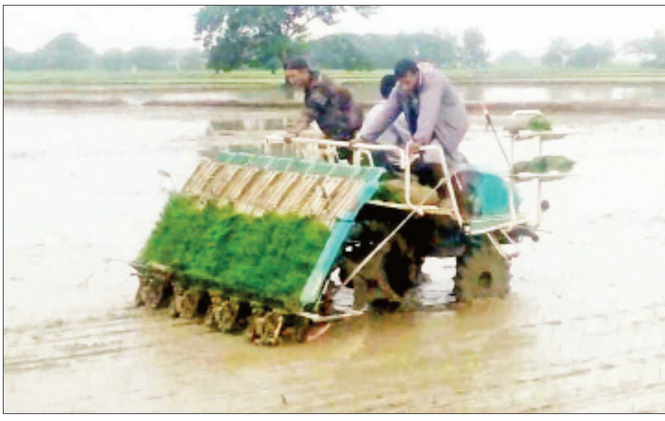
မိုးစပါးများအချိန်မီစိုက်ပျိုးနိုင်ရေး စက်မှုလယ်ယာဦးစီးဌာနမှ ဝန်ဆောင်မှုပေးလျက်ရှိ