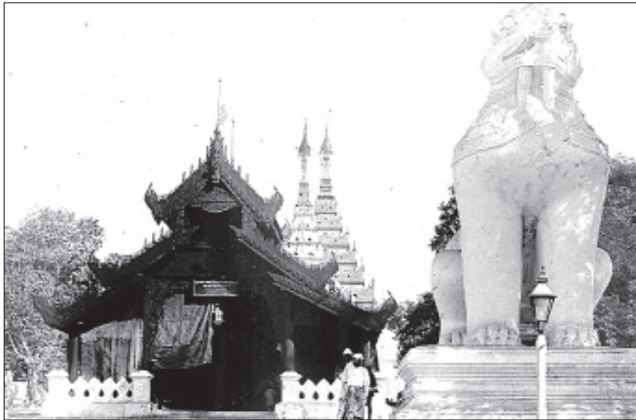
ရှေးက မဟာမုနိအနောက်မုခ်

ကျွန်းပြာသာဒ် ကျွန်းစောင်းတန်း ၁၉၄၂ ခုနှစ် ဧပြီ ၂၅ ရက်နေ့တွင် မဟာမုနိဘုရား မြောက်ဘက် မြင်းဝန်တိုက် အနောက်ဘက်ရပ်ကွက်ကို မီးတင်ရှို့ရာမှ ရပ်ကွက်သာမက မြောက်စောင်းတန်းမုခ်ဦး ကျွန်းပြာသာဒ် ကျွန်းစောင်းတန်း၊ ရွှေရေဆောင်တိုက်နှင့် အနောက်စောင်းတန်း ကျွန်းပြာသာဒ် ကျွန်းစောင်းတန်း