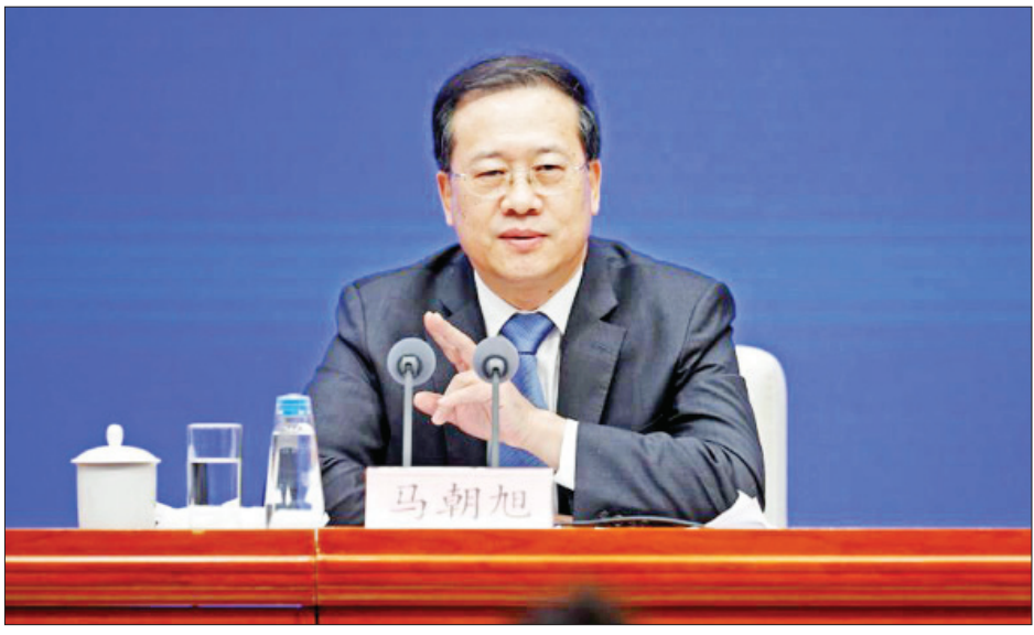
တရုတ်နိုင်ငံခြားရေးဒုတိယဝန်ကြီး မာကျောင်းရှူ

နိုင်ငံခြားရေးဒုတိယဝန်ကြီး မာကျောင်းရှူက ယနေ့ ပြုလုပ်သော သတင်းစာရှင်းလင်းပွဲတစ်ရပ်တွင် ပြောကြား ခဲ့သည်။ ထို့ပြင် ကမ္ဘာ့ကျန်းမာရေးအဖွဲ့၏ ကိုရိုနာဗိုင်းရပ်စ် ဆိုင်ရာ ဘက်ပေါင်းစုံငွေကြေးသုံးစွဲမှုအတွက် အမေရိကန် ဒေါ်လာ သန်း ၅၀ ခန့်ကို တရုတ်နိုင်ငံက ထောက်ပံ့ပေးခဲ့ ကြောင်းနှင့် ကာကွယ်ဆေးအတွက် ကမ္ဘာလုံးဆိုင်ရာ မဟာမိတ်အဖွဲ့အပါအဝင် ကမ္ဘာ့အဖွဲ့ အစည်းများအား ထောက်ပံ့မှု အများအပြားပေးခဲ့ကြောင်း တရုတ် နိုင်ငံခြားရေး ဒုတိယဝန်ကြီး မာကျောင်းရှူက ဆိုသည်။ တရုတ်နိုင်ငံအနေဖြင့် ကမ္ဘာ့ကျန်းမာရေးအဖွဲ့၏ ကြံ့ခိုင်ရေးနှင့်တုံ့ပြန်မှုရန်ပုံငွေအဖွဲ့တွင်လည်း တက်ကြွစွာ ပါဝင်လျက်ရှိကြောင်း မာကျောင်းရှူက ဆက်လက် ပြောကြားသည်။ ထို့ပြင် အာဖရိက၌ ဆေးရုံပေါင်း ၃၀ တည်ဆောက်ရေး တွင် စက်ကိရိယာများကို ကူညီထောက်ပံ့ပေးလျက် ရှိကြောင်း ၎င်းကဆိုသည်။ ကိုးကား- ဂလိုဘယ်တိုင်းမ် ဘာသာပြန်- အောင်ကျော်ကျော်