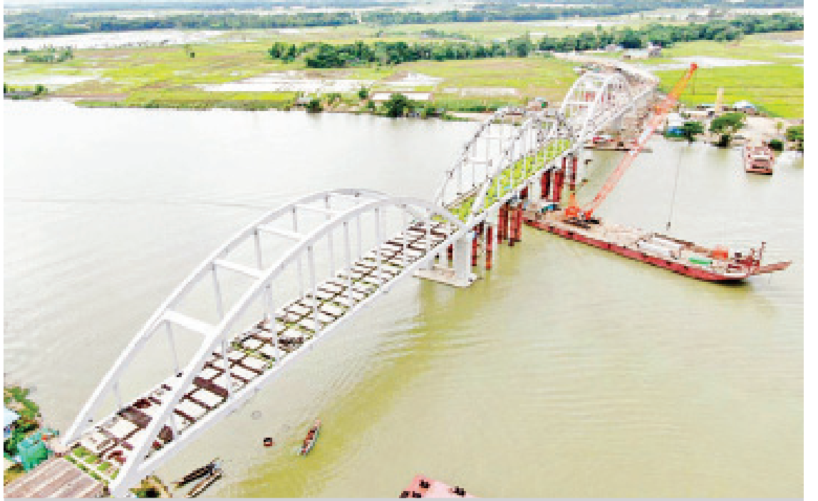
စော်ကဲတံတား သံပေါင်တပ်ဆင်ပြီးစီးမှုကို တွေ့ရစဉ်။

ယခုအခါ စော်ကဲတံတား၏ ပင်မတံတားသံပေါင် မီတာ ၉၀ ခန်းဖွင့်တပ်ဆင်ခြင်းလုပ်ငန်းများ အလုံးစုံဆောင်ရွက်ပြီးစီးပြီး ကျွန်းပြဿဒိတံတားအတွက် နောက်ဆုံး သံ