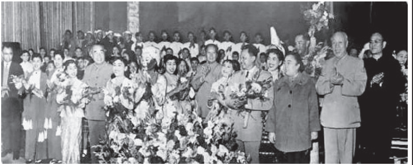
၁၉၆၀ ပြည့်နှစ် အောက်တိုဘာ ၉ ရက်တွင် ဥက္ကဋ္ဌကြီး မော်စီတုန်းနှင့် တရုတ်ခေါင်းဆောင်များ မြန်မာ့ယဉ်ကျေးမှုကိုယ်စားလှယ်အဖွဲ့နှင့်အတူ စုပေါင်းမှတ်တမ်းတင်ဓာတ်ပုံ ရိုက်စဉ်။

ထို့အပြင် နှစ်နိုင်ငံသည် ပထဝီတည်နေရာချင်း နီးကပ်ပြီး ပြည်သူချင်း ချစ်ခင်ရင်းနှီးကာ ယဉ်ကျေးမှု ချင်းလည်း ဆက်နွှယ်နေပါကြောင်း၊ နှစ်နိုင်ငံအကြား အေးအတူပူအမျှ အသိုက်အဝန်းအတူတကွ တည်ဆောက် ရန် သဘောတူညီချက်သည် နှစ်နိုင်ငံပြည်သူများ၏ အခက်အခဲကို အတူတကွရှင်ဆိုင်ကြသည့် အပြန်အလှန် အကူအညီပေးပေးကြသောညီအစ်ကိုမောင်နှမသံယောဇဉ် ကို သက်ဝင်လှုပ်ရှားစွာထင်ဟပ်စေပြီး နှစ်ဦးနှစ်ဖက် ဆက်ဆံရေး၏ အနာဂတ်လမ်းပြမြေပုံသစ်ကို ဘက်စုံ ရေးဆွဲနေပြီဖြစ်ပါကြောင်း၊ နှစ်နိုင်ငံပြည်သူများ၏ ဆန္ဒ အရေးကြီးကြောင်းကို စဉ်ဆက်မပြတ် ခိုင်ခံ့လာအောင်