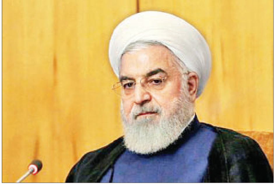
အီရန်သမ္မတ ရိုဟာနီ

ကိုးကား - အေအက်ပီပီ၊ ဘာသာပြန် - အောင်ဇော်လင်း