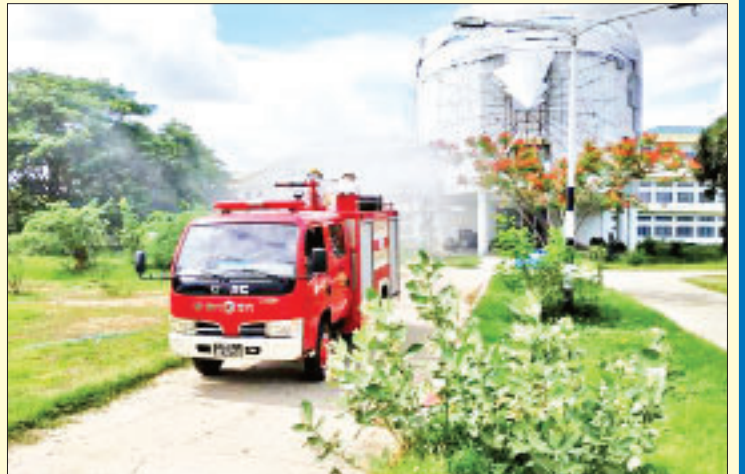
မန္တလေးတိုင်းဒေသကြီး မိတ္ထီလာမြို့နယ်ရှိ လေကြောင်းနှင့် အာကာသပညာတက္ကသိုလ်၌ ကိုဗစ်-၁၉ ရောဂါ ကာကွယ်ရေး ပိုးသတ်ဆေးဖျန်းစဉ်။