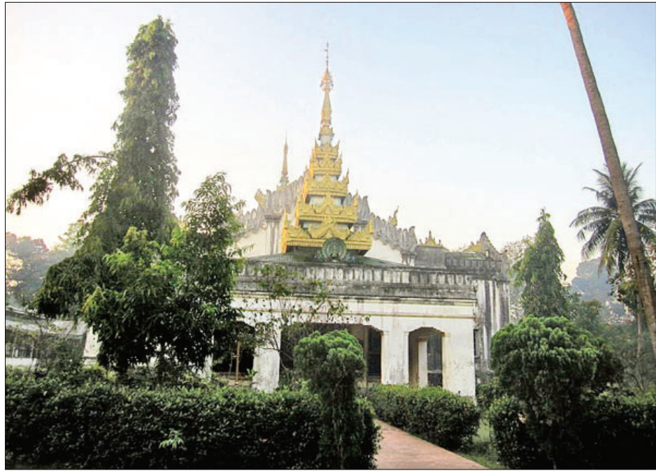
ရန်ကုန်တက္ကသိုလ်ဓမ္မာရုံ။

သည်တုန်းက တက္ကသိုလ်မှာ အေးအေးချမ်းချမ်း သာသာယာယာ ပညာသင်ကြားခဲ့ရတဲ့အချိန်က နည်းပါး