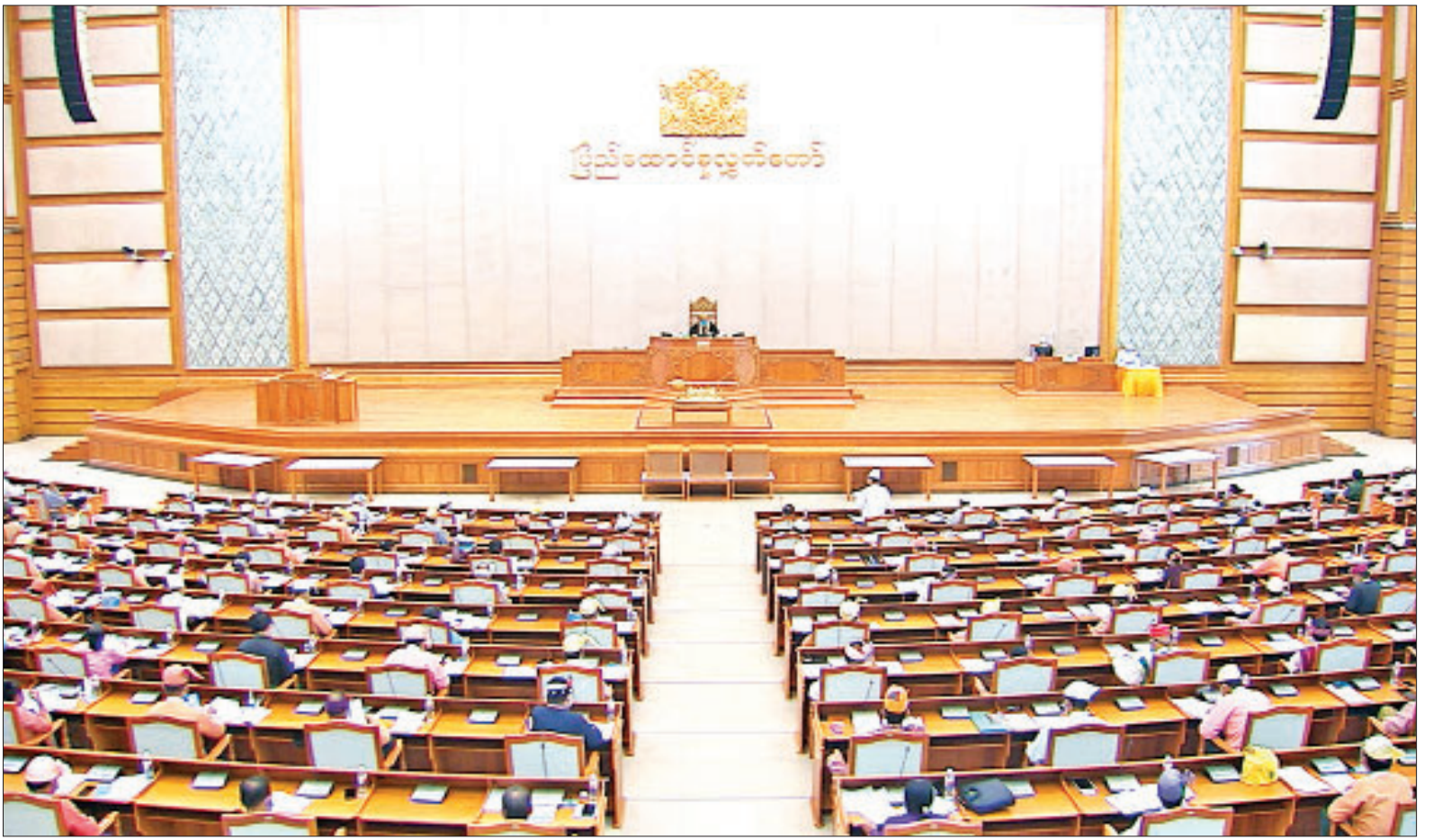
ဒုတိယအကြိမ် ပြည်ထောင်စုလွှတ်တော် (၁၆)ကြိမ်မြောက် ပုံမှန်အစည်းအဝေး ပဉ္စမနေ့ကျင်းပစဉ်။