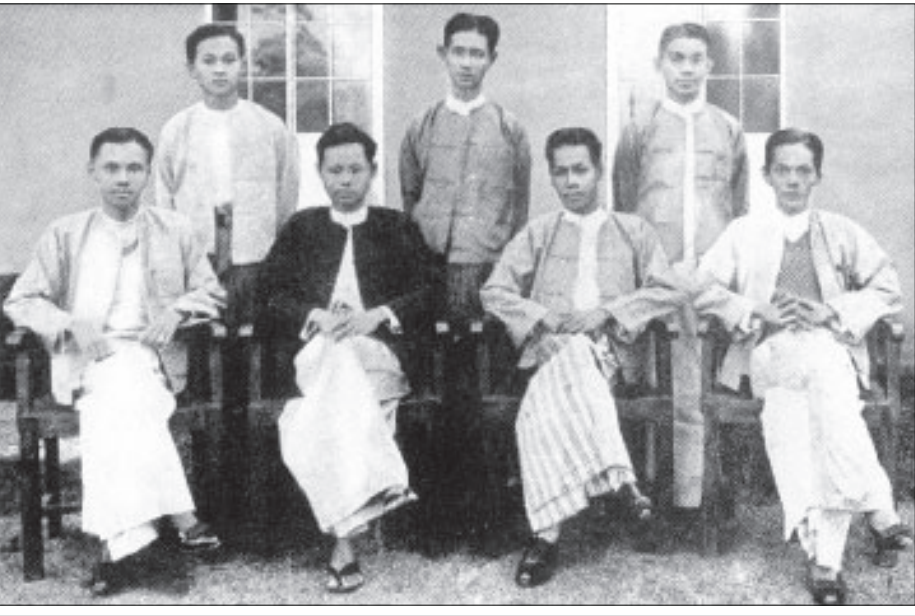
ဗိုလ်ချုပ်အောင်ဆန်း ရန်ကုန်တက္ကသိုလ်ကျောင်းသားဘဝက ကျောင်းသားသမဂ္ဂ၌ ရိုက်ကူးထားသော မှတ်တမ်းတင်ဓာတ်ပုံအား တွေ့ရစဉ်။

ကျွန်ဘဝသို့ရောက်ရှိပြီး တစ်လျှောက်လုံးလိုလိုပင် ကျောင်းသားလှုပ်ရှားမှု မရှိခဲ့ဘဲ ငြိမ်သက်ခဲ့ရာမှ ၁၉၂၀ ပြည့်နှစ် သပိတ်ကြီးပေါ်ပေါက်လာပြီး ပြောင်ပြောင်တင်းတင်း ဆန့်ကျင်လိုက်ခြင်းဟာ ရန်ကုန်တက္ကသိုလ် ကျောင်းသား ကျောင်းသူများအနေဖြင့် မြန်မာနိုင်ငံရဲ့ အမျိုးသားနိုင်ငံရေးကို လျစ်လျူရှုထားဘူး၊ လက်ပိုက်ကြည့်မနေဘူး တိုက်ပွဲဝင်သွားတော့မယ်လို့ နယ်ချဲ့ကို သတိပေးလိုက်ခြင်းပဲဖြစ်တယ်။ တစ်ချိန်တည်းမှာလည်း ရန်ကုန် တက္ကသိုလ်သပိတ်ကြီးဟာ အမျိုးသားတစ်ရပ်လုံး နီးထလာအောင် တပ်လှန့် နှိုးဆော်ခြင်းလည်းဖြစ်တာကြောင့် အဲဒီအချိန်ကစပြီး မြန်မာနိုင်ငံရဲ့ လွတ်မြောက်ရေး ကြိုးပမ်းမှုတစ်စခန်းက အစပြုခဲ့တယ်လို့ ဆိုနိုင်ပါတယ်