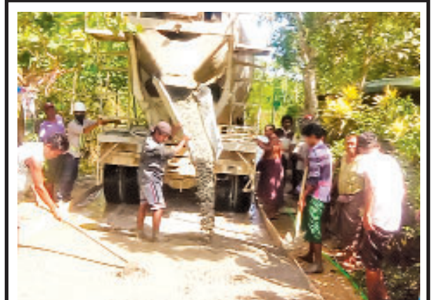
ရန်ကုန်တိုင်းဒေသကြီး သန်လျင်မြို့နယ် ဘုရားကျွန်းကျေးရွာအုပ်စု ကွမ်းမြံ ကျွန်းအနောက်ပိုင်းရပ်ကွက် ပိတောက်လမ်းအား မေ ၂၆ ရက်က ကျေးလက် ဒေသဖွံ့ဖြိုးရေးရန်ပုံငွေနှင့် ဒေသခံပြည်သူများထည့်ဝင်ငွေဖြင့် အရည်ပေ ၁၂၀၊ အကျယ် ၁၀ ပေ၊ ဒု ခြောက်လက်မ ကွန်ကရစ်ခင်းလုပ်ငန်း ဆောင်ရွက်စဉ်။