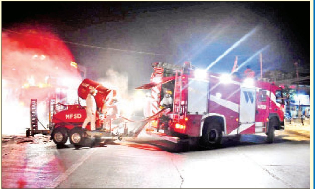
ရန်ကုန်တိုင်းဒေသကြီး စမ်းချောင်းမြို့နယ်၌ ကိုဗစ်-၁၉ ရောဂါ ကာကွယ်ရေး ပိုးသတ်ဆေးဖျန်းစဉ်။