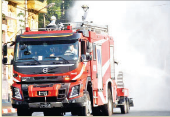
ရန်ကုန်တိုင်းဒေသကြီး ဗဟန်းမြို့နယ်၌ ကိုဗစ်-၁၉ ရောဂါ ကာကွယ်ရေး ပိုးသတ်ဆေးဖျန်းစဉ်။

သက်ဆိုင်ရာတိုင်းစစ်ဌာနချုပ်အသီးသီးမှ တပ်မတော်သားများ၊ မီးသတ်တပ်ဖွဲ့ဝင်များ၊ ဌာန၊ အဖွဲ့အစည်းများပူးပေါင်း၍ ကိုဗစ်-၁၉ ရောဂါ ကာကွယ်ထိန်းချုပ်နိုင်ရေးအတွက် မေ ၂၂ ရက်တွင် ပိုးသတ်ဆေးဖျန်းခြင်းလုပ်ငန်းများကို နေပြည်တော်၊ တိုင်းဒေသကြီး/ပြည်နယ်များမှ မြို့နယ် ၄၄ မြို့နယ်ရှိ နေရာ ၉၄ နေရာတို့တွင် မီးသတ်ယာဉ်များ၊ မီးသတ်ပစ္စည်းကိရိယာများဖြင့် ဆောင်ရွက်ခဲ့ရာ ပိုးသတ်ဆေးရည် ၇၉ ဂါလန်၊ ပိုးသတ်ဆေးမှုန့် ၂၉ ကီလိုဂရမ်၊ ရေ ဂါလန် ၆၄၈၀ သုံးစွဲခဲ့ပြီး ပိုးသတ်ဆေးဖျန်းခြင်းလုပ်ငန်းများကို တာဝန်ရှိသူများက လိုက်လံကြည့်ရှုအားပေးခဲ့ကြောင်း သိရှိရသည်။ သတင်းစဉ်