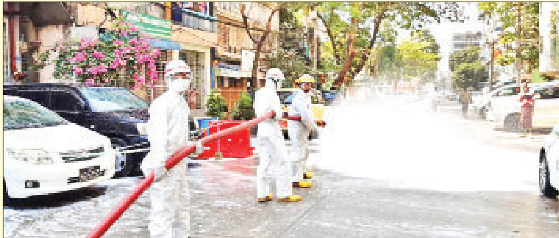
ရန်ကုန်တိုင်းဒေသကြီး မင်္ဂလာတောင်ညွန့်မြို့နယ်၌ ကိုဗစ်-၁၉ ရောဂါ ကာကွယ်ရေး ပိုးသတ်ဆေးဖျန်းစဉ်။