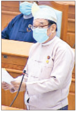
ပြည်ထောင်စုဝန်ကြီး ဒေါက်တာမြင့်ထွေး

နိုင်ငံတော်၏ ရငွေအဖြစ် စာရင်းတင်မည်ဖြစ်သောကြောင့် ဘတ်ဂျက်လိုငွေအပေါ် သက်ရောက်မှုမရှိပါကြောင်း။