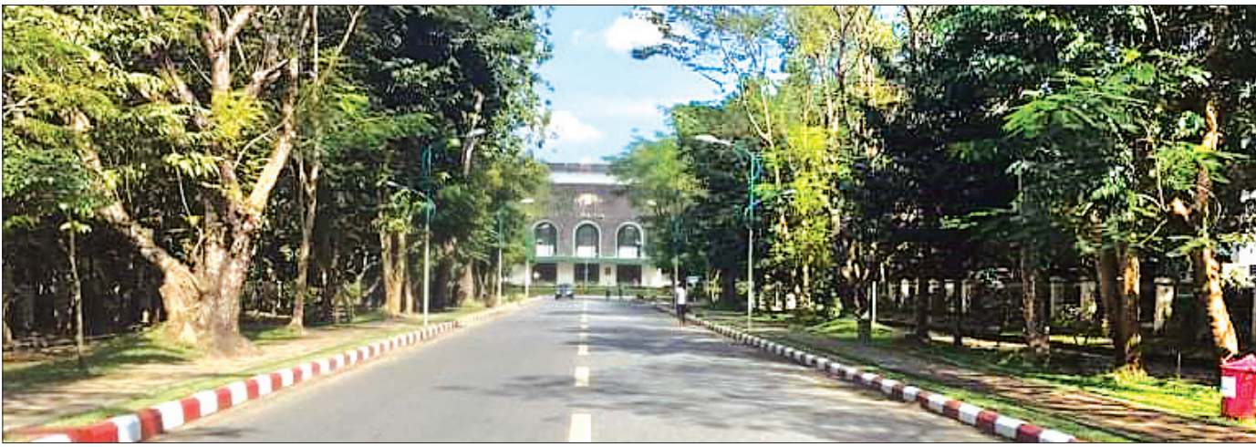
ရန်ကုန်တက္ကသိုလ်အဝင် အဓိပတိလမ်းနှင့် ဘွဲ့နှင်းသဘင်ခန်းမ။