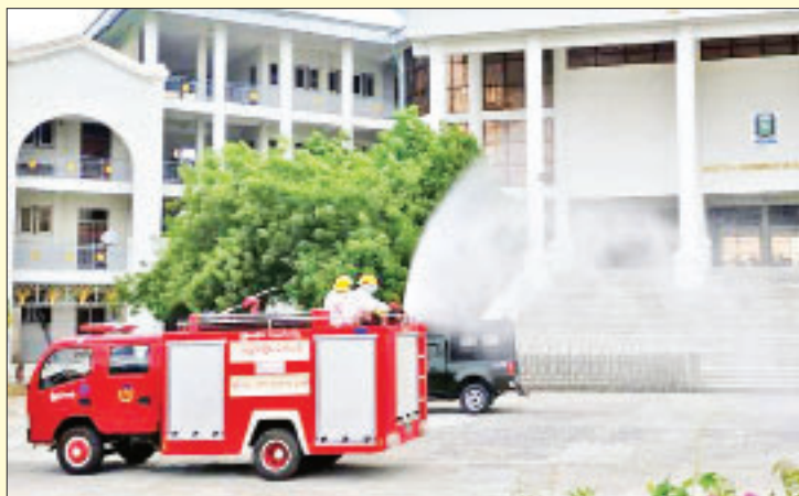
မန္တလေးတိုင်းဒေသကြီး မိတ္ထီလာမြို့နယ်ရှိ စီးပွားရေးတက္ကသိုလ်၌ ကိုဗစ်-၁၉ ရောဂါ ကာကွယ်ရေး ပိုးသတ်ဆေးဖျန်းစဉ်။