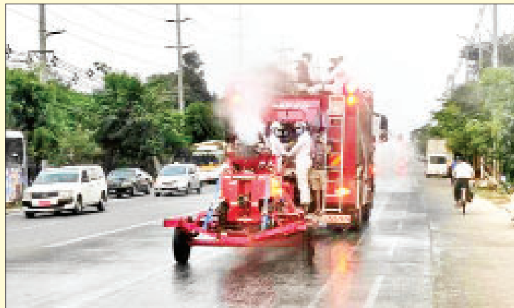
ရန်ကုန်တိုင်းဒေသကြီး ရန်ကင်းမြို့နယ်၌ ကိုဗစ်-၁၉ ရောဂါ ကာကွယ်ရေး ပိုးသတ်ဆေးဖျန်းစဉ်။