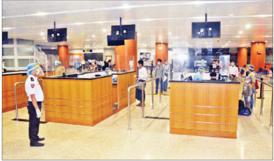
အိန္ဒိယနိုင်ငံမှ ပြန်လည်ရောက်ရှိလာသည့် မြန်မာနိုင်ငံသားများအား ရန်ကုန်အပြည်ပြည်ဆိုင်ရာလေဆိပ်၌ တွေ့ရစဉ်။

နေပြည်တော် မေ ၂၇ နိုင်ငံတကာခရီးသည်တင် လေယာဉ်များ ပျံသန်းမှုယာယီရပ်ဆိုင်းထားခြင်းကြောင့် အိန္ဒိယနိုင်ငံ ဂါယာမြို့နှင့် ယင်းမြို့၏အနီးအနားဒေသများတွင် ရောက်ရှိနေပြီး အခက်အခဲကြုံတွေ့နေရသည့် မြန်မာနိုင်ငံသား ၈၀ အား မြန်မာအမျိုးသားလေကြောင်းလိုင်း (Myanmar National Airlines-MNA) ကယ်ဆယ်ရေးလေယာဉ်ဖြင့် တတိယအသုတ်အဖြစ် ပြန်လည်ခေါ်ဆောင်ခဲ့ရာ ယနေ့ညပိုင်းတွင် ရန်ကုန်အပြည်ပြည်ဆိုင်ရာ လေဆိပ်သို့ အဆင်ပြေချောမွေ့စွာ ပြန်လည်ရောက်ရှိကြသည်။ ၎င်းတို့ ရန်ကုန်အပြည်ပြည်ဆိုင်ရာ လေဆိပ်သို့ ရောက်ရှိချိန်တွင် စာမျက်နှာ ၁၇ ကော်လံ ၅ သို့ ❁