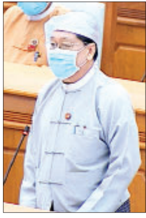
ပြည်ထောင်စုဝန်ကြီး ဦးသိန်းဆွေ