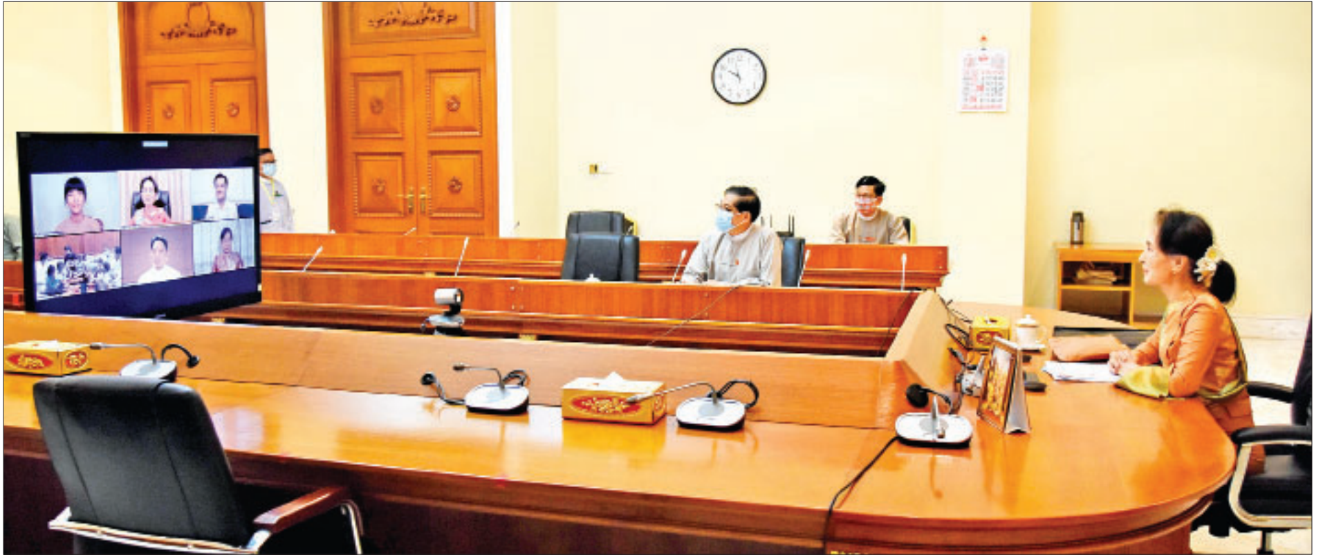
Coronavirus Disease 2019 (COVID-19) ကာကွယ်၊ ထိန်းချုပ်၊ ကုသရေး အမျိုးသားအဆင့် ဗဟိုကော်မတီဥက္ကဋ္ဌ၊ နိုင်ငံတော်၏အတိုင်ပင်ခံပုဂ္ဂိုလ် ဒေါ်အောင်ဆန်းစုကြည် အိမ်တွင်းဖြစ် ချည်ထည် Mask ပြိုင်ပွဲတွင် ပထမဆုံး ရရှိခဲ့ကြသူများနှင့် အပြန်အလှန်ဆွေးနွေးကြစဉ်။

● ရှေးဖိုးမှ ထို့နောက် ပြည်သူ့အနှစ်သက်ဆုံး ပထမဆုံးရ ဒေါက်တာကျော်ကျော်ဝင်း (Eric Yang) (USA) က ကိုဗစ်-၁၉ ရောဂါနှင့် အတူယှဉ်တွဲပြီး လူမှုရေး၊ စီးပွားရေး၊ ပညာရေးကဏ္ဍများကို New Normal ပုံစံဖြင့် ပြုပြင် ပြောင်းလဲနေထိုင်ရန် အကြံပြုချက်များ၊ Social Distancing ကို မလျော့သောခွဲဖြင့် လိုက်နာဆောင်ရွက်သွားသည့် အကြံပြုချက်များကိုလည်းကောင်း၊ ရည်ရွယ်ချက် စိတ်ဝင် စားဖွယ်အကောင်းဆုံး ပထမဆုံးရ ကမာရွတ်မြို့နယ်မှ ASEAN DMA Center, Poland Head Office, Managing Director ဒေါ်ဖြူဖြူငြိမ်းချမ်းက ရင်ခွင်မှကလေးစောင့်ရှောက် ရေးလုပ်ငန်းစတင်ခဲ့မှုအခြေအနေ၊ Single Mother တစ်ဦး၏ခံစားချက်နှင့် ရည်ရွယ်ချက်၊ မေတ္တာကိုရည်ရွယ်ပြီး ကိုယ်ဝန်ဆောင်မိခင်များအား ကူညီဆောင်ရွက်ပေးနေမှု၊ ရင်ခွင်မှကလေးများ စောင့်ရှောက်ရာတွင် တွေ့ကြုံရသည့် အခက်အခဲများ၊ ကိုဗစ်-၁၉ နှင့်စပ်လျဉ်း၍ ကလေးများအား အသိပညာပေးခဲ့မှုအခြေအနေများကို လည်းကောင်း။