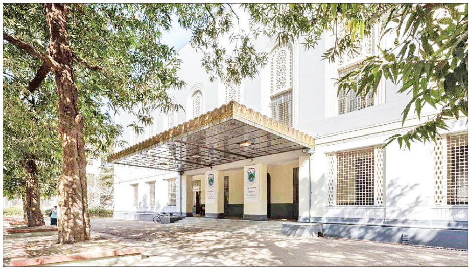
သိပ္ပံခန်းမဆောင်။

သွားရတဲ့ သူတွေရှိသလို လမ်းမှန်လျှောက်လှမ်းခဲ့ကြသလို တိုးတက်ထွန်းကားသွားတဲ့ သူတွေလည်း တစ်ပုံကြီး ရှိပါတယ်။ ကျွန်တော့်အနေနဲ့ မျိုးဆက်သစ်ကျောင်းသား