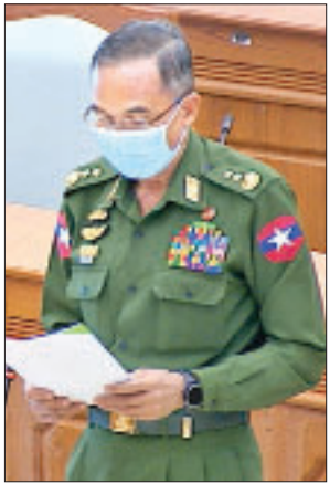
ပြည်ထောင်စုဝန်ကြီး ဒုတိယဗိုလ်ချုပ်ကြီး စိန်ဝင်း