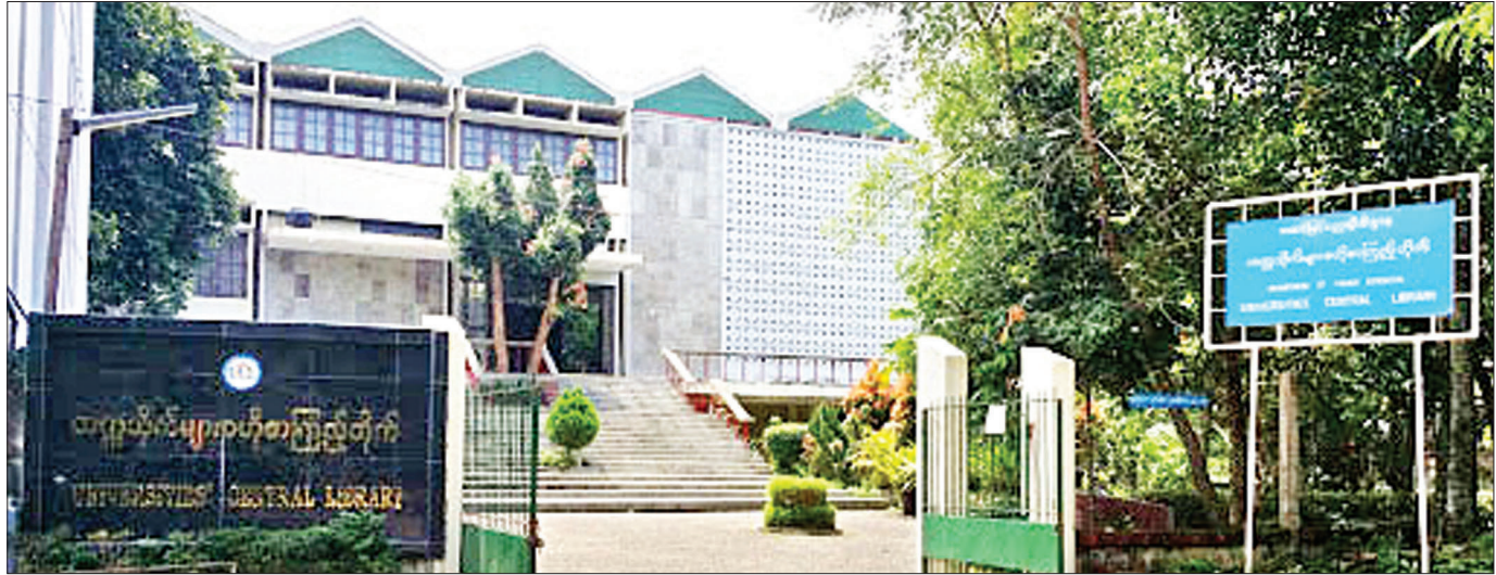
တက္ကသိုလ်များ ဗဟိုစာကြည့်တိုက်။

တွေကို “ပညာဟူသည် မြတ်ရွှေအိုး၊ ဥစ္စာဟူသည် မျက်လှည့်မျိုး” ဆိုတဲ့အတိုင်း ပညာကိုသာ အာရုံပြု သင်ကြားကြပါလို့ အလေးအနက်မှာကြားချင်ပါတယ်။ မိဘတွေက သားသမီးတွေဘွဲ့ရအောင် ရုန်းကန်ရှာဖွေ ပေးပြီး တက္ကသိုလ်ကို ပို့ပေးကြတာ ဖြစ်ပါတယ်။ ယခုခေတ် ပညာသင်စရိတ်ဟာ ကျွန်တော်တို့ခေတ် ပညာသင်စရိတ်ထက် ပိုမိုကြီးမားပါတယ်။ ဒါကြောင့် မျိုးဆက်သစ်ကျောင်းသားတွေအနေနဲ့