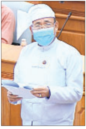
ပြည်ထောင်စုဝန်ကြီး ဦးကျော်တင်

နိုင်ငံတော်ပိုင် စီးပွားရေးလုပ်ငန်းများနှင့်စပ်လျဉ်း၍ နိုင်ငံတော်ပိုင်စီးပွား ရေးအဖွဲ့အစည်းများအားလုံးသည် နှစ်စဉ်ပြည်ထောင်စု၏ ဘဏ္ဍာငွေအရအသုံး ဆိုင်ရာဥပဒေနှင့်အညီ ရငွေအားလုံးကို ပြည်ထောင်စုဘဏ္ဍာရန်ပုံငွေသို့ ပေးသွင်း ရပါကြောင်း၊ အခွန်အခအပါအဝင် အသုံးစရိတ်အားလုံးကို ပြည်ထောင်စု ဘဏ္ဍာရန်ပုံငွေမှ ကျခံသုံးစွဲရပါကြောင်း၊ ဘဏ္ဍာရေးနှစ် ကုန်ဆုံးပြီး နှစ်ချုပ် စာရင်းရေးဆွဲ၍ ပြည်ထောင်စုစာရင်းစစ်ချုပ်ရုံးမှ စစ်ဆေးပြီးချိန်တွင် အမြတ် ပိုမိုရရှိလာပါက ထပ်မံပေးဆောင်ရမည့် ဝင်ငွေခွန်နှင့် နိုင်ငံတော်သို့ ထည့်ဝင်ငွေ များကို မိရဘာဏ္ဍာရေးနှစ် အရအသုံးခန့်မှန်းခြေငွေစာရင်းတွင် အသုံးစရိတ် အဖြစ် လျာထားပြီး ထပ်မံတောင်းခံပေးသွင်းရပါကြောင်း၊ အဆိုပါ ဝင်ငွေခွန်နှင့် နိုင်ငံတော်သို့ ထည့်ဝင်ငွေများသည် နိုင်ငံတော်ပိုင်စီးပွားရေးအဖွဲ့အစည်းများ အနေဖြင့် ကြည့်မည်ဆိုပါက အသုံးစရိတ်ဖြစ်ပြီး သက်ဆိုင်ရာဌာနတွင်