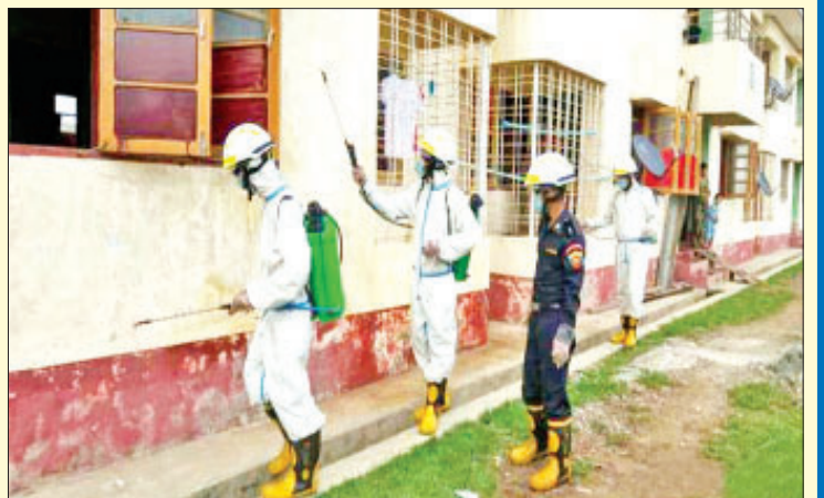
ရခိုင်ပြည်နယ် မောင်တောမြို့ခရိုင်/မြို့နယ် ဌာနဆိုင်ရာ ဝန်ထမ်းများ နေထိုင်သည့် အိုးအိမ်ဦးစီးဌာနပိုင် အဆောက်အအုံများ၌ ကိုဗစ်-၁၉ ရောဂါ ကာကွယ်ရေး ပိုးသတ်ဆေးဖျန်းစဉ်။