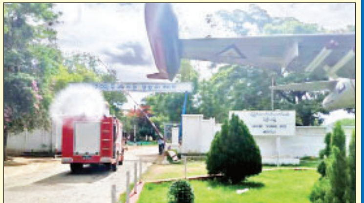
မန္တလေးတိုင်းဒေသကြီး မိတ္ထီလာမြို့နယ်ရှိ မြေပြင်အတတ်သင် လေတပ်စခန်း၌ ကိုဗစ်-၁၉ ရောဂါ ကာကွယ်ရေး ပိုးသတ်ဆေးဖျန်းစဉ်။