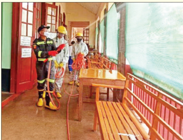
ရန်ကုန်တိုင်းဒေသကြီး ကွမ်းခြံကုန်းမြို့နယ် မြို့သစ်ရပ်ကွက်ရှိ ဘုန်းတော်ကြီးကျောင်း၌ ကိုဗစ်-၁၉ ရောဂါ ကာကွယ်ရေး ပိုးသတ်ဆေးဖျန်းစဉ်။