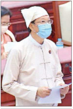
ပြည်ထောင်စုဝန်ကြီး ဒေါက်တာမျိုးသိမ်းကြီး