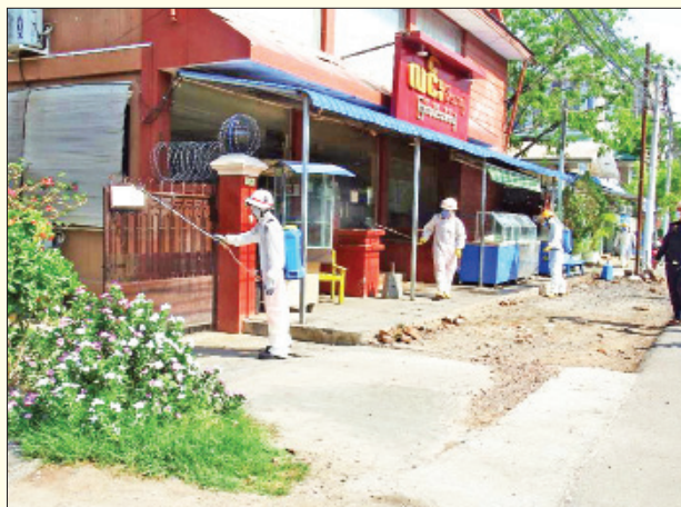
မန္တလေးတိုင်းဒေသကြီး အမရပူရမြို့နယ်၌ ကိုဗစ်-၁၉ ရောဂါ ကာကွယ်ရေး ပိုးသတ်ဆေးဖျန်းစဉ်။