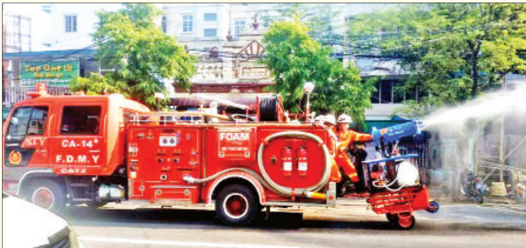
မန္တလေးတိုင်းဒေသကြီး ပုသိမ်ကြီးမြို့နယ်၌ ကိုဗစ်-၁၉ ရောဂါ ကာကွယ်ရေး ပိုးသတ်ဆေးဖျန်းစဉ်။