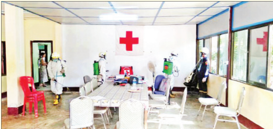
ရခိုင်ပြည်နယ် မောင်တောမြို့ ကြက်ခြေနီရုံး၌ ကိုဗစ်-၁၉ ရောဂါ ကာကွယ်ရေး ပိုးသတ်ဆေးဖျန်းစဉ်။