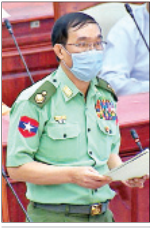
ဒုတိယဝန်ကြီး ဗိုလ်ချုပ်သန်းထွဋ်