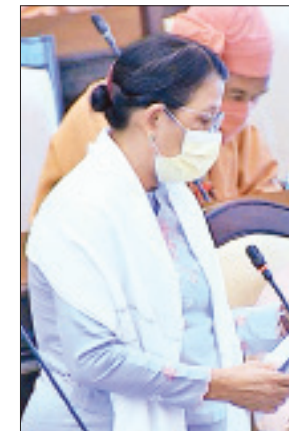
ဒုတိယဝန်ကြီး ဒေါက်တာမြလေးစိန်

အား ဌာနမှ ဝင်ရောက်စွက်ဖက်ကြီးကြပ်ခြင်းမရှိဘဲ မြန်မာ နိုင်ငံ ဂေါက်သီးရိုက်အသင်းမှသာ စီမံခန့်ခွဲလျက်ရှိနေပါ သဖြင့် နိုင်ငံတော်အစိုးရ၏ တာဝန်ပေးချက်ဖြစ်သော အားကစားကွင်းများ ရေရှည်တည်တံ့ခိုင်မြဲရေးနှင့် အားကစားကွင်းများ မပျောက်ပျက်စေရန်အတွက် ကျန်းမာရေးနှင့် အားကစားဝန်ကြီးဌာနအနေဖြင့် မိမိ၏ လေးထားသော တာဝန်ကို ဆက်လက်တာဝန်ယူပြီး ထိန်းသိမ်းစောင့်ရှောက်ပေးသွားမည် ဖြစ်ကြောင်း ဖြေကြားသည်။