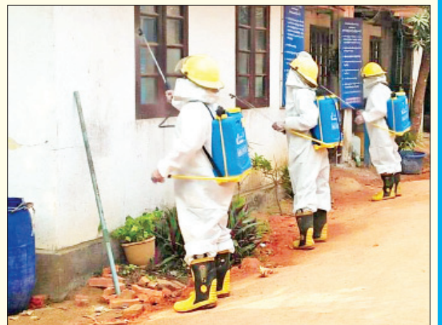
တနင်္သာရီတိုင်းဒေသကြီး လောင်းလုံမြို့နယ် စာရင်းစစ်ရုံး၌ ကိုဗစ်-၁၉ ရောဂါ ကာကွယ်ရေး ပိုးသတ်ဆေးဖျန်းစဉ်။