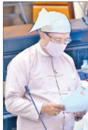
ဒုတိယဝန်ကြီး ဒေါက်တာကျော်လင်း