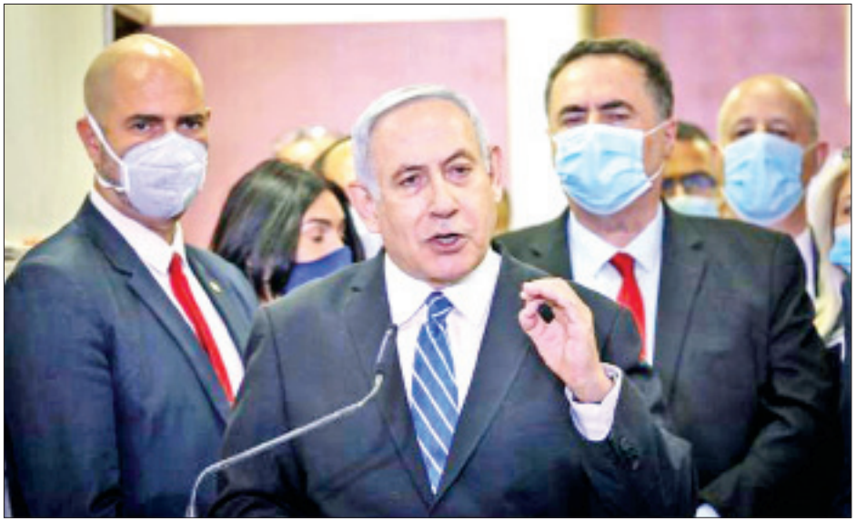
အစွဲရောဂါကြီးချုပ် ဘင်ဂျမင် နေတန်ယာဟု

ရင်ဆိုင်နေရသည်။ ၎င်းအနေဖြင့် အပြစ်ကင်းစင်ပါကြောင်းနှင့် စွပ်စွဲပြောဆိုသည့် ရဲအရာရှိများနှင့် အစိုးရရေးရာများသည် ၎င်းအား ရာထူးမှဖြုတ်ချရန် လက်ဝါဒ်ခံရသောအခါများနှင့် ပူးပေါင်းကြံစည်ကြခြင်းပင်ဖြစ်ပါကြောင်း တရားရင်ဆိုင်မှု မတက်ရောက်မီ ယမန်နေ့က ပြုလုပ်သော သတင်းစာရှင်းလင်းပွဲတစ်ရပ်တွင် ဝန်ကြီးချုပ် နေတန်ယာဟု ပြောကြားခဲ့သည်။ အစွဲရောဂါဒုပဒေအရ ဝန်ကြီးချုပ်များအနေဖြင့် ၎င်းတို့ရင်ဆိုင်နေရသော စွပ်စွဲမှုများနှင့်ပတ်သက်ပြီး တရားရုံးမှ စီရင်ချက်ချမှတ်ပြီးသည့်တိုင် နိုင်ငံတော်ရာထူးတာဝန်များကို ထမ်းဆောင်ခွင့်ရှိကြောင်း သိရသည်။ ဝန်ကြီးချုပ် နေတန်ယာဟု၏ ရှေ့နေများက အဆိုပါ စွပ်စွဲချက်များနှင့်ပတ်သက်ပြီး ပြန်လည်ချေပနိုင်ရန် ခိုင်မာသော သက်သေအထောက်အထားများ ရှာဖွေရေးအတွက် အချိန်တောင်းခံခဲ့ပြီးနောက် တရားရုံးက စွပ်စွဲချက်နှင့်ပတ်သက်ပြီး စစ်ဆေးချက်များကို ရွှေ့ဆိုင်းထားလိုက်ပြီဖြစ်ကြောင်း သိရသည်။ ကိုးကား - အင်န်အိတ်ချ်ကော့ဘာသာပြန် - အောင်ကျော်ကျော်