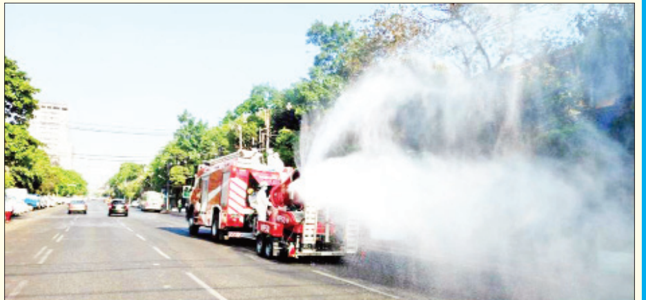
ရန်ကုန်တိုင်းဒေသကြီး ကျောက်တံတားမြို့နယ်၌ ကိုဗစ်-၁၉ ရောဂါ ကာကွယ်ရေး ပိုးသတ်ဆေးဖျန်းစဉ်။