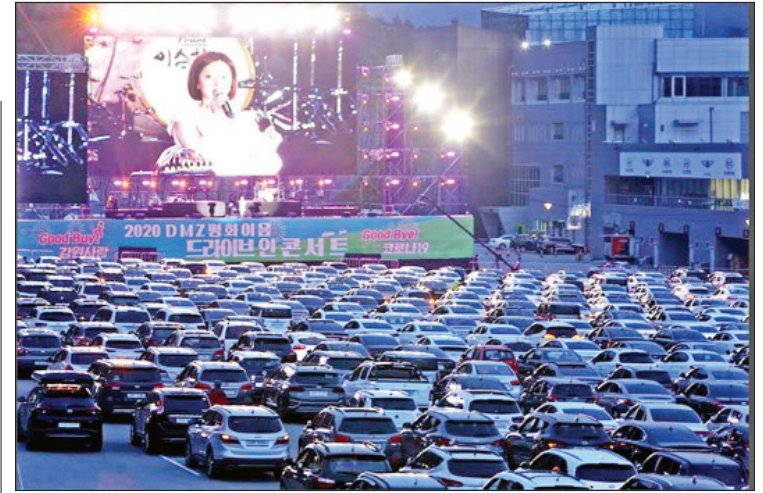
တောင်ကိုရီးယားနိုင်ငံ ဂန်းဝန်ပြည်နယ် အင်ဂျယ်မြို့တွင် မေ ၂၃ ရက်က ကားအတွင်းမှ ကြည့်ရှုနိုင်သည့် တေးဂီတဖျော်ဖြေပွဲတစ်ပွဲ ကျင်းပနေသည်ကို တွေ့ရစဉ်။

ယခင်က အဆိုပီစံချိန်ကို တေးသံရှင် Psy က ရယူထားခဲ့ပြီး Psy ရဲ့ ကျော်ကြားတဲ့ တေးသီချင်းတစ်ပုဒ်ဖြစ်တဲ့ Gangnam Style ဟာ နိုင်ငံပေါင်း ၈၆ နိုင်ငံမှာရှိတဲ့ iTunes တေးဂီတဇယားတွေကို ဦးဆောင် ထားနိုင်ခဲ့ကာ ဒီစံချိန်ကို ရှစ်နှစ်ကြာထိန်းသိမ်းထားနိုင်ခဲ့တာ ဖြစ်ပါတယ်။ လတ်တလောမှာ ဗွီက စံချိန်သစ်တင်ခဲ့ပြီး ဒေသတွင်းမှာသာမက အာရှတေးသံရှင်တွေအနက် iTunes တေးဂီတဇယားအများဆုံးကို ဦးဆောင်နိုင်တဲ့ တစ်ကိုယ်တော်တေးသံရှင်တစ်ဦး ဖြစ်လာခဲ့ကြောင်း သိရပါတယ်။