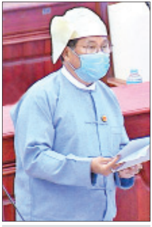
ဒုတိယဝန်ကြီး ဦးစိုးအောင်