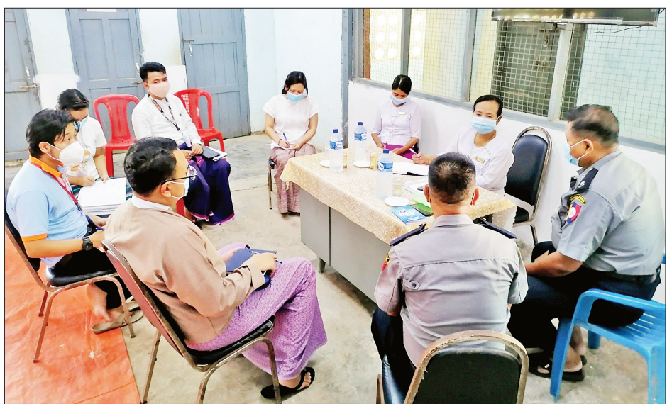
ခုနစ်နေရာတွင်ရှိသော ကလေးများ၏ မိသားစုများအတွက် အခြေခံစားသောက်ကုန်များဖြစ်သော ဆန်၊ ဆီ၊ ဆား၊ ကြက်ဥနှင့် တစ်ကိုယ်ရေသုံးကာကွယ်ရေးပစ္စည်းများ ဖြစ်သည့် နှာခေါင်းစည်း၊ လက်သန့်ဆေးရည်စသည်တို့ ထောက်ပံ့ပေးရန်၊ လမ်းပေါ်နေကလေးများနှင့် မိသားစုများ အတွက် ငွေကြေးထောက်ပံ့ရန်၊ ကိုဗစ်ကာလဖြစ်သည့် အတွက် မိဘထံပြန်လည်အပ်နှံပေးခြင်းထက် ယာယီ ဆက်လက် ထိန်းသိမ်းထားရန်တို့နှင့်စပ်လျဉ်း၍ ဆွေးနွေးခဲ့ ကြသည်။ လူမှုဝန်ထမ်း၊ ကယ်ဆယ်ရေးနှင့်ပြန်လည်နေရာချ ထားရေးဝန်ကြီးဌာနအနေဖြင့် ရပ်ရွာအခြေပြုတုံ့ပြန် ဆောင်ရွက်ခြင်းကိုလည်း မိတ်ဖက်အဖွဲ့အစည်းများနှင့် ပူးပေါင်း၍ ဆက်လက်ဆောင်ရွက်သွားမည်ဖြစ်ကြောင်း သိရသည်။ သတင်းစဉ်

ထားသည့် ကလေးသူငယ်များတွင် မွေးရာပါဥာဏ်ရည် ဖွံ့ဖြိုးမှုအားနည်းခြင်း၊ စိတ်ကျန်းမာရေးပြဿနာများ၊ အာဟာရချို့တဲ့မှုများရှိကြောင်း၊ အထွေထွေကျန်းမာရေး ချို့ယွင်းမှုများအား လတ်တလောအခြေအနေတွင် မတွေ့ရှိရကြောင်း၊ ရှင်သန်ကြီးပြင်းရာ ပတ်ဝန်းကျင်အခြေအနေ ပေါ်မူတည်၍ ဗီဇ၊ စရိုက်နှင့် အပြုအမူပိုင်းဆိုင်ရာတွင် အားနည်းချက်ရှိသူ အများစုဖြစ်ပါကြောင်း၊ ကလေးများတွင် ကော်ရူခြင်းအလေ့အထရှိသည်ကို တွေ့ရပါကြောင်း၊ ကလေးများ၏စိတ်ပိုင်းဆိုင်ရာပြုပြင်ရေးအတွက် TDHL၊ World Vision နှင့် UNICEF (မြန်မာ)တို့က ပံ့ပိုးဆောင်ရွက်ပေးလျက်ရှိကြောင်း၊ ကလေးများတွင် ရာဇဝတ်မှုကျူးလွန်ခြင်းရှိခဲ့သူများ၊ သင်ကြားသင်ယူမှုနှင့် လူမှုဆက်ဆံရေး ခက်ခဲမှုရှိသူများ မတွေ့ရှိရပါကြောင်း၊ လိုအပ်ချက်များ အနေဖြင့် မီးဖိုချောင်သုံးပစ္စည်းများ၊ နှာခေါင်းစည်းနှင့် လက်သန့်ဆေးရည်၊ ဆေးဝါးပစ္စည်းများလိုအပ်ကြောင်း လေ့လာတွေ့ရှိရသည်။ ဆက်လက်၍ ပူးပေါင်းအဖွဲ့သည် AD မီးပွိုင့်၊ ပါရမီ မီးပွိုင့်၊ မြောက်ဥက္ကလာပ မီးပွိုင့်၊ အောင်မင်္ဂလာမီးပွိုင့်၊ သီရိမင်္ဂလာစေ့၊ ဘုရင့်နေအိမ်၊ သိမ်ဖြူမီးပွိုင့်၊ ယင်း