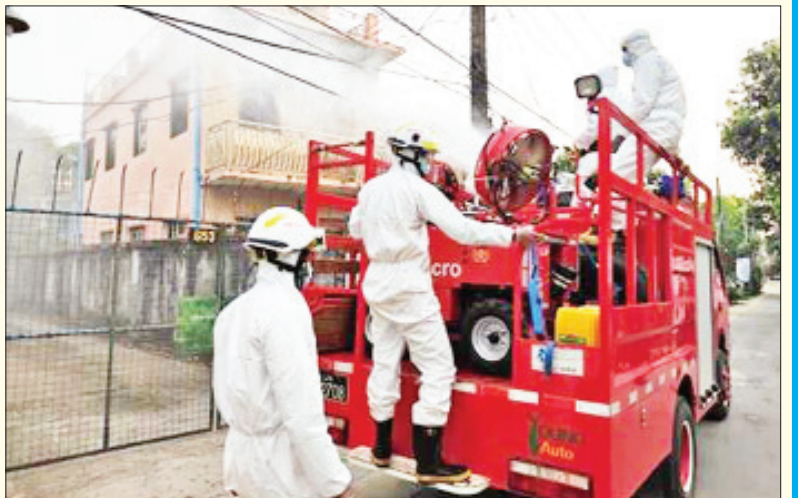
ရန်ကုန်တိုင်းဒေသကြီး အင်းစိန်မြို့နယ်၌ ကိုဗစ်-၁၉ ရောဂါ ကာကွယ်ရေး ပိုးသတ်ဆေးဖျန်းစဉ်။