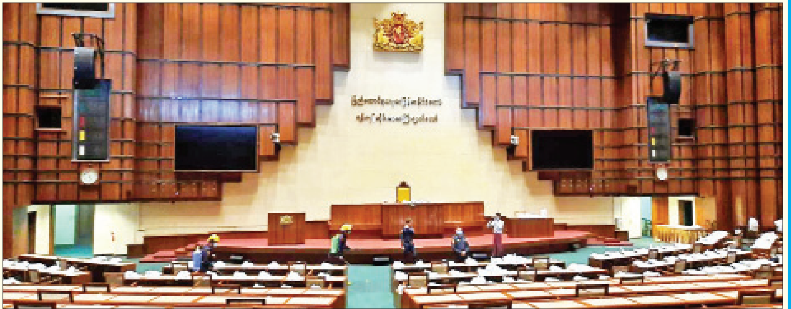
ရန်ကုန်တိုင်းဒေသကြီး လွှတ်တော်၌ ကိုဗစ်-၁၉ ရောဂါ ကာကွယ်ရေး ပိုးသတ်ဆေးဖျန်းစဉ်။

နေပြည်တော် မေ ၂၅ သက်ဆိုင်ရာတိုင်းစစ်ဌာနချုပ်အသီးသီးမှ တပ်မတော်သားများ၊ မီးသတ်တပ်ဖွဲ့ဝင်များ၊ ဌာန၊ အဖွဲ့အစည်းများ ပူးပေါင်း၍ ကိုဗစ်-၁၉ ရောဂါ ကာကွယ် ထိန်းချုပ်နိုင်ရေးအတွက် ပိုးသတ်ဆေးဖျန်းခြင်း လုပ်ငန်းများကို မေ ၂၀ ရက်က နေပြည်တော်၊ တိုင်းဒေသကြီး/ ပြည်နယ်များမှ မြို့နယ် ၄၀ ရှိ နေရာ ၈၈ နေရာတို့တွင် မီးသတ်ယာဉ်များ၊ မီးသတ်ပစ္စည်းကိရိယာများဖြင့် ဆောင်ရွက်ခဲ့ရာ ပိုးသတ်ဆေးရည် ၄၂ ဂါလန်၊ ပိုးသတ်ဆေးမှုန့် ၂၄ ကီလိုဂရမ်၊ ရောဂါလန့် ၃၉၆၀ သုံးစွဲခဲ့ပြီး ပိုးသတ်ဆေးဖျန်းခြင်း လုပ်ငန်းများကို တာဝန်ရှိသူများက လိုက်လံကြည့်ရှုအားပေးခဲ့ကြောင်း သိရသည်။ သတင်းစဉ်