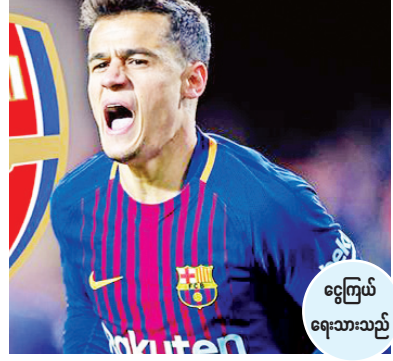
ဌေးကြယ် ရေးသားသည်

အာဆင်နယ်အသင်းဟာ ဘာစီလိုနာအသင်းမှ ဘရာဇီးကြယ်ပွင့် ကော်တင်ဟိုကို ခေါ်ယူဖို့ ကြိုးပမ်းနေပြီး လက်ရှိမှာ ကော်တင်ဟိုရဲ့ အေးဂျင့်ဖြစ်သူနဲ့ အာဆင်နယ်အသင်းတို့ ဆွေးနွေးမှုတွေ ပြုလုပ်နေတယ်လို့ သိရပါတယ်။ ကော်တင်ဟိုအနေနဲ့ ဘာစီလိုနာအသင်းမှာ ဆက်ကစားဖို့ ဆန္ဒရှိနေပေမယ့် ဘာစီလိုနာအသင်းကတော့ အပြောင်းအရွှေ့ရန်ပုံငွေတိုးမြှင့်ရရှိရေးအတွက် ကွင်းလယ်ကစားသမား ကော်တင်ဟိုကို နွေရာသီဈေးကွက်အတွင်း ရောင်းချဖို့ စိစစ်နေတာဖြစ်ပါတယ်။ ကလပ်အသင်းအများစုကလည်း ကော်တင်ဟိုကိုခေါ်ယူဖို့အတွက် ဘာစီလိုနာအသင်းနဲ့ချိတ်ဆက်မှုတွေပြုလုပ်နေပေမယ့် ဘာစီလိုနာအသင်းကတော့ သူတို့တောင်းဆိုထားတဲ့ ပြောင်းရွှေ့ကြေးနဲ့ ကမ်းလှမ်းလာတဲ့ အသင်းမရှိသေးဘူးလို့ ဆိုပါတယ်။ ကွင်းလယ်ကစားသမား ကော်တင်ဟိုဟာ လက်ရှိမှာ ဘိုင်ယန်မြူးနစ်အသင်းမှာ အငှားစာချုပ်နဲ့သွားရောက်ကစားနေတာဖြစ်ပြီး ဘိုင်ယန်မြူးနစ်အသင်းက အမြဲတမ်းစာချုပ်နဲ့ ခေါ်ယူဖို့မရှိတာ