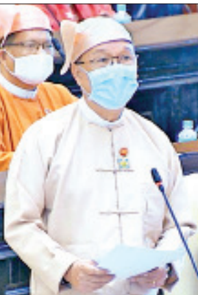
ပြည်ထောင်စုဝန်ကြီး ဦးသန့်စင်မောင်

ကျောပိုးမှ ဖောက်လုပ်ရန်အတွက် လိုအပ်သောမြေနေရာအား သက်ဆိုင်ရာများမှ အသုံးမလိုသည့် သိမ်းဆည်းမြေများအား ပြန်လည်စွန့်လွှတ်ပေးခြင်းဆိုင်ရာ လုပ်ငန်းဆောင်ရွက် နေမှုအခြေအနေနှင့် ပတ်သက်၍ သိရှိလိုသည့်မေးခွန်းကို ပို့ဆောင်ရေးနှင့် ဆက်သွယ်ရေးဝန်ကြီးဌာန ပြည်ထောင်စု ဝန်ကြီး ဦးသန့်စင်မောင်က ကျိုင်းတုံ-ဝမ်ကောင်းလမ်းပိုင်း တွင် မြန်မာ့မီးရထားမှ သိမ်းယူခဲ့သည့် လမ်းအကြောင်း သိမ်းဆည်းမြေ ၉၉ ဒသမ ၅၅၉ ဧကကို ဆောက်လုပ်ရေး ဝန်ကြီးဌာနအတွက် ၉၄ ဒသမ ၁၇၃ ဧက လွှဲပြောင်းပေး သွားမည်ဖြစ်ကြောင်း၊ ကျိုင်းတုံဘူတာ ယာဒ်ဝင်းမြေ ၄၂ ဒသမ ၄၂ ဧကကို နိုင်ငံတော်သို့ ပြန်လည်အပ်နှံသွားမည် ဖြစ်ကြောင်း၊ ၅ ဒသမ ၄၀၆ ဧကကို မူလတောင်သူများသို့ ပြန်လည်စွန့်လွှတ်မည် ဖြစ်ကြောင်း၊ အဆိုပါလုပ်ငန်း များကို ဆောက်လုပ်ရေးဝန်ကြီးဌာန၊ ရှမ်းပြည်နယ်အစိုးရ အဖွဲ့နှင့် ပေါင်းစပ်ညှိနှိုင်းဆောင်ရွက်လျက်ရှိကြောင်း ဖြေကြားသည်။