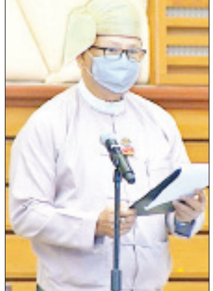
ဧရာဝတီတိုင်းဒေသကြီး မဲဆန္ဒနယ် အမှတ်(၅)မှ ဦးမောင်မောင်အုန်း

ပြန်လည်ရှင်းလင်း အလားတူ ရခိုင်ပြည်နယ် မဲဆန္ဒနယ်အမှတ်(၁၁)မှ ဒေါ်ထုမေ၏ သံတွဲ(၁၀၀၀-မဇင်)လေဆိပ်ကို နိုင်ငံတကာ ခရီးစဉ် ပျံသန်းစေမည့် လေယာဉ်များ ဝင်ရောက်/ထွက်ခွာ နိုင်သော အကောက်ခွန်လေဆိပ် (Custom Aerodrome) အဖြစ် ၂၀၂၀ - ၂၀၂၁ ဘဏ္ဍာနှစ်တွင် သတ်မှတ်ပေးရန် အစီအစဉ် ရှိ မရှိ မေးခွန်းနှင့် စပ်လျဉ်း၍ ပို့ဆောင်ရေးနှင့် ဆက်သွယ်ရေးဝန်ကြီးဌာန ပြည်ထောင်စုဝန်ကြီး ဦးသန့်စင်မောင်က လည်းကောင်း၊ ချင်းပြည်နယ် မဲဆန္ဒ နယ်အမှတ်(၁၀)မှ ဦးလားလ်မင်းထန်၏ ချင်းပြည်နယ် မတူပီခရိုင် မတူပီမြို့ ခုတင်(၅၀)ဆုံ ပြည်သူ့ဆေးရုံအား ခရိုင်အင်္ဂါရပ်နှင့် ညီညွတ်သည့် ခုတင် (၁၀၀)ဆုံ ခရိုင်ဆေးရုံ အဖြစ် ၂၀၂၀ - ၂၀၂၁ ဘဏ္ဍာနှစ်တွင် အဆင့်တိုးမြှင့်ပေးရန် အစီအစဉ် ရှိ မရှိ မေးခွန်းနှင့် စပ်လျဉ်း၍ ကျန်းမာရေးနှင့် အားကစားဝန်ကြီးဌာန ဒုတိယဝန်ကြီး ဒေါက်တာမြလေးစိန် ကလည်းကောင်း၊ ပဲခူးတိုင်းဒေသကြီး မဲဆန္ဒနယ်အမှတ်(၁၂) မှ ဦးအောင်သိန်း၏ နိုင်ငံတော်အစိုးရ၏ ပုဂ္ဂလိကပိုင် ပြုလုပ်ရေး ကော်မရှင်မှ ရန်ကုန်တိုင်းဒေသကြီး စမ်းချောင်း မြို့နယ်ရှိ မြေတိုင်းရပ်ကွက်အမှတ် (၂၅/စီ - ၁)၊ မြေကွက် အမှတ် (၇ - အေ)နှင့်ပတ်သက်၍ မြို့ပြနှင့် အိမ်ရာဖွံ့ဖြိုးရေး ဦးစီးဌာနမှ စီမံခန့်ခွဲသော အစိုးရမြေကို လေလံတင် ရောင်းချခဲ့ခြင်းနှင့် စပ်လျဉ်း၍ သိရှိလိုသည့် မေးခွန်းကို ဆောက်လုပ်ရေးဝန်ကြီးဌာန ဒုတိယဝန်ကြီး ဒေါက်တာ ကျော်လင်းက လည်းကောင်း ပြန်လည်ရှင်းလင်းဖြေကြား ခဲ့ကြသည်။