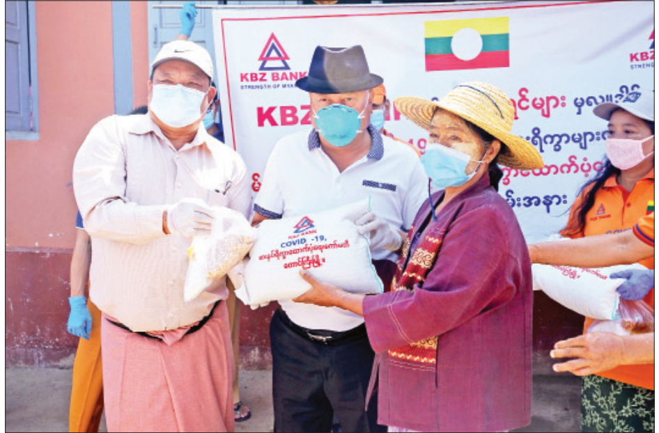
များအားထားရှိသည့် စောင့်ကြည့်ရေးစင်တာများအတွက် ကိုလည်း နေရာအရောက် ပေးပို့လှူဒါန်းလျက်ရှိကြောင်း လိုအပ်သည့် ကျန်းမာရေးအထောက်အကူပြုပစ္စည်းများ သိရသည်။ ပြည်နယ်(ပြန်/ဆက်)

ရှမ်းပြည်နယ် ပြည်သူ့လူထု စားနပ်ရိက္ခာထောက်ပံ့ရေး ကော်မတီသည် ကမ္ဘောဇဘဏ်လီမိတက်၏မတည်လျှော့ဒါန်း ငွေကျပ်သိန်း ၅၀၀၀ ကျော်နှင့် အများပြည်သူ လှူဒါန်းငွေ များဖြင့် ရှမ်းပြည်နယ်အတွင်း တိုင်းရင်းသားများ နေထိုင်ရာဒေသများသို့လည်းကောင်း၊ တိုက်ပွဲရှောင် စခန်းများသို့လည်းကောင်း၊ ဘုန်းတော်ကြီးကျောင်းများနှင့် ပရဟိတကျောင်းများသို့လည်းကောင်း စားနပ်ရိက္ခာထုတ် များ ဆက်လက်လှူဒါန်းသွားရန် စီမံဆောင်ရွက်လျက်ရှိကြောင်း၊ တိုင်းဒေသကြီးနှင့်ပြည်နယ်အသီးသီးရှိ တိုက်နယ်ဆေးရုံ များ၊ ကျေးလက်ကျန်းမာရေးဌာနများနှင့် မြန်မာနိုင်ငံ အတွင်း ပြန်လည်ဝင်ရောက်လာသည့် နေရပ်ပြန်ပြည်သူ