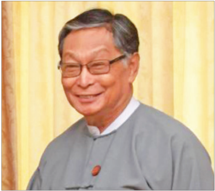
ပြည်ထောင်စုဝန်ကြီး ဦးကျော်တင်ဆွေ

တစ်နိုင်ငံလုံး ပစ်ခတ်တိုက်ခိုက်မှုရပ်စဲရေး သဘောတူစာချုပ်(NCA)မှာ လက်မှတ်ရေးထိုးပြီးတဲ့ တိုင်းရင်းသားလက်နက်ကိုင်အဖွဲ့တွေနဲ့ ရေရှည်တည်တံ့ခိုင်မြဲတဲ့ ငြိမ်းချမ်းရေးရရှိဖို့အတွက် NCA ပါ ပြဋ္ဌာန်းချက်တွေနဲ့အညီ အကောင်အထည်ဖော်ရေးကိစ္စတွေကို နှစ်ဖက်ညှိနှိုင်းဆောင်ရွက်