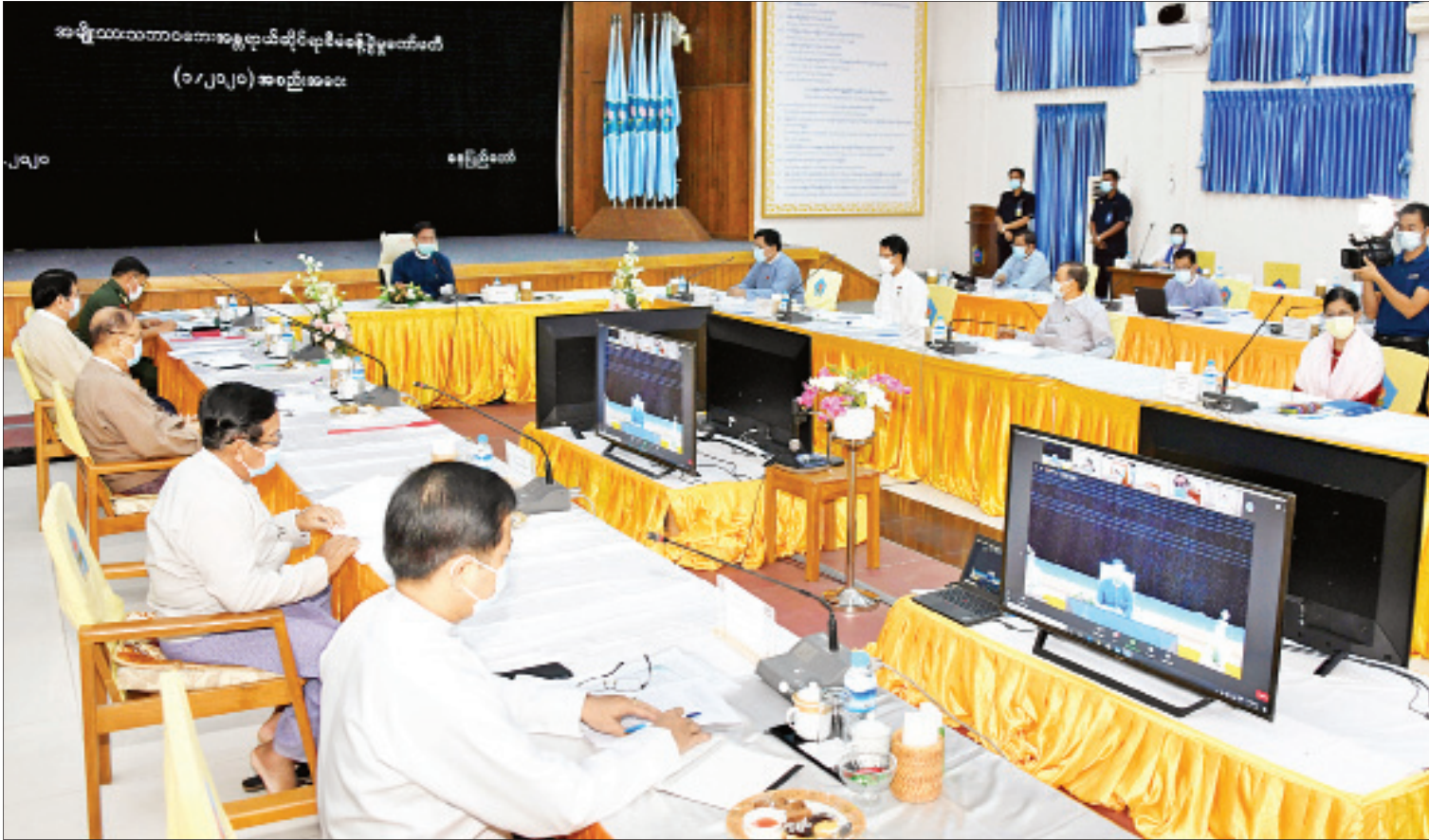
အမျိုးသားသဘာဝဘေးအန္တရာယ်ဆိုင်ရာစီမံခန့်ခွဲမှုကော်မတီ (၁/၂၀၂၀) အစည်းအဝေး ကျင်းပစဉ်။

နေပြည်တော် မေ ၂၂ အမျိုးသားသဘာဝဘေးအန္တရာယ်ဆိုင်ရာ စီမံခန့်ခွဲမှုကော်မတီ (၁/၂၀၂၀) အစည်းအဝေး ကို ယနေ့မနက် ၉ နာရီတွင် နေပြည်တော်ရှိ လူမှုဝန်ထမ်း၊ ကယ်ဆယ်ရေးနှင့် ပြန်လည် နေရာချထားရေးဝန်ကြီးဌာန အစည်းအဝေး ခန်းမ၌ ကျင်းပရာ အမျိုးသားသဘာဝ ဘေးအန္တရာယ်ဆိုင်ရာ စီမံခန့်ခွဲမှုကော်မတီ ဥက္ကဋ္ဌ၊ ဒုတိယသမ္မတ ဦးဟင်နရီဗန်ထီးယူ တက်ရောက်အမှာစကား ပြောကြားသည်။