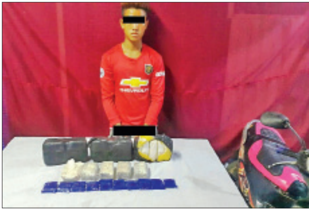
မနောအား သိမ်းဆည်းရမိသည့် စိတ်ကြွေးသွပ်ဆေးပြားများနှင့်အတူ တွေ့ရစဉ်။

နောင်ချို ညနေ ၄ ခန့်တွင် မူးယစ်ဆေးဝါးတားဆီးနှိမ်နင်းရေးရဲတပ်ဖွဲ့မှ တပ်ဖွဲ့ဝင်များပါဝင်သော ပူးပေါင်းအဖွဲ့သည် နောင်ချိုမြို့နယ် မူဆယ်-မန္တလေး