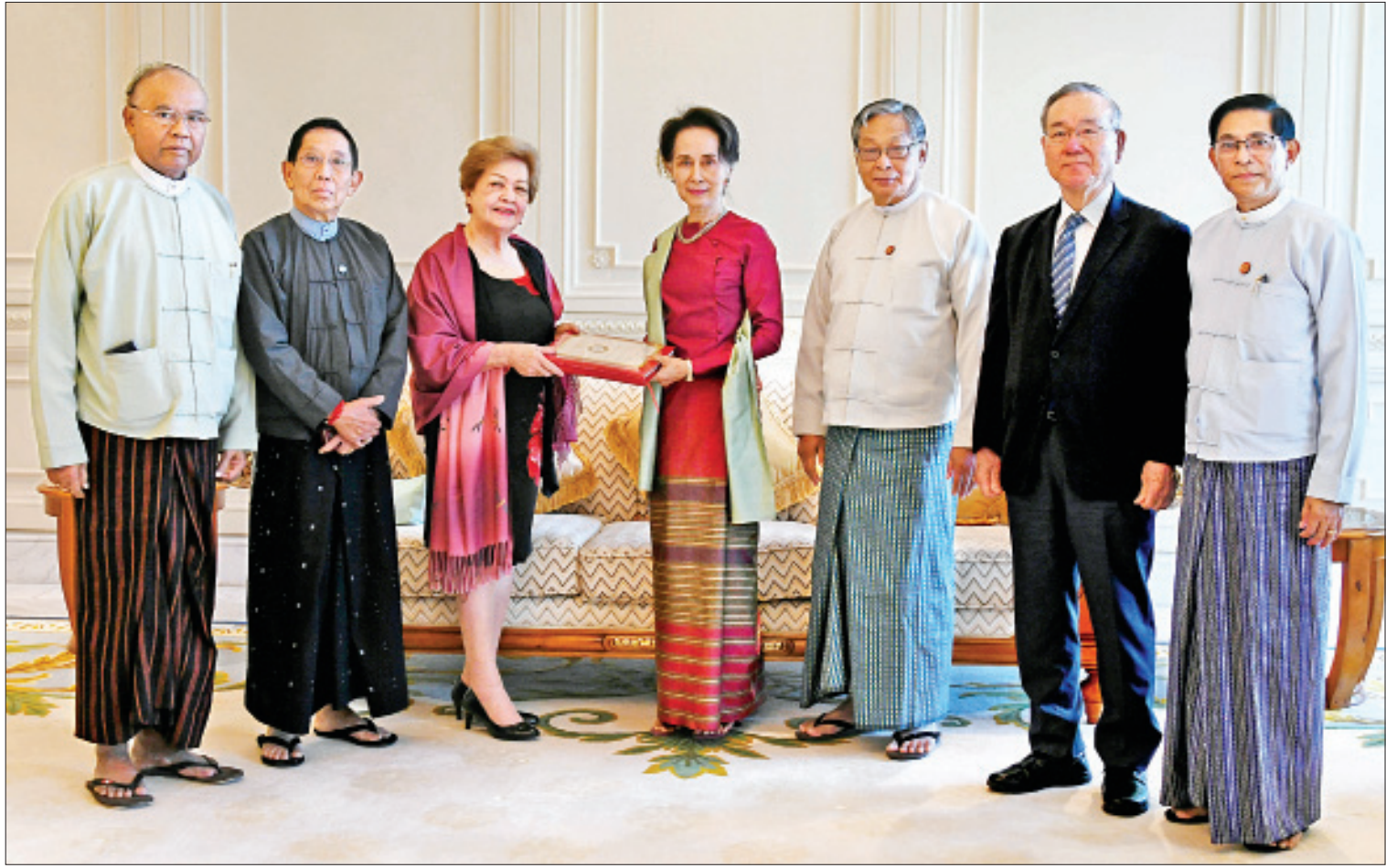
၂၀-၁-၂၀၂၀ ရက်နေ့တွင် နိုင်ငံတော်၏အတိုင်ပင်ခံပုဂ္ဂိုလ် ဒေါ်အောင်ဆန်းစုကြည်ထံ လွတ်လပ်သောစုံစမ်းစစ်ဆေးရေးကော်မရှင် (ICoE) မှ နောက်ဆုံးအချောသပ်အစီရင်ခံစာ ပေးအပ်စဉ်။

ငြိမ်းချမ်းရေး ပထမလုပ်ငန်းစဉ်က ပြည်ထောင်စုငြိမ်းချမ်းရေးညီလာခံ - (၂၁) ရာစုပင်လုံကို တယ်လိုရှေ့ဆက်သွားမလဲဆိုတဲ့ တုံ့လုပ်ငန်းစဉ်ကို သဘောတူညီမှုရယူဖို့ ဖြစ်ပါတယ်။ တစ်နိုင်ငံလုံးပစ်ခတ်တိုက်ခိုက်မှု ရပ်စဲရေး သဘောတူစာချုပ်(NCA) အကောင်အထည်ဖော်မှုနဲ့ပတ်သက်ပြီး မူဘောင် သဘောတူညီချက်တွေအပြင် လက်ရှိရရှိထား တဲ့ အခြေခံမူသဘောတူညီချက် (၁၄) ချက်နဲ့ ထပ်မံပြီးရရှိလာမယ့် အခြေခံမူသဘော တူညီချက်တွေ၊ ၂၀၂၀ ပြည့်နှစ် ရွေးကောက်ပွဲ အလွန်မှာ ဆက်လက်ဖော်ဆောင်မယ့် အဆင့် လိုက်လုပ်ငန်းစဉ်တွေ၊ အဆင့်လိုက် အကောင် အထည်ဖော်မှု သဘောတူညီချက်တွေကို လာမယ့်ပြည်ထောင်စုငြိမ်းချမ်းရေးညီလာခံ- (၂၁) ရာစု ပင်လုံ၊ စတုတ္ထအစည်းအဝေးမှာ သဘောတူညီချက်ရယူပြီး ပြည်ထောင်စု သဘောတူစာချုပ် အစိတ်အပိုင်း (၃) အဖြစ်