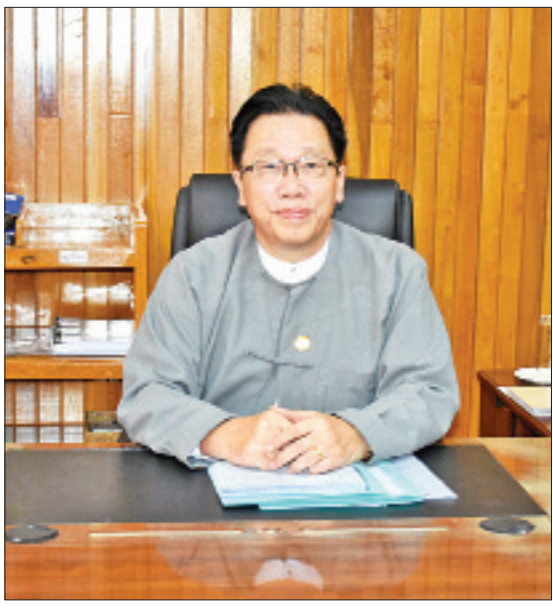
ဒုတိယဝန်ကြီး ဦးမင်းလွင်