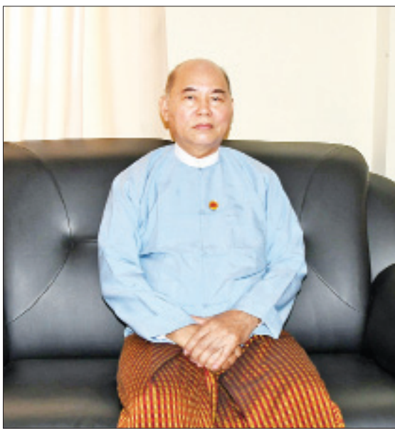
ဒုတိယဝန်ကြီး ဦးခင်မောင်တင်

နိုင်ငံတော်အတိုင်ပင်ခံရုံးဝန်ကြီးဌာန အနေဖြင့် နိုင်ငံတော်၏အတိုင်ပင်ခံပုဂ္ဂိုလ်၏ လမ်းညွှန်ချက်ဖြင့် အမျိုးသားပြန်လည် သင့်မြတ်ရေးနှင့် ငြိမ်းချမ်းရေးလုပ်ငန်းစဉ်တွေ၊ ရခိုင်ပြည်နယ် ဖွံ့ဖြိုးတိုးတက်ရေးနှင့်တရား ဥပဒေစိုးမိုးရေးကိစ္စရပ်တွေကို အဓိကထား ဆောင်ရွက်နေသည့်အပြင် နိုင်ငံတော်၏ အတိုင်ပင်ခံပုဂ္ဂိုလ်က ပေးအပ်လာသော တာဝန်များကို ထမ်းဆောင်ခြင်း၊ နိုင်ငံတော်၏ အတိုင်ပင်ခံပုဂ္ဂိုလ် ချမှတ်ပေးထားသည့် မူဝါဒတွေနဲ့ လမ်းညွှန်ချက်တွေ အောင်မြင်စွာ အကောင်အထည် ပေါ်လာစေရန်အတွက် ကြိုးပမ်းဆောင်ရွက်လျက်ရှိတာကို ပြောကြား ရင်းနဲ့ နိဂုံးချုပ်ပါတယ်။