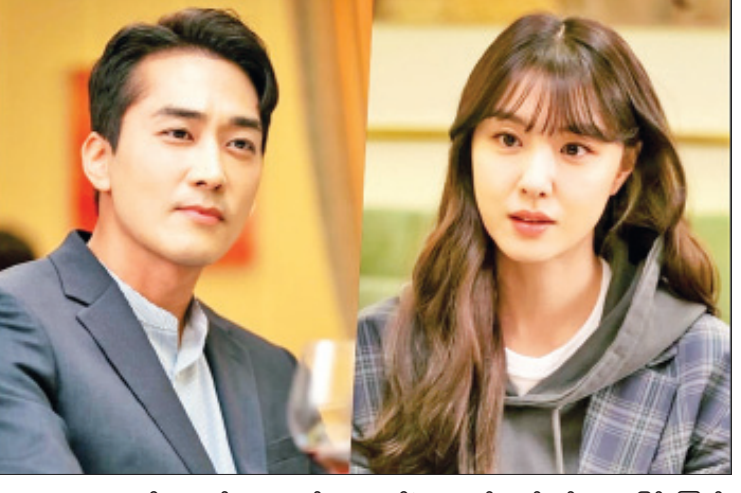
Dinner Mate ကို လာမယ့် မေ ၂၅ ရက်မှာ နာရီခွဲမှာ စတင် ထုတ်လွှင့်သွားမှာဖြစ်ကြောင်း NBC ရုပ်သံလိုင်းမှ ဒေသစံတော်ချိန် ည ၉ လည်း သိရပါတယ်။ အေးပြည့်

တတ်တဲ့ ပုံစံကိုလည်း ဖုံးကွယ်ထားနိုင်သူဖြစ်ကြောင်း၊ အဆိုပါအချက်က သူ့ရဲ့ လက်ရှိဘဝ၊ သူ့ရဲ့ပုံစံနဲ့ ဆင်တူကြောင်း ပြောကြားခဲ့ပါတယ်။ ဆိုဂျီဟေးဟာ အဆိုပါ ဇာတ်လမ်းတွဲမှာ ရိုက်ကူးထုတ်လုပ်သူတစ်ဦးအဖြစ် ပါဝင်ထားပြီး သူပါဝင်ထားတဲ့ ဇာတ်ကောင်ဟာ အခြေအနေတိုင်းမှာ ရယ်မောနိုင်သူတစ်ဦးဖြစ်တာကို အားကျမိကြောင်း မင်းသမီးက ပြောကြားခဲ့ပါတယ်။ ဒါ့အပြင် သူက အဆိုပါ ဇာတ်လမ်းတွဲမှာ သူပါဝင်သရုပ်ဆောင်ထားတဲ့ ဇာတ်ကောင်နဲ့အတူ ရယ်မောပျော်ရွှင်စရာများစွာကို ပရိသတ်ထံ သယ်ဆောင်လာမှာဖြစ်ကြောင်းလည်း ထည့်သွင်းပြောကြားခဲ့ပါတယ်။