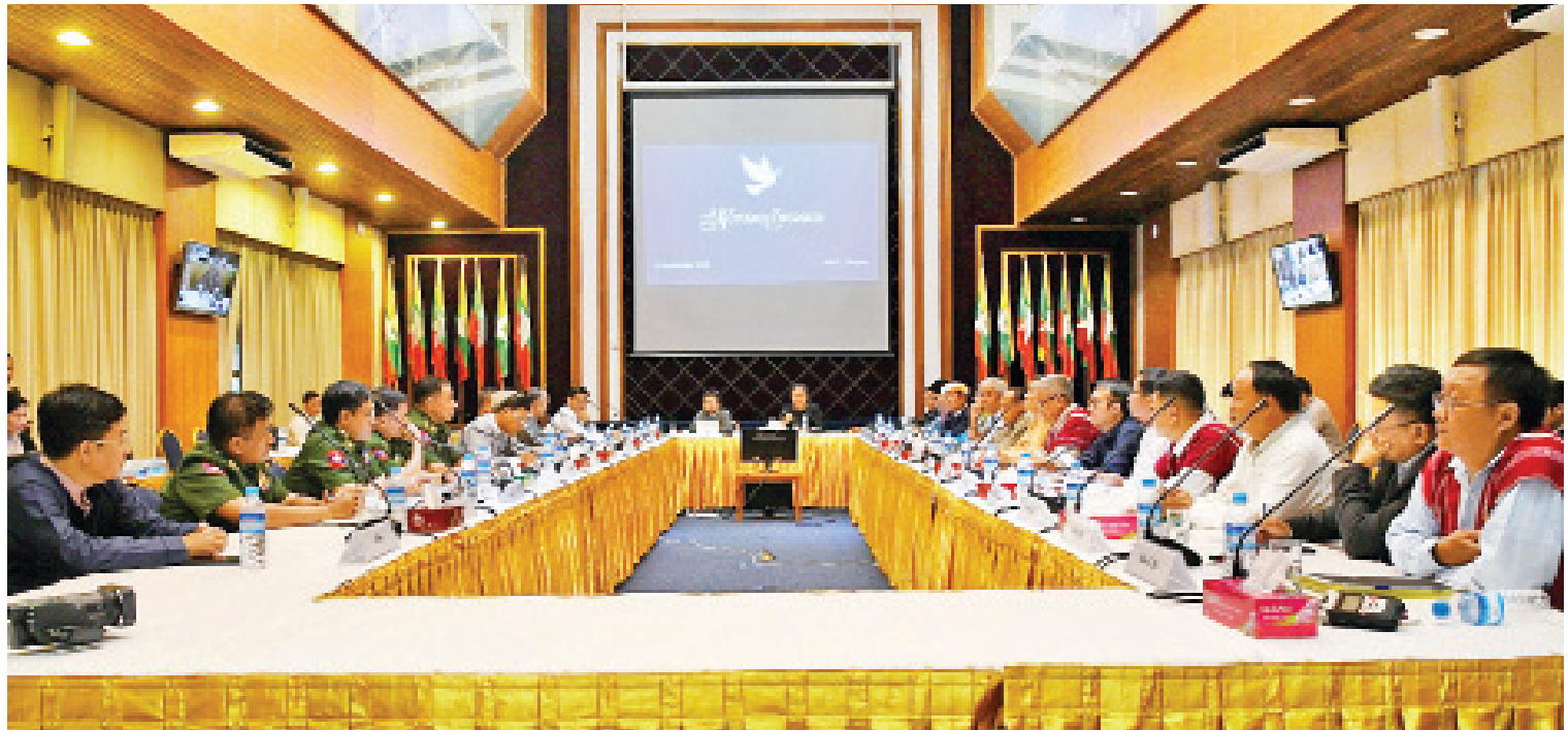
၁၀-၉-၂၀၁၉ ရက်နေ့တွင် နိုင်ငံတော်အစိုးရကိုယ်စားလှယ်အဖွဲ့နှင့် NCA-S EAO ညှိနှိုင်းရေးအဖွဲ့ (တစ်နိုင်ငံလုံးပစ်ခတ်တိုက်ခိုက်မှုရပ်စဲရေးသဘောတူစာချုပ်လက်မှတ်ရေးထိုးထားသည့် တိုင်းရင်းသားလက်နက်ကိုင်အဖွဲ့အစည်း ၁၀ ဖွဲ့) တို့၏ ငြိမ်းချမ်းရေးလုပ်ငန်းစဉ်များအတွက် ညှိနှိုင်းအစည်းအဝေး ကျင်းပစဉ်။

တိုင်းရင်းသားပြည်သူများ လူမှုဘဝကူညီပံ့ပိုးနိုင်ရေး ဆွေးနွေးညှိနှိုင်းမှုတွေကို တစ်ဖက်မှာ ဆောင်ရွက်နေသလို တစ်ဖက်မှာလည်း ပဋိပက္ခကျရောက်ခဲ့ရတဲ့ ဒေသတွေအတွင်းရှိ တိုင်းရင်းသားပြည်သူတွေရဲ့ စားဝတ်နေရေးအတွက် ပြည်ထောင်စုရဲ့ ဘဏ္ဍာရန်ပုံငွေမှ ထောက်ပံ့ပေးလျက်ရှိပြီး အမျိုးသား ပြန်လည်သင့်မြတ်ရေးနှင့် ငြိမ်းချမ်းရေးဗဟိုဌာနရဲ့ ရန်ပုံငွေ ပြည်တွင်း