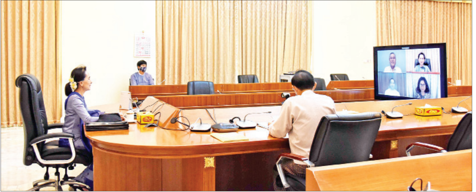
Coronavirus Disease 2019 (COVID-19) ကာကွယ်၊ ထိန်းချုပ်၊ ကုသရေး အမျိုးသားအဆင့် ဗဟိုကော်မတီဥက္ကဋ္ဌ၊ နိုင်ငံတော်၏အတိုင်ပင်ခံပုဂ္ဂိုလ် ဒေါ်အောင်ဆန်းစုကြည် စားသောက်ဆိုင်များ ပြန်လည်ဖွင့်လှစ်ရန် စီမံဆောင်ရွက်ခြင်း နှင့်စပ်လျဉ်း၍ ရွှေပလ္လင်လုပ်ငန်းစုမှ မန်နေဂျင်းဒါရိုက်တာ၊ စားသုံးသူပြည်သူ့တစ်ဦး၊ ခိုင်ခိုင်ကျော်အုပ်စု ရောင်းဝယ်ရေးကုမ္ပဏီလီမိတက်မှ မန်နေဂျင်းဒါရိုက်တာတို့နှင့်တွေ့ဆုံ၍ အပြန်အလှန် ဆွေးနွေးစဉ်။

◆ ရှေ့ဖို့မှ ဝန်ထမ်းများအား စိစစ်ပြန်လည်ခေါ်ယူရေးအဖွဲ့၊ ပြင်ဆင်ဆောင်ရွက်ရေးအဖွဲ့၊ ကျန်းမာရေးစောင့်ရှောက်မှုအဖွဲ့နှင့် သင်ကြားရေးနှင့် ပညာပေးရေးအဖွဲ့များ ဖွဲ့စည်းထားရှိမှုနှင့် ဆောင်ရွက်နေမှုအခြေအနေများကိုလည်းကောင်း ဆွေးနွေးတင်ပြကြရာ နိုင်ငံတော်၏အတိုင်ပင်ခံပုဂ္ဂိုလ်က စားသောက်ဆိုင်နှင့် လက်ဖက်ရည်ဆိုင်များ ပြန်လည်ဖွင့်လှစ်ရာတွင် ကျန်းမာရေးအရ ဘေးအန္တရာယ် ကင်းရှင်းလုံခြုံမှုရှိစေရေးနှင့် စားသောက်ဆိုင်ငယ်များတွင် ပါဆယ်ယူသည့်စနစ်ကျင့်သုံးရေးတို့ကို လမ်းညွှန်မှာကြားပြီး စီးပွားရေးလုပ်ငန်းများ ပြန်လည်လည်ပတ်နိုင်ရေး လိုအပ်မှု၊ စားသောက်ဆိုင်နှင့် လမ်းဆေးဆိုင်ငယ်များ ပြန်လည်ဖွင့်လှစ်နိုင်ရေးအတွက် နိုင်ငံတော်က ပံ့ပိုးကူညီဆောင်ရွက်ပေးသွားမည့် အခြေအနေများကို ရှင်းလင်းပြောကြားသည်။