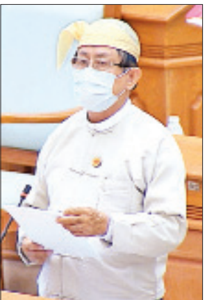
ဒုတိယဝန်ကြီး ဦးမောင်မောင်ဝင်း