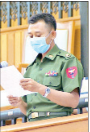
တပ်မတော်သား ပြည်သူ့လွှတ်တော်ကိုယ်စားလှယ် ဗိုလ်မှူးကြီးထင်လင်းအောင်

နှင့် ပြည်သူ့ဘဏ္ဍာငွေကို ထိရောက်အကျိုးရှိစွာ သုံးစွဲရန်မှာ ကြီးမားသောစိန်ခေါ် မှုဖြစ်ပြီး မှန်ကန်စွာ စီမံခန့်ခွဲဆောင်ရွက်ရန် လိုအပ်ပါကြောင်း၊ ဘဏ္ဍာငွေကို ထိရောက်အကျိုးရှိစွာ သုံးစွဲနိုင်ရေးအတွက် ထုတ်ပြန်ထားသည့် ဥပဒေပြဋ္ဌာန်း ချက်များ၊ အမိန့်၊ ညွှန်ကြားချက်များအနက်မှ လုပ်ငန်းနှောင့်နှေးစေသော အချက်များ၊ ဗဟိုချုပ်ကိုင်မှုလွန်နေသည့်အချက်များကို ပြည်ထောင်စုအစိုးရ အဖွဲ့အနေဖြင့် လိုအပ်သလို ဖြေလျှော့ဆောင်ရွက်သင့်ပါကြောင်း၊ ယင်းသို့ ဖြေလျှော့ပေးသကဲ့သို့ တစ်ဖက်တွင်လည်း ဘတ်ဂျက်အလွှဲသုံးစားလုပ်မှုများ ကိုလည်း ထိရောက်ပြင်းထန်သည့် အရေးယူဆောင်ရွက်ချက်မျိုး လုပ်သင့်ပါ ကြောင်း အကြံပြုဆွေးနွေးသည်။