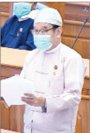
ပြည်ထောင်စုဝန်ကြီး ဒေါက်တာမြင့်ထွေး

ထို့နောက် နိုင်ငံတော်သမ္မတထံမှ ပေးပို့ထားသော နိုင်ငံတော်၏ လိုငွေအား ဖြည့်ဆည်းရန်အတွက် အပြည်ပြည်ဆိုင်ရာငွေကြေးရန်ပုံငွေအဖွဲ့ (IMF) ထံမှ ချေးငွေအမေရိကန်ဒေါ်လာသန်း ၇၀၀ ရယူရေးနှင့် စပ်လျဉ်း၍ လွှတ်တော်