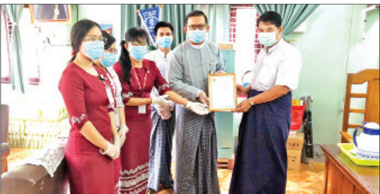
ကျန်းမာရေးနှင့် အားကစားဝန်ကြီးဌာန