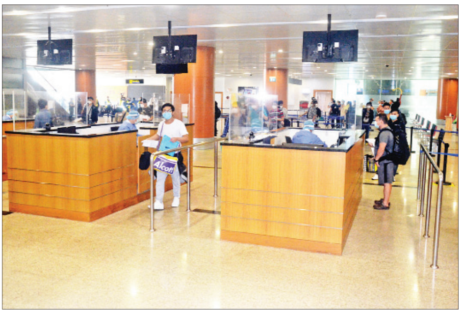
ပြင်သစ်နှင့် အီတလီနိုင်ငံတို့မှ မြန်မာနိုင်ငံသားများ ရန်ကုန်အပြည်ပြည်ဆိုင်ရာလေဆိပ်သို့ ပြန်လည်ရောက်ရှိ လာစဉ်။

နေပြည်တော် မေ ၂၂ နိုင်ငံတကာခရီးသည်တင် လေယာဉ် များ ပျံသန်းမှုယာယီရပ်ဆိုင်းထားခြင်း ကြောင့် ပြည်ပနိုင်ငံများ၌ အခက်အခဲ ကြုံတွေ့နေရသည့် ကိုရီးယားသမ္မတ နိုင်ငံရောက် မြန်မာနိုင်ငံသား ၇၂ ဦးနှင့် ဘယ်လ်ဂျီယံနိုင်ငံ၊ ကနေဒါနိုင်ငံ၊ အင်ဒို နီးရှားနိုင်ငံ၊ ဂျပန်နိုင်ငံ၊ နော်ဝေနိုင်ငံ၊ ကာတာနိုင်ငံ၊ ဗြိတိန်နိုင်ငံ၊ အီတလီ နိုင်ငံ၊ အမေရိကန်ပြည်ထောင်စု၊ ဟောင်ကောင် အထူးအုပ်ချုပ်ခွင့်ရ ဒေသတို့မှ မြန်မာနိုင်ငံသား ၆၀ စုစုပေါင်း ၁၃၂ ဦးတို့အား အင်ချန်း အပြည်ပြည်ဆိုင်ရာလေဆိပ်မှတစ်ဆင့် Myanmar Airways International-MAI ကယ်ဆယ်ရေးလေယာဉ်ဖြင့် ပြန်လည်ခေါ်ဆောင်ခွဲရာ ည ၈ နာရီ တွင် ရန်ကုန်အပြည်ပြည်ဆိုင်ရာ လေဆိပ်သို့ အဆင်ပြေချောမွေ့စွာ ပြန်လည်ရောက်ရှိခဲ့ကြသည်။ စာမျက်နှာ ၁၈ ကော်လံ ၁ သို့ ၀