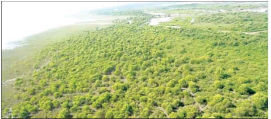
ရန်ကုန်တိုင်းဒေသကြီးအတွင်းရှိ ဒီရေတောကို တွေ့ရစဉ်။