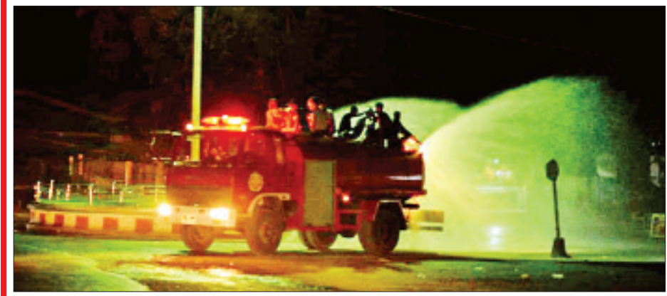
ကချင်ပြည်နယ် မိုးညှင်းမြို့နယ်တွင် မေ ၁၄ ရက်က ကိုဗစ်-၁၉ ရောဂါ ကာကွယ်ရေး ပိုးသတ်ဆေးဖျန်းစဉ်။