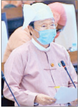
ဒုတိယဝန်ကြီး ဦးလှကျော်

ဆက်လက်၍ အမျိုးသားလွှတ်တော် ဥပဒေကြမ်းကော်မတီဝင် ဒေါ်ကျိန်နီက မန်က ပြည်သူ့လွှတ်တော်က ပြင်ဆင်ချက်ဖြင့် အတည်ပြုပြီး