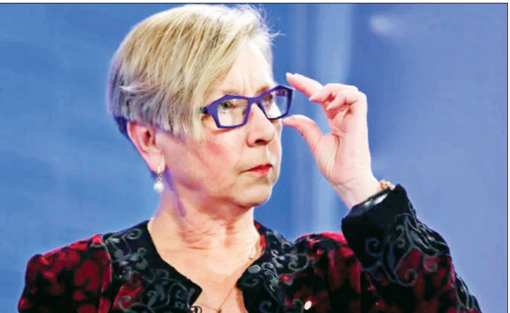
ကမ္ဘာ့ကျန်းမာရေးအဖွဲ့မှ ဘုတ်အဖွဲ့ဝင်ဟောင်းနှင့် ဩစတြေးလျထိပ်တန်းကျန်းမာရေးပညာရှင် ဂျိမ်းစ်ဟက်တန်

ဆစ်ဒနီ မေ ၁၈ ကမ္ဘာပေါ်ရှိ နိုင်ငံတစ်နိုင်ငံအနေဖြင့် ကိုရိုနာဗိုင်းရပ်စ်ကာကွယ်ဆေးကို ရှာဖွေတွေ့ရှိပြီး မိမိနိုင်ငံအတွက် ဦးစားပေးဖြန့်ဖြူးခြင်းကို ဆောင်ရွက်နေပါက တွေ့ရှိဆေးဝါးကို ကမ္ဘာလုံးဆိုင်ရာဖြန့်ဖြူးမှုပြုလုပ်ရာတွင် အဟန့်အတား ဖြစ်သွားမည်ဟု ကမ္ဘာ့ကျန်းမာရေးအဖွဲ့မှ ဘုတ်အဖွဲ့ဝင်ဟောင်းနှင့် ဩစတြေးလျ ထိပ်တန်းကျန်းမာရေးပညာရှင်တစ်ဦးဖြစ်သူ ဂျိမ်းစ်ဟက်တန်က ပြောကြားသည်။ ကိုရိုနာဗိုင်းရပ်စ်ကာကွယ်ဆေးကို မိမိနိုင်ငံတစ်ခုတည်းတွင်သာ သုံးစွဲရန်ဆောင်ရွက် သွားပါက အခြေအနေပိုမိုဆိုးရွားသွားမည်ဟု ကပ်ရောဂါဆိုင်ရာ ပြင်ဆင်ဆောင်ရွက်ရေး မဟာမိတ်အဖွဲ့၏ဥက္ကဋ္ဌ ဟက်တန်က အထက်ပါ သတိပေးချက်အား အမျိုးသားသတင်းစာ ကလပ်တွင် ယနေ့ ပြောကြားခဲ့သည်။ ကမ္ဘာတစ်ဝန်း၌ ကိုရိုနာဗိုင်းရပ်စ်ကာကွယ် ဆေးဖွံ့ဖြိုးတိုးတက်စေရန် တူညီသော အခွင့်အရေးများရှိနေပြီး ယခုအခါ၌ ကမ္ဘာတစ်ဝန်း တွင် ကိုရိုနာဗိုင်းရပ်စ်ကာကွယ်ဆေးဖွံ့ဖြိုး တိုးတက်စေရေးအတွက် ဆောင်ရွက်နေသော အဖွဲ့အစည်း ၁၃၀ ခန့်ရှိကြောင်း၊ ကိုရိုနာဗိုင်းရပ်စ် အတွက် အတည်ပြု ကာကွယ်ဆေးတွေ့ရှိပါက ထိုဆေးဝါးကို တစ်နိုင်တည်း ပြည်တွင်းသုံးစွဲ