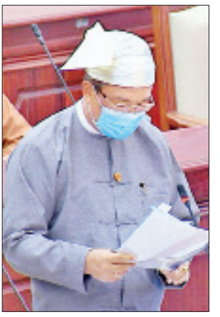
ဒုတိယဝန်ကြီး ဒေါက်တာကျော်လင်း

ဒေါက်တာကျော်လင်းက အဆိုပါလမ်းကို အပိုင်း နှစ်ပိုင်းခွဲ၍ မြစ်ကြီးနားမှ ဝါရှောင်အထိ ၁၉ ဒဿမ ၀၆ ကီလိုမီတာကို ဆောက်လုပ်ရေးဝန်ကြီးဌာန မြစ်ကြီးနားခရိုင် လမ်းဦးစီးဌာနမှ စီမံခန့်ခွဲပြုပြင်လျက်ရှိပြီး ဝါရှောင်မှ ကန်ပိုက်တီအထိ ၉၅ ကီလိုမီတာကို တရုတ်ပြည်သူ့သမ္မတနိုင်ငံ ထိန်မိန် ကုမ္ပဏီက ပြင်ဆင်ထိန်းသိမ်းလျက်ရှိပါကြောင်း၊ ၎င်းလမ်းပေါ်တွင် လမ်းအသုံးပြုခ ငွေကြေးကောက်ခံခြင်းမရှိပါကြောင်း။