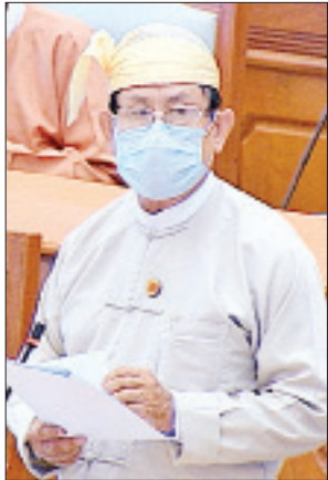
ဒုတိယဝန်ကြီး ဦးမောင်မောင်ဝင်း