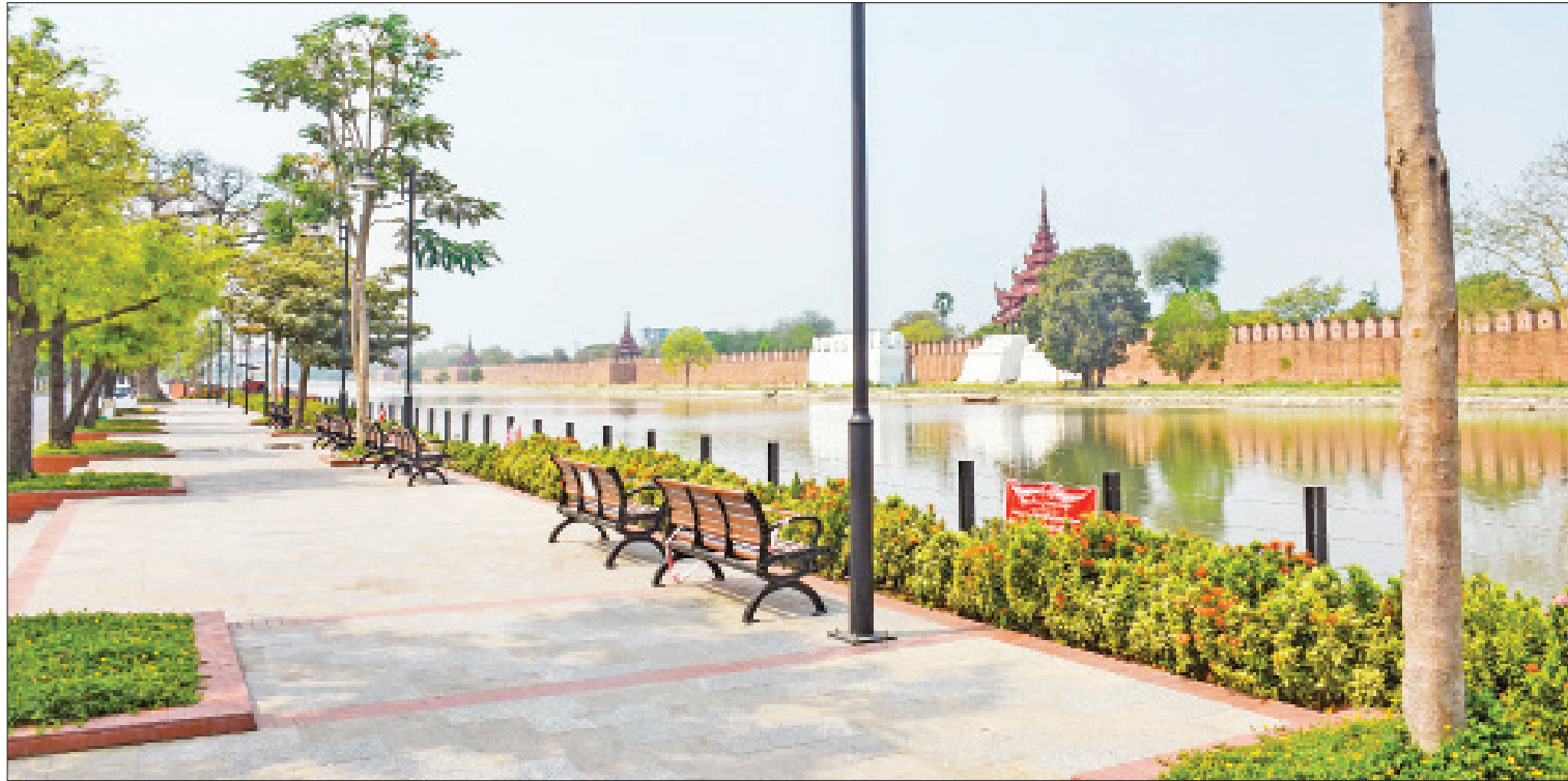
မန္တလေးမြို့ ၆၆ လမ်းကျွန်းအရှေ့ဘက်ရှိ အများပြည်သူ အနားယူအပန်းဖြေရန် ဆောင်ရွက်ထားမှုကို တွေ့ရစဉ်။

ကျေးလက်ဒေသ ဖွံ့ဖြိုးတိုးတက်ရေးဦးစီးဌာနမှ တိုင်းဒေသကြီးအစိုးရအဖွဲ့ ရန်ပုံငွေဖြင့် (၄)နှစ်တာကာလအတွင်း ကျေးလက်ရေရရှိရေးလုပ်ငန်းများ ဆောင်ရွက်ရာတွင် ကျေးရွာ ၁၀၃၈ ရွာမှ အိမ်ခြေ ၁၉၄၆၈၈ အိမ်ရှိ လူဦးရေ ၉၆၆၂၅၅ ဦးအတွက် ရေတွင်း/ရေကန်၊ စိမ့်စမ်း၊ အခြားလုပ်ငန်း ၁၀၄၄ ခု စုစုပေါင်းငွေကျပ်သန်း ၁၁၃၈၉ ဒသမ ၃၁၁၁၈ သန်း ကျပ်ဆောင်ရွက်ခဲ့