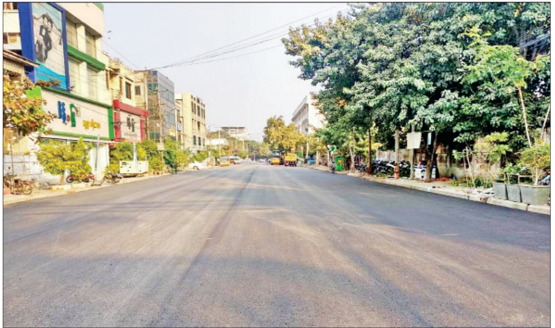
မန္တလေးမြို့ ၃၄ လမ်း (၇၉ x ၈၆ လမ်းကြား) နိုင်ငံ့ကတ္တရာလမ်းခင်းထားမှုကို တွေ့ရစဉ်။

၂၀၁၉ - ၂၀၂၀ ဘဏ္ဍာနှစ်တွင် မန္တလေးတိုင်းဒေသကြီးအတွင်း လမ်းဦးစီးဌာနနှင့် B.O.T ကုမ္ပဏီများမှ ကတ္တရာကွန်ကရစ်လမ်း ခင်းခြင်း၊ ကွန်ကရစ်လမ်းခင်းခြင်း၊ ကတ္တရာလမ်းချဲ့ခြင်းလုပ်ငန်း၊ ကတ္တရာထပ်ပိုးလွှာခင်းခြင်းလုပ်ငန်း၊ ကတ္တရာလမ်း အနိမ့်အမြင့် ညီခြင်း၊ ဒုံပေါက်များတူးထုတ်၍ ကတ္တရာခင်းခြင်း၊ မြေသားတာပေါင် ချဲ့ခြင်းလုပ်ငန်း၊ မြေကာနံရံတည်ဆောက်ခြင်း၊ ပေ ၂၀ အောက် တံတား၊ ပေ ၂၀ နှင့် ပေ ၅၀ အောက်တံတား၊ ပေ ၅၀ နှင့် ပေ ၁၀ အောက်တံတားတည်ဆောက်ခြင်းလုပ်ငန်းများကို ပြည်ထောင်စု ခွင့်ပြုရန်ပုံငွေ ကျပ်သန်း ၁၉၈၈ သန်းနှင့် တိုင်းဒေသကြီး ခွင့်ပြု ရန်ပုံငွေကျပ်သန်း ၂၃၆၉၇ ဒသမ ၁၇၀၇ ဖြင့် ဆောင်ရွက်လျက်ရှိ