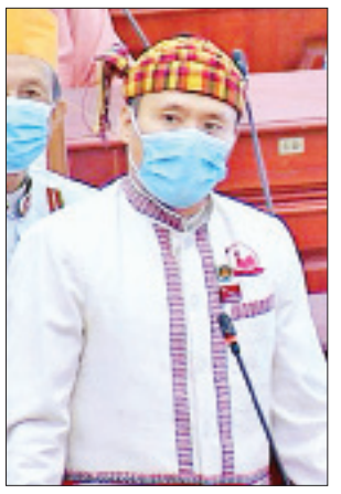
ဝိုင်းမော်မဲဆန္ဒနယ်မှ ဦးလက်နံဇယ်ဂျိုး

မြစ်သားမဲဆန္ဒနယ်မှ ဒေါက်တာလင်းလင်းကျော်၏ မြစ်သားမြို့နယ်တွင် အရေးပါသော ကုမ-ကဆွန်-သိမ်ကုန်း-အုန်းကုန်းလမ်းအား ရာသီမရွေးသွားလာနိုင်သော ကွန်ကရစ်လမ်း သို့မဟုတ် ကတ္တရာလမ်းအဖြစ် အဆင့်မြှင့်တင်ပေးရန် အစီအစဉ်ရှိ၊ မရှိ မေးခွန်းနှင့်စပ်လျဉ်း၍ ဒုတိယဝန်ကြီး ဒေါက်တာကျော်လင်းက အဆိုပါလမ်းသည် လမ်းအဆင့်သတ်မှတ်ချက် Class (A)၊ ဦးစားပေးအဆင့် (၁) လမ်းစာရင်းတွင် ပါဝင်သဖြင့် ကတ္တရာလမ်းအဖြစ် အဆင့်မြှင့်တင်ခြင်းလုပ်ငန်း ဆောင်ရွက်ရန် ၂၀၂၀-၂၀၂၁ ဘဏ္ဍာနှစ် နောက်ပိုင်းကာလများတွင် မန္တလေးတိုင်းဒေသကြီးအစိုးရအဖွဲ့ ရန်ပုံငွေ၌ ထည့်သွင်းလျာထားတင်ပြပြီး ရန်ပုံငွေခွဲဝေရရှိမှု