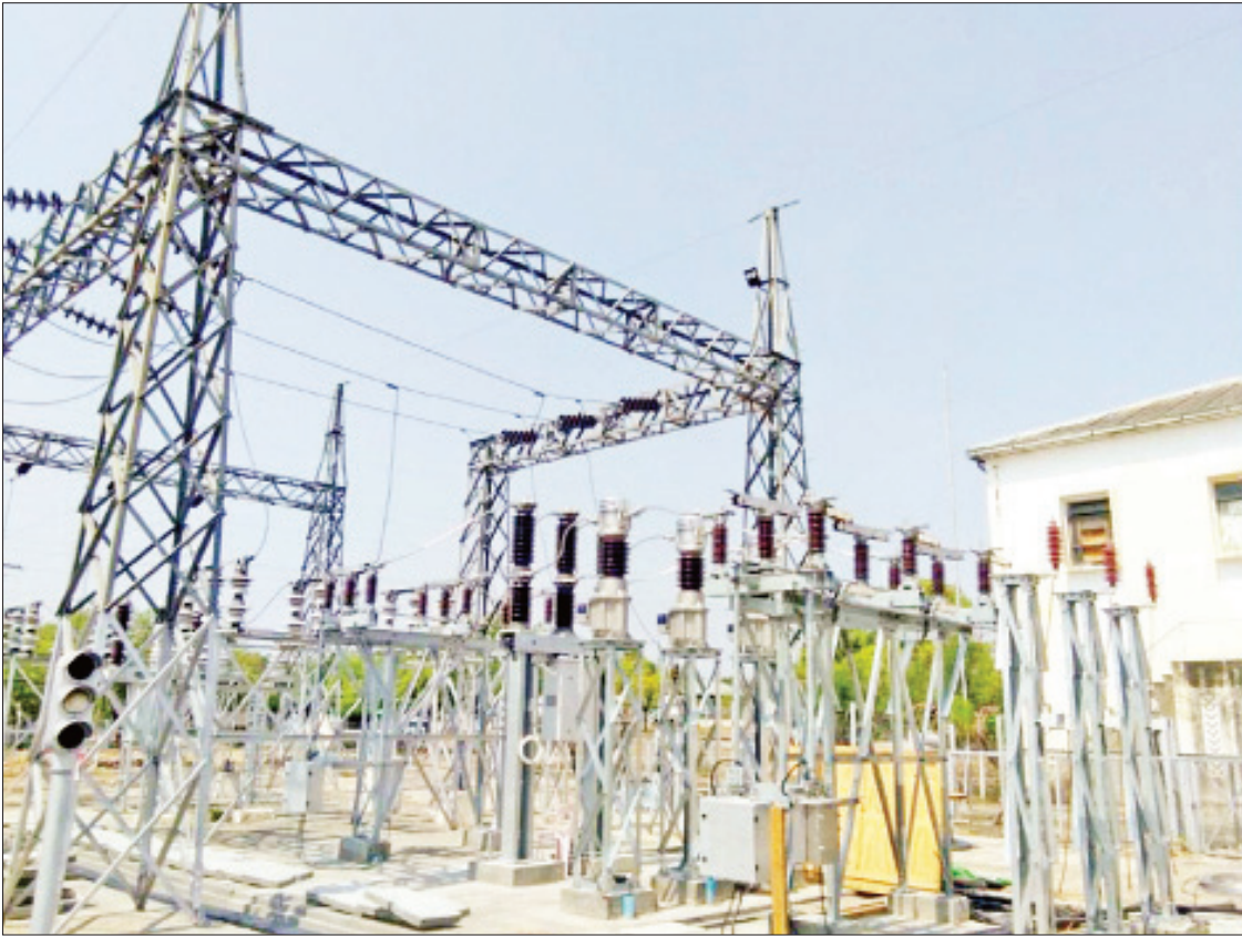
ပြည်ထောင်စုဘတ်ဂျက်ဖြင့် ဆောင်ရွက်သော ပြင်ဦးလွင်မြို့နယ် သာစည်ပင်မဓာတ်အားခွဲရုံတွင် 33 kv Switchbay(1) Set တိုးချဲ့ တည်ဆောက်ပြီးစီးမှုကို တွေ့ရစဉ်။

e-Government လုပ်ငန်းများ (၄) နှစ်တာ ကာလအတွင်း e-Government စနစ်အကောင်အထည်ဖော် ဆောင်ရွက်လျက်ရှိရာ e-Mandalay Web Portal (www.emandalay.gov.mm) မှ တစ်ဆင့် မန္တလေးတိုင်းဒေသကြီးအတွင်းရှိ တိုင်းအဆင့်ဌာနဆိုင်ရာ ဌာန ၁၄၀ ၏ သတင်း အချက်အလက်များ၊ ဝန်ဆောင်မှုဆိုင်ရာအချက် အလက်များ (လျှောက်လွှာများ၊ စည်းမျဉ်း