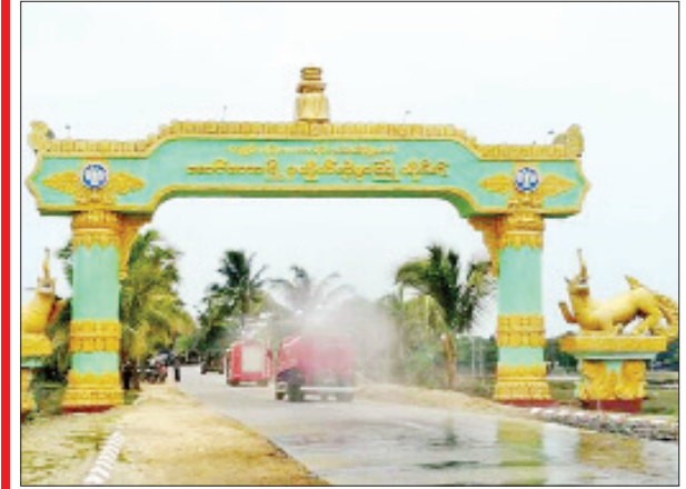
ရခိုင်ပြည်နယ် မောင်တောမြို့ မြို့ဝင်မုခ်ဦးမှ မြို့တွင်းလမ်းမကြီး တစ်လျှောက်တွင် မေ ၁၂ ရက်က ကိုဗစ်-၁၉ ရောဂါ ကာကွယ်ရေး ပိုးသတ်ဆေးဖျန်းစဉ်။