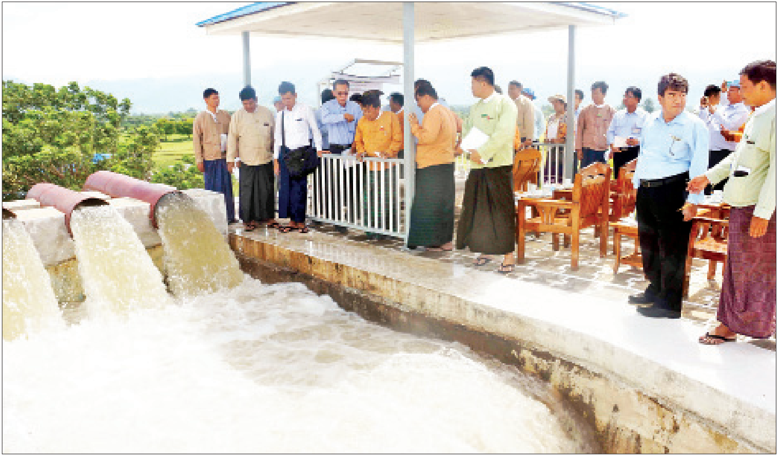
မန္တလေးတိုင်းဒေသကြီးဝန်ကြီးချုပ် ဒေါက်တာဇော်မြင့်မောင် ကင်းတားလက်ဝဲမြောင်းမကြီး မြစ်ရေတင်စီမံကိန်းကို ကြည့်ရှုစစ်ဆေးစဉ်။

အလားတူ မန္တလေးမြို့တော်နေ ပြည်သူများ အပါအဝင် မသန်စွမ်းသူများ အသုံးပြုနိုင်