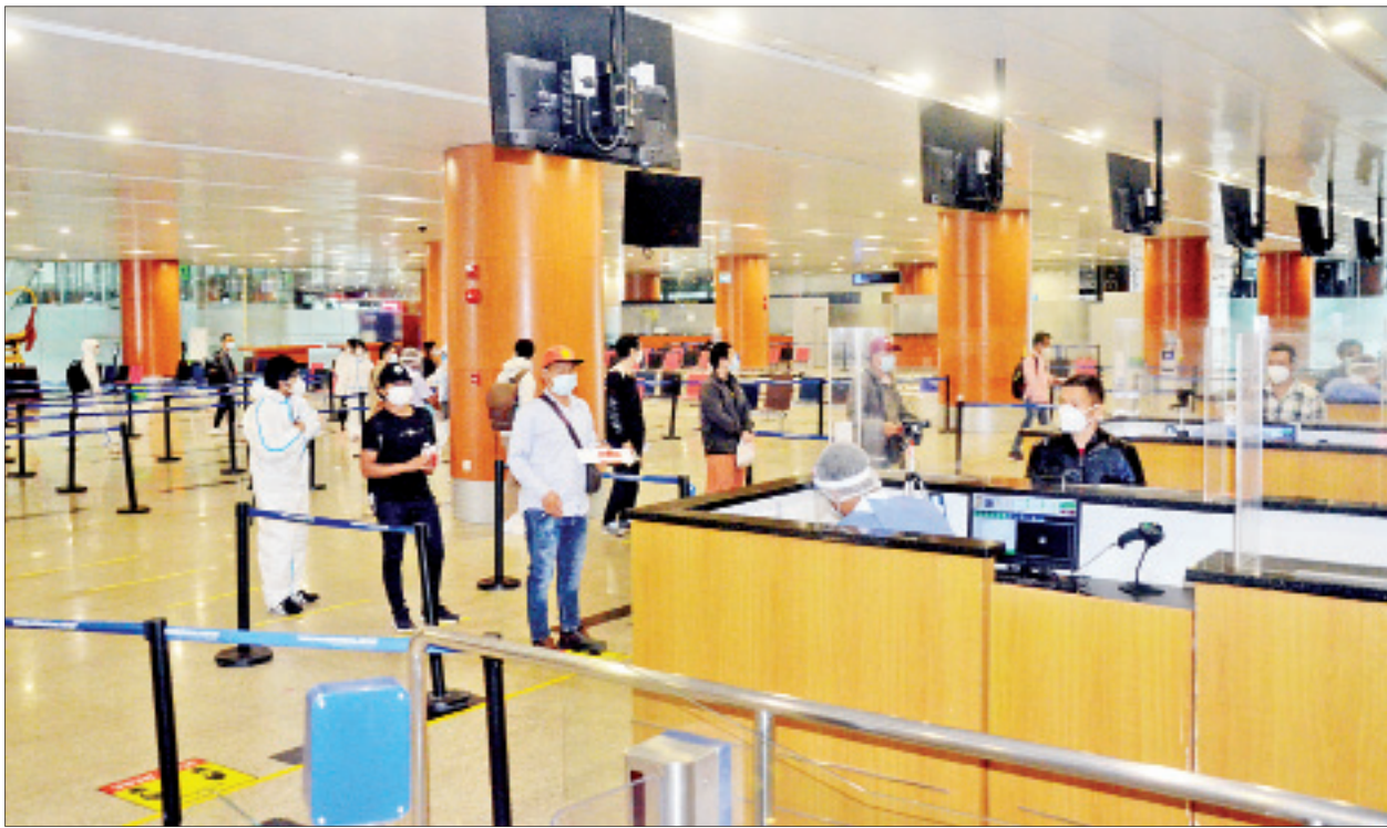
ဖိလစ်ပိုင်နိုင်ငံမှ ပြန်လည်ရောက်ရှိလာသည့် မြန်မာနိုင်ငံသားများကို ရန်ကုန်အပြည်ပြည်ဆိုင်ရာလေဆိပ်၌ တွေ့ရစဉ်။