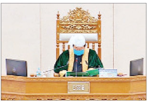
ပြည်သူ့လွှတ်တော်ဥက္ကဋ္ဌ ဦးတီခွန်မြတ်

ထို့နောက် ဝိုင်းမော်မဲဆန္ဒနယ်မှ ဦးလက်နံဇယ်ဂျိုး၏ ဝိုင်းမော်မြို့နယ်အတွင်းရှိ မြစ်ကြီးနား-ဝိုင်းမော်-ဆန်း-ကန်ပိုက်တီမှ တရုတ်ပြည်သူ့သမ္မတနိုင်ငံတို့ကို ဆက်သွယ်ထားသော လမ်းကြောင်းကို ပြုပြင်ပေးရန် အစီအစဉ်ရှိ မရှိမေးခွန်းနှင့်စပ်လျဉ်း၍ ဆောက်လုပ်ရေးဝန်ကြီးဌာန ဒုတိယဝန်ကြီး