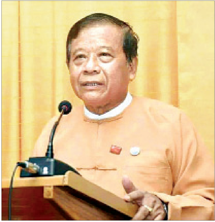
မန္တလေးတိုင်းဒေသကြီးဝန်ကြီးချုပ် ဒေါက်တာဇော်မြင့်မောင်

မြို့တော်အတွင်း ယာဉ်ကြောကျပ်တည်းမှုနှင့် လမ်းဆုံများတွင် ယာဉ်အန္တရာယ်ကင်းရှင်းစွာသွားလာနိုင်ရေးအတွက် မြို့နယ်ခြောက်မြို့နယ်တွင် (၄) နှစ်တာကာလအတွင်း ရိုးရိုးမီးပွိုင့် ၅၅ ခု၊ SCATS စနစ် မီးပွိုင့် ၅၀ နှင့် Individual Loop Sensor မီးပွိုင့်နှစ်ခု တပ်ဆင်နိုင်ခဲ့သည်။ SCATS စနစ်သုံးမီးပွိုင့် ၅၀ နှင့် မီးပွိုင့်များတွင် ဖြတ်သန်းသွားလာသော ယာဉ်နံပါတ်များ မှတ်တမ်းရယူထားနိုင်သော ANPR Camera အလုံး ၁၅၀၊ မီးပွိုင့်များတွင် 360 Degree လှည့်ပတ်စောင့်ကြည့်နိုင်သော PTZ Drone Camera အလုံး ၅၀၊ ယာဉ်စည်းကမ်းဖောက်ဖျက်သည့်ယာဉ်များ မှတ်တမ်းရယူနိုင်သော e-Police Camera ၆၃ ခု၊ Parking