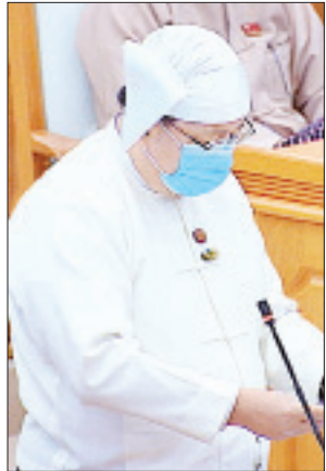
ပြည်ထောင်စုဝန်ကြီး ဦးသောင်းထွန်း