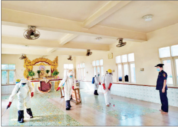
မန္တလေးတိုင်းဒေသကြီး ပြည်ကြီးတံခွန်မြို့နယ် ညောင်ရမ်းတိုက်သစ် ပရိယတ္တိစာသင်တိုက်တွင် မေ ၁၄ ရက်က ကိုဗစ်-၁၉ ရောဂါ ကာကွယ်ရေး ပိုးသတ်ဆေးဖျန်းစဉ်။