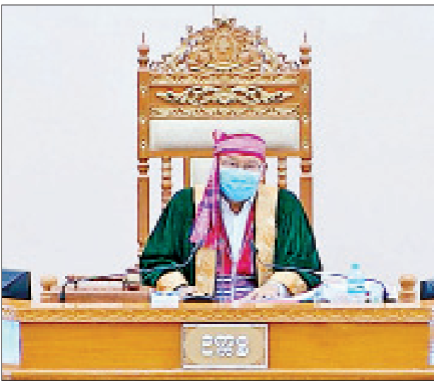
အမျိုးသားလွှတ်တော်ဥက္ကဋ္ဌ မန်းဝင်းခိုင်သန်း

ယင်းနောက် ရခိုင်ပြည်နယ် မဲဆန္ဒနယ်အမှတ်(၁၂)မှ ဦးစိုးဝင်း၏ (N) မဲမြဲဦးပိုင်ထွက်ရှိထားသည့် လယ်ယာမြေများကို အမြဲဦးပိုင်ဖြင့် လယ်ယာမြေလုပ်ပိုင်ခွင့်ပြုလက်မှတ် ပုံစံ(၇) ရရှိရေးအတွက် သက်ဆိုင်ရာအဖွဲ့အစည်းများက "၂၀၁၂ ခုနှစ်၊ မြေလွတ်၊ မြေလပ်နှင့် မြေရိုင်းများ စီမံခန့်ခွဲရေးဥပဒေ"အရ လျှောက်ထားစေခြင်းများမှာ ဥပဒေလုပ်ထုံးလုပ်နည်းများနှင့် ညီညွတ်ခြင်း ရှိ/မရှိနှင့် တည်ဆဲဥပဒေဖြစ်သည့် မြန်မာနိုင်ငံ မြေစာရင်းလက်စွဲဥပဒေပုဒ်မ (၅၈၂) ပါ လုပ်ထုံးလုပ်နည်းများနှင့်အညီ (N) မဲမြဲဦးပိုင်မှ အမြဲဦးပိုင်ဖြင့် လယ်ယာမြေလုပ်ပိုင်ခွင့်ပြုလက်မှတ် ပုံစံ(၇) ရရှိရေးအတွက် ဆောင်ရွက်ပေးရန်