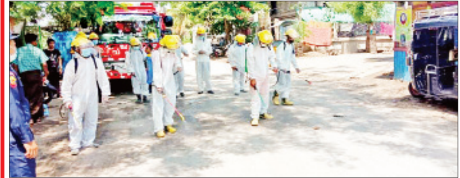
မန္တလေးတိုင်းဒေသကြီး မဟာအောင်မြေမြို့နယ် ဒေးရှေ့ရပ်ကွက်တွင် မေ ၁၃ ရက်က ကိုဗစ်-၁၉ ရောဂါ ကာကွယ်ရေး ပိုးသတ်ဆေးဖျန်းစဉ်။