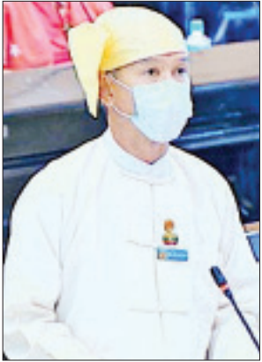
ဒုတိယဝန်ကြီး ဦးလှမော်ဦး

အစီအစဉ် ရှိ/မရှိ မေးခွန်းနှင့်စပ်လျဉ်း၍ စိုက်ပျိုးရေး၊ မွေးမြူရေးနှင့် ဆည်မြောင်းဝန်ကြီးဌာန ဒုတိယဝန်ကြီးဦးလှကျော်က မြန်မာနိုင်ငံ မြေစာရင်းလက်စွဲ ဥပဒေ ပုဒ်မ (၅၈၂) ပါ ပြဋ္ဌာန်းချက်သည် မြေမျိုးပြောင်းလဲသတ်မှတ်ခြင်းနှင့် သက်ဆိုင်ခြင်းမရှိပါကြောင်း၊ အဆိုပါ ပြဋ္ဌာန်းချက်အရ စိုက်ပျိုးမှုအခြေအနေ တည်မြဲသည် မမြဲသည်ကို ဆုံးဖြတ်ရာတွင်လည်း လက်တွေ့ဖြေရှင်းသည့်အခါ ပြဋ္ဌာန်းချက်ရှိသည်ကို အတိအလင်း ဖော်ပြထားပါကြောင်း၊ ထို့ကြောင့် ကွင်းပွဲတိုင်းတာခြင်းနှင့် ဦးပိုင် ပိုင်ဆိုင်မှုစာရင်း ကောက်ယူနိုင်ခြင်းတို့ မရှိသေးသည့် ဒေသများရှိ မဲမြဲဦးပိုင်များကို အမြဲဦးပိုင် ပြောင်းလဲရာတွင် မဖြစ်နိုင်သေးပါကြောင်း၊ ထို့ကြောင့် အဆိုပါအခြေအနေတွင် မြေမျိုးကြီးအနေဖြင့် မြေလွတ်၊ မြေလတ်၊ မြေရိုင်းစာရင်းများအဖြစ်သာ မှတ်သားတည်ရှိနေခြင်း ဖြစ်ပါကြောင်း။