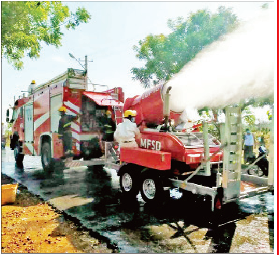
နေပြည်တော် ဇမ္ဗူသီရိမြို့နယ်တွင် မေ ၁၂ ရက်က ကိုဗစ်-၁၉ ရောဂါ ကာကွယ်ရေး ပိုးသတ်ဆေးဖျန်းစဉ်။