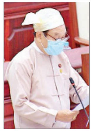
ပြည်ထောင်စုဝန်ကြီး ဒေါက်တာမြင့်ထွေး

ယင်းနောက် ကျန်းမာရေးနှင့် အားကစားဝန်ကြီးဌာန ပြည်ထောင်စုဝန်ကြီး ဒေါက်တာမြင့်ထွေးက ကူးစက်ရောဂါကာကွယ်နှိမ်နင်းရေးဥပဒေကြမ်းကို တင်သွင်းပြီး အဆိုပါဥပဒေကြမ်းနှင့်စပ်လျဉ်း၍ ဥပဒေကြမ်းကော်မတီဝင်