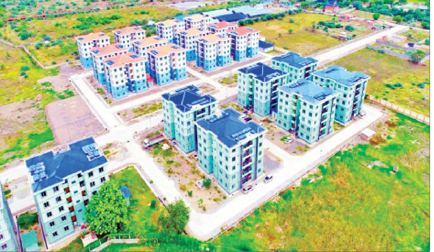
မန္တလေးတိုင်းဒေသကြီး ပုသိမ်ကြီးမြို့နယ်ရှိ အောင်မြေမြေအောင်မြေမြေလှာ နိုင်ငံ့ဝန်ထမ်းအိမ်ရာကို တွေ့ရစဉ်။

ထိုကဲ့သို့သာသနာတော်ထွန်းကားပြန့်ပွား ရေးဆောင်ရွက်မှုများနှင့် ဒေသခံလူထု၏ လူမှုစီးပွားဘဝ ဖွံ့ဖြိုးတိုးတက်ရေးအတွက် လုပ်ထုံးလုပ်နည်း ဖြေလျှော့ပေးမှုများ ဆောင်ရွက်လျက်ရှိသလို နိုင်ငံတော်၏ ရည်မှန်းချက်ပန်းတိုင်ဖြစ်သည့် အေးချမ်း သာယာပြီး ခေတ်မီဖွံ့ဖြိုးတိုးတက်သော ဒီမို ကရေစီဖက်ဒရယ်ပြည်ထောင်စု တည်ဆောက် ရာတွင် မန္တလေးတိုင်းဒေသကြီးအစိုးရအဖွဲ့ သည် နိုင်ငံတော်အစိုးရနှင့်အတူ ပြည်သူနှင့် အတူ လက်တွဲပူးပေါင်းဆောင်ရွက်လျက်ရှိ ကြောင်း ရေးသားတင်ပြလိုက်ရပါသည်။