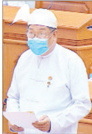
မြန်မာနိုင်ငံတော် ဗဟိုဘဏ် ဒုတိယဥက္ကဋ္ဌ ဦးစိုးမင်း

* ရှေ့ဖိုးမှ အဖွဲ့အစည်းများနှင့် ပူးပေါင်းညှိနှိုင်း၍ ကိုဗစ်-၁၉ ရောဂါ ကာကွယ်ထိန်းချုပ်ရေး ဆိုင်ရာညွှန်ကြားချက်များနှင့်အညီ တတ်စွမ်းသမျှ ဆောင်ရွက်ထားရှိပါကြောင်း။