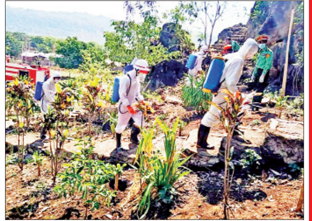
ကယားပြည်နယ် ဖရူဆိုမြို့နယ် ထီးပေါ်ဆိုကျေးရွာအုပ်စု ကဒါးလားဘုန်းတော်ကြီးကျောင်းဝင်းတွင် မေ ၁၁ ရက်က ကိုဗစ်-၁၉ ရောဂါ ကာကွယ်ရေး ပိုးသတ်ဆေးဖျန်းစဉ်။