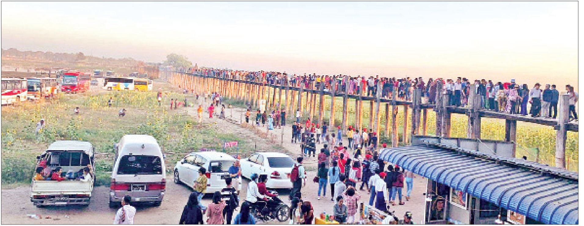
ပြည်တွင်း ပြည်ပ ခရီးသွားများ လာရောက်လည်ပတ်လျက်ရှိသည့် ဦးပိန်တံတားအား တွေ့ရစဉ်။

»» အထူးကဏ္ဍ [ ၁ ] မှ တွင် မန္တလေးလျှပ်စစ်ဓာတ်အားပေးရေး ကော်ပိုရေးရှင်းအနေဖြင့် (၄) နှစ်တာကာလ အတွင်း မန္တလေးတိုင်းဒေသကြီးအစိုးရအဖွဲ့ ရန်ပုံငွေကျပ်သန်း ၅၂၇၄၀ ဒသမ ၅၃၈ ဖြင့် ကျေးရွာပေါင်း ၂၉၇၆ ရွာ လျှပ်စစ်ဓာတ်အား ရရှိရေး ဆောင်ရွက်ခဲ့သည်။