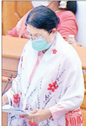
ဒုတိယဝန်ကြီး ဒေါက်တာမြလေးစိန်