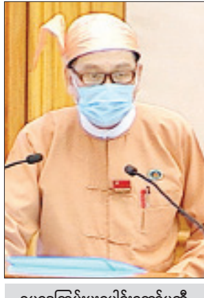
ဥပဒေကြမ်းပူးပေါင်းကော်မတီ တွဲဖက်အတွင်းရေးမှူး ဒေါက်တာမြတ်ဉာဏစိုး