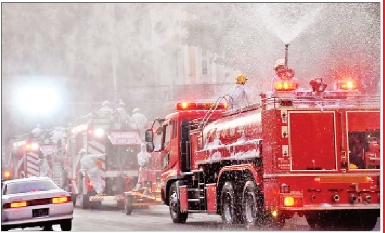
ရန်ကုန်မြို့ ကျောက်တံတားမြို့နယ်အတွင်း မေ ၁၁ ရက်က ကိုဗစ်-၁၉ ရောဂါ ကာကွယ်ရေး ပိုးသတ်ဆေးဖျန်းစဉ်။

နေပြည်တော် မေ ၁၈ သက်ဆိုင်ရာ တိုင်းစစ်ဌာနချုပ်အသီးသီးမှ တပ်မတော်သားများ၊ မီးသတ်တပ်ဖွဲ့ဝင်များ၊ ဌာန၊ အဖွဲ့အစည်းများပူးပေါင်း၍ ကိုဗစ်-၁၉ ရောဂါ ကာကွယ်ထိန်းချုပ်နိုင်ရေးအတွက် ပိုးသတ်ဆေးဖျန်းခြင်းလုပ်ငန်းများကို မေ ၁၁ ရက်က နေပြည်တော်၊ တိုင်းဒေသကြီး/ပြည်နယ်များမှ မြို့နယ် ၅၇ မြို့နယ်ရှိ နေရာ ၁၄၈ နေရာတွင် မီးသတ်ယာဉ်များ၊ မီးသတ်ပစ္စည်းကိရိယာများဖြင့် ဆောင်ရွက်ခဲ့ရာ ပိုးသတ်ဆေးရည် ၉၁ ဂါလန်၊ ပိုးသတ်ဆေးမှုန့် ၃၅ ကီလိုဂရမ်၊ ရေ ဂါလန် ၇၅၆၀ သုံးစွဲခဲ့ပြီး ပိုးသတ်ဆေးဖျန်းပေးခဲ့ကြောင်း သိရသည်။ အလားတူ မေ ၁၂ ရက်က နေပြည်တော်၊ တိုင်းဒေသကြီး/ပြည်နယ်များမှ မြို့နယ် ၄၆ မြို့နယ်ရှိ နေရာ ၁၀၉ နေရာတွင် မီးသတ်ယာဉ်များ၊ မီးသတ်ပစ္စည်းကိရိယာများဖြင့် ဆောင်ရွက်ခဲ့ရာ ပိုးသတ်ဆေးရည် ၆၆၀ ဂါလန်၊ ပိုးသတ်ဆေးမှုန့် ၂၆ ကီလိုဂရမ်၊ ရေဂါလန် ၁၁၀၆၀ သုံးစွဲခဲ့ပြီး ပိုးသတ်ဆေးဖျန်းပေးခဲ့ကြောင်း သိရသည်။ ထို့အတူ မေ ၁၃ ရက်က နေပြည်တော်၊ တိုင်းဒေသကြီး/ပြည်နယ်များမှ မြို့နယ် ၆၃ မြို့နယ်ရှိ နေရာ ၁၄၆ နေရာတွင် မီးသတ်ယာဉ်များ၊ မီးသတ်ပစ္စည်းကိရိယာများဖြင့် ဆောင်ရွက်ခဲ့ရာ ပိုးသတ်ဆေးရည် ၁၄၇ ဂါလန်၊ ပိုးသတ်ဆေးမှုန့် ၃၄ ကီလိုဂရမ်၊ ရေဂါလန် ၁၀၈၆၀ သုံးစွဲခဲ့ပြီး ပိုးသတ်ဆေးဖျန်းပေးခဲ့ကြောင်း သိရသည်။ ထို့အပြင် မေ ၁၄ ရက်က နေပြည်တော်၊ တိုင်းဒေသကြီး/ပြည်နယ်များမှ မြို့နယ် ၅၂ မြို့နယ်ရှိ နေရာ ၁၁၃ နေရာတွင် မီးသတ်ယာဉ်များ၊ မီးသတ်ပစ္စည်းကိရိယာများဖြင့် ဆောင်ရွက်ခဲ့ရာ ပိုးသတ်ဆေးရည် ၂၄၁ ဂါလန်၊ ပိုးသတ်ဆေးမှုန့် ၂၃ ကီလိုဂရမ်၊ ရေဂါလန် ၁၅၈၄၀ သုံးစွဲခဲ့ပြီး ပိုးသတ်ဆေးဖျန်းပေးခဲ့ကြောင်း သိရသည်။ သတင်းစဉ်