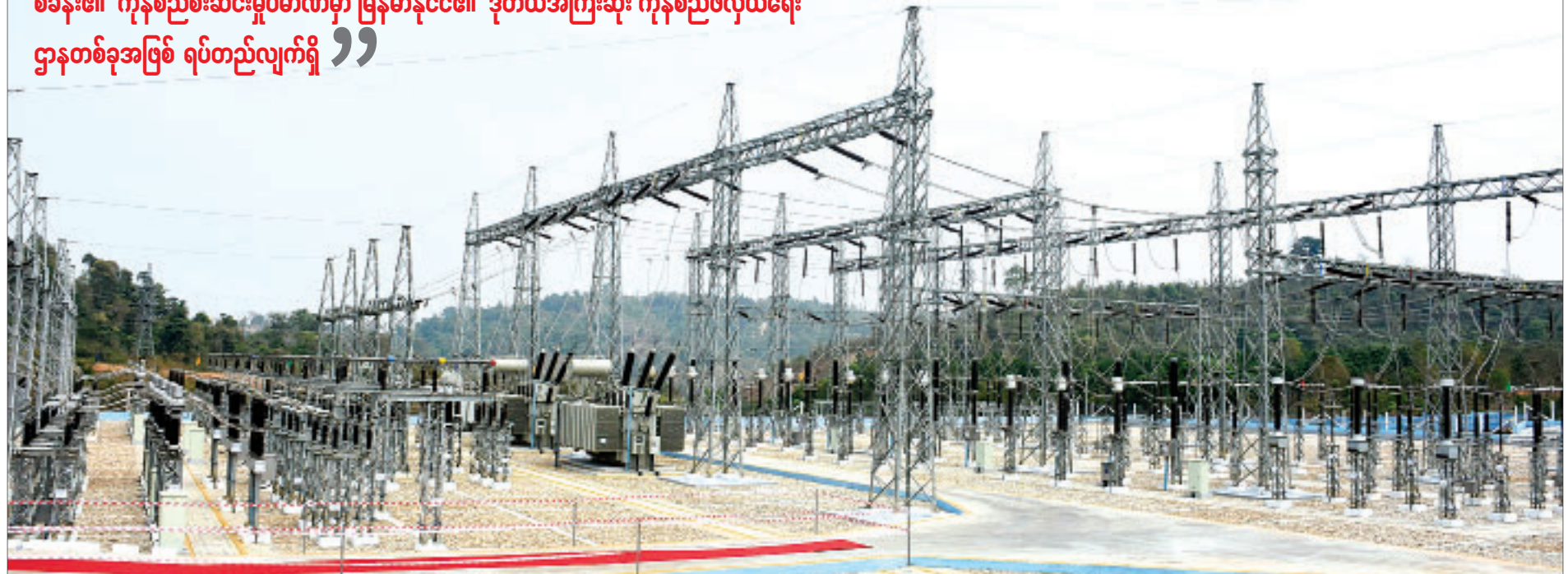
၂၀၁၆/၁၁ ကေစီ ၁၀၀ အမ်စီအေ မြဝတီပင်မဓာတ်အားခွဲရုံကို တွေ့ရစဉ်။

“ လမ်းပန်းဆက်သွယ်ရေးကောင်းမွန်မှု မြို့ပြ/ကျေးလက်ဒေသမကျန် ဖွံ့ဖြိုးတိုးတက်လာမည်ဖြစ်ရာ ကရင်ပြည်နယ်၏ အဓိကစီးပွားရေးလုပ်ငန်းတစ်ခုဖြစ်သည့် ကုန်သွယ်ရေးကဏ္ဍ ဖွံ့ဖြိုးတိုးတက်ရေးအတွက် အခြေခံကျသော လမ်းပန်းဆက်သွယ်ရေးကောင်းမွန်စေရန် ပြည်နယ်အစိုးရအဖွဲ့က ဦးစားပေးဆောင်ရွက်လျက်ရှိသည်။ မြဝတီမြို့နယ်စပ်ကုန်သွယ်ရေးစခန်း၏ ကုန်စည်စီးဆင်းမှုပမာဏမှာ မြန်မာနိုင်ငံ၏ ဒုတိယအကြီးဆုံး ကုန်စည်ဖလှယ်ရေးဌာနတစ်ခုအဖြစ် ရပ်တည်လျက်ရှိ ”