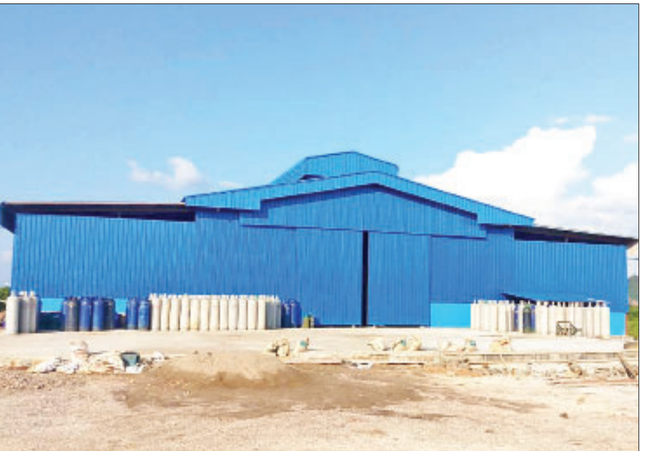
Kyaw 3 ကော်ပစ္စည်းမျိုးစုံ ထုတ်လုပ်ရေးလုပ်ငန်း အဆောက်အအုံကို တွေ့ရစဉ်။