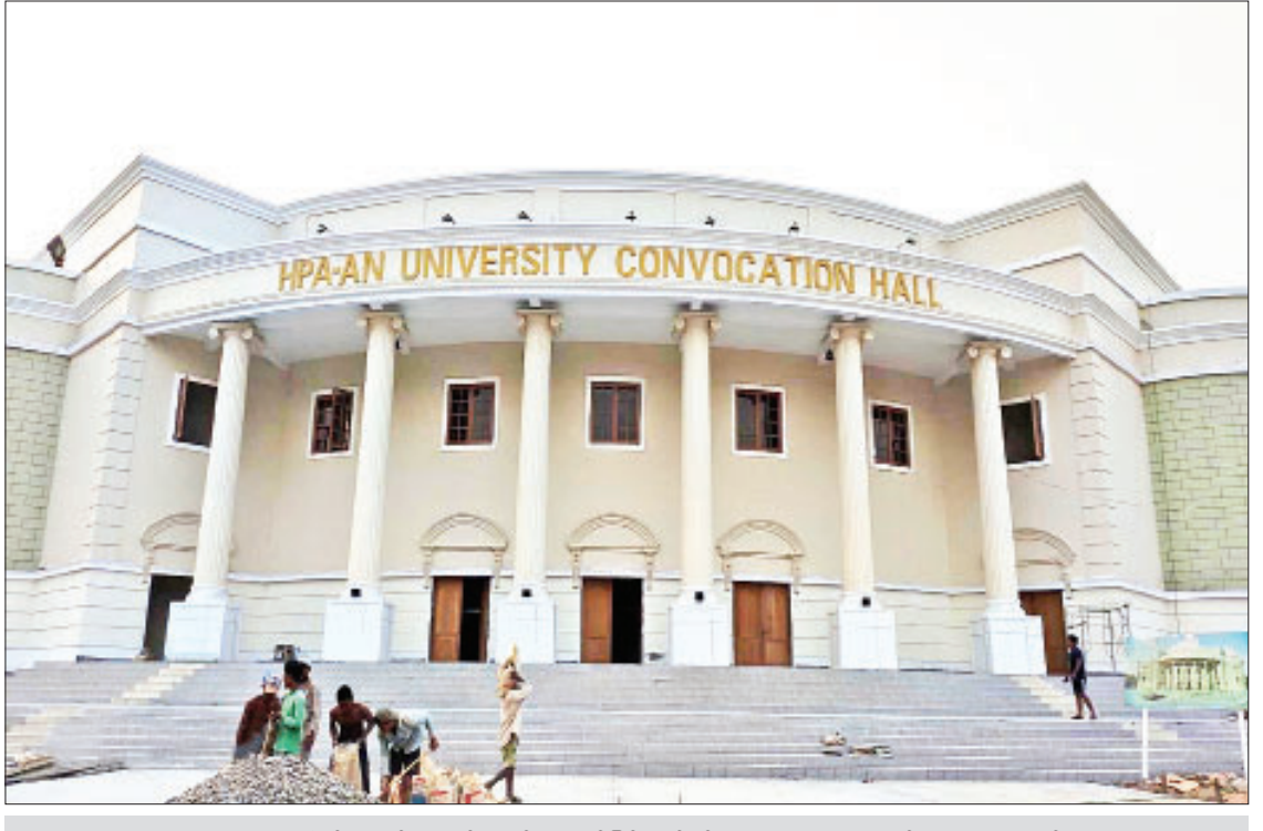
ဘားအံတက္ကသိုလ် ဘွဲ့နှင်းသဘင် တည်ဆောက်ခြင်းလုပ်ငန်းအား ၂၂-၂၀၂၀ ရက်နေ့က တွေ့ရစဉ်။

တိုးတက်လာသော ခရီးသွားလုပ်ငန်း ကဏ္ဍနှင့်အညီ ဝန်ဆောင်မှုကောင်းများကို ပိုမိုနိုင်ရန်ရည်ရွယ်၍ ဟိုတယ်ဝန်ဆောင်မှု