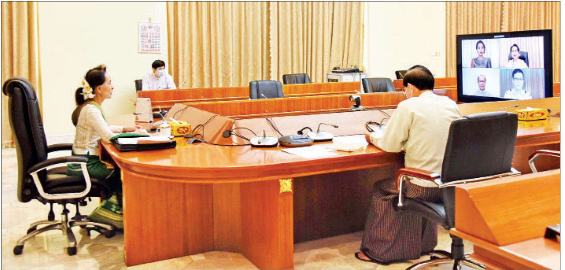
Coronavirus Disease 2019 (COVID- 19) ကာကွယ်၊ ထိန်းချုပ်၊ ကုသရေး အမျိုးသားအဆင့်ဗဟိုကော်မတီဥက္ကဋ္ဌ နိုင်ငံတော်၏အတိုင်ပင်ခံပုဂ္ဂိုလ် ဒေါ်အောင်ဆန်းစုကြည် Public Transportation and COVID-19 Prevention ကဏ္ဍတွင် ပါဝင်ဆောင်ရွက်နေသည့်တာဝန်ရှိသူများနှင့် အပြန်အလှန် ဆွေးနွေးစဉ်။

◆ ရှေ့ဖို့မှ လက်ရှိပြေးဆွဲနေသည့် မီးရထားများ ကောင်းသည်ထက်ကောင်းအောင် ဆောင်ရွက်နေမှု၊ လေအိတ်ရထားများ ပြေးဆွဲနေမှု၊ မြို့ပတ်ရထားများ၊ ခရီးဝေး ရထားများ ပြေးဆွဲပေးနေမှု၊ ရထားစီးနင်းသည့် ခရီးသည်များ COVID-19 ရောဂါ ကူးစက်ပြန့်ပွားမှုမရှိအောင် အသိပညာပေးခြင်း၊ အသိပညာပေးမှု ညွှန်ကြားချက် များနှင့်အညီ ဆောင်ရွက်စေခြင်း၊ လိုအပ်သည့်လက်ဆေးရည်၊ လက်ဆေး ဘေစင်များ ဆောင်ရွက်ထားမှု၊ ဘူတာ၊ မီးရထားပေါ်နှင့် ဈေးသည်များ ဈေးရောင်းချရာတွင် အန္တရာယ်ကင်းရှင်းရေး ကြပ်မတ်စစ်ဆေးဆောင်ရွက်မှု တို့ကိုလည်းကောင်း ရှင်းလင်းတင်ပြကြရာ နိုင်ငံတော်၏အတိုင်ပင်ခံပုဂ္ဂိုလ်က နိုင်ငံတော်အစိုးရမှ ဖြည့်ဆည်းဆောင်ရွက်ပေးရမည့် ကိစ္စရပ်များနှင့်စပ်လျဉ်း၍ ရေတို၊ ရေရှည်ကြည့်၍ စဉ်းစားစီစဉ်ဆောင်ရွက်ပေးသွားမည့် အခြေအနေများကို ရှင်းလင်းပြောကြားသည်။