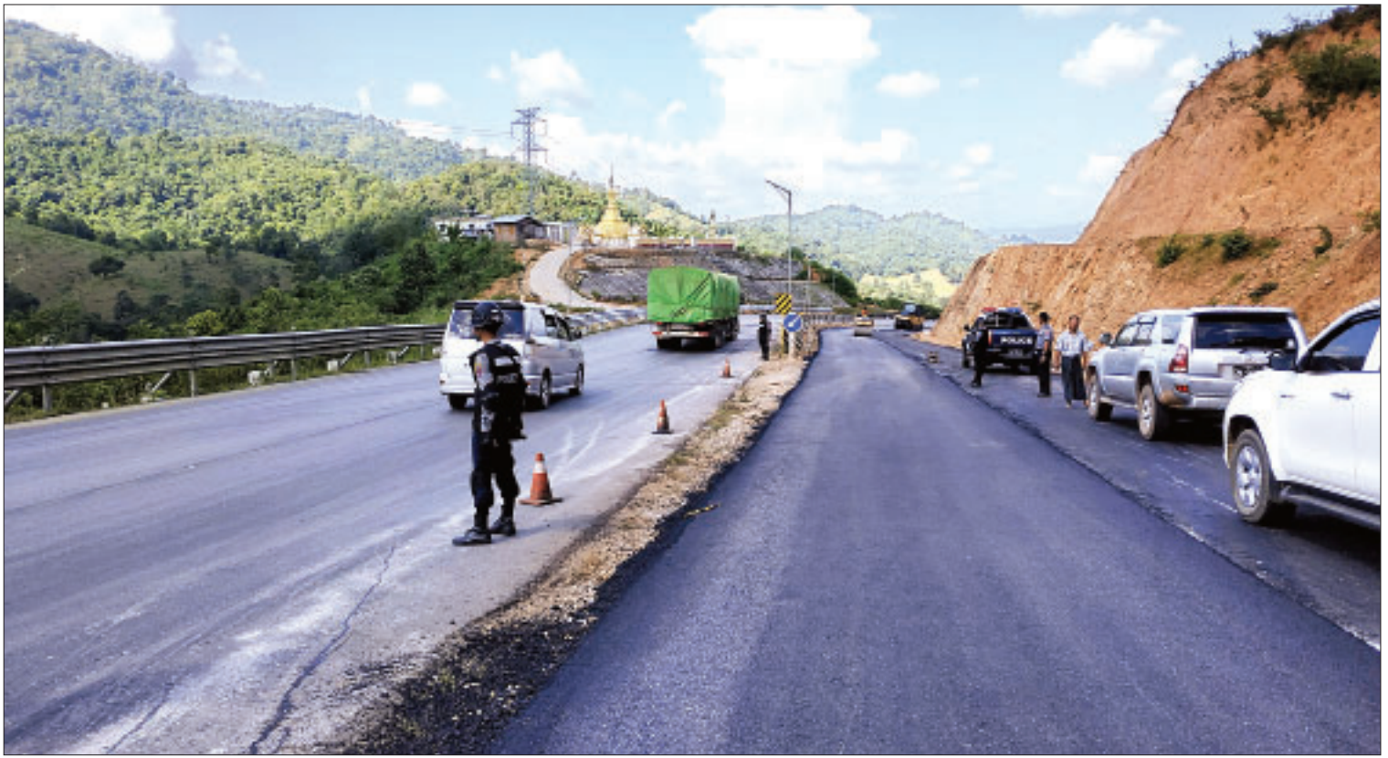
သထုံ-ဘားအံ-ကော့ကရိတ်-မြဝတီလမ်း(အာရှလမ်း)နိုင်ငံလွန်ကတ္တရာထပ်ပိုးလွှာခင်းနေမှုကို တွေ့ရစဉ်။

လေးနှစ်တာကာလအတွင်း ဇာသပြင်- အိန္ဒိယလမ်း၊ မုဒုံ-မြဝတီ (မဲသရော-လှိုင်ကွယ် အပိုင်း)လမ်း၊ ကြာအင်းဆိပ်ကြီး-တဂေး- ခုတ်ခွား-ကျိုက်ဒုံလမ်း၊ ကြာအင်းဆိပ်ကြီး- ချောင်းဆုံ(ဘုရားသုံးဆူ)လမ်း၊ တံတားအနေ ဖြင့် မုဒုံ - မြဝတီလမ်းပေါ်ရှိ လှိုင်ကွယ်ချောင်း ကူးတံတား၊ သံဖြူဇရပ်-ဘုရားသုံးဆူလမ်းပေါ် ရှိ ဇမိချောင်းတံတား၊ အနန်းကွင်းတံတား၊ ဆင်ပြေးချောင်းတံတား၊ မက္ကသာချောင်း တံတားနှင့် ဖာပွန် - ကမမောင်း-ဝါးတိုးတော