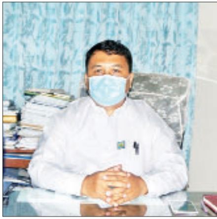
ဒေါက်တာကျော်မိုးဦး ညွှန်ကြားရေးမှူးချုပ်

“မုန်တိုင်းဆိုတာ မုန်တိုင်းနဲ့ ဆက်စပ်နေပါတယ်။ ယခင်က မုန်တိုင်းက သူ့ဘာသာသူဝင်လာတယ်။ မုန်တိုင်းဝင်ပြီဆိုရင် အိန္ဒိယဘက်ကို ဖြတ်ပြီးတော့ တိုက်တဲ့လေက အားကောင်းလာတယ်။ ခုနောက်ပိုင်းနှစ်တွေကို ပြန်ကြည့်မယ်ဆိုရင် အိန္ဒိယဘက်ကို ဖြတ်တိုက်တဲ့လေက အားမကောင်းတော့ဘူး။ အားမကောင်းတဲ့အတွက် မုန်တိုင်းအတွက်ကို မုန်တိုင်းတွေက ဆွဲပြီးခေါ်လာတယ်။ ဒီနှစ်မှာလည်း မုန်တိုင်းမဖြစ်ဘူးဆိုရင် မုန်တိုင်းနောက်ကျမယ့်အနေအထား ရှိတယ်။ လက်ရှိမုန်တိုင်းဖြစ်လာတဲ့အတွက် မုန်တိုင်းက ယခင်ခန့်မှန်းထားတဲ့ မေ ၁၆ ရက်ကနေ ၂၁ ရက်အတွင်းမှာ မြန်မာနိုင်ငံတောင်ပိုင်းကို စတင်ဝင်ရောက်မယ့်အခြေအနေရှိပါတယ်။ တကယ်လို့ မုန်တိုင်းဝင်လာမယ်ဆိုရင် ရွေ့ပြောင်းရလွယ်ကူအောင်လည်း ယခုအချိန်ကတည်းက