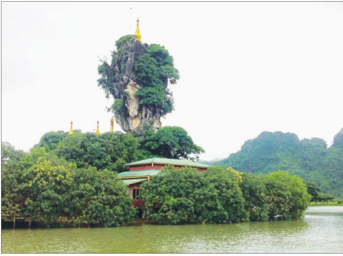
ပြည်တွင်း ပြည်ပ ခရီးသွားစဉ်သည်များအား ဆွဲဆောင်လျက်ရှိသည့် ဘားအံမြို့မှ သမိုင်းဝင် ကျောက်ကလပ်စေတီတော်။

ထို့ပြင် ဘားအံကွန်ပျူတာတက္ကသိုလ်တွင် ဆရာ/ဆရာမများနှင့် ကျောင်းသား ကျောင်းသူများနေထိုင်နိုင်ရန်အတွက် လေးခန်းတွဲ လေးထပ်ဆောင် အရာထမ်းအိမ်ရာ၊ လေးခန်းတွဲ လေးထပ်ဆောင် အမှုထမ်းအိမ်ရာနှင့် ကျောင်းသူကျောင်းသား ၁၀၀ ဆံ့ အိမ်ဆောင် အဆောက်အအုံ၊ အစိုးရနည်းပညာ အထက်တန်းကျောင်း (ဘားအံ)တွင် RC နှစ်ထပ်စာသင်ဆောင်၊ (၁၅) x ၃၄) ပေ Student Dormitory R.C.C. Building ၊ (၁၉) x ၃၈) ပေရှိ RC သုံးထပ်စာသင်ဆောင်၊ (၁၀၀ x ၄၀) ပေရှိ သံကူကွန်ကရစ် လေးထပ်ကျောင်းသား ကျောင်းသူအဆောင်နှင့် (၁၂၀ x ၄၀) ပေရှိ သံကူကွန်ကရစ် ခြောက်ခန်းတွဲ ဆရာ ဆရာမအဆောင်၊ အစိုးရနည်းပညာ အထက်တန်းကျောင်း (သံတောင်ကြီး) တွင် (၁၉) x ၃၈) ပေရှိ RC သုံးထပ်စာသင်ဆောင်၊