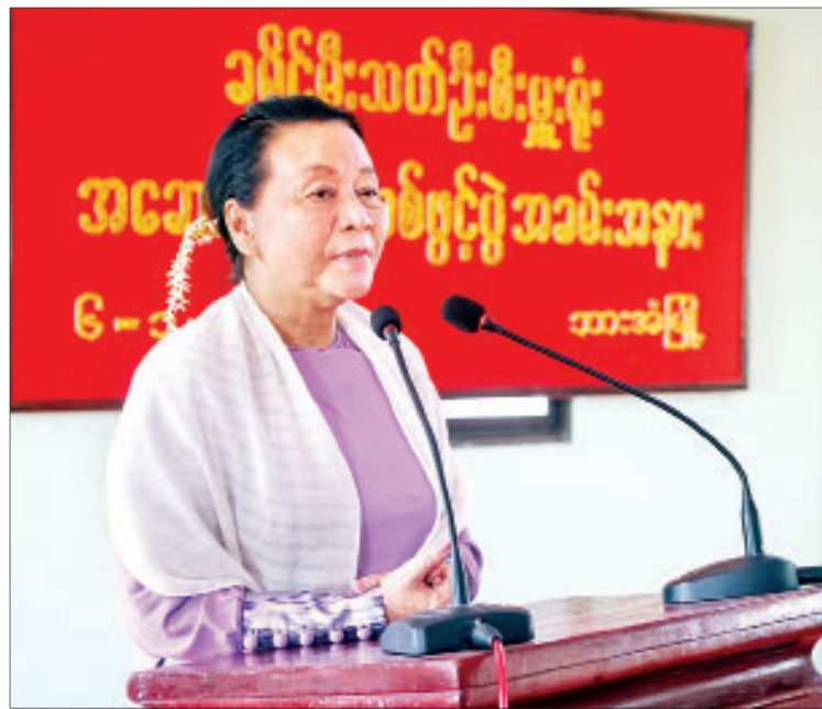
ကရင်ပြည်နယ်ဝန်ကြီးချုပ် ဒေါ်နန်းခင်ထွေးမြင့်

ဘားအံမြို့၏ တောင်ဘက် ၇ မိုင်ခန့်အကွာတွင် တည်ရှိသည့် ဇွဲကပင်တောင်သည် နိုင်ငံတကာခရီးသွားများ စိတ်ဝင်တစားလာရောက်လေ့လာ လည်ပတ်ရာနေရာတစ်ခုဖြစ်သည်။ ဇွဲကပင်တောင်သည် ပင်လယ်ရေမျက်နှာပြင်အထက် ၂၃၇၂ ပေမြင့်ပြီး ကရင်ပြည်နယ်၏ အမှတ်အသားတစ်ခုဖြစ်သည်။ ဇွဲကပင်တောင်သို့ တက်ရန်နှင့် ဆင်းရန်အတွက် ခလောက်နီကျေးရွာဝင်ပေါက်နှင့် လုမ္ဗီနီဥယျာဉ်ဝင်ပေါက်ဟူ၍ရှိပြီး လုမ္ဗီနီဥယျာဉ်ဝင်ပေါက်သည် သံလွင်တံတားနှင့် နီးသောကြောင့် ခရီးသွားအများဆုံးဝင်ရောက်လေ့ရှိသည်။