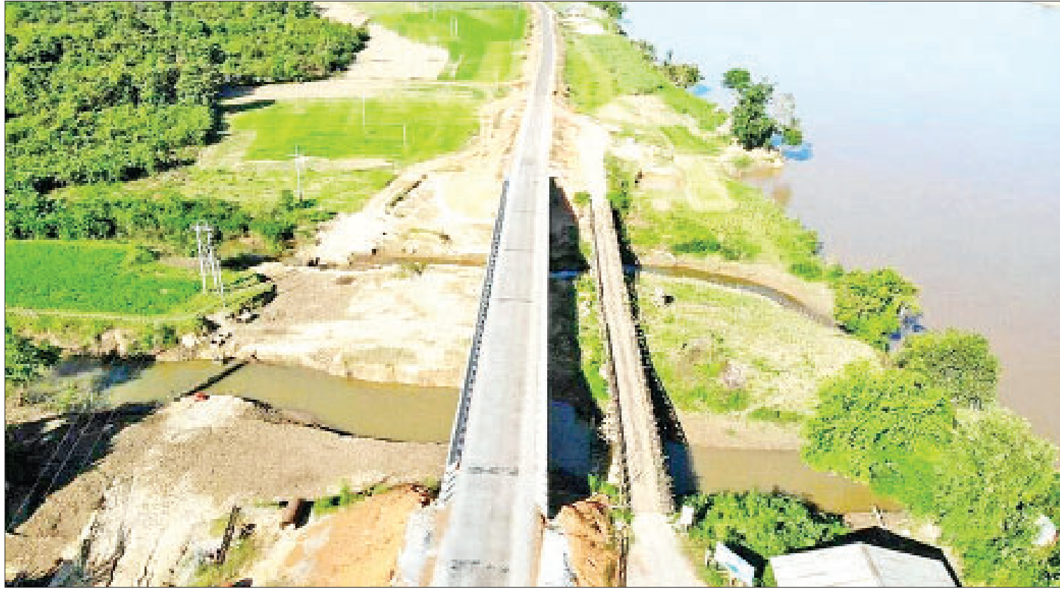
ဖာပွန်-ကမမောင်း-ဝါးတိုးတောလမ်းပေါ်ရှိ အရှည်ပေ ၃၀၀ ရှိသည့် ချောင်းညီနောင်တံတားအား တွေ့ရစဉ်။

ကရင်ပြည်နယ် ပိုင်ကျုံမြို့နှင့် ပတ်ဝန်းကျင် ကျေးရွာများ ဓာတ်အားဖြန့်ဖြူးပေးနိုင်ရန် အတွက် လှိုင်းဘွဲ့ (ချမ်းသာ)-ပိုင်ကျုံ ၃၃ ကေစီဓာတ်အားလိုင်း ၁၉ မိုင်နှင့် ၃၃ ကေစီ Outgoing Switch (2)Set Incoming Switch Bay (1)Set နှင့် ပိုင်ကျုံတွင် ၃၃/၁၁ ကေစီ/၅ အမိဗီအေ ဓာတ်အားခွဲရုံတစ်ရုံကို ၂၀၁၉-၂၀၂၀