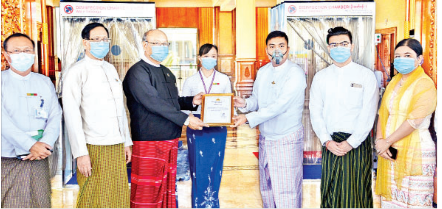
အမျိုးသားလွှတ်တော်ဥက္ကဋ္ဌ မန်းဝင်းခိုင်သန်း စိုးလျှပ်စစ်ဖောင်ဒေးရှင်းဥက္ကဋ္ဌ ဦးကျော်မင်းထွန်းအား ဂုဏ်ပြုမှတ်တမ်းလွှာပေးအပ်စဉ်။

နေပြည်တော် မေ ၁၅ အမျိုးသားလွှတ်တော်ရုံးတွင် အသုံးပြုရန် အတွက် Coronavirus Disease 2019 (COVID-19) ကာကွယ်ရေးအထောက်အကူပြု ပစ္စည်း Auto Disinfection Passage System ဖြင့် အလိုအလျောက် ဆေးဖျန်းပေးသည့် စက်များ ပေးအပ်လှူဒါန်းပွဲ အခမ်းအနားကို ယနေ့ နံနက် ၁၀ နာရီတွင် နေပြည်တော်ရှိ အမျိုးသားလွှတ်တော် ဧည့်ခန်းမဆောင်၌ ကျင်းပသည်။