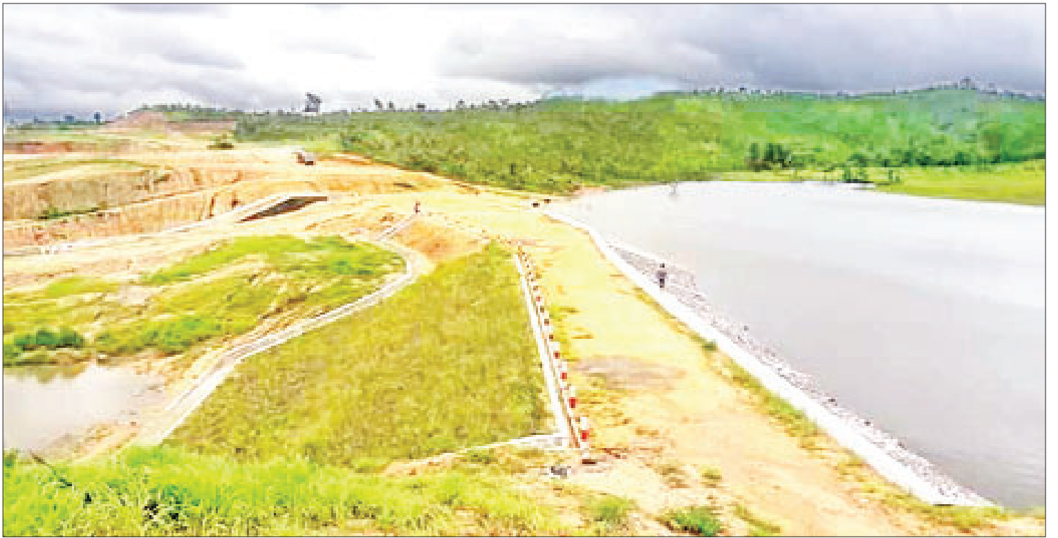
ဘားအံမြို့နယ် နောင်လုံ-နတ်ကျွန်းမြောင်းမကြီး ဆဒွန်ဂူအနီး မြောင်းကူးတံတားနှင့် ရေထိန်းတံခါးတည်ဆောက်ခြင်းလုပ်ငန်းဆောင်ရွက်ပြီးစီးမှုကို တွေ့ရစဉ်။

လူထုဗဟိုပြုလုပ်ငန်းများ ဆောင်ရွက် ကရင်ပြည်နယ်သည် (၄)နှစ်တာကာလ အတွင်း လုပ်ငန်းများ အကောင်အထည်ဖော် ဆောင်ရွက်ရာတွင် တိုးတက်ပြောင်းလဲလာ သည့်နှင့်အမျှ ပြည်သူတို့၏ အကျိုးစီးပွား ဖွံ့ဖြိုး တိုးတက်လာမှုအပေါ် သက်ရောက်မှုရှိသည့် လူထုဗဟိုပြုစီမံကိန်းကို အကောင်အထည်ဖော် ဆောင်ရွက်လျက်ရှိရာ ကရင်ပြည်နယ် ကြာအင်းဆိပ်ကြီးမြို့နယ်ရှိ ကျေးရွာ ၅၀ တွင် စီမံကိန်းထောက်ပံ့ငွေကျပ် ၁၀၀၅၉ သန်းဖြင့် လမ်း/တံတားလုပ်ငန်း ၄၂၂ ခု၊ ရေရရှိရေး လုပ်ငန်း ၁၇၀ ခု၊ စာသင်ကျောင်း တိုးချဲ့/ ပြင်ဆင်ခြင်းလုပ်ငန်း ၂၂၆ ခု၊ မီးလင်းရေးလုပ်ငန်း ၁၃ ခု၊ ကျန်းမာရေးအဆောက်အအုံလုပ်ငန်း ၄၂ ခု၊ ကျေးရွာအစည်းအဝေးခန်းမ ၃၂ ခုနှင့် အခြားလုပ်ငန်း သုံးခုကို ပြည်နယ်အစိုးရ အဖွဲ့က အကောင်အထည်ဖော်တည်ဆောက်