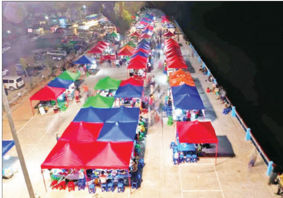
ဘားအံမြို့ ကမ်းနားလမ်း ညဈေးတန်းအား တွေ့ရစဉ်။

ကရင်ပြည်နယ်အစိုးရအနေဖြင့် (၄)နှစ်တာကာလအတွင်း ပြည်သူများအတွက် အချိန်တိုအတွင်း ထိရောက်သည့် လုပ်ငန်းများကို ဖော်ဆောင်ပေးခဲ့သည့်အပြင် ရေရှည်ဖွံ့ဖြိုးတိုးတက်ရေးအစီအမံများကို ချမှတ်အကောင်အထည်ဖော်လျက်ရှိရာ မကြာမီကာလအတွင်း ဒေသခံတိုင်းရင်းသားပြည်သူများ၏ မျှော်လင့်ချက်များကို ဖော်ဆောင်ပေးနိုင်တော့မည်ဖြစ်ကြောင်း ရေးသားတင်ပြလိုက်ပါသည်။