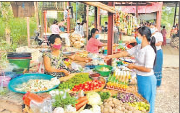
ရွှေမိုး (ပြန်/ဆက်)

သံသယဖြစ်ဖွယ် ရောဂါလက္ခဏာများ၊ အနုပညာရှင် များ၏ ရင်တွင်းစကားသံများ အစရှိသည့် ကိုဗစ်-၁၉ ရောဂါနှင့်ပတ်သက်၍ ကြိုတင်ကာကွယ်ရေး အကြောင်းအရာများ၊ သိရှိလိုက်နာဆောင်ရွက်ဖွယ် အကြောင်းအရာများကို ထည့်သွင်းဖော်ပြထား ကြောင်း သိရသည်။