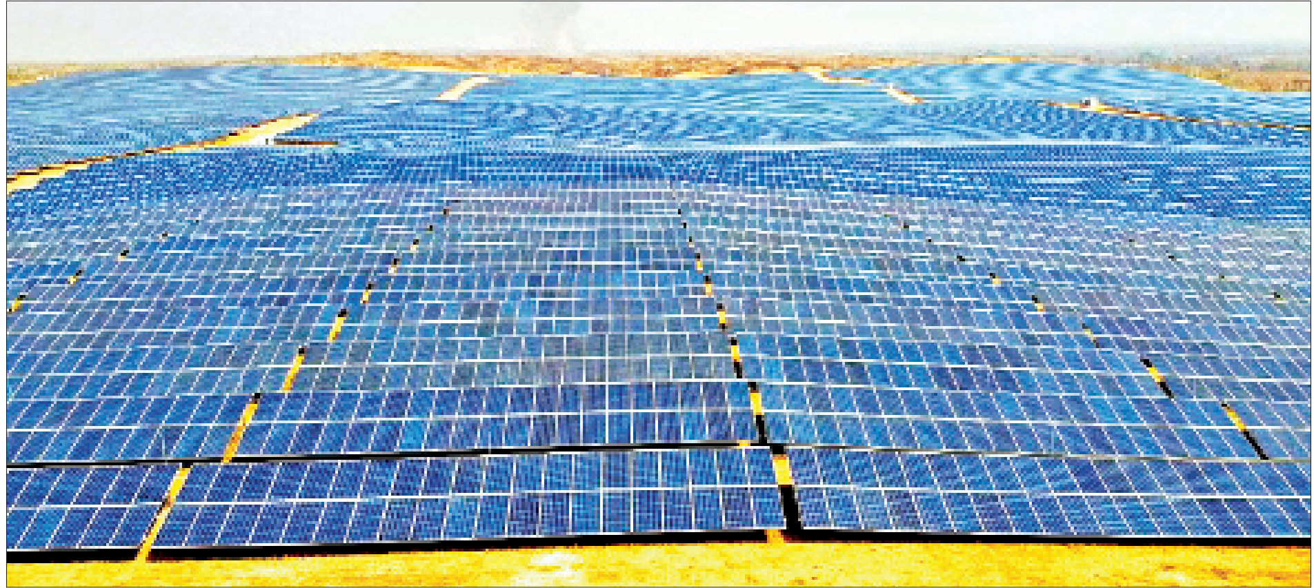
နေရောင်ခြည်စွမ်းအင်သုံး ဓာတ်အားပေးစက်ရုံ(မင်းဘူး)ကို တွေ့ရစဉ်။