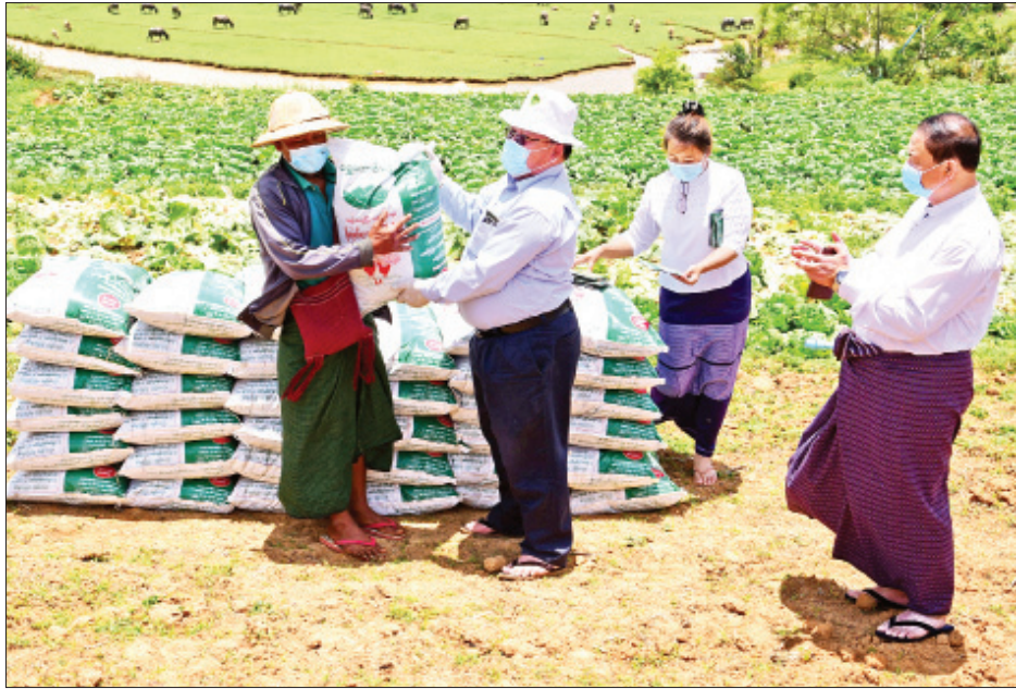
ယင်းနောက် ပြည်နယ်ဝန်ကြီးနှင့် တာဝန်ရှိသူများက ကလောမြို့နယ် မြင်းမထိကျေးရွာရှိ ဂေါ်ဖီ၊ မုန်ညင်း စိုက်ပျိုးသည့် တောင်သူများအား ဟင်းသီးဟင်းရွက် မျိုးကောင်းမျိုးသန့်မျိုးစေ့များ၊ သဘာဝမြေဩဇာများနှင့် စိုက်ပျိုးရေးနည်းပညာပေး လက်ကမ်းစာစောင်များအား

ဟဲဟိုး မေ ၁၄ ကိုဗစ်-၁၉ ရောဂါ ဖြစ်ပွားနေစဉ်ကာလအတွင်း ဂေါ်ဖီ၊ မုန်ညင်း စသည့်သီးနှံဈေးကွက်များ ဝယ်လိုအားနှင့် ဈေးကွက်ကျဆင်းနေမှုကြောင့် ဒေသခံတောင်သူများ၏ အကျပ်အတည်းဖြစ်ပေါ်နေမှုအပေါ် ကြုံတွေ့နေရသော အခက်အခဲပြဿနာများ၊ ဖြေရှင်းဆောင်ရွက်ရမည့် နည်းလမ်းများ၊ ဆန်၊ ဆီ၊ ကြက်ဥနှင့် ဟင်းသီးဟင်းရွက် မျိုးကောင်းမျိုးသန့် မျိုးစေ့များနှင့်စပ်လျဉ်း သည့် ဆွေးနွေးပွဲကို ယနေ့ နံနက်ပိုင်းက ဟဲဟိုးမြို့ ကော်ဖီနှင့် သီးနှံစုဖွဲ့ရုံး၌ ကျင်းပသည်။