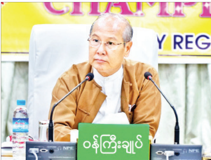
မကွေးတိုင်းဒေသကြီး ဝန်ကြီးချုပ် ဒေါက်တာအောင်မိုးညို

တိုင်းဒေသကြီး အစိုးရအဖွဲ့အနေဖြင့် ၂၀၁၈-၂၀၁၉ ခုနှစ်တွင် ၁၈ ဒသမ ၄ ဘီလီယံ