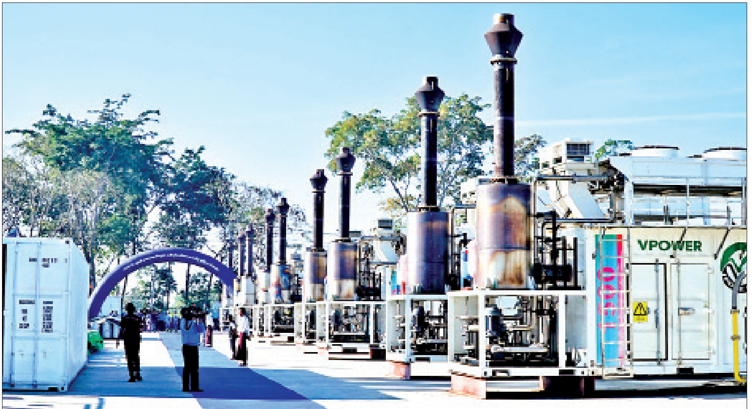
သဘာဝဓာတ်ငွေ့သုံး လျှပ်စစ်ဓာတ်အားပေးစက်ရုံကို တွေ့ရစဉ်။

ပညာရေးကဏ္ဍ တိုင်းဒေသကြီးအစိုးရအနေဖြင့် ဒေသ တွင်းပြည်သူများ၏ လူမှုစီးပွားတိုးတက်ရေး အတွက် ကြိုးပမ်းဆောင်ရွက်သကဲ့သို့ တိုင်းဒေသကြီးအတွင်း ပညာရေးအဆင့် အတန်း တိုးတက်ကောင်းမွန်စေရန်အတွက် အားထုတ်ဆောင်ရွက်လျက်ရှိသည်။ တိုင်းဒေသကြီးအတွင်း ကျောင်းအဆင့်