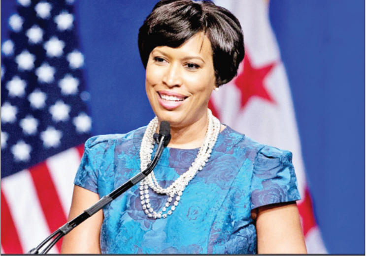
ဝါရှင်တန်ဒီစီ မြို့တော်ဝန် မျူရယ်ဘော်ဆာ

ကူးစက်ခံရသူမရှိစေရန် မျှော်လင့်ထားသော်လည်း လေးရက်ဆက်တိုက်အထိသာ ကူးစက်ခံရသူမရှိခဲ့ကြောင်း မြို့တော်ဝန် မျူရယ်ဘော်ဆာက ဆိုသည်။ ပြောင်းလဲသတ်မှတ်ခဲ့ ခရီးသွားလာခွင့်ကန့်သတ်ချက်များကို မေ ၁၅ ရက်အထိသာ ချမှတ်မည်ဟု ယခင်ကကြေညာခဲ့သော်လည်း ဗိုင်းရပ်စ်ကူးစက်မှုနှုန်းများ ဆက်လက်မြင့်တက်လျက်ရှိသည့်အတွက် ဇွန် ၈ ရက်သို့ ပြောင်းလဲသတ်မှတ်ခဲ့ခြင်းဖြစ်သည်။ ဝါရှင်တန်ဒီစီတွင် ဗိုင်းရပ်စ်ကူးစက်ခံရသူ ၆၅၈၄ ဦးရှိပြီး သေဆုံးသူ ၃၅၀ ရှိကြောင်း ဒေသန္တရအစိုးရအဖွဲ့က အတည်ပြုပြောကြားခဲ့သည်။ ကိုးကား-အင်န်အိတ်ချ်ကော့ဘာသာပြန်-အောင်ကျော်ကျော်