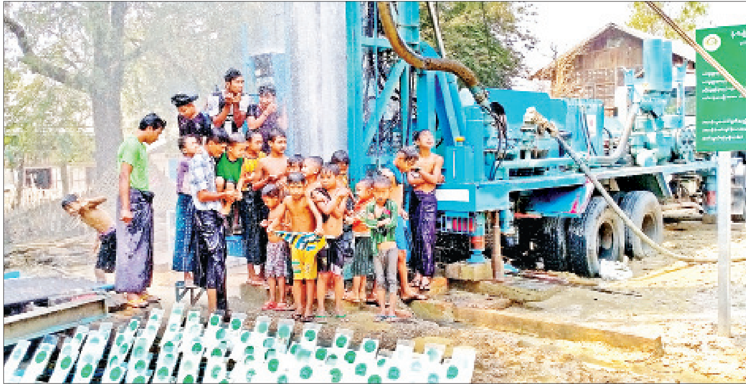
ရေစိုက်မြို့နယ်တွင် ကျေးလက်ရေရရှိရေးဆောင်ရွက်ပေးမှုကို တွေ့ရစဉ်။

e-Government လုပ်ငန်းများ အကောင်အထည်ဖော်မှု မကွေးတိုင်းဒေသကြီး အစိုးရအဖွဲ့သည် e-Government လုပ်ငန်းများ အကောင် အထည်ဖော် ဆောင်ရွက်နိုင်ရန်အတွက် ၂၀၁၈ ခုနှစ်မှစတင်၍ သင်တန်းများကို ဖွင့်လှစ် ပေးခဲ့ရာ ၂၀၂၀ ပြည့်နှစ်တွင် e-Government အခြေခံသင်တန်း၊ Web-content သင်တန်း အထူးကဏ္ဍ [ ၁ ] သို့ »»