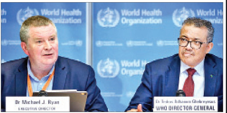
ကမ္ဘာ့ဒေသအများအပြားတွင် ဆက်လက်မြင့်တက်နေ သတိပေးပြောကြားခဲ့သည်။ ကိုးကား-ဘီဘီစီ၊ ဦးမည်ဖြစ်ကြောင်းလည်း ဒေါက်တာ မိုက်ကယ်ရိုင်ယန်က အင်န်အိတ်ချ်ကော့ ဘာသာပြန်-အလင်းသစ်

အိတ်ချ်အိုင်ဗီသည် အချိန်ကြာမြင့်စွာဆက်လက်ရှိ နေခြင်းကို ထောက်ပြလျက် ကာကွယ်ဆေးထုတ်လုပ် ရာတွင် နိုင်ငံတကာပူးပေါင်းဆောင်ရွက်ခြင်း၏ အရေးပါမှု ကိုလည်း ကမ္ဘာ့ကျန်းမာရေးအဖွဲ့၏ ကျန်းမာရေးဆိုင်ရာ အရေးပေါ်အခြေအနေအစီအစဉ်ညွှန်ကြားရေးမှူး ဒေါက်တာ မိုက်ကယ်ရိုင်ယန်က အလေးထားပြောကြားခဲ့သည်။ ထို့ပြင် ကိုရိုနာဗိုင်းရပ်စ်ကူးစက်မှုအန္တရာယ်သည်