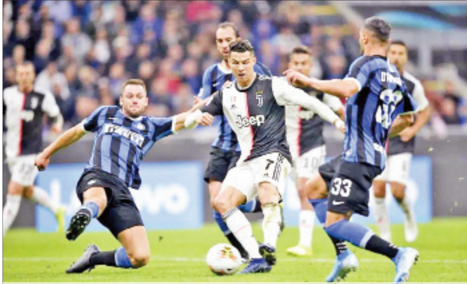
၂၀၁၉ ခုနှစ် အောက်တိုဘာလက ဂျူဗင်တပ်အသင်းနှင့် အင်တာမီလန်အသင်းတို့ ယှဉ်ပြိုင်ကစားမှုကို တွေ့ရစဉ်။

အီတလီစီးရီးအေကလပ်အသင်းတွေဟာ လာမယ့် တစ်ပတ်ထဲမှာ အသင်းလိုက်လေ့ကျင့်ရေးအစီအစဉ်တွေ စတင်လုပ်ဆောင်ဖို့ စီစဉ်နေတာလည်းဖြစ်ပါတယ်။ အီတလီ နိုင်ငံဟာ ကိုရိုနာဗိုင်းရပ်စ်ကူးစက်မှုတွေကြောင့် ထိခိုက်ခဲ့ရ