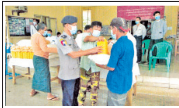
မေ ၁၁ ရက်က ရန်ကုန်မြောက်ပိုင်း ခရိုင် မှော်ဘီမြို့နယ် မြောင်းတကာ စက်မှုဇုန်တွင်နေထိုင်သည့် စက်ရုံ လုပ်သား အိမ်ထောင်စု ၂၂၆၀ အတွက် ဆန် (၆) ပြည်၊ ဆီ (၁) ဝိသာ၊ ပဲ (၁) ဝိသာစီအား စက်မှု ဇုန်ကြီးကြပ်မှု ကော်မတီဝင်များ၊ မှော်ဘီမြို့နယ် ရဲတပ်ဖွဲ့မှူး ရဲမှူး ကောင်းသိန်းထွန်းနှင့် အလှူရှင်များ က လှူဒါန်းစဉ်။