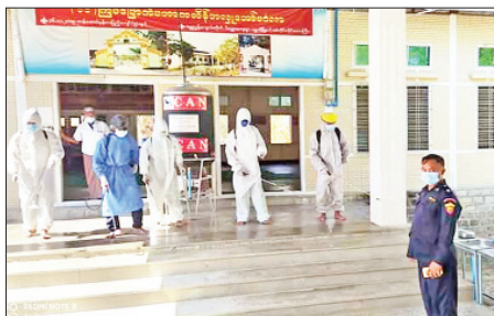
စစ်ကိုင်းတိုင်းဒေသကြီး ရွှေဘိုမြို့နယ် ပိတ္တောက်ကျေးရွာ စုမ္မာညွန့် (အလယ်) ကျောင်းတိုက်တွင် မေ ၇ ရက်က ကိုဗစ်-၁၉ ရောဂါ ကာကွယ်ရေး ပိုးသတ်ဆေးဖျန်းစဉ်။