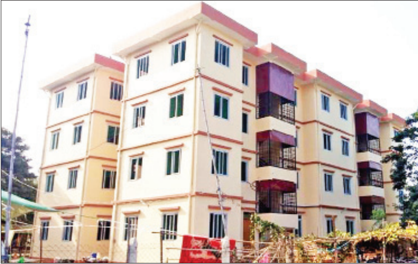
၃၁-၃-၂၀၁၉ ရက်နေ့တွင် ဆောက်လုပ်ပြီးစီးခဲ့သည့် မုံရွာမြို့ ပြည်သူ့အဖွဲ့အစည်းအိမ်ရာကို တွေ့ရစဉ်။

သယ်ဇာတနှင့် သဘာဝပတ်ဝန်းကျင် ထိန်းသိမ်းရေးဝန်ကြီးဌာနရဲ့ ဧရိယာတိုင်းတာ အထူးကဏ္ဍ [ ၁ ] သို့ >>>