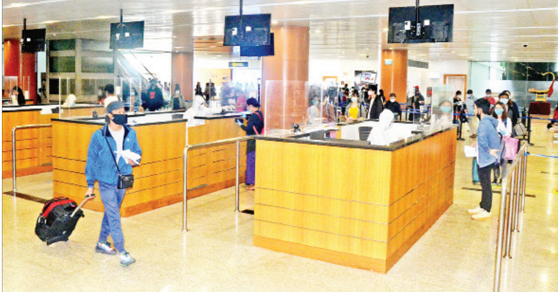
စင်ကာပူနိုင်ငံမှ ပြန်လည်ရောက်ရှိလာသည့် မြန်မာနိုင်ငံသားများအား ရန်ကုန်အပြည်ပြည်ဆိုင်ရာလေဆိပ်၌ တွေ့ရစဉ်။

နေပြည်တော် မေ ၁၃ နိုင်ငံတကာခရီးသည်တင်လေယာဉ်များ ပုံသန့်မှုယာယီရပ်ဆိုင်းထားခြင်းကြောင့် စင်ကာပူနိုင်ငံတွင် အခက်အခဲကြုံတွေ့နေရသည့် မြန်မာနိုင်ငံသား ၁၄၅ ဦးအား မြန်မာအမျိုးသားလေကြောင်းလိုင်း (Myanmar National Airlines-MNA) ကယ်ဆယ်ရေးလေယာဉ်ဖြင့် တတိယအသုတ်အဖြစ် ပြန်လည်ခေါ်ဆောင်ခဲ့ရာ ယနေ့ညနေ ၃ နာရီ ၁၅ မိနစ်တွင် ရန်ကုန်အပြည်ပြည်ဆိုင်ရာလေဆိပ်သို့ အဆင်ပြေချောမွေ့စွာ ပြန်လည်ရောက်ရှိကြသည်။ တာဝန်ယူဆောင်ရွက် ၎င်းတို့ ရန်ကုန်အပြည်ပြည်ဆိုင်ရာလေဆိပ်သို့ ရောက်ရှိချိန်တွင် လူဝင်မှုကြီးကြပ်ရေး၊ ကျန်းမာရေးစစ်ဆေးရေးနှင့် ကျန်းမာရေးနှင့် အားကစားဝန်ကြီးဌာနမှ ထုတ်ပြန်ကြေညာထားသည့် သတ်မှတ်ချက်များနှင့်အညီ သီးခြားသတ်မှတ်ပေးထားသည့်နေရာ သို့မဟုတ် သတ်မှတ်ဟိုတယ်များ၌ ၂၁ ရက်တာ အသွားအလာ ကန့်သတ်နေထိုင်ရေးတို့ကို စာမျက်နှာ ၃ ကော်လံ ၅ သို့ ❁