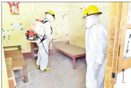
ရခိုင်ပြည်နယ် ကျောက်ဖြူမြို့၊ ကျောက်ဖြူပညာရေးကောလိပ် စောင့်ကြည့်ရေးစခန်းတွင် မေ ၇ ရက်က ကိုဗစ်-၁၉ ရောဂါ ကာကွယ်ရေး ပိုးသတ်ဆေးဖျန်းစဉ်။