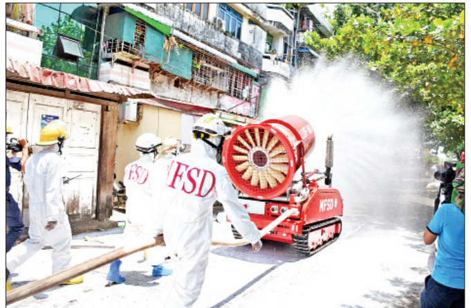
ရန်ကုန်မြို့၊ မင်္ဂလာတောင်ညွန့်မြို့နယ်တွင် မေ ၇ ရက်က ကိုဗစ်-၁၉ ရောဂါ ကာကွယ်ရေး ပိုးသတ်ဆေးဖျန်းစဉ်။