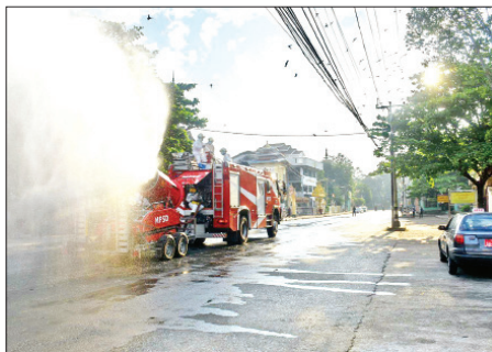
ရန်ကုန်မြို့၊ စမ်းချောင်းမြို့နယ်တွင် မေ ၈ ရက်က ကိုဗစ်-၁၉ ရောဂါ ကာကွယ်ရေး ပိုးသတ်ဆေးဖျန်းစဉ်။