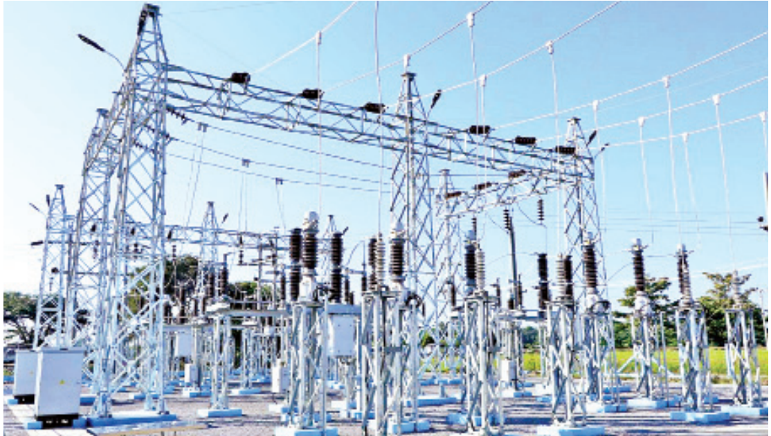
၆၆/၃၃ ကေဗီ၊ ၃၀ အမီစီအေ ရွေ့ပန်းကူး ဓာတ်အားခွဲရုံကို တွေ့ရစဉ်။