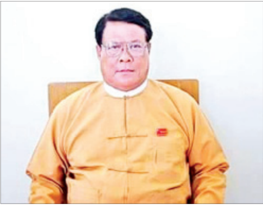
စစ်ကိုင်းတိုင်းဒေသကြီး ဝန်ကြီးချုပ် ဒေါက်တာမြင့်နိုင်

စိုက်ပျိုးသီးနှံတွေ ရေချွေတာသုံးစွဲတာ စိုက်ပျိုးထုတ်လုပ်နိုင်ဖို့ ရည်ရွယ်ပြီး Water Saving Agriculture Technology (WSAT) စီမံကိန်းကို အပူပိုင်းဇုန်စရိယာ မြို့နယ် ၁၀ မြို့နယ်မှာ အကောင်အထည်ဖော် ဆောင်ရွက်လျက်ရှိပါတယ်။ အစက်ချရေသွင်းပိုက်တွေနဲ့