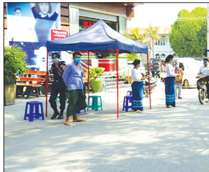
သက်မောင်(ပြန်/ဆက်)

ကျောက်ဆည်ခရိုင် ပြန်ကြားရေးနှင့် ပြည်သူ့ဆက်ဆံရေးဦးစီးဌာန ခရိုင်အခြေအနေများအား အပြန်အလှန် ဝန်ထမ်းများက ဖြန့်ဝေပေးခဲ့ကြောင်း သိရသည်။ အဆိုပါစာစောင်တွင် နိုင်ငံတော်၏ အတိုင်ပင်ခံပုဂ္ဂိုလ် ဒေါ်အောင်ဆန်းစုကြည်မှ ကိုဗစ်-၁၉ ရောဂါကာကွယ်၊ ထိန်းချုပ်၊ ကုသရေးလုပ်ငန်းများတွင် ပါဝင်ဆောင်ရွက်သူများနှင့် လက်တွေ့အခြေအနေများအား အပြန်အလှန် ဆွေးနွေးရာတွင် ပြောကြားချက်မှ ကောက်နုတ်ချက်များ၊ ကျန်းမာရေးနှင့် အားကစားဝန်ကြီးဌာနမှ ထုတ်ပြန်ထားသည့် စနစ်တကျလက်ဆေးနည်းများ၊ ကိုဗစ်-၁၉ ရောဂါ ကူးစက်မှုကာကွယ်ရန် လိုက်နာရမည့်အချက်များ၊ ကိုဗစ်-၁၉ ရောဂါ လက္ခဏာများ၊ ကူးစက်ပုံများ၊ သံသယဖြစ်ဖွယ်ရာ ရောဂါလက္ခဏာများ၊ ကူးစက်မှုကာကွယ်ရေးအတွက် လိုက်နာရမည့် အချက်များနှင့် ဂီတ၊ အနုပညာရှင်များ ပူးပေါင်းပါဝင်ထားသည့် အသိပညာပေး စကားသံများပါဝင်ကြောင်း သိရသည်။