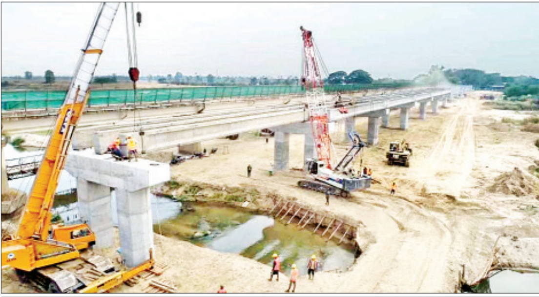
မူးမြစ်ကူးတံတား(ရေဦး) တည်ဆောက်ခြင်းလုပ်ငန်း ဆောင်ရွက်နေမှုကို တွေ့ရစဉ်။

ရင်းနှီးမြှုပ်နှံမှုကဏ္ဍအနေနဲ့ ၂၀၁၈- ၂၀၁၉ ဘဏ္ဍာနှစ်အတွင်း မြန်မာနိုင်ငံသား ရင်းနှီးမြှုပ်နှံမှုလုပ်ငန်း ၂၅ ခုနဲ့ ရင်းနှီးမြှုပ်နှံမှု လုပ်ငန်း တိုးမြှင့်ခြင်းတွေအပါအဝင် ရင်းနှီး မြှုပ်နှံမှုမဟာဏ အမေရိကန်ဒေါ်လာ ၁၀ သန်း ကျော်အပါအဝင် ငွေကျပ် ၄၆၂၅၅ သန်းကျော်၊ နိုင်ငံခြားရင်းနှီးမြှုပ်နှံမှုလုပ်ငန်းတစ်ခုနဲ့ ရင်းနှီး မြှုပ်နှံမှုတိုးမြှင့်ခြင်းတွေအပါအဝင် ရင်းနှီး