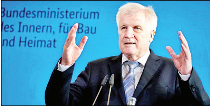
ဂျာမနီပြည်ထောင်စုဝန်ကြီး ဟော့စ်ဆီ ဟိုဗာ

ဘာလင် မေ ၁၃ ဂျာမနီနိုင်ငံအတွင်း ကိုဗစ်-၁၉ ရောဂါ ကူးစက်ပျံ့နှံ့မှုနှုန်း လျော့ကျလာခဲ့ရာ ရောဂါကူးစက်ပျံ့နှံ့မှု ထိန်းချုပ်ရန် နယ်စပ်ဒေသ ထိန်းချုပ်မှုကို ဇွန်လ အလယ်ပိုင်းတွင် အဆုံးသတ်ရန် ရည်ရွယ်ကြောင်း အစိုးရက ယနေ့ ပြောကြားသည်။