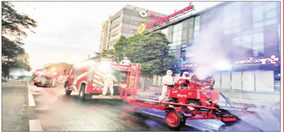
ရန်ကုန်မြို့၊ ဝိလိတထောင်မြို့နယ်တွင် မေ ၈ ရက်က ကိုဗစ်-၁၉ ရောဂါ ကာကွယ်ရေး ပိုးသတ်ဆေးဖျန်းစဉ်။