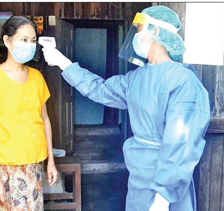
မွန် အင်းစိန်မြို့နယ်ရှိ ရောဂါပိုးအများဆုံး တွေ့ရှိခဲ့သောရပ်ကွက်လေးခု၌ ဆောင်ရွက်ခဲ့ပြီး အိမ်ခြေ ၁၀၇၄၄ အိမ်ရှိ လူဦးရေ စုစုပေါင်း ၄၇၆၅၃ ဦးအား စစ်ဆေးမေးမြန်းခဲ့ရာ ရောဂါလက္ခဏာရှိသူ ခရီးသွားရာစင်ရှိသူနှင့် ရောဂါပိုးရှိသူနှင့် အနီးကပ်ထိတွေ့မှုရှိသူ သုံးဦးအား အင်းစိန်မြို့နယ်၌လှည့်လည်ဆေးရုံကြီးသို့ လည်းကောင်း၊ ထူးခြားလက္ခဏာရှိသူ ၁၆ ဦးကို Quarantine center သို့လည်းကောင်း ပို့ဆောင်နိုင်ခဲ့ကြောင်း သိရသည်။ သတင်း-ဇာနည်မောင်၊ အေးမင်းသူ

သွားမည်ဖြစ်ပြီး အဓိကအားဖြင့် ရောဂါ လက္ခဏာ ရှိမရှိနှင့် တိုက်ဆိုင်စစ်ဆေးသွား မည်ဖြစ်ကြောင်း သိရသည်။ စစ်တမ်းကောက်ယူခြင်းတွင် ကိုဗစ်-၁၉ ရောဂါဦးတွေ့လူနာများနှင့် အနီးကပ်ထိတွေ့မှု ရှိ/မရှိ ပြုလမ်းသဘာဝများ၊ လူစုလူဝေးများသို့ သွားရောက်မှုခြင်းရှိ/မရှိ၊ ခရီးသွားရာစင် ရှိ/မရှိတို့ကို တစ်အိမ်တက်ဆင်းမေးမြန်းခြင်း၊ ရောဂါလက္ခဏာများဖြစ်သည့် ဖျားခြင်း၊ ချောင်းဆိုးခြင်း၊ အသက်ရှူရခက်ခြင်း၊ အနံ့ အရသာပျောက်ခြင်းအစရှိသည့် လက္ခဏာ များရှိ/မရှိမေးမြန်းခြင်းနှင့် ရောဂါလက္ခဏာ များစွာမရှိပါက မိမိကိုယ်တိုင်သတင်းပေးပို့ နိုင်ရေးရည်ရွယ်ချက်ဖြင့် ဆောင်ရွက်ခြင်း ဖြစ်သည်။ လှိုင်သာယာမြို့နယ်နှင့် တာမွေမြို့နယ် တို့တွင် ကျန်းမာရေးစစ်တမ်းကောက်ယူရန် နှင့် ရန်ကုန်တိုင်းဒေသကြီးအတွင်း ကိုဗစ်-၁၉ ရောဂါ ကြိုတင်ကာကွယ် ထိန်းချုပ်နိုင်ရေး တိုင်းဒေသကြီးအဆင့် ကိုဗစ်-၁၉ ရောဂါ