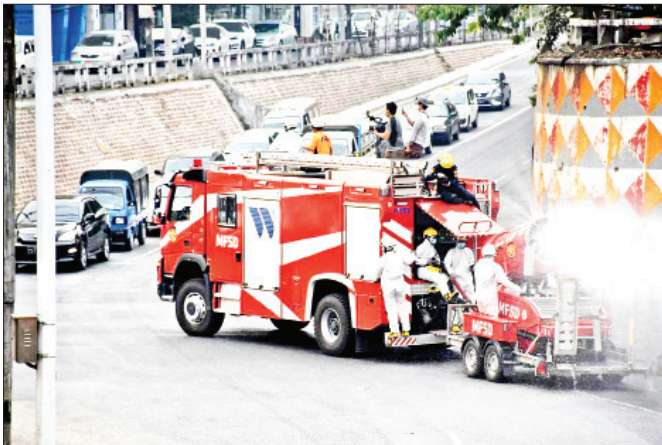
ရန်ကုန်မြို့၊ ကြည့်မြင်တိုင်မြို့နယ်တွင် မေ ၇ ရက်က ကိုဗစ်-၁၉ ရောဂါ ကာကွယ်ရေး ပိုးသတ်ဆေးဖျန်းစဉ်။