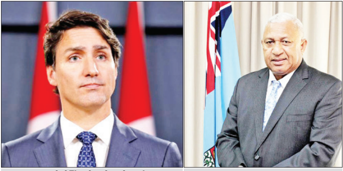
ကနေဒါဝန်ကြီးချုပ် ဂျက်စတင်ထရူးဒိုး (အလယ်) ဖလှယ်ခဲ့ကြသလို ကိုဗစ်-၁၉ ရောဂါ ပတ်သက်၍ ထိန်းချုပ်ရေးနယ်ပယ်၌ အားနည်းသော ဖီဂျီဝန်ကြီးချုပ် ဗိုရက်ခဲတိုင်နီမာရာမာ (ညာ) နိုင်ငံများအား အကူအညီပေးရန် လိုအပ်ပုံကိုလည်း ထည့်သွင်းဆွေးနွေးခဲ့ကြကြောင်း သိရသည်။

ဆူဇာ မေ ၁၃ ဖီဂျီဝန်ကြီးချုပ် ဗိုရက်ခဲတိုင်နီမာရာမာသည် ကိုဗစ်-၁၉ ရောဂါနှင့်ပတ်သက်၍ ယခု သီတင်းပတ်အစောပိုင်းက ကနေဒါဝန်ကြီးချုပ် ဂျက်စတင်ထရူးဒိုးနှင့် တယ်လီဖုန်းဖြင့် ဆယ်သွယ်ဆွေးနွေးခဲ့ကြောင်း သိရသည်။