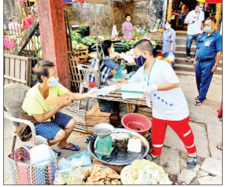
ညောင်ပင်ခန်း

ရန်ကုန် မေ ၁၃ ရန်ကုန်မြောက်ပိုင်းခရိုင် အင်းစိန်မြို့နယ်ရှိ ဈေးကြီး ၁၅ ဈေးအတွင်း ယနေ့နံနက် ၈ နာရီမှစတင်၍ ကိုဗစ်-၁၉ ရောဂါကူးစက်ပြန့်ပွားမှုမရှိစေရေးနှင့် ကြိုတင် ကာကွယ်ထိန်းချုပ်နိုင်ရန်အတွက် ရောဂါကာကွယ်၊ ထိန်းချုပ်၊ ကုသရေး ကော်မတီမှ အမှတ်(၂) တိုင်းဒေသကြီးလွှတ်တော်ကိုယ်စားလှယ် ဦးဝေဖြိုးဟန် နှင့် ဌာနဆိုင်ရာတာဝန်ရှိသူများ၊ we love Insein နှင့် စေတနာ့ဝန်ထမ်းများအဖွဲ့ ၁၅ ဖွဲ့ရွဲကာ ဈေးရောင်းသူ၊ ဈေးဝယ်သူ ပြည်သူများအား နှာခေါင်းစည်း တပ်ဆင်ရေး Mask Campaign ပြုလုပ်၍ နှာခေါင်းစည်း ၁၃၀၀၀ ကျော်ကို ဈေးရောင်း၊ ဈေးဝယ် ပြည်သူများအား အခမဲ့ဖြန့်ဝေပေးခဲ့ကြောင်း သိရ သည်။