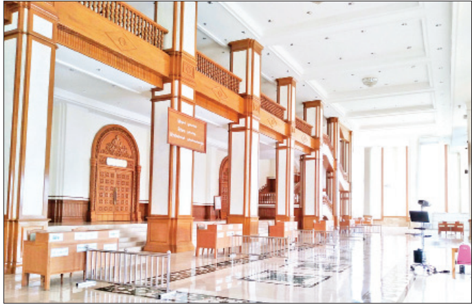
ပြည်ထောင်စုလွှတ်တော်ကိုယ်စားလှယ်များ အမည်စာရင်းပေးသွင်းရန် စီစဉ်ဆောင်ရွက်ထားမှုကို တွေ့ရစဉ်။