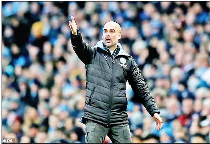
ငွေကြယ် ရေးသားသည်

ပါတယ်။ ဂြိုဟ်ယိုလားဟာ ၂၀၁၆ ခုနှစ်မှာ မနုစီးတီးအသင်း နည်းပြဖြစ်လာခဲ့ပြီး