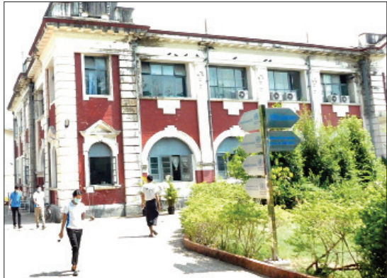
ရန်ကင်းမြို့ မော်ကွန်းတိုက်လမ်းရှိ အမျိုးသားကျန်းမာရေးဓာတ်ခွဲခန်းဆိုင်ရာဌာနကို တွေ့ရစဉ်။

ရန်ကင်း မေ ၁၃ မြန်မာယူနန်အလှူရှင်အဖွဲ့က လှူဒါန်းမည့် ကိုဗစ်-၁၉ ရောဂါပိုး ဓာတ်ခွဲစစ်ဆေးနိုင်သော Cobas စက်သစ်များရောက်ရှိပါက မန္တလေး မြို့ ပြည်သူ့ကျန်းမာရေးဓာတ်ခွဲခန်း၌ Lab (ဓာတ်ခွဲခန်း) တစ်ခု တိုးချဲ့ခြင်းအပါအဝင် တောင်ကြီး၊ မော်လမြိုင်နှင့် လားရှိုးမြို့တို့၌ ဓာတ်ခွဲခန်းနေရာများ ထပ်မံတိုးချဲ့ကာ Cobas စက်များအား ထားရှိသွားမည်ဖြစ်ကြောင်း သိရသည်။ ညွှန်ကြားဆောင်ရွက် "ပြင်ပအလှူရှင်တွေ လှူဒါန်းမယ့် Cobas စက်သစ်တွေ ရောက်လာဖို့ရှိပါတယ်။ လေယာဉ်အခက်အခဲဆိုတော့ မရောက်လာသေးတာပါ။ အဲဒီစက်သစ်တွေ ထားဖို့နေရာတွေ ထပ်တိုးချဲ့ဖို့ရှိပါတယ်။ မန္တလေးမြို့မှာ NHL ရဲ့အဖွဲ့တစ်ခုဖြစ်တဲ့ PHL ရှိပါတယ်။ အဲဒီမှာ Lab စာမိတ်တိုးချဲ့မယ်။