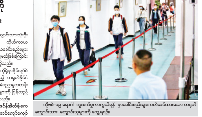
ကိုဗစ်-၁၉ ရောဂါ ကူးစက်မှုကာကွယ်ရန် နှာခေါင်းစည်းများ ဝတ်ဆင်ထားသော တရုတ်ကျောင်းသား ကျောင်းသူများကို တွေ့ရစဉ်။ ကိုးကား - အေအက်ဖီဝီ ဘာသာပြန် - အောင်စော်လင်း

အဆိုပါကြေညာချက်ထွက်ပေါ်လာခြင်းဖြစ်သည်။ အဆိုပါ ကျောင်းသားသုံးဦးသည် နှာခေါင်းစည်းများဝတ်ဆင်ကာ တားဝေးအခြားအားကစားပြိုင်ပွဲများတွင် ပါဝင်ဆင်နွှဲခဲ့ကြသည်။ ယင်းကျောင်းသားများသည် အားကစားပြိုင်ပွဲများ ပါဝင်ဆင်နွှဲစဉ် N95 နှာခေါင်းစည်းများကို ဝတ်ဆင်ထားကြောင်း စစ်ဆေးတွေ့ရှိရသည်။ ထို့ကြောင့် အားကစားလုပ်ဆောင်စဉ် နှာခေါင်းစည်းများ ဝတ်ဆင်ထားခြင်းကြောင့် အသက်ရှူပိတ်ကာ ကျောင်းသားသုံးဦး သေဆုံးခဲ့သည့်အတွက် ကိုယ်ကာယအားကစားလုပ်ဆောင်စဉ် နှာခေါင်းစည်းများ ဝတ်ဆင်ခြင်းကို ရှောင်ကြဉ်ရမည်ဟု တရုတ်ပညာရေးဝန်ကြီးဌာနက ဆိုသည်။ လက်ရှိအချိန်တွင် ကိုရိုနာဗိုင်းရပ်စ် ခံနိုင်ရည်မရှိသော အားကစားပြိုင်ပွဲများနှင့် အလယ်တန်းကျောင်းများကို ပြန်လည်ဖွင့်လှစ်ထားကြောင်း သိရသည်။ ကိုးကား - အင်န်အိတ်ချီကော ဘာသာပြန် - အောင်ကျော်ကျော်