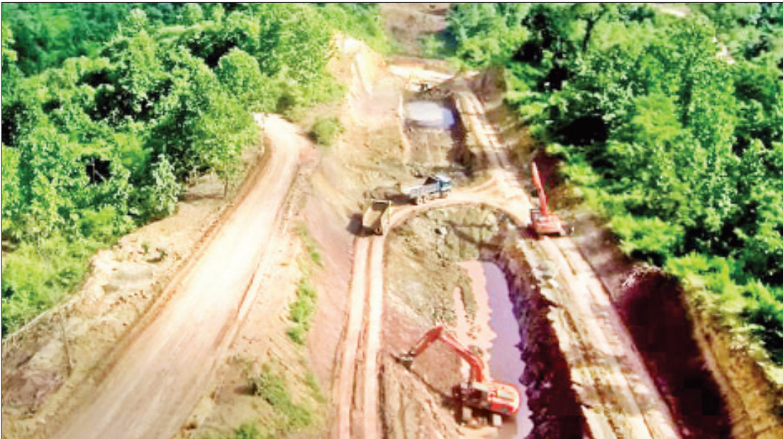
အိန္ဒိယအကူအညီဖြင့် အိန္ဒိယ-မြန်မာ-ထိုင်း သုံးနိုင်ဆက်သွယ်ပေးမည့် မုံရွာ-ယာကြီး-ကလေးဝလမ်း (ယာကြီး-ကလေးဝ လမ်းပိုင်း) လုပ်ငန်းဆောင်ရွက်နေမှုကို တွေ့ရစဉ်။

တရား - ကလေးဝ - ယာကြီး - ချောင်းမ - လင်းကတောလမ်းဟာ အိန္ဒိယ-မြန်မာ-ထိုင်း သုံးနိုင်ချင်းဆက်လမ်းမကြီး (India - Myanmar - Thai Trilateral Highway) ရဲ့ အစိတ်အပိုင်းဖြစ်ပါတယ်။ ဒီသုံးနိုင်ချင်းဆက် လမ်းမကြီးမှာ မုံရွာ-ယာကြီး-ကလေးဝလမ်း ပါဝင်ပြီး ဒီလမ်းကို အိန္ဒိယအကူအညီနဲ့ ဆောင်ရွက်လျက်ရှိပြီး ၂၀၂၀ - ၂၀၂၁ မှာ ပြီးစီးအောင် ဆောင်ရွက်သွားမှာ ဖြစ်ပါတယ်။ နိုင်ငံဝန်ထမ်းတွေအတွက် ၂၀၁၈-၂၀၁၉ ဘဏ္ဍာနှစ်မှာ တိုင်းဒေသကြီး ခွင့်ပြု ရန်ပုံငွေကျပ်သန်း ခြောက်ဘီလီယံကျော်နဲ့ အရာထမ်းတွေအတွက် အခန်းပေါင်း ၂၀ ပါဝင် တဲ့ အိမ်ရာတစ်လုံးနဲ့ အမှုထမ်းတွေအတွက် အခန်းပေါင်း ၂၆၀ ပါဝင်တဲ့ အိမ်ရာ ၁၉ လုံးကို ဆောင်ရွက်ပေးနိုင်ခဲ့ပြီး ပစ်ခတ်စားနိုင်ငံ ဝန်ထမ်းတွေနဲ့ အိမ်ရာမရှိသေးတဲ့ ပြည်သူတွေ အတွက် ပြည်သူ့အငှားအိမ်ရာအဖြစ် မြို့နယ် ပေါင်း ၁၆မြို့နယ်မှ အခန်းပေါင်း ၅၅၂ ခန်း ပါဝင်တဲ့ တိုက် ၁၂ လုံးကို ဆောက်လုပ်ပေးခဲ့ပြီး အခန်းပေါင်း ၄၈၀ ကို နေရာချထားပေးခဲ့ပြီး