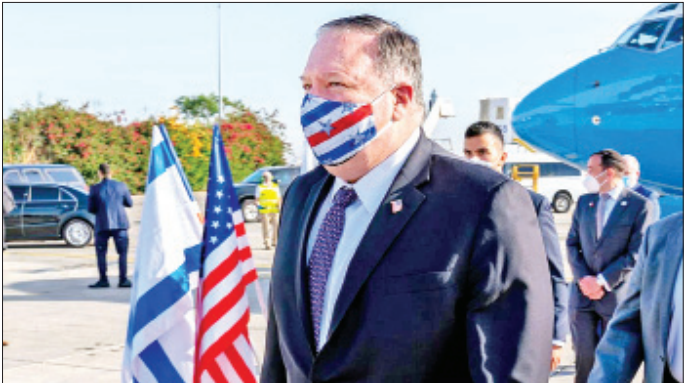
ကို ယခုနှစ် ဇူလိုင်လတွင် စတင်ဖွယ်ရှိကြောင်း သိရသည်။ အဆိုပါ နယ်မြေတိုက်ခိုက်သိမ်းပိုက်မှုသည် ထရုန်၏ ငြိမ်းချမ်းရေးအစီအစဉ် အစိတ်အပိုင်းတစ်ခုဖြစ်သော်လည်း အမေရိကန်အနေဖြင့် ထောက်ခံမှုမရှိ/မရှိ ရှင်းလင်းလင်းမသိရသေးပေ။ ပါလက်စတိုင်း၊ အာရပ်အဖွဲ့ချုပ်နှင့်

ကို ယခုနှစ် ဇူလိုင်လတွင် စတင်ဖွယ်ရှိကြောင်း သိရသည်။ အဆိုပါ နယ်မြေတိုက်ခိုက်သိမ်းပိုက်မှုသည် ထရုန်၏ ငြိမ်းချမ်းရေးအစီအစဉ် အစိတ်အပိုင်းတစ်ခုဖြစ်သော်လည်း အမေရိကန်အနေဖြင့် ထောက်ခံမှုမရှိ/မရှိ ရှင်းလင်းလင်းမသိရသေးပေ။ ပါလက်စတိုင်း၊ အာရပ်အဖွဲ့ချုပ်နှင့် ကိုးကား - ဆင်ဟွာ၊ ဘာသာပြန် - ကျော်