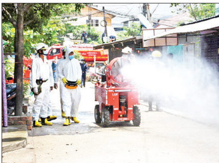
ရန်ကုန်မြို့၊ အလုံမြို့နယ်တွင် မေ ၇ ရက်က ကိုဗစ်-၁၉ ရောဂါ ကာကွယ်ရေး ပိုးသတ်ဆေးဖျန်းစဉ်။