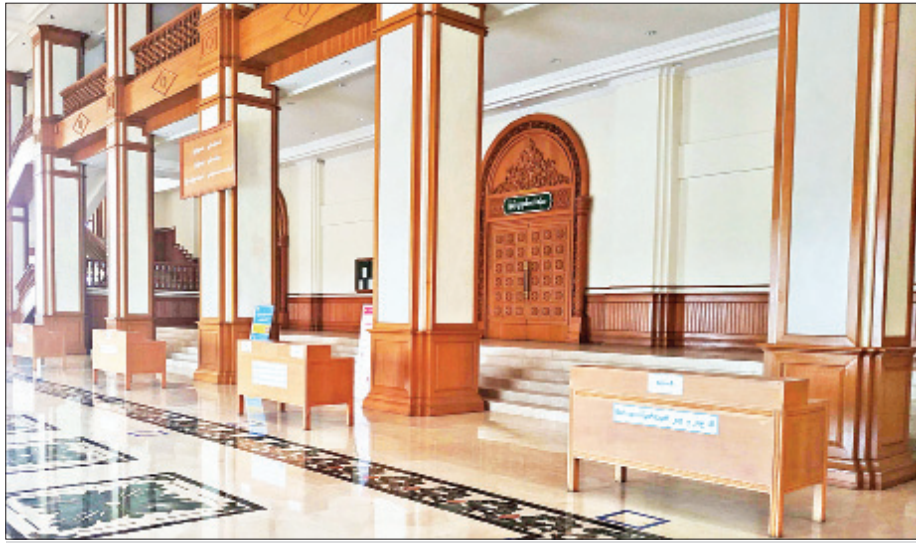
ပြည်သူ့လွှတ်တော်ကိုယ်စားလှယ်များ အမည်စာရင်းပေးသွင်းရန် စီစဉ်ဆောင်ရွက်ထားမှုကို တွေ့ရစဉ်။

»» စာမျက်နှာ ၈ မှ ပြည်ထောင်စုလွှတ်တော် အစည်းအဝေးခန်းမအောက်ထပ်၌ ထပ်မံ ပြင်ဆင်ထားသည့် နေရာများနှင့် လေ့လာရေးစင်မြင့် နေရာများတွင် အစည်းအဝေး တက်ရောက်ကြမည့် ကိုယ်စားလှယ်များအနေဖြင့် ဆွေးနွေးရန်ရှိပါက FM MIC ဖြင့်သာ ဆွေးနွေးရမည်ဖြစ်ပြီး Voting ကိုလည်း လက်ရှိ အစီအစဉ်ကို လွှတ်တော်ကိုယ်စားလှယ်များအား ကြိုတင်အသိပေးပြီး ဖြစ်ကြောင်း သိရသည်။ ဒုတိယအကြိမ် (၁၆)ကြိမ်မြောက် လွှတ်တော်ပုံမှန်အစည်းအဝေးများကို သတ်မှတ်ရက်ထက် နောက်ကျကျင်းပ ရသော်လည်း အချိန်တိုအတွင်း ပြီးစီးအောင် စီစဉ်ထားပြီး အစည်းအဝေး ဖြီးဆုံးရက်ကို ယခင်သတ်မှတ်ထား