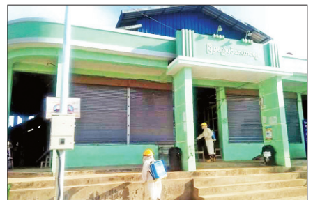
တနင်္သာရီတိုင်းဒေသကြီး လောင်းလုံးမြို့နယ် မြို့မစည်ပင်သာယာရေးတွင် မေ ၇ ရက်က ကိုဗစ်-၁၉ ရောဂါ ကာကွယ်ရေး ပိုးသတ်ဆေးဖျန်းစဉ်။