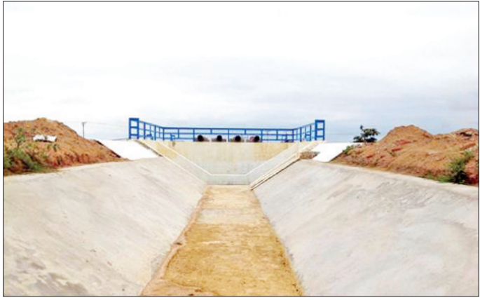
ကန်ဘလူခရိုင် ကျွန်းလှမြို့တွင် ဆောင်ရွက်လျက်ရှိသည့် မခေါင်လျှပ်စစ်မြစ်ရေတင်လုပ်ငန်းကို တွေ့ရစဉ်။