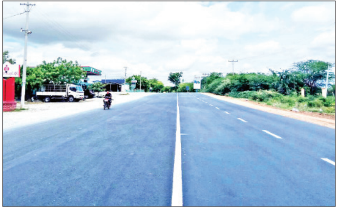
စစ်ကိုင်း-မုံရွာ (လေးလမ်းသွား) ကတ္တရာကွန်ကရစ်လမ်းကို တွေ့ရစဉ်။