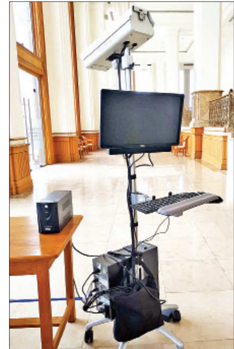
ကျန်းမာရေးစစ်ဆေးမှုများ ဆောင်ရွက်ရန် အဖူချိန်တိုင်းတာသည့် စက်တပ်ဆင်ထားမှုကို တွေ့ရစဉ်။