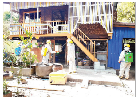
မန္တလေးတိုင်းဒေသကြီး မတ္တရာမြို့နယ် အမှတ်(၁)ရပ်ကွက်တွင် မေ ၇ ရက်က ကိုဗစ်-၁၉ ရောဂါ ကာကွယ်ရေး ပိုးသတ်ဆေးဖျန်းစဉ်။