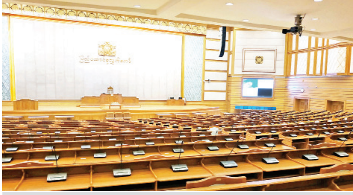
ပြည်ထောင်စုလွှတ်တော်အစည်းအဝေးကျင်းပရန် ပြင်ဆင်ဆောင်ရွက်ထားမှုကို တွေ့ရစဉ်။