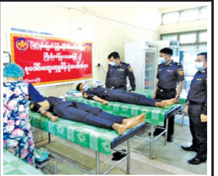
(၇၄) နှစ်မြောက် မြန်မာနိုင်ငံမီးသတ်တပ်ဖွဲ့နေ့ကို ဂုဏ်ပြုသောအားဖြင့် မေ ၄ ရက်က ပဲခူးတိုင်းဒေသကြီး မီးသတ်ဦးစီးဌာနမှ သန္ဓေတပ်ဖွဲ့ဝင် ၂၀၊ အရန်မီးသတ်တပ်ဖွဲ့ဝင် ၁၅ ဦးတို့က ပဲခူးမြို့ ပြည်သူ့ဆေးရုံကြီးတွင် သွေးလျှောခန်းကြ စဉ်။