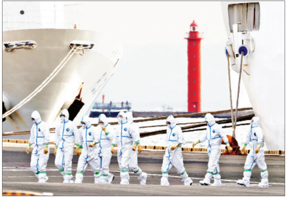
ကိုဗစ်- ၁၉ ကူးစက်ရောဂါ တိုက်ဖျက်ရေးလုပ်ငန်းအတွက် ကာကွယ်ရေးဝတ်စုံများ ဝတ်ဆင်ထားစဉ်။

တရုတ်နိုင်ငံဟာ အခုလို ကိုရိုနာဗိုင်းရပ်စ်ကူးစက် ရောဂါ ပြန့်ပွားနေတဲ့အချိန်မှာ ကမ္ဘာလုံးဆိုင်ရာအရေး ကိစ္စတွေမှာ ဦးစီးဆောင်ရွက်နိုင်စွမ်းရှိတယ်လို့ ပြသနိုင် နေခြင်းရဲ့ အဓိကအချက်ကတော့ ပြည်တွင်းရေးကို ဦးစားပေးဆောင်ရွက်နေတဲ့ အမေရိကန်နိုင်ငံခြားရေး မူဝါဒနဲ့ ပြည်တွင်းမှာလုံလောက်မှုမရှိတဲ့ အခြေအနေ တွေကြောင့်ပဲ ဖြစ်ပါတယ်။ စာမျက်နှာ ၂၆ သို့ ❖