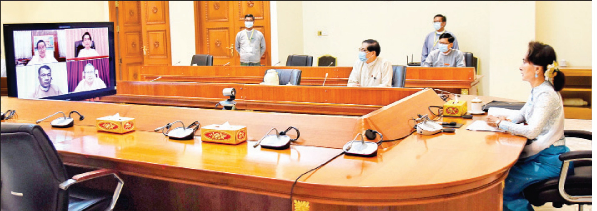
Coronavirus Disease 2019 (COVID-19) ကာကွယ်၊ ထိန်းချုပ်၊ ကုသရေးအမျိုးသားအဆင့် ဗဟိုကော်မတီဥက္ကဋ္ဌ နိုင်ငံတော်၏အတိုင်ပင်ခံပုဂ္ဂိုလ် ဒေါ်အောင်ဆန်းစုကြည် ကရင်ပြည်နယ်၊ မွန်ပြည်နယ်နှင့် တနင်္သာရီတိုင်းဒေသကြီးတို့မှ ဝန်ကြီးချုပ်များနှင့် COVID-19 ကာကွယ်၊ ထိန်းချုပ်၊ ကုသရေးလုပ်ငန်းများနှင့်စပ်လျဉ်း၍ ဆွေးနွေးစဉ်။

★ ရှေ့ဖွံ့ဖြိုးမှု မိမိတို့အတွက် သက်သာပါကြောင်း၊ ထိုင်းနိုင်ငံနှင့် ဆက်သွယ် ဆောင်ရွက်နိုင်သည်မှာလည်း အဆင်ပြေသည်ဟု ထင်မြင် ပါကြောင်း၊ ကရင်ပြည်နယ်သည် အဓိကကျပါကြောင်း၊ ယခင်ဝင်ရောက်လာသည့် အများစုမှာ မြဝတီဘက်မှ တစ်ဆင့်ဝင်ရောက်ပြီး တခြားဒေသများသို့ သွားရောက် ကြပါကြောင်း၊ တချို့မှာ တနင်္သာရီတိုင်းဒေသကြီးဘက်မှ ဝင်ရောက်ကြပါကြောင်း ပြောကြားသည်။