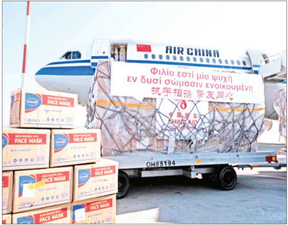
ကိုရိုနာဗိုင်းရပ်စ် ကူးစက်ရောဂါကို တရုတ်နိုင်ငံတွင်း ထိန်းချုပ်နိုင်ခဲ့ပြီး နောက်ပိုင်းတွင် အခြားနိုင်ငံများသို့ ဆေးပညာရှင်များနှင့် ဆေးပစ္စည်းများ ပေးပို့ကူညီခဲ့သည်ကို တွေ့ရစဉ်။

တစ်နိုင်ငံတည်းသာရှိကြောင်း ပြောကြားခဲ့ပါတယ်။ အလီဘာဘာ ကုမ္ပဏီကို တည်ထောင်ခဲ့တဲ့ ဂျက်မ ကလည်း သူတို့အနေနဲ့ အမေရိကန်နိုင်ငံအတွက် နှာခေါင်းစည်းမျက်နှာဖုံးတွေနဲ့ ကိုရိုနာဗိုင်းရပ်စ်ရောဂါ ရှိ/ မရှိ စစ်ဆေးတဲ့ ကိရိယာအများအပြားကို အကူအညီ