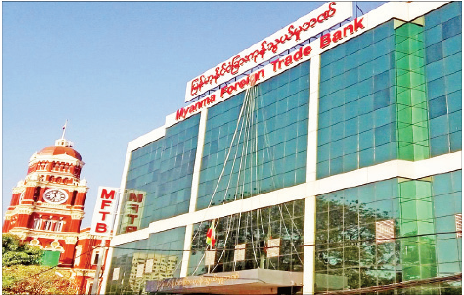
မြန်မာ့နိုင်ငံခြား ကုန်သွယ်မှုဘဏ်ကို တွေ့ရစဉ်။

ဖြေ။ ။ မြန်မာနိုင်ငံမှာကျေးလက်ဒေသဖွံ့ဖြိုးရေးနဲ့ ဆင်းရဲမှုလျှော့ချရေးတို့ကို အထောက်အကူဖြစ်စေဖို့ အားလုံးပါဝင်နိုင်တဲ့ ငွေကြေးကြေးရေးကဏ္ဍ တည်ဆောက်ရေးလမ်းပြမြေပုံ (Financial Inclusion Roadmap 2014 - 2020) ကို ရေးဆွဲအကောင်အထည်ဖော်ခဲ့ပြီး ဖြစ်ပါတယ်။ ဆက်လက်ပြီး Financial Inclusion Roadmap (2019-2023)ကို ရေးဆွဲခဲ့ပြီး ဝင်ငွေနည်းပါးသူတွေအတွက် ငွေကြေးဝန်ဆောင်မှုပေးခြင်း၊ အသေးစား၊ အငယ်စားနှင့် အလတ်စား စီးပွားရေးလုပ်ငန်းတွေနဲ့ လုပ်ကွက်ကြီးမားတဲ့ လယ်သမားတွေအတွက် ငွေကြေးဝန်ဆောင်မှုပေးခြင်း၊ စုဆောင်းငွေကို လည်ပတ်သုံးစွဲမှု