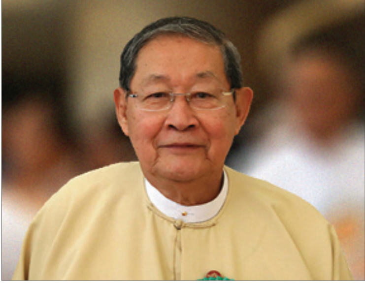
ပြည်ထောင်စုဝန်ကြီး ဦးစိုးဝင်း

ဖြေ။ ။ စိုက်ပျိုးစရိတ်ချေးငွေတွေကို မြန်မာ့လယ်ယာဖွံ့ဖြိုးရေးဘဏ်က ၂၀၁၈-၂၀၁၉ ဘဏ္ဍာနှစ်မှာ ငွေကျပ် ၁၆၈၄ ဘီလီယံ ထုတ်ချေးခဲ့ရာကနေ ၂၀၁၉ - ၂၀၂၀ ဘဏ္ဍာနှစ်