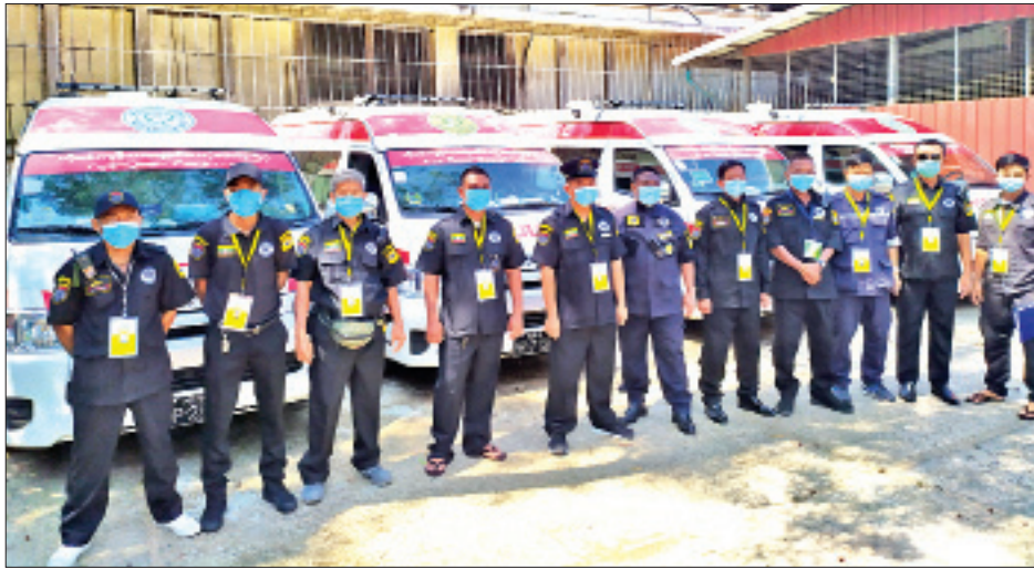
ပြောသည်။ ရန်ကုန်တိုင်းဒေသကြီးအတွင်း ယခုအခါ ကိုဗစ်-၁၉ ပိုးတွေ့အတည်ပြုလူနာများကို ဝေဘာဂီဆေးရုံ၊ မြောက်ဥက္ကလာပပြည်သူ့ဆေးရုံနှင့် တောင်ဥက္ကလာပ မိခင်နှင့်ကလေးဆေးရုံတို့၌ ပြုစုကုသပေးလျက်ရှိကြောင်း၊ ယင်းဆေးရုံများတွင် လူနာထားနိုင်သည့်အရေအတွက်