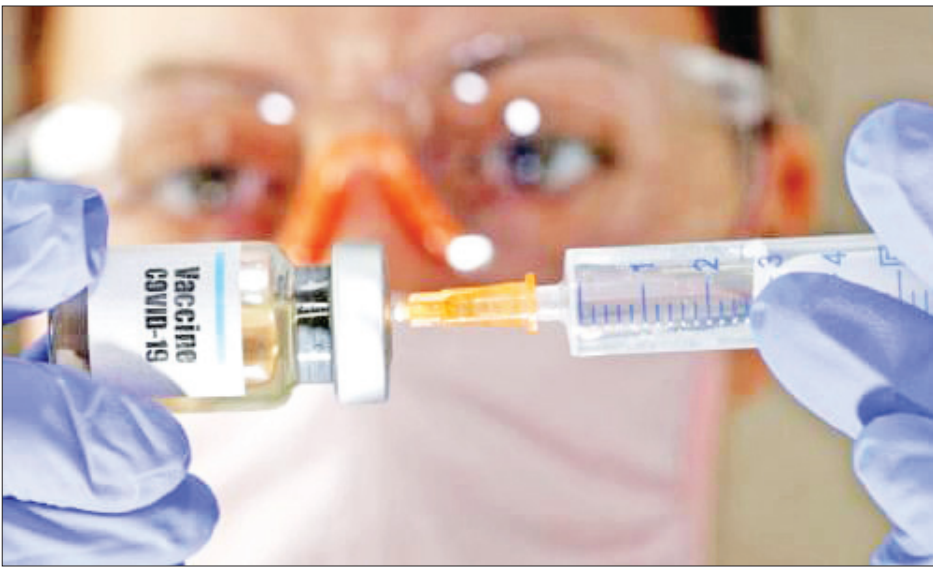
ကိုဗစ်-၁၉ ကူးစက်ရောဂါကို ထိထိရောက်ရောက်ကုသပေးနိုင်မည့် ဆေးဝါးထုတ်လုပ်နိုင်ရေးအတွက် နိုင်ငံကြီး အချို့တွင် စမ်းသပ်နေသည်ကို တွေ့ရစဉ်။

အမေရိကန်နိုင်ငံအနေနဲ့ အခုအချိန်မှာ ကိုဗစ်-၁၉ ကူးစက်ရောဂါကာလအတွင်း လိုအပ်နေတဲ့ ရုပ်ပိုင်း ဆိုင်ရာပစ္စည်းလိုအပ်ချက်တွေကို ပါဝင်ဖြည့်ဆည်းပေးဖို့ အထောက်အကူမပြုနိုင်သော်လည်း ဇီဝသိပ္ပံနဲ့ ဇီဝ နည်းပညာပိုင်းမှာ ကမ္ဘာ့ရှေ့တန်းမှာရှိနေတဲ့ နိုင်ငံတစ် နိုင်ငံအနေနဲ့ လိုအပ်နေတဲ့ ဆေးဝါးဖော်ထုတ်နိုင်ရေး မှာတော့ အရေးပါတဲ့ကဏ္ဍကနေ ပါဝင်နိုင်တဲ့ အနေ