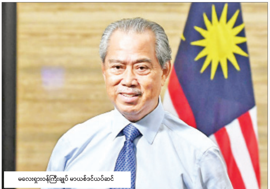
မလေးရှားဝန်ကြီးချုပ် မာယစ်ဒင်ယပ်ဆင်

မှတ်ချက်များနှင့်အညီ စီးပွားရေးလုပ်ငန်းအားလုံးပိတ်တားခြင်းကို တနင်္လာနေ့မှစ၍ လုပ်ငန်းလည်ပတ်ခွင့်ပြုမည်ဖြစ်ကြောင်း ပြောကြားသည်။ စည်းကမ်းသတ်မှတ်ချက်များတွင် တစ်ဦးနှင့်တစ်ဦး ခပ်ခွာခွာနေခြင်းစည်းမျဉ်းကို မှန်မှန်ကန်ကန် ကျင့်သုံးနိုင်ရန် ဆောင်ရွက်ခြင်းပါဝင်ကြောင်း ဝန်ကြီးချုပ်က ရုပ်မြင်သံကြားမိန့်ခွန်း၌ ပြောကြားသည်။ အသွားအလာတားမြစ်ကန့်သတ်ထားသော ကာလအတွင်း စီးပွားရေးလုပ်ငန်းများ ရပ်နားခဲ့ရသဖြင့် မလေးရှားနိုင်ငံသည် ရင်းကစ် ၆၃ ဘီလီယံ(ဒေါ်လာ ၁၄ ဘီလီယံ) ဆုံးရှုံးခဲ့ကြောင်း ပြောကြားခဲ့သည်။ သို့သော်လည်း စာသင်ကျောင်းများ၊ ဗိုင်းရပ်စ်ကူးစက်မှု အန္တရာယ်ကို မြင့်တက်စေနိုင်သည့် လူလူချင်း နီးကပ်စွာ ထိစပ်မှုများရှိသည့် စီးပွားရေးလုပ်ငန်းများ (ဥပမာ၊ ရုပ်ရှင်ရုံများ) ကို ဆက်လက်ပိတ်ထားမည်ဖြစ်သည်။ မူဆလင်အများစုရှိသည့် မလေးရှားနိုင်ငံတွင် ဗလီများကိုလည်း ဆက်လက်ပိတ်ထားမည်ဖြစ်သည်။ ထို့ပြင် မေလကုန်တွင် ကျရောက်မည့် အိမ်အားလပ်ရက်တွင် ပြည်သူများကို ၎င်းတို့၏ ဇာတိမြို့ရွာများသို့ ခရီးသွားခွင့်ပြုမည်မဟုတ်ပေ။ ကိုးကား-အေအက်ဖ်ပီ၊ ဘာသာပြန်-အောင်ဇော်လင်း