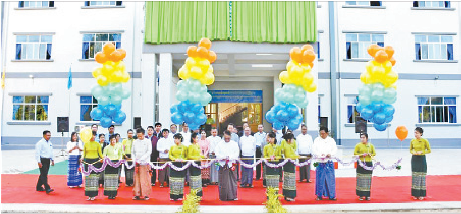
ပြည်ထောင်စုဝန်ကြီး ဒေါက်တာသန်းမြင့် နေပြည်တော်ရှိ မြန်မာကုန်သွယ်မှုမြှင့်တင်ရေးအဖွဲ့ရုံး အဆောက်အအုံအား ဖွင့်လှစ်ပေးစဉ်။