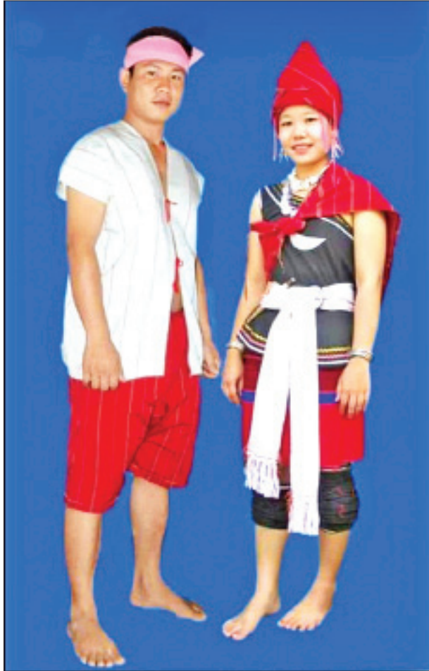
ကော်ယော် (မနုမနော)လူမျိုးစု ခေတ်ဟောင်းရိုးရာဝတ်စုံ

သွားရန် ဖောင်ဖွဲ့၍ ပင်လယ်ပြင်သို့ ထွက်လာရာတွင် သူတို့ထံပါလာသော တဆေး (တရုတ်) အနံ့ကြောင့် မိကျောင်းက အနောင်အယုတ်ပေးသဖြင့် ရှေ့သို့ဆက်လက်မသွားပုံဘဲ ကုန်းပေါ်သို့ ပြန်တက်ခဲ့ရသည်ဟု ဆိုပါသည်။