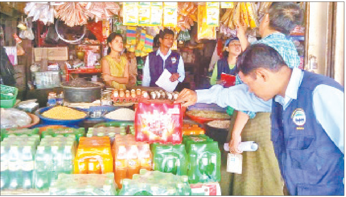
စားသုံးသူရေးရာဦးစီးဌာနမှ တာဝန်ရှိသူများ ဈေးတွင် ကွင်းဆင်းစစ်ဆေးနေမှုကို တွေ့ရစဉ်။