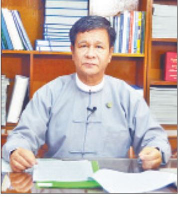
ဒုတိယဝန်ကြီး ဦးအောင်ထူး

ကမ္ဘာ့ကုန်သွယ်ရေးအဖွဲ့ (WTO) မှ ဖွဲ့စည်း မှုအနည်းဆုံးနိုင်ငံများသို့ ပေးအပ်သည့် ကုန်သွယ်မှုကဏ္ဍ ဖွံ့ဖြိုးတိုးတက်ရေးဆိုင်ရာ အကူအညီအထောက်အပံ့ဖြစ်သည့် Enhanced Integrated Framework - EIF အစီအစဉ် များကို WTO နှင့် အပြည်ပြည်ဆိုင်ရာ