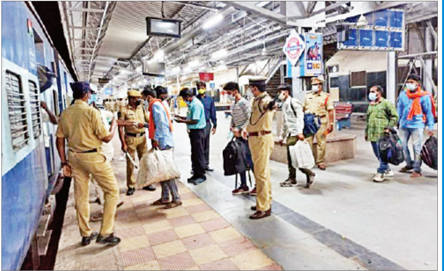
နေရပ်ပြန်ကြတော့မည့် အိန္ဒိယ ရွှေ့ပြောင်းလုပ်သားများကို တီလန်ဂါနာပြည်နယ် လင်ဂမ်ပါလီဘူတာရုံ၌ တွေ့ရစဉ် ။

အခု နေရပ်ပြန်နေပြီဖြစ်တဲ့ ရွှေ့ပြောင်းလုပ်သား တွေဟာ ဟောဒီရာဘတ်မြို့က အိန္ဒိယနည်းပညာ အင်စတီကျုရဲ့ ဆောက်လုပ်ရေးလုပ်ငန်းခွင်က လုပ်သား တွေဖြစ်ပါတယ်။ မကြာသေးမီက ဒီလုပ်သားတွေဟာ သူတို့ရဲ့ လုပ်ခလစာတွေ မရရှိတဲ့အတွက်