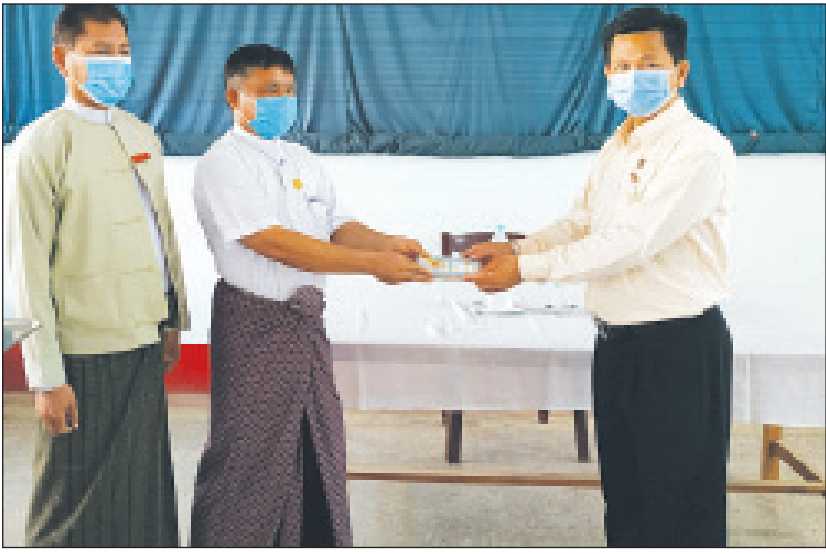
ကြီးနှင့် လက်ထောက်ဆရာဝန်များက ကိုယ်ပူခြင်း၊ စောင့်ရှောက်မှု (အခမဲ့) ကုသပေးသွားမည်ဖြစ်၍ များနာခြင်း၊ ချောင်းဆိုးခြင်း၊ မောပန်းခြင်း၊ ရင်ကျပ်ခြင်း၊ ဝမ်းပျက်ဝမ်းလျှော့ဖြစ်သူများကို ကျန်းမာရေး

မင်းလှ မေ ၁ ပဲခူးတိုင်းဒေသကြီး စိုက်ပျိုးရေး၊ မွေးမြူရေးနှင့် ဆည်မြောင်းဝန်ကြီးသည် မင်းလှမြို့နယ် ပြည်သူ့ဆေးရုံတွင်ဖွင့်လှစ်ထားသော Fever Clinic သို့ မေ ၁ ရက် နံနက် ၈ နာရီက ဆေးဝါးများ ဝယ်ယူရန် အလှူငွေများလှူဒါန်းခဲ့ကြောင်း သိရသည်။ တိုင်းဒေသကြီး စိုက်ပျိုးရေး၊ မွေးမြူရေးနှင့် ဆည်မြောင်းဝန်ကြီး ဦးအောင်နိုင်က Fever Clinic တွင် အမှန်တကယ်လိုအပ်သည့်ဆေးဝါးနှင့် အသုံးအဆောင်ပစ္စည်းများဝယ်ယူနိုင်ရေးအတွက် ငွေကျပ် ၈၅၀၀၀၀ ကို မြို့နယ်ဆရာဝန်ကြီးနှင့် မြို့နယ်အုပ်ချုပ်ရေးမှူးထံ ပေးအပ်လှူဒါန်းသည်။ အဆိုပါ Fever Clinic ဆေးခန်းသည် ကိုဗစ်-၁၉ ကမ္ဘာ့ကပ်ရောဂါဖြစ်ပွားချိန် ဆေးခန်းပြသရန် အခက်အခဲဖြစ်နေသူများအား တစ်ဖက်တစ်လမ်းမှကူညီကာ ကျန်းမာရေးစောင့်ရှောက်မှု ပေးနိုင်ရေးအတွက် ဖွင့်လှစ်ရခြင်းဖြစ်ကြောင်း၊ နေ့စဉ်နံနက် ၉ နာရီမှ မွန်းတည့် ၁၂ နာရီထိ ဖွင့်လှစ်၍ မြို့နယ်ဆရာဝန်