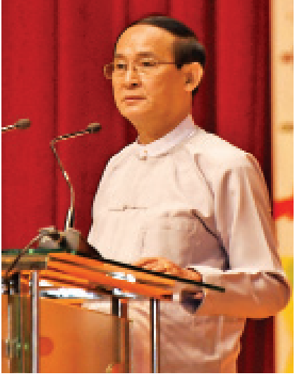
[နိုင်ငံတော်သမ္မတ ဦးဝင်းမြင့်၏ ၄-၁-၂၀၂၀ ရက်နေ့တွင် (၇၂) နှစ်မြောက် လွတ်လပ်ရေးနေ့ အထိမ်းအမှတ်အခမ်းအနားသို့ ပေးပို့သော သဝဏ်လွှာမှ ကောက်နုတ်ချက်]

ယနေ့ကာလသည် အတိတ်သမိုင်းကို သင်ခန်းစာယူကာ သံသယနှင့် ပဋိပက္ခများ ကင်းစင်ပျောက်ပြီး ရေရှည်တည်တံ့သည့် စစ်မှန်သော ငြိမ်းချမ်းရေးရရှိရန် တိုင်းရင်းသားညီအစ်ကို မောင်နှမများအားလုံး တစ်ဦးနှင့်တစ်ဦး နားလည်မှု၊ ယုံကြည်မှုရရှိရေးအတွက် ခိုင်မာသော ပြည်ထောင်စုစိတ်ဓာတ်ဖြင့် ကြိုးပမ်းဆောင်ရွက်လျက်ရှိသည့် အချိန်အခါဖြစ်ပါသည်။ ငြိမ်းချမ်းရေးနှင့် အမျိုးသားပြန်လည်သင့်မြတ်ရေး အတွက် ပြည်ထောင်စုငြိမ်းချမ်းရေးညီလာခံ-(၂၁) ရာစု ပင်လုံအစည်းအဝေးများကို သုံးကြိမ်အထိ အောင်မြင်စွာကျင်းပနိုင်ခဲ့ပြီး ဒီမိုကရေစီ ဖက်ဒရယ်ပြည်ထောင်စု တည်ဆောက်နိုင်ရေးအတွက် လိုအပ်သော သဘောတူညီချက်အချို့ကိုလည်း ရရှိထားပါသည်။ တိုင်းရင်းသားပြည်သူများ မျှော်လင့်တောင့်တလျက်ရှိသည့် ဒီမိုကရေစီဖက်ဒရယ်ပြည်ထောင်စုကြီးပေါ်ထွန်းလာရေးအတွက် ငြိမ်းချမ်းရေးလုပ်ငန်းစဉ်များအား စဉ်ဆက်မပြတ် ကြိုးပမ်းဆောင်ရွက်လျက်ရှိပါသည်။