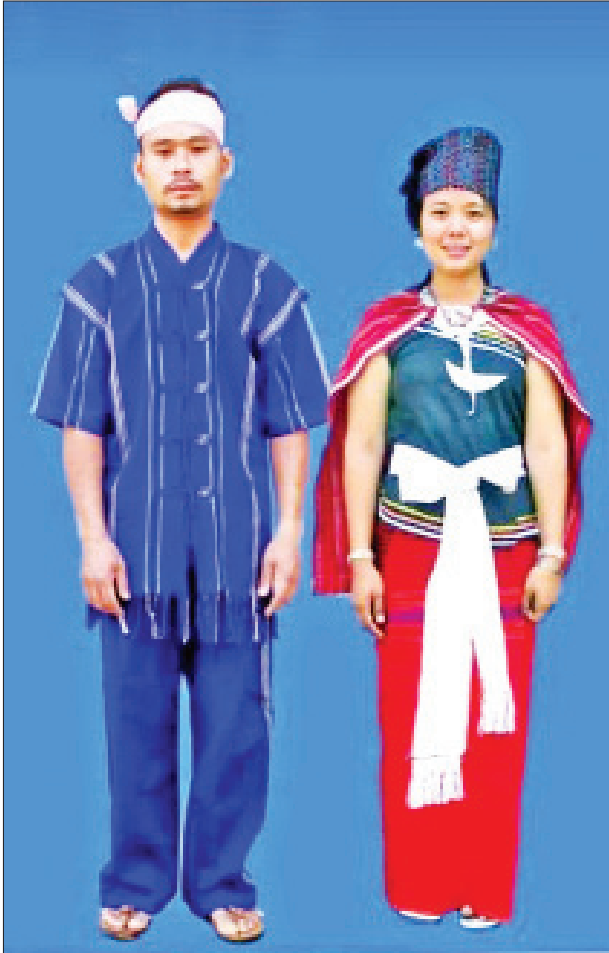
ကော်ယော် (မနုမနော)လူမျိုးစု ခေတ်သစ်ရိုးရာဝတ်စုံ

(၂) ထိုမှတစ်ဆင့် တောင်ဘက်သို့ ဆင်းလာရာ မြစ်ဝကျွန်းပေါ်နှင့်ပင်လယ်ပြင်အထိ ရောက်သွားခဲ့ကြသည်ဟု ဆိုပါသည်။ တောင်ဘက်သို့ ဆက်လက်