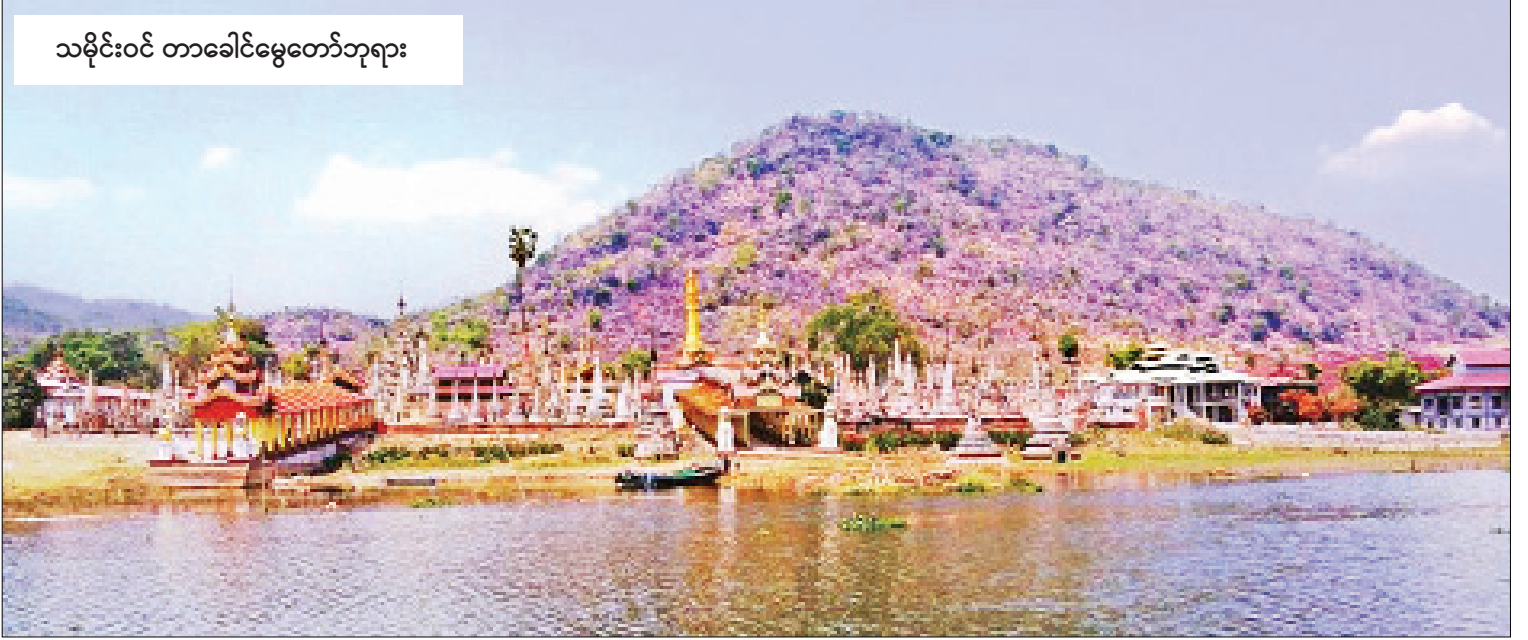
သမိုင်းဝင် တာခေါင်မွေတော်ဘုရား

စံကားကျေးရွာသည် ရှမ်းပြည်နယ်တောင်ပိုင်း ညောင်ရွှေမြို့နယ် အင်းလေးကန်တောင်ဘက် ပိုင်းတွင် မြောက်လတ္တီတွဒ် ၂၀ ဒီဂရီ ၀၉ ဒီဂရီ ၅၆ မိနစ်နှင့် အရှေ့ လောင်ဂျီတွဒ် ၉၉ ဒီဂရီ ၅၆ ၅၆ ဒီဂရီ ၄၇ မိနစ်ကြားတွင် တည်ရှိသည်။ ရှေးယခင်က စံကားစော်ဘွားများ အုပ်ချုပ်သော စံကားနယ်ဒေသဖြစ်ခဲ့သည်။ စတုရန်းမိုင်ပေါင်း ၃၅၀ ကျယ်ဝန်းသည်။ မြောက်ဘက်တွင် ညောင်ရွှေ၊ အရှေ့ဘက်တွင် ဆားထောင်၊ တောင်ဘက်တွင် နမ်းတုတ်နှင့်စကွယ်၊ အနောက်ဘက်တွင် လွယ်လုံ (ပင်လောင်း) နယ်တို့အကြားတွင် တည်ရှိသည်။ ညောင်ရွှေမြို့မှ ရေမိုင် ၃၇ မိုင် အကွာ ဘီလူးချောင်း၏ အရှေ့ဘက်နှင့် အနောက်ဘက် တစ်ဖက်တစ်ချက် ကမ်းပေါ်တွင် စံကားကျေးရွာတည်ရှိသည်။