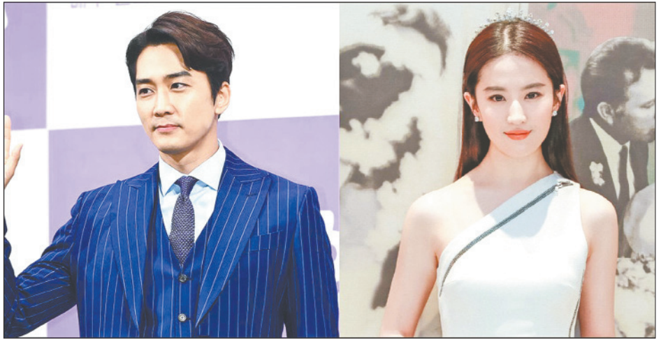
ဆောင်းဆန်ဟွန်းနဲ့ လျူရီဖိုင်တို့ဟာ တရုတ်-ကိုရီးယားရုပ်ရှင် The Third Way of Love ကို ရိုက်ကူးရင်း တွေ့ခဲ့ကြတာပါ။ အဆိုပါ ရုပ်ရှင်ရိုက်ကူးပြီး နောက်ပိုင်း ၂၀၁၅ ခုနှစ်အတွင်း သူတို့နှစ်ဦး ချစ်သူတွေအဖြစ် တရားဝင်လက်တွဲခဲ့သူတွေလည်း ဖြစ်ပါတယ်။ သုံးနှစ်ခန့် လက်တွဲခဲ့ပြီးနောက် ၂၀၁၈ ခုနှစ်အတွင်း လမ်းခွဲလိုက်ပြီ ဖြစ်ကြောင်း တရားဝင်ထုတ်ဖော်ပြောကြားခဲ့ကြတာဖြစ် တယ်လို့ သိရပါတယ်။

အဖြစ် ပြန်လည်လက်တွဲနေကြောင်း သတင်းတွေလည်း ထွက်လာခဲ့ပါတယ်။ ဒီလိုသတင်းတွေ ပေါ်ထွက်ပြီးနောက် နေ့မှာ ဆောင်းဆန်ဟွန်းရဲ့ ဖျော်ဖြေရေးအေဂျင်စီက ပြန်လည်ရှင်းချက်ထုတ်ခဲ့ပါတယ်။ အေဂျင်စီရဲ့ ပြောကြားချက်အရ ဒါဟာ ဝန်ထမ်းတစ်ဦးရဲ့ အမှားကြောင့်ဖြစ်ပြီး ဆောင်းဆန်ဟွန်းရဲ့ ဓာတ်လမ်းတွဲသစ်အတွက် ပိုစတာဓာတ်ပုံကို ဝိဘိုပေါ်မှာ ဖော်ပြခဲ့ရမှာ မတော်တဆ လျူရီဖိုင်နဲ့ ဓာတ်ပုံကို ကြိုက်နှစ်သက်ကြောင်း ဖော်ပြခဲ့တာဖြစ်တယ်လို့ သိရပါတယ်။ ဒါအပြင် အေဂျင်စီရဲ့ ပြောကြားချက်အရ လျူရီဖိုင်နဲ့ ဖော်ပြချက်တွေကို နှစ်ဦးစလုံးနဲ့ သူငယ်ချင်းဖြစ်နေတဲ့ အကောင့်ကနေတစ်ဆင့် တွေ့မြင်ခဲ့ရကြောင်း လတ်တလောမှာ ပေါ်ထွက်လာတဲ့ ကောလာဟလတွေမှာ မှန်ကန်မှုမရှိကြောင်းလည်း တစ်ပါတည်းပြောကြားခဲ့ပါတယ်။