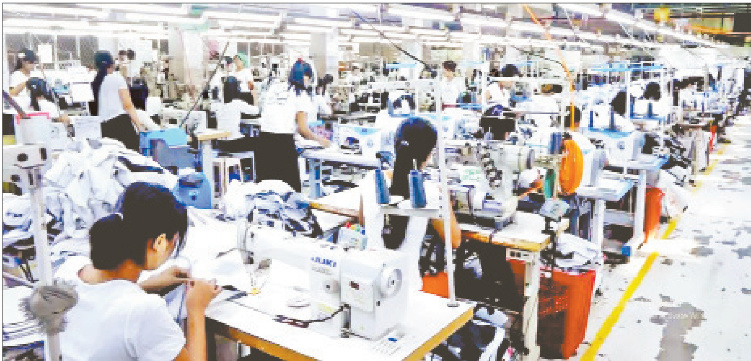
ရန်ကုန်မြို့ရှိ ပုဂ္ဂလိကအထည်ချုပ်စက်ရုံများမှ လုပ်ငန်းများလည်ပတ်နေမှုကို တွေ့ရစဉ်။