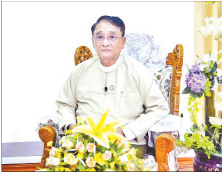
ပြည်ထောင်စုဝန်ကြီး ဒေါက်တာသန်းမြင့်

စီးပွားရေးနှင့် ကူးသန်းရောင်းဝယ်ရေး ဝန်ကြီးဌာနသည် ၂၀၁၈ - ၂၀၁၉ ဘဏ္ဍာနှစ်တွင် ပို့ကုန်အမေရိကန်ဒေါ်လာ ၁၆ ဒသမ ၉၁၉ ဘီလီယံ၊ သွင်းကုန်အမေရိကန်ဒေါ်လာ ၁၈ ဒသမ ၀၅၉ ဘီလီယံ၊ ကုန်သွယ်မှုပမာဏ အမေရိကန်ဒေါ်လာ ၃၄ ဒသမ ၉၇၉ ဘီလီယံ ဆောင်ရွက်နိုင်ခဲ့ပြီး ကုန်သွယ်မှုလုံခြုံရေး အမေ ရိကန်ဒေါ်လာ ၁ ဒသမ ၁၄ ဘီလီယံအထိ လျော့ ကျအောင် ဆောင်ရွက်နိုင်ခဲ့သည်ကို မြင်တွေ့ရ ပြီး ၂၀၁၉ - ၂၀၂၀ ဘဏ္ဍာနှစ်ဖြစ်သည့် ၂၀၂၀ ပြည့်နှစ် ဖေဖော်ဝါရီလ ၁၄ ရက်အထိ ပို့ကုန် အမေရိကန်ဒေါ်လာ ၆ ဒသမ ၇၆၁ ဘီလီယံ၊