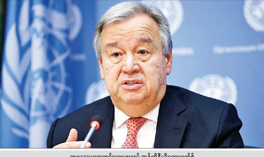
ကုလသမဂ္ဂအတွင်းရေးမှူးချုပ် အန်တိုနီယိုဂူတာရက်စ်