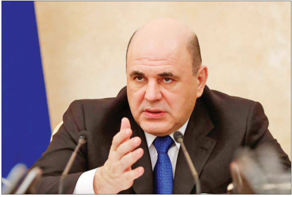
ရုရှားဝန်ကြီးချုပ် မီခေးလ်မီရှူစတင်

မော်စကို မေ ၁ ရုရှားဝန်ကြီးချုပ် မီခေးလ်မီရှူစတင်တွင် ကိုရိုနာဗိုင်းရပ်စ် ကူးစက်ခံရကြောင်း စမ်းသပ်တွေ့ရှိသဖြင့် လုပ်ဖော်ကိုင်ဖက်များကို ကာကွယ်ရန် သီးသန့်ခွဲနေထိုင်ရမည်ဟု မီခေးလ်က ရုရှားသမ္မတ ဗလာဒီမာပူတင်နှင့် ရုပ်သံအစည်းအဝေးတစ်ခုအတွင်း ပြောကြားခဲ့ပြီး ယာယီဝန်ကြီးချုပ်ခန့်အပ်ရန် အကြံပြုခဲ့သည်။ အစားထိုးခန့်အပ် သမ္မတပူတင်က ဒုတိယဝန်ကြီးချုပ်-၁ အန်ဒရေဘီလော့ဆော့စ်ကို ယာယီဝန်ကြီးချုပ်အဖြစ် အစားထိုးခန့်အပ်သော အမိန့်တစ်ရပ်ကို မြန်မြန်ဆန်ဆန် လက်မှတ်ရေးထိုးခဲ့သည်။ လူတိုင်း ကိုဗစ်-၁၉ ရောဂါကူးစက်ခံရနိုင်ပြီး မီခေးလ်မီရှူစတင် အရေးကြီးသော ဆုံးဖြတ်ချက်များ ပြုလုပ်မည်မဟုတ်ဟု သမ္မတ ပူတင်က ပြောကြားခဲ့သည်။ ပူတင်က မျက်နှာချင်းဆိုင် အစည်းအဝေးများ မကျင်းပသည်မှာ သီတင်းပတ်များစွာ ကြာမြင့်နေပြီဖြစ်ပြီး မီခေးလ်ကို အဆိုပါအခန်းတွင် မတ် ၂၄ ရက်က နောက်ဆုံးအကြိမ် မြင်တွေ့ခဲ့ခြင်းဖြစ်ကြောင်း ရုရှားသမ္မတရုံး ဝက်ဘ်ဆိုက်၏ ဖော်ပြချက်အရ သိရသည်။ ရုရှားနိုင်ငံတွင် ပြီးခဲ့သော ၂၄ နာရီအတွင်း အတည်ပြုထားသော ကိုဗစ်-၁၉ ရောဂါကူးစက်ခံရသူ ၇၀၉၉ ဦးရှိခဲ့ရာ ရောဂါကူးစက်ခံရသူပေါင်း ၁၀၆၄၉၈ ဦးနှင့် သေဆုံးသူပေါင်း ၁၀၇၃ ဦးအထိရှိလာခဲ့သည်ဟု အစိုးရ၏ နေ့စဉ်ကိုရိုနာဗိုင်းရပ်စ် နောက်ဆုံးအခြေအနေဖော်ပြချက်အရ သိရသည်။ နေ့စဉ် ကူးစက်မှုအရေအတွက် ထောင်ချီမြင့်တက်လာခြင်းကြောင့် ရုရှားနိုင်ငံမှာ ယခုအခါ ဥရောပတိုက်တွင် ကိုရိုနာဗိုင်းရပ်စ် ကူးစက်မှုသစ် အများဆုံးဖြစ်ပွားရာ နိုင်ငံဖြစ်လာသည်။ ကိုးကား-အေအက်ဖ်ပီ၊ ဘာသာပြန်-ကျော်ထိုက်စိုး