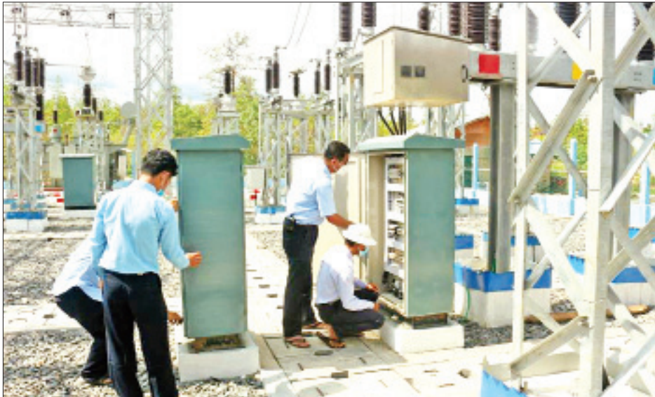
ဆောင်ရွက်သွားမည်ဖြစ်သည်။ စစ်ကိုင်းတိုင်းဒေသကြီးအတွင်းတွင် မြို့ပေါင်း ၅၀၊ ကျေးရွာပေါင်း ၅၉၉၂ ရွာရှိခဲ့ရာမှ ၂၀၁၆ ခုနှစ်တွင် မြို့ပေါင်း ၃၂ မြို့၊ ကျေးရွာပေါင်း ၁၃၄၇ ရွာတို့ကိုသာ လျှပ်စစ်ဓာတ်အားဖြန့်ဖြူးပေးနိုင်ခဲ့သော်လည်း ယခုအခါ မြို့ပေါင်း ၃၆ မြို့၊ ကျေးရွာပေါင်း ၂၆၀၉ ရွာတို့အား လျှပ်စစ်ဓာတ်အားဖြန့်ဖြူးပေးနိုင်ခဲ့ပြီဖြစ်သဖြင့် မြို့၊ လေးမြို့နှင့် ကျေးရွာပေါင်း ၁၂၆၂ ရွာတို့ကို တိုးချဲ့ဖြန့်ဖြူးပေးနိုင်ခဲ့ပြီးဖြစ်သည်။ အဆိုပါ ကလေး-မော်လိုက် ဓာတ်အားလိုင်းနှင့် မော်လိုက်ဓာတ်အားခွဲရုံစီမံကိန်းကို ၂၀၁၉ ခုနှစ် ဖေဖော်ဝါရီလတွင် စတင်တည်ဆောက်ခဲ့ပြီး ပေ ၁၂၀၀ ခန့် မြင့်မားသော သတင်းစဉ်

ထုတ်လုပ်ပေးနိုင်ရန်အတွက် ယခုနှစ်တွင် ၁၁၆၆ မဂ္ဂါဝပ် တိုးတက်ထုတ်လုပ်နိုင်ရေး စီမံဆောင်ရွက်လျက်ရှိရာ မကြာမီကာလတွင်လည်း ဓာတ်အားထုတ်လုပ်ရေးစက်ရုံများမှ လျှပ်စစ်ဓာတ်အားများကို တိုးချဲ့ထုတ်လုပ်နိုင်တော့မည်ဖြစ်သည်။ အခြားတစ်ဖက်တွင်လည်း ဓာတ်အားဖြန့်ဖြူးရေးအပိုင်းများကိုလည်း ကြိုးပမ်းဆောင်ရွက်ခဲ့ရာ စစ်ကိုင်းတိုင်းဒေသကြီး၊ မော်လိုက်မြို့နယ်နှင့် ပတ်ဝန်းကျင်ကျေးရွာများသို့ နိုင်ငံတော်ဓာတ်အားစနစ်မှဓာတ်အားပို့လွှတ်နိုင်ရေးအတွက် ၆၆ ကေဗီ ကလေး-မော်လိုက် ဓာတ်အားလိုင်း ၃၃.၄ မိုင်နှင့် ၆၆/၁၁ ကေဗီ ၁၀ အမီဗီအေ မော်လိုက် ဓာတ်အားခွဲရုံ တည်ဆောက်ခြင်းစီမံကိန်းမှာလည်း တစ်ခုအပါအဝင် ဖြစ်သည်။ စစ်ကိုင်းတိုင်းဒေသကြီး အထက်ချင်းတွင်းဒေသရှိ မော်လိုက်မြို့ပေါ်တွင် အိမ်ထောင်စုပေါင်း ၁၆၆၈ စု ရှိသည့် အနက် ၈၃၆ စုကိုသာ တစ်နေ့လျှင် ဒီဇယ်ဓာတ်အားပေးစက်ဖြင့် ၄ နာရီခန့်သာ ဓာတ်အားပေးခဲ့ရာမှ ယခုအခါတွင် မြို့ပေါ်အိမ်ထောင်စုပေါင်း ၁၆၆၈ စုနှင့် ပတ်ဝန်းကျင်ကျေးရွာများဖြစ်သည့် တွန်းပင်ကျေးရွာ၊ သရက်ပင်လယ်ချောင်ကျေးရွာ၊ မော်ကူးကျေးရွာ စသည့် ကျေးရွာ သုံးရွာကိုလည်း ယခု ၂၀၁၉-၂၀၂၀ ဘဏ္ဍာနှစ်အတွင်း၌ လျှပ်စစ်ဓာတ်အား ရရှိသွားမည်ဖြစ်ပြီး ကျန်ရှိသည့်ကျေးရွာများကိုလည်း လျှပ်စစ်ဓာတ်အားတိုးတက်ဖြန့်ဖြူးနိုင်ရန်အတွက် ဆက်လက်