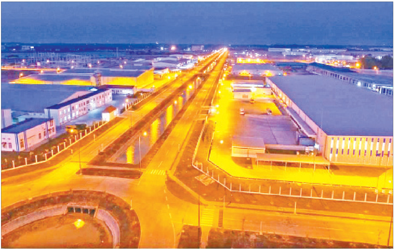
သီလဝါအထူးစီးပွားရေးဇုန် အပိုင်း(၁) တည်ဆောက်ပြီးစီးမှုအခြေအနေကို တွေ့ရစဉ်။

စီးပွားရေးနှင့်ကူးသန်း ရောင်းဝယ် ရေးဝန်ကြီးဌာနသည် နိုင်ငံတော် ၏ စီးပွားရေးမူဝါဒနှင့်အညီ “ကုန်သွယ်မှု လုပ်ငန်းများဖြင့် အမျိုးသားစီးပွားရေး ဖွံ့ဖြိုး တိုးတက်အောင် ဆောင်ရွက်ရန်” ဟူ၍ မျှော်မှန်းချက် ချမှတ်ထား သကဲ့သို့ ဈေးကွက်စီးပွားရေး စနစ်ကို ပီပြင်စွာ ဖြစ်ပေါ်ပြီး ကူးသန်းရောင်းဝယ်မှု ဖွံ့ဖြိုး တိုးတက်မှုမှတစ်ဆင့် နိုင်ငံတော် ၏ စီးပွားရေးဖွံ့ဖြိုး တိုးတက်မှုနှင့် အလုပ်အကိုင်များဖန်တီးနိုင်ရေး တို့ကို အထောက်အကူပြုရေး အတွက် ရည်ရွယ်