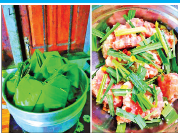
စိုင်းအောင်ဇော်လင်း(ပြန်/ဆက်)

ထောင်းပြီး တစ်ဆက်တည်းမှာ နှင်း၊ ငရုတ်သီးစိမ်း၊ ဆား၊ အချိုမှုန့် စတဲ့ ဟင်းခတ်အမွှေးအကြိုင်များနဲ့ သမအောင် ရောမွှေပေးပြီး အငန်၊ အစပ်အရသာ ကို မိမိကြိုက်နှစ်သက်တဲ့ အနေအထားမှာထားပြီးလျှင် ငှက်ပျောဖက်နှင့် ထုပ်ပြီး ပေါင်းအိုးနဲ့ နာရီဝက်/တစ်နာရီကြာ ကျက်အောင် ထည့်ပေါင်းရပါတယ်”ဟု ဝက်သားထုပ်ပြုလုပ်ရောင်းချသူ အမျိုးသမီးတစ်ဦး၏ ပြောပြချက်အရ သိရ သည်။ ဆီမလို၊ ကျန်းမာရေးနှင့်လည်းကိုက်ညီပြီး ရိုးရှင်းသော စွဲမက်ဖွယ်ရာ တိုင်းလိရိုးရာအစားအစာ မိုင်းယောင်းဝက်သားထုပ်ကို ထမင်း၊ ကောက်ညှင်း ပေါင်းများနှင့် စား၍ရသလို ဂျုံ၊ ပြောင်း၊ ကောက်ညှင်းကျည်တောက်၊ မုန့်ဖက် ထုပ်များနှင့်လည်း စား၍ရကြောင်း သိရသည်။