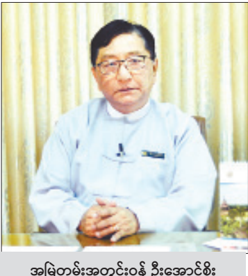
အမြဲတမ်းအတွင်းဝန် ဦးအောင်စိုး

ကုန်သွယ်မှုနှင့် ဆက်သွယ်ရေးအဖွဲ့အစည်း များ ဌာနခွဲတို့နှင့် ပူးပေါင်းအကောင်အထည် ဖော် ဆောင်ရွက်လျက်ရှိသည့်အပြင် ကမ္ဘာ့ ကုန်သွယ်ရေးအဖွဲ့နှင့်ပူးပေါင်း၍ မြန်မာနိုင်ငံ၏ ဒုတိယအကြိမ် ကုန်သွယ်မှုမူဝါဒဆန်းစစ်ခြင်း ဆိုင်ရာ အသိပညာပေး အလုပ်ရုံဆွေးနွေးပွဲနှင့် ကြိုတင်ပြင်ဆင်မှုများ ဆောင်ရွက်နိုင်ရေး အကြံပြုညှိနှိုင်းဆွေးနွေးပွဲကို ကျင်းပပြုလုပ်နိုင်ခဲ့ ကြောင်း ဝန်ကြီးဌာနမှ သိရသည်။