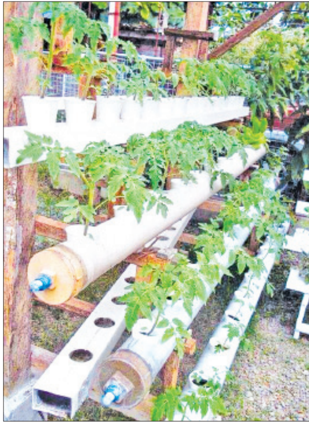
ဇလော်ချိုပျံ တိုင်လွတ်ပဲ၊ တိုင်ထောင်ပဲ၊ ဇလော်မိုးထောင်၊ ကြက်ဟင်းခါးသီး၊ ဟင်းနုနယ်၊ မုန့်ညင်းစိမ်း၊ ကိုက်လန်၊ ကန့်စွန်းရွက်၊ မုန့်ညင်းဖြူ၊ ခရမ်းသီး၊ မုန့်လာဥနီ၊ မုန့်လာဥဖြူ၊ ရွှေပဲရွက်၊ ပဲတောင့်ရှည်၊ ဗိုလ်စားပဲ၊ ပဲမျိုးစုံ၊ ဖရုံနံပင်၊ သင်္ဘော၊ ဂေါ်ဖီထုပ်၊ ဆလတ်၊ ပန်းဂေါ်ဖီစိမ်း စသည်တို့ကို ရှမ်းပြည်နယ် (တောင်ပိုင်း)၊ (မြောက်ပိုင်း)၊ (အရှေ့ပိုင်း) ရှိ ခရိုင်များသို့ အခမဲ့ပေးပို့ ဖြန့်ဝေသွားမည်ဖြစ်ကြောင်း သိရသည်။