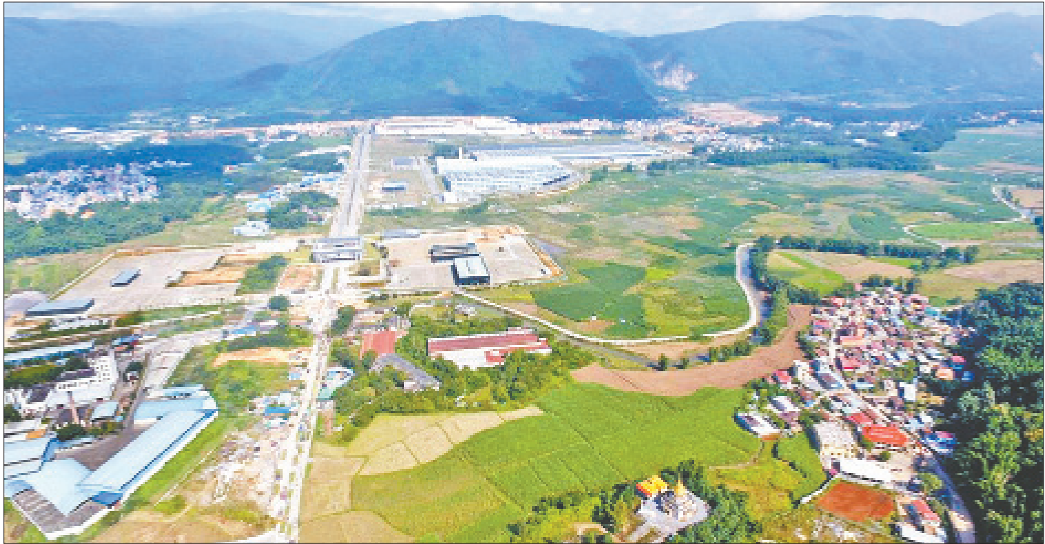
သစ်သီးများအဓိကတင်ပို့နေသည့် ကျင်စန်းကျော့ကုန်သွယ်ရေးဂိတ်ကို တွေ့ရစဉ်။