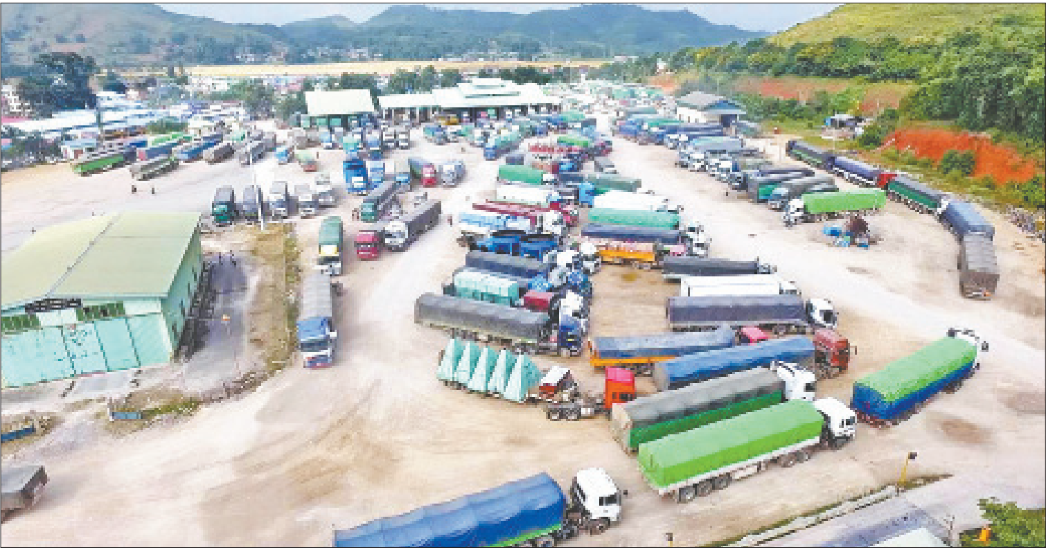
မူဆယ်(၁၀၅)မိုင်ကုန်သွယ်ရေးဇုန်အတွင်း ကုန်တင်ယာဉ်များကို တွေ့ရစဉ်။