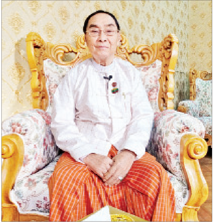
တိုင်းရင်းသားလူမျိုးရေးရာဝန်ကြီးဌာန ပြည်ထောင်စုဝန်ကြီး နိုင်ငံသက်လွင်

၂၀၂၀ ပြည့်နှစ်မှာ မြန်မာနိုင်ငံတိုင်းရင်းသားလုပ်ငန်းရှင်များအသင်းက ကြီးမှူးပြီး တိုင်းရင်းသားလူမျိုးများ စဉ်ဆက်မပြတ် ဖွံ့ဖြိုးတိုးတက်မှုဖိုရမ် (Ethnic Sustainable Development Forum) ကို နေပြည်တော်မှာ ကျင်းပနိုင်ရေး ဆောင်ရွက်လျက်ရှိပါတယ်။