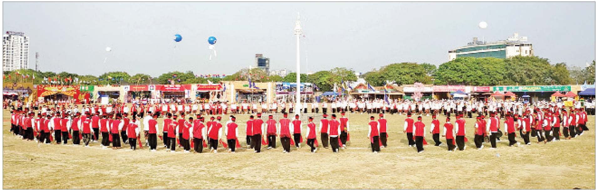
ရန်ကုန်မြို့၊ ကျိုက္ကဆံ အားကစားကွင်း၌ ဖေဖော်ဝါရီ ၁ ရက်က ကျင်းပသည့် သွေးချင်းတိုရဲ့ ပွဲတော်ဆီ (၂၀၂၀) ဖွင့်ပွဲအခမ်းအနားတွင် ကယားလူမျိုးတို့၏ တံခွန်တိုင်အကကို တွေ့ရစဉ်။