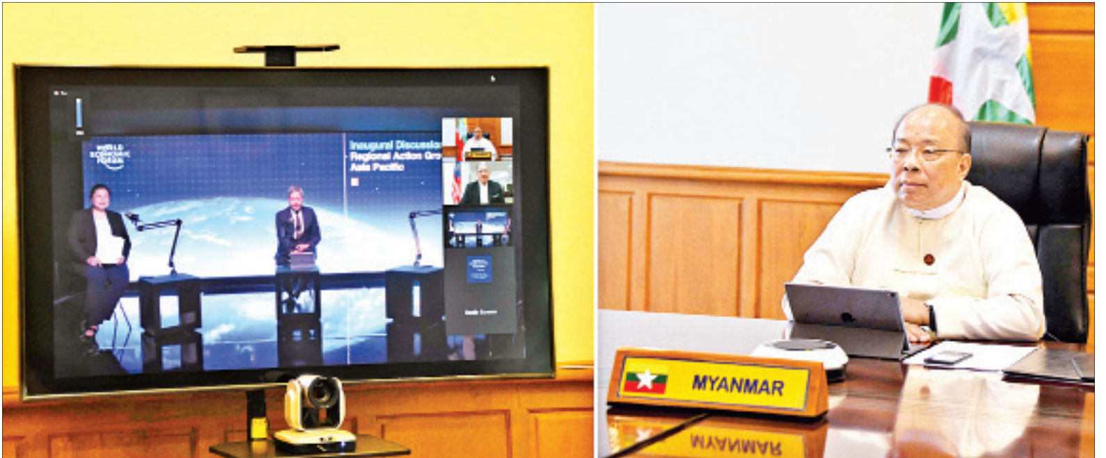
ပြည်ထောင်စုဝန်ကြီး ဦးသောင်းထွန်း ကမ္ဘာ့ကျန်းမာရေးအဖွဲ့နှင့် ကမ္ဘာ့စီးပွားရေးဖိုရမ်တို့ ပူးပေါင်း၍ Video Conference စနစ်ဖြင့် ကျင်းပသည့် ကိုဗစ်-၁၉ နှင့်စပ်လျဉ်း၍ အာရှ-ပစိဖိတ်ဒေသဆွေးနွေးပွဲတွင် ပါဝင်ဆွေးနွေးစဉ်။

နေပြည်တော် ဧပြီ ၂၁ ကမ္ဘာ့ကျန်းမာရေးအဖွဲ့ (WHO)နှင့် ပူးပေါင်း၍ ကမ္ဘာ့စီးပွားရေးဖိုရမ် (WEF) က Video Conference စနစ်ဖြင့် ကျင်းပသည့် ကိုဗစ်-၁၉ ရောဂါနှင့်စပ်လျဉ်း၍ အာရှ-ပစိဖိတ်ဒေသ အစိုးရနှင့် ပုဂ္ဂလိကကဏ္ဍမှ ဦးဆောင်သူများ၏ ဆွေးနွေးပွဲသို့ ရင်းနှီးမြုပ်နှံမှုနှင့် နိုင်ငံခြားစီးပွားဆက်သွယ်ရေး ဝန်ကြီးဌာန ပြည်ထောင်စုဝန်ကြီး ဦးသောင်းထွန်းသည် ယနေ့မနက် ၁ နာရီတွင် ပြည်ထောင်စုဝန်ကြီးရုံးခန်းမှ ပါဝင်တက်ရောက်သည်။ အဆိုပါ ဆွေးနွေးပွဲသို့ ကမ္ဘာ့စီးပွားရေးဖိုရမ်အဖွဲ့နှင့် ကမ္ဘာ့ကျန်းမာရေးအဖွဲ့တို့မှ တာဝန်ရှိသူများ၊ အာရှ-ပစိဖိတ်ဒေသတွင်းနိုင်ငံများမှ အစိုးရနှင့် ပုဂ္ဂလိကကဏ္ဍတို့မှ တာဝန်ရှိသူများနှင့် အသိပညာရှင် အတတ်ပညာရှင်များ ပါဝင်တက်ရောက်ကြပြီး စာမျက်နှာ ၄ ကော်လံ ၁ သို့ ၀