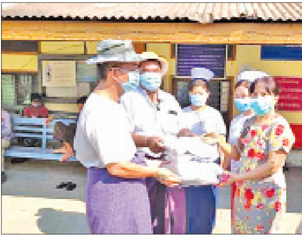
တောင်ဥက္ကလာပမြို့နယ် ပြည်သူ့ကျန်းမာရေးဦးစီးဌာနသို့ တစ်ကိုယ်ရေသုံး ကာကွယ်ရေးဝတ်စုံနှင့် နှာခေါင်းစည်းများ လှူဒါန်း