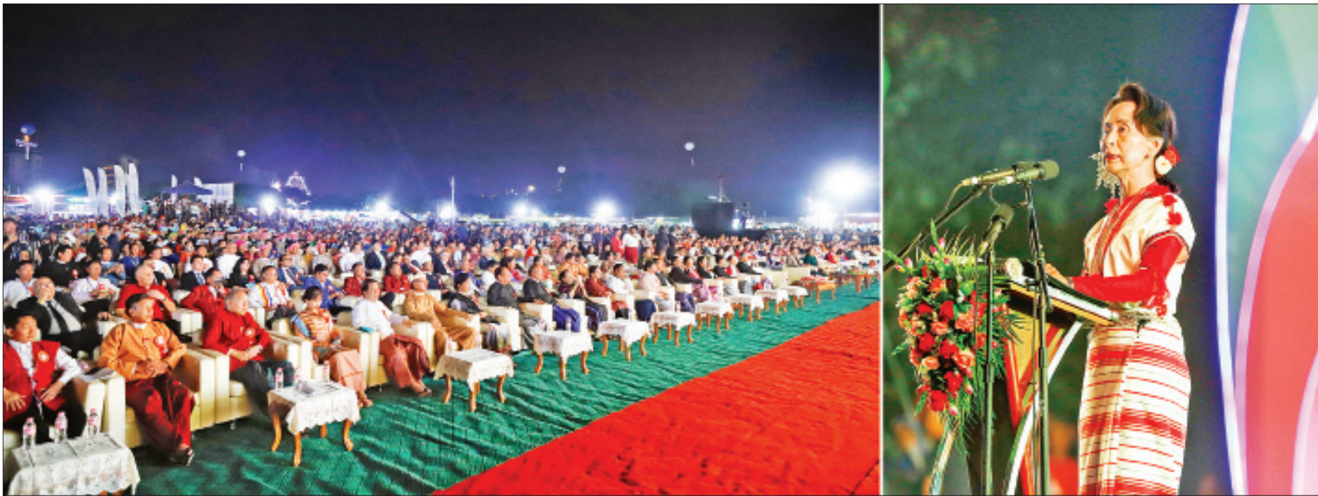
နိုင်ငံတော်၏ အတိုင်ပင်ခံပုဂ္ဂိုလ် ဒေါ်အောင်ဆန်းစုကြည် ရန်ကုန်မြို့၊ ကျိုက္ကဆံ အားကစားကွင်း၌ ဖေဖော်ဝါရီလ ၁ ရက်နေ့က ကျင်းပသည့် သွေးချင်းတို့ရဲ့ပွဲတော်ဆီ (၂၀၂၀) ဖွင့်ပွဲအခမ်းအနားတွင် အမှာစကားပြောကြားစဉ်။ (သတင်းစဉ်)