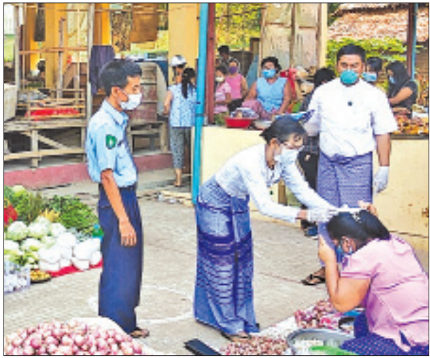
သရက်ချောင်းမြို့ စည်ပင်သာယာရေးဦး ဈေးရောင်းသူများအား ပလတ်စတစ်အကြည် မျက်နှာဖုံးများဝေငှ