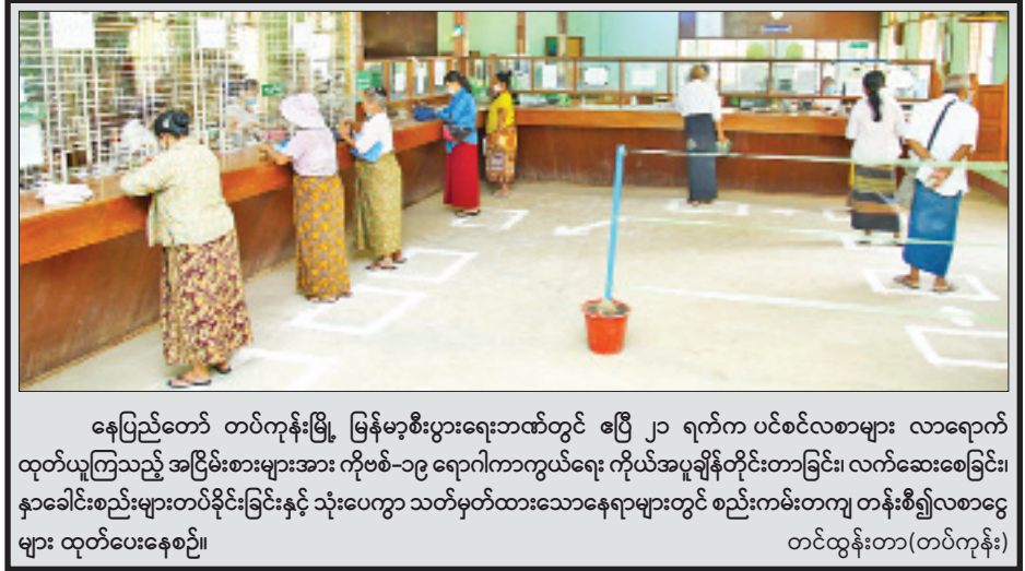
နေပြည်တော် တပ်ကုန်းမြို့ မြန်မာ့ဦးစီးဌာနတွင် ဧပြီ ၂၁ ရက်က ပင်စင်လစာများ လာရောက်ထုတ်ယူကြသည့် အငြိမ်းစားများအား ကိုဗစ်-၁၉ ရောဂါကာကွယ်ရေး ကိုယ်အပူချိန်တိုင်းတာခြင်း၊ လက်ဆေးစေခြင်း၊ နှာခေါင်းစည်းများတပ်ဆင်ခြင်းနှင့် သုံးပေကွာ သတ်မှတ်ထားသောနေရာများတွင် စည်းကမ်းတကျ တန်းစီ၍လစာငွေများ ထုတ်ပေးနေစဉ်။

◆ မန္တလေးတောင်ခြေအနီးမှ ထိုပြင် အဆိုပါ ပိုးသတ်ဆေးဖျန်းခြင်းလုပ်ငန်းများကို ယနေ့ဖွန်းလွှဲပိုင်းတွင်လည်း ပုသိမ်ကြီးမြို့နယ်ရှိ ရန်ကင်းတောင်၊ မဟာအောင်မြေမြို့နယ်ရှိ မြင်းဝန်မင်းကြီးကျောင်းတိုက်နှင့် ချမ်းမြသာစည်မြို့နယ်အတွင်းရှိ မြို့ဟောင်းဘူတာတို့တွင် မန္တလေးခရိုင် မီးသတ်တပ်ဖွဲ့နှင့် တပ်မတော်သားများ ပူးပေါင်း၍ ဆက်လက်ဆောင်ရွက်ခဲ့ကြသည်။ “ကိုဗစ်-၁၉ ရောဂါ ကူးစက်ဖြစ်ပွားမှုမရှိစေဖို့ ကာကွယ်တားဆီးရေးလုပ်ငန်းတွေအနေနဲ့ ပိုးသတ်ဆေးဖျန်းခြင်းလုပ်ငန်းတွေကို ကျွန်တော်တို့ မီးသတ်ဦးစီးဌာနက ရှိသမျှ အင်အားအကုန်အသုံးပြုပြီး ဆောင်ရွက်ပေးနေပါတယ်”ဟု ၎င်းက ပြောသည်။ မန္တလေးခရိုင်ဦးစီးဌာနမှ ကိုဗစ်-၁၉ ရောဂါကာကွယ်တားဆီးရေးလုပ်ငန်းများကို မြန်မာနိုင်ငံ၌ အဆိုပါ ရောဂါ စတင်ဖြစ်ပွားသည့်အချိန်မှစ၍ ခရိုင်အတွင်းရှိ မြို့နယ် ခုနစ်မြို့နယ်အလိုက် စီမံချက်များရေးဆွဲကာ လေးရက်လျှင် တစ်ကြိမ်နှုန်းဖြင့် မန္တလေးမြို့အတွင်းရှိ ရပ်ကွက်များ၊ ဈေးများ၊ ဆေးရုံများနှင့် အထက်ကရနေရာများတွင် တပ်ဖွဲ့ဝင်အင်အားများဖြင့် ပိုးသတ်ဆေးဖျန်းခြင်းလုပ်ငန်းများကို ဆောင်ရွက်ပေးလျက်ရှိကြောင်း သိရသည်။ မင်းထက်အောင်(မန်းကိုယ်ပွား)