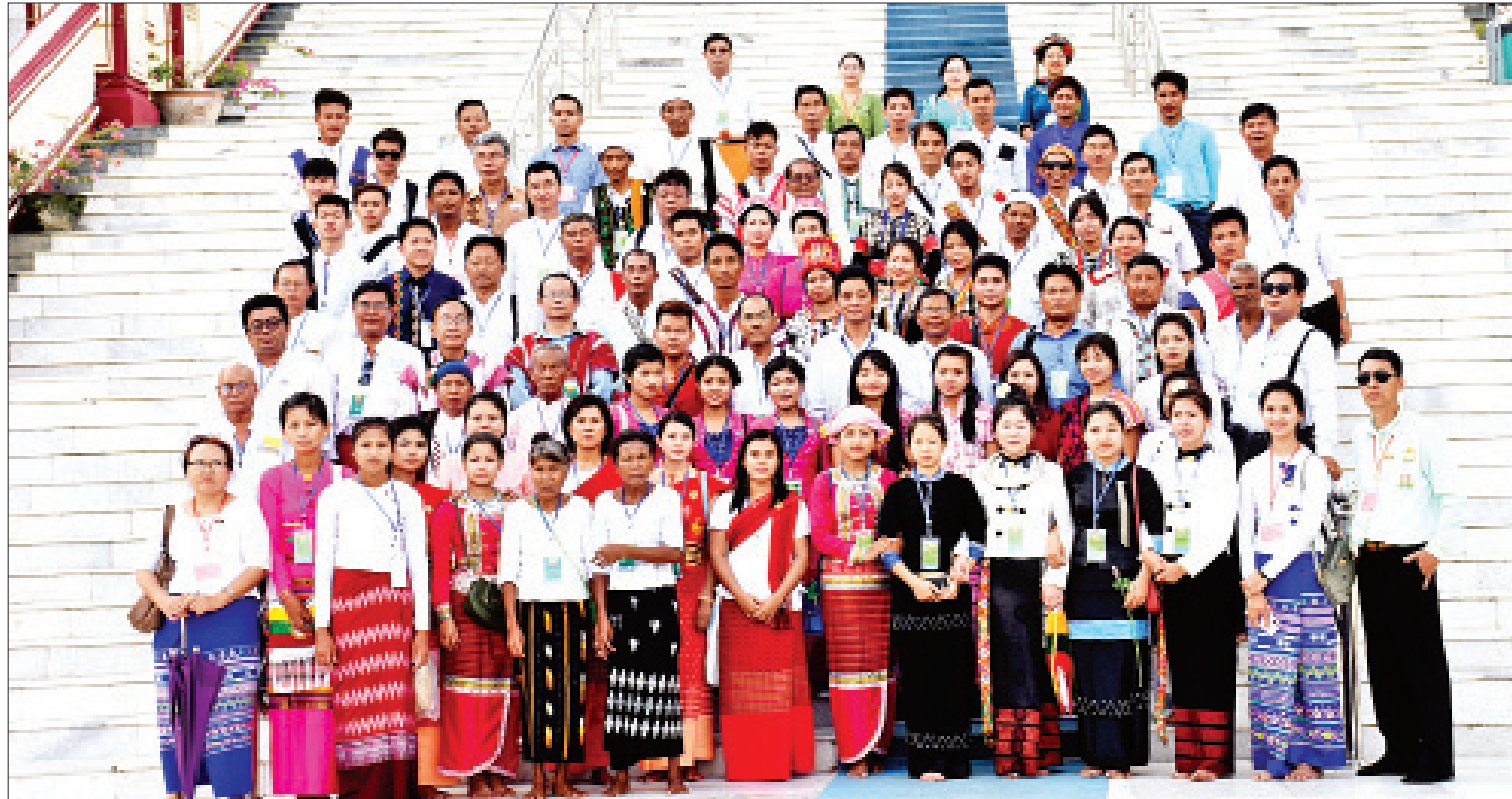
၂၉- ၅- ၂၀၁၉ ရက်နေ့၌ နေပြည်တော်တွင် လေ့လာရေးခရီးလာရောက်ကြသည့် တိုင်းရင်းသားလူမျိုးစုများ မဟာသကျရံသီဘုရားအား ဖူးမြော်ကြည့်ညိပြီး မှတ်တမ်းတင်ဓာတ်ပုံရိုက်စဉ်။

တိုင်းရင်းသားတွေကလည်း ဝန်ကြီးဌာနရဲ့ စေတနာနဲ့ လုပ်ဆောင်ပေးချက်တွေကို အသိအမှတ်ပြုပြီး အားလုံးပူးပေါင်းပါဝင် ဆောင်ရွက်ကြဖို့ လိုပါတယ်။ နိုင်ငံတော်ကြီးဟာ အားလုံးသော တန်းတူညီတူ အခွင့်အလမ်းတွေရရှိပြီး ငြိမ်းချမ်းသာယာတဲ့ နိုင်ငံတော်ကြီးအဖြစ် ဦးတည်သွားမှာ ဖြစ်ပါတယ်။