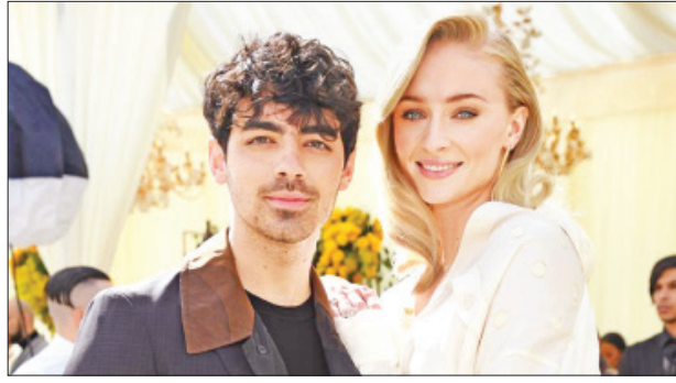
ဆေးရုံက ကျန်းမာရေးဝန်ထမ်းတွေအတွက် နေ့လယ်စာကို ဝန်ထမ်း ၁၀၀ အတွက် လှူဒါန်းခဲ့တာဖြစ်ပါတယ်။ ဒီလှူဒါန်းမှုတွေကို Fueling the Fearless အဖွဲ့နဲ့ပူးပေါင်းကာ လုပ်ဆောင်ခဲ့တာဖြစ်ပြီး ဒီအကြောင်း

ဟောလိဝုဒ်ကြယ်ပွင့် စုံတွဲတစ်တွဲဖြစ်တဲ့ ဂျိုဂျိုးနက်စ်နဲ့ ဆိုဖီယာတာနာ တို့ဟာ ကိုရိုနာဗိုင်းရပ်စ်ကူးစက်မှုတွေ ဖြစ်ပွားနေတဲ့ ကာလအတွင်း တိုက်ဖျက်ရေးလုပ်ငန်းတွေကို ရှေ့တန်းကနေ လုပ်ဆောင်နေကြတဲ့ ကျန်းမာရေးဝန်ထမ်းတွေအတွက် လတ်တလောမှာ နေ့လယ်စာ လှူဒါန်းခဲ့ကြောင်း ဟာပါဘဇာဒေါ့ကွန်းရဲ့ ရေးသားဖော်ပြချက်တွေအရ သိရပါတယ်။