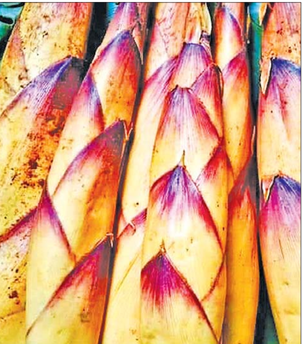
များကာ မိုင်းဖြတ်၊ ကျိုင်းတုံ၊ တွက်ခြေတိုက်ကြောင်း သိရသည်။ တာချီလိတ်မြို့များသို့ တစ်ဆင့်ဝယ်ယူရောင်းချသူများလည်း စီးပွားဖြစ် မိုင်းအောင်ဇော်လင်း (ပြန်/ဆက်)

မိုင်းယောင်း ဧပြီ ၁၄ ရမ်းပြည်နယ်(အရှေ့ပိုင်း) မိုင်းယောင်းမြို့နယ်တွင် မျှစ်ခါးများ လှိုင်လှိုင်ပေါ်၍ ဝယ်ယူသူများပြားသဖြင့် မျှစ်ခါးရှာဖွေရောင်းချသူများ မိသားစုဝင်ငွေအဆင်ပြေနေကြောင်း သိရသည်။ မျှစ်ခါးကို ဟင်းချိုရည်ချက်သောက်၍လည်းကောင်း၊ တို့စရာအဖြစ်လည်းကောင်း၊ အသားများနှင့် ကြော်ချက်၍လည်းကောင်း အမျိုးမျိုးချက်ပြုတ်ပြုလုပ်နိုင်သော သဘာဝရိုးရာအစားအစာတစ်မျိုးဖြစ်သည်။ မိုးဦးလေဦးများ တစ်ကြိမ်၊ နှစ်ကြိမ်ရွာပြီးက တောတောင်လျှိုမြောင်ထဲတွင် သဘာဝအတိုင်း ပေါက်ရောက်နေသော မျှစ်ခါးပင်များမှ မျှစ်ခါးများ လှိုင်လှိုင်ပေါ်ကြောင်း၊ မျှစ်ခါးငါးချောင်းပါ တစ်စည်းလျှင် ကျပ် ၁၀၀၀ ဖြင့် ရောင်းရကြောင်း သိရသည်။ မိုင်းယောင်းမျှစ်ခါးသည် အရသာကောင်းမွန်သဖြင့် ဒေသတွင်း လူကြိုက်