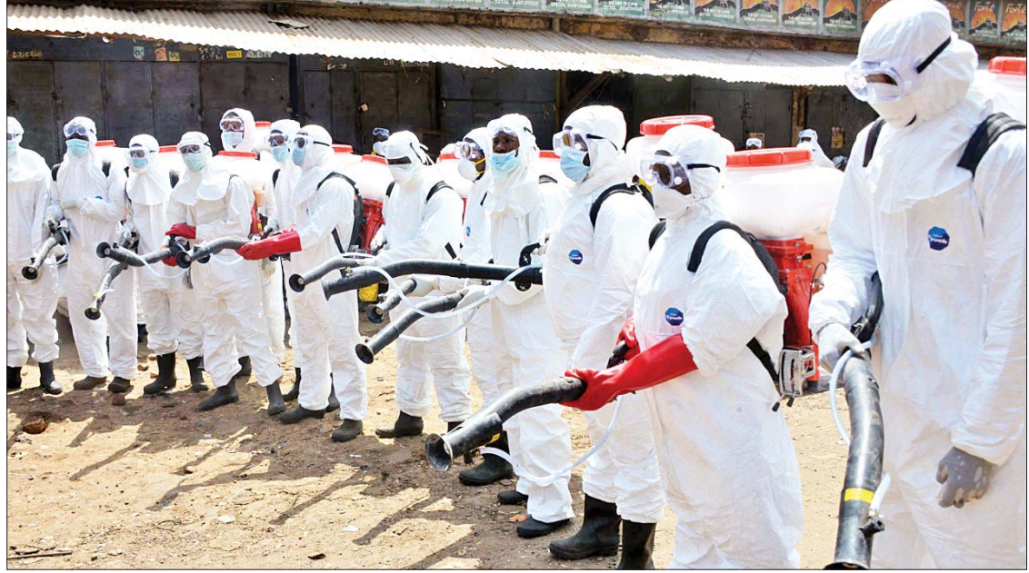
ဧပြီ ၁၂ ရက်က ဂီနီယာနိုင်ငံရှိ လမ်းများနှင့် ဈေးဆိုင်များတွင် ရောဂါကူးစက်မှုမဖြစ်ပွားစေရေး ပိုးသတ်ဆေးဖျန်းရန် ဝတ်စုံပြည့်ဝတ်ဆင်ထားသော အလုပ်သမားများအား တွေ့ရစဉ်။