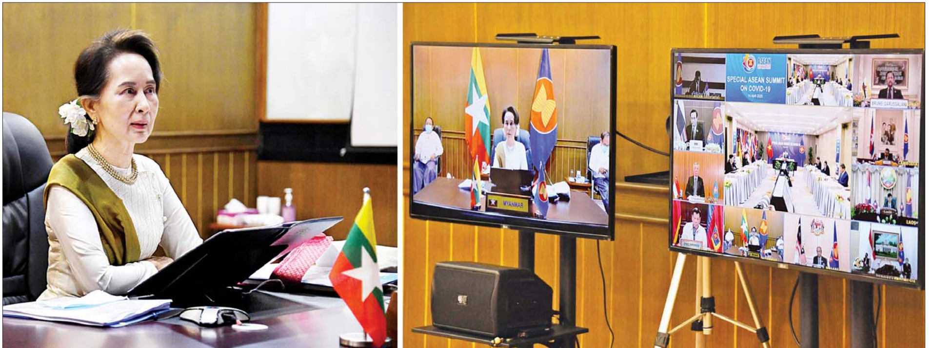
နိုင်ငံတော်၏အတိုင်ပင်ခံပုဂ္ဂိုလ် ဒေါ်အောင်ဆန်းစုကြည် Video Conferencing စနစ်ဖြင့် ကျင်းပပြုလုပ်သည့် COVID-19 ကူးစက်ရောဂါဆိုင်ရာ အာဆီယံအထူးထိပ်သီးအစည်းအဝေးသို့ ပါဝင်တက်ရောက်စဉ်။