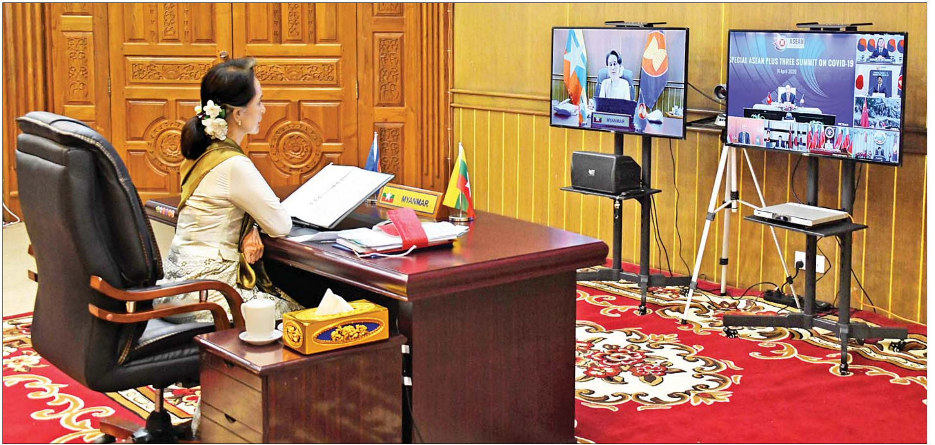
နိုင်ငံတော်၏အတိုင်ပင်ခံပုဂ္ဂိုလ် ဒေါ်အောင်ဆန်းစုကြည် Video Conferencing စနစ်ဖြင့် ကျင်းပပြုလုပ်သည့် COVID-19 ကူးစက်ရောဂါဆိုင်ရာ အာဆီယံအပေါင်းသုံး အထူးထိပ်သီးအစည်းအဝေးသို့ ပါဝင်တက်ရောက်စဉ်။

★ ရှေ့ဖူးမှ အာဆီယံအထူးထိပ်သီးအစည်းအဝေးနှင့် အာဆီယံအပေါင်းသုံး အထူးထိပ်သီးအစည်းအဝေးတို့တွင် ဗီယက်နမ် ဝန်ကြီးချုပ် Nguyen Xuan Phuc က သဘာပတိအဖြစ် ဆောင်ရွက်သည်။ အာဆီယံအထူးထိပ်သီးအစည်းအဝေးသို့ အာဆီယံအဖွဲ့ဝင်နိုင်ငံများမှ ခေါင်းဆောင်များနှင့် အာဆီယံအတွင်းရေးမှူးချုပ်တို့ ပါဝင်တက်ရောက်ပြီး အာဆီယံအပေါင်းသုံး အထူးထိပ်သီးအစည်းအဝေးသို့ အာဆီယံခေါင်းဆောင်များနှင့် အပေါင်းသုံးနိုင်ငံများဖြစ်သည့် တရုတ်၊ ဂျပန်၊ တောင်ကိုရီးယားနိုင်ငံများမှ ခေါင်းဆောင်များအပြင် ကမ္ဘာ့ကျန်းမာရေးအဖွဲ့၊ ညွှန်ကြားရေးမှူးချုပ်နှင့် အာဆီယံအတွင်းရေးမှူးချုပ်တို့ ပါဝင်တက်ရောက်ခဲ့ကြသည်။