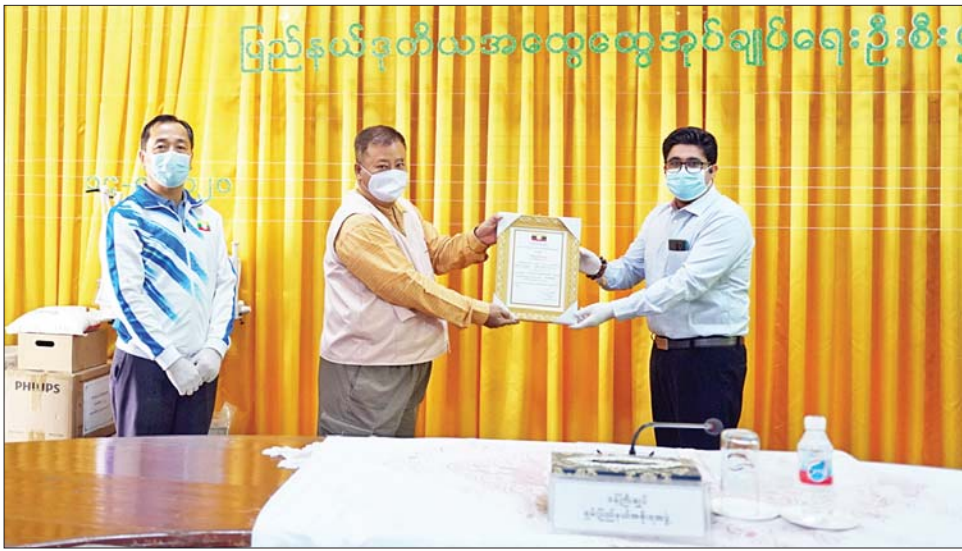
ပြည်နယ်ဒုတိယအထွေထွေအုပ်ချုပ်ရေးဦးစီးဌာန