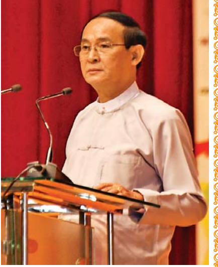
[နိုင်ငံတော်သမ္မတ ဦးဝင်းမြင့်၏ ၄-၁-၂၀၂၀ ရက်နေ့တွင် (၇၂) နှစ်မြောက် လွတ်လပ်ရေးနေ့ အထိမ်းအမှတ်အခမ်းအနားသို့ ပေးပို့သော သဝဏ်လွှာမှ ကောက်နုတ်ချက်]

ယနေ့ကာလသည် အတိတ်သမိုင်းကို သင်ခန်းစာယူကာ သံသယနှင့် ပဋိပက္ခများ ကင်းစင်ပျောက်ပြီး ရေရှည်တည်တံ့သည့် စစ်မှန်သော ငြိမ်းချမ်းရေးရရှိရန် တိုင်းရင်းသားညီအစ်ကို မောင်နှမများအားလုံး တစ်ဦးနှင့်တစ်ဦး နားလည်မှု၊ ယုံကြည်မှုရရှိရေးအတွက် ခိုင်မာသော ပြည်ထောင်စုစိတ်ဓာတ်ဖြင့် ကြိုးပမ်းဆောင်ရွက်လျက်ရှိသည့် အချိန်အခါဖြစ်ပါသည်။ ငြိမ်းချမ်းရေးနှင့် အမျိုးသားပြန်လည်သင့်မြတ်ရေး အတွက် ပြည်ထောင်စုငြိမ်းချမ်းရေးညီလာခံ-(၂၁) ရာစုပင်လုံ အစည်းအဝေးများကို သုံးကြိမ်အထိ အောင်မြင်စွာကျင်းပနိုင်ခဲ့ပြီး ဒီမိုကရေစီ ဖက်ဒရယ်ပြည်ထောင်စု တည်ဆောက်နိုင်ရေးအတွက် လိုအပ်သော သဘောတူညီချက်အချို့ကိုလည်း ရရှိထားပါသည်။ တိုင်းရင်းသားပြည်သူများ မျှော်လင့်တောင့်တလျက်ရှိသည့် ဒီမိုကရေစီဖက်ဒရယ်ပြည်ထောင်စုကြီးပေါ်ထွန်းလာရေးအတွက် ငြိမ်းချမ်းရေးလုပ်ငန်းစဉ်များအား စဉ်ဆက်မပြတ် ကြိုးပမ်းဆောင်ရွက်လျက်ရှိပါသည်။