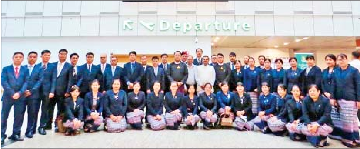
၂၂-၈-၂၀၁၉ က ပြည်ထောင်စုတရားသူကြီးချုပ်ရုံးနှင့် အိန္ဒိယနိုင်ငံ အမျိုးသားတရားစီရင်ရေးအကယ်ဒမီတို့အကြား ရေးထိုးထားသည့် နားလည်မှုစာချွန်လွှာအရ ပထမအကြိမ် တရားစီရင်ရေးသင်တန်းသို့ သင်တန်းသား ၄၀ စေလွှတ်စဉ်။

ပြည်ထောင်စုတရားလွှတ်တော်ချုပ်ရဲ့ ၂၀၁၉ ခုနှစ် ဒီဇင်ဘာလ ၁၆ ရက် ရက်စွဲပါ အမိန့်ကြော်ငြာစာအမှတ် (၁၀၈၃/ ၂၀၁၉)နဲ့ “ဝ”ကိုယ်ပိုင်အုပ်ချုပ်ခွင့်ရတိုင်းတရားရုံးကို ဖွဲ့စည်းပြီး ဟိုပန်၊ မိုင်းမော၊ ပန်ပိုင်၊ နားဖန်း၊ မက်မန်းနဲ့ ပန်ဆန်း(ပန်ခမ်း) မြို့နယ်တွေမှာ ဖြစ်ပွားတဲ့ ရာဇဝတ်မှုနဲ့ တရားမမှုတွေကို စစ်ဆေးစီရင်နိုင်ဖို့ စီရင်ပိုင်ခွင့်အာဏာကို အပ်နှင်းခဲ့ပါတယ်။