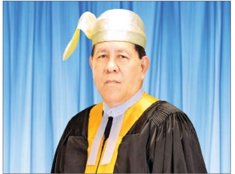
ပြည်ထောင်စုတရားသူကြီးချုပ် ဦးထွန်းထွန်းဦး

တွေ့ဆုံမေးမြန်း - နိုင်လင်းကြည်၊ ဓာတ်ပုံ - ဟိန်းစည်သူ