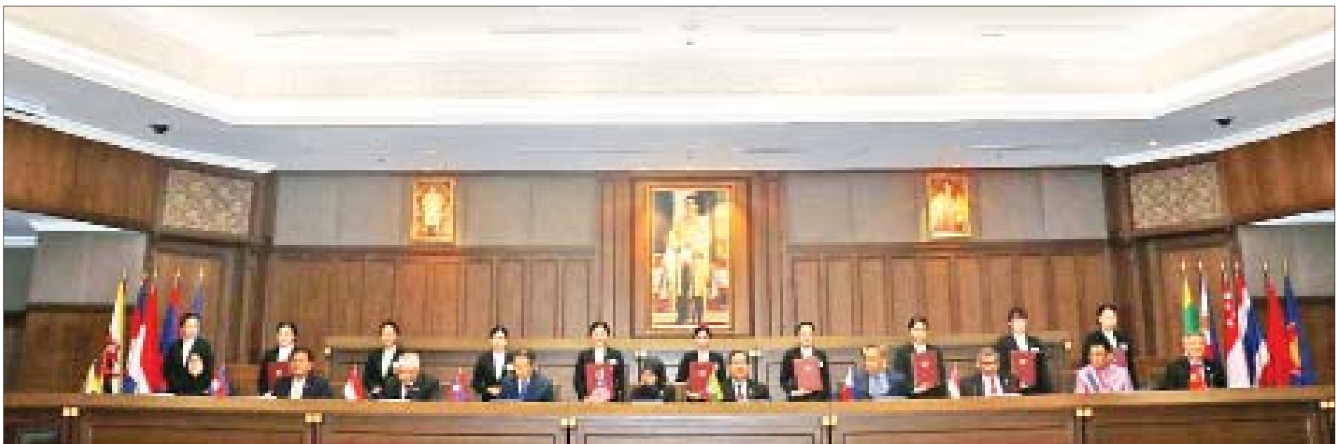
ပြည်ထောင်စုတရားသူကြီးချုပ် ဦးထွန်းထွန်းဦး အာဆီယံနိုင်ငံများမှ တရားသူကြီးချုပ်များ၊ တရားရေးအကြီးအကဲများနှင့်အတူ “ဗန်ကောက် ကြေညာချက်”ကို လက်မှတ်ရေးထိုးစဉ်။