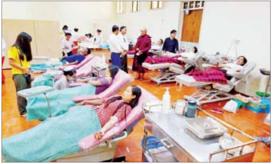
ရန်ကုန်ပြည်သူ့ဆေးရုံကြီး အမျိုးသားသွေးဌာနနှင့် ရွှေပါရမီအဖွဲ့ဝင်များ စုပေါင်းသွေးလှူဒါန်းကြသည်ကို တွေ့ရစဉ်။

အမျိုးသားသွေးဌာနအား နံနက် ၈ နာရီမှ ၂၂ နာရီ အထိ ပိတ်ရက်မရှိဖွင့်လှစ်ပေးထားပြီး စေတနာသွေးလှူရှင်