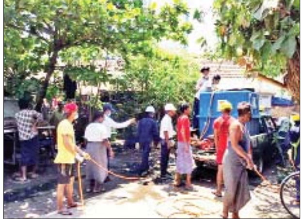
သိမ်ဖြူရထားရပ်ကွက်အိမ်ရာများအား ကလိုရင်း ပိုးသတ်ဆေးဖျန်းခြင်းလုပ်ငန်းများ ဆောင်ရွက်နေစဉ်။