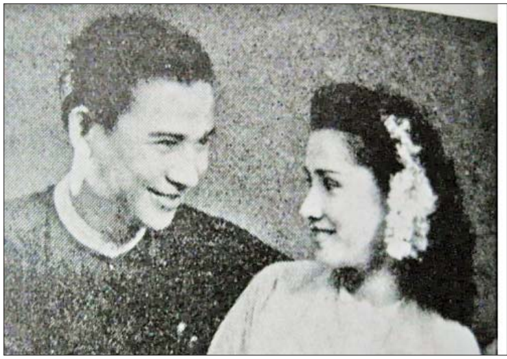
မျိုးချစ်၊ ဝင်နီ

ထိုင်နေရင်လည်း “သောဘဂါ ဣတိပိ အရဟံ အရဟံဗုဒ္ဓေါ အရဟံဘဂါ သိဒ္ဓိ” ရောက်အောင်ဒါပဲ။ ကြည်စိုးထွန်း။ ။ ဘာသာရေးပဲ။ ဒိုင်ဗင်တင်လှ။ ။ အာရုံပြုနေတာ။ စာမျက်နှာ ၉ သို့+ စတန်မင်းသားတွေ။