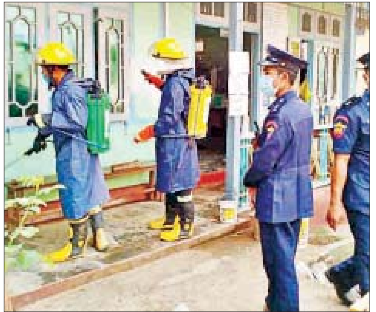
ရုံးအတွင်း၊ အပြင်၊ ရုံးရှေ့၊ မြေစိုက်ဘုတ်နှင့် ဆေးဖျန်းဆောင်ရွက်ခဲ့ကြောင်း သိရ လူဝင်၊ လူထွက်များသောနေရာအားလုံးကို သည်။ မျိုးလွင်(ပင်လည်ဘူး)

ထိုသို့ဆောင်ရွက်ရာတွင် မိမိတို့ရုံးအနေဖြင့် ပြည်သူများအသုံးပြု ဝင်ထွက်သွားလာလျက် ရှိပြီး စာကြည့်တိုက်ရှိစာအုပ်များ လာရောက် ငှားရမ်းကြသော စာပေချစ်မြတ်နိုးသူ ရဟန်း ရှင်လှ၊ မိဘပြည်သူ၊ ကျောင်းသား ကျောင်းသူ များအားလုံး ကိုဗစ်-၁၉ ရောဂါကူးစက်ပျံ့နှံ့မှု အန္တရာယ်မှ ကာကွယ်ရန်ရည်ရွယ်၍ လူထု အခြေပြုဗဟိုဌာနခန်းမ၊ ကလေးစာဖတ်ခန်း၊