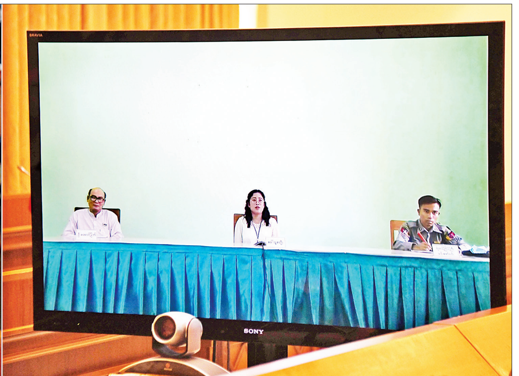
Coronavirus Disease 2019 (COVID-19) ကာကွယ်၊ ထိန်းချုပ်၊ ကုသရေး အမျိုးသားအဆင့်ဗဟိုကော်မတီဥက္ကဋ္ဌ၊ နိုင်ငံတော်၏အတိုင်ပင်ခံပုဂ္ဂိုလ် ဒေါ်အောင်ဆန်းစုကြည် COVID-19 ကာကွယ်၊ ထိန်းချုပ်၊ ကုသရေးလုပ်ငန်းများတွင် ကရင်ပြည်နယ်မှ ပါဝင်ဆောင်ရွက်နေသူများနှင့်တွေ့ဆုံ၍ လက်တွေ့အခြေအနေများအား အပြန်အလှန်ဆွေးနွေးစဉ်။

နေပြည်တော် ဧပြီ ၃ Coronavirus Disease 2019 (COVID-19) ကာကွယ်၊ ထိန်းချုပ်၊ ကုသရေး အမျိုးသားအဆင့်ဗဟိုကော်မတီဥက္ကဋ္ဌ၊ နိုင်ငံတော်၏အတိုင်ပင်ခံပုဂ္ဂိုလ် ဒေါ်အောင်ဆန်းစုကြည်သည် ယနေ့နံနက်ပိုင်းတွင် နေပြည်တော်ရှိ နိုင်ငံတော်သမ္မတအိမ်တော် အစည်းအဝေးခန်းမ၌ COVID-19 ကာကွယ်၊ ထိန်းချုပ်၊ ကုသရေးလုပ်ငန်းများတွင် ကရင်ပြည်နယ်မှ ပါဝင်ဆောင်ရွက်နေသူများနှင့် Video Conferencing စနစ်