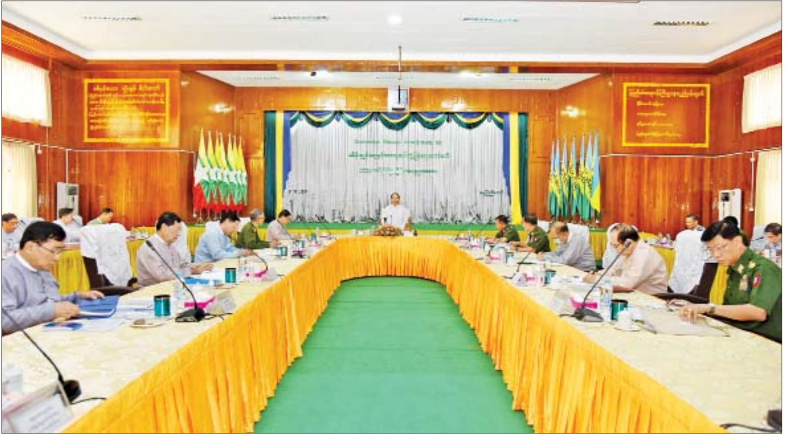
ဒုတိယသမ္မတ ဦးမြင့်ဆွေ COVID-19 ထိန်းချုပ်ရေးနှင့် အရေးပေါ်တုံ့ပြန်ရေးကော်မတီ ပထမအကြိမ် ညှိနှိုင်းအစည်းအဝေးတွင် အမှာစကားပြောကြားစဉ်။

နေပြည်တော် ဧပြီ ၃ Coronavirus Disease 2019 (COVID-19) ထိန်းချုပ်ရေးနှင့် အရေးပေါ်တုံ့ပြန်ရေး ကော်မတီ ပထမအကြိမ် ညှိနှိုင်းအစည်းအဝေးကို ယနေ့နံနက် ၉ နာရီခွဲတွင် နေပြည်တော်ရှိ ပြည်ထဲရေးဝန်ကြီးဌာန အစည်းအဝေးခန်းမ၌ ကျင်းပရာ Coronavirus Disease 2019 (COVID-19) ထိန်းချုပ်ရေးနှင့် အရေးပေါ်တုံ့ပြန်ရေးကော်မတီ ဥက္ကဋ္ဌ၊ ဒုတိယသမ္မတ ဦးမြင့်ဆွေ တက်ရောက် အမှာစကားပြောကြားသည်။