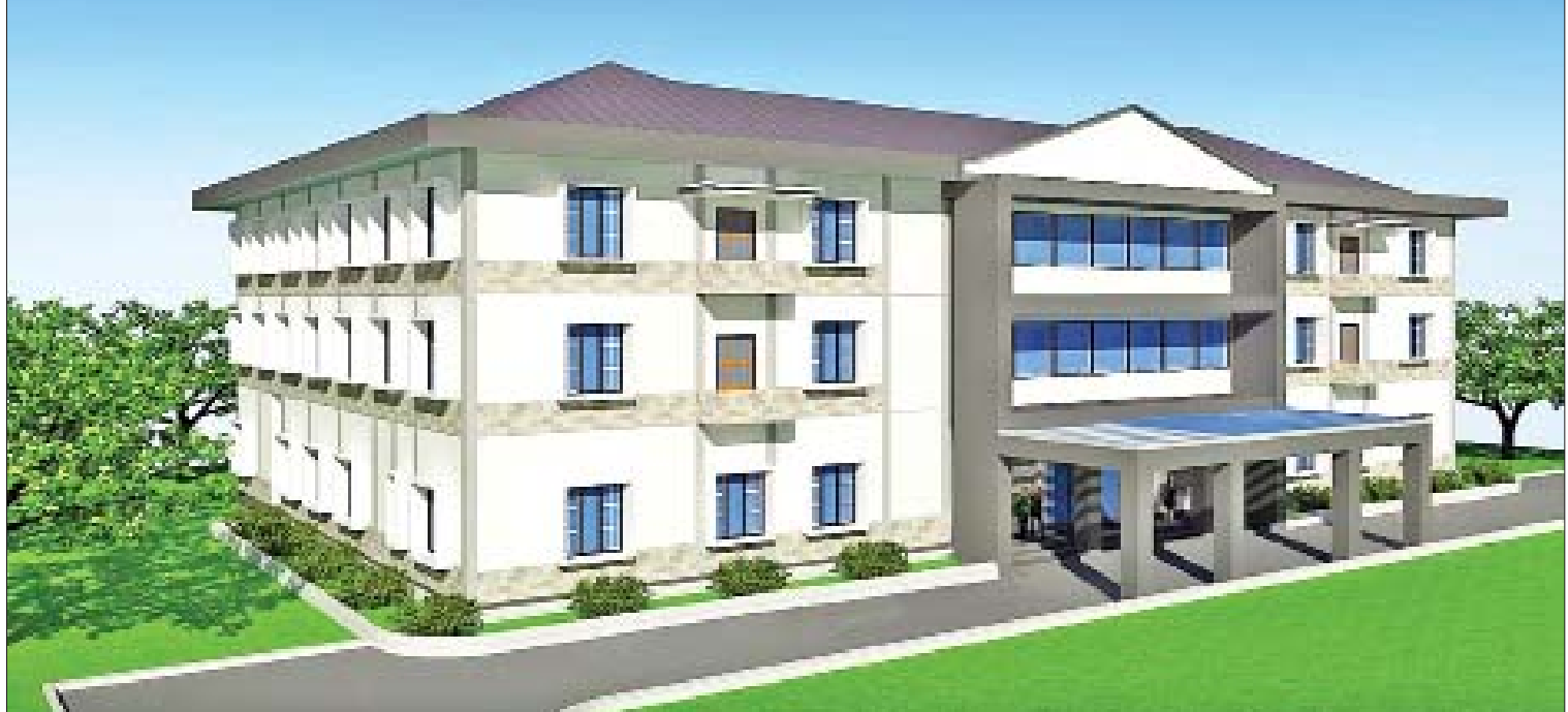
ပြည်ထောင်စုတရားလွှတ်တော်ချုပ် Judicial College အဆောက်အဦပုံစံကို တွေ့ရစဉ်။

ဟုတ်ကဲ့ပါ အခုလို ပြည့်ပြည့်စုံစုံဖြေကြားပေးတဲ့အတွက် ကျေးဇူးတင်ပါတယ်။ ။