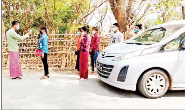
ဆောင်ရွက်မှုတွင် မြို့နယ်အုပ်ချုပ်ရေးမှူး၏ ရပ်ကွက်စာရေးများနှင့်အတူ ပူးပေါင်း ကြီးကြပ်မှုဖြင့် မြို့နယ်ရဲတပ်ဖွဲ့ဝင်များ၊ ဆောင်ရွက်ခဲ့ကြောင်း သိရသည်။ အထွေထွေအုပ်ချုပ်ရေးဦးစီးဌာန ဝန်ထမ်းများ၊ ပြည့်(ပြန်/ဆက်)

ကွန်ဟိန်း ဧပြီ ၂ ရှမ်းပြည်နယ်(တောင်ပိုင်း) ကွန်ဟိန်းမြို့၌ ယနေ့ နံနက် ၈ နာရီက ရပ်ကွက်၊ ကျေးရွာ အုပ်စုများအတွင်း အသက်ရှူလမ်းကြောင်း ဆိုင်ရာ ကိုဗစ်-၁၉ ရောဂါကူးစက်ပြန့်ပွားမှု မရှိရေးအတွက် တာချီလိတ်နယ်စပ် ဝင်ပေါက်မှ ဝင်ရောက်လာသည့် မော်တော် ယာဉ်များတွင် မြို့နယ်အတွင်းနေထိုင်သူများ ပါရှိခြင်း ရှိ မရှိ စစ်ဆေးခြင်း၊ ကျန်းမာရေး စစ်ဆေးခြင်း၊ ရောဂါကူးစက်နိုင်ခြေရှိသည့် နည်းလမ်းများ၊ သံသယဖြစ်ဖွယ်ရောဂါ လက္ခဏာများ၊ ကာကွယ်နိုင်မည့်နည်းလမ်း များအပြင် လူစုလူဝေးရှိသည့် နေရာများသို့ သွားလာခြင်းမှ ရှောင်ကြဉ်ရန်နှင့် သတ်မှတ် စောင့်ကြည့်ကာလ ၁၄ ရက်ကို အသွားအလာ ကန့်သတ်ပြီး အိမ်၌သီးခြားနေထိုင်ရန် ပညာ ပေးခြင်းများ ဆောင်ရွက်ခဲ့သည်။ အဆိုပါ