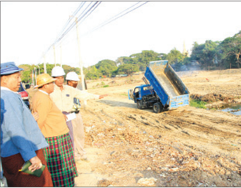
ဟံသာဝတီမြို့ဟောင်း ကျုံးတူးဖော်မှုနှင့် ကျုံးပတ်လမ်းတူးဖော်နေမှု ကြည့်ရှုစစ်ဆေး

ပဲခူး ဧပြီ ၂ ပဲခူးတိုင်းဒေသကြီးဝန်ကြီးချုပ် ဦးဝင်းသိန်းသည် ဧပြီ ၁ ရက် ညနေ ၅ နာရီက ပဲခူးမြို့တွင် ဟံသာဝတီမြို့ဟောင်း ကျုံးတူးဖော်မှုနှင့် ကျုံးပတ်လမ်းအတွင်း/အပြင် တူးဖော် နေမှုအား ကြည့်ရှုစစ်ဆေးသည်။