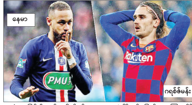
နေမာ (ယူရို ၂၂) သန်းနဲ့ ပြောင်းရွှေ့ခဲ့တာဖြစ်ပါတယ်။ တိုက်စစ်မှူးနေမာဟာ ၂၀၁၇ ခုနှစ်က ဘာစီလိုနာအသင်းကနေ ပီအက်စ်ဂျီအသင်းဆီ

ဂရစ်မန်ဟာ အခုနှစ် ဘောလုံးရာသီမှာ လာလီဂါပြိုင်ပွဲ ၂၆ ပွဲပါဝင်ကစားပေးခဲ့ပြီး သွင်းဂိုးရှစ်ဂိုးသွင်းယူပေးခဲ့တာဖြစ်ပါတယ်။ တိုက်စစ်မှူးနေမာဟာ ၂၀၁၇ ခုနှစ်က ဘာစီလိုနာအသင်းကနေ ပီအက်စ်ဂျီအသင်းဆီ