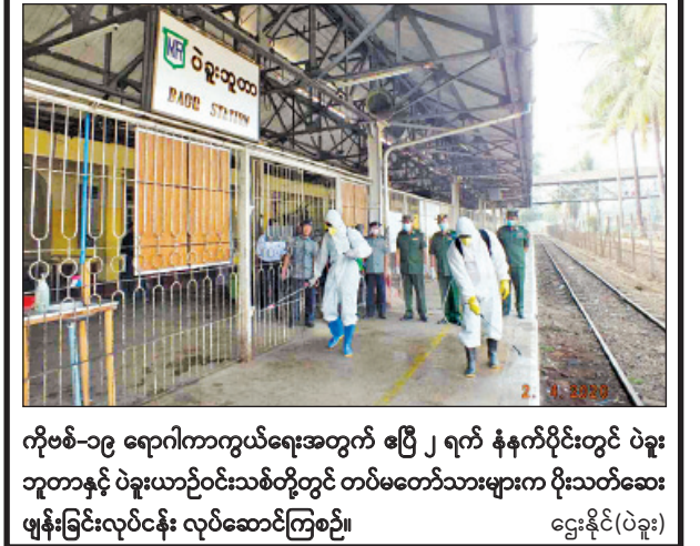
ကိုဗစ်-၁၉ ရောဂါကာကွယ်ရေးအတွက် ဧပြီ ၂ ရက် နံနက်ပိုင်းတွင် ပဲခူး တာဝန်နှင့် ပဲခူးယာဉ်ဝင်းသစ်တို့တွင် တပ်မတော်သားများက ပိုးသတ်ဆေး ဖျန်းခြင်းလုပ်ငန်း လုပ်ဆောင်ကြစဉ်။ ဌေးနိုင်(ပဲခူး)

မိုင်ကမ်း ဧပြီ ၂ ချင်းပြည်နယ် တီးတိန်မြို့နယ် မိုင်ကမ်းမြို့အနီးတွင် ဖွင့်လှစ်ထားသည့် ကနေဒါ ဆင်ထိန်းသိမ်းရေးစခန်းတွင် ကိုဗစ်-၁၉ ရောဂါအန္တရာယ် ထိန်းချုပ်နိုင်ရန် ခရီးသွားဝင်ရောက်မှု ယာယီပိတ်ထားလိုက်ပြီဖြစ်ကြောင်း ချင်းပြည်နယ် ဆင်ထိန်းသိမ်းရေးစခန်းမှ သိရသည်။ ကနေဒါဆင်ထိန်းသိမ်းရေးစခန်းကို မတ် ၂၄ ရက်မှစတင်၍ ယာယီပိတ်ထားခြင်းဖြစ်သည်။ အဆိုပါဆင်ထိန်းသိမ်းရေးစခန်းကို ၂၀၁၉ ခုနှစ် ဖေဖော်ဝါရီ ၁၆ ရက်က ချင်းပြည်နယ် တီးတိန်မြို့နယ် ဆီးယင်းကြီးပိုင်းအကွက် အမှတ် (၁၃၈)တွင် ဆင်အထီးလေးကောင်နှင့် ဆင်အမသုံးကောင် စုစုပေါင်း ခုနစ် ကောင်တို့ဖြင့် ဖွင့်လှစ်ထားခြင်းဖြစ်ကြောင်း သိရသည်။ ချင်းတွင်းသား