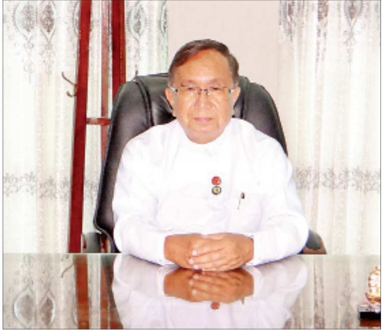
ဆောက်လုပ်ရေးဝန်ကြီးဌာန ပြည်ထောင်စုဝန်ကြီး ဦးဟန်ဇော်