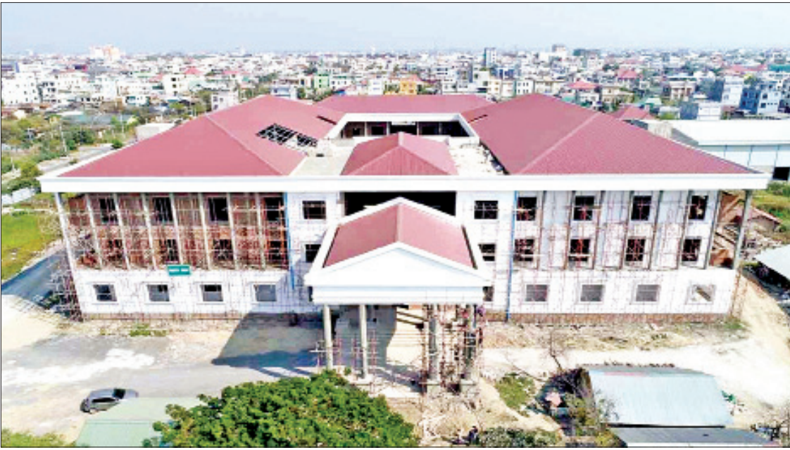
ဆောက်လုပ်ရေးဝန်ကြီးဌာနမှ တည်ဆောက်သည့် မန္တလေးတိုင်းဒေသကြီးတရားလွှတ်တော် တည်ဆောက်ရေးလုပ်ငန်းခွင်ကို တွေ့ရစဉ်။