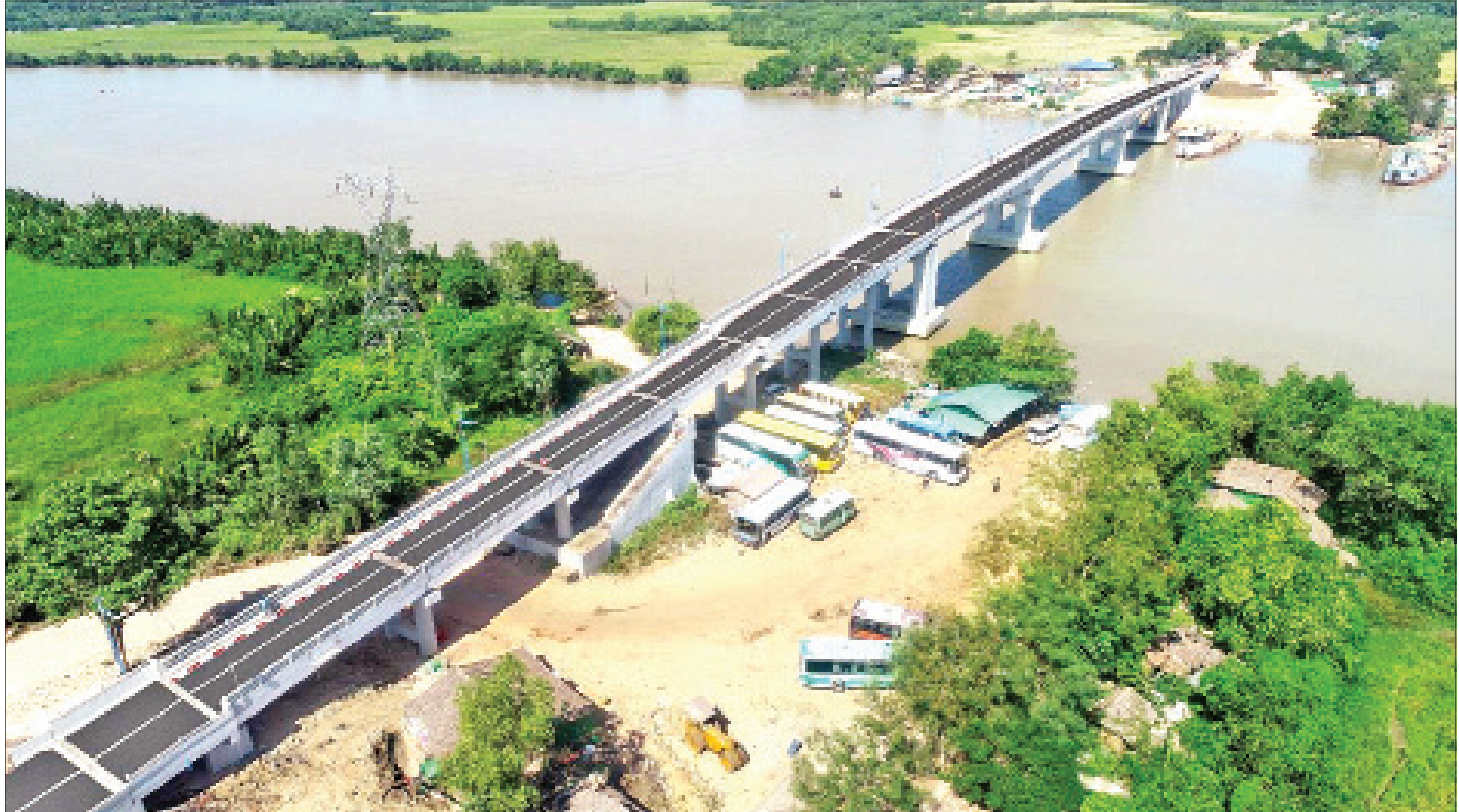
ရော့တီတိုင်းဒေသကြီး မြောင်းမြမြို့နယ် လပွတ္တာ-မြောင်းမြ-အိမ်မဲ လမ်းပေါ်ရှိ ပင်လယ်လေးမြစ်ကို ဖြတ်သန်းဖောက်လုပ်ထားသည့် လပွတ္တာတံတား(ပင်လယ်လေး) ကိုတွေ့ရစဉ်။