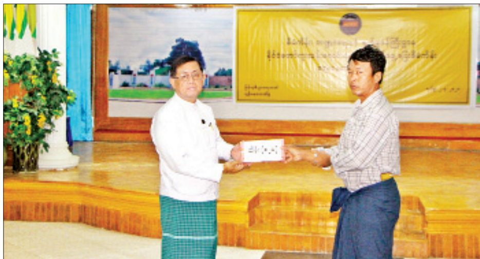
ချေးငွေလျှောက်ထားသူ ၁၃ ဦးသို့ ချေးငွေကျပ် ၁၂၆ သန်း ထုတ်ချေးခဲ့ကြောင်း သိရသည်။