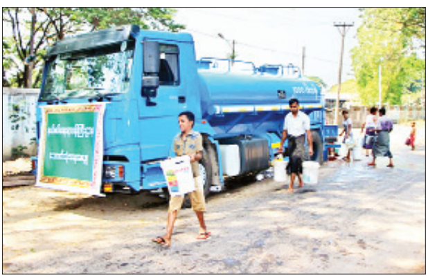
ဆက်လက်၍ ဧယျာသီရိမြို့နယ်နှင့် ပုဗ္ဗသီရိမြို့နယ်တို့ရှိ ကျေးရွာများသို့လည်း သောက်သုံးရေဖူလုံစေရေးအတွက် နယ်စပ်ရေးရာဝန်ကြီးဌာနက အလှည့်ကျ ရေပေးဝေလှူဒါန်းသွားမည် ဖြစ်ကြောင်းနှင့် နိုင်လင်းကြည်

နေပြည်တော် ဧပြီ ၂ နေပြည်တော် ပျဉ်းမနားမြို့နယ် ကဲဦးရပ်ကွက်၊ တောင်သာနှင့် မဲကုန်းကျေးရွာများသို့ သောက်သုံးရေဖူလုံစေရေးအတွက် ယနေ့နံနက်ပိုင်းတွင် နယ်စပ်ရေးရာဝန်ကြီးဌာနမှ တာဝန်ရှိသူများက သွားရောက်လှူဒါန်းသည်။ ထိုသို့ လှူဒါန်းရာတွင် နယ်စပ်ဒေသနှင့် တိုင်းရင်းသားလူမျိုးများ ဖွံ့ဖြိုးတိုးတက်ရေးဦးစီးဌာနမှ တာဝန်ရှိသူများနှင့် အုပ်ချုပ်ရေးမှူးများက ဦးဆောင်၍ ကဲဦးရပ်ကွက်သို့ ရေဂါလန် ၂၀၀၀၊ တောင်သာကျေးရွာသို့ ရေဂါလန် ၂၀၀၀ နှင့် မဲကုန်းကျေးရွာသို့ ရေဂါလန် ၂၀၀၀ စုစုပေါင်း ရေဂါလန် ၆၀၀၀ အား အိမ်ထောင်စုလိုက် သောက်သုံးရေဖူလုံစေရေးအတွက် ရေသယ်ယာဉ်ဖြင့် သယ်ဆောင်၍ စနစ်တကျ ခွဲဝေလှူဒါန်းပေးခဲ့သည်။