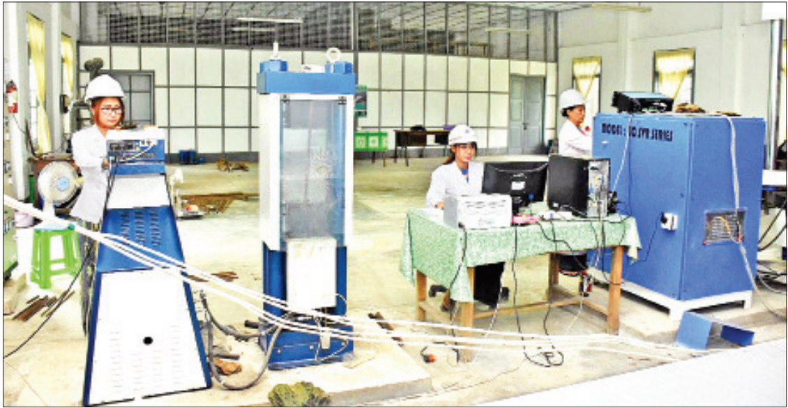
အဆောက်အဦဦးစီးဌာနမှ အဆောက်အဦအရည်အသွေး စစ်ဆေးခြင်း ဓာတ်ခွဲခန်းကို တွေ့ရစဉ်။

ကရင်ပြည်နယ်မှာရှိတဲ့ လမ်းမိုင်ပေါင်း ၈၀၀ ကျော်အနက် ၂၀ ရာခိုင်နှုန်းကို ကတ္တရာလမ်း/ကွန်ကရစ်လမ်းအဖြစ် ဆောင်ရွက်ဖို့ ကျန်ပါတယ်။ လမ်းမိုင် ၈၀ ရာခိုင်နှုန်းအထိကို ကတ္တရာလမ်း/ ကွန်ကရစ်လမ်းနဲ့ ရာသီမရွေး သွားလာလို့ရတဲ့ လမ်းတွေအဖြစ် အဆင့်မြှင့်တင်ပြီး ဖြစ်ပါတယ်။ ကရင်ပြည်နယ်မှာ