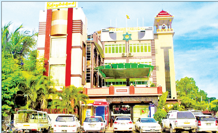
ဧပြီ ၂ ရက်က စစ်ကိုင်းတိုင်း ဒေသကြီး ရွှေဘိုမြို့တွင် ပြည့် ကုမ္ပဏီက လုပ်ငန်း ကုမ္ပဏီက ကိုဗစ်-၁၉ ကာလအတွင်း ဆေးရုံ အဖြစ် အသုံးပြုနိုင်ရန် လှူဒါန်း ထားသည့် ပြည့်သီဟိုတယ်ကို တွေ့ရစဉ်။ မိုးသောက်(ရွှေဘို)