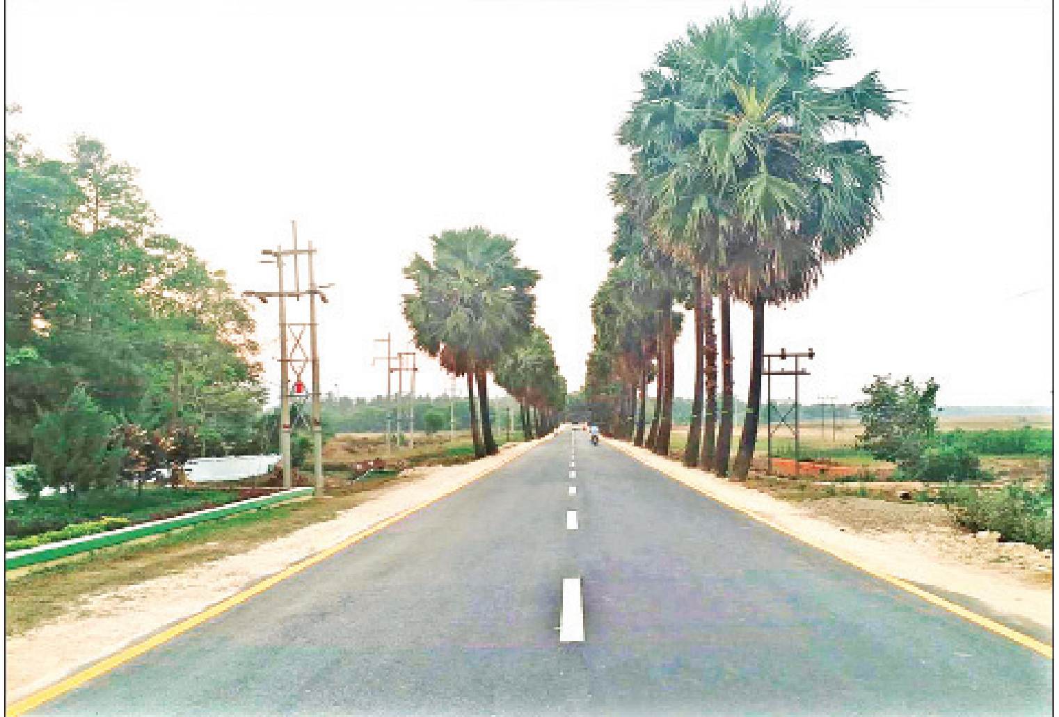
မွန်ပြည်နယ် မော်လမြိုင်-ကျိုက်မရောလမ်းပိုင်းကို တွေ့ရစဉ်။

နိဂုံးချုပ်အနေနဲ့ ကျွန်တော်တို့ ဝန်ကြီး ဌာနမှာရှိတဲ့ ဦးစီးဌာန ၅ ခု အနေနဲ့ သက်ဆိုင် ရာ ကဏ္ဍအလိုက် လမ်း၊ တံတားနဲ့ မြို့ပြအိမ်ရာ တွေ ဖွံ့ဖြိုးတိုးတက်ဖို့အတွက် ကြိုးပမ်းဆောင် ရွက်နေပါတယ်။ ။