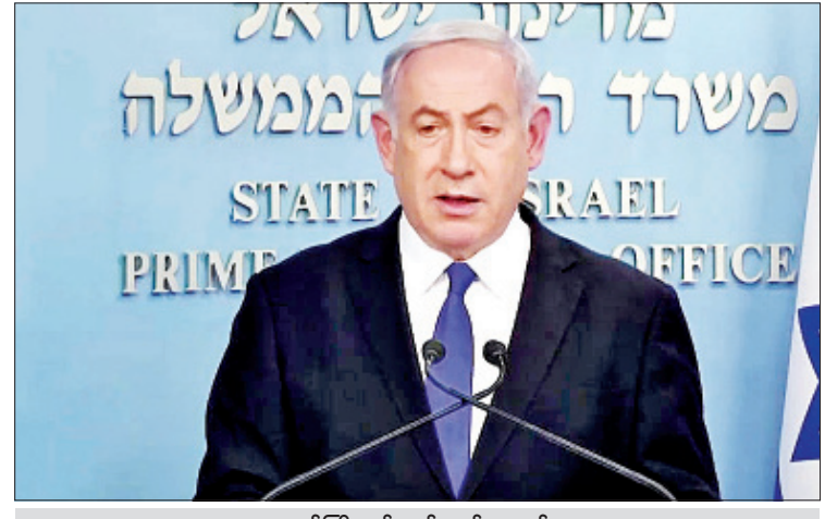
အစ္စရေးဝန်ကြီးချုပ် ဘင်ဂျမင်နေတန်ယာဟု

အစ္စရေးကျန်းမာရေးဝန်ကြီး ယာကော့ဗ် လစ်သ်ဇ်မန်သည် ကိုဗစ်-၁၉ ရောဂါ ကူးစက် ခံရပြီးနောက် ဧပြီ ၂ ရက်တွင် ၎င်း၏ဇနီးသည် နှင့်အတူ သီးသန့်ခွဲ၍ နေထိုင်နေရကြောင်း သိရသည်။ ဝန်ကြီး၏ ဇနီးမှာလည်း အဆိုပါ ရောဂါ ကူးစက်ခံရကြောင်း သိရသည်။ သို့သော် ဝန်ကြီးယာကော့ဗ်လစ်သ်ဇ်မန် နှင့် ဇနီးသည် နေကောင်းလျက်ရှိပြီး ဆေးဝါး ကုသမှုခံယူလျက်ရှိကြောင်း ကျန်းမာရေး ဝန်ကြီးဌာနက ထုတ်ပြန်ချက်တစ်ရပ်တွင် ဖော်ပြထားသည်။ ထို့အပြင် နိုင်ငံအတွင်း ကိုရိုနာဗိုင်းရပ်စ် ကူးစက်ပျံ့နှံ့မှုထိန်းချုပ်ရေးအတွက် အစိုးရ၏ ကြိုးပမ်းအားထုတ်မှုတွင် အဓိက အခန်းကဏ္ဍ မှ ပါဝင်သည့် အစ္စရေးကျန်းမာရေးဝန်ကြီးဌာန မှ ညွှန်ကြားရေးမှူးချုပ် မောရေဘာဆီမန် တော့ဗ်သည်လည်း ယာကော့ဗ်လစ်သ်ဇ်မန် နှင့် မကြာခဏထိတွေ့ဆက်ဆံခဲ့သောကြောင့် သီးသန့်ခွဲ၍ နေထိုင်နေရကြောင်း သိရသည်။ အစ္စရေးနိုင်ငံတွင် ကိုဗစ်-၁၉ ရောဂါ ကူးစက်ခံရသူ လူနာ ၆၂၁၁ ဦးရှိပြီး ၎င်းတို့ အနက် ၃၁ ဦးသည် အဆိုပါရောဂါကြောင့် သေဆုံးခဲ့ကြောင်း ကျန်းမာရေးဝန်ကြီးဌာနက ထုတ်ပြန်သည့် နောက်ဆုံးအချက်အလက်များ အရ သိရသည်။ ကိုးကား - ဆင်ပွာ ဘာသာပြန် - ဂျေတီ