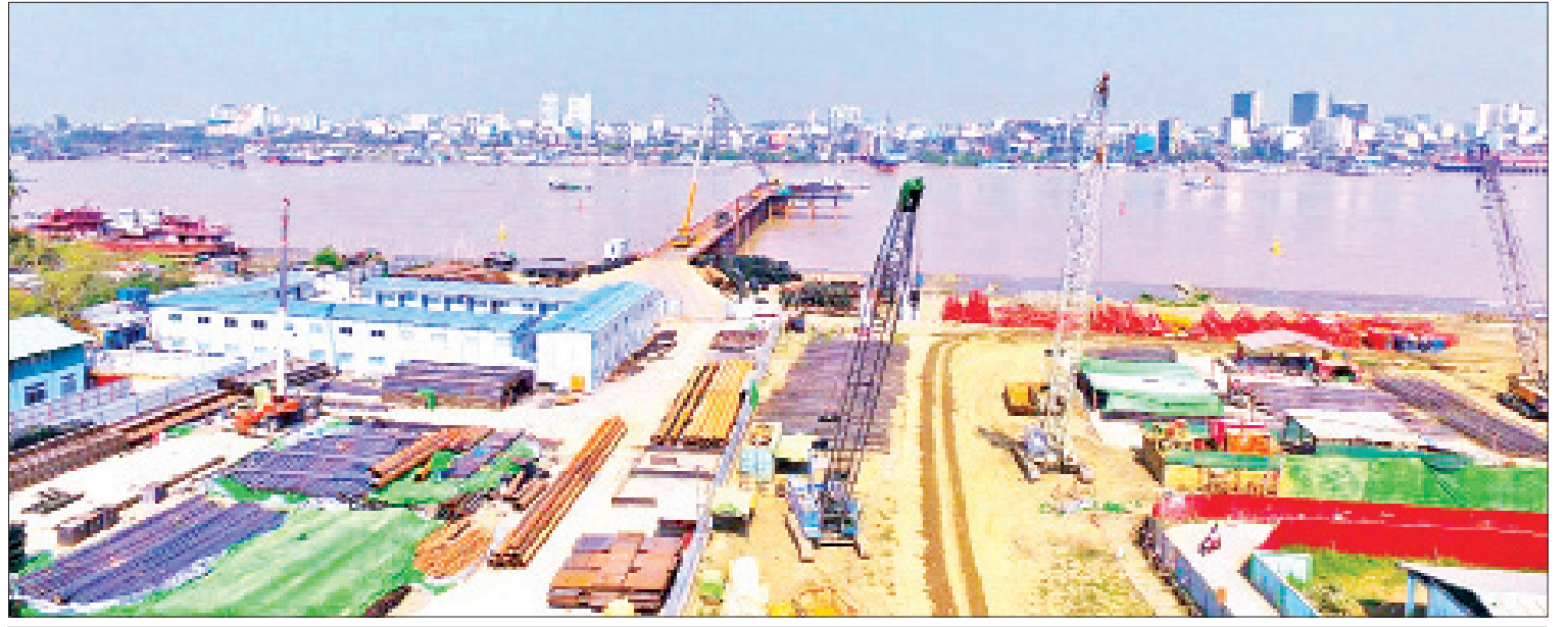
ရန်ကုန်တိုင်းဒေသကြီး လမ်းမတော်မြို့နယ်နှင့် ဒလမြို့နယ်တို့ကို ရန်ကုန်မြစ်အား ဖြတ်သန်း၍ ဆက်သွယ်တည်ဆောက်နေသော မြန်မာ-ကိုရီးယား ချစ်ကြည်ရေး (ဒလ) တံတားစီမံကိန်း ကို တွေ့ရစဉ်။