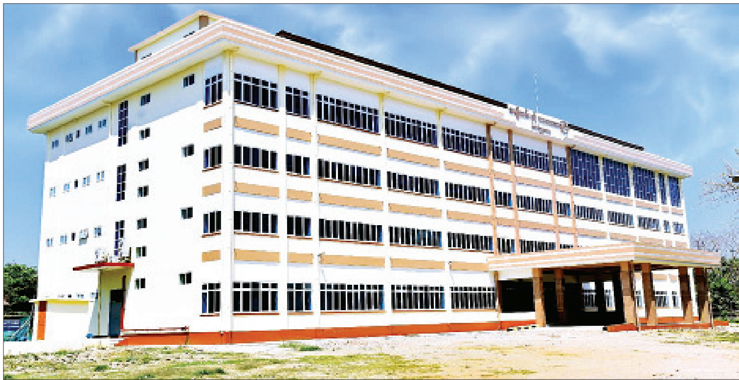
ဆောက်လုပ်ရေးဝန်ကြီးဌာနမှ တည်ဆောက်သည့် ရန်ကုန်တိုင်းဒေသကြီး တောင်ဥက္ကလာပမြို့နယ်ရှိ အမျိုးသမီးနှင့် ကလေးဆေးရုံကြီးကို တွေ့ရစဉ်။

ဆောင်ရွက်တယ်ဆိုတာလည်း ရှင်းပြပေးပါ။ ဖြေ။ ။ နိုင်ငံတော်ရန်ပုံငွေ (Government Budget)နဲ့ အကောင်အထည်ဖော် ဆောင်ရွက်တာ၊ လုပ်ငန်းတွေအနက် ဖြစ်နိုင်ခြေ ရှိတဲ့ လုပ်ငန်းတချို့ကို Public Private Partnership (PPP) စနစ်နဲ့ ပုဂ္ဂလိကလုပ်ငန်း ရှင်တွေနဲ့ ပူးပေါင်းအကောင်အထည်ဖော် ဆောင်ရွက်တာ၊ နိုင်ငံတကာအကူအညီ Development Partner တွေဖြစ်တဲ့ JICA၊ ADB၊ WB၊ KOICA နဲ့ TICA စတဲ့ အဖွဲ့အစည်း တွေနဲ့ အလှူရှင်တွေရဲ့ ကူညီထောက်ပံ့ငွေ (Grant)/ ချေးငွေ (Loan) တွေနဲ့ အကောင် အထည်ဖော်ဆောင်ရွက်နေတာ ဖြစ်ပါတယ်။