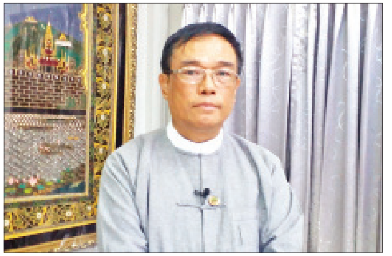
ဆောက်လုပ်ရေးဝန်ကြီးဌာန ဒုတိယဝန်ကြီး ဒေါက်တာကျော်လင်း

ဒေါက်တာကျော်လင်း (ဒုတိယဝန်ကြီး၊ ဆောက်လုပ်ရေးဝန်ကြီးဌာန) မေး။ ။ ဆောက်လုပ်ရေး ဝန်ကြီးဌာနကနေ စတုတ္ထ (၁)နှစ်တာအတွင်း ဆောင်ရွက်