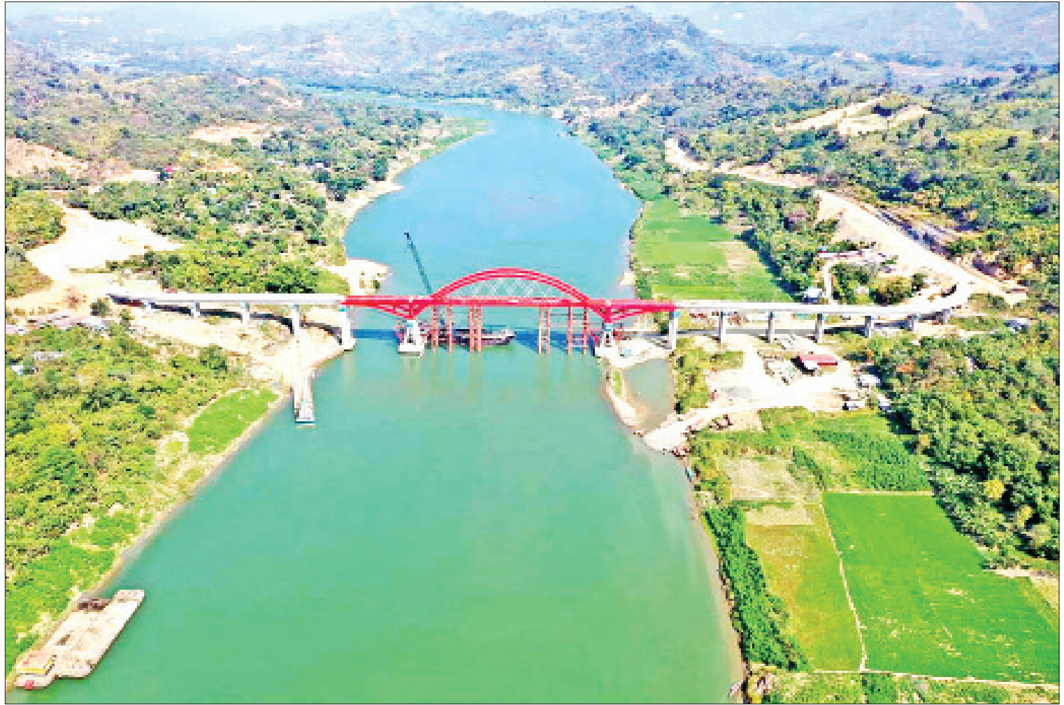
ချင်းပြည်နယ် ပလက်ဝမြို့နယ် ပလက်ဝ-မတူပီ လမ်းပေါ်ရှိ ကုလားတန်မြစ်ကူးတံတား(ပလက်ဝ)တည်ဆောက်ရေးလုပ်ငန်းခွင်ကို တွေ့ရစဉ်။