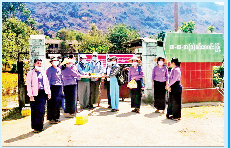
ဧပြီ ၂ ရက်က ပင်လောင်း မြို့နယ် အမှတ်(၁)အထက၌ ကန့်သတ်စောင့်ကြပ်ကြည့်ရှုခြင်းခံရ သည့် ပြည်သူများအတွက် မြို့နယ် မိခင်နှင့် ကလေးစောင့်ရှောက်ရေး အသင်းက လက်သန်ဆေးရည်နှင့် အချိုရည်ဘူးများ ပေးအပ်စဉ်။ မြို့နယ်(ပြန်/ဆက်)