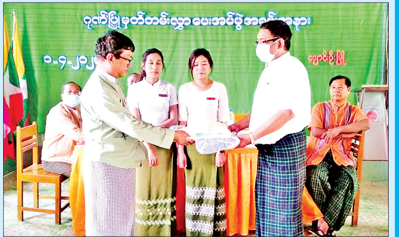
ဧပြီ ၂ ရက်က စစ်ကိုင်းတိုင်း ဒေသကြီး ချောင်းဦးမြို့နယ် ပြည်သူ ဆေးရုံသို့ တစ်ကိုယ်ရေသုံး ကာကွယ်ရေးဝတ်စုံ ၂၅ စုံအား အလှူရှင်များက ပေးအပ်လှူဒါန်း စဉ်။ ယမင်း(ရွှေဦးမြေ)