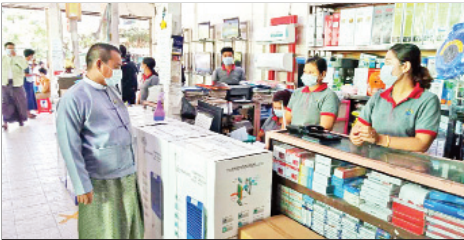
သော ဆန်နှင့်ဆီတို့ကို အိမ်တိုင်ရာရောက်ပို့ပေးသောစနစ်ဖြင့် ရောင်းချခြင်းကို ပိုမိုဆောင်ရွက်ရေး၊ ကုန်ပစ္စည်းများ ပြတ်လပ်မှုမရှိစေရေးအတွက် မှာကြားခဲ့ကြောင်း သိရသည်။ သတင်းစဉ်

အိမ်သုံးပစ္စည်းများအား နဂိုပုံမှန်ဈေးနှုန်းအတိုင်း ရောင်းချမှုရှိ/မရှိ သွားရောက်စစ်ဆေးသည်။ ရန်ကုန်တိုင်းဒေသကြီး သမဝါယမဦးစီးဌာနမှ တာဝန်ရှိသူက ဆိုင်တာဝန်ခံများ၊ ဝန်ထမ်းများနှင့်တွေ့ဆုံကာ ယခုကာလသည် ကိုဗစ်-၁၉ လတ်တလော အသက်ရှူလမ်းကြောင်းဆိုင်ရာ ရောဂါကူးစက်မှုများ မြန်မာနိုင်ငံတွင် တွေ့ရှိနေပြီဖြစ်၍ မိမိတို့၏ ဝန်ထမ်းများအနေဖြင့် ဈေးဝယ်ရန် လာရောက်သည့် ပြည်သူများ၏ ကျန်းမာရေးအတွက် ကျန်းမာရေးနှင့်အားကစားဝန်ကြီးဌာနက ညွှန်ကြားထားသည့် ညွှန်ကြားချက်အတိုင်း စနစ်တကျလိုက်နာဆောင်ရွက်ရေး၊ စားသောက်ကုန်များရောင်းချရာတွင် အန္တရာယ်ဖြစ်စေမည့် စားသောက်ကုန်များ မဖြစ်စေရေး၊ လူသုံး၊ အိမ်သုံးနှင့် စားသောက်ကုန်များ ရောင်းချရာတွင် လည်း ဈေးနှုန်းကို ပုံမှန်ဈေးနှုန်းဖြင့်သာ ရောင်းချရေး၊ ဈေးရောင်းသူနှင့် ဈေးဝယ်သူများအကြား ရောဂါကူးစက်မှု မရှိစေရေးအတွက် သတ်မှတ်ထားသော အကွာအဝေးမှသာ ပါဆယ်စနစ်ဖြင့်ရောင်းချရေး၊ စားသောက်ကုန်ဖြစ်