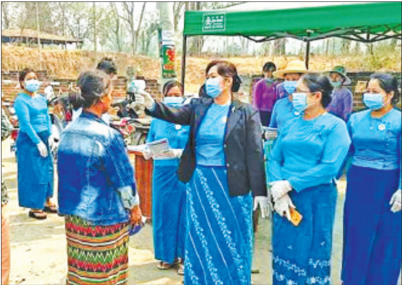
အား အချိရည်များနှင့် ရေသန့်ဘူးများပေးခြင်း၊ အချိရည်များနှင့် ရေသန့်ဘူးများပေးခြင်းအပြင် လုံခြုံကျေးရွာတွင် ထိုင်းနိုင်ငံမှပြန်ရောက်လာသည့် ဂန့်ဂေါမြို့ ညနေဈေးတွင်လည်း လက်ကမ်းစာစောင် ပြည်သူတစ်ဦးအား ကျန်းမာရေးစစ်ဆေးပေးခြင်းနှင့် များ ဖြန့်ဝေပေးခဲ့ကြသည်။ စိန်ကျော်

ဂန့်ဂေါ ဧပြီ ၂ ဂန့်ဂေါမြို့အဝင် လမ်းဆုံကွက်တွင် ဖြတ်သန်းမောင်း နှင်သည့် မော်တော်ယာဉ်ဖြင့်လိုက်ပါသည့် ခရီးသည် များ၊ ဆိုင်ကယ်များ၊ ခရီးသည်များ ကျန်းမာရေး စစ်ဆေးခြင်း၊ စောင့်ရှောက်ခြင်းတို့ကို ဂန့်ဂေါမြို့နယ် အမျိုးသမီးရေးရာအဖွဲ့၊ မြို့နယ်မိခင်နှင့် ကလေး စောင့်ရှောက်ရေးအဖွဲ့၊ ခရိုင်ပြန်ကြားရေးနှင့် ပြည်သူ့ဆက်ဆံရေးဦးစီးဌာန၊ ကျန်းမာရေးဌာနတို့ ပူးပေါင်းအဖွဲ့သည် မတ် ၃၁ ရက် က ပြုလုပ်ကြသည်။ ထိုသို့ဆောင်ရွက်ရာတွင် ကလေးမြို့၊ ဟားခါးမြို့ နှင့် ဂန့်ဂေါမြို့သို့ အသွားအပြန်ကားများဖြင့် လိုက်ပါ လာသည့် ခရီးသည်များအား ကိုယ်အပူချိန်စမ်းသပ် စစ်ဆေး၍ ကျန်းမာရေးစောင့်ရှောက်မှုဆောင်ရွက် ပေးကာ ကိုဗစ်-၁၉ ရောဂါ အသိပညာပေးခြင်း၊ ရောဂါဖြစ်ပွားမှုအား ကြိုတင်ကာကွယ်ရမည့် နည်းလမ်းများ အသိပညာပေးခြင်းနှင့် လက်ကမ်း စာစောင် ဖြန့်ဝေပေးကြခြင်းဖြစ်သည်။ ထို့ပြင် အနောက်ဂန့်ဂေါကျေးရွာကွက်တွင်လည်း ကျန်းမာရေးစစ်ဆေးပေးကာ ခရီးသွားပြည်သူများ