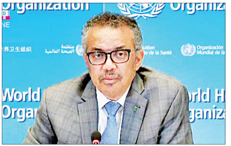
ကမ္ဘာ့ကျန်းမာရေးအဖွဲ့ ညွှန်ကြားရေးမှူးချုပ် တီဒရော့စ်အက်ဟာနွမ်ဂီဘာရီယီးဆပ်

ခုခံနိုင်စွမ်းနည်းပါးသူများအား စားနပ်ရိက္ခာနှင့် အခြားသောလူမှုဘဝ၏ အခြေခံလိုအပ်ချက် များရရှိစေမည့်ဆောင်ရွက်မှုများကို လုပ်ဆောင် ရန်လည်း ၎င်းက တောင်းဆိုထားသည်။ ကမ္ဘာ့ကျန်းမာရေးအဖွဲ့၏ ပြောကြားချက် အရ ကိုရိုနာဗိုင်းရပ်စ်ကူးစက်ခြင်းပွားမှုကြောင့် ကမ္ဘာ့တစ်ဝန်း သေဆုံးသူအရေအတွက် ၄၇၀၀၀ ကျော်ရှိသွားပြီဖြစ်ကြောင်းနှင့် ကူးစက်ခံရသူ ဦးရေသည်လည်း ၉၄၀၀၀၀ ကျော်ရှိသွားပြီ ဖြစ်ကြောင်း သိရသည်။ ကိုးကား-အင်န်အိတ်ချ်ကေ ဘာသာပြန်-အလင်းသစ်