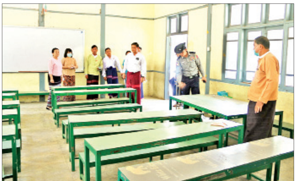
များအား ယနေ့ ညနေပိုင်းမှစ၍ ဘားအံမြို့၌ သီးခြား ထားရှိရန် စီစဉ်ထားသည့်နေရာများတွင် လက်ခံထားရှိပြီး လိုအပ်သည့်ကျန်းမာရေးစောင့်ရှောက်မှုများ ဆောင်ရွက် ပေးလျက်ရှိကြောင်း သိရသည်။ စောမျိုးမင်းသိန်း(ပြန်/ဆက်)

အသွားအလာကန့်သတ်စောင့်ကြည့်ခြင်း ၁၄ ရက်ကို ဒီမှာပဲ လုပ်လိုက်တော့မယ်။ ကရင်ပြည်နယ်က လူတွေကိုကျတော့ ကျွန်တော်တို့က လေးကောက်ကိုပို့ပြီး လေးကောက် ကနေတစ်ဆင့် ဘားအံကိုပြန်ခဲ့မယ်။ ၁၄ ရက်ထားမှာဖြစ်တဲ့ အတွက် သံလွင်တံတားအနီး အမှတ်(၈)ရပ်ကွက် မိုးကုတ် ဝိပဿနာတရားစခန်း၊ စိုက်ပျိုးရေးသိပ္ပံ(ဇွဲကပင်)၊ လှာကမြင်ကွက်သစ် မူလတန်းလွန်ကျောင်းတို့မှာ သုံးနေရာ ထားရှိသွားမှာဖြစ်တယ်။ ထပ်လိုမယ်ဆိုရင်လည်း အုန်းတစ်ပင် အထက်တန်းကျောင်း(ခွဲ)ကို အရန်အနေနဲ့ စီစဉ်ထားတာ ရှိပါတယ်။ အလှူရှင်လည်းရှိတဲ့အတွက် လူတစ်ဦးကို မွေ့ရာခင်း၊ ခေါင်းအုံး၊ ရေခွက်၊ ဆပ်ပြာ၊ ရေသန့်ဘူး စသည်ဖြင့် မနက်၊ ည ထမင်းကျွေးမှာဖြစ်ပါ တယ်။ အထူးသဖြင့် ရန်ကုန်နဲ့ ဒေသတချို့ပါ။ ကျန်တဲ့ဒေသ တွေကတော့ သူတို့အစီအစဉ်နဲ့သူတို့ ပြန်မှာပါ။ မန္တလေး၊ စစ်ကိုင်းတို့ကလည်း သူတို့ကိုကြိုဖို့ ကားတွေလာစောင့်နေ တာရှိပါတယ်” ဟု ပြောသည်။