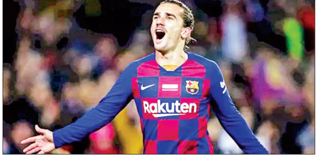
အသက် ၂၉ နှစ်အရွယ်ရှိ ဂရစ်မန်းဟာ ကော်တင်ဟိုက်ဝတ်ဆင်နေတဲ့ ကျောနံပါတ်ခုနစ်ကို ဝတ်ဆင်ခွင့်ရဖို့ ဆန္ဒရှိနေတာဖြစ်ပြီး လက်ရှိမှာကော်တင်ဟို ဟာ ဘိုင်ယန်မြူးနစ်အသင်းမှာ အငှားနဲ့သွားရောက်ကစားနေတဲ့အပြင် ဘာစီလိုနာအသင်းကလည်း ကော်တင်ဟိုကို ရောင်းချဖို့မျှော်လင့်ထားတာ ဖြစ်ပါတယ်။

ဆက်ဂ်ညာဟာ ၂၀၀၇ ခုနှစ်မှာ လန်ဒန်မြေကို ရောက်ရှိလာခဲ့တာ ဖြစ်ပြီး အာဆင်နယ်အသင်းရဲ့ ညာခြမ်းခံစစ်မှာ အကောင်းဆုံး ခြေစွမ်းပြ ကစားနိုင်ခဲ့တာကြောင့် ပရီမီယာလိဂ်မှာ အကောင်းဆုံး နောက်တန်းကစားသမားတွေထဲက တစ်ဦးအဖြစ် နာမည်ရလာခဲ့တာ ဖြစ်ပါတယ်။ နောက်တန်း ကစားသမား ဆက်ဂ်ညာဟာ ၂၀၀၈ ခုနှစ်နဲ့ ၂၀၁၁ ခုနှစ်တို့မှာ ပရီမီယာလိဂ်ရဲ့ အကောင်း