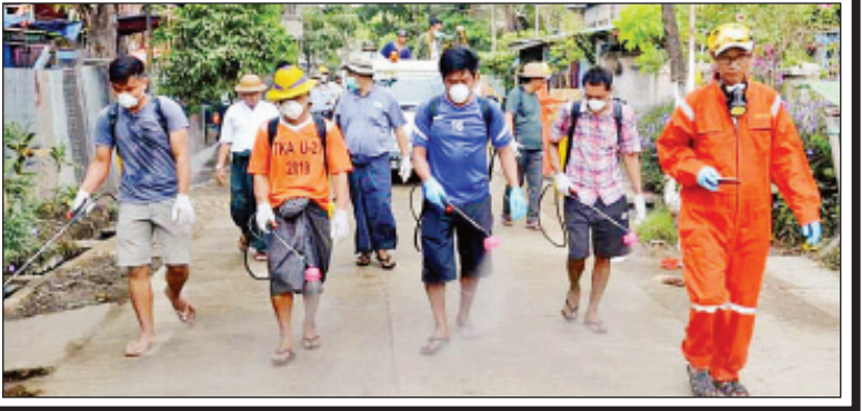
ဖိုးခွား

COVID-19 ရောဂါကာကွယ်ရေးအတွက် ရန်ကုန်တိုင်းဒေသကြီး သာကေတမြို့နယ် (၈) ရပ်ကွက်အတွင်း ပိုးသတ်ဆေးဖျန်းခြင်း လုပ်ငန်းကို ကရုဏာရုံသို့လူမှုကူညီရေး အသင်းနှင့် (၈)ရပ်ကွက်အုပ်ချုပ်ရေးမှူးရုံး တို့က ယနေ့ နံနက် ၈ နာရီမှစတင်၍ စုပေါင်းပြုလုပ်ခဲ့ ကြသည်။