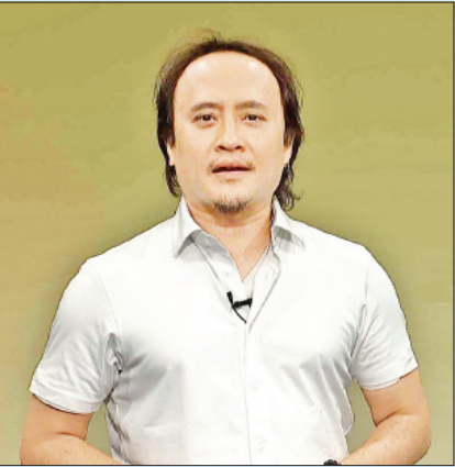
ဇော်ပိုင်

ကမ္ဘာတစ်ဝန်း COVID-19 ရောဂါကူးစက်ပျံ့နှံ့မှုသည် မြန်မာနိုင်ငံ၌ အစိုးရအဖွဲ့အစည်းများက ကာကွယ်၊ ထိန်းချုပ်၊ ကုသရေးလုပ်ငန်းစဉ်များကို အရှိန်အဟုန်မြှင့် ဆောင်ရွက်လျက်ရှိပြီး ကျန်းမာရေးဝန်ထမ်းများ၊ သက်ဆိုင်ရာဒေသများရှိ အရပ်ဘက်အဖွဲ့အစည်းများက ကျန်းမာရေးအသိပညာပေးနှိုးဆော်ရေးအစီအစဉ်များတွင် ပူးပေါင်းပါဝင်ဆောင်ရွက်ခဲ့ကြပါသည်။ ထို့အတူ ရုပ်ရှင်၊ ဂီတ အနုပညာရှင်များကလည်း COVID-19 ရောဂါနှင့်ပတ်သက်၍ အသိပညာပေးနှိုးဆော်ရေးအစီအစဉ်တွင် ပါဝင်ခဲ့ကြပါသည်။