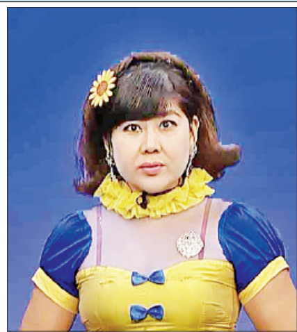
ဆောင်းအိန္ဒြေထွန်း

“ချောင်းဆိုး၊ နှာချေသည့်အခါမှာ တစ်ခါသုံးတစ်ရှူးကို အသုံးပြုပြီး နှာခေါင်းနှင့် ပါးစပ်ကို လုံအောင် ဖုံးအုပ်ပါ။ သုံးပြီးသား တစ်ရှူးကို အမှိုက်ပုံးထဲသို့ စနစ်တကျ စွန့်ပစ်ပါ။ လက်ကို စနစ်တကျ သန့်ရှင်းအောင် ဆေးကြောပါ။”