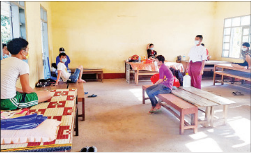
COVID-19 ရောဂါ တားဆီးကာကွယ်ထိန်းချုပ်နိုင်ရေး ကွင်းဆင်းဆောင်ရွက်

COVID-19 ရောဂါ ကြိုတင်ကာကွယ်ထိန်းချုပ်ကုသရေး လုပ်ငန်းစဉ်များအတွင်း နိုင်ငံခြားမှ နေရပ်ပြန်လာသူများနှင့် လိုအပ်ချက်ရှိသူများအား ထားရှိရန်နေရာများကိုလည်း အရန် စီစဉ်ဆောင်ရွက်ထားကြောင်း သိရသည်။ ချမ်းသာ (မိတ္ထီလာ)