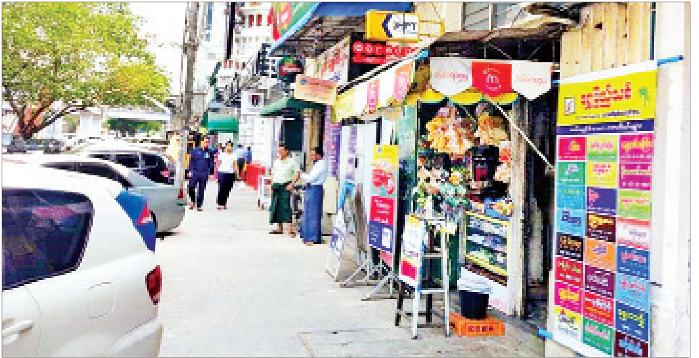
ရန်ကုန်မြို့ ဆူးလေဘုရားအနီးတွင် ဖွင့်လှစ်ထားသော စားသောက်ဆိုင်များကို တွေ့ရစဉ်။