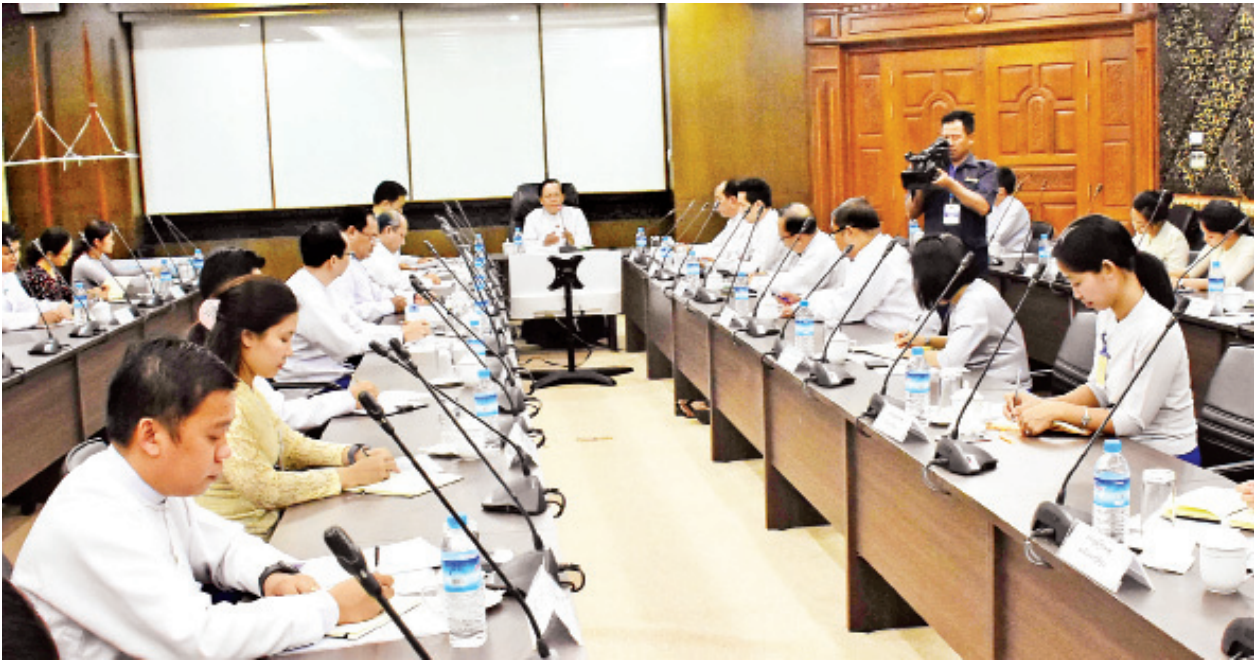
ပြည်ထောင်စုဝန်ကြီး ဦးကျော်တင် နိုင်ငံခြားရေးဝန်ကြီးဌာနနှင့် အပြည်ပြည်ဆိုင်ရာ ပူးပေါင်းဆောင်ရွက်ရေးဝန်ကြီးဌာန COVID-19 အသက်ရှူလမ်းကြောင်းဆိုင်ရာ ကူးစက်ရောဂါ ကာကွယ်၊ ထိန်းချုပ်ရေး လုပ်ငန်းအဖွဲ့၏ အစည်းအဝေးတွင် အမှာစကားပြောကြားစဉ်။

နိုင်ငံခြားရေးဝန်ကြီးဌာန ရက်စွဲ၊ ၂၀၂၀ ပြည့်နှစ်၊ မတ်လ ၃၀ ရက်