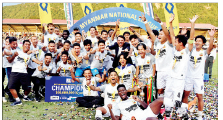
အာဆီယံကလပ်ပြိုင်ပွဲ ယှဉ်ပြိုင်ခွင့်ရထားသည့် ၂၀၁၉ MNL ချန်ပီယံ ရှမ်းယူနိုက်တက်အသင်း။

ရန်ကုန် မတ် ၃၀ ကမ္ဘာ့နိုင်ငံများတွင် ဖြစ်ပွားနေသည့် COVID-19 ရောဂါကြောင့် မြန်မာ ကလပ် ရှမ်းယူနိုက်တက်အသင်း ဝင်ရောက်ယှဉ်ပြိုင်ခွင့်ရထားသည့် အာဆီယံကလပ် ချန်ပီယံရှစ်ပြိုင်ပွဲ ကို ၂၀၂၁ ခုနှစ်သို့ ရွှေ့ဆိုင်းလိုက်ပြီ ဖြစ်သည်။ အာဆီယံဘောလုံးအဖွဲ့ ချုပ်သည် COVID-19 ရောဂါကြောင့် ယခုနှစ်အတွင်းကျင်းပမည့် ပြိုင်ပွဲ များနှင့်ပတ်သက်၍ ထုတ်ပြန်ရာတွင် အာဆီယံကလပ်ပြိုင်ပွဲကို တစ်နှစ် စာမျက်နှာ ၂၇ ကော်လံ ၁ သို့ ■