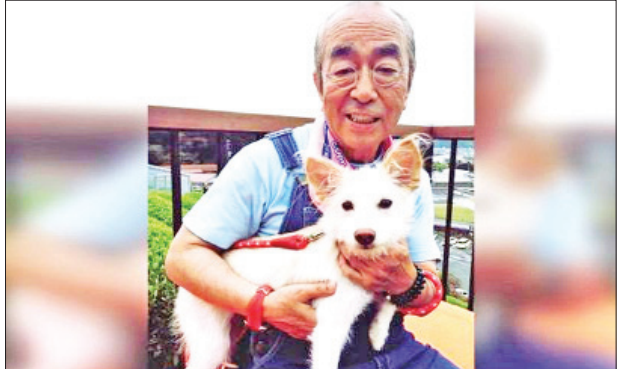
သရုပ်ဆောင်မှုတွေအနက် မျက်နှာကို အဖြူရောင်ခြယ်ကာ မျက်ခုံးမွေးအထူကြီး တွေခွဲ သရုပ်ဆောင်မှုဟာ အထင်ရှားဆုံး ဖြစ်ပါတယ်။

ဂျပန်နိုင်ငံရဲ့ ကျော်ကြားတဲ့ သရုပ်ဆောင်တစ်ဦးဖြစ်သူ ကန်ရှိမူရာဟာ ကိုရိုနာ ဗိုင်းရပ်စ်ကူးစက်ခံရပြီး လတ်တလောမှာ ကွယ်လွန်ခဲ့ပြီဖြစ်ကြောင်း အေးရှားဝမ်း ဒေါ့ကွန်းရဲ့ ရေးသားဖော်ပြချက်တွေအရ သိရပါတယ်။ ကန်ရှိမူရာဟာ ကိုရိုနာဗိုင်းရပ်စ်ကူးစက်ခံရပြီးနောက် ဆေးရုံတက်ရောက် ကုသနေရာကနေ ကွယ်လွန်ခဲ့တာပါ။ သူဟာ ဂျပန်အနုပညာရှင်တွေအနက် ကိုရိုနာဗိုင်းရပ်စ်ကြောင့် ပထမဆုံးကွယ်လွန်ခဲ့သူလည်း ဖြစ်ပါတယ်။ မတ် ၂၉ ရက်ညပိုင်းမှာ မင်းသားကြီး ကွယ်လွန်ခဲ့တာဖြစ်ပြီး သူ့ရဲ့ ပရိသတ် တွေက ကန်ရှိမူရာ ကွယ်လွန်ခဲ့တဲ့အပေါ် ဝမ်းနည်းကြောင်း ရေးသားဖော်ပြခဲ့ ကြပါတယ်။ ကန်ဟာ ကွယ်လွန်ချိန်မှာ အသက် ၇၀ ရှိပြီဖြစ်ကြောင်းလည်း သိရပါတယ်။ ကန်ရှိမူရာဟာ ဂျပန်နိုင်ငံရဲ့ ဟာသသရုပ်ဆောင်တွေအနက် ကျော်ကြားသူ တစ်ဦးလည်း ဖြစ်ပါတယ်။ သူဟာ ၁၉၇၀ ပြည့်နှစ်နဲ့ ၁၉၈၀ ပြည့်နှစ်တွေအတွင်း ရုပ်မြင်သံကြားပေါ်မှာ အလွန်ကျော်ကြားတဲ့ သရုပ်ဆောင်တစ်ဦးပါ။ သူ့ရဲ့