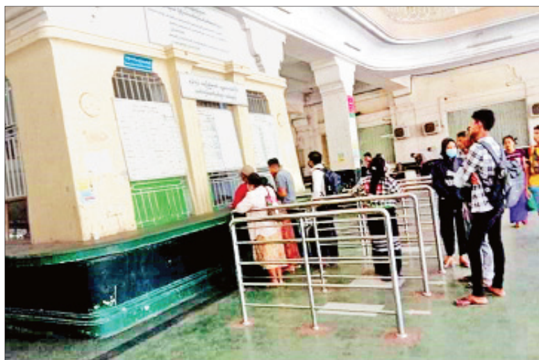
ရထားစီးခရီးသည်နည်းပါးလာသည့် လက်ရှိရန်ကုန်ဘူတာကြီးမြင်ကွင်းကို တွေ့ရစဉ်။

ရန်ကုန် မတ် ၃၀ ရန်ကုန်ဘူတာကြီးမှ ထွက်ခွာပြေးဆွဲပေးနေသည့် အမြန်ရထားတွဲဆိုင်းများကို ယာယီရပ်နား ထားခြင်းမရှိသေးသော်လည်း ရထားစီးခရီးသည် လိုက်ပါစီးနင်းမှုအပေါ်မူတည်၍ နေ့စဉ် စောင့်ကြည့်ကာ ရထားတွဲချိတ်ဆက်မှုအား လျှော့ချသွားမည်ဖြစ်ကြောင်း မြန်မာ့မီးရထားမှ သိရသည်။ စာမျက်နှာ ၂၇ ကော်လံ ၁ သို့ ❖