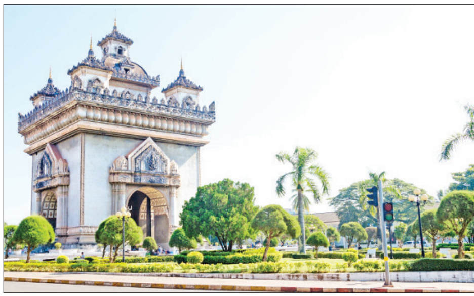
လာအိုနိုင်ငံ၏ လွတ်လပ်ရေးကြိုးပမ်းမှုအထိမ်းအမှတ် ပက်တူဆိုင်းဂိတ်ကို တွေ့ရစဉ်။

ဗီယက်ကျန်း မတ် ၃၀ လာအိုနိုင်ငံတွင် ကိုရိုနာဗိုင်းရပ်စ်ကူးစက်မှုကို ကာကွယ်သည့်အနေဖြင့် နိုင်ငံတစ်ဝန်း ခရီးသွားလာမှုများ ကန့်သတ်လိုက်ပြီဖြစ်ကြောင်း လာအိုအစိုးရက ယနေ့ကြေညာခဲ့သည်။ သို့သော် ကုန်စည်ပို့ဆောင်ရေးစနစ်များကို ခွင့်ပြုပေးမည်ဖြစ်သည်။ နိုင်ငံအတွင်းရှိ ပြည်သူများကိုလည်း နေအိမ်အတွင်းမှာသာ နေထိုင်ကြရန်နှင့် အရေးကြီးကိစ္စများအတွက်သာ နေအိမ်ပြင်ပသို့ ထွက်ကြရန် လာအိုအစိုးရက တိုက်တွန်းပြောကြားထားသည်။ ကုန်စည်ပို့ဆောင်ရေး (သို့မဟုတ်) ဆေးရုံသို့လူနာပို့ဆောင်ခြင်းကဲ့သို့သော အာဏာပိုင်များခွင့်ပြုထားသည့် အရေးကြီးကိစ္စရပ်များ လုပ်ဆောင်ခြင်းမှအပ ဗိုင်းရပ်စ်ကူးစက်မှုနှုန်းမြင့်တက်သည့်ဒေသများသို့ သွားလာခွင့်ကို ပြည်သူများအား ပိတ်ပင်ထားကြောင်း သိရသည်။ ထို့ပြင် လူစုလူဝေးခြင်းများကိုလည်း ရှောင်ရှားရန် အမိန့်စာတွင် ပါရှိသည်။ နိုင်ငံအတွင်း ခရီးသွားလာခြင်းကန့်သတ်မှုသည် မတ် ၃၀ ရက်မှ ဧပြီ ၁၉ ရက်အထိ အာဏာသက်ရောက်မှု ရှိမည်ဖြစ်သည်။ ဗိုင်းရပ်စ်ကာကွယ်ရေးဆိုင်ရာ စည်းမျဉ်းစည်းကမ်းများနှင့် နိုင်ငံအတွင်း ခရီးသွားလာမှု ကန့်သတ်ခြင်းကို