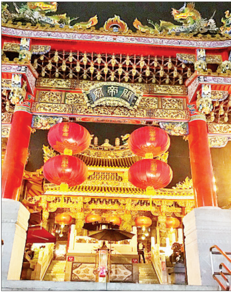
Kanteibyō တရုတ်ဘုံကျောင်း

တရုတ်တန်းကို ကောင်းခြင်းမင်္ဂလာများ ဖြစ်ထွန်းအောင် စောင့်ရှောက်တယ်လို့ ယုံကြည်မှုရှိကြပါတယ်။ အဲဒီခွဲညားလှပတဲ့ တရုတ်တန်းလေးဖက်လေးတန်း အဝင်မုခ်ခွဲကြီးတွေဟာ ယိုကိုဟားမားတရုတ်တန်းရဲ့ အဓိကမြင်ကွင်းတွေ ဖြစ်လို့နေပါပြီ။ ဆိုခဲ့သလို ဒီဂိတ်ကြီးတွေအပြင် တရုတ်တန်းအတွင်းလမ်း အများအပြားမှာလည်း အမည်အမျိုးမျိုးနဲ့ ဂိတ်များစွာရှိပါတယ်။ ယိုကိုဟားမား တရုတ်တန်း ဖွံ့ဖြိုးရေးအသင်း စာရင်းအချက်အလက်တွေအရ ၂၀၁၉ ခုနှစ်ကုန်အထိ ယိုကိုဟားမားတရုတ်တန်းမှာ တရုတ်စားသောက်ဆိုင် ၁၅၀၊ ကော်ဖီဆိုင် (ကိတ်မုခ်ဆိုင်) ၂၂ ဆိုင်၊ သစ်သီးဖျော်ရည်ဆိုင် လေးဆိုင်၊ လက္ခဏာဗေဒင်ဟောခန်း ခုနှစ်ခု၊ ကားပါကင်ခြောက်ခုဟိုတယ် ၁၀ လုံးနဲ့ အခြား ကုမ္ပဏီရုံးခန်း ၅၀ တည်ရှိပါတယ်။ ယိုကိုဟားမားတရုတ်တန်း ဧရိယာတစ်ခုလုံးဆိုရင် ၅၀၀ စတုဂံယားမီတာ (၅၃၈၂ စတုဂံယားပေ) ကျယ်ဝန်းပြီး ယနေ့တရုတ်တန်းမှာ တရုတ်နိုင်ငံသားပိုင် ဆိုင်များသာမက ဂျပန်နိုင်ငံသားပိုင် ဆိုင်များလည်း တွေ့နိုင်တယ်လို့ ဆိုပါတယ်။ ဒါ့အပြင် တရုတ်တန်းမှာ Kanteibyō နဲ့ Maso byō အမည်ရှိ ခွဲညားလှပတဲ့ တရုတ်ဘုံကျောင်းကြီးနှစ်ကျောင်းလည်း တည်ရှိပါတယ်။