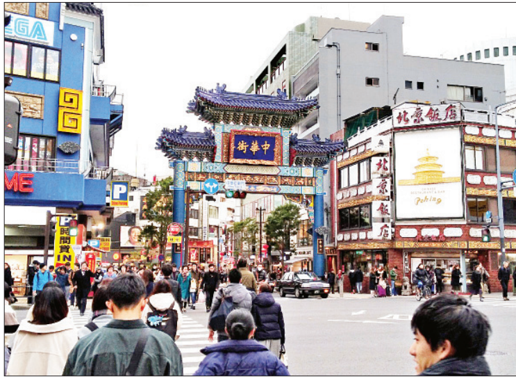
ယိုကိုဟားမားတရုတ်တန်း

ယိုကိုဟားမားသွားမယ်ဆိုတော့ တည်းခိုဖို့ နေရာ ရှာရပါတယ်။ ပစ်မှတ်က တရုတ်တန်း ပါ။ တရုတ်တန်းအနီးဝန်းကျင်ကိုရှာရင် ယိုကိုဟားမား အားကစားကွင်း (Yokohama Stadium) အနီး ယိုကိုဟားမား ဗဟိုတည်းခိုဆောင် (Yokohama Central Hostel) ဆိုပြီး ဈေးသက်သာတဲ့ တည်းခိုခန်းတစ်ခု တွေ့ပါတယ်။ တရုတ်တန်းနဲ့ ငါးမိနစ်လောက်ပဲ လျှောက်ရပါတယ်။ အမှန်တော့ သူ့ထက် ကောင်းတဲ့ တည်းခိုခန်းမှာ တည်းခိုခဲ့တာ ပါ။ ကိုယ့်တည်းခိုတဲ့ တည်းခိုခန်းနဲ့ ခုခံလုံး က လူပြည့်နေတာမို့ နောက်ဆုံး ဒီတည်းခိုခန်းပဲ ရွေးလိုက်ရပါတယ်။ တည်းခိုခန်းပိုင်ရှင်က လည်း အတော်ကူညီပါတယ်။ တိုကျိုက မနက်ထွက်၊ အိမ်နီးမားကျွန်းဝင်လည်၊ နေ့လယ်ဘက် ကာမာရတရားပေး၊ ညနေဘက် ဒီယိုကိုဟားမားကို ရောက်ပါတယ်။ တည်းခိုခန်းရောက်တာနဲ့ ပါလာတဲ့အထုပ် တွေထားပြီး ညစာစားဖို့ တရုတ်တန်းဘက်ဆီ လမ်းလျှောက်ထွက်လာခဲ့ပါတယ်။