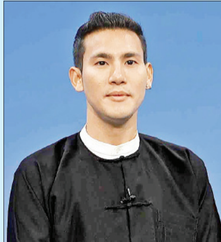
စိုပြေမြင့်

“မိမိကြောင့် မိမိ၏ မိသားစု၊ မိတ်ဆွေအပေါင်းအသင်းများကို မကူးစက်ပါစေနှင့်။”