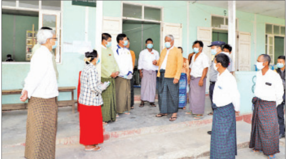
ထွန်းကိုကို (ယင်းမာပင်)

တန်းကျောင်းတွင် အမျိုးသားလေးဦးနှင့် အမျိုးသမီးခုနစ်ဦး၊ ရေဦးမြို့ အမှတ် (၁) အခြေခံပညာအထက်တန်းကျောင်းတွင် အမျိုးသားခြောက်ဦးနှင့် အမျိုးသမီးရှစ်ဦး၊ ဒီပဲယင်းမြို့နယ် စိုင်ပြင်ကျေးရွာအခြေခံပညာအထက်တန်းကျောင်းတွင် အမျိုးသားသုံးဦးနှင့် အမျိုးသမီးတစ်ဦး စုစုပေါင်း သံသယပြည်သူ ၂၉ ဦးတို့အား ကျန်းမာရေးစောင့်ရှောက်ပေးနေမှုနှင့် လုံခြုံရေးဆောင်ရွက်ပေးထားမှုတို့ကို တိုင်းဒေသကြီးဝန်ကြီးချုပ်က ကြည့်ရှုအားပေးစစ်ဆေးပြီး လိုအပ်သည်များကို တာဝန်ရှိသူများနှင့် ပေါင်းစပ်ညှိနှိုင်း ဆောင်ရွက်ပေးခဲ့သည်။