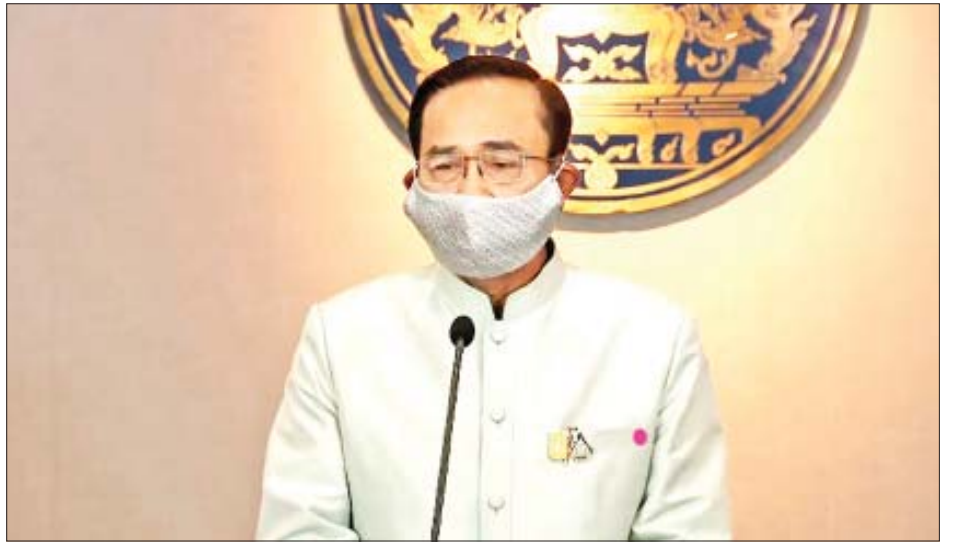
ထိုင်းဝန်ကြီးချုပ် ပရာယူချန်အိုချာ

သာဗီးဆီးလ်ဝိက ဆိုသည်။ “ကမ္ဘာလှည့်ခရီးသည် များအတွက် ယာဉ်မောင်းအဖြစ် တာဝန်ထမ်းဆောင်နေတဲ့ အဲဒီသေဆုံးသူဟာ ဆေးရုံတင်ခြင်းမခံရမီ တီဘီရောဂါ ခံစားခဲ့သူတစ်ဦးဖြစ်ပါတယ်” ဟု ၎င်းက ထပ်မံ ပြောကြားသည်။ ထိုင်းနိုင်ငံတွင် COVID-19 ရောဂါ ကူးစက်ခံရသူ လူနာ စုစုပေါင်း ၈၂၇ ဦးရှိပြီး ယင်းတို့အနက် ၅၇ ဦးသည် ကျန်းမာရေးအခြေအနေ ကောင်းမွန်လာသော ကြောင့် ဆေးရုံများမှ ပြန်ဆင်းသွားပြီဖြစ်ကြောင်း ထိုင်းပြည်သူ့ကျန်းမာရေးဝန်ကြီးဌာနက အတည်ပြု ပြောကြားသည်။ တစ်ချိန်တည်းမှာပင် ထိုင်းဝန်ကြီးချုပ် ပရာယူချန် အိုချာက နိုင်ငံအတွင်း COVID-19 ရောဂါကူးစက်ပျံ့နှံ့မှု ကိုင်တွယ်ဖြေရှင်းသည့်အနေဖြင့် အရေးပေါ်ဥပဒေတစ်ရပ် ကို ထုတ်ပြန်ကြေညာမည်ဖြစ်ပြီး ယင်းဥပဒေကို မတ် ၂၆ ရက်တွင် အာဏာတည်စေမည်ဖြစ်ကြောင်း၊ သို့သော် ညမထွက်ရအမိန့်ကိုမူ ကြေညာမည်မဟုတ်သေးကြောင်း စသည်ဖြင့် ပြောကြားသည်။ အဆိုပါ အရေးပေါ်ဥပဒေသည် ညမထွက်ရအမိန့်၊ ခရီးသွားလာမှုတားမြစ်ပိတ်ပင်ရေးနှင့် ခွင့်ပြုချက်