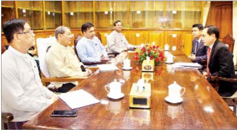
နေပြည်တော် မတ် ၂၄ စီမံကိန်း၊ ဘဏ္ဍာရေးနှင့် စက်မှုဝန်ကြီးဌာန ပြည်ထောင်စုဝန်ကြီး ဦးစိုးဝင်းသည် အာရှဖွံ့ဖြိုးရေးဘဏ်၏ မြန်မာနိုင်ငံဆိုင်ရာ Country Director Mr. Newin Sinsiri နှင့် အဖွဲ့အား ယနေ့ညနေ ၄ နာရီတွင် နေပြည်တော်ရှိ စီမံကိန်း၊ ဘဏ္ဍာရေးနှင့် စက်မှုဝန်ကြီးဌာန ပြည်ထောင်စုဝန်ကြီးရုံး၌ လက်ခံတွေ့ဆုံသည်။ တွေ့ဆုံစဉ်ကမ္ဘာ့နှင့်တစ်ဝန်း ကူးစက်ပျံ့နှံ့လျက်ရှိသည့် ကိုရိုနာဗိုင်းရပ်စ် ရောဂါ (COVID-19) နှင့် စပ်လျဉ်း၍ မြန်မာနိုင်ငံ၏ COVID-19 ရောဂါ ကြိုတင်ကာကွယ်ရေးနှင့် ကုသရေးလုပ်ငန်းများတွင် သုံးစွဲရန် လိုအပ်သည့်ဆေးဝါးများနှင့် ကျန်းမာရေးဆိုင်ရာ ပစ္စည်းကိရိယာများ ဝယ်ယူနိုင်ရေးအတွက် အာရှဖွံ့ဖြိုးရေးဘဏ်မှ အရေးပေါ်ချေးငွေ ပံ့ပိုးပေးနိုင်မည့် အခြေအနေများ၊ ယင်းကိစ္စရပ်များနှင့် စပ်လျဉ်းသည့် ပစ္စည်းဝယ်ယူရေး ကူညီပေးနိုင်မည့် အခြေအနေများနှင့် ကိစ္စရပ်များတွင် လုပ်ငန်းလျင်မြန်စေရန် အာရှဖွံ့ဖြိုးရေးဘဏ်က ပံ့ပိုးသတင်းစဉ်