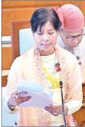
အုတ်တွင်းမဲဆန္ဒနယ်မှ ဒေါ်ချိုချို