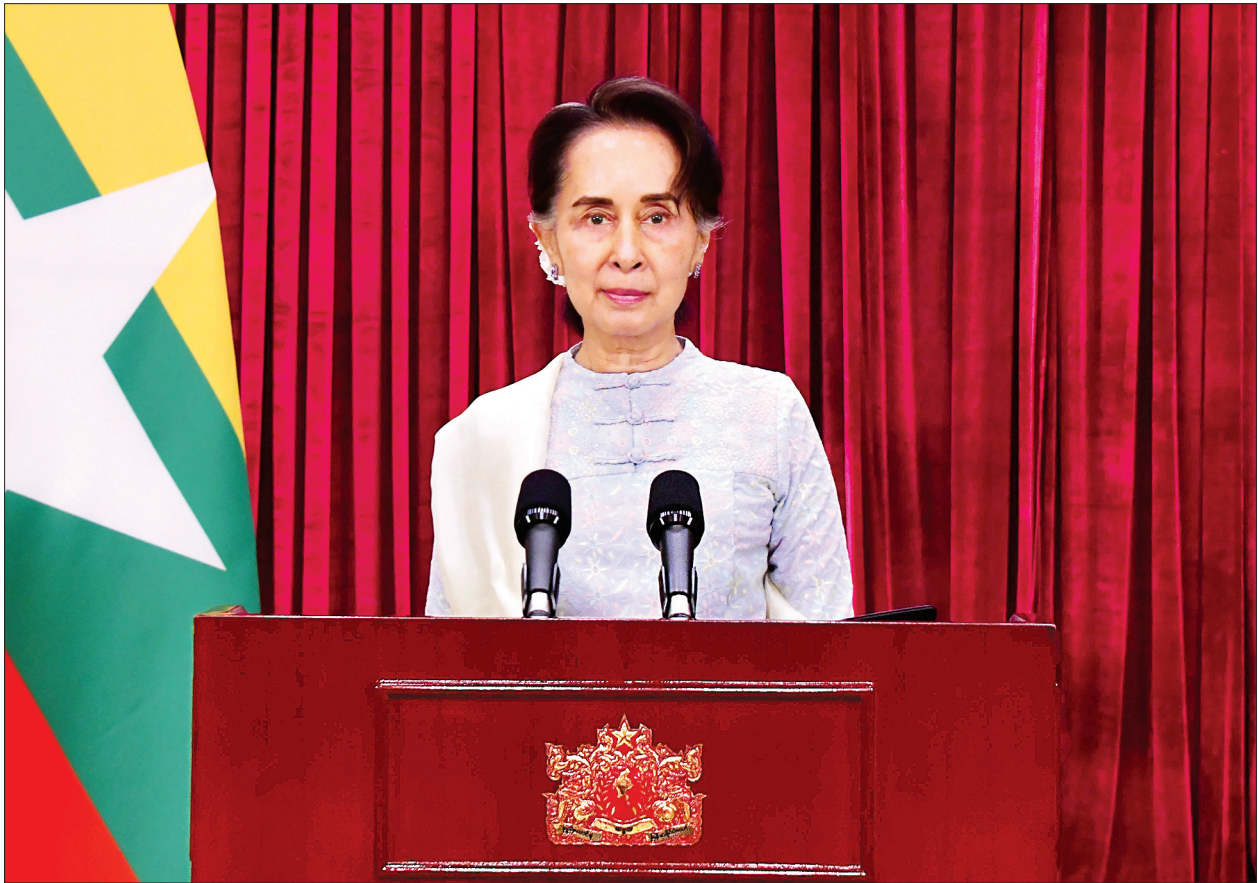
နိုင်ငံတော်၏အတိုင်ပင်ခံပုဂ္ဂိုလ် ဒေါ်အောင်ဆန်းစုကြည် COVID-19 ဖြစ်ပွားမှု နောက်ဆုံးအခြေအနေနှင့်စပ်လျဉ်း၍ ပြည်သူလူထုသို့ အစီရင်ခံတင်ပြသည့် မိန့်ခွန်းပြောကြားစဉ်။

ဒီလိုရောဂါကူးစက်နေသူ နှစ်ဦးတွေရှိကြောင်း သတင်းထွက်လာတာနဲ့ စိုးရိမ်ပူပန်၊ တုန်လှုပ်ကြောက်ရွံ့သူတွေရှိကြမယ်ဆိုတာ ခန့်မှန်းနိုင်ပါတယ်။ ကျွန်ုပ်အနေနဲ့ နိုင်ငံတော်အစိုးရကို ကိုယ်စားပြုပြီး ပြည်သူတွေကို ပန်ကြားချင် တာကတော့ ကြောက်လန့်တုန်လှုပ်ခြင်းမရှိကြပါနဲ့။ ခေါင်းအေးအေးထားပြီး သတိကြီးစွာနဲ့ ကျန်းမာရေးဝန်ကြီးဌာနနဲ့ အခြားအစိုးရဌာနများရဲ့ စာမျက်နှာ ၃ ကော်လံ ၁ သို့ ❖