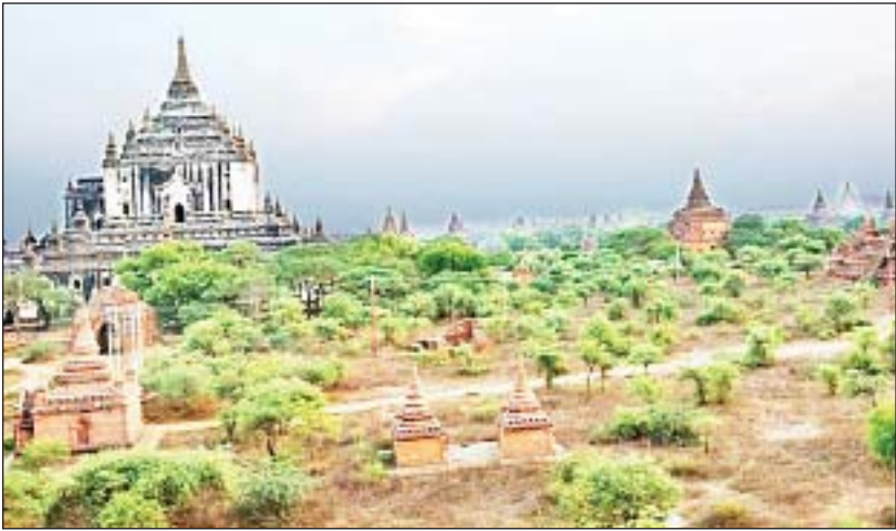
ထိန်းသိမ်းဆောင်ရွက်ပြီးစေတီ ၃၇၅ ဆူ ပြုပြင်ထိန်းသိမ်းဆောင်ရွက်ဆဲစေတီ ၁၁ ဆူနှင့် ပြုပြင်ထိန်းသိမ်းဆောင်ရွက်ရန်ကျန်နေသည့်စေတီသုံးဆူရှိကြောင်း ရှေးဟောင်းသုတေသနနှင့် အမျိုးသားပြတိုက်ဦးစီးဌာနမှ စာရင်းများအရ သိရသည်။

ရှေးဟောင်းသုတေသနနှင့် အမျိုးသားပြတိုက်ဦးစီးဌာနက ဆောင်ရွက်လျက်ရှိသည့် ပုဂံဒေသရှိ ငလျင်ဒဏ်ခံ ရှေးဟောင်းအဆောက်အအုံများ ထိန်းသိမ်းရေးလုပ်ငန်းမှ ပျက်စီးခဲ့သော စေတီ ၃၈၉ ဆူတွင် ပြုပြင်ထိန်းသိမ်းဆောင်ရွက်ပြီး စေတီ ၃၇၅ ဆူရှိကာ ဆောင်ရွက်ဆဲ စေတီ ၁၁ ဆူနှင့် ဆောင်ရွက်ရန် ကျန်ရှိနေသည့် စေတီသုံးဆူရှိကြောင်း ရှေးဟောင်းသုတေသနနှင့် အမျိုးသားပြတိုက်ဦးစီးဌာနမှ ထုတ်ပြန်ချက်စာရင်းများအရ သိရသည်။