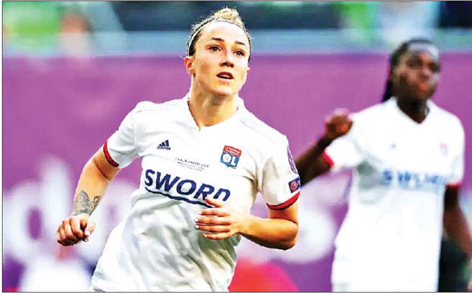
အိုလံပစ်ပြိုင်မှာ ဗြိတိန်ကိုယ်စားပြု ဝင်ရောက်ကစားဖို့ရှိ ဥရောပချန်ပီယံရစ်ပြိုင်ပွဲမှာလည်း အင်္ဂလန်ကိုယ်စားပြု ဝင်ရောက်ကစားဖို့ရှိနေခဲ့တာ ဖြစ်ပါတယ်။

အင်္ဂလန်အမျိုးသမီးအသင်းနဲ့ လိုင်ယွန်အမျိုးသမီးအသင်း တို့ရဲ့ နောက်တန်းကစားသမားတစ်ဦးဖြစ်တဲ့ လူစီဘရွန်းဇီ ဟာ ဘီဘီစီရဲ့ ၂၀၂၀ ပြည့်နှစ် အကောင်းဆုံးအမျိုးသမီး ကစားသမားဆုကို ဆွတ်ခူးနိုင်ခဲ့ပြီဖြစ်ပါတယ်။