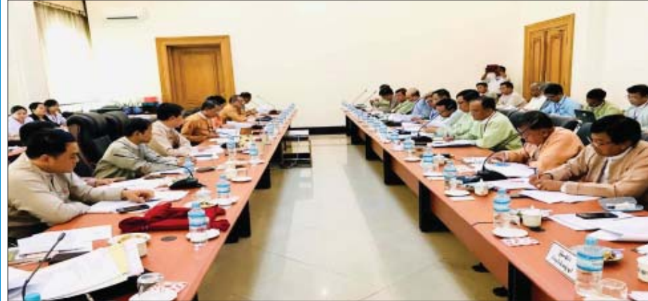
၈-၇-၂၀၁၉ ရက်နေ့ အမျိုးသားလွှတ်တော်ဥပဒေကြမ်းကော်မတီဝင်များ ငါးမွေးမြူရေးဆိုင်ရာ ဥပဒေကြမ်းနှင့် စပ်လျဉ်း၍ အစည်းအဝေးကျင်းပစဉ်။

လွှတ်တော်ကိုယ်စားလှယ်တွေရဲ့ ဆွေးနွေးချက် တွေအပေါ်မှာလည်း လွှတ်တော်ဥက္ကဋ္ဌရဲ့ တာဝန်ပေးအပ် ချက်အရ ကျွန်တော်တို့ ကော်မတီက ပြန်လည်ကြားနာတဲ့ အစည်းအဝေးတွေ လုပ်ပါတယ်။ ကြားနာအတည်ပြု ပြီးရင်တော့ လွှတ်တော်အဆုံးအဖြတ်ရယူပါတယ်။ အဆုံး အဖြတ်ရယူပြီးရင်တော့ ပြည်သူ့လွှတ်တော်ကို ဆက်လက် ပေးပို့ရပါတယ်။