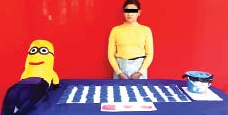
သင်းသင်းနွယ်အား သိမ်းဆည်းရမိသည့် စိတ်ကြွေးသွပ်ဆေးပြားများနှင့်အတူ တွေ့ရစဉ် ။