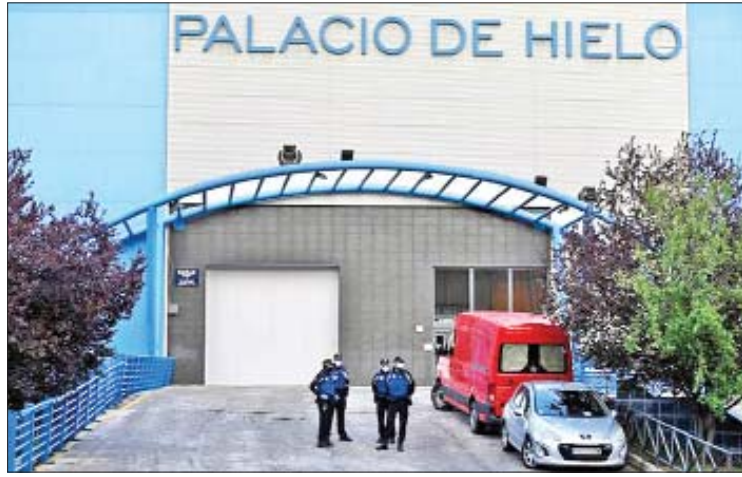
ရင်ခွဲရုံအဖြစ် ပြောင်းလဲအသုံးပြုမည့် မက်ဒရစ်ရေခဲစက်ကွင်း။

နိုင်ငံအတွင်း ရောဂါကူးစက်မှုကြောင့် သေဆုံးသူအရေအတွက် မြင့်မားလာသောကြောင့် မက်ဒရစ်ရေခဲစက်ကွင်း (PALACIO DE HIELO)ကို ယာယီရေခဲတိုက်အဖြစ် အသုံးပြုမည်ဖြစ်သည်ဟု မက်ဒရစ်ဒေသန္တရ အာဏာပိုင်များက ဆိုသည်။ အဆိုပါ စက်ကွင်းသည် ခုတင် ၅၅၀၀ ဆုံးပြီး မတ် ၂၉ ရက်တွင် စတင်အသုံးပြုမည်ဖြစ်ကြောင်း သိရသည်။ ကိုးကား-ဆင်ဟွာဘာသာပြန်-အောင်ကျော်ကျော်