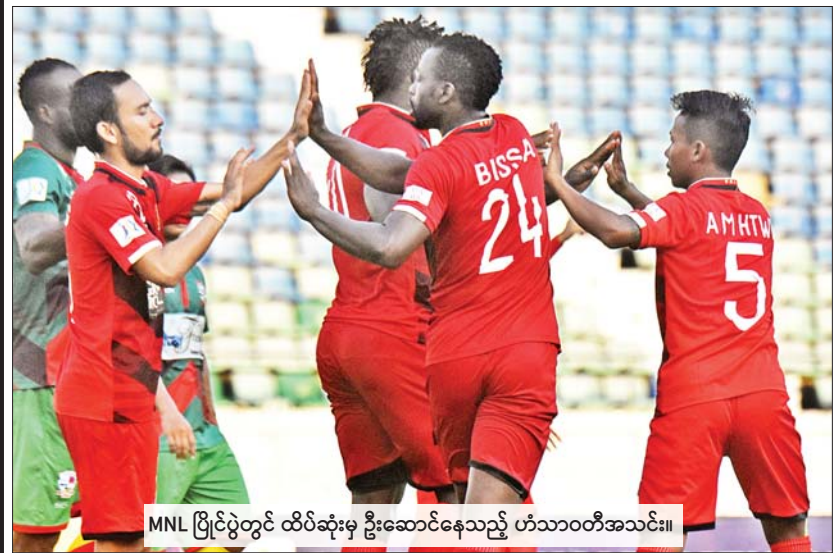
MNL ပြိုင်ပွဲတွင် ထိပ်ဆုံးမှ ဦးဆောင်နေသည့် ဟံသာဝတီအသင်း။