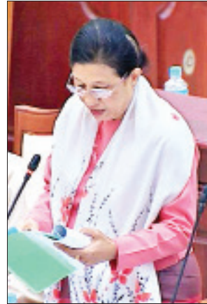
ဒုတိယဝန်ကြီး ဒေါက်တာမြလေးစိန်

ထို့နောက် အမျိုးသားလွှတ်တော်မှ ပြင်ဆင်ချက်ဖြင့် ပြန်လည်ပေးပို့သော တိရစ္ဆာန်ကျန်းမာရေးနှင့် မွေးမြူရေးလုပ်ငန်းဖွံ့ဖြိုးတိုးတက်ရေးဥပဒေကြမ်း နှင့်စပ်လျဉ်း၍ ဥပဒေကြမ်းကော်မတီဝင် ဦးနေမျိုးထွန်းက အမျိုးသားလွှတ်တော် ၏ ပြင်ဆင်အတည်ပြုချက် ၂၆ ချက်၊ ပြည်သူ့လွှတ်တော် ဥပဒေကြမ်းကော်မတီ က ထပ်မံပြင်ဆင်ရန် တင်ပြချက် ၁၇ ချက်နှင့် အမျိုးသားလွှတ်တော်၏ ပြင်ဆင် ချက်များအတိုင်း သဘောမတူဘဲ ပြည်သူ့လွှတ်တော်၏ ယခင်အတည်ပြုချက် အတိုင်း ထားရှိသင့်သည့်အချက် ၁၈ ချက်တို့ကိုတင်ပြရာ ပြည်သူ့လွှတ်တော် ဥက္ကဋ္ဌ ဦးတိုးခွန်မြတ်က စိုက်ပျိုးရေး၊ မွေးမြူရေးနှင့် ဆည်မြောင်းဝန်ကြီးဌာန၏ သဘောထားရယူပြီး လွှတ်တော်၏အဆုံးအဖြတ် ရယူအတည်ပြုသည်။ ယင်းနောက် ဥပဒေကြမ်းကော်မတီ အတွင်းရေးမှူး ဦးကျော်စိုးလင်းက အဆိုပါ ဥပဒေကြမ်းနှင့်စပ်လျဉ်း၍ သဘောကွဲလွဲသည့်အချက် (၃၅) ချက်တို့ကို ပြည်ထောင်စုလွှတ်တော်တွင် ဆွေးနွေးဆုံးဖြတ်ရန် တင်ပြသင့်ကြောင်း အဆို တင်သွင်းသည်။ ဆက်လက်၍ ပြည်သူ့လွှတ်တော်ဥက္ကဋ္ဌက တင်ပြခဲ့သည့် (၃၅) ချက်နှင့်