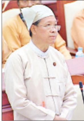
ပြည်ထောင်စုဝန်ကြီး ဒေါက်တာမျိုးသိမ်းကြီး

အစည်းအဝေးတွင် စစ်ကိုင်းမဲဆန္ဒနယ်မှ ဦးခင်မောင်သိန်း၏ စစ်ကိုင်းမြို့ နယ် ဆားတောင်မြို့ တည်ဆောက်ရာ၌ ဌာနဆိုင်ရာအဆောက်အဦများ နေရာချထားရာတွင် အုပ်ချုပ်ရေးမှူးရုံးဝန်ထမ်းအိမ်ရာ ဆောက်လုပ်နိုင်ရေး အတွက် မြေဧရိယာ (ပေ ၂၅၀ x ပေ ၂၅၀)အား ခွဲဝေ၊ ခွင့်ပြုချထားပေးရန် အစီအစဉ် ရှိ မရှိ မေးခွန်းနှင့်စပ်လျဉ်း၍ ကျန်းမာရေးနှင့် အားကစားဝန်ကြီးဌာန ဒုတိယဝန်ကြီး ဒေါက်တာမြလေးစိန်က ဆားတောင်ကျေးလက်ကျန်းမာရေးဌာန မြေဧရိယာတွင် ပင်မအဆောင်တစ်ဆောင်နှင့် ဝန်ထမ်းအိမ်ရာ ငါးဆောင်၊ မိခင်နှင့်ကလေးစောင့်ရှောက်ရေးအသင်း မူကြိုတစ်ဆောင် ဆောက်လုပ်ထား သော်လည်း စစ်ကိုင်းအဆောက်အဦများ မဟုတ်သည့်အတွက် စစ်ကိုင်းစည်းပုံ အရ ဝန်ထမ်းအင်အား ခြောက်ဦးအတွက် လုံလောက်မှုမရှိပါကြောင်း၊ စစ်ကိုင်း ကျန်းမာရေးဌာနအဆောက်အဦနှင့် ဝန်ထမ်းအိမ်ရာဆောက်လုပ်ရန် လိုအပ် မည်ဖြစ်ပါသဖြင့် ၂၀၂၁-၂၀၂၂ ဘဏ္ဍာနှစ်တွင် လျာထားဆောင်ရွက်သွားမည်ဖြစ် ပြီး ယခုကျေးလက်ကျန်းမာရေးဌာန၏ ခြံစည်းရိုးကာရံရန်အတွက် ၂၀၂၀-၂၀၂၁ ဘဏ္ဍာနှစ်တွင် ရန်ပုံငွေတင်ပြတောင်းခံထားပြီးဖြစ်ပါကြောင်း၊ ယခုတောင်းဆို သည့် မြို့နယ်အုပ်ချုပ်ရေးရုံးဝင်းအတွင်း ဝန်ထမ်းအိမ်ရာ ဆောက်လုပ်ရန်အတွက် မြေဧရိယာ (၂၅၀ x ၂၅၀)ပေအား ခွဲဝေပေးရမည်ဆိုပါက စစ်ကိုင်းအဆောက် အဦများ ဆောက်လုပ်ရာတွင်လည်းကောင်း၊ ကျန်းမာရေးဝန်ထမ်းများ နေထိုင် ရန်အတွက်လည်းကောင်း အခက်အခဲရှိလာမည်ဖြစ်ပါကြောင်း၊ သို့ပါ၍ ဆားတောင်ကျေးလက်ကျန်းမာရေးဌာန၏ မြေဧရိယာအား ခွဲဝေပေးနိုင်ရန်