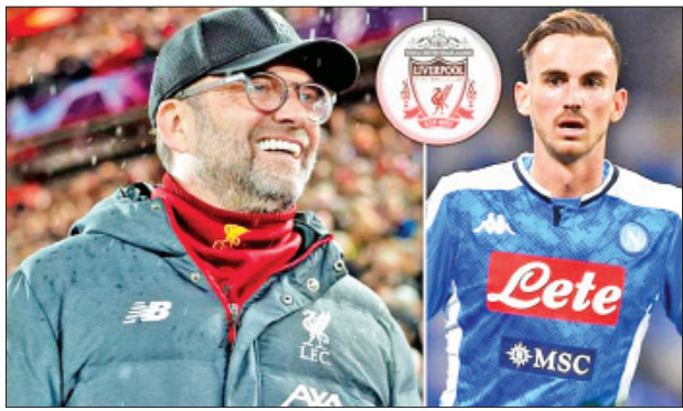
လီဗာပူးနည်းပြ ဂျာကင်ကလော့(ဝဲ)၊ ဖေဘီယန်ရစ်(ယာ)။

ဖေဘီယန်ရစ်ဟာ အီတလီစီးရီးအေပြိုင်ပွဲများ ကိုရိုနာဗိုင်းရပ်စ်ကြောင့် ရပ်နားထားခြင်းမရှိချိန်အထိ နာပိုလီအသင်းအတွက် ၂၂ ပွဲမှာ သွင်းဂိုးနှစ်ဂိုး သွင်းယူထားပြီး နှစ်ဂိုးဖန်တီးပေးထားနိုင်ခဲ့တာဖြစ်ပါတယ်။