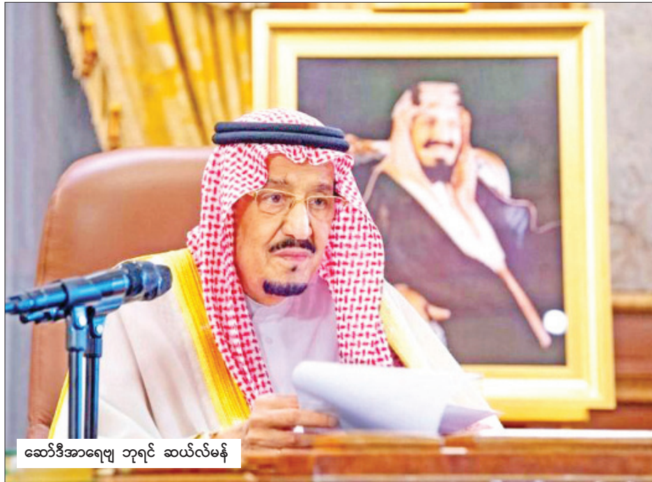
ဆော်ဒီအာရေဗျ ဘုရင် ဆယ်လ်မန်

ရီယာဒ် မတ် ၂၃ ကိုရိုနာဗိုင်းရပ်စ်ပျံ့နှံ့မှုကို ထိန်းချုပ်ရန် ကြိုးစားဆောင်ရွက် သည့်အနေဖြင့် ဆော်ဒီအာရေဗျ ဘုရင် ဆယ်လ်မန်က တနင်္လာနေ့မှစ၍ နိုင်ငံတစ်ဝန်း နေဝင်ချိန်မှ အရုတ် တက်ချိန်အထိ အပြင်မထွက်ရအမိန့်ကို ထုတ်ပြန်ကြေညာ သည်။ ယင်းဆောင်ရွက်ချက်သည် ကိုရိုနာဗိုင်းရပ်စ်ပျံ့နှံ့မှု ထိန်းချုပ်ရေးအတွက် ချမှတ်ခဲ့သည့် ကန့်သတ်ချက်များစွာ အနက်မှ နောက်ဆုံးဆောင်ရွက်ချက်ဖြစ်သည်။ ည ၇ နာရီမှ နောက်တစ်နေ့ နံနက် ၆ နာရီအထိ အပြင်မထွက်ရအမိန့်ကို ၂၁ ရက်ကြာ ချမှတ်ခြင်းဖြစ်သည်ဟု တော်ဝင်အမိန့်ကို ကိုးကား၍ တရားဝင် ဆော်ဒီပရိတ် အေဂျင်စီက ပြောကြား သည်။ ဆော်ဒီအာရေဗျနိုင်ငံက တနင်္ဂနွေနေ့တွင် ကိုရိုနာဗိုင်းရပ်စ်ကူးစက်ခံရသူ အရေ အတွက်သည် ၅၁၁ ဦးသို့ ရောက်ရှိသွားပြီဖြစ်ကြောင်း၊ ပင်လယ်ကွေ့ဒေသတွင် အများဆုံးကူးစက်ခံရမှုဖြစ် ကြောင်း ကြေညာခဲ့ပြီး နောက် ယင်းအပြင်မထွက်ရအမိန့် ထုတ်ပေါ်လာခြင်း ဖြစ်သည်။ ဆော်ဒီအာရေဗျဘုရင်နိုင်ငံ တွင် ယခုချိန်အထိ ဗိုင်းရပ်စ်ကြောင့် သေဆုံးမှု မရှိသေးပေ။ ကျန်းမာရေးကဏ္ဍမှ အလုပ်ရှင်များ၊ လုံခြုံရေးနှင့် စစ်ဘက်မှ တာဝန်ရှိသူများသည် အပြင်မထွက်ရ ကန့်သတ်