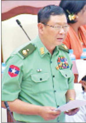
ဒုတိယဝန်ကြီး ဗိုလ်ချုပ်အောင်သူ

ဖြေကြားသည်။ မိုင်းယန်းမဲဆန္ဒနယ်မှ ဦးစိုင်းဆမ်၏ မိုင်းယန်းမြို့နယ် ရဲတပ်ဖွဲ့မှူးရုံးတွင် လိုအပ်နေသော ရဲစခန်း(အချုပ်ခန်းပါ) (၉၀ x ၃၀ x ၁၂)ပေ သံကူကွန်ကရစ် တစ်လုံး၊ မြို့နယ်ရဲစခန်းတပ်ဖွဲ့ရုံး (၄၀ x ၃၂ x ၁၂)ပေ Steel Structure တစ်လုံး တစ်လုံး၊ မြောက်ခန်းတွဲ နှစ်ထပ် (၁၂၆ ပေ x ၃၅ ပေ x ၆ လက်မ) + ၂ x ၂(၂၀ x ၂၀)ပေ သံကူကွန်ကရစ်တစ်လုံးတို့အား လာမည့်ဘဏ္ဍာရေးနှစ်တွင် ဆောင်ရွက်ပေးရန် အစီအစဉ် ရှိ မရှိ မေးခွန်းနှင့်စပ်လျဉ်း၍ ပြည်ထဲရေးဝန်ကြီး ဌာန ဒုတိယဝန်ကြီး ဗိုလ်ချုပ်အောင်သူက မြို့နယ်ရဲတပ်ဖွဲ့မှူးရုံးနှင့် မြို့မရဲစခန်း ဝင်းအတွင်းရှိ အဆောက်အဦများသည် နှစ်ကာလကြာမြင့်၍ ဟောင်းနွမ်းပြီး အမြင်တင့်တယ်မှုမရှိခြင်း၊ လက်ရှိရဲတပ်ဖွဲ့ဝင်အင်အားနှင့် နေအိမ်၊ လက်နက် လုံလောက်မှုမရှိခြင်း၊ ပြင်ပနေ တပ်ဖွဲ့ဝင်များနှင့် ဖွဲ့စည်းပုံအရ အင်အားထပ်မံ ဖြည့်တင်းလာပါက တပ်ဖွဲ့ဝင်များနေထိုင်ရန် အဆောက်အဦများ လိုအပ်လျက် ရှိခြင်းတို့ကြောင့် မြို့နယ်ရဲတပ်ဖွဲ့မှူးရုံး တစ်ထပ် တစ်လုံး၊ မြို့မရဲစခန်းရုံး (အချုပ်ပါ) သံကူကွန်ကရစ် တစ်ထပ် တစ်လုံးနှင့် မြောက်ခန်းတွဲ နှစ်ထပ် တစ်လုံးတို့အား ဆောက်လုပ်ပေးရန်လိုအပ်လျက်ရှိပါကြောင်း၊ သို့ပါ၍ အဆိုပါ အဆောက်အဦများအတွက် ၂၀၂၀-၂၀၂၁ ဘဏ္ဍာနှစ် ငွေလုံးငွေရင်း(မူလ) အသုံး စရိတ်တွင် လျာထားတင်ပြတောင်းခံသွားမည်ဖြစ်ပါကြောင်း ရှင်းလင်းဖြေကြား သည်။