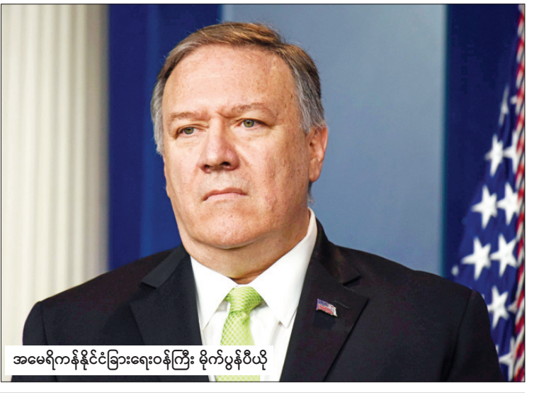
အမေရိကန်နိုင်ငံခြားရေးဝန်ကြီး မိုက်ပွန်ပီယို

အုပ်စုအကြား ဆယ်ရက်အတွင်း အကျဉ်းသား လဲလှယ်ရေးဆိုင်ရာ သဘောတူစာချုပ်တစ်ရပ် ကို ပြီးခဲ့သည့် ဖေဖော်ဝါရီ ၂၉ ရက်က လက်မှတ်ရေးထိုးခဲ့ခြင်းဖြစ်သည်။ အမေရိကန်အစိုးရနှင့် တာလီဘန်အုပ်စု အကြား သဘောတူစာချုပ်သည် အာဖဂန် နစ္စတန်နိုင်ငံအတွင်း ၂၀၀၁ ခုနှစ်ကတည်းက ဖြစ်ပွားခဲ့သည့် အမေရိကန်၏ အရှည်ကြာဆုံး စစ်ပွဲအဆုံးသတ်ရေးအတွက် မူဘောင်တစ်ခု ကို တည်ထောင်ပေးခဲ့သည်။ ကိုးကား - အေအက်ဖ်ပီ ဘာသာပြန် - ဂျေတီ