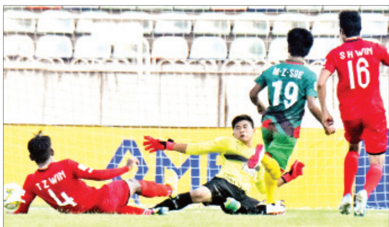
ဟံသာဝတီအသင်းနှင့် ဇွဲကပင်အသင်းတို့ ယှဉ်ပြိုင်ကစားစဉ်။