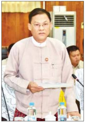
ပြည်ထောင်စုရှေ့နေချုပ် ဦးထွန်းထွန်းဦး ရှင်းလင်းတင်ပြစဉ်။

ချက်တွင် ဆောင်ရွက်ပြီး ခုနစ်ချက်၊ ဆောင်ရွက်ဆဲ ရှစ်ချက်၊ ပညာရေး ဝန်ကြီးဌာနက တာဝန်ခံဆောင်ရွက် နေသော “ကျန်းမာရေးနှင့် ပညာရေး ကိစ္စရပ်များ” ၁၃ ချက်တွင် ဆောင်ရွက်ပြီး ရှစ်ချက်၊ ဆောင်ရွက်ဆဲ ငါးချက်၊ သာသနာရေးနှင့် ယဉ်ကျေးမှု ဝန်ကြီးဌာနက တာဝန်ခံဆောင်ရွက် နေသော “ဘာသာပေါင်းစုံ ချစ်ကြည် ရေးကိစ္စရပ်များ၊ လွတ်လပ်စွာ ထုတ်ဖော်ခွင့်နှင့် ငြိမ်းချမ်းစွာ စုဝေးခွင့် ကိစ္စရပ်များ” ၁၈ ချက်တွင် ဆောင်ရွက်ပြီး ၁၄ ချက်၊ ဆောင်ရွက် ဆဲ လေးချက်၊ နိုင်ငံတော်အတိုင်ပင်ခံရုံး ဝန်ကြီးဌာနက တာဝန်ခံဆောင်ရွက် နေသော “ပစ်ခတ်တိုက်ခိုက်မှုရပ်စဲ ရေးနှင့် အမျိုးသားပြန်လည်သင့်မြတ် ရေးကိစ္စရပ်များ” ငါးချက်တွင် ဆောင်ရွက်ပြီး နှစ်ချက်၊ ဆောင်ရွက်ဆဲ သုံးချက်၊ စီမံကိန်း၊ ဘဏ္ဍာရေးနှင့် စက်မှုဝန်ကြီးဌာနက တာဝန်ခံ ဆောင်ရွက်ရသည့် “စီးပွားရေး ဖွံ့ဖြိုး တိုးတက်ရေးကိစ္စရပ်များ” ၁၂ ချက်၊ အလုပ်သမား၊ လူဝင်မှုကြီးကြပ်ရေးနှင့် ပြည်သူ့အင်အား ဝန်ကြီးဌာနက တာဝန်ခံဆောင်ရွက်နေသော “နိုင်ငံ သားစစ်စစ်ရေးကိစ္စရပ်များ၊ ပြည်တွင်း နေရပ်စွန့်ခွာရွှေ့ပြောင်းနေရသူများ ကိစ္စရပ်များနှင့် လူကုန်ကူးခြင်းကိစ္စရပ် များ” ခုနစ်ချက်တို့သည် ဆောင်ရွက်ဆဲ ကိစ္စရပ်များဖြစ်ပြီး စုစုပေါင်း အကြံပြု တိုက်တွန်းချက် ၁၆၆ ချက်တွင် ဆောင်ရွက်ပြီး ၆၂ ချက်နှင့် ဆောင်ရွက်ဆဲ ၁၀၄ ချက်ရှိသည်ကို တွေ့ရှိရပါကြောင်း၊ ဆောင်ရွက်ဆဲ အချက်များထဲမှ စဉ်ဆက်မပြတ် လုပ်ဆောင်နေရမည့် ကိစ္စရပ်များမှ လွဲ၍ ကျန်ကိစ္စရပ်များကို သတ်မှတ်