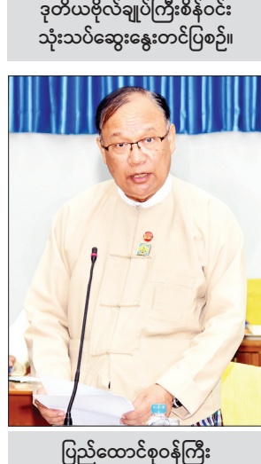
ပြည်ထောင်စုဝန်ကြီး ဦးသန့်စင်မောင် ရှင်းလင်းပြောကြားစဉ်။

ယခုအချိန်အထိ ရေနံတင်သင်္ဘောများသာ ဝင်ရောက်လာခြင်းရှိသော်လည်း တိုင်းပြည်တိုးတက်လာသည်နှင့်အမျှ ဓာတုပစ္စည်း အစရှိသော ကုန်စည်များတင်ဆောင်သည့် နိုင်ငံတကာ သင်္ဘောကြီးများ ဆက်လက်ဝင်ရောက်လာမည်ဖြစ်ပါကြောင်း၊ ထို့ကြောင့် ရေထုညစ်ညမ်းမှုဆိုင်ရာ မှာ ဆီယိုဖိတ်မှုအန္တရာယ်တစ်ခုတည်းသာမကဆိုသည်ကို သတိချပ်ရမည်ဖြစ်ပါကြောင်း။