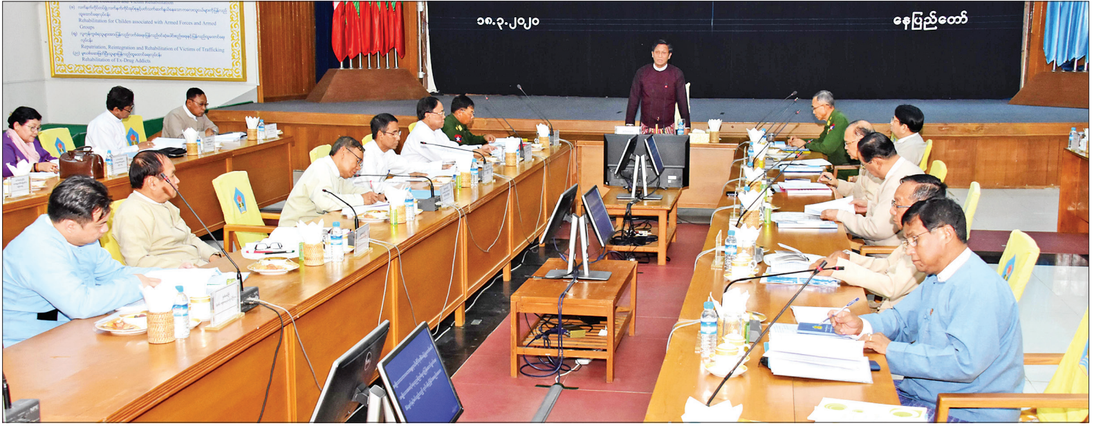
ဒုတိယသမ္မတ ဦးဟင်နရီဗိုလ်တို့ အမျိုးသားအဆင့် ရေထုညစ်ညမ်းမှုတုံ့ပြန်ဆောင်ရွက်ရေးစီမံချက် ရှင်းလင်းတင်ပြခြင်း အစည်းအဝေးတွင် အမှာစကားပြောကြားစဉ်။

မိမိဆောင်ရွက်သောလုပ်ငန်းမှ တိုက်ရိုက်ဖြစ်စေ၊ သွယ်ဝိုက်ပြီးဖြစ်စေ သဘာဝနှင့်လူမှုပတ်ဝန်းကျင်ကို သက်ရောက်မှုရှိလာနိုင်သည့် ဆိုးကျိုးများကို ကြိုတင်ကာကွယ်ခြင်း၊ လျော့ချခြင်းစသည့် အစီအမံများကို လုပ်ဆောင်ရမည်ဖြစ်