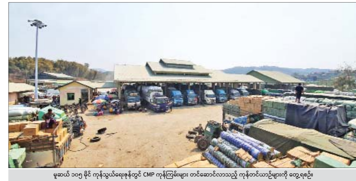
မူဆယ် ၁၀၅ မိုင် ကုန်သွယ်ရေးဇုန်တွင် CMP ကုန်ကြမ်းများ တင်ဆောင်လာသည့် ကုန်တင်ယာဉ်များကို တွေ့ရစဉ်။

□ မူဆယ် ၁၀၅ မိုင်မှ နှစ်စဉ် တရုတ်နှစ်သစ်ကူး ရုံးပိတ်ရက်ကာလတွင် ကုန်သွယ်မှုလျော့နည်းလေ့ ရှိသော်လည်း ကိုရိုနာဗိုင်းရပ်စ် စတင်ကူးစက်မှုဖြစ်ပွားမှုနှင့် ဆက်စပ်သွားသဖြင့် ကုန်သွယ်မှုလုပ်ငန်းများ ဆက်လက်ရပ်ဆိုင်းသွားခဲ့ကြောင်း၊ ကုန်သွယ်မှုလျော့နည်း လေ့ရှိသော တရုတ်နှစ်သစ်ကူးကာလ ဇန်နဝါရီ ၂၃ ရက်နှင့် ၂၄ ရက်တို့တွင် CMP ကုန်ကြမ်းတင်သွင်းမှုမှာ တစ်နေ့လျှင် ကားစီးရေ ၄၀ မှ ၅၀ ခန့်အထိရှိပြီး ဇန်နဝါရီ ၂၇ ရက် နောက်ပိုင်းတွင် CMP ကုန်ကြမ်းတင်သွင်းမှုမှာ တစ်နေ့လျှင် ကားစီးရေ ၄၀ မှ ၅၀ ခန့်အထိရှိခဲ့ပြီး အချို့ရက်များတွင် တင်သွင်းမှုလုံးဝမရှိသည်အထိ ဖြစ်ခဲ့ကြောင်း။ ဖေဖော်ဝါရီ ၁၅ ရက်မှစတင်၍ တရုတ်နိုင်ငံအတွင်း ရောဂါပိုးကူးစက်မှု မရှိသော ပြည်နယ်များမှ ကုန်တင်ယာဉ်ကြီးများ တရုတ်နိုင်ငံ နယ်စပ်မြို့ဖြစ်သည့် ရွှေလီနှင့် ကျယ်ဂေါင်မြို့တို့သို့ ဝင်ရောက်ခွင့်ရလာသည့်အချိန်မှစ၍ မူဆယ် ၁၀၅ မိုင် ကုန်သွယ်ရေးဇုန်မှ CMP ကုန်ကြမ်းတင်သွင်းမှုတွင် တစ်နေ့လျှင် ကားစီးရေ ၄၀ မှ ၅၀ ခန့်အထိရှိခဲ့ပြီး အချို့ရက်များတွင် တင်သွင်းမှုလုံးဝမရှိသည်အထိ ဖြစ်ခဲ့ကြောင်း။ မတ်လဆန်းမှစတင်၍ တင်သွင်းမှုများ အရှိန်ရလာကာ မတ် ၁၀ ရက်မှစ၍ တစ်ရက်လျှင် စီးရေ ၃၀ ခန့်တင်သွင်းခဲ့ပြီး မတ် ၁၁ ရက်မှ ၁၇ ရက်အထိ စီးရေ ၇၀ ခန့် မြင့်တက်လာခဲ့ကြောင်း၊ ကုန်ကြမ်းတင်သွင်းမှုအနေ ဖြင့် အမေရိကန်ဒေါ်လာ ၁ ဒသမ ၁၄ သန်းမှ ၂ ဒသမ ၉၃ သန်းအထိ တိုးမြှင့်လာခဲ့ပြီး CMP ကုန်ကြမ်းတင်သွင်းမှုမှာ ကိုရိုနာဗိုင်းရပ်စ်မဖြစ်ခင်ကာလများထက် ယခုမတ်လ တွင် ပိုမိုတင်သွင်းမှုများပြားကြောင်း စီးပွားရေးနှင့် ကူးသန်းရောင်းဝယ်ရေးဝန်ကြီး ဌာနမှ သတင်းရရှိသည်။ သတင်းစဉ်