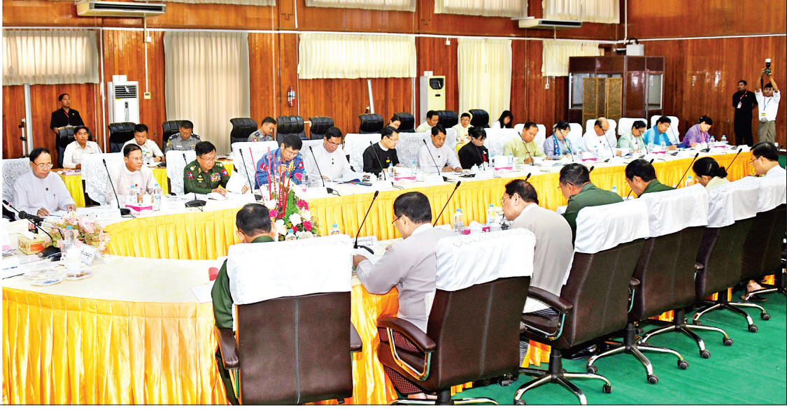
ဒုတိယသမ္မတ ဦးမြင့်ဆွေ ကမ္ဘာ့နိုင်ငံအားလုံး၏ လူ့အခွင့်အရေးအခြေအနေကို ပုံမှန်သုံးသပ်သည့်လုပ်ငန်းစဉ် (Universal Periodic Review - UPR) ဆိုင်ရာ အကြံပြုတိုက်တွန်းချက်များ အကောင်အထည်ဖော်ဆောင်ရွက်ရေး အမျိုးသားအဆင့်ကော်မတီ၏ တတိယအကြိမ် လုပ်ငန်းညှိနှိုင်းအစည်းအဝေးတွင် အမှာစကားပြောကြားစဉ်။