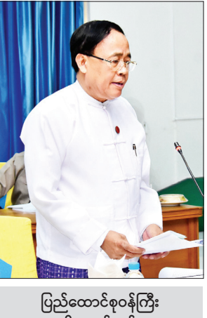
ပြည်ထောင်စုဝန်ကြီး ဦးကျော်တင် သုံးသပ်ဆွေးနွေးတင်ပြစဉ်။