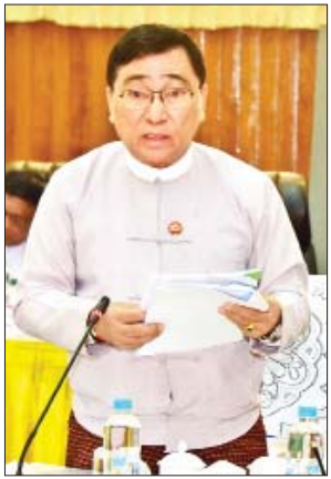
ပြည်ထောင်စုဝန်ကြီး ဒေါက်တာ ဝင်းမြတ်အေး ဆွေးနွေးတင်ပြစဉ်။

နေသော “အဓိကအပြည်ပြည်ဆိုင်ရာ လူ့အခွင့်အရေးစာချုပ်များတွင် ပါဝင် ချုပ်ဆိုရန်ကိစ္စရပ်များ” ၄၁ ချက်တွင် ဆောင်ရွက်ပြီး ၁၃ ချက်၊ ဆောင်ရွက် ဆဲ ၂၈ ချက်၊ မြန်မာနိုင်ငံအမျိုးသား လူ့အခွင့်အရေးကော်မရှင်က တာဝန်ခံ ဆောင်ရွက်နေသော “အမျိုးသားလူ့ အခွင့်အရေးကော်မရှင်နှင့် စပ်လျဉ်း သည့် ကိစ္စရပ်များ” ခုနစ်ချက်တွင် ဆောင်ရွက်ပြီး တစ်ချက်၊ ဆောင်ရွက် ဆဲ ခြောက်ချက်၊ အပြည်ပြည်ဆိုင်ရာ ပူးပေါင်းဆောင်ရွက်ရေးဝန်ကြီးဌာနက တာဝန်ခံဆောင်ရွက်နေသော “ကုလ သမဂ္ဂ လူ့အခွင့်အရေးယန္တရားနှင့် ဆောင်ရွက်ရန်ကိစ္စရပ်များ” လေးချက်တွင် ဆောင်ရွက်ပြီး နှစ်ချက်၊ ဆောင်ရွက်ဆဲ နှစ်ချက်၊ ပြည်ထောင်စု ရှေ့နေချုပ်ရုံးက တာဝန်ယူဆောင်ရွက် ရသည့် “ဒီမိုကရေစီရေး၊ ငြိမ်းချမ်းရေး၊ တရားဥပဒေစိုးမိုးရေးနှင့် လူ့အခွင့် အရေးပြုပြင်ပြောင်းလဲရေး ကိစ္စရပ် များ” ၁၉ ချက်တွင် ဆောင်ရွက်ပြီး နှစ်ချက်၊ ဆောင်ရွက်ဆဲ ၁၇ ချက်၊ ပြည်ထောင်စုအစိုးရအဖွဲ့ရုံး ဝန်ကြီး ဌာနက တာဝန်ခံဆောင်ရွက်နေသော “ကောင်းမွန်သော အုပ်ချုပ်မှုစနစ် ဖော်ဆောင်ရေးကိစ္စနှင့် မြေသိမ်းမှုကိစ္စ ရပ်များ” ၁၀ ချက်တွင် ဆောင်ရွက်ပြီး လေးချက်၊ ဆောင်ရွက်ဆဲ ခြောက် ချက်၊ လူမှုဝန်ထမ်း၊ ကယ်ဆယ်ရေး နှင့် ပြန်လည်နေရာချထားရေးဝန်ကြီး ဌာနက တာဝန်ခံဆောင်ရွက်နေသော “ကျား/မတန်းတူရည်တူရှိမှုဖြင့်တင် ရေးကိစ္စရပ်များနှင့် ထိခိုက်ခံစားလွယ် သော အုပ်စုများ ကာကွယ်ရေးကိစ္စရပ် များ” ၁၅ ချက်တွင် ဆောင်ရွက်ပြီး ကိုးချက်၊ ဆောင်ရွက်ဆဲ ခြောက်ချက် နှင့် ခွဲခြားမှုမပြုရေးကိစ္စရပ်များ ၁၅