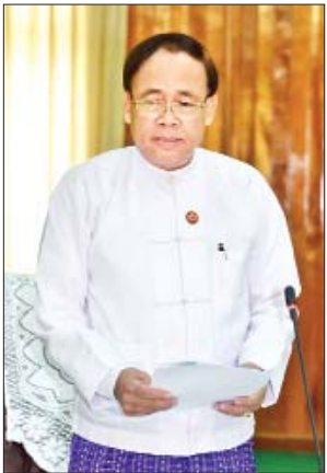
ပြည်ထောင်စုဝန်ကြီး ဦးကျော်တင် ဆွေးနွေးတင်ပြစဉ်။

၂၀၁၉ ခုနှစ် မေ ၃၀ ရက်က ကျင်းပခဲ့သည့် “အမျိုးသား အဆင့်ကော်မတီ၏ ဒုတိယအကြိမ် လုပ်ငန်းညှိနှိုင်းအစည်းအဝေး” တွင် အစည်းအဝေးဆုံးဖြတ်ချက် ကိုးချက် ချမှတ်ခဲ့ရာ ဆုံးဖြတ်ချက်များအားလုံး ဆောင်ရွက်ပြီးဖြစ်သည်ကို တွေ့ရှိရ ပါကြောင်း၊ ကဏ္ဍ (၁)ရပ်အပေါ် တာဝန်ခံဆောင်ရွက်နေသည့် ဝန်ကြီး ဌာနများနှင့် အဖွဲ့အစည်းများ၏ တင်ပြချက်များအရ နိုင်ငံခြားရေး ဝန်ကြီးဌာနက တာဝန်ခံဆောင်ရွက်