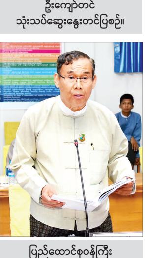
ပြည်ထောင်စုဝန်ကြီး ဦးအုန်းဝင်း သုံးသပ်ဆွေးနွေးတင်ပြစဉ်။