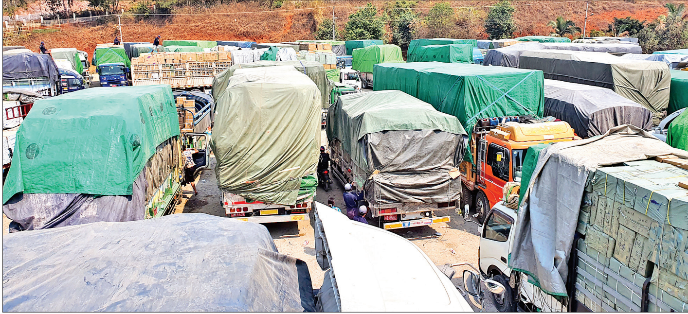
မူဆယ် ၁၀၅ မိုင် ကုန်သွယ်ရေးဇုန်တွင် CMP ကုန်ကြမ်းများ တင်ဆောင်လာသည့် ကုန်တင်ယာဉ်များကို တွေ့ရစဉ်။

တစ်မြို့ ကူးလူးဆက်ဆံမှုများကို ပိတ်ဆို့ဖြတ်တောက်လိုက်သဖြင့် ကုန်သွယ်မှုများ ရပ်ဆိုင်းသွားခဲ့ပြီး တရုတ်နိုင်ငံနှင့် နယ်စပ်ကုန်သွယ်ရေးဆောင်ရွက်လျက်ရှိသော မူဆယ်၊ လွယ်ဂျယ်၊ ချင်းရွှေဟော်၊ ကန်ပိုက်တီ ကုန်သွယ်ရေးစခန်းတို့တွင်လည်း ကုန်သွယ်မှုလုပ်ငန်း များ ထိခိုက်လာခဲ့သည်။ စာမျက်နှာ ၁၅ ကော်လံ ၁ သို့ ❑