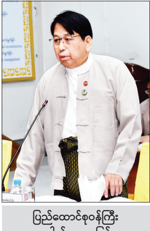
ပြည်ထောင်စုဝန်ကြီး ဒေါက်တာဖေမြင့် သုံးသပ်ဆွေးနွေးတင်ပြစဉ်။