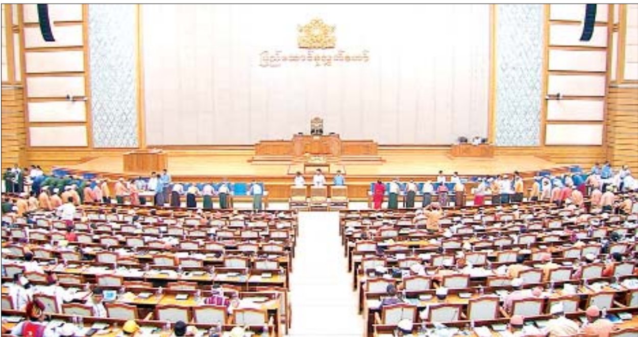
ဒုတိယအကြိမ် ပြည်ထောင်စုလွှတ်တော် (၁၅)ကြိမ်မြောက် ပုံမှန်အစည်းအဝေး (၂၅)ရက်မြောက်နေ့တွင် ပြည်ထောင်စုလွှတ်တော်ကိုယ်စားလှယ်များ လျှို့ဝှက်ဆန္ဒပြုခြင်း နည်းလမ်းဖြင့် ဆန္ဒမဲပေးကြစဉ်။

ဖွဲ့စည်းပုံအခြေခံဥပဒေကို ဒုတိယအကြိမ် ပြင်ဆင်သည့် ဥပဒေမူကြမ်းများပါ ဖွဲ့စည်းပုံ အခြေခံဥပဒေပုဒ်မ ၄၃၆ ပုဒ်မခွဲ(ခ)တွင် အကျုံးဝင်သော ပုဒ်မ၊ ပုဒ်မခွဲ ၁၉ ခုကို စုစည်းထားသည့် ဆန္ဒမဲလက်မှတ်(၃)နှင့်စပ်လျဉ်း၍ လွှတ်တော်၏ အဆုံးအဖြတ်ရယူ