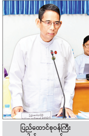
ပြည်ထောင်စုဝန်ကြီး ဒေါက်တာအောင်သူ သုံးသပ်ဆွေးနွေးတင်ပြစဉ်။

ရည်ရွယ်ရေးဆွဲထား အမျိုးသားအဆင့် ရေထုညစ်ညမ်းမှု တုံ့ပြန်ဆောင်ရွက်ရေးစီမံချက် (National Contingency Plan for Marine Pollution) ကို ရေထုညစ်ညမ်းမှုများအား ထိရောက်လျင်မြန်စွာ တုံ့ပြန်ဆောင်ရွက်ပြီး ထိခိုက်မှုအနည်းဆုံး ဖြစ်စေရန်အတွက် အစိုးရအဖွဲ့အစည်းများနှင့် သက်ဆိုင်ရာ အဖွဲ့အစည်းများ/လူပုဂ္ဂိုလ်များအကြား ပေါင်းစပ်ညှိနှိုင်းဆောင်ရွက်နိုင်ရေးအတွက် မူဝါဒ၊ စနစ်နှင့် လမ်းညွှန်ချက်များဆိုင်ရာ အမျိုးသားအဆင့် မူဘောင်ချမှတ်နိုင်ရန် ရည်ရွယ်ရေးဆွဲထားရှိကြောင်း အဆိုပါစီမံချက်တွင် ဖော်ပြထားသည်ကို တွေ့ရှိရပါကြောင်း။