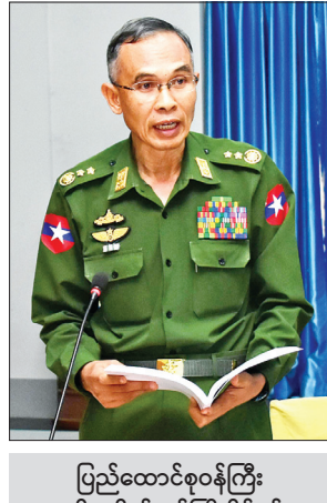
ပြည်ထောင်စုဝန်ကြီး ဒုတိယဗိုလ်ချုပ်ကြီးစိန်ဝင်း သုံးသပ်ဆွေးနွေးတင်ပြစဉ်။

မတော်တဆယိုဖိတ်မှုကြောင့် ဖြစ်ပွားသော ညစ်ညမ်းမှု” ဟု ဖွင့်ဆိုထားသည်ကို တွေ့ရှိရပါကြောင်း။ ထည့်သွင်းပြဋ္ဌာန်းရေးဆွဲ၍ ၂၀၁၃ ခုနှစ်က ပြဋ္ဌာန်းထားသည့် သဘာဝဘေးအန္တရာယ်ဆိုင်ရာ စီမံခန့်ခွဲမှုဥပဒေတွင်လည်း သဘာဝဘေးအန္တရာယ်ဆိုင်ရာကို သဘာဝအလျောက်ဖြစ်စေ၊ လူတို့၏ ပြုမူဆောင်ရွက်မှု၊ မတော်တဆမှု သို့မဟုတ် ပျော်ဆွဲမှုကြောင့် ဖြစ်ပွားသော ဓာတုပစ္စည်းကြောင့် ဖြစ်စေ၊ ရေနံယိုဖိတ်ခြင်းကြောင့် ဖြစ်စေ ဖြစ်ပွားသော သဘာဝဘေးအန္တရာယ်ဖြစ်သည်ဟု ထည့်သွင်းပြဋ္ဌာန်းရေးဆွဲထားပြီးဖြစ်ပါကြောင်း။