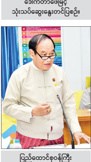
ပြည်ထောင်စုဝန်ကြီး ဒေါက်တာမြင့်ထွေး သုံးသပ်ဆွေးနွေးတင်ပြစဉ်။

ရန်၊ နိုင်ငံတကာတွင် ဖြစ်ပွားခဲ့သည့် ရေနံယိုဖိတ်မှု၊ ရေနံတွင်း ပေါက်ကွဲမှုကြောင့် ရေထုညစ်ညမ်းမှုဖြစ်စဉ်များ၊ ပျက်စီးဆုံးရှုံး ထိခိုက်နစ်နာမှုနှင့် ပြန်လည်ကုစားပေးရသည့် အခြေအနေများနှင့် အမျိုးသားအဆင့် ရေထုညစ်ညမ်းမှု တုံ့ပြန်ဆောင်ရွက်ရေးစီမံချက်တွင် ဖြည့်စွက်သင့်သည့် အချက်များကို ဆွေးနွေးတင်ပြကြသည်။