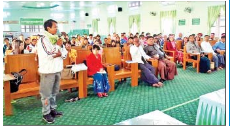
အမျိုးသားလွှတ်တော် တိုင်းရင်းသားရေးရာကော်မတီနှင့် ကယားပြည်နယ် လွိုင်လင်မြို့မှ တိုင်းရင်းသား ဘာသာစာပေသင်ကြားသည့် ဆရာ ဆရာမများနှင့်တွေ့ဆုံစဉ်။