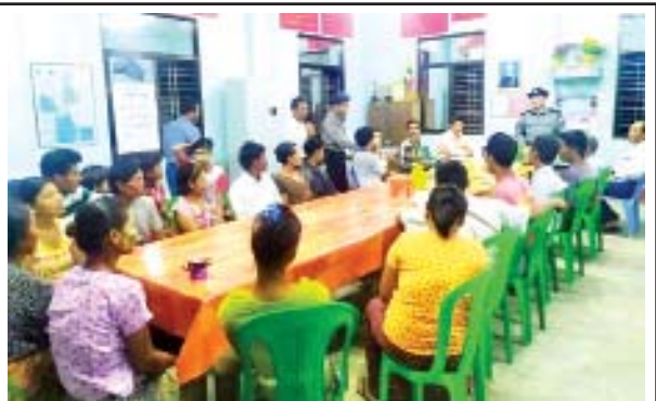
ရန်ကုန်တိုင်းဒေသကြီး ခရမ်းမြို့နယ် အမှတ်(၉)ရပ်ကွက်အုပ်ချုပ်ရေးမှူးရုံး၌ မတ် ၁၄ ရက် ညပိုင်းတွင် ခရမ်းမြို့မရဲစခန်းမှူးနှင့် အဖွဲ့ဝင်များက မူခင်း ကျဆင်းရေးအသိပညာပေး ဟောပြောစဉ်။