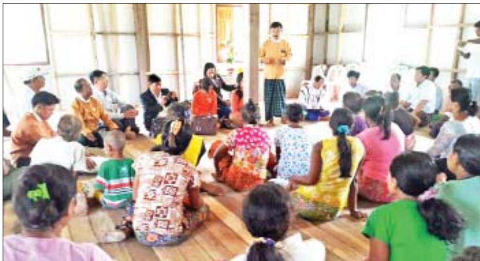
မကြိုဂလက်ကျွန်းဘော်ဒါဆောင်တွင် အမျိုးသားလွှတ်တော် တိုင်းရင်းသားရေးရာကော်မတီနှင့် ဆလုံ တိုင်းရင်းသားတွေ့ဆုံစဉ်။

နောက်ပြီး စစ်ကိုင်းတိုင်းဒေသကြီးမှာရှိတဲ့ ပြည်ထောင်စု တိုင်းရင်းသားလူမျိုးများ ဖွံ့ဖြိုးရေး တက္ကသိုလ် (ရွာသစ်ကြီး)ကိုလည်း သွားရောက်လေ့လာ တာရှိပါတယ်။ ကချင်ပြည်နယ်မှာရှိတဲ့ တိုက်ပွဲရှောင်စခန်း တွေကို သွားရောက်တာတွေ၊ သူတို့ရဲ့ အခက်အခဲကို နားထောင်တာ၊ နှစ်သိမ့်ဆွေးနွေးပေးတာတွေလည်း ရှိပါတယ်။ ကျွန်ုပ်တို့ တိုင်းရင်းသားရေးရာကော်မတီ အနေနဲ့ သူတို့ရဲ့ လိုအပ်ချက်တွေကို တတ်နိုင်သလောက် လျှော့ဒါနီးပေးခဲ့တာတွေလည်း ရှိပါတယ်။ သက်ဆိုင်ရာ ပြည်နယ်အစိုးရ တာဝန်ရှိသူတွေနဲ့ တွေ့ဆုံခဲ့တာတွေ