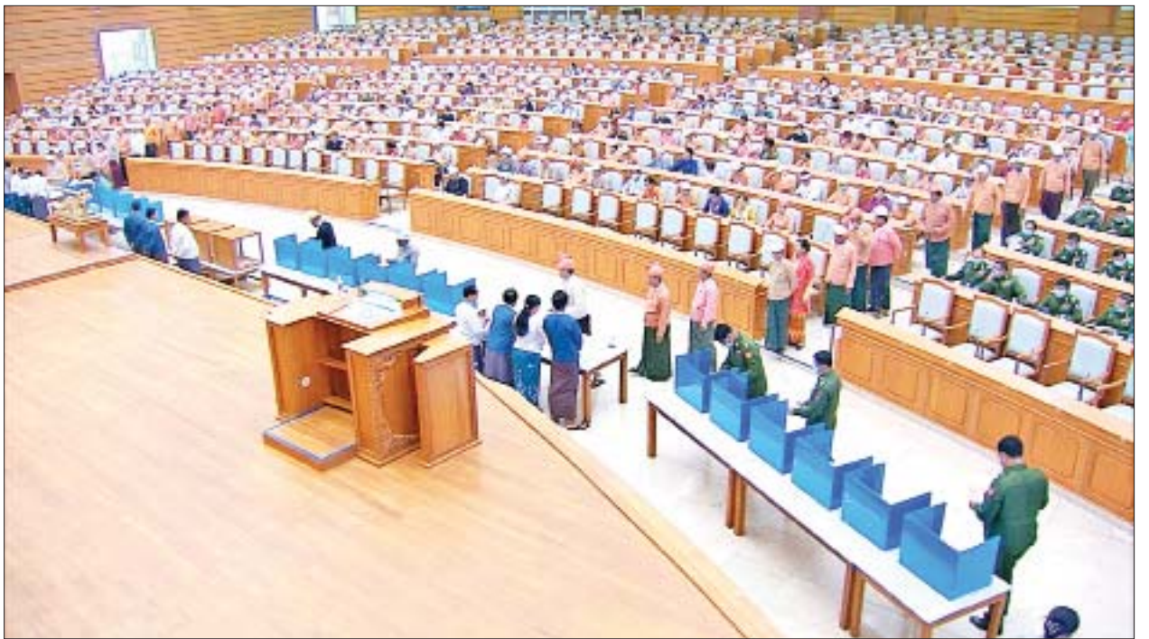
ပြည်ထောင်စုလွှတ်တော်ကိုယ်စားလှယ်များ လျှို့ဝှက်ဆန္ဒပြုခြင်းနည်းလမ်းဖြင့် ဆန္ဒမဲပေးကြစဉ်။

ထို့နောက် ပြည်ထောင်စုလွှတ်တော်နာယက က လွှတ်တော်ကိုယ်စားလှယ် များထံ ထုတ်ပေးထားသည့် ဆန္ဒမဲလက်မှတ် ၆၃၁ စောင်ဖြစ်ပြီး ယခုဆန္ဒမဲ