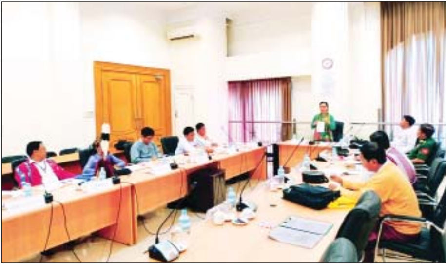
အမျိုးသားလွှတ်တော် တိုင်းရင်းသားရေးရာကော်မတီ၏ ညှိနှိုင်းအစည်းအဝေး ကျင်းပစဉ်။