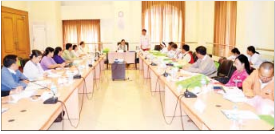
အမျိုးသားလွှတ်တော် တိုင်းရင်းသားရေးရာကော်မတီနှင့် တိုင်းရင်းသားလူမျိုးရေးရာဝန်ကြီးဌာနမှ တာဝန်ရှိသူများ တွေ့ဆုံဆွေးနွေးစဉ်။

တိုင်းရင်းသားရေးရာကော်မတီသည် ပြည်တွင်းငြိမ်းချမ်းရေးကော်မတီ၊ ကော်မရှင်များ၊ ပြည်ထောင်စုအဆင့် အစိုးရဌာနများ၊ ဝန်ကြီးဌာနများ၊ ပြည်တွင်း ပြည်ပ အဖွဲ့အစည်းများ၊ အစိုးရမဟုတ်သောအဖွဲ့အစည်းများ၊ ငြိမ်းချမ်းရေး အဖွဲ့အစည်းများနှင့် လွှတ်တော်ဥက္ကဋ္ဌ၏ ခွင့်ပြုချက်ဖြင့် အခါအားလျော်စွာ တွေ့ဆုံဆွေးနွေးညှိနှိုင်း၍ လုပ်ငန်း၏ရည်ရွယ်ချက်များကို ဖော်ဆောင်ပေးရန်၊ ငြိမ်းချမ်းရေးဖော်ဆောင်မှုကို တိုက်ရိုက်ဖြစ်စေ၊ သွယ်ဝိုက်၍ဖြစ်စေ ဆောင်ရွက်နေသည့် ပြည်တွင်း ပြည်ပ အဖွဲ့အစည်းများ၏ အခြေအနေကို လေ့လာသုံးသပ်တင်ပြရန်တို့ကို ဆောင်ရွက်ရ