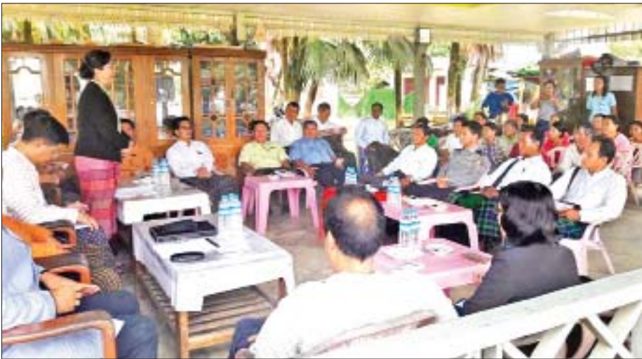
အမျိုးသားလွှတ်တော် တိုင်းရင်းသားရေးရာကော်မတီမှ တာဝန်ရှိသူများကချင်ပြည်နယ် တနိုင်းမြို့ တိုင်းရင်းသားဒေသခံများနှင့်တွေ့ဆုံစဉ်။

ကျွန်ုပ်တို့တိုင်းရင်းသားရေးရာကော်မတီအနေနဲ့ တိုင်းရင်းသားတွေရဲ့ ဘာသာ၊ စာပေ၊ စကား၊ ရိုးရာ ယဉ်ကျေးမှုတွေနဲ့ ပတ်သက်ပြီး ပေါင်းစပ်ဆောင် ရွက်ပေးလျက်ရှိပါတယ်။ ရှေ့ဆက်လက်ပြီးတော့လည်း ကရင်ပြည်နယ်၊ မွန်ပြည်နယ်တွေကို သွားရောက်ပြီး ဆောင်ရွက်ဖို့ရှိပါတယ်။ တိုင်းရင်းသားတွေရဲ့ မြေမူပါဒ် ရေးဆွဲရာမှာလည်း အထောက်အကူပြုအောင် သုတေသန လုပ်ငန်းတွေ ဆောင်ရွက်နေပါတယ်လို့ ပြောကြားလိုပါ တယ်။