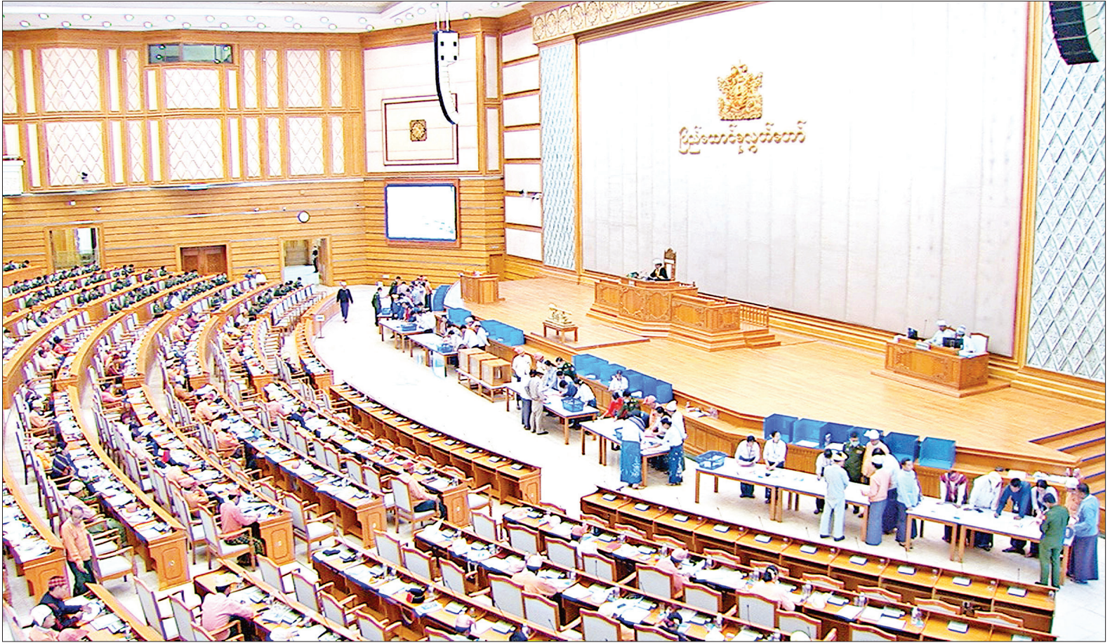
ဒုတိယအကြိမ် ပြည်ထောင်စုလွှတ်တော် (၁၅)ကြိမ်မြောက် ပုံမှန်အစည်းအဝေး (၂၄)ရက်မြောက်နေ့ ကျင်းပစဉ်။

နေပြည်တော် မတ် ၁၇ ဒုတိယအကြိမ် ပြည်ထောင်စု လွှတ်တော် (၁၅)ကြိမ်မြောက် ပုံမှန် အစည်းအဝေး (၂၄)ရက်မြောက်နေ့ကို ယနေ့နံနက် ၁၀ နာရီတွင် နေပြည် တော်ရှိ ပြည်ထောင်စုလွှတ်တော် အစည်းအဝေးခန်းမ၌ ကျင်းပရာ တက်ရောက်ခွင့်ရှိသူ ပြည်ထောင်စု လွှတ်တော်ကိုယ်စားလှယ် ၆၅၄ ဦး ရှိသည့်အနက် ၆၃၁ ဦးတက်ရောက်ပြီး ၂၃ ဦး ခွင့်တိုင်ကြားသည်။ အစည်းအဝေးတွင် ပြည်ထောင်စု လွှတ်တော် ဥပဒေကြမ်းပူးပေါင်း ကော်မတီဝင် ဦးဇော်ဝင်းက နိုင်ငံတော် သမ္မတထံမှ သဘောထားမှတ်ချက်ဖြင့် ပြန်လည်ပေးပို့ထားသော မြန်မာ နိုင်ငံ ဘူမိသိပ္ပံကောင်စီဥပဒေကြမ်းနှင့် စပ်လျဉ်း၍ ဥပဒေကြမ်း ပူးပေါင်း ကော်မတီ၏ လေ့လာတွေ့ရှိချက်နှင့် သဘောထားမှတ်ချက် အစီရင်ခံစာကို လွှတ်တော်သို့ ဖတ်ကြားတင်ပြသည်။ ထို့နောက် ပြည်ထောင်စုလွှတ်တော် နာယက ဦးတီခွန်မြတ် က နိုင်ငံတော် သမ္မတ၏ သဘောထားမှတ်ချက်များ ကို ပြည်ထောင်စုလွှတ်တော်ဆိုင်ရာ နည်းဥပဒေ ၁၀၈ နှင့်အညီ အဆိုတင် သွင်းဆွေးနွေးလိုသည့် လွှတ်တော် ကိုယ်စားလှယ်ရှိပါက အပိုဒ်၊ အပိုဒ်ခွဲ စာမျက်နှာ ၃ ကော်လံ ၁ သို့ ၂