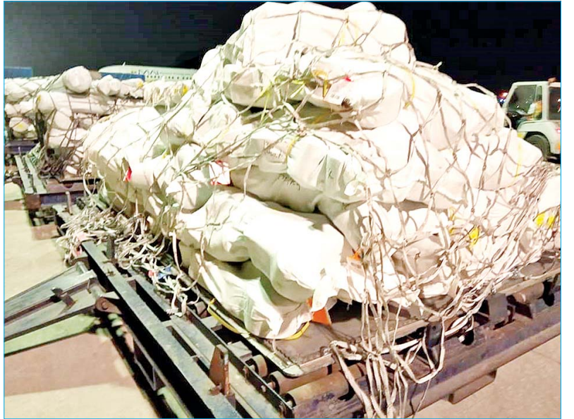
တရုတ်ပြည်သူ့သမ္မတနိုင်ငံ ကွမ်ကျိုးမြို့မှ AQ - 1359 Cargo ကုန်တင်လေယာဉ်ဖြင့် သယ်ဆောင်လာသည့် ကုန်ကြမ်းပစ္စည်းများ ရန်ကုန်အပြည်ပြည်ဆိုင်ရာလေဆိပ်သို့ ရောက်ရှိလာစဉ်။