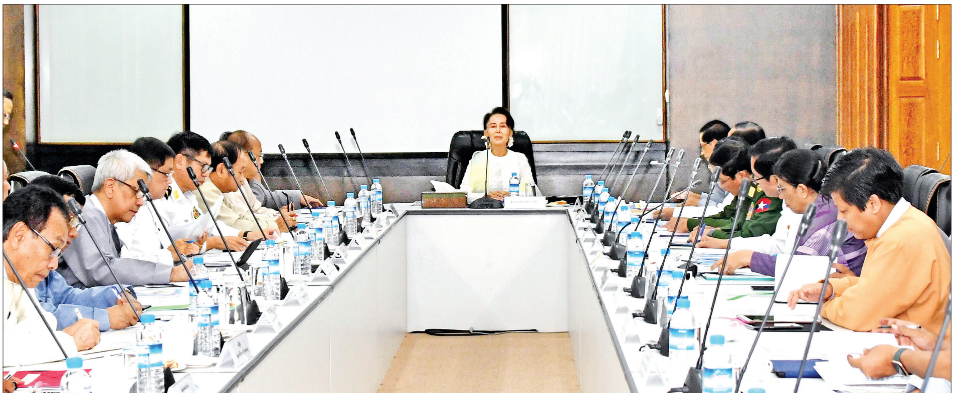
နိုင်ငံတော်၏အတိုင်ပင်ခံပုဂ္ဂိုလ် ဒေါ်အောင်ဆန်းစုကြည် COVID-19 ကြောင့်ဖြစ်ပွားသော အဆုတ်ရောင်ရောဂါ ကာကွယ်၊ ထိန်းချုပ်၊ ကုသရေးဆိုင်ရာ အရေးပေါ်အစည်းအဝေးတွင် အမှာစကားပြောကြားစဉ်။

COVID-19 ကြောင့်ဖြစ်ပွားသော အဆုတ်ရောင်ရောဂါ ကာကွယ်၊ ထိန်းချုပ်၊ ကုသရေးဆိုင်ရာ အရေးပေါ်အစည်းအဝေး တက်ရောက်