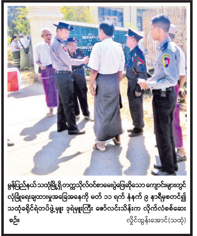
မွန်ပြည်နယ်သထုံမြို့ရှိ တက္ကသိုလ်ဝင်စာမေးပွဲဖြေဆိုသော ကျောင်းများတွင် လုံခြုံရေးချထားမှုအခြေအနေကို မတ် ၁၁ ရက် နံနက် ၉ နာရီမှစတင်၍ သထုံခရိုင်ရဲတပ်ဖွဲ့မှူး ဒုရဲမှူးကြီး ဇော်လင်းသိန်းက လိုက်လံစစ်ဆေး စဉ်။ လှိုင်ထွန်းအောင်(သထုံ)