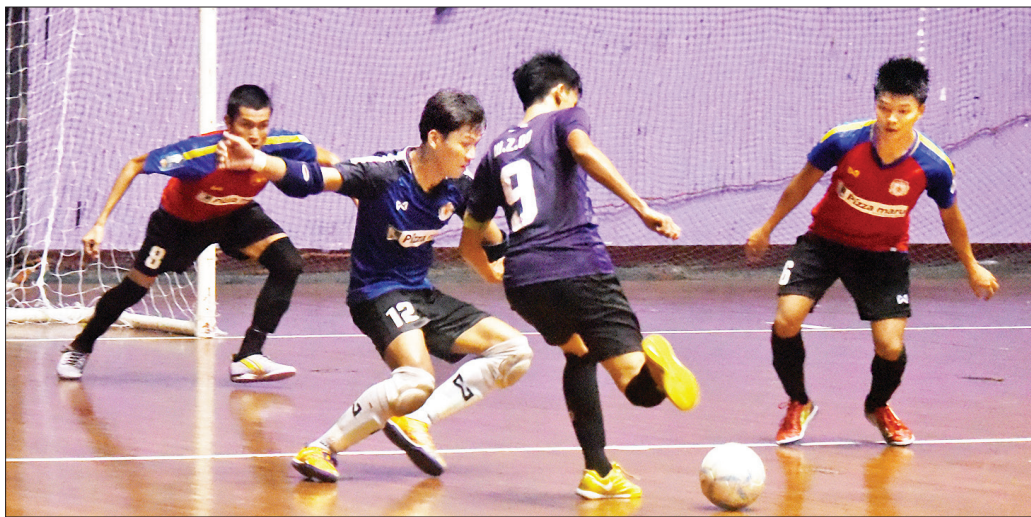
၂၀၁၉ ခုနှစ်က ကျင်းပသည့် MFF Open Cup ဖူဆယ်ပြိုင်ပွဲတွင် ပြိုင်ပွဲဝင်အသင်းများ ယှဉ်ပြိုင်နေစဉ်။