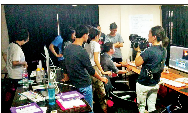
ရန်ကုန် မတ် ၁၂ ဂျပန်နိုင်ငံ NHK အသံလွှင့်ဌာနမှ ရိုက်ကူးရေး အဖွဲ့သည် ယနေ့တွင် ရန်ကုန်မြို့ ရန်ကင်း မြို့နယ်ရှိ ရန်ကုန်ရုပ်ရှင်သင်တန်းကျောင်း မြန်မာ့ရုပ်ရှင် ပြောင်းလဲတိုးတက်လာမှု