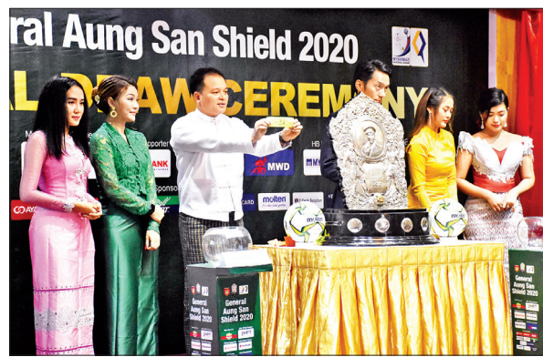
၂၀၂၀ ရာသီ ဗိုလ်ချုပ်အောင်ဆန်းခိုင်း ရှုံးထွက်ပြိုင်ပွဲ ပွဲစဉ်မဲနှိုက်စဉ်။