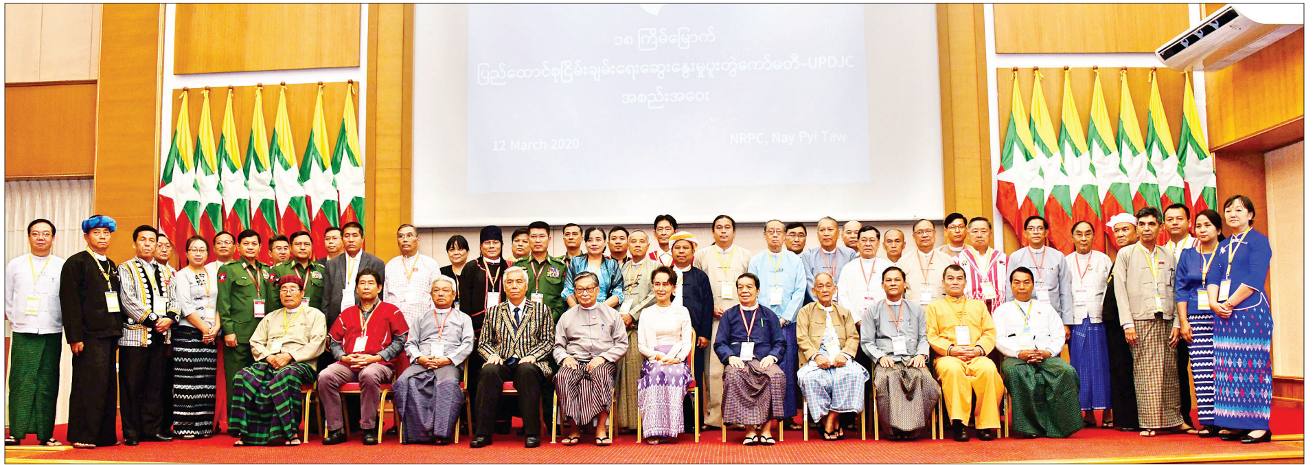
နိုင်ငံတော်၏အတိုင်ပင်ခံပုဂ္ဂိုလ် ဒေါ်အောင်ဆန်းစုကြည် (၁၈)ကြိမ်မြောက် ပြည်ထောင်စုငြိမ်းချမ်းရေးဆွေးနွေးမှုပူးတွဲကော်မတီ-UPDJC အစည်းအဝေးသို့ တက်ရောက်လာကြသည့် အစိုးရ၊ လွှတ်တော်၊ တပ်မတော်အစုအဖွဲ့၊ တိုင်းရင်းသားလက်နက်ကိုင် အဖွဲ့အစည်းများအစုအဖွဲ့နှင့် နိုင်ငံရေးပါတီများအစုအဖွဲ့တို့မှ တာဝန်ရှိသူများနှင့်အတူ စုပေါင်းမှတ်တမ်းတင်ဓာတ်ပုံရိုက်ကြစဉ်။

» စာမျက်နှာ ၄ မှ မိမိတို့နိုင်ငံတွင် ငြိမ်းချမ်းရေး မရရှိခဲ့သည်မှာ လွတ်လပ်ရေးစပြီး ရကတည်းက ဖြစ်ပါကြောင်း၊ ငြိမ်းချမ်းသည့်နိုင်ငံဖြစ်အောင် မိမိတို့ ဆောင်ရွက်ရာတွင် စေတနာ၊ ပညာ၊ သတ္တိ လိုအပ်ပါကြောင်း၊ စေတနာရှိမှသာ ငြိမ်းချမ်းရေးကို စတင်လုပ်ဆောင် နိုင်မည်ဖြစ်ပါကြောင်း၊ စတင် လုပ်ဆောင်ရာတွင် ပညာဖြင့် မှန်မှန် ကန့်ကန့် လမ်းကိုလျှောက်ပြီး မှန်ကန် သည့်ဆုံးဖြတ်ချက်များ ချနိုင်မည် ဖြစ်ပါကြောင်း၊ ယင်းဆုံးဖြတ်ချက် များကို အကောင်အထည်ဖော်ရသည့် သတ္တိရှိရန် အင်မတန်အရေးကြီးပါ