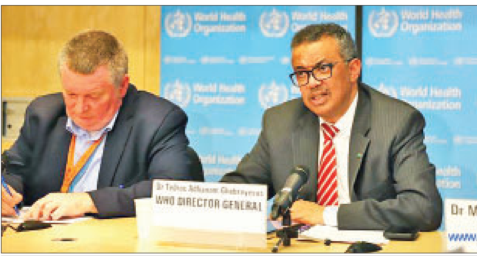
ကမ္ဘာ့ကျန်းမာရေးအဖွဲ့ ညွှန်ကြားရေးမှူးချုပ် တက်ရိတ်အက်ဒါဟာနို ဂီဘာရီရက်စ်အား သတင်းစာရှင်းလင်းပွဲတွင် တွေ့ရစဉ်။

ဂျီနီဗာ မတ် ၁၂ ကိုရိုနာဗိုင်းရပ်စ်ပိုးကူးစက်ပြန့်ပွားမှုသည် နေ့စဉ် ပိုမိုများပြားလာသည့်အတွက် ကိုရိုနာဗိုင်းရပ်စ် ကူးစက်မှုကို ကမ္ဘာလုံးဆိုင်ရာ ကပ်ရောဂါအဖြစ် ကမ္ဘာ့ကျန်းမာရေးအဖွဲ့က ယမန်နေ့တွင် ထုတ်ပြန်ကြေညာခဲ့သည်။ ကိုရိုနာဗိုင်းရပ်စ်ပိုးကူးစက်မှုကို ကမ္ဘာလုံးဆိုင်ရာ ကပ်ရောဂါအဖြစ် သတ်မှတ်ရန် စစ်ဆေးအကဲဖြတ်မှုများ လုပ်ဆောင်ခဲ့ကြောင်း ကမ္ဘာ့ကျန်းမာရေးအဖွဲ့ ညွှန်ကြားရေးမှူးချုပ် တက်ရိတ်အက်ဒါဟာနို ဂီဘာရီရက်စ်က သတင်းစာရှင်းလင်းပွဲ တစ်ရပ်တွင် ပြောကြားခဲ့သည်။ ထို့ပြင် ကိုရိုနာဗိုင်းရပ်စ်ပိုးကူးစက်မှုကို ကာကွယ်ပေးရန် ဘာသာရေးနှင့် လျင်မြန်သွက်လက်ပြီး ထိရောက်သော လုပ်ဆောင်ချက်များကို ကမ္ဘာ့နိုင်ငံများအနေဖြင့် ဆောင်ရွက်သင့်ကြောင်း ကမ္ဘာ့ကျန်းမာရေးအဖွဲ့ ညွှန်ကြားရေးမှူးချုပ် တက်ရိတ်အက်ဒါဟာနို ဂီဘာရီရက်စ်က ပြောကြားခဲ့သည်။ လက်ရှိအချိန်၌ ကမ္ဘာ့နိုင်ငံပေါင်း ၁၁၄ နိုင်ငံတွင် ဗိုင်းရပ်စ်ပိုးတွေ့ရှိရပြီး ကူးစက်ခံရသူ ၁၂၅၆၆၆ ခန့်ရှိကာ ၄၄၄၁ ဦး သေဆုံးခဲ့ရသည်။ ကိုရိုနာဗိုင်းရပ်စ်ပိုးကူးစက်မှုနှင့် သေဆုံးမှုနှုန်းသည် နေ့စဉ်ရက်ဆက် မြင့်တက်လျက်ရှိသည်။