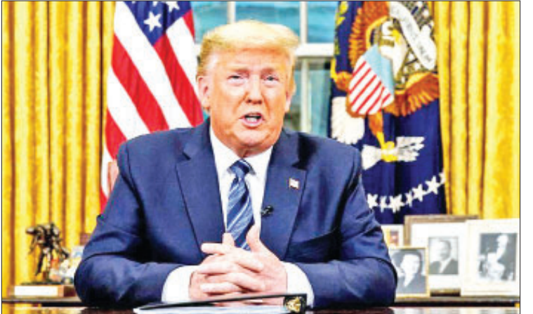
အသေးစားလုပ်ငန်းများသို့ အတိုးနှုန်း တောင့်တင်းစေရန်နှင့် ကိုရိုနာဗိုင်းရပ်စ် ဖြစ်ပွားမှုကို လျှော့ချရန်အတွက် အစီအစဉ်တစ်ခုအတွက် ရန်ပုံငွေကို ဒေါ်လာဘီလီယံ ၅၀ အထိ တိုးမြှင့်ပေးရန် ကွန်ဂရက်သို့ တောင်းခံနေကြောင်း ၎င်းကဆိုသည်။ သမ္မတ ဒေါ်နယ်ထရမ်က ငွေကြေးဈေးကွက် ခိုင်မာ

ဝါရှင်တန် မတ် ၁၂ ကိုရိုနာဗိုင်းရပ်စ် ကူးစက်ရောဂါတိုက်ဖျက်ရေး ကြိုးပမ်းမှုတစ်ရပ်အဖြစ် ဗြိတိန်အပါအဝင် ဥရောပတိုက်မှ အမေရိကန်နိုင်ငံသို့ ခရီးသွားလာမှု အားလုံးကို ရက် ၃၀ ကြာ ဆိုင်းငံ့လိုက်ကြောင်း အမေရိကန်သမ္မတ ဒေါ်နယ်ထရမ်က ပြောကြားသည်။ မတ် ၁၃ ရက် ညပိုင်းမှစ၍ စည်းမျဉ်းများ အသက်ဝင်လာမည်ဟု ယမန်နေ့က ဘဲဂျပ်ခန်းမတွင်ပြောကြားသည့် ရုပ်သိမ်းခွင့်တစ်ခုအတွင်း သမ္မတ ဒေါ်နယ်ထရမ်က ဆိုသည်။ တရုတ်နိုင်ငံသို့ ခရီးသွားလာခွင့် ကန့်သတ်ချက်များပြုလုပ်ခြင်းအပါအဝင် ကိုရိုနာဗိုင်းရပ်စ်ပိုးကူးစက်ရောဂါ စတင်ဖြစ်ပွားသည့် အချိန်မှစ၍ အမေရိကန်အစိုးရက ထိရောက်သောဆောင်ရွက်ချက်များ လုပ်ဆောင်နေကြောင်း ၎င်းက ပြောသည်။ ကိုရိုနာဗိုင်းရပ်စ်ပိုးကူးစက်ရောဂါဒဏ်ခံခဲ့ရသည့် ကုမ္ပဏီများအတွက် အပိုထောက်ပံ့မှု ပြုလုပ်ပေးမည်ဟုလည်း ဒေါ်နယ်ထရမ်က ပြောသည်။