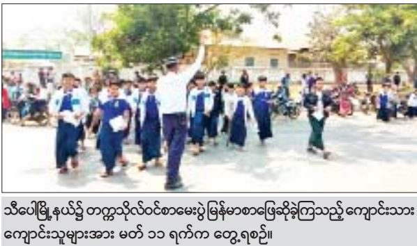
သီပေါမြို့နယ်၌ တက္ကသိုလ်ဝင်စာမေးပွဲ မြန်မာစာဖြေဆိုခဲ့ကြသည့် ကျောင်းသား ကျောင်းသူများအား မတ် ၁၁ ရက်က တွေ့ရစဉ်။