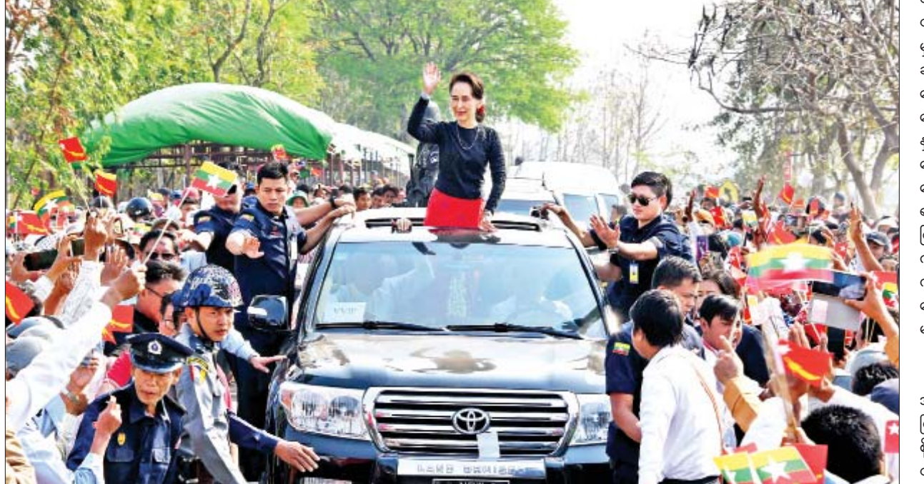
နိုင်ငံတော်၏အတိုင်ပင်ခံပုဂ္ဂိုလ် ဒေါ်အောင်ဆန်းစုကြည်အား ဒီပဲယင်းမြို့နှင့် မြို့နယ်အတွင်းရှိ ကျေးရွာများမှ ဒေသခံပြည်သူများ၊ ဌာနဆိုင်ရာဝန်ထမ်းများနှင့် ကျောင်းသား ကျောင်းသူလေးများက သောင်းသောင်းဖြဖြ ကြိုဆိုနှုတ်ဆက်ကြစဉ်။

တော့ အခွင့်အရေး ရပါတယ်။ ကိုယ်တစ်ယောက်တည်းကနေပြီး တော့ ၁၀ မိနစ်ပြောမယ်ဆိုရင် တခြားသူတွေ နှစ်မိနစ် သုံးမိနစ်နဲ့ ပြောရမယ့်လူ ငါးယောက်လောက်က အခွင့်အရေးက လွတ်သွားပါလိမ့်မယ်။ အဲဒီလိုစဉ်းစားဖို့ လိုပါတယ်။ ကျွန်မတို့ ဒီမိုကရေစီနိုင်ငံတစ်နိုင်ငံ ထူထောင်မယ်ဆိုရင် ငါ့အရေးနဲ့အတူ အခြားအရေးကိုလည်း စဉ်းစားရမယ်။ ကိုယ့်အရေးတစ်ခုတည်း စဉ်းစားလို့ မရဘူး။ အခြားအရေးကိုလည်း စဉ်းစား ရမယ်။ အခြားပုဂ္ဂိုလ်များရဲ့ အရေးကို လည်း စဉ်းစားရမယ်။ သူတို့ရဲ့ လိုအပ် ချက်တွေကိုလည်း ကျွန်မတို့ကနေပြီး တော့ တန်ဖိုးထားရမယ်။ နှလုံးသွင်း ရမှာ ဖြစ်ပါတယ်။