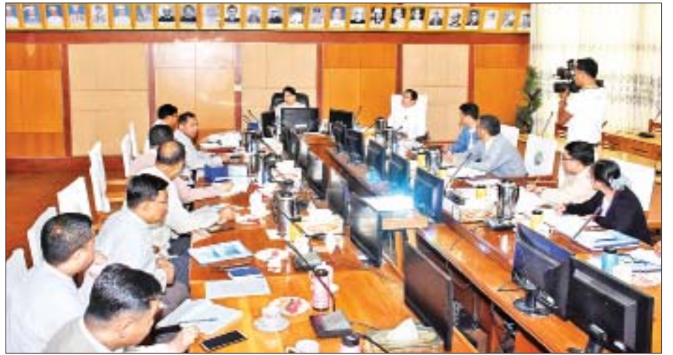
စပ်လျဉ်းသည့် သိချင်းများ၊ ပညာပေးအစီအစဉ်များ၊ ဆောင်ရွက်နိုင်ရေး ပြင်ဆင်ရန်တို့နှင့်စပ်လျဉ်း၍ ဆွေးနွေးအင်တာဗျူးများကို စိတ်ဝင်စားဖွယ်ဖြစ်အောင် ဆောင်ရွက်သွားရန်နှင့် ယင်းတို့အား စောနိုင်သမျှ ဆောလျင်စွာ သတင်းစဉ်

ယင်းနောက် ပြည်ထောင်စုဝန်ကြီး ဒေါက်တာဖေမြင့်က ပြည်ထောင်စုရွေးကောက်ပွဲကော်မရှင်က ချမှတ်ထားသော မီဒီယာနှင့်သက်ဆိုင်သည့် လမ်းညွှန်ချက်များကို လိုက်နာနိုင်ရေး စုစည်းပြုစုထားရန်၊ ရွေးကောက်ပွဲနှင့်