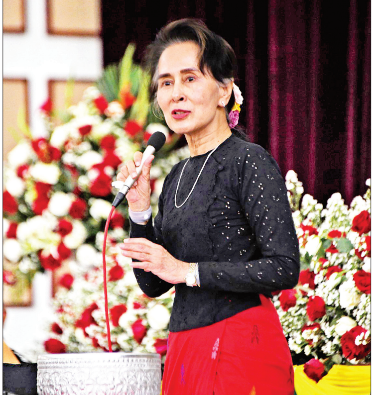
နိုင်ငံတော်၏အတိုင်ပင်ခံပုဂ္ဂိုလ် ဒေါ်အောင်ဆန်းစုကြည် ရွှေဘိုမြို့ ဒေသခံပြည်သူများနှင့်တွေ့ဆုံပွဲတွင် အမှာစကားပြောကြားစဉ်။

နှင့် ဌာနဆိုင်ရာတာဝန်ရှိသူများက မုံရွာ လေဆိပ်၌ ကြိုဆိုနှုတ်ဆက်ကြသည်။ ကြိုဆိုနှုတ်ဆက် ထိုမှတစ်ဆင့် နိုင်ငံတော်၏အတိုင်ပင်ခံ ပုဂ္ဂိုလ်သည် အဖွဲ့ဝင်များနှင့်အတူ ရဟတ် ယာဉ်များဖြင့် ဒီပဲယင်းမြို့သို့ရောက်ရှိရာ ဒီပဲယင်းမြို့နှင့် မြို့နယ်အတွင်းရှိ ကျေးရွာများ မှ ဒေသခံပြည်သူများ၊ ဌာနဆိုင်ရာဝန်ထမ်းများ နှင့် ကျောင်းသား ကျောင်းသူလေးများက နိုင်ငံတော်အလင်္ဂယများကို ဝှေ့ယမ်း၍ သောင်းသောင်းဖြဖြ ကြိုဆိုနှုတ်ဆက်ကြသည်။ ထို့နောက် နိုင်ငံတော်၏အတိုင်ပင်ခံပုဂ္ဂိုလ် သည် ဒီပဲယင်းမြို့ရှိ မြို့နယ်အားကစားကွင်း၌ ဒေသခံပြည်သူများနှင့် တွေ့ဆုံသည်။ တွေ့ဆုံပွဲသို့ ပြည်ထောင်စုဝန်ကြီးများဖြစ် ကြသည့် ဦးမင်းသူ၊ ဒုတိယဗိုလ်ချုပ်ကြီး စိုးထွဋ်၊ စာမျက်နှာ ၃ ကော်လံ ၁ သို့ ၂