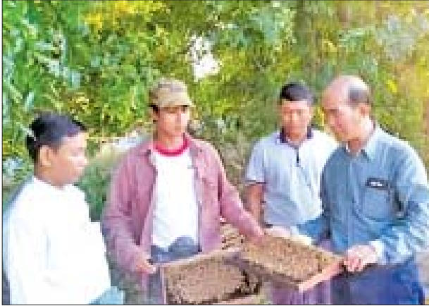
ဝင်ငွေရရှိသည့်အပြင် ပျားမွေးမြူရေးလုပ်ငန်းမှလည်း မိသားစုတစ်ဝိုင်းတစ်နိုင် ကိုယ်ပိုင်စီးပွားရေးလုပ်ငန်းအဖြစ် လုပ်ကိုင်ကြကာ ဝင်ငွေအခွင့်အလမ်းများ တစ်ဖက်တစ်လမ်းမှ ရရှိနေသည်ဟု သိရသည်။

တိုင်းဒေသကြီးအစိုးရအဖွဲ့က ပံ့ပိုးခြင်း၊ ပျားမွေးမြူရေးဌာနမှ ဝန်ဆောင်မှု ပေးခြင်း၊ နည်းပညာသင်တန်းပို့ချပေးခြင်းတို့ကြောင့် မကွေးတိုင်းဒေသကြီး ပုဂ္ဂလိကပျားမွေးမြူရေးအနေဖြင့် မြေပဲနှင့် နှမ်းစိုက်ပျိုးရေးလုပ်ငန်းမှ အဓိက