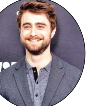
အေးပြည့် - စုစည်းသည်

ဟယ်ရီပိုတာ ဇာတ်လမ်းတွဲတွေနဲ့ ပရိသတ်အသိအမှတ်ပြုမှုရရှိလာတဲ့ မင်းသား ဒန်နီရယ်ရက်ကလစ်စ်ဟာ ကိုရိုနာဗိုင်းရပ်စ်ကူးစက်ခံထားရကြောင်း သတင်းတွေပေါ်ထွက်လာရာမှာ မင်းသားဘက်က လတ်တလော မှာ ကူးစက်ခံရခြင်းမရှိကြောင်း ထုတ်ဖော်ပြောကြားခဲ့တာကြောင့် ကောလဟာလတွေလည်း အဆုံးသတ် ခဲ့ကြောင်း အီးအွန်လိုင်းဒေါ့ကွန်းရဲ့ ရေးသားဖော်ပြချက်တွေအရ သိရပါတယ်။