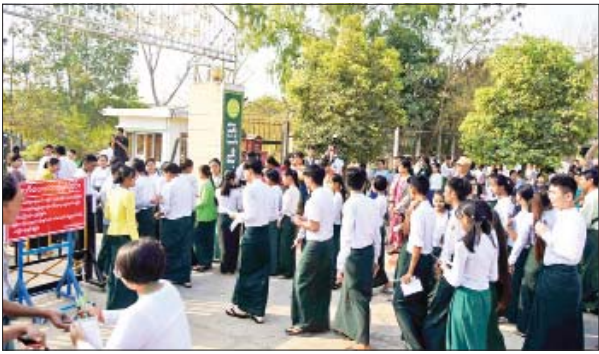
နေပြည်တော် ဇေယျသီရိမြို့နယ် အထက(၆) အခြေခံပညာအထက်တန်းကျောင်း၌ တက္ကသိုလ်ဝင်စာမေးပွဲ မြန်မာစာဖြေဆိုမည့် ကျောင်းသား ကျောင်းသူများကို မတ် ၁၁ ရက်က တွေ့ရစဉ်။