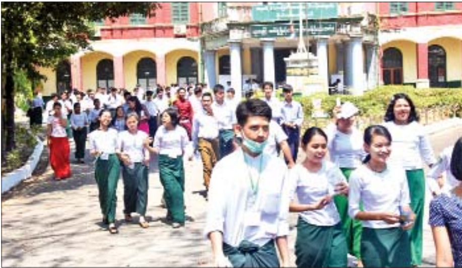
ရန်ကုန်တိုင်းဒေသကြီး ဗိုလ်တထောင်မြို့နယ် အထက(၆)၌ ကျောင်းသား ကျောင်းသူများ တက္ကသိုလ်ဝင်စာမေးပွဲ မြန်မာစာဖြေဆိုအပြီး မတ် ၁၁ ရက်က တွေ့ရစဉ်။