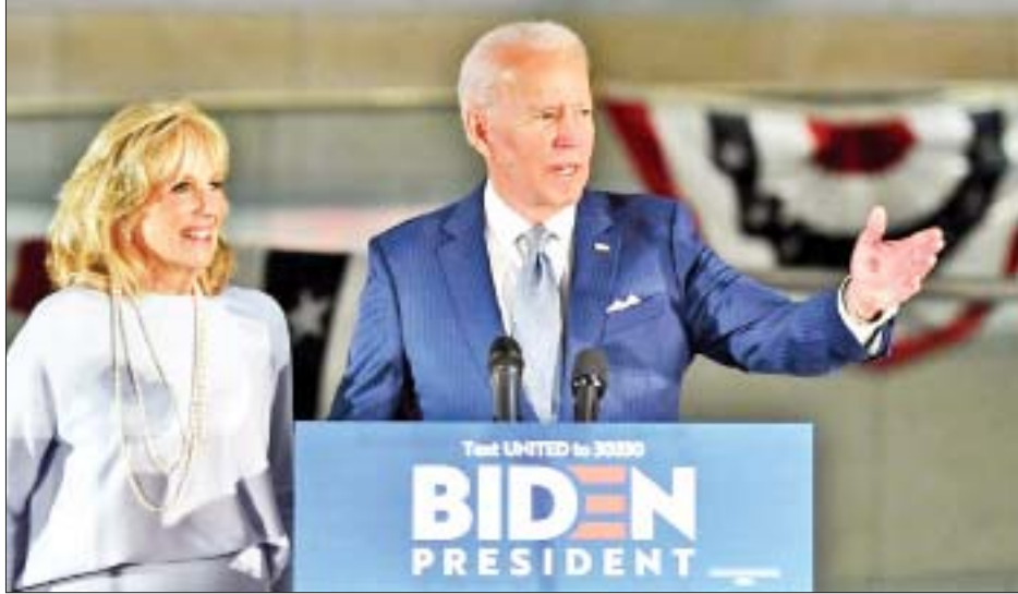
အမေရိကန်ဒုတိယသမ္မတဟောင်း ဂျိုးဘိုင်ဒင်နှင့်ဇနီး ဂျိုး

ဝါရှင်တန် မတ် ၁၁ အမေရိကန်ဒုတိယသမ္မတဟောင်း ဂျိုးဘိုင်ဒင်သည် အကြံရွေးကောက်ပွဲတွင် အဓိကပြိုင်ဘက် ဘာနီဆန်းဒါးကို အနိုင်ရခဲ့ပြီးနောက် နိုဝင်ဘာလတွင် ကျင်းပမည့် ရွေးကောက်ပွဲတွင် လက်ရှိသမ္မတ ဒေါ်နယ်ထရမ်ကို ယှဉ်ပြိုင်ရမည်ဖြစ်သည်။