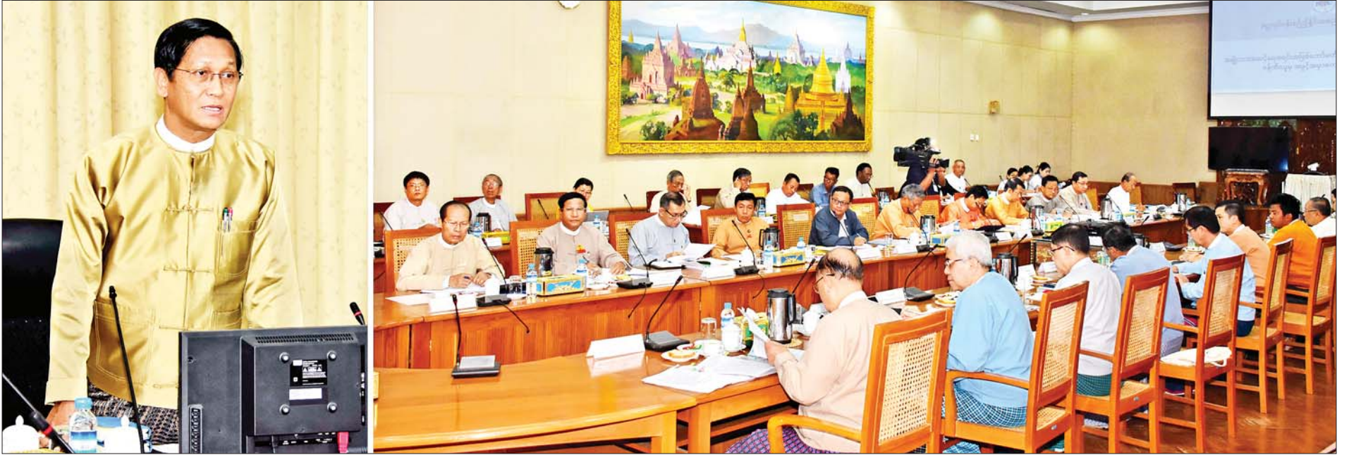
ဒုတိယသမ္မတ ဦးဟင်နရီဗန်ထီးယူ အမျိုးသားအဆင့် ရေအရင်းအမြစ်ကော်မတီ၏ ရှေ့လုပ်ငန်းစဉ် ညှိနှိုင်းအစည်းအဝေးတွင် အမှာစကားပြောကြားစဉ်။