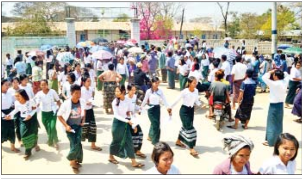
ငါးသရောက်မြို့ အခြေခံပညာအထက်တန်းကျောင်း၌ တက္ကသိုလ်ဝင်စာမေးပွဲ ဖြေဆိုမည့် ကျောင်းသား ကျောင်းသူများ မြန်မာစာဖြေဆိုအပြီး မတ် ၁၁ ရက်က တွေ့ရစဉ်။