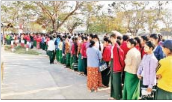
ဗန်းမောက်မြို့နယ် အခြေခံပညာအထက်တန်းကျောင်း၌ တက္ကသိုလ်ဝင် စာမေးပွဲ မြန်မာစာဖြေဆိုမည့် ကျောင်းသား ကျောင်းသူများကို မတ် ၁၁ ရက်က တွေ့ရစဉ်။