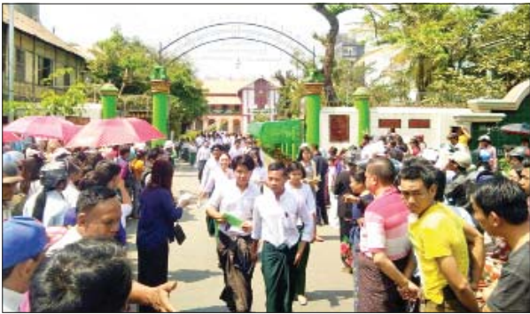
မန္တလေးမြို့ အမှတ်(၈) အခြေခံပညာအထက်တန်းကျောင်း၌ ကျောင်းသား ကျောင်းသူများ တက္ကသိုလ်ဝင်စာမေးပွဲ မြန်မာစာဖြေဆိုအပြီး မတ် ၁၁ ရက်က တွေ့ရစဉ်။