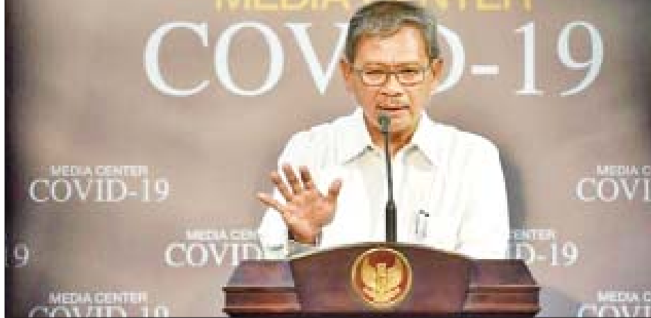
အင်ဒိုနီးရှားအစိုးရ၏ ပြောရေးဆိုခွင့်ရှိသူ အာမ်မက်ယူရီယံတို

ကိုးကား - ဆင်ပဟွာ ဘာသာပြန် - ကျော်ထိုက်စိုး