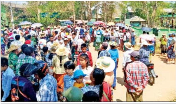
ညောင်လေးပင်မြို့ အမှတ်(၁) အခြေခံပညာအထက်တန်းကျောင်း၌ မတ် ၁၁ ရက်က တက္ကသိုလ်ဝင်စာမေးပွဲ မြန်မာစာဘာသာရပ် ဖြေဆိုလာကြသည့် ကျောင်းသား ကျောင်းသူများအား မိဘဆွေမျိုးများက စောင့်ဆိုင်းကြိုဆိုနေကြစဉ်။