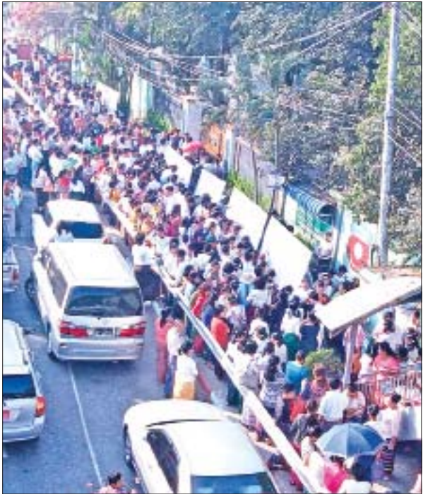
အောင်ဆန်းသူရိယလှသောင်းကျောင်း၊ အထက(၂)မင်္ဂလာဒုံ၌ တက္ကသိုလ်ဝင် စာမေးပွဲ မြန်မာစာဘာသာရပ်ဖြေဆိုကြမည့် ကျောင်းသား ကျောင်းသူများ အား မိသားစုဝင်များနှင့်အတူ မတ် ၁၁ ရက်က တွေ့ရစဉ်။