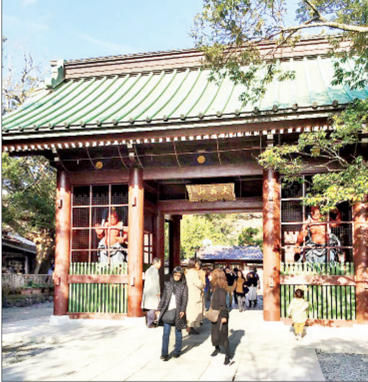
ခိုတိုးအင်းဘုရားကျောင်း။

ကာမာကူရဘုရားဟာ အိန္ဒိယနိုင်ငံမှာ ဒုတိယအကြီးမားဆုံး ထိုင်တော်မူ ကြေးမုံဒီဇိုင်းပွား တော်စာရေးဝင်းဝင်ပါသည်။