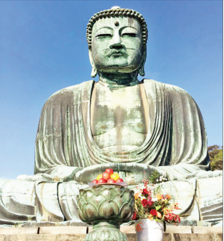
ကာမာကူရဘုရား။

ကာမာကူရဘုရား (Kamakura Pagoda) ကာမာကူရဘုရားသည် ကာမာကူရဂူရံ (၁၉၅၂-၁၉၅၅) ကာမာကူရဘုရားကို အိန္ဒိယနိုင်ငံအဖွဲ့တွေက ခုတ်ယူခဲ့တာကို သိရတော့ မိနပ်ဖို့ခဲသံရတော့မှ ရှိပါတယ်။