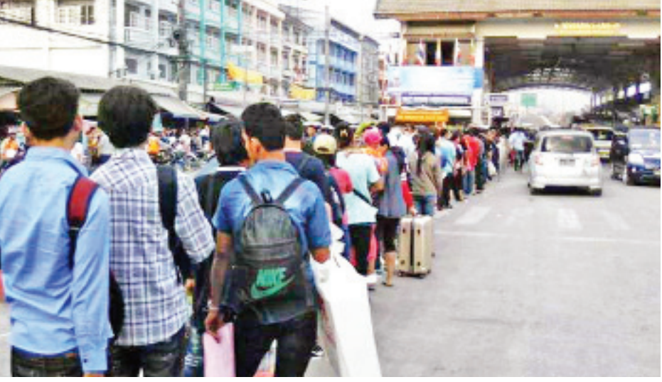
နေရပ်ပြန်ကြမည့် မြန်မာအလုပ်သမားများအား ထိုင်း- မြန်မာနယ်စပ် မဲဆောက်မြို့ဘက်ခြမ်း၌ တွေ့ရစဉ်။

ဘန်ကောက် မတ် ၉ ကိုရိုနာဗိုင်းရပ်စ်ရောဂါကူးစက်မှုနှုန်း ပိုမိုမြင့်တက်မှုကြောင့် မြန်မာနိုင်ငံသို့ပြန်၍ ထိုင်းနိုင်ငံသို့ MoU စနစ်ဖြင့် ပြန်လည်ဝင်ရောက်မည့် မြန်မာအလုပ်သမားများအား ထိုင်းနိုင်ငံဘက်ခြမ်း နယ်စပ်မြို့များ၌ရှိသည့် ကိုရိုနာဗိုင်းရပ်စ် စောင့်ကြည့်ရေးဌာနများက ရောဂါပိုးလက္ခဏာ ရှိ၊ မရှိ ၁၄ ရက်ကြာစောင့်ကြည့်မည်ဖြစ်ကြောင်း သတင်းများထွက်ပေါ်လျက်ရှိသောကြောင့် မြန်မာအလုပ်သမားများနှင့် ထိုင်းအလုပ်ရှင်များအနေဖြင့် စိုးရိမ်ပူပန်မှုများရှိနေကြောင်း ထိုင်းနိုင်ငံရောက် မြန်မာအလုပ်သမားများထံမှ သိရသည်။