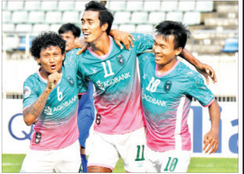
AFC Cup ပြိုင်ပွဲ ယှဉ်ပြိုင်နေသည့် ရန်ကုန်အသင်းအား တွေ့ရစဉ်။