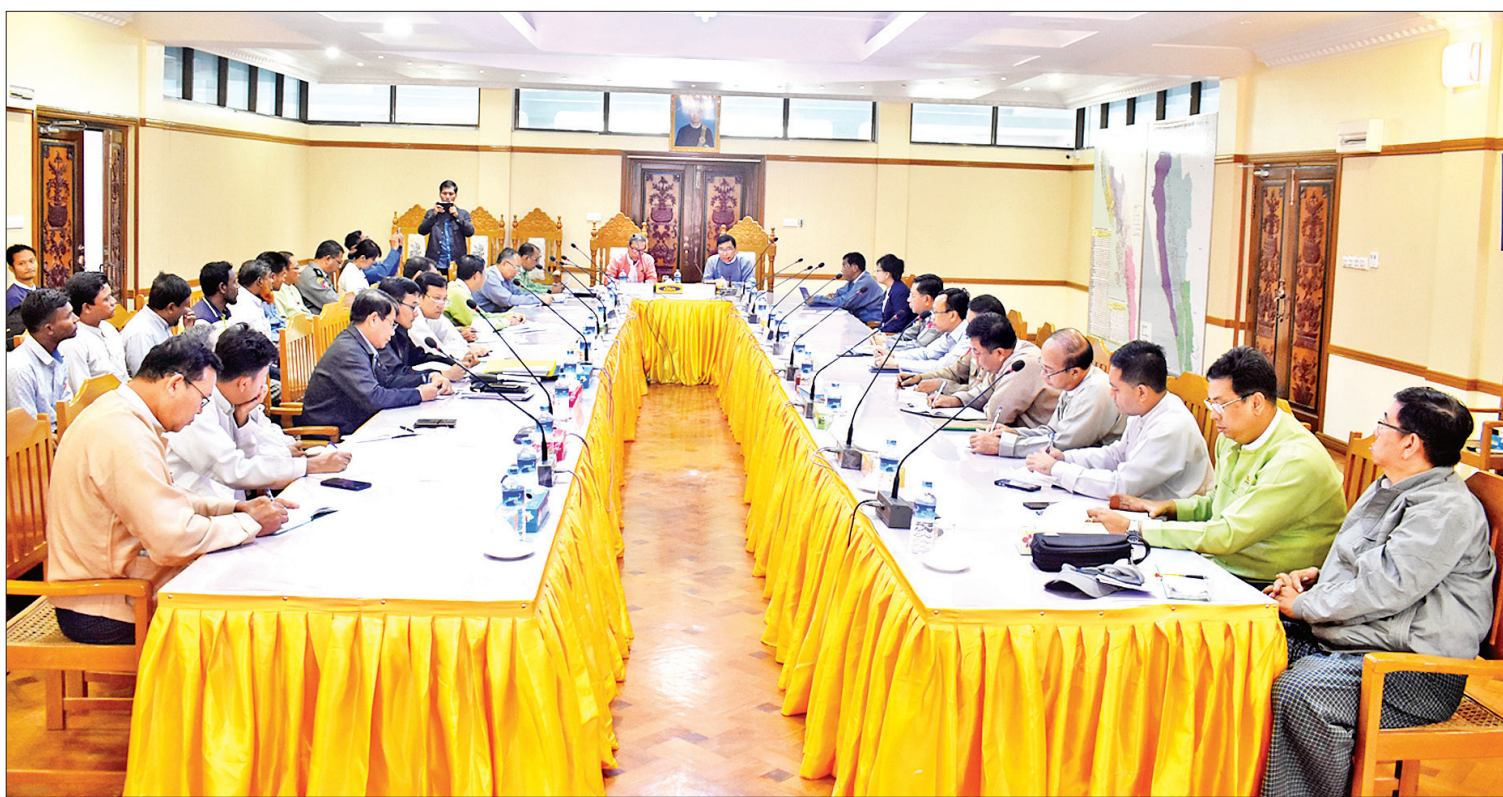
လွတ်လပ်သော စုံစမ်းစစ်ဆေးရေးကော်မရှင်၏ ရခိုင်ပြည်နယ်ဆိုင်ရာ အစီရင်ခံစာအရ အရှိန်အဟုန်ဖြင့် မြန်ဆန်စွာဆောင်ရွက်သင့်သည့် လုပ်ငန်းများ ညှိနှိုင်းအစည်းအဝေး ကျင်းပစဉ်။

စစ်တွေ မတ် ၉ ရခိုင်ပြည်နယ်ဆိုင်ရာ ဆောင်ရွက်ချက်များတွင် လွတ်လပ်သော စုံစမ်းစစ်ဆေးရေးကော်မရှင် (Independent Commission of Enquiry - ICOE)၏ အကြံပြုချက်များမှ အရှိန် အဟုန်ဖြင့် မြန်ဆန်စွာဆောင်ရွက်သင့်သည့် လုပ်ငန်းများနှင့်ပတ်သက်၍ လက်ရှိ ဆောင်ရွက်ချက်များကို ပြန်လည်သုံးသပ်ခြင်း၊ ရှေ့ဆက်ဆောင်ရွက်မည့် လုပ်ငန်းများကို ညှိနှိုင်းဆောင်ရွက်ခြင်းနှင့် တစ်ဖက်နိုင်ငံသို့ တိမ်းရှောင်ထွက်ပြေးခြင်းမပြုသည့် နေရပ် စွန့်ခွာသူများနေထိုင်ရာ ကျေးရွာများထဲမှ ကျေးရွာ ခုနစ်ရွာကို ပြန်လည်နေရာချထားရေး ဆောင်ရွက်နေမှုများနှင့်စပ်လျဉ်း၍ ကျေးရွာ နေသူများ၏ ကိုယ်စားလှယ်များနှင့် တွေ့ဆုံ ဆွေးနွေးခြင်းကို ယနေ့နံနက်ပိုင်းတွင် ရခိုင် ပြည်နယ် စစ်တွေမြို့၊ ပြည်နယ်ဧည့်ဂေဟာရှိ အစည်းအဝေးခန်းမ၌ ကျင်းပသည်။