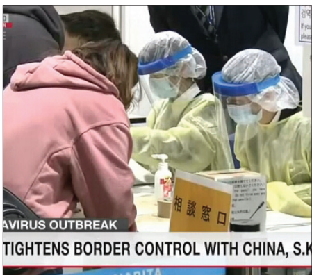
AVIRUS OUTBREAK TIGHTENS BORDER CONTROL WITH CHINA, S.K