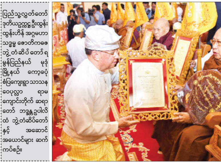
ပြည်သူ့လွှတ်တော် ဒုတိယဥက္ကဋ္ဌ ဦးထွန်းထွန်းဟိန် အဂ္ဂမဟာသဒ္ဓမ္မဇောတိကစေ ဘွဲ့တံဆိပ်တော်ရ မွန်ပြည်နယ် မုဒုံမြို့နယ် ကော့ခင်စံပြကျေးရွာသာသနာဓဇပုလ္လာ ရာမကျောင်းတိုက် ဆရာတော် ဘဒ္ဒန္တဥပါလိထံ ဘွဲ့တံဆိပ်တော်နှင့် အဆောင်အယောင်များ ဆက်ကပ်စဉ်။

ဆက်ကပ်ပူဇော် ယင်းနောက် ပြည်ထောင်စုရွေးကောက်ပွဲကော်မရှင်ဥက္ကဋ္ဌ ဦးလှသိန်း၊ ဒုတိယတပ်မတော် ကာကွယ်ရေးဦးစီးချုပ် ကာကွယ်ရေးဦးစီးချုပ်(ကြည်း) ဒုတိယဗိုလ်ချုပ်မှူးကြီးစိုးဝင်းနှင့် ပြည်သူ့လွှတ်တော် ဒုတိယဥက္ကဋ္ဌ ဦးထွန်းထွန်းဟိန်တို့က အဂ္ဂမဟာပဏ္ဍိတနှင့် အဂ္ဂမဟာသဒ္ဓမ္မဇောတိကစေ ဘွဲ့တံဆိပ်တော်ရ ဆရာတော်များထံ ဘွဲ့တံဆိပ်တော်နှင့် အဆောင်အယောင်များ ဆက်ကပ်ပူဇော်ကြသည်။ ဆက်လက်၍ ပြည်ထောင်စုဝန်ကြီးများ၊ ပြည်ထောင်စုရှေ့နေချုပ်၊ ပြည်ထောင်စု စာရင်းစစ်ချုပ်၊ ပြည်ထောင်စုရာထူးဝန်အဖွဲ့ ဥက္ကဋ္ဌ၊ နေပြည်တော်ကောင်စီဥက္ကဋ္ဌ၊ မြန်မာနိုင်ငံတော်ဗဟိုဘဏ်ဥက္ကဋ္ဌ၊ ညှိနှိုင်းကွပ်ကဲရေးမှူး (ကြည်း၊ ရေ၊ လေ)၊ နေပြည်တော်တိုင်းစစ်ဌာနချုပ်တိုင်းမှူး၊ ဒုတိယဝန်ကြီးများ၊ နေပြည်တော်ကောင်စီဝင်များ၊ အမြဲတမ်းအတွင်းဝန်များနှင့် ညွှန်ကြားရေးမှူးချုပ်များက အဂ္ဂမဟာပဏ္ဍိတ၊ အဂ္ဂမဟာသဒ္ဓမ္မဇောတိကစေ၊ အဂ္ဂမဟာ ကမ္မဋ္ဌာနာစရိယ၊ အဂ္ဂမဟာဂန္ထဝါစက ပဏ္ဍိတ၊ မဟာဓမ္မကထိကဗဟုဇနဟိတစရ၊ မဟာဂန္ထဝါစက ပဏ္ဍိတ၊ မဟာသဒ္ဓမ္မဇောတိကစေ၊ မဟာကမ္မဋ္ဌာနာစရိယ၊ ဓမ္မကထိကဗဟုဇနဟိတစရ၊ ဂန္ထဝါစက ပဏ္ဍိတ၊ သဒ္ဓမ္မဇောတိကစေ၊ ကမ္မဋ္ဌာနာစရိယ ဘွဲ့တံဆိပ်တော်ရ ဆရာတော်များအား ဘွဲ့တံဆိပ်တော်နှင့် အဆောင်အယောင်များ ဆက်ကပ်ပူဇော်ကြသည်။ ထို့နောက် နိုင်ငံတော်သမ္မတ