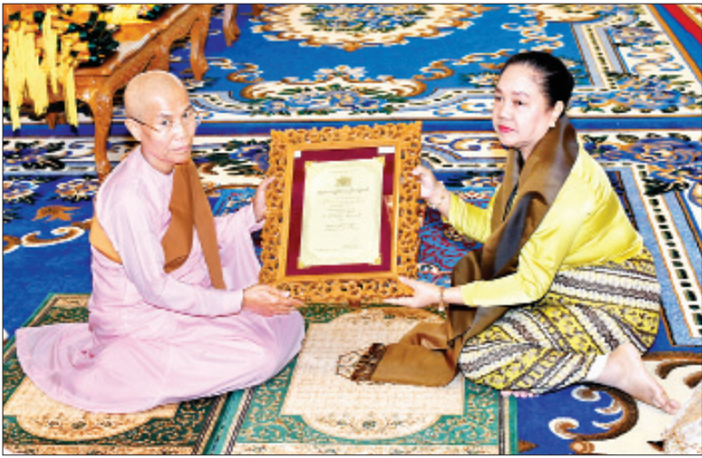
နိုင်ငံတော်သမ္မတ ဦးဝင်းမြင့်၏ ဇနီး ဒေါ်ချိုချို အဂ္ဂမဟာ ဂန္ထဝါစက ပဏ္ဍိတ ဘွဲ့တံဆိပ်တော်ရ သီလရှင် ဆရာကြီး ဒေါ်ကေတုဝတီထံ ဘွဲ့တံဆိပ်တော် ဆက်ကပ်စဉ်။