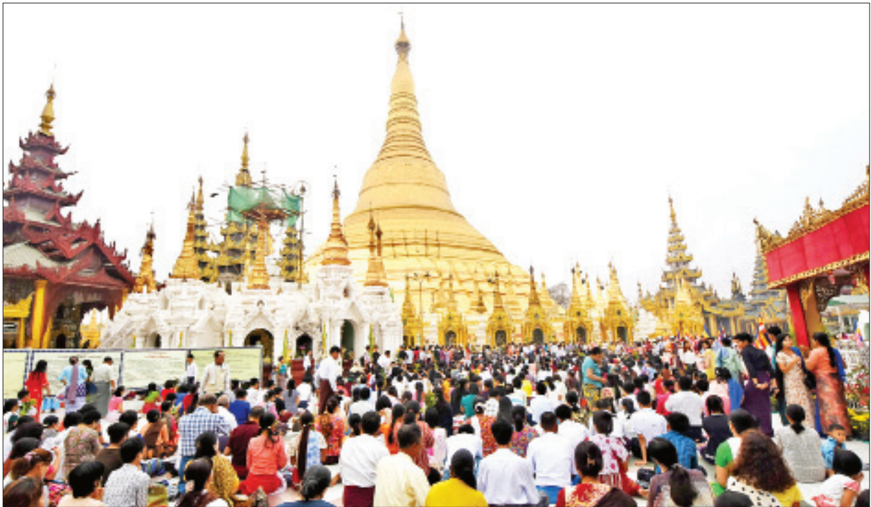
ရန်ကုန်မြို့ ရွှေတိဂုံစေတီတော်၌ ဘုရားဖူးပြည်သူများဖြင့် စည်ကားလျက်ရှိစဉ်။