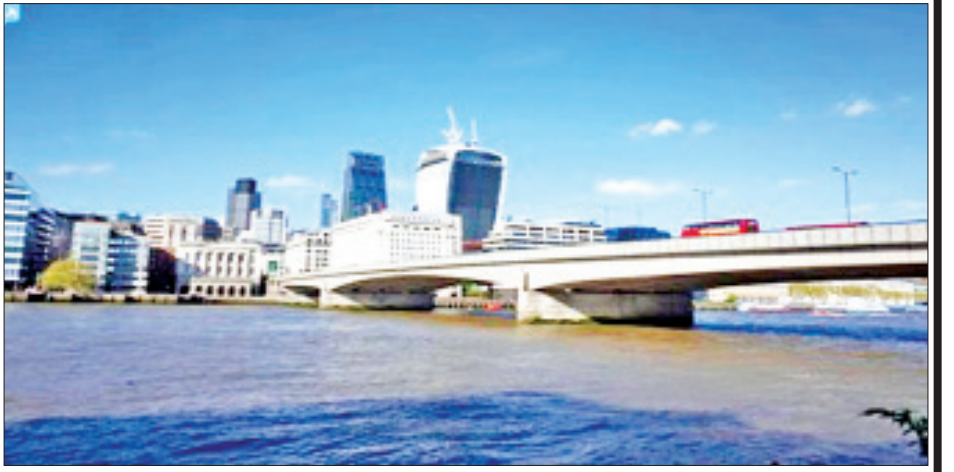
လန်ဒန်တံတား။

ဗြိတိန်နိုင်ငံ လန်ဒန်မြို့ရှိ မျှော်စင်တံတားသည် သိမ်းမြစ်ကိုဖြတ်၍ တည်ဆောက်ထားပြီး လန်ဒန်မြို့၏ အထင်ကရသင်္ကေတတစ်ခုလည်း ဖြစ်သည်။ မျှော်စင်တံတားကို ၁၈၈၆ ခုနှစ်နှင့် ၁၈၉၄ ခုနှစ်အကြား တည်ဆောက်ထားခဲ့ခြင်းဖြစ်သည်။ တံတားအရှည်မှာ ၈၀၁ ပေ (၂၄၄မီတာ)ဖြစ်ပြီး အကျယ်မှာ ပေ ၂၇၀ (၈၂ဒဿမ ၃ မီတာ) ရှိ၍ အမြင့်မှာ ၂၁၃ ပေ (၆၅ မီတာ) ရှိသည်။ တံတားအမျိုးအစားမှာ ခေါက်တံတား နှစ်ပိုင်းခြမ်း၍ ရသော တံတားအမျိုးအစား ဖြစ်သည်။ ယင်းသို့ ခေါက်၍ အတင်၊ အချပြလုပ်နိုင်ရန်အတွက် လောင်စာဆီနှင့်