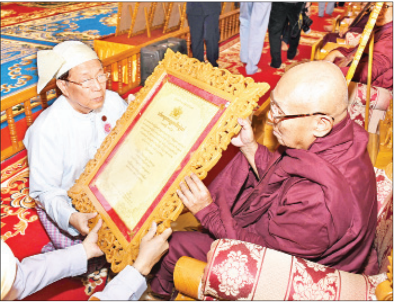
နိုင်ငံတော်ဖွဲ့စည်းပုံအခြေခံဥပဒေဆိုင်ရာ ခုံရုံးဥက္ကဋ္ဌ ဦးမျိုးညွန့် အဘိဓဇအဂ္ဂမဟာ သဒ္ဓမ္မဇောတိက ဘွဲ့တံဆိပ်တော်ရ ရှမ်းပြည်နယ် မိုင်းယောင်းမြို့နယ် ထေရဝါဒဗုဒ္ဓသာသနာပြု ဗဟိုကျောင်းဆရာတော် ဘဒ္ဒန္တဘဒ္ဒိယထံ ဘွဲ့တံဆိပ်တော်နှင့် အဆောင်အယောင်များ ဆက်ကပ်စဉ်။

❖ စာမျက်နှာ ၃ မှ အဘိဓဇအဂ္ဂမဟာ သဒ္ဓမ္မဇောတိက ဘွဲ့တံဆိပ်တော်ရ မန္တလေးတိုင်းဒေသကြီး ညောင်ဦးမြို့ ရွှေမင်းဝန်ကျောင်းတိုက်ဆရာတော် ဘဒ္ဒန္တဝိမလနှင့် ရခိုင်ပြည်နယ် တောင်ကုတ်မြို့ စေတနာ့အဖွဲ့ရုံးဝန်ထမ်းတို့ကို ဆရာတော် ဘဒ္ဒန္တသုရိယစေတီထံ လည်းကောင်း၊ နိုင်ငံတော်ဖွဲ့စည်းပုံအခြေခံဥပဒေဆိုင်ရာ ခုံရုံးဥက္ကဋ္ဌ ဦးမျိုးညွန့်က အဘိဓဇ အဂ္ဂမဟာ သဒ္ဓမ္မဇောတိက ဘွဲ့တံဆိပ်တော်ရ မန္တလေးတိုင်းဒေသကြီး မြစ်သားမြို့ မင်းကျောင်းပရိယတ္တိစာသင်တိုက် ဆရာတော် ဒေါက်တာဘဒ္ဒန္တဝေဠုရိယနှင့် ရှမ်းပြည်နယ် မိုင်းယောင်းမြို့နယ် ထေရဝါဒဗုဒ္ဓသာသနာပြုဗဟိုကျောင်းဆရာတော် ဘဒ္ဒန္တဘဒ္ဒိယထံ လည်းကောင်း ဘွဲ့တံဆိပ်တော်နှင့် အဆောင်အယောင်များ ဆက်ကပ်ပူဇော်ကြသည်။