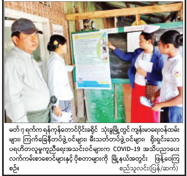
မတ် ၇ ရက်က ရန်ကုန်တောင်ပိုင်းခရိုင် သုံးခွမြို့တွင် ကျန်းမာရေးဝန်ထမ်းများ၊ ကြက်ခြေနီတပ်ဖွဲ့ဝင်များ၊ မီးသတ်တပ်ဖွဲ့ဝင်များ၊ ရိုးရှင်းသော ပရဟိတလူမှုကူညီရေးအသင်းဝင်များက COVID-19 အသိပညာပေးလက်ကမ်းစာစောင်များနှင့် ပုံစံတူများကို မြို့နယ်အတွင်း မြန့်နှံ့ဝေကြစဉ်။

(၄၆/၂) မိုင်မှ (၄၆/၄) မိုင်အတွင်း မြစ်ကမ်းပြိုကျမှုကို ဖြတ်တာတည်ဆောက်မည့်နေရာအား ကြည့်ရှုစစ်ဆေးပြီး ရေဘေးအန္တရာယ် ကျရောက်မှုမှ ကာကွယ်ပေးနိုင်ရေးအတွက် လိုအပ်သည့် တာတမံပြုပြင်မှုများနှင့် ကမ်းပြိုမှုမှ ကာကွယ်နိုင်ရေးအတွက် ဖြတ်တာတည်ဆောက်ရေးလုပ်ငန်းကို မိုးရာသီမတိုင်မီ အပြီးသတ်ဆောင်ရွက်နိုင်ရေးနှင့် ရေရှည်ထိန်းသိမ်းဆောင်ရွက်နိုင်မည့် အစီအစဉ်များကို ဆွေးနွေးမှာကြားသည်။ ဖြတ်တာတည်ဆောက်ရေး မြစ်ရေ တိုက်စားမှုကြောင့် ဟင်္သာတခရိုင်အတွင်း မြစ်ကမ်းပြိုမှု ဖြစ်ပွားသည့်နေရာများ၏ အနောက်ဘက်မှ ဖြတ်တာတည်ဆောက်ရေးလုပ်ငန်းများကို ဆည်မြောင်းနှင့် ရေအသုံးချမှုစီမံခန့်ခွဲရေး ဦးစီးဌာနနှင့် သက်ဆိုင်ရာဝန်ကြီးဌာနများ ပူးပေါင်း၍ မိုးရာသီကာလမတိုင်မီ စီမံဆောင်ရွက်သွားမည်ဖြစ်ကြောင်း သိရသည်။ သတင်းစဉ်