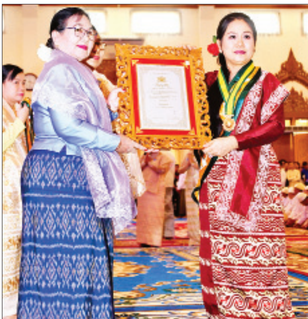
ပြည်သူ့လွှတ်တော် ဒုတိယဥက္ကဋ္ဌ ဦးထွန်းထွန်းဟိန်၏ဇနီး ဒေါက်တာ စိန်စိန်သိမ်း သီရိသုဓမ္မသီရိဘွဲ့တံဆိပ်ရ ဒေါ်ခင်အုန်းအား ဘွဲ့တံဆိပ်နှင့် အဆောင်အယောင်များ ပေးအပ်ချီးမြှင့်စဉ်။