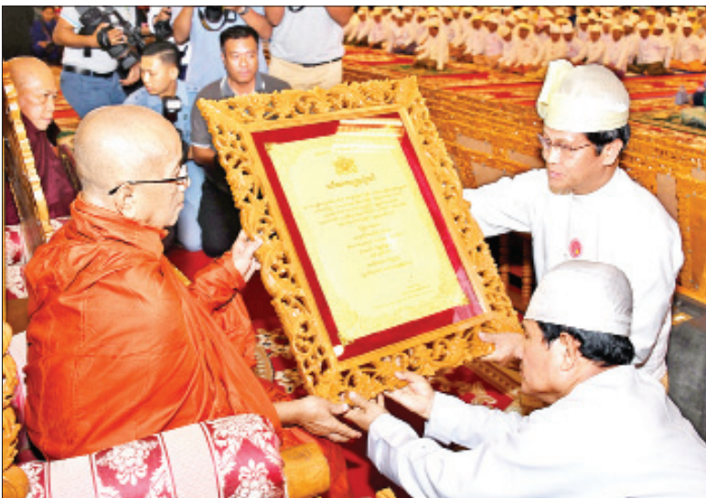
ဒုတိယသမ္မတ ဦးဟင်နရီ ဗန်ထီးယူ အဘိဓမ္မမဟာရဋ္ဌဂုရု ဘွဲ့တံဆိပ်တော်ရ မကွေးတိုင်းဒေသကြီး မကွေးမြို့ သံဃာရာမကျောင်းတိုက် ဆရာတော် ဘဒ္ဒန္တစိန္တာသာရ တံ ဘွဲ့တံဆိပ်တော်နှင့် အဆောင်အယောင်များ ဆက်ကပ်စဉ်။