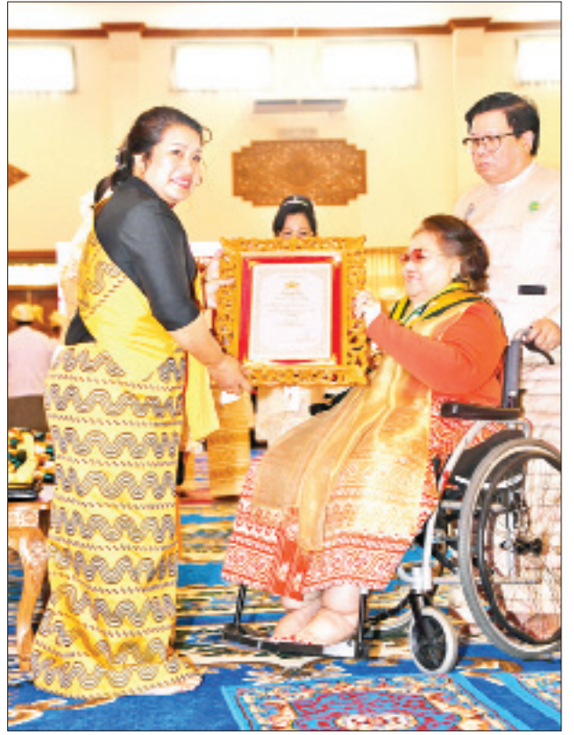
ဒုတိယသမ္မတ ဦးဟင်နရီဗန်ထီးယူ၏ဇနီး ဒေါက်တာရွှေလွမ်း သီရိသုဓမ္မသီရိဘွဲ့တံဆိပ်ရ ဒေါ်ခင်စိုးရီအား ဘွဲ့တံဆိပ်နှင့် အဆောင်အယောင်များ ပေးအပ်ချီးမြှင့်စဉ်။