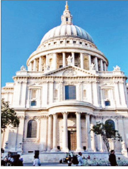
စိန့်ပေါ ဘုရားရှိခိုးကျောင်း။

ဘုရားကျောင်း၌ အသုဘအခမ်းအနားများနှင့် မင်္ဂလာပွဲများလည်း ပြုလုပ်လေ့ရှိရာ အဆိုပါအခမ်းအနား များအနက် ကမ္ဘာကျော် ဗြိတိသျှဝန်ကြီးချုပ်များဖြစ်သည့်