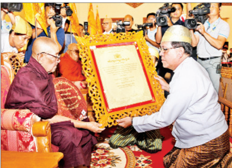
ပြည်ထောင်စုတရားသူကြီးချုပ် ဦးထွန်းထွန်းဦး အဘိဓမ္မအဂ္ဂမဟာသဒ္ဓမ္မဇောတိက ဘွဲ့တံဆိပ်တော်ရ မကွေးတိုင်းဒေသကြီး ပွင့်ဖြူမြို့နယ် ရွာသာကျောင်းတိုက် ဆရာတော် ဘဒ္ဒန္တပညာဝံသတံ ဘွဲ့တံဆိပ်တော်နှင့် အဆောင်အယောင်များ ဆက်ကပ်စဉ်။

* ရှေ့ဖုံးမှ မန္တလေးတိုင်းဒေသကြီး မြင်းခြံမြို့ ချောင်းဒေါင်းစာသင်တိုက် ဆရာတော် ဘဒ္ဒန္တကေလာသတံ ဘွဲ့တံဆိပ်တော်နှင့် အဆောင်အယောင်များ ဆက်ကပ်ပူဇော်သည်။ ယင်းနောက် နိုင်ငံတော်၏ အတိုင်ပင်ခံပုဂ္ဂိုလ် ဒေါ်အောင်ဆန်းစုကြည်က အဘိဓမ္မမဟာရဋ္ဌဂုရု