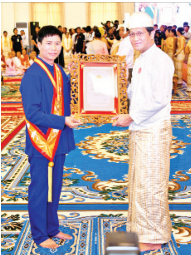
ဒုတိယသမ္မတ ဦးဟင်နရီဗန်ထီးယူ သီရိသုဓမ္မမဏိဇောတဓရ ဘွဲ့တံဆိပ်ရ ဦးမောင်မောင်အား ဘွဲ့တံဆိပ်နှင့် အဆောင်အယောင်များ ပေးအပ်ချီးမြှင့်စဉ်။