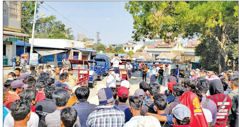
ယာဉ်များ၊ သုံးဘီးယာဉ်များ၊ မြန်မာအလုပ်သမား နေကြပြီဖြစ်ကြောင်း သိရသည်။ များနှင့် ပြည်သူလူထုများ ပုံမှန်ဝင်/ထွက်သွားလာ ဆလှိုင်းမန်ရိုးထန်(ပြန်/ဆက်)

မူဆယ် မတ် ၈ ရှမ်းပြည်နယ်(မြောက်ပိုင်း) မူဆယ်မြို့ နယ်စပ် ဂိတ်များမှ တရုတ်နိုင်ငံ ရွှေလီ-ကျယ်ဂေါင်ဘက်သို့ ကုန်ပစ္စည်းများ နေ့စဉ်သယ်ဆောင်ပြီး အဝင်/ အထွက် သွားလာနေသည့် သုံးဘီးယာဉ်မောင်းများ အား မတ် ၇ ရက် နံနက် ၁၀ နာရီက ကိုရိုနာဗိုင်းရပ်စ် ကူးစက်ခြင်းမှ ကြိုတင်ကာကွယ်ရန်အတွက် နှာခေါင်း စည်းများ အခမဲ့ဖြန့်ဝေခြင်းကို နှစ်နိုင်ငံ အဝင်/ အထွက်ဂိတ် (မန်ပိန်းဂိတ်)အနီး၌ ဆောင်ရွက် သည်။