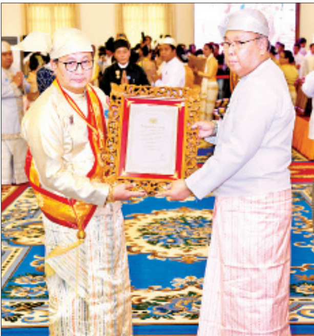
အမျိုးသားလွှတ်တော်ဥက္ကဋ္ဌ မန်းဝင်းခိုင်သန်း သီဟသုဓမ္မမဏိဇောတ ဓရ ဘွဲ့တံဆိပ်ရ ဦးမောင်မောင်ရင်အား ဘွဲ့တံဆိပ်နှင့် အဆောင်အယောင်များ ပေးအပ်ချီးမြှင့်စဉ်။