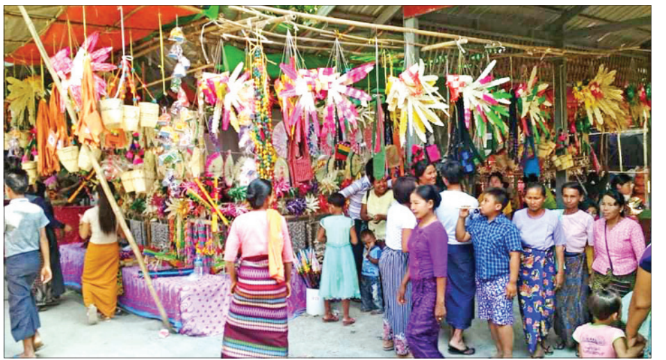
ထွက်ကုန်ပစ္စည်းများကို ရောင်းချ သည့် ပွဲတော်ဈေးတန်း၌ ဒေသထွက် ကုန်များကို ဝယ်ယူကြသည်။

ဗုဒ္ဓပူဇော်ယဉ်တော် အပြီးတွင် ဘုရားဂေါပကအဖွဲ့နှင့် စေတနာရှင်၊ အလှူရှင် ပြည်သူများ စုပေါင်း၍