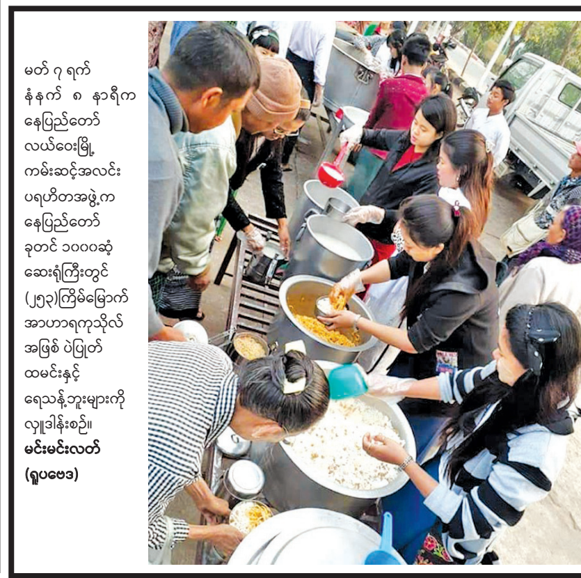
မတ် ၇ ရက် နံနက် ၈ နာရီက နေပြည်တော် လယ်ဝေးမြို့ ကမ်းဆင့်အလင်း ပရဟိတအဖွဲ့က နေပြည်တော် ခုတင် ၁၀၀၀ဆုံ ဆေးရုံကြီးတွင် (၂၅၃)ကြိမ်မြောက် အာဟာရကုသိုလ် အဖြစ် ပဲပြိတ် ထမင်းနှင့် ရေသန့်ဘူးများကို လှူဒါန်းစဉ်။