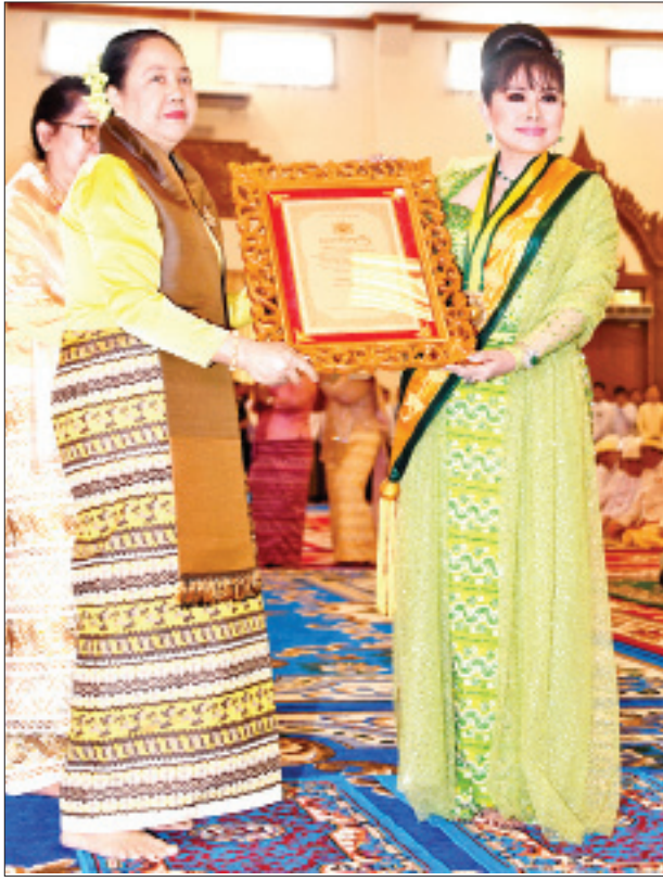
နိုင်ငံတော်သမ္မတ၏ဇနီးဒေါ်ချိုချို အဂ္ဂမဟာသီရိသုဓမ္မသီရိဘွဲ့တံဆိပ်ရ ဒေါ်လယ်လယ်အောင်အား ဘွဲ့တံဆိပ်နှင့် အဆောင်အယောင်များ ပေးအပ်ချီးမြှင့်စဉ်။