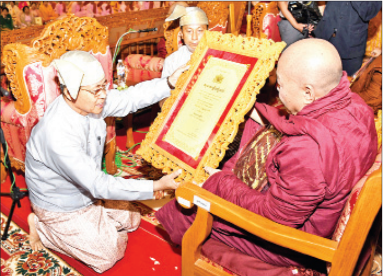
ဒုတိယတပ်မတော်ကာကွယ်ရေးဦးစီးချုပ် ကာကွယ်ရေးဦးစီးချုပ်(ကြည်း) ဒုတိယဗိုလ်ချုပ်မှူးကြီးစိုးဝင်း အဂ္ဂမဟာပဏ္ဍိတ ဘွဲ့တံဆိပ်တော်ရ ရန်ကုန်တိုင်းဒေသကြီး ကွမ်းခြံကုန်းမြို့နယ် ကံကြီး/မကျိုးရပ်ကွက် မရိုးရိမ်စာသင်တိုက်ဆရာတော် ဘဒ္ဒန္တစန္ဒဇောတိထံ ဘွဲ့တံဆိပ်တော်နှင့် အဆောင်အယောင်များ ဆက်ကပ်စဉ်။

ဆက်ကပ်ပူဇော် ယင်းနောက် ပြည်ထောင်စုရွေးကောက်ပွဲကော်မရှင်ဥက္ကဋ္ဌ ဦးလှသိန်း၊ ဒုတိယတပ်မတော် ကာကွယ်ရေးဦးစီးချုပ် ကာကွယ်ရေးဦးစီးချုပ်(ကြည်း) ဒုတိယဗိုလ်ချုပ်မှူးကြီးစိုးဝင်းနှင့် ပြည်သူ့လွှတ်တော် ဒုတိယဥက္ကဋ္ဌ ဦးထွန်းထွန်းဟိန်တို့က အဂ္ဂမဟာပဏ္ဍိတနှင့် အဂ္ဂမဟာသဒ္ဓမ္မဇောတိကစေ ဘွဲ့တံဆိပ်တော်ရ ဆရာတော်များထံ ဘွဲ့တံဆိပ်တော်နှင့် အဆောင်အယောင်များ ဆက်ကပ်ပူဇော်ကြသည်။ ဆက်လက်၍ ပြည်ထောင်စုဝန်ကြီးများ၊ ပြည်ထောင်စုရှေ့နေချုပ်၊ ပြည်ထောင်စု စာရင်းစစ်ချုပ်၊ ပြည်ထောင်စုရာထူးဝန်အဖွဲ့ ဥက္ကဋ္ဌ၊ နေပြည်တော်ကောင်စီဥက္ကဋ္ဌ၊ မြန်မာနိုင်ငံတော်ဗဟိုဘဏ်ဥက္ကဋ္ဌ၊ ညှိနှိုင်းကွပ်ကဲရေးမှူး (ကြည်း၊ ရေ၊ လေ)၊ နေပြည်တော်တိုင်းစစ်ဌာနချုပ်တိုင်းမှူး၊ ဒုတိယဝန်ကြီးများ၊ နေပြည်တော်ကောင်စီဝင်များ၊ အမြဲတမ်းအတွင်းဝန်များနှင့် ညွှန်ကြားရေးမှူးချုပ်များက အဂ္ဂမဟာပဏ္ဍိတ၊ အဂ္ဂမဟာသဒ္ဓမ္မဇောတိကစေ၊ အဂ္ဂမဟာ ကမ္မဋ္ဌာနာစရိယ၊ အဂ္ဂမဟာဂန္ထဝါစက ပဏ္ဍိတ၊ မဟာဓမ္မကထိကဗဟုဇနဟိတစရ၊ မဟာဂန္ထဝါစက ပဏ္ဍိတ၊ မဟာသဒ္ဓမ္မဇောတိကစေ၊ မဟာကမ္မဋ္ဌာနာစရိယ၊ ဓမ္မကထိကဗဟုဇနဟိတစရ၊ ဂန္ထဝါစက ပဏ္ဍိတ၊ သဒ္ဓမ္မဇောတိကစေ၊ ကမ္မဋ္ဌာနာစရိယ ဘွဲ့တံဆိပ်တော်ရ ဆရာတော်များအား ဘွဲ့တံဆိပ်တော်နှင့် အဆောင်အယောင်များ ဆက်ကပ်ပူဇော်ကြသည်။ ထို့နောက် နိုင်ငံတော်သမ္မတ