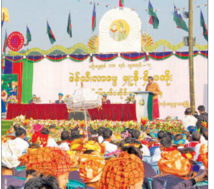
အမျိုးသားအဖွဲ့ချုပ် (PNO) နှင့် ပအိုဝ်းလွတ် များနှင့် ဒေသခံပြည်သူများတက်ရောက်ခဲ့ မြောက်ရေးအဖွဲ့ချုပ် (PNLO)တို့မှ တာဝန် ကြကြောင်း သိရသည်။ ရှိသူများ၊ မွန်၊ ကရင်၊ ပအိုဝ်းတိုင်းရင်းသား သက်ဦး(သထုံ)

အခမ်းအနားသို့ ပြည်နယ်ဝန်ကြီးချုပ် နှင့် ဝန်ကြီးများ၊ ပြည်နယ်လွှတ်တော် ကိုယ်စားလှယ်များ၊ ဌာနဆိုင်ရာများ၊ ပအိုဝ်း