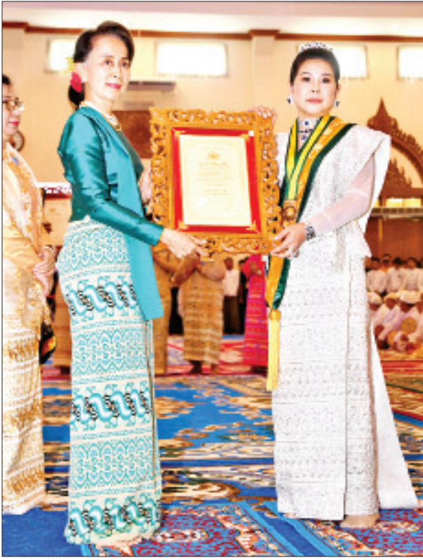
နိုင်ငံတော်၏အတိုင်ပင်ခံပုဂ္ဂိုလ် ဒေါ်အောင်ဆန်းစုကြည် အဂ္ဂမဟာ သီရိသုဓမ္မသီရိဘွဲ့တံဆိပ်ရ ဒေါ်တင်လတ်မင်းအား ဘွဲ့တံဆိပ်နှင့် အဆောင်အယောင်များ ပေးအပ်ချီးမြှင့်စဉ်။