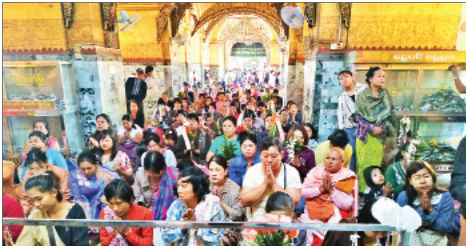
မန္တလေးမြို့ မဟာမုနိရုပ်ရှင်တော်မြတ်၌ ဘုရားဖူးပြည်သူများဖြင့် စည်ကားလျက်ရှိစဉ်။

မန္တလေး မတ် ၈ တပေါင်းလပြည့်နေ့ နံနက်ပိုင်းမှစတင်၍ မန္တလေးမြို့ရှိ ဘုရားပုထိုးစေတီများ၌ ကုသိုလ်ပုည ဆည်းပူးကြသူများ များပြားလျက်ရှိသည်။