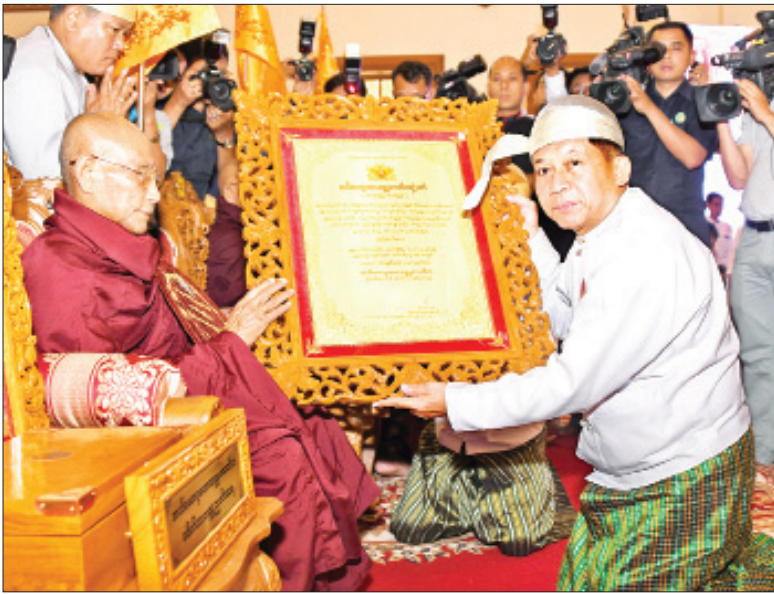
တပ်မတော်ကာကွယ်ရေးဦးစီးချုပ် ဗိုလ်ချုပ်မှူးကြီးမင်းအောင်လှိုင် အဘိဓဇအဂ္ဂမဟာသဒ္ဓမ္မဇောတိက ဘွဲ့တံဆိပ်တော်ရ မန္တလေးတိုင်းဒေသကြီး ညောင်ဦးမြို့ ရွှေမင်းဝန်ကျောင်းတိုက် ဆရာတော် ဘဒ္ဒန္တဝိမလထံ ဘွဲ့တံဆိပ်တော်နှင့် အဆောင်အယောင်များ ဆက်ကပ်စဉ်။