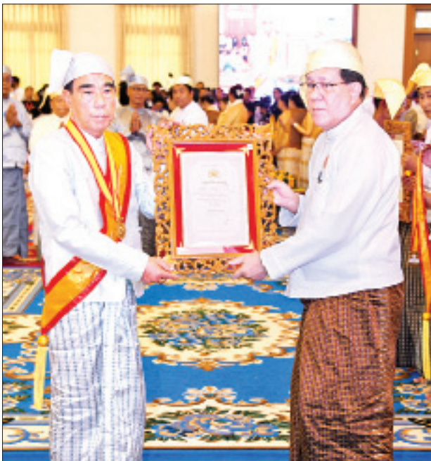
ပြည်ထောင်စုတရားသူကြီးချုပ် ဦးထွန်းထွန်းဦး သုဓမ္မမဏိဇောတဓရ ဘွဲ့တံဆိပ်ရ ဦးလှကြည်အား ဘွဲ့တံဆိပ်နှင့် အဆောင်အယောင်များ ပေးအပ် ချီးမြှင့်စဉ်။