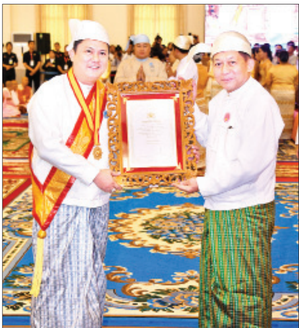
တပ်မတော်ကာကွယ်ရေးဦးစီးချုပ် ဗိုလ်ချုပ်မှူးကြီးမင်းအောင်လှိုင် သုဓမ္မမဏိဇောတဓရ ဘွဲ့တံဆိပ်ရ ဦးတင်မိုးအောင်အား ဘွဲ့တံဆိပ်နှင့် အဆောင်အယောင်များ ပေးအပ်ချီးမြှင့်စဉ်။