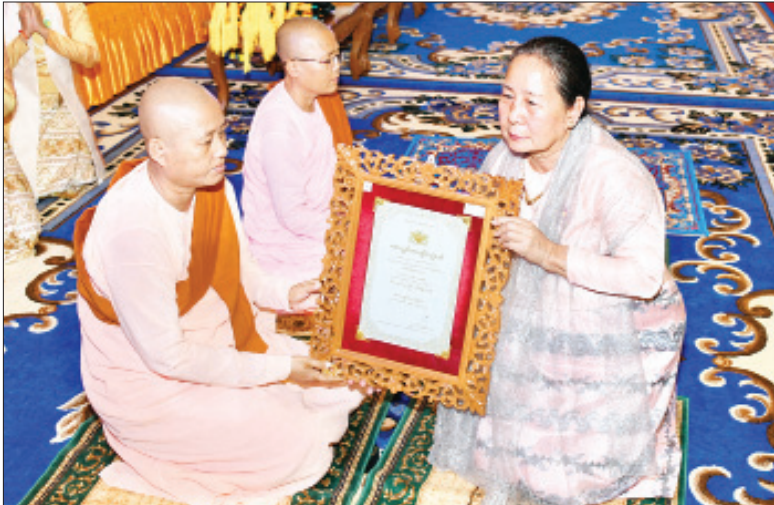
အမျိုးသားလွှတ်တော် ဥက္ကဋ္ဌ မန်းဝင်းခိုင်သန်း၏ဇနီး နန်းကြိုင်ကြည် မဟာဂန္ထဝါစကပဏ္ဍိတ ဘွဲ့တံဆိပ်တော်ရ သီလရှင်ဆရာကြီး ဒေါ်စန္ဒကလျာထံ ဘွဲ့တံဆိပ်တော် ဆက်ကပ်စဉ်။