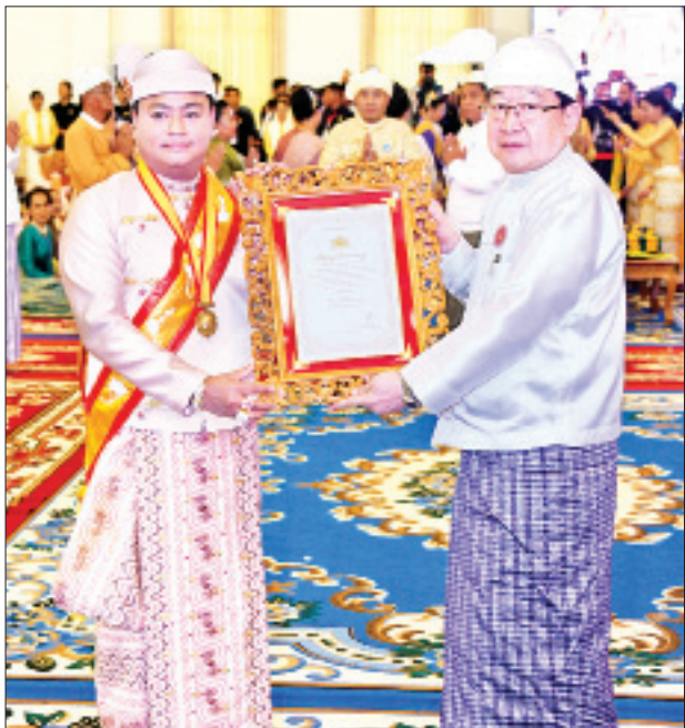
ပြည်သူ့လွှတ်တော်ဥက္ကဋ္ဌ ဦးတိစ္ဆာန်မြတ် သီရိသုဓမ္မမဏိဇောတဓရ ဘွဲ့တံဆိပ်ရ ဦးကျော်သူအား ဘွဲ့တံဆိပ်နှင့် အဆောင်အယောင်များ ပေးအပ် ချီးမြှင့်စဉ်။