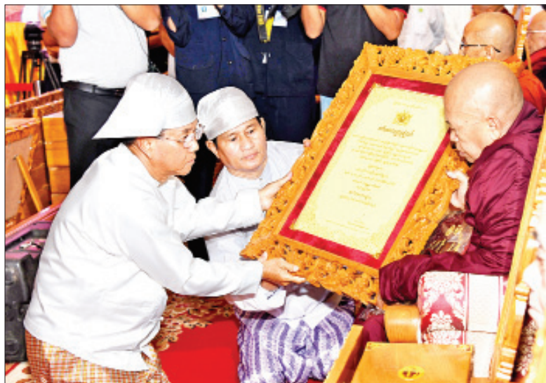
ဒုတိယသမ္မတ ဦးမြင့်ဆွေ အဘိဓမ္မမဟာရဋ္ဌဂုရု ဘွဲ့တံဆိပ်တော်ရ ရန်ကုန်တိုင်းဒေသကြီး ရန်ကင်းမြို့နယ် ကျောက်ကုန်းတောရ မေဒီနီစာသင်တိုက် ဆရာတော် ဘဒ္ဒန္တကောဝိဒဇေယျ ဘွဲ့တံဆိပ်တော်နှင့် အဆောင်အယောင်များ ဆက်ကပ်စဉ်။