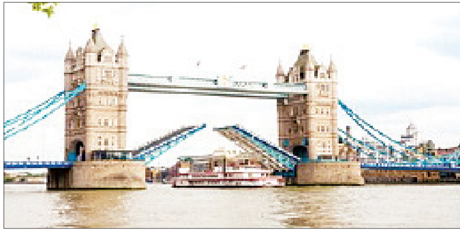
မျှော်စင်တံတား။