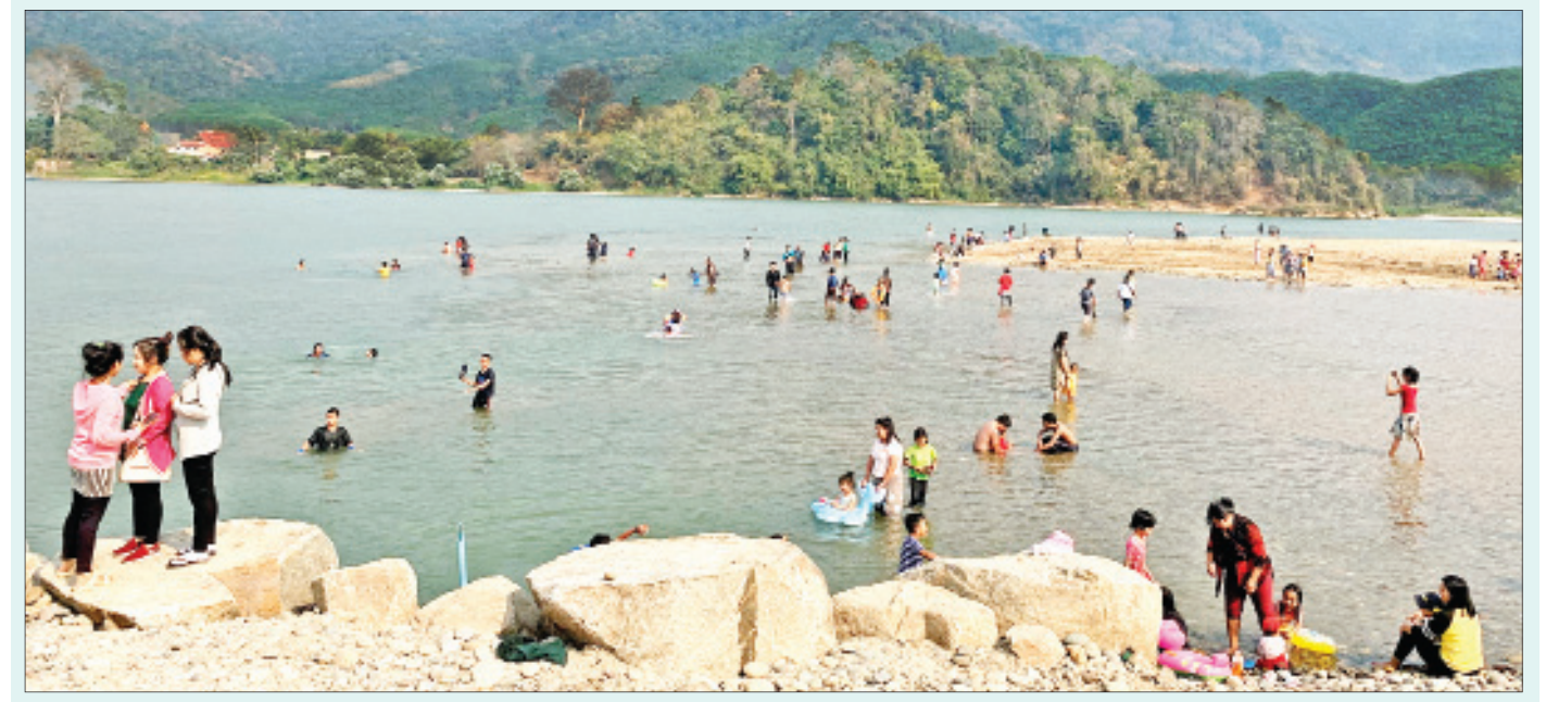
မတ် ၈ ရက် (တပေါင်းလပြည့်နေ့)က တာချီလိတ်မြို့ မိုင်းဖုန်း(က) ကျေးရွာအုပ်စု ဝမ်ပုံရွာအနီးရှိ မြန်မာ-လာအိုနယ်စပ် မဲခေါင်မြစ်ကမ်းရှိ ဇွဲသာယာကမ်းခြေတွင် ခရီးသွားများ လာရောက်အပန်းဖြေရေကစားကြစဉ်။

ထို့နောက် ရွှေတိဂုံစေတီတော် ၂၆၀၈ နှစ်မြောက် ဗုဒ္ဓပူဇော်ယုတ္တပေါင်းပွဲတော် ရေစက်ချပွဲအခမ်းအနားကို စေတီတော်ရင်ပြင် ချမ်းသာကြီးတန်ဆောင်း၌ ဆက်လက် ကျင်းပရာ ဂေါပကအဖွဲ့ဝင်များ၊ ဘာသာရေးဝတ်အသင်းအဖွဲ့များနှင့် အလှူရှင်များက နိုင်ငံတော်ဩဝါဒါစရိယ ရွှေတိဂုံစေတီတော်ဘဏ္ဍာတော်ထိန်း ဩဝါဒါစရိယ ရန်ကင်း မြို့နယ် ကျိုက်ပိကျောင်း စာမျက်နှာ ၈ ကော်လံ ၁ သို့ ၀