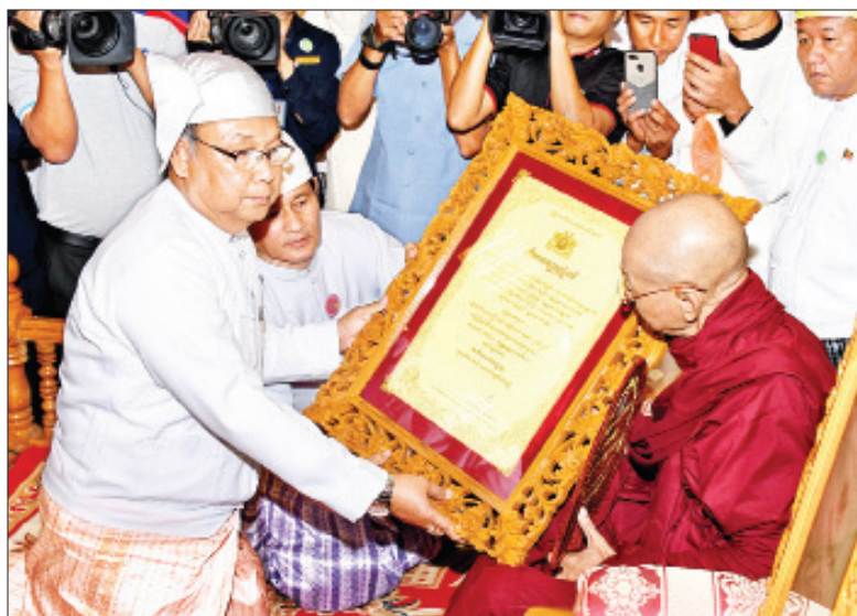
အမျိုးသားလွှတ်တော် ဥက္ကဋ္ဌ မန်းဝင်းခိုင်သန်း အဘိဓမ္မမဟာရဋ္ဌဂုရု ဘွဲ့တံဆိပ်တော်ရ ပါမောက္ခချုပ် ဆရာတော် ဒေါက်တာဘဒ္ဒန္တ နန္ဒမာလာဘိဝံသတံ ဘွဲ့တံဆိပ်တော်နှင့် အဆောင်အယောင်များ ဆက်ကပ်စဉ်။