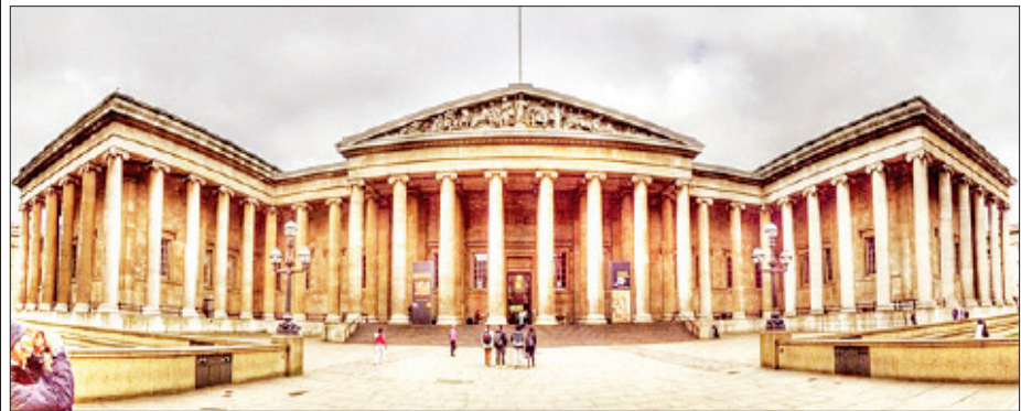
ဗြိတိသျှပြတိုက်။

ရိုက်(စ်)စပီးယားဂလုတ်(ဘ်) သည် လန်ဒန်မြို့ သိမ်းမြစ်ကမ်းဘေးတွင်တည်ရှိပြီး ကမ္ဘာပေါ်တွင် ထင်ရှားကျော်ကြားသည့် အနုပညာနှင့် ယဉ်ကျေးမှု ဖျော်ဖြေပွဲများ၊ ပညာရေးစင်တာအဖြစ် ထင်ရှားသည့် Open Theatre နေရာတစ်ခုဖြစ်သည်။ ပြဇာတ်ရေးဆရာနှင့် ကဗျာဆရာဖြစ်သူ ဝီလီယံရိုက်(စ်)စပီးယား၏ ကမ္ဘာပေါ်တွင် ပြောင်းလဲမှုများ ဖန်တီးနိုင်ခဲ့သည့် ပြဇာတ်များကို ဖျော်ဖြေရေး Open Air ပြဇာတ်များအား ကပြဖန်တီးပြသလျက်ရှိသည်။ စာမျက်နှာ ၂၄ သို့