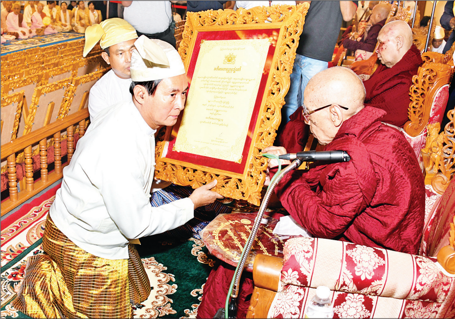
နိုင်ငံတော်သမ္မတ ဦးဝင်းမြင့် အဘိဓမ္မဟာရဋ္ဌဂုရု ဘွဲ့တံဆိပ်တော်ရ မန္တလေးတိုင်းဒေသကြီး မြင်းခြံမြို့ ချောင်းဒေါင်းပရိယတ္တိစာသင်တိုက် ဆရာတော် ဘဒ္ဒန္တ ကေလာသထံ ဘွဲ့တံဆိပ်တော်နှင့် အဆောင်အယောင်များ ဆက်ကပ်စဉ်။