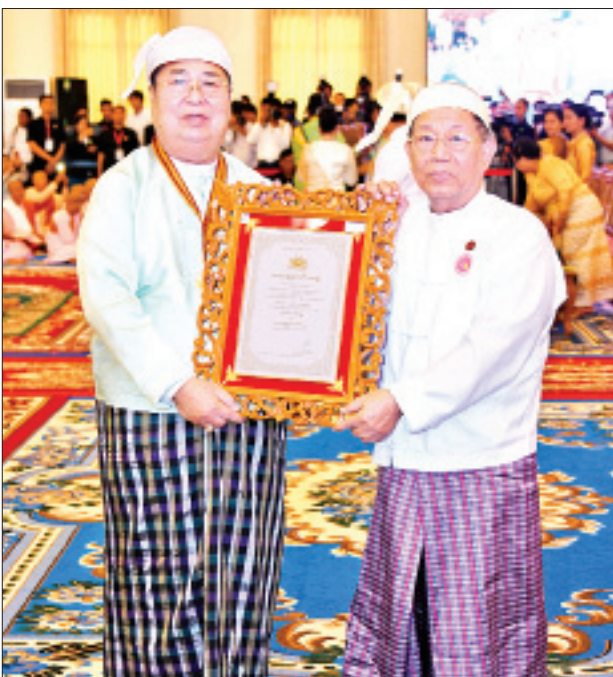
နိုင်ငံတော်ဖွဲ့စည်းပုံအခြေခံဥပဒေဆိုင်ရာခုံရုံးဥက္ကဋ္ဌ ဦးမျိုးညွန့် မဟာ သဒ္ဓမ္မဇောတိကဓဇ ဘွဲ့တံဆိပ်ရ ဒေါက်တာခင်ရွှေအား ဘွဲ့တံဆိပ်နှင့် အဆောင်အယောင်များ ပေးအပ်ချီးမြှင့်စဉ်။