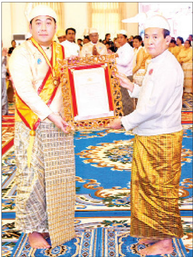
နိုင်ငံတော်သမ္မတ ဦးဝင်းမြင့် အဂ္ဂမဟာသီရိသုဓမ္မမဏိဇောတဓရ ဘွဲ့တံဆိပ်ရ ဦးစိုင်းမျိုးဝင်းအား ဘွဲ့တံဆိပ်နှင့် အဆောင်အယောင်များ ပေးအပ်ချီးမြှင့်စဉ်။