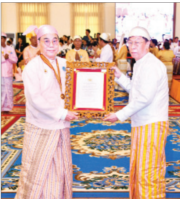
ပြည်ထောင်စုရွေးကောက်ပွဲကော်မရှင်ဥက္ကဋ္ဌ ဦးလှသိန်း မဟာသဒ္ဓမ္မ ဇောတိကဓဇ ဘွဲ့တံဆိပ်ရ ဦးယုမောင်(ခ)ဦးအမ်းယုမောင်အား ဘွဲ့တံဆိပ်နှင့် အဆောင်အယောင်များ ပေးအပ်ချီးမြှင့်စဉ်။