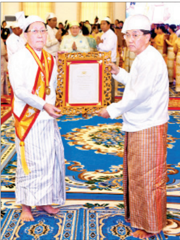
ဒုတိယသမ္မတ ဦးမြင့်ဆွေ သီရိသုဓမ္မမဏိဇောတဓရ ဘွဲ့တံဆိပ်ရ ပါမောက္ခ ဒေါက်တာကြည်စိုးအား ဘွဲ့တံဆိပ်နှင့် အဆောင်အယောင်များ ပေးအပ်ချီးမြှင့်စဉ်။