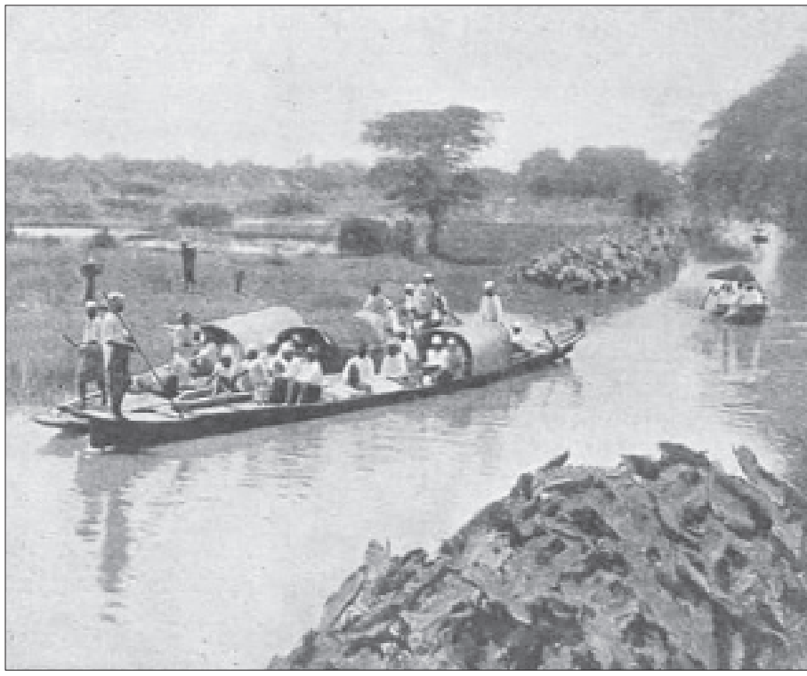
ရအောင် ဘေးဘောင်နှစ်ဖက်ကို စတိုးကြိုး မောင်း ခလုတ်များ တပ်ဆင်ထားပါတယ်။

မန္တလေးတူးမြောင်းကြီးဟာ ကလက်မက်ချောင်းရဲ့ အပေါ်ကနေ ရေတံလျှောက်ကြီးခင်းပြီး ဖြတ်စီးပါတယ်။ ရုံးပင်နေရာမှာ ရေတံလျှောက်ကြီး တည်ထားတာပါ။ ရေတံလျှောက်ကြီးရဲ့ ဘေးဘောင်နှစ်ဖက်ကို သံနဲ့ လုပ်ထားတာပါ။ ရေတံခါးများ လှဲချဖွင့်သလိုမျိုး လှဲချလို့