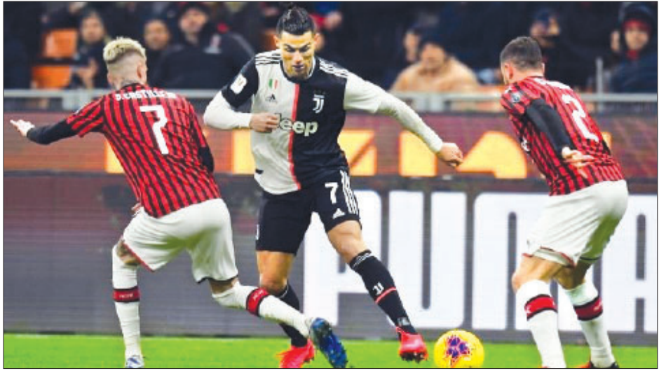
ဂျူပင်အသင်းနဲ့ အေစီကာလန်အသင်းတို့ ကိုပါအိတာလီယာဖလား ဆီမီးဖိုင်နယ်အဆင့် ပထမအကျော့ပွဲစဉ်ကို ယှဉ်ပြိုင်ကစားခဲ့စဉ်။

ပြီးခဲ့တဲ့တစ်ပတ်ကလည်း ကိုရိုနာဗိုင်းရပ်စ်ဖြစ်ပွားမှု မြင့်တက်လာခြင်းကြောင့် အီတလီစီးရီးအေပွဲစဉ် လေးပွဲ သာ ယှဉ်ပြိုင်ကစားခဲ့ပြီး အခြားသောပွဲစဉ်များအားလုံးကို ရွှေဆိုင်းခဲရတာ ဖြစ်ပါတယ်။ လက်ရှိအချိန်အထိ ကိုရိုနာ ဗိုင်းရပ်စ်ဖြစ်ပွားမှုကြောင့် ရွှေဆိုင်းခဲရတဲ့ အီတလီစီးရီးအေ ပွဲစဉ်ပေါင်း ၁၀ ပွဲ ရှိသွားပြီလည်းဖြစ်ပါတယ်။