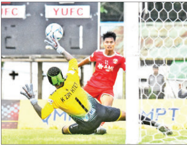
ရော့ဝတီနှင့် ရန်ကုန်အသင်းတို့ ပြီးခဲ့သည့်ရာသီက တွေ့ဆုံခဲ့စဉ်။

ရန်ကုန် မတ် ၄ ၂၀၂၀ ရာသီ MNL အမှတ်ပေးပြိုင်ပွဲ ပွဲစဉ်(၉)ကို ယခုတစ်ပတ်ဆက်လက် ကျင်းပမည်ဖြစ်ပြီး ရှုံးပွဲမရှိသေး သည့် အသင်းကြီးနှစ်သင်းဖြစ်သော ရော့ဝတီနှင့် ရန်ကုန်အသင်းတို့၏ ပြိုင်ဆိုင်မှုကို တွေ့မြင်ရမည်ဖြစ် သည်။ ပွဲစဉ် (၉) အဖြစ် မတ် ၆ ရက်တွင် သုဝဏ္ဏကွင်း၌ မကွေးအသင်းနှင့် ရှမ်းယူနိုက်တက်အသင်း၊ မတ် ၇ ရက်တွင် မန္တလေးသီရိကွင်း၌ ရတနာပုံအသင်းနှင့် ချင်းယူနိုက် တက်အသင်း၊ ပုသိမ်ကွင်း၌ ရော့ဝတီ အသင်းနှင့် ရန်ကုန်အသင်း၊ စာမျက်နှာ ၁၄ ကော်လံ ၄ သို့ ၀