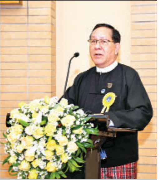
ပြည်ထောင်စုတရားသူကြီးချုပ် ဦးထွန်းထွန်းဦး “တရားရုံးက ဦးဆောင်သည့် စေ့စပ်ဖြေရှင်းရေး စမ်းသပ်အစီအစဉ်” ရှင်းလင်းတင်ပြခြင်း အခမ်းအနားတွင် အမှာစကားပြောကြားစဉ်။

သုံးသပ်တွေ့ရှိရ အခမ်းအနားတွင် ပြည်ထောင်စု တရားသူကြီးချုပ် ဦးထွန်းထွန်းဦးက ပြည်ထောင်စု တရားလွှတ်တော်ချုပ် အနေဖြင့် တရားစီရင်ရေးမဟာဗျူဟာ စီမံကိန်း (၂၀၁၈-၂၀၂၂)၏ မဟာဗျူဟာ ရည်မှန်းချက် ၅ ဒသမ ၃ တွင် အငြင်းပွားမှုများကို တရားရုံးက ထိရောက် မြန်ဆန်စွာ ဖြေရှင်းပေးသောစနစ် များကို သတ်မှတ်ဆောင်ရွက်ရန် ရည်မှန်းချက်နှင့်အညီ ၂၀၁၉ ခုနှစ်က ခရိုင်တရားရုံး နှစ်ရုံးနှင့် မြို့နယ်တရားရုံး နှစ်ရုံးတို့တွင် “တရားမမှုများတွင် တရားရုံးက ဦးဆောင်သည့် စေ့စပ်ဖြေရှင်းရေးစမ်းသပ်အစီအစဉ်”ကို စတင် အကောင်အထည်ဖော် ဆောင်ရွက်နိုင် ခဲ့ကြောင်း၊ တစ်နှစ်တာ ဆောင်ရွက် ချက်၏ရလဒ်များအရ စမ်းသပ်အစီ အစဉ်ကို ပိုမိုကျယ်ပြန့်စွာ ဆောင်ရွက် သင့်သည်ဟု သုံးသပ်တွေ့ရှိရသည့် အတွက် ယခုနှစ် ၂၀၂၀ ပြည့်နှစ်တွင် မန္တလေးတိုင်းဒေသကြီး၊ နေပြည်တော် ကောင်စီနယ်မြေ ဒက္ခိဏဒေသတိုင်း ရှိ ပျဉ်းမနားမြို့နယ် တရားရုံး၊ လယ်ဝေး မြို့နယ် တရားရုံး၊ ဇမ္ဗူသီရိမြို့နယ် တရားရုံး၊ ပုဗ္ဗသီရိမြို့နယ် တရားရုံး၊ ဥက္ကရာဇ်သီရိမြို့နယ် တရားရုံးနှင့် ဒက္ခိဏ သီရိမြို့နယ် တရားရုံးတို့တွင် ယင်း