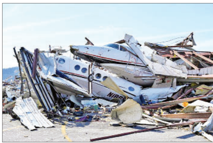
အမေရိကန်တောင်ပိုင်း၌ လေဆင်နှာမောင်း တိုက်ခတ်မှုကြောင့် ပျက်စီးသွားသော ချီပိုပေါ့ အင်အားပေးလိုင်း

ကိုးကား-အေအက်ဖ်ပီ ဘာသာပြန်-ကျော်ထိုက်စိုး