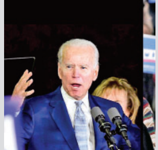
စာမျက်နှာ » ၁၃

ဒီမိုကရက်တစ်ပါတီ၏ အကြံပြုချက်ကောက်ပွဲများတွင် ဒုတိယသမ္မတဟောင်း ဂျိုးဘိုင်ဒင် ထောက်ခံမဲအများဆုံးရရှိ