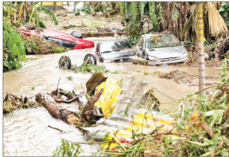
ဘရာဇီးတွင် မိုးသည်းထန်စွာ ရွာသွန်း ၁၆ ဦးသေ၊ ၃၃ ဦး ပျောက်ဆုံး

ဆော်ပေါလို မတ် ၄ ဘရာဇီးနိုင်ငံ အရှေ့တောင်ဘက်ပိုင်းတွင် မိုးသည်းထန်စွာရွာသွန်းမှုကြောင့် ရေကြီးမှုနှင့် မြေပြိုမှုများဖြစ်ပွားခဲ့ရာ ၁၆ ဦး သေဆုံးခဲ့ပြီး ၃၃ ဦး ပျောက်ဆုံးလျက်ရှိကြောင်း ဒေသန္တရ မီဒီယာများက ယမန်နေ့တွင် ပြောကြားသည်။