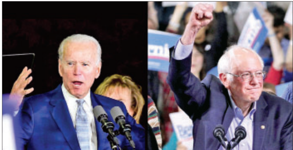
ဒုတိယသမ္မတဟောင်း ဂျိုးဘိုင်ဒင်

ကိုးကား-အင်န်အိတ်ချီကော ဘာသာပြန်-အောင်ကျော်ကျော်