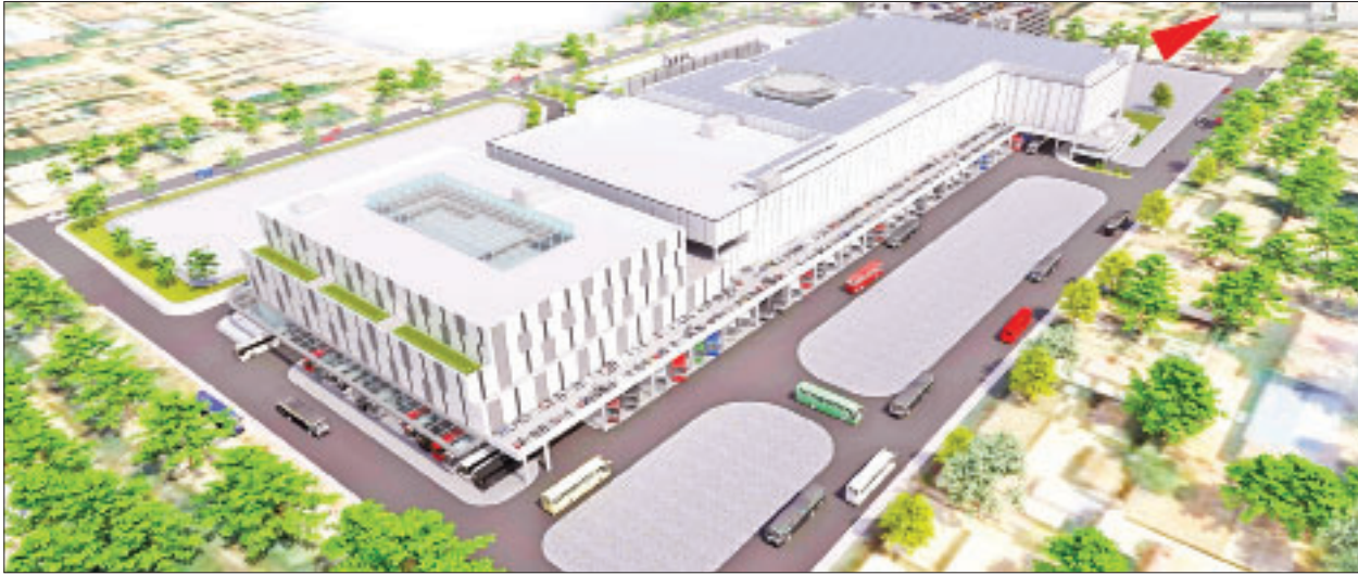
အသစ်ပြန်လည်တည်ဆောက်မည့် စီမံကိန်းပုံစံအား တွေ့ရစဉ်။

မန္တလေး မတ် ၄ မန္တလေးတိုင်းဒေသကြီး မန္တလေးမြို့ ပြည်ကြီးတံခွန်မြို့နယ် ရန်ကုန်-မန္တလေး ကားလမ်းမဘေးတွင် တည်ရှိသော ချမ်းမြေ့ပြည် (ကျွဲဆည်ကန်) ကားကြီးဝင်း အား မြန်မာနိုင်ငံ၏ ပထမဆုံး နိုင်ငံတကာအဆင့်မီ Bus Terminal အဖြစ် နှစ်နှစ်အတွင်းအပြီး အကောင်အထည်ဖော် တည်ဆောက်သွားမည်ဖြစ်ကြောင်း ထိုမှတစ်ဆင့် မြန်မာ-တရုတ် အိန္ဒိယသုံးနိုင်ငံ စီးပွားရေးအဝိုင်းအပိုင်းတစ်ခု ကို ဖော်ဆောင်နိုင်မည်ဖြစ်ကြောင်း စီမံကိန်းလုပ်ကိုင်ခွင့်ရ M Development မှ သိရသည်။