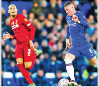
စာမျက်နှာ » ၂၀

လီဟာပူးကို အနိုင်ရပြီး ချယ်လ်ဆီး အက်ဖ်အေဖလား ကွာတား ဖိုင်နယ်တက်