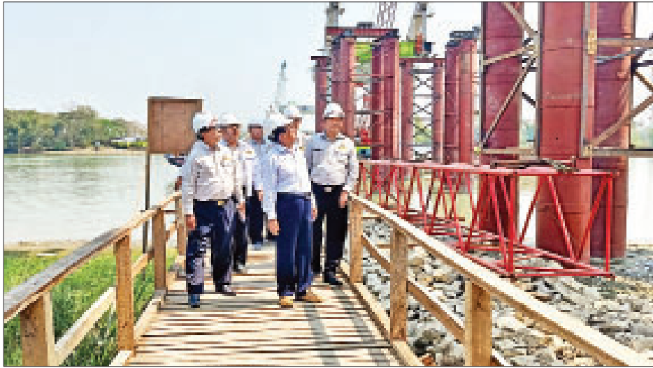
ဝါးခယ်မတံတားသည် ဧရာဝတီတိုင်းဒေသကြီး ဝါးခယ်မမြို့နယ် ပန်းတနော် - ရွှေလောင်း - ဝါးခယ်မ-ကျုံ့မင်းလမ်းပေါ်တွင် တည်ရှိပြီး ဝါးခယ်မမြစ်ကို ဖြတ်ကျော်တည်ဆောက်ထားကာ ပင်မတံတားအပိုင်းကို

နေပြည်တော် မတ် ၂ ဆောက်လုပ်ရေးဝန်ကြီးဌာန ပြည်ထောင်စုဝန်ကြီး ဦးဟန်ဇော်သည် ယမန်နေ့ နံနက်ပိုင်းတွင် ပုသိမ်-ကံကုန်း-မြောင်းမြလမ်းအပိုင်း ကွန်ကရစ်ခင်းခြင်းလုပ်ငန်းများ ဆောင်ရွက်နေမှု၊ မရမ်းချောင်း-ရွာသစ်လမ်းပေါ် မိတာ ၂၄၀ ရှိ ကျွန်းကုန်းတံတားသစ် တည်ဆောက်နေမှုနှင့် ကျွန်းကုန်းကြိုးတံတားဟောင်း ကြံ့ခိုင်မှုတို့ကို ကြည့်ရှု စစ်ဆေးသည်။