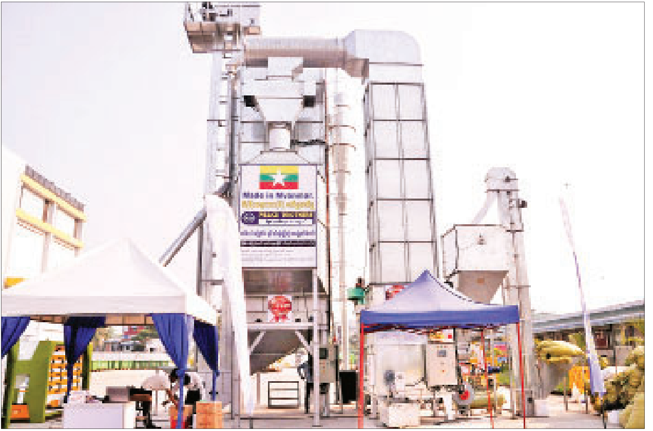
မုံရွာစက်မှုဇုန်မှ တီထွင်ထုတ်လုပ်သည့် စပါး၊ ပဲ၊ ပြောင်းနှင့် သီးနှံမျိုးစုံ အခြောက်ခံစက်ကို တွေ့ရစဉ်။

ရန်ကုန် မတ် ၂ စပါးထည့်ချိန်နာရီဝက် အခြောက်ခံချိန်နာရီဝက်ဖြင့် စပါး၊ ပဲ၊ ပြောင်းနှင့် သီးနှံမျိုးစုံကို တစ်နာရီလျှင် တန် ၃၀ ထုတ်လုပ်နိုင်သည့် မြန်မာပြည်မှ ကိုယ်ပိုင်တီထွင်ထုတ်လုပ်သော အခြောက်ခံစက်ကို ရန်ကုန်မြို့၊ သာကေတမြို့နယ် Fortune Plaza ရှိ မြန်မာအပြည်ပြည်ဆိုင်ရာလယ်ယာသုံးစက်ကိရိယာပြပွဲတွင် ဖွင့်လှစ်ပြသလျက်ရှိရာ ဆန်စက်ပိုင်ရှင်များနှင့် တောင်သူများ အထူးစိတ်ဝင်စားလျက်ရှိသည်။