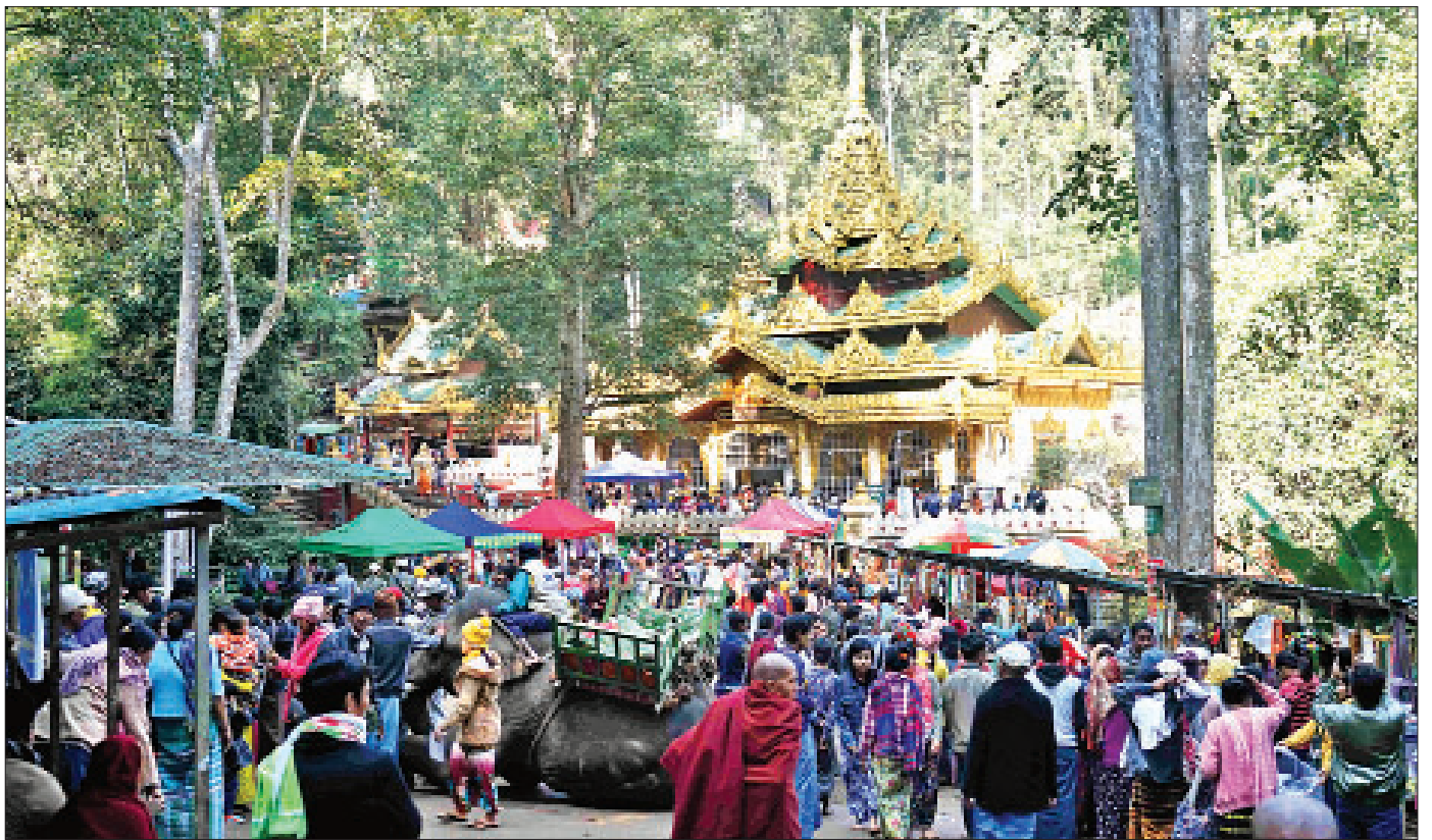
စစ်ကိုင်းတိုင်းဒေသကြီး ယင်းမာပင်မြို့နယ်ရှိ အလောင်းတော်ကဿပဘုရား၌ ဘုရားဖူးသူများဖြင့် စည်ကားလျက်ရှိစဉ်။

ထို့အတူ ပုဂ္ဂလိကလုပ်ငန်းများနှင့် ခရီးသွား ဧည့်သည်များ အလွယ်တကူ ထိတွေ့ဆက်ဆံနိုင်ရန်နှင့်