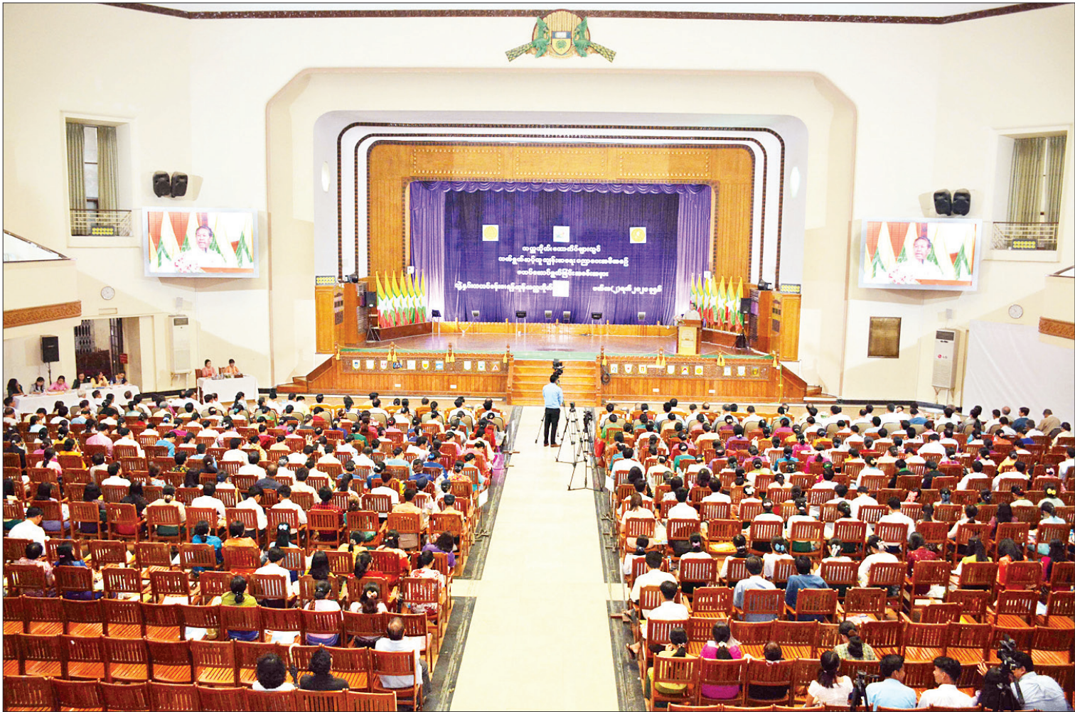
ရန်ကုန်တက္ကသိုလ် ဘွဲ့နှင့်သဘင်ခန်းမ၌ တက္ကသိုလ်၊ ကောလိပ်များတွင် သက်ရွယ်ဆင့်တူကျန်းမာရေး ပညာပေးအစီအစဉ် စတင်ဆောင်ရွက်ခြင်း အခမ်းအနား ကျင်းပစဉ်။

ဆောင်ရွက်လျက်ရှိ ရှေးဦးစွာ ပညာရေးဝန်ကြီးဌာန ပြည်ထောင်စုဝန်ကြီး ဒေါက်တာမျိုးသိမ်းကြီး က ကျောင်းသား ကျောင်းသူလူငယ်များ စုဝေးရာဖြစ်သည့် တစ်နိုင်ငံလုံးရှိ ကျောင်းများ၊ တက္ကသိုလ်များနှင့် ပြည်သူ့လူထု၏ အနီး ဝန်းကျင်တွင် မူးယစ်ဆေးဝါးအန္တရာယ်ကင်း ဝေးစေရန်၊ ဆေးလိပ်ကင်းစင်သော တက္ကသိုလ် ပတ်ဝန်းကျင်ဖြစ်လာစေရန်၊ အရက်ဘီယာ အန္တရာယ်ကင်းစေရန်အတွက် နိုင်ငံတော်၏ အတိုင်ပင်ခံပုဂ္ဂိုလ်၏ လမ်းညွှန်ချက်(၇)ရပ် ဖြစ်သည့် မူးယစ်ဆေးဝါးအန္တရာယ်ကင်းစင် ပပျောက်ရေး၊ ဆေးလိပ်၊ ဆေးရွက်ကြီးနှင့် ကွမ်းယာသုံးစွဲမှုကင်းစင်ပပျောက်ရေး၊ အရက် အလွန်အကျွံသောက်သုံးခြင်းနှင့် နောက်ဆက်တွဲ အန္တရာယ်များ လျော့ချရေး၊ ကျန်းမာရေးနှင့် ညီညွတ်သည့် လူနေမှုဘဝပုံစံများ လိုက်နာ ကျင့်သုံးရေး၊ ယာဉ်အန္တရာယ်နှင့် လမ်းအန္တရာယ် တို့ကြောင့် ထိခိုက်ဒဏ်ရာရရှိမှု လျော့နည်း ပပျောက်ရေး၊ မျိုးဆက်ပွားကျန်းမာရေးဆိုင်ရာ အသိပညာဗဟုသုတများကို ထည့်သွင်း သင်ကြားပေးနိုင်ရေးနှင့် ဂိမ်းအလွန်အကျွံ စွဲလမ်းမှုပပျောက်ရေးတို့ကို အကောင်အထည် ဖော်ဆောင်ရွက်လျက်ရှိပါကြောင်း။ စာမျက်နှာ ၃ ကော်လံ ၁ သို့ *