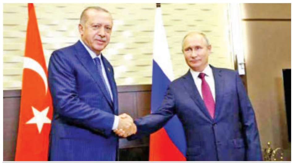
တူရကီသမ္မတ အာဒိုဂန်နှင့် ရုရှားသမ္မတ ပူတင်

သို့သော်လည်း အိဒလစ်ပြည်နယ်ကို သိမ်းပိုက်ရန် အတွက် ရုရှား၏ ပိုမိုကူညီမှုဖြင့် ဆီးရီးယားတပ်မတော်၏ မကြာသေးမီက စစ်ဆင်ရေးများသည် ၂၀၁၁ ခုနှစ်က ဆီးရီး