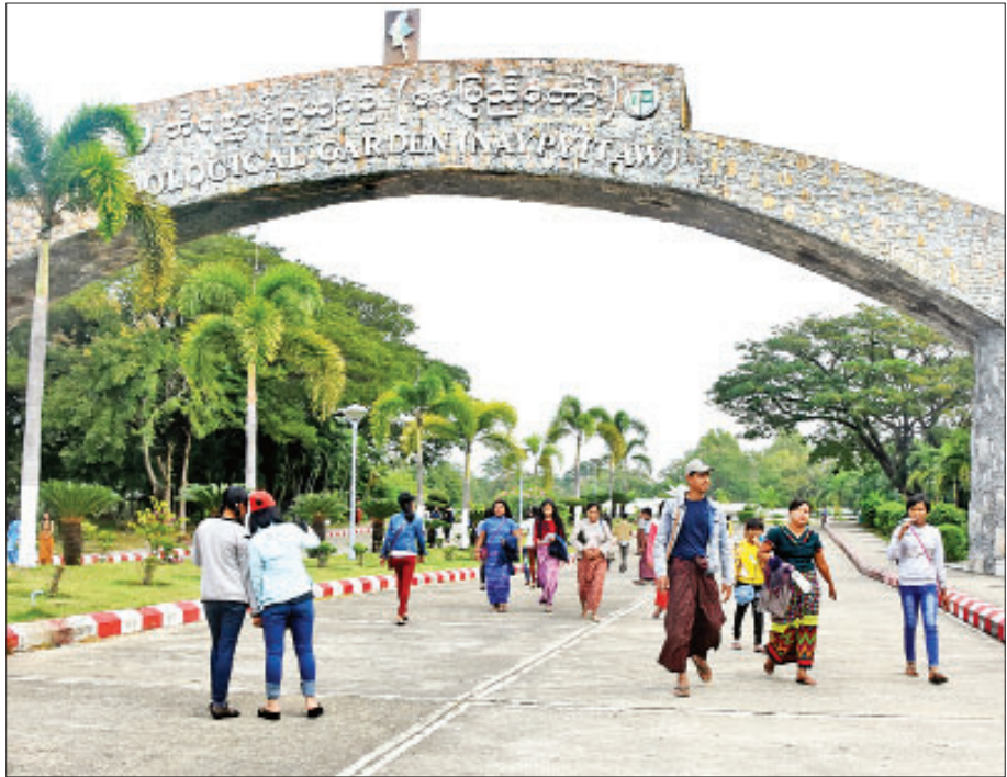
နေပြည်တော်ရှိ တိရစ္ဆာန်ဥယျာဉ်တွင် လာရောက်လေ့လာလည်ပတ်ကြသူများကို တွေ့ရစဉ်။

မြန်မာနိုင်ငံတွင် သဘာဝအလှအပများစွာ တည်ရှိ နေပြီး ထိုအရာများကို Destination Management Plan များ ချမှတ်ကာ စနစ်တကျဆောင်ရွက်ရန် လိုအပ်သလို လူထုအခြေပြုခရီးသွားလုပ်ငန်းများ၊ ခရီးစဉ်အသစ်များ ဖော်ဆောင်ခြင်းဖြင့် ဒေသခံပြည်သူလူထု၏ လူသား အရင်းအမြစ်ဖွံ့ဖြိုးတိုးတက်ရေးကို ဆောင်ရွက်သင့် ကြောင်းကိုလည်း ပညာရှင်များက သုံးသပ်ကြသည်။