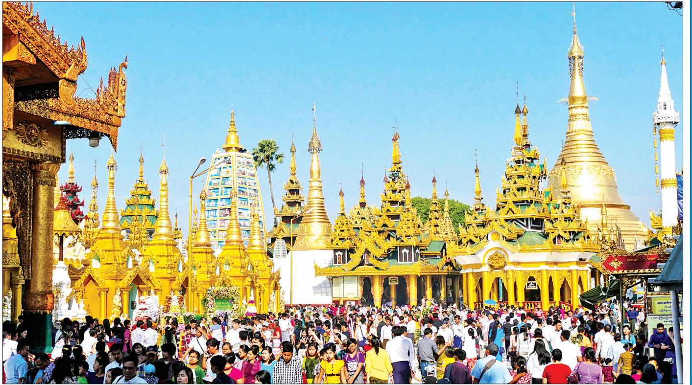
ရန်ကုန်မြို့ရှိ လေးဆူဓာတ်ပုံ မြတ်ရွှေတိဂုံစေတီတော်တွင် ဘုရားဖူးလာသူများဖြင့် စည်ကားလျက်ရှိစဉ်။

မစ္စတူနီနတ်ပက်ထရီဇာတို့ကဲ့သို့ မြန်မာနိုင်ငံသို့ လာရောက်လည်ပတ်သည့် ပြည်ပခရီးသွားဧည့်သည် အရေအတွက်သည် နှစ်စဉ်တိုးတက်လျက်ရှိရာ ၂၀၁၆