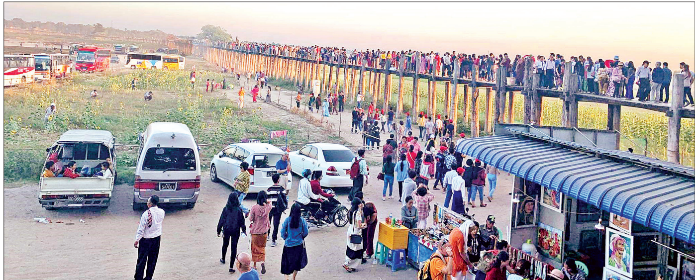
မန္တလေးမြို့ရှိ ဦးပိန်တံတား၌ ပြည်တွင်းပြည်ပ ခရီးသွားများဖြင့် စည်ကားလျက်ရှိစဉ်။

မြန်မာနိုင်ငံတွင် ခရီးသွားဧည့်သည်လွယ်ကူစွာ လာရောက်လည်ပတ်နိုင်စေရေးအတွက် ဗီဇာဖြေလျှော့မှု များ ဆောင်ရွက်ပေးလျက်ရှိကာ တရုတ်နိုင်ငံက ခရီး သွား ဝင်ရောက်မှုမှာ ၂၀၁၆ ခုနှစ်တွင် တစ်သိန်း ရှစ်သောင်းကျော်ရှိခဲ့ရာမှ စာမျက်နှာ ၇ သို့