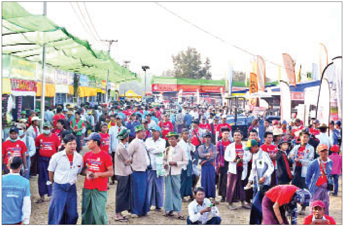
တိုင်းဒေသကြီး ဝန်ကြီးချုပ် ဦးလှမိုးအောင်နှင့် ခွင့်ပြုလက်မှတ်များ ပေးအပ်သည်။ လက်မှတ်လက်ခံရရှိသည့် တောင်သူများ တာဝန်ရှိသူများက တောင်သူများအား လုပ်ပိုင် ထိုနောက် စွန့်လွှတ်ခြင်းများ လုပ်ပိုင်ခွင့်ပြု ကိုယ်စား တောင်သူတစ်ဦးက ကျေးဇူးတင်

ဆက်လက်၍ ရာဇဝတ်တိုင်းဒေသကြီး အတွင်းရှိ ဓနုဖြူ မအူပင်၊ ရေကြည်၊ ဒေးဒရဲနှင့် ကျောင်းကုန်းမြို့နယ်တို့မှ စွန့်လွှတ်ခြင်းများ တောင်သူများလက်ဝယ်သို့ လုပ်ပိုင်ခွင့်ပြု လက်မှတ်များပေးအပ်ခြင်း အခမ်းအနားကို ကျင်းပရာ ရာဇဝတ်တိုင်းဒေသကြီး လယ်ယာ မြေနှင့် အခြားမြေများ သိမ်းဆည်းခြင်းခံရ မှုများ ပြန်လည်စိစစ်ရေးကော်မတီဥက္ကဋ္ဌ၊