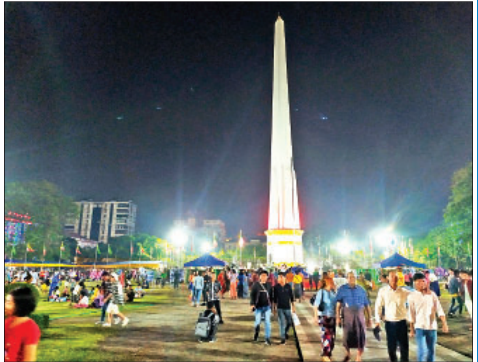
ရန်ကုန်မြို့ မဟာဗန္ဓုလပန်းခြံတွင် လာရောက်အနားယူအပန်းဖြေကြသည့် ပြည်သူများ။