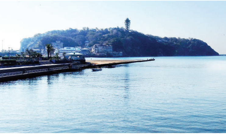
ဂျပန်နိုင်ငံ ကာနာဂါဝါခရိုင် ဖူဂျိဆာဝါမြို့ ရှိနန်ပင်လယ်ကမ်းခြေ မလှမ်းမကမ်းတွင် တည်ရှိသော အိနိုရီးမားကျွန်း။

စာရေးသူ တိုကျိုမြို့တော်သို့ ရောက်ရှိ လည်ပတ်နေသည်မှာ ခုနစ်ရက်ပြည့်ခဲ့ပြီ ဖြစ်သည်။ မနက်ဖြန် ရှစ်ရက်မြောက်နေ့တွင် တိုကျိုမြို့တော်အနီးရှိ ဂျပန်နိုင်ငံ၏ ဒုတိယ အကြီးမားဆုံးမြို့ဖြစ်သည့် ယိုကိုဟားမားသို့ သွားရောက်လည်ပတ်မည် ဖြစ်သည်။ ယိုကိုဟားမားသို့ မသွားမီလမ်းတွင် ကမာကူရ ဘုရားသို့ ဝင်ရောက်လည်ပတ်မည် ဖြစ်သည်။ သို့ဖြစ်ရာ တိုကျို-ကမာကူရ-ယိုကိုဟားမား ခရီးစဉ်ထပ်ဆင့်ရသည်။ ကမာကူရသို့ သွားရောက်ခြင်းသည် အဓိကဘုရားဖူးခြင်း ဖြစ်ရာ ဘုရားကြီးအားကြည့်ပြီးလျှင် ကမာကူရခရီးစဉ် ပြီးဆုံးပြီဖြစ်သည်။ သို့ဖြစ်ရာ တိုကျိုမှ မနက်ထွက်၊ ကမာကူရ ဘုရားဆီသို့ ယိုကိုဟားမားဆက်သွားလျှင် နေ့တစ်ဝက်အတွင်း ယိုကိုဟားမားသို့ ရောက်ရှိမည် ဖြစ်သည်။ စာရေးသူက တိုကျို မှထွက်သည်နှင့် တစ်နေ့ကုန်လမ်းမှာ ဝင်ရောက်လည်ပတ်လိုသည်။ ယိုကိုဟားမား သို့ ညနေပိုင်းမှ ရောက်လိုသည်။ ကမာကူရ ဘုရားအနီးတွင် လည်ပတ်စရာနေရာအချို့ ရှိသော်လည်း ထိုထက် စိတ်ဝင်စားစရာ ကောင်းသည့် လမ်းခရီးတစ်လျှောက် မြို့ရွာများသို့ သွားရောက်လည်ပတ်လိုသည်။ အင်တာနက်မှာ ရှာကြည့်တော့ တိုကျို-ယိုကိုဟားမားအကြား ထင်ရှားသော လည်ပတ်စရာ နေရာနှစ်ခုရှိသည်။ ၎င်းတို့မှာ ကမာကူရဘုရားနှင့် အိနိုရီးမားကျွန်းတို့ ဖြစ်သည်။