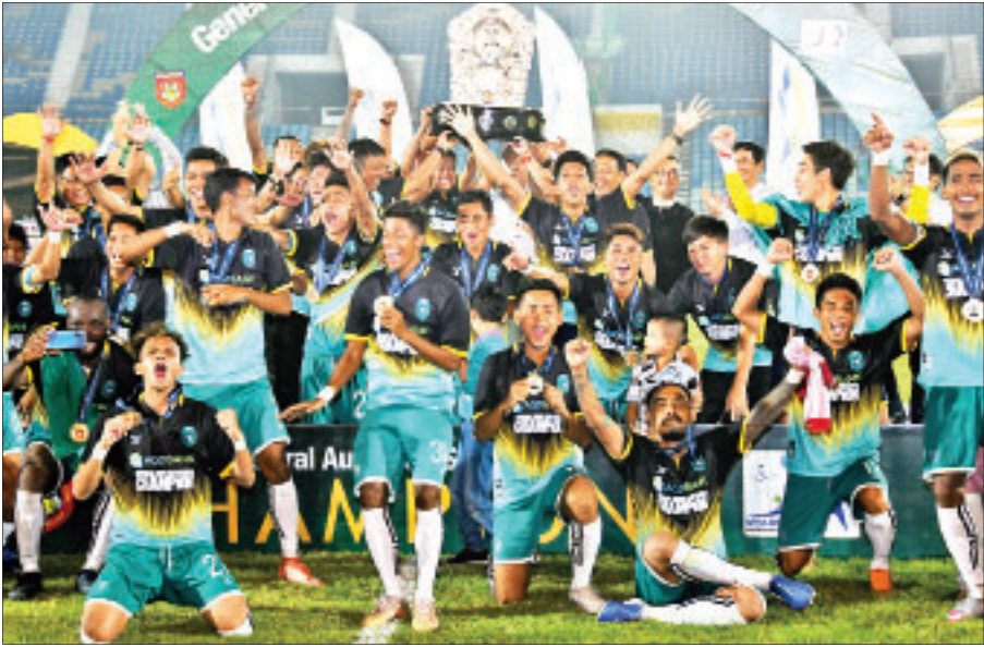
၂၀၁၉ ခုနှစ် ဗိုလ်ချုပ်အောင်ဆန်းဒိုင်း ရှုံးထွက်ချန်ပီယံ ရန်ကုန်အသင်းကို တွေ့ရစဉ်။

ရန်ကုန် မတ် ၂ ၂၀၂၀ ရာသီ ဗိုလ်ချုပ်အောင်ဆန်းဒိုင်း ရှုံးထွက်ဘောလုံးပြိုင်ပွဲကို ဧပြီလ ဒုတိယပတ်တွင် စတင်ကျင်းပမည် ဖြစ်ပြီး မတ်လဒုတိယပတ်တွင် ပွဲစဉ် မဲနှိုက်ရေးဆွဲသည့် အခမ်းအနား ပြုလုပ်မည် ဖြစ်သည်။ ၂၅ သင်း ဝင်ရောက်ယှဉ်ပြိုင် မြန်မာနေရှင်နယ်လီကော်မတီသည် ယခုနှစ်တွင် MNL ကလပ် အသင်းများ၊ MNL-2 (ပထမတန်း) ကလပ်အသင်းများအပြင် အပျော်တမ်း အသင်းများကိုလည်း ပထမဆုံး ယှဉ်ပြိုင်ခွင့်ပြုထားပြီး အသင်းပေါင်း ၂၅ သင်းဖြင့် ကျင်းပမည်ဖြစ်သည်။ MNL ကလပ် ၁၂ သင်း၊ MNL-2 ကလပ် အသင်း ၅ သင်း၊ အပျော်တမ်းကလပ် ၁၈ သင်း စုစုပေါင်း ၂၅ သင်း ဝင်ရောက် ယှဉ်ပြိုင်မည်ဖြစ်သည်။ ယခုရာသီတွင် စာမျက်နှာ ၂၄ ကော်လံ ၄ သို့ ၀