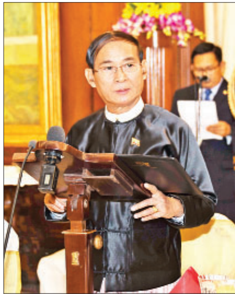
နိုင်ငံတော်သမ္မတ ဦးဝင်းမြင့် ဂုဏ်ပြုညစာစားပွဲတွင် မိန့်ခွန်းပြောကြားစဉ်။