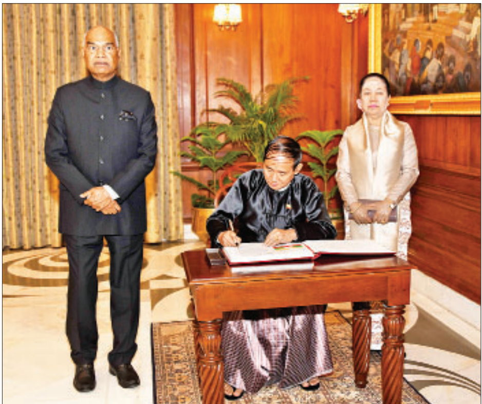
နိုင်ငံတော်သမ္မတ ဦးဝင်းမြင့် အိန္ဒိယသမ္မတနိုင်ငံ သမ္မတအိမ်တော် ဧည့်သည်တော်မှတ်တမ်းတွင် လက်မှတ်ရေးထိုးစဉ်။

ဂုဏ်ယူဝမ်းမြောက် မိမိအနေဖြင့် မြန်မာနိုင်ငံ၏ ချစ်ကြည်ရင်းနှီးသည့် အိမ်နီးချင်း အိန္ဒိယနိုင်ငံ၏ ဘက်စုံဖွံ့ဖြိုးတိုးတက် မှုများကို တွေ့မြင်နေရသည့်အတွက် ဝမ်းမြောက်ဝမ်းသာ ဖြစ်မိပါကြောင်း၊ အိန္ဒိယအစိုးရနှင့် ပြည်သူများ၏ မနားမနေ ကြိုးပမ်းအားထုတ်မှုများ ကြောင့် အိန္ဒိယနိုင်ငံ၏ နိုင်ငံတော် တည်ဆောက်ရေး လုပ်ငန်းစဉ်များ သည် အိန္ဒိယနိုင်ငံကို တိုးတက်မှုများ ရရှိနေပြီး ကမ္ဘာ့အဆင့်မီ စီးပွားရေး အင်အားတစ်ရပ်အဖြစ် အသွင်ပြောင်း လဲစေနိုင်ခဲ့သည့်အတွက် ဂုဏ်ယူ ဝမ်းမြောက်မိပါကြောင်း၊ အချိန်တို အတွင်း အိန္ဒိယနိုင်ငံ၏ လူမှု-စီးပွား ရေး အလျင်အမြန် တိုးတက်လာပြီး