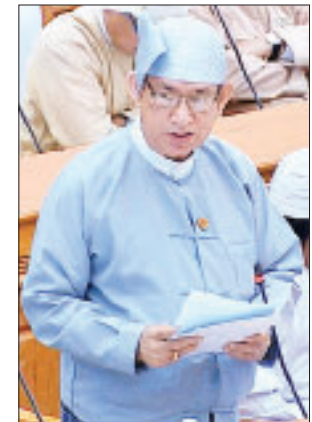
ဒုတိယဝန်ကြီး ဒေါက်တာရဲမြင့်ဆွေ

ယခုအခါ နိုင်ငံတော်အစိုးရသစ်လက်ထက်တွင် ကျယ်ပြန့်သော စီးပွားရေးဆိုင်ရာ ပြုပြင်ပြောင်းလဲမှုများကို ဆောင်ရွက်ခဲ့ခြင်း၊ နိုင်ငံတော်အတွက် အရေးပါ