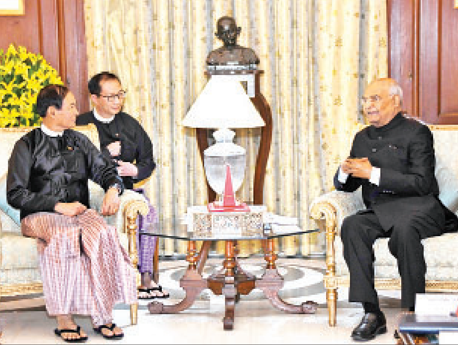
နိုင်ငံတော်သမ္မတ ဦးဝင်းမြင့်နှင့် အိန္ဒိယသမ္မတနိုင်ငံ သမ္မတ ရှရီ ရမ် နက်သ် ကိုပင့်ခိုက် တွေ့ဆုံဆွေးနွေးစဉ်။

နယူးဒေလီ ဖေဖော်ဝါရီ ၂၈ အိန္ဒိယသမ္မတနိုင်ငံ နယူးဒေလီမြို့၌ ရောက်ရှိနေသော ပြည်ထောင်စုသမ္မတမြန်မာနိုင်ငံတော် နိုင်ငံတော်သမ္မတ ဦးဝင်းမြင့်နှင့်အိန္ဒိယ အိန္ဒိယသမ္မတနိုင်ငံ သမ္မတ ရှရီ ရမ် နက်သ် ကိုပင့်ခိုက်နှင့် တွေ့ဆုံဆွေးနွေးပြီး အိန္ဒိယသမ္မတက တည်ခင်း ညှိနှိုင်းသည့် ဂုဏ်ပြုညစာစားပွဲသို့ တက်ရောက်ကြသည်။ နိုင်ငံတော်သမ္မတ ဦးဝင်းမြင့်သည် အဖွဲ့ဝင်များနှင့် အတူ ဖေဖော်ဝါရီ ၂၇ ရက် ညပိုင်းတွင် အိန္ဒိယသမ္မတနိုင်ငံ သမ္မတအိမ်တော်သို့ရောက်ရှိရာ အိန္ဒိယသမ္မတနိုင်ငံ သမ္မတ