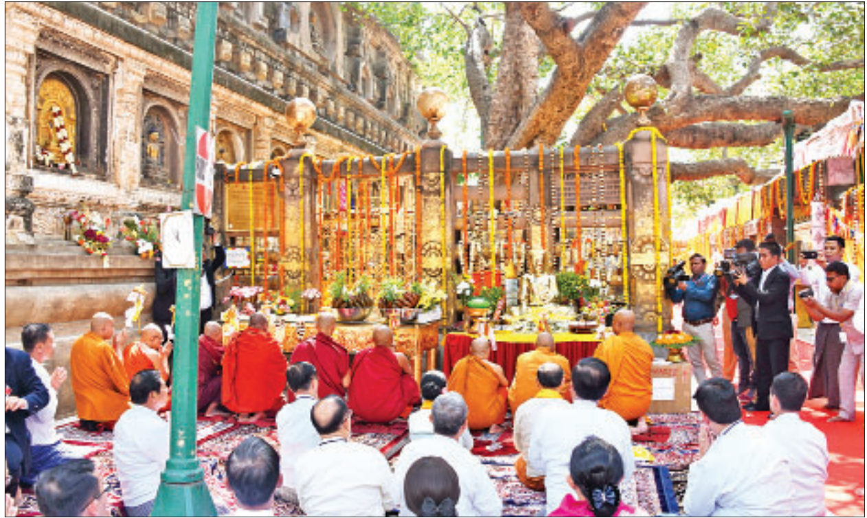
ဂယာမြို့မဟာဗောဓိစေတီတော်အနီးရှိ ဗုဒ္ဓဂယာ မဟာဗောဓိပင်နှင့် ရွှေပလ္လင်တော်၌ ထားရှိအပူဇော်ခံရန် ဉာဏ်တော် ၃၆ လက်မ အမြင့်ဆောင်သည့် ကြေးသွန်းဗုဒ္ဓရုပ်ပွားတော်မြတ် ပေးအပ်လှူဒါန်းပူဇော်ပွဲအခမ်းအနား ကျင်းပစဉ်။

နှင့်အတူ မှတ်တမ်းတင်ဓာတ်ပုံ ရိုက်ကြသည်။ မွန်းလွဲပိုင်းတွင် နိုင်ငံတော်သမ္မတ နှင့်ဇနီးနှင့်အဖွဲ့သည် ဗုဒ္ဓဂယာ မြန်မာ ဘုန်းတော်ကြီးကျောင်းသို့ ရောက်ရှိ ကြပြီး မြန်မာကျောင်း ပဓာနနာယက ဆရာတော် အဘိဓဇအဂ္ဂမဟာ သဒ္ဓမ္မ ဇောတိကဇေ ဘဒ္ဒန္တဉာဏိန္ဒ အမျိုးပြု သော မဟာအောင်မြေကျောင်း၊ ရခိုင် မွန်ကျောင်း၊ ကမ္ဘောဇရမ်းကျောင်း၊ မဟာဗောဓိ ဓမ္မရိပ်သာကျောင်း၊ ရခိုင်ကျောင်းနှင့် ရာမညမုနိကျောင်း စသည့် ဗုဒ္ဓဂယာရှိ မြန်မာ ဘုန်းတော်ကြီးကျောင်း ၁၃ ကျောင်း တို့မှ စာမျက်နှာ ၇ သို့ >>>