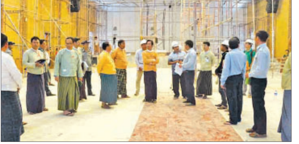
ရီရယ်(ဒီးမော့ဆို)

နှင့် ဆည်တာပေါင်ရှိ မြေသားလမ်းကို ကွန်ကရစ်လမ်းသို့ အဆင့်မြှင့်တင်ခြင်းလုပ်ငန်း၊ ဆည်တာပေါင်တစ်လျှောက် မြေယာရှင်းဆောင်ရွက်မည့် အခြေအနေများကို ကြည့်ရှု စစ်ဆေးပြီး ဆည်ပေါင်ဧရိယာတွင် မော်တော်ယာဉ်များ ဖြတ်သန်းသွားလာမှုမရှိစေရေး အများပြည်သူများအား ကျယ်ကျယ်ပြန့်ပြန့် ချပြရှင်းလင်းရန်လိုအပ်ပြီး မြေယာ ရှင်းဆောင်ရွက်ရာတွင်လည်း သတ်မှတ်စံချိန်စံညွှန်းများ အတိုင်း စနစ်တကျဖော်ဆောင်သွားရန် မှာကြားသည်။ ထို့နောက် ဒီးမော့ဆိုမြို့နယ် မြို့နယ်ခန်းမ ဆောက်လုပ် ပြီးစီးမှုအခြေအနေများကို သွားရောက်ကြည့်ရှုစစ်ဆေးပြီး ခန်းမအတွက် လိုအပ်သော ဆက်စပ်လုပ်ငန်းများနှင့် ပရိဘောဂများအတွက် ရန်ပုံငွေများ လျာထားနိုင်ရေး၊ ခန်းမဆောင် အချိန်မီပြီးစီးရေးအတွက် သက်ဆိုင်ရာ တာဝန်ရှိသူများအား ပေါင်းစပ်ဆောင်ရွက်သွားကြရန် မှာကြားခဲ့ကြောင်း သိရသည်။