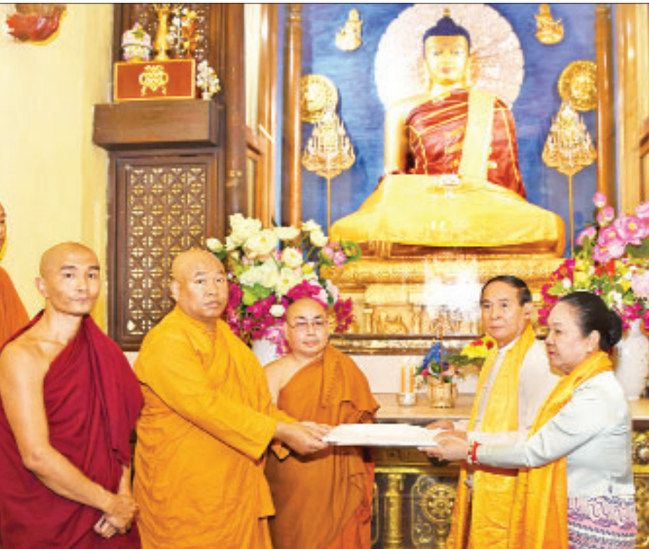
နိုင်ငံတော်သမ္မတ ဦးဝင်းမြင့်နှင့်ဇနီး ဒေါ်ချိုချို ဆရာတော်ထံ အလှူငွေများ ပေးအပ်လှူဒါန်းစဉ်။

အခမ်းအနားအပြီးတွင် နိုင်ငံတော် သမ္မတနှင့်ဇနီးတို့သည် မဟာဗောဓိပင် အား ရွှေဆိုင်များ ဆက်ကပ်လှူဒါန်း ပြီး အဖွဲ့ဝင်များနှင့်အတူ မှတ်တမ်းတင်