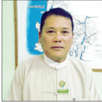
ဦးမျိုးစော် တိုင်းဒေသကြီးဦးစီးမှူး စိုက်ပျိုးရေးဦးစီးဌာန