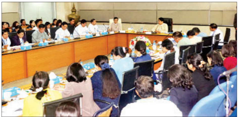
ပြန်ကြားရေးဝန်ကြီးဌာန ပြည်ထောင်စုဝန်ကြီး ဒေါက်တာဖေမြင့် မြန်မာ့အသံနှင့် ရုပ်မြင်သံကြားမှ အစီအစဉ် ထုတ်လုပ်သူများနှင့် တွေ့ဆုံပွဲတွင် လိုအပ်သည်များ ဆွေးနွေးမှာကြားစဉ်။

ညနေပိုင်းတွင် ပြည်ထောင်စုဝန်ကြီး၊ ဒုတိယဝန်ကြီးနှင့် တာဝန်ရှိသူများသည် ဇေယျာသီရိမြို့နယ် ခရေပင်လမ်းခွဲရှိ သတင်းနှင့် စာနယ်ဇင်းလုပ်ငန်း မြန်မာ့အလင်း၊ ကြေးမုံနှင့် နေပြည်တော်သတင်းစာတိုက်တို့မှ ဝန်ထမ်းများ