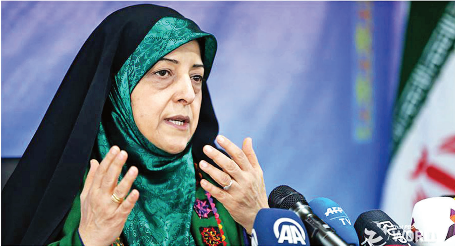
တီဟီရန် ဖေဖော်ဝါရီ ၂၈ အီရန်ဒုတိယသမ္မတ မာဆိုမက်အက်တီကာသည် ကိုရိုနာ ဗိုင်းရပ်စ်ကူးစက်ခြင်းခံထားရကြောင်း ယနေ့ စစ်ဆေး တွေ့ရှိရသည်။ အီရန်အမျိုးသမီးရေးရာကိစ္စရပ်များကို ကိုင်တွယ်ဖြေရှင်း ရသည့် အသက် ၅၉ နှစ်အရွယ် ဒုတိယသမ္မတ မာဆိုမက်

အက်တီကာသည် ဗိုင်းရပ်စ်ပိုးကူးစက်ခြင်းခံရသော ခုနစ် ယောက်မြောက် အရာရှိတစ်ဦးဖြစ်လာသည်။ ရောဂါပိုးရှိ ကြောင်း စစ်ဆေးတွေ့ရှိပြီးနောက် ၎င်း၏နေအိမ်တွင် သီးသန့်ထားရှိကြောင်း သိရသည်။ သမ္မတရိဟာနီအပါ အဝင် အစိုးရအဖွဲ့တာဝန်ရှိသူများနှင့် အစည်းအဝေးတစ်ရပ် ကျင်းပခဲ့ပြီးနောက် တစ်ရက်အကြာတွင် ရောဂါပိုးရှိကြောင်း စစ်ဆေးတွေ့ရှိခဲ့ခြင်းဖြစ်သည်။ သို့သော် ရောဂါလက္ခဏာ များ ပြင်းထန်ခြင်းမရှိသေးကြောင်း အီရန်သတင်းအေဂျင်စီ က ဆိုသည်။ အက်တီကာသည် ၁၉၇၉ ခုနှစ်က အမေရိကန်နိုင်ငံ သား ၅၂ ဦးအား ၄၄၄ ရက်တိုင်တိုင် ဓားစာခံအဖြစ် ဖမ်းဆီး ထားမှုတွင် အီရန်ကျောင်းသားများ၏ ပြောရေးဆိုခွင့်ရှိသူ အဖြစ် စေတနာ့ဝန်ထမ်းလုပ်ဆောင်ခဲ့သည်။ အဆိုပါ အရေးကိစ္စနှင့်ပတ်သက်ပြီး အက်တီကာသည် လူသိများ ကျော်ကြားလာခဲ့သည်။ အလားတူ အသက် ၈၁ နှစ်ရှိပြီဖြစ်သည့် ဗာတီကန်နှင့် အီဂျစ်နိုင်ငံများဆိုင်ရာ အီရန်သံအမတ်ကြီးဟောင်း ဟာဒီ ခိုရိုရာဟီသည် ကိုရိုနာဗိုင်းရပ်စ်ပိုး ကူးစက်ခြင်းခံရကာ