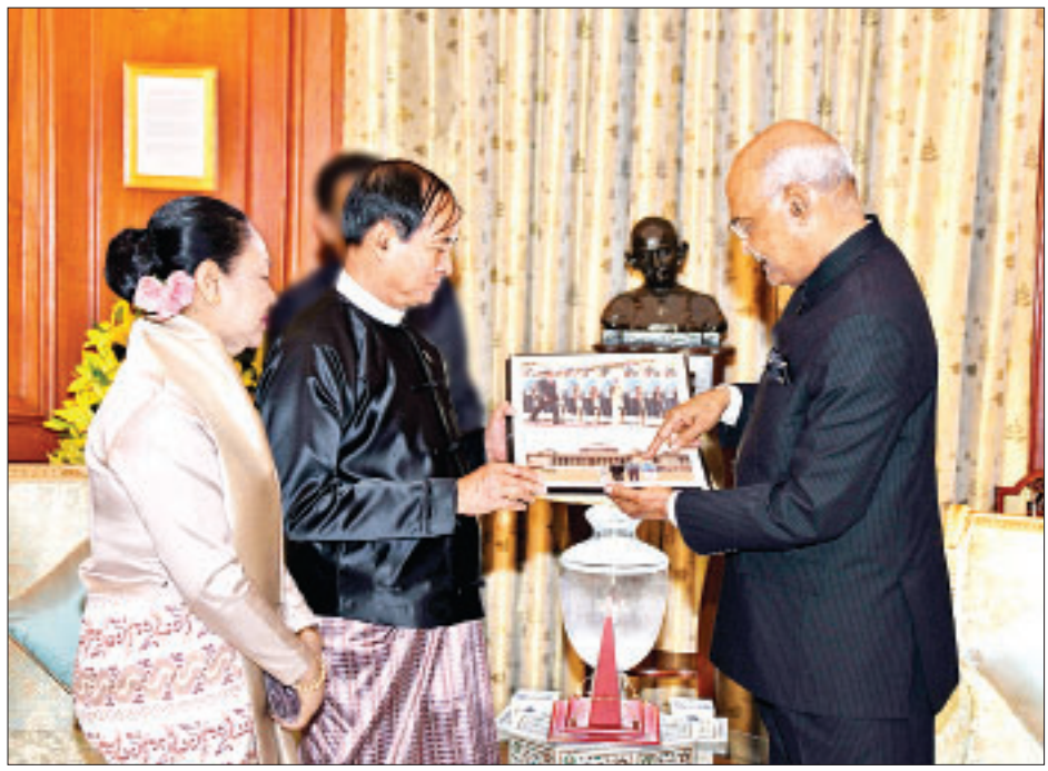
နိုင်ငံတော်သမ္မတ ဦးဝင်းမြင့်ထံ အိန္ဒိယသမ္မတနိုင်ငံ သမ္မတ ရှုရီ ရမ် နက်သ် ကိုဗစ်ဒီကာ ဓာတ်ပုံမှတ်တမ်းအယ်လ်ဘမ် ပေးအပ်စဉ်။

အိန္ဒိယပြည်သူများ၏ လူနေမှုအဆင့် အတန်း မြှင့်တင်နိုင်သည့်အတွက် အားရမိပါကြောင်း၊ အနာဂတ်ကာလ တွင်လည်း အိန္ဒိယခေါင်းဆောင်များ၏ ပြောင်မြောက်သည့် ဦးဆောင်မှုများ နှင့် အိန္ဒိယပြည်သူများအနေဖြင့် ပိုမို တိုးတက် သာယာဝပြောမှုများကို ဆက်လက်ရရှိခံစားနိုင်မည်ဟု မိမိ အနေဖြင့် စစ်မှန်စွာ ယုံကြည်ပါ ကြောင်း။