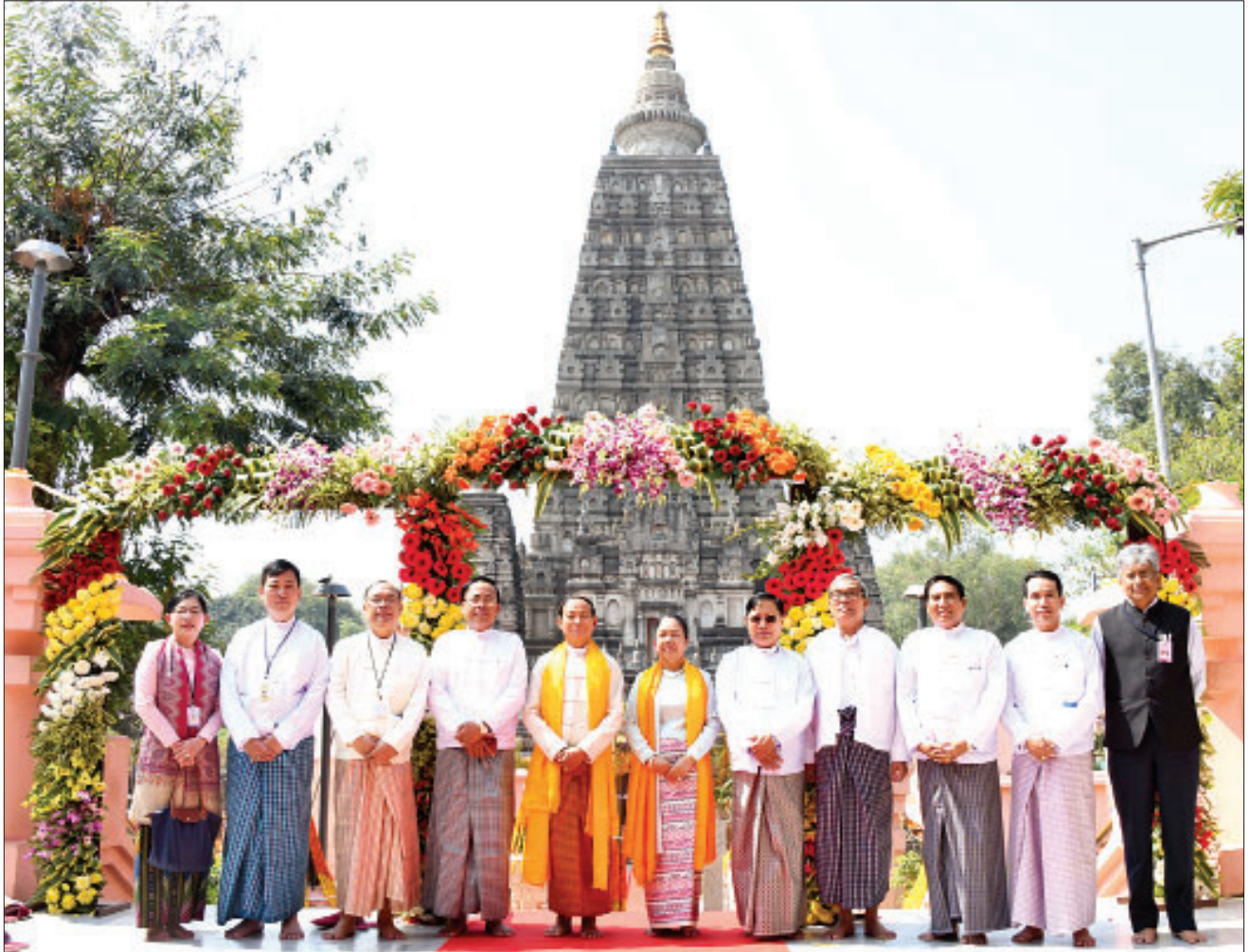
နိုင်ငံတော်သမ္မတ ဦးဝင်းမြင့်နှင့်ဇနီး ဒေါ်ချိုချို၊ ပြည်ထောင်စုဝန်ကြီး ဦးကျော်တင်၊ သူရဦးအောင်ကို၊ ဦးသန့်စင်မောင်၊ ရခိုင်ပြည်နယ်ဝန်ကြီးချုပ် ဦးညီပုနှင့် အဖွဲ့ဝင်များ စုပေါင်းမှတ်တမ်းတင်ဓာတ်ပုံရိုက်စဉ်။

ထို့နောက် နိုင်ငံတော်သမ္မတနှင့်ဇနီးတို့သည် ဗုဒ္ဓကယာမြန်မာ ကျောင်းတိုက်အုပ်ဆရာတော်နှင့် တာဝန်ရှိသူများ၊ ကိုယ်စားလှယ်အဖွဲ့ ဝင်များ၊ ဂျပန်ဘုရားမှ တာဝန်ရှိသူများနှင့်အတူ စုပေါင်းမှတ်တမ်းတင် ဓာတ်ပုံရိုက်ကာ မော်တော်ယာဉ်များဖြင့် ခေတ္တတည်းခိုမည့် Mahabodhi ဟိုတယ်သို့ ပြန်လည်ရောက်ရှိကြပြီး ညအိပ်ရပ်နားကြ သည်။