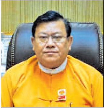
ဦးလှမိုးအောင် တိုင်းဒေသကြီးဝန်ကြီးချုပ် ဧရာဝတီတိုင်းဒေသကြီး