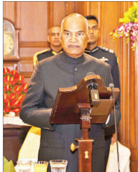
အိန္ဒိယသမ္မတနိုင်ငံ သမ္မတ ရှုရီ ရမ် နက်သ် ကိုဗင့်ဒိ ဂုဏ်ပြုညစာစားပွဲတွင် မိန့်ခွန်းပြောကြားစဉ်။

အစိတ်အပိုင်းများအဖြစ် အစဉ်တည်ရှိ လာခဲ့ကြပါကြောင်း၊ လူကြီးမင်းတို့ကို မိသားစုဝင်များကဲ့သို့ ကြိုဆိုဇဉ်ဝတ် ပြုရသည့်အတွက် ဝမ်းမြောက်ဝမ်းသာ ရှိလှပါကြောင်း။