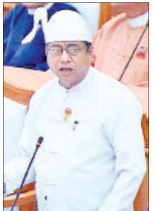
ဒုတိယဝန်ကြီး ဦးတင်လတ်

သော ပြည်ပရင်းနှီးမြှုပ်နှံမှုများကို ဖိတ်ခေါ်လျက်ရှိခြင်းတို့ကြောင့် ပြည်တွင်းမှ လုပ်ငန်းရှင်များအတွက်လည်း စီးပွားရေးအခွင့်အလမ်းများ ပိုမိုပွင့်လန်းလာပြီး အမျိုးအစားစုံသော စီးပွားရေးလုပ်ငန်းများသည် နေ့စဉ်ပေါ်ထွန်းလာနေပြီ ဖြစ်ပါကြောင်း၊ ကုမ္ပဏီများ၊ တစ်ဦးတည်းပိုင်လုပ်ငန်းရှင်စသည်ဖြင့် အခွန်စည်းကြပ်ရမည့်လုပ်ငန်းများ များပြားလာသကဲ့သို့ အစိုးရကဏ္ဍ၊ ပုဂ္ဂလိကကဏ္ဍ လစာဝန်ထမ်း/အခွန်ထမ်းများအနေဖြင့်လည်း တစ်နေ့တခြား တိုးတက်လာနေသည်ကို တွေ့ရမည်ဖြစ်ပါကြောင်း။