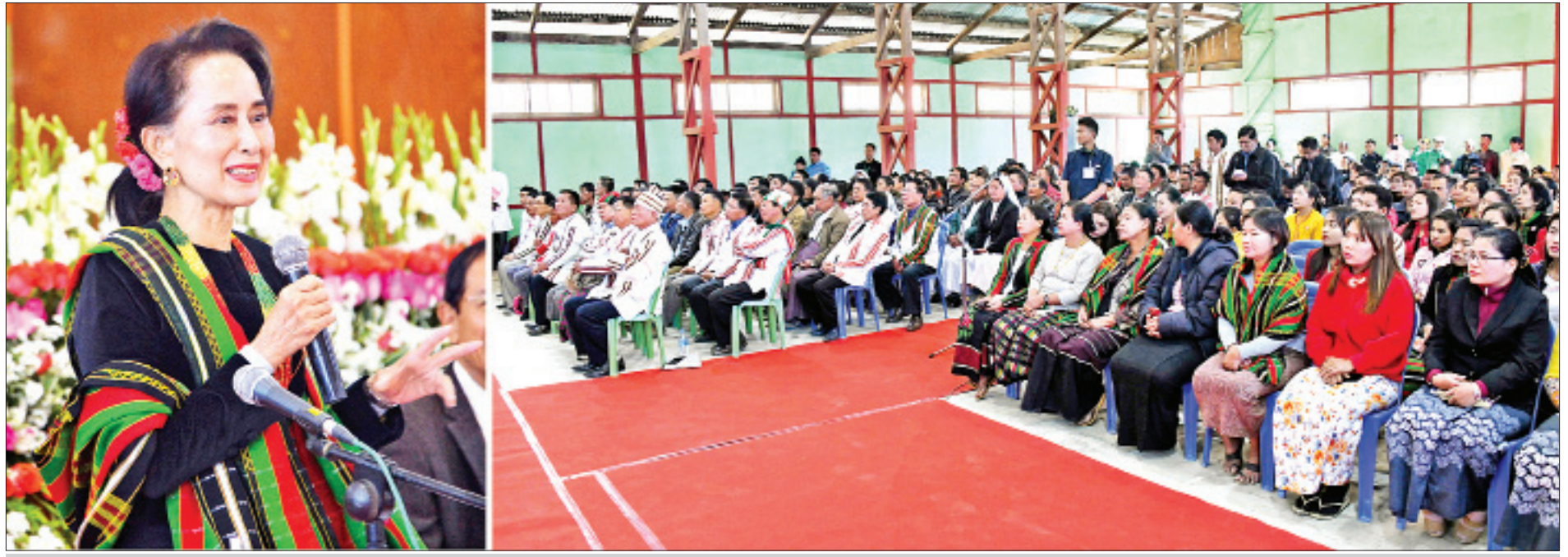
နိုင်ငံတော်၏အတိုင်ပင်ခံပုဂ္ဂိုလ် ဒေါ်အောင်ဆန်းစုကြည် တွန်းဖီမြို့နယ် ဒေသခံပြည်သူများနှင့် တွေ့ဆုံပွဲတွင် အမှာစကားပြောကြားစဉ်။

❖ နိုင်ငံတော်၏အတိုင်ပင်ခံပုဂ္ဂိုလ်မှ နိုင်ငံတော်၏အတိုင်ပင်ခံပုဂ္ဂိုလ်နှင့် အဖွဲ့အား စစ်ကိုင်းတိုင်းဒေသကြီး ဝန်ကြီးချုပ် ဒေါက်တာမြင့်နိုင်၊ ချင်း ပြည်နယ်ဝန်ကြီးချုပ် ဦးဆလင်းလျန် လွယ်၊ တိုင်းဒေသကြီး ဝန်ကြီးများ၊ ပြည်နယ်ဝန်ကြီးများ၊ တာဝန်ရှိသူများ၊ မြို့မိမြို့ဖများ၊ ဒေသခံတိုင်းရင်းသား တိုင်းရင်းသားများက ကလေးလေဆိပ်၌ ကြိုဆိုနှုတ်ဆက်ကြသည်။