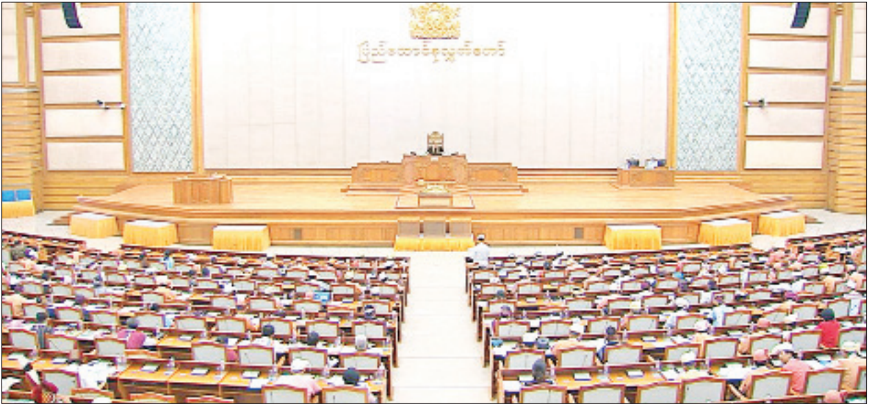
ဒုတိယအကြိမ် ပြည်ထောင်စုလွှတ်တော် (၁၅)ကြိမ်မြောက်ပုံမှန်အစည်းအဝေး ဒသမနေ့ကျင်းပစဉ်။