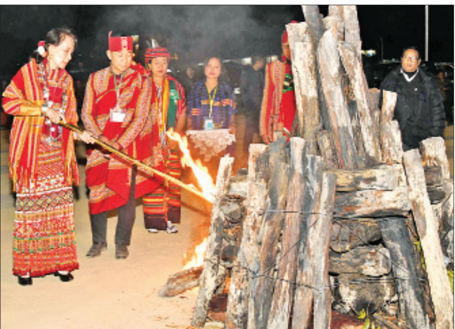
နိုင်ငံတော်၏အတိုင်ပင်ခံပုဂ္ဂိုလ် ဒေါ်အောင်ဆန်းစုကြည် (၇၂)နှစ်မြောက် ချင်းအမျိုးသားနေ့အကြိုညာမီးပုံပွဲ ကို မီးရှူးတိုင်ဖြင့် ထွန်းညှိဖွင့်လှစ်ပေးစဉ်။

ပူးပေါင်းပြီး ဆောင်ရွက် လွတ်လပ်ရေးရဖို့အတွက် တိုင်းရင်း သားအားလုံးက ပူးပေါင်းပြီး ဆောင်ရွက်မှ မြန်မြန်ရနိုင်မယ်ဆိုတာ ကို ဒီလိုယုံကြည်ချက်နဲ့ ဒီပင်လုံ စာချုပ်ကို လက်မှတ်ထိုးခဲ့တယ်။ လွတ်လပ်ရေးရဖို့ဆိုတာထက် နိုင်ငံ တစ်နိုင်ငံအတွက် ပိုပြီးတော့ အရေးကြီးတဲ့ကိစ္စ မရှိပါဘူး။ နိုင်ငံ တစ်နိုင်ငံဟာ လွတ်လပ်မှု အချုပ်အခြာ အာဏာပိုင်နိုင်ငံဖြစ်မှ ကိုယ့်ကိုကြံမ္မာ ကို ကိုယ်ဖန်တီးနိုင်မှာပါ။ ဒါဟာ ကျွန်မတို့ လွတ်လပ်ရေးခေါင်းဆောင် ကြီးရဲ့ ကြွေးကြော်သံပဲဖြစ်ပါတယ်။ ကိုယ့်ကိုကြံမ္မာကို ကိုယ်ဖန်တီးရမယ် ကိုယ့်ကိုကြံမ္မာဟာသူများ လက်ထဲ မှာ မရှိရဘူး။ ဒါပေမယ့် လွတ်လပ်ရေးရပြီးတဲ့ နောက်ပိုင်းမှာ ကျွန်မတို့ညီညွတ်ရေး ကို အခုထက်ထိမတည်ဆောက်နိုင် သေးဘူး။ အပြည့်အဝ မတည်ဆောက် တည်ဆောက်လို့မရတယ်။ အပြည့် အဝ တည်ဆောက်လို့မရသေးဘူး။ အဲဒီတော့ ဒီလိုညီညွတ်ရေးကို ကျွန်မ တို့ တည်ဆောက်လို့မရတဲ့အကြောင်း ရင်းက ဘာလဲဆိုတာကို ကျွန်မတို့ တစ်ဦးချင်း တစ်ဦးချင်းကို စဉ်းစား စေချင်ပါတယ်။ အခု ကျွန်မတို့နိုင်ငံမှာ ဆိုရင် ကိုးကွယ်တဲ့ဘာသာအမျိုးမျိုး၊ ပြောတဲ့ ဘာသာစကားအမျိုးမျိုး၊ ဒီတိုင်းရင်းသားလူမျိုးအမျိုးမျိုး၊ ဒီ အမျိုးမျိုးတွေဟာ ဘာဖြစ်လို့ အေးအေးဆေးဆေး ညီညီညွတ်ညွတ် နဲ့ မနေနိုင်ရမှာလဲ။ အခု ကိုးကွယ်တဲ့ ဘာသာမှာဆိုရင် ခရစ်ယာန်ဘာသာ ဟာဆိုတာ မြန်မာနိုင်ငံကနေ ပေါက်ဖွားလာတာ မဟုတ်ပါဘူး။ ပြောမယ်ဆိုရင် ဗုဒ္ဓဘာသာဆိုရင် လည်း မြန်မာနိုင်ငံကနေပေါက်ဖွား လာတာမဟုတ်ပါဘူး။ အဲဒီတော့ ကျွန်မ တို့ ကိုးကွယ်တဲ့ဘာသာအရ စိတ်ဝမ်း