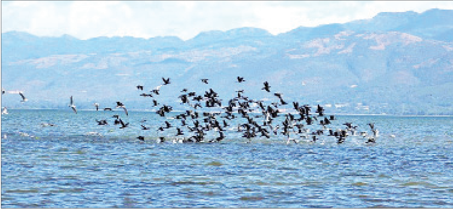
အင်းလေးကန်တောရိုင်းတိရစ္ဆာန်ဘေးမဲ့တောအတွင်း တွေ့ရှိရသည့် ရေပျော်ငှက်များကိုတွေ့ရစဉ်။

နေပြည်တော် ဖေဖော်ဝါရီ ၁၉ ၂၀၂၀ ပြည့်နှစ် ဖေဖော်ဝါရီ ၂ ရက်တွင် ကျရောက်သည့် ကမ္ဘာ့ရေဝပ်ဒေသများနေ့၌ ပြည်ထောင်စုသမ္မတ မြန်မာနိုင်ငံတော်အစိုးရ သည် အင်းလေးကန်တောရိုင်းတိရစ္ဆာန်ဘေးမဲ့ တောအား အရှေ့အာရှ - ဩစတြေးလျအာရှ ရွှေ့ပြောင်းကျက်စားသည့် ငှက်ပျံသန်းရာ လမ်းကြောင်း ကွန်ရက်နယ်မြေ- EAAF (အီးအေအေအက်ဖ်အမှတ်၊ ၁၄၇)အဖြစ် သတ်မှတ်ကြောင်းကြေညာလိုက်သည့်အတွက် အင်းလေးကန်တောရိုင်းတိရစ္ဆာန်ဘေးမဲ့တော သည် မြန်မာနိုင်ငံ၏ ဆဋ္ဌမမြောက် အရှေ့ အာရှ - ဩစတြေးလျအာရှ ရွှေ့ပြောင်းကျက် စားသည့် ငှက်ပျံသန်းရာ လမ်းကြောင်းကွန်ရက် နယ်မြေဖြစ်လာကြောင်း သိရသည်။ “ဂေဟစနစ်ဝန်ဆောင်မှု အမျိုးမျိုးပေးစွမ်း လျက်ရှိပြီး ဘေးမဲ့တောအနီးရှိ ဒေသခံ နှစ်သိန်းကျော်အား အစားအစာနှင့် အသက်မွေး ဝမ်းကျောင်းလုပ်ငန်းများအတွက် ပံ့ပိုးပေးရာ နေရာတစ်ခုဖြစ်သည့် အင်းလေးကန်တောရိုင်း တိရစ္ဆာန်ဘေးမဲ့တောအား မြန်မာနိုင်ငံ၏ စာမျက်နှာ ၁၆ ကော်လံ ၁ သို့ ★