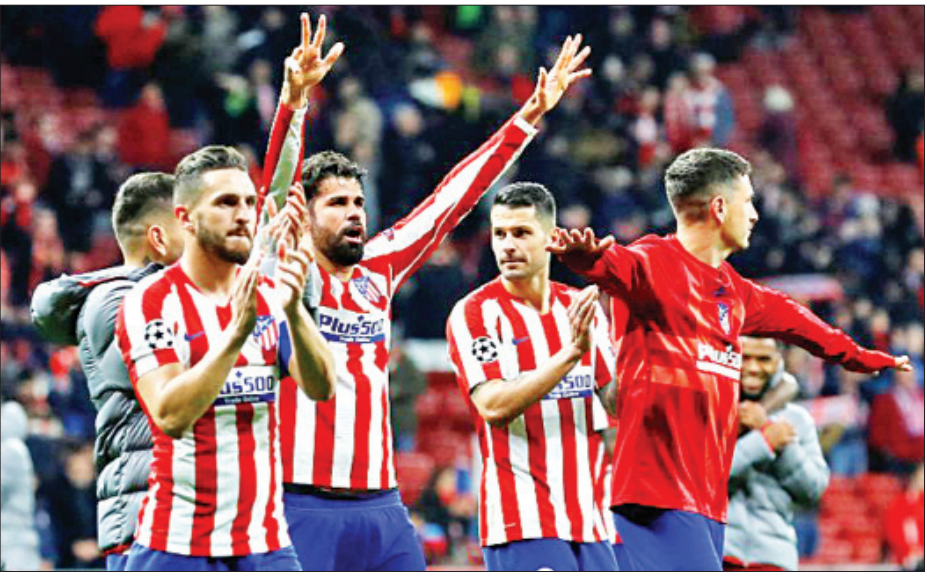
ပွဲကြိုခဲ့ရတာဖြစ်ပြီး လေးပွဲသာ အနိုင်ရရှိခဲ့တာဖြစ်ပါတယ်။ အခုလီဗာပူးအသင်းကို အနိုင်ရရှိခဲ့တဲ့ အက်သလက်

ပရီမီယာလိဂ်ကလပ် လီဗာပူးအသင်းနဲ့ စပိန်လာလီဂါ ကလပ် အက်သလက်တီကိုမက်ဒရစ် အသင်းတို့ဟာ ချန်ပီယံ လိဂ်ပြိုင်ပွဲရဲ့ ၁၆ သင်းအဆင့် ပထမအကျော့ပွဲစဉ်အဖြစ် ယှဉ်ပြိုင်ကစားခဲ့ရာမှာ အက်သလက်တီကိုမက်ဒရစ် အသင်းက လက်ရှိချန်ပီယံလိဂ် လီဗာပူးအသင်းကို ဆာအူးလ်နီကတ်စ်ရဲ့ တစ်လုံးတည်းသောသွင်းဂိုးနဲ့ အနိုင် ရရှိခဲ့ပါတယ်။