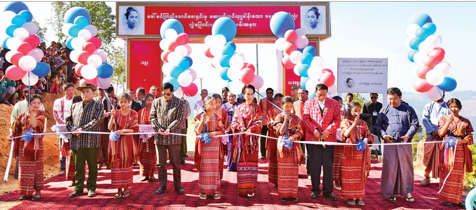
နိုင်ငံတော်၏အတိုင်ပင်ခံပုဂ္ဂိုလ် ဒေါ်အောင်ဆန်းစုကြည်၊ ပြည်ထောင်စုဝန်ကြီး ဦးမင်းသူ၊ ပြည်ထောင်စုဝန်ကြီး ဒုတိယဗိုလ်ချုပ်ကြီးရဲအောင်၊ ပြည်နယ်ဝန်ကြီးချုပ် ဦးဆလှိုင်လှိုင်နှင့် ဒေါ်ခင်ကြည်ဖောင်ဒေးရှင်းမှ အမှုဆောင် ဩဇာကြားရေးမှူး ဦးမိုးဇော်ဦးတို့က ဒေါ်ခင်ကြည်ဖောင်ဒေးရှင်းမှ ဆောက်လုပ်လှူဒါန်းသော နေအိမ်အလုံး ၅၀ လွှဲပြောင်းပေးအပ်ပွဲအခမ်းအနားကို ဖဲကြိုးဖြတ်ဖွင့်လှစ်ပေးကြစဉ်။

ထန်တလန် ဖေဖော်ဝါရီ ၁၉ နယ်စပ်ဒေသနှင့် တိုင်းရင်းသားလူမျိုးများ ဖွံ့ဖြိုးတိုးတက် ရေး ဗဟိုကော်မတီဥက္ကဋ္ဌ နိုင်ငံတော်၏အတိုင်ပင်ခံပုဂ္ဂိုလ် ဒေါ်အောင်ဆန်းစုကြည်သည် ယနေ့တွင် ချင်းပြည်နယ် တွန်းဇံမြို့နယ်နှင့် ထန်တလန်မြို့နယ်တို့မှ ဒေသခံပြည်သူ များနှင့်တွေ့ဆုံပြီး သီကီးရ်ကျေးရွာ တိုက်နယ်ဆေးရုံဖွင့်ပွဲနှင့် ဒေါ်ခင်ကြည်ဖောင်ဒေးရှင်းမှ လှူဒါန်းသော နေအိမ် အလုံး