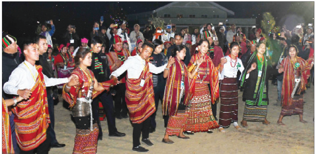
နိုင်ငံတော်၏အတိုင်ပင်ခံပုဂ္ဂိုလ် ဒေါ်အောင်ဆန်းစုကြည် (၇၂)နှစ်မြောက် ချင်းအမျိုးသားနေ့အကြိုညာမီးပုံပွဲတွင် ပါဝင်ဆင်နွှဲစဉ်။