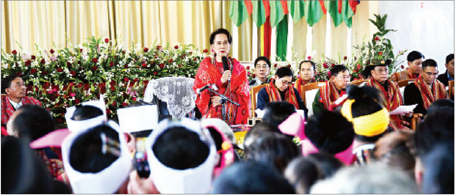
နိုင်ငံတော်၏အတိုင်ပင်ခံပုဂ္ဂိုလ် ဒေါ်အောင်ဆန်းစုကြည် ထန်တလန်မြို့ ဒေသခံပြည်သူများနှင့် တွေ့ဆုံစဉ်။

ငြိမ်းချမ်းရေးနဲ့ ဒွန်ဒွန်ပြီး ကျွန်မတို့ဟာ ဖွံ့ဖြိုးရေးလုပ်ငန်းတွေကို အကောင်အထည်ဖော်သွားရမှာပါ။ ဒါနဲ့ ပတ်သက်လို့ ပြောရမယ်ဆိုရင် ကျွန်မဘယ်ပုံသွားသွား၊ ပြည်သူတွေနဲ့ တွေ့တဲ့အခါ ပြည်သူတွေရဲ့ မေးခွန်းတွေ၊ တင်ပြချက်တွေကို တောင်းခံပါတယ်။ တောင်းခံရတဲ့အကြောင်းရင်းက နိုင်ငံရဲ့ နေရာဒေသအသီးသီးမှာ