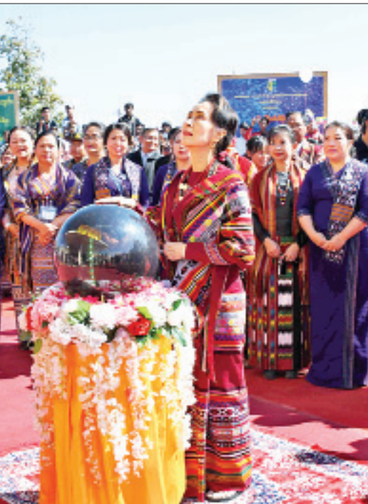
နိုင်ငံတော်၏အတိုင်ပင်ခံပုဂ္ဂိုလ် ဒေါ်အောင်ဆန်းစုကြည် သီကီးရ်ကျေးရွာ တိုက်နယ်ဆေးရုံဆိုင်ခွတ်ကို စက်ခလုတ်နှိပ် ဖွင့်လှစ်ပေးစဉ်။