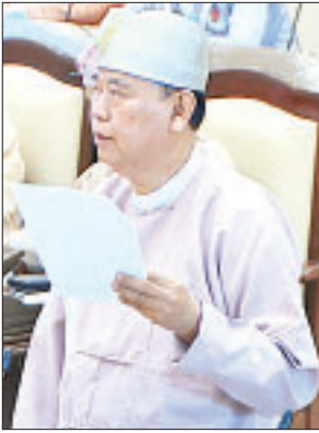
ဒုတိယဝန်ကြီး ဦးဝင်းမော်ထွန်း

မွန်ပြည်နယ် မဲဆန္ဒနယ်အမှတ်(၁၁)မှ ဦးလှမြင့် (ခ) ဦးလှမြင့်သန်း၏ မွန်ပြည်နယ် ကျိုက်ထိုမြို့နယ် ကျိုက်ပိကျေးရွာ အခြေခံပညာအလယ်တန်း ကျောင်းရှိ အန္တရာယ်ရှိကျောင်းဆောင်ကို ဖျက်သိမ်းပြီး နှစ်ထပ်ကျောင်းဆောင် တစ်ဆောင် အသစ်ဆောက်လုပ်ပေးရန် အစီအစဉ် ရှိ/ မရှိ မေးခွန်းနှင့်စပ်လျဉ်း၍ ဒုတိယဝန်ကြီး ဦးဝင်းမော်ထွန်းက ကျိုက်ထိုမြို့နယ် ကျိုက်ပိကျေးရွာ အခြေခံ ပညာအလယ်တန်းကျောင်းတွင် ပေ(၁၁၀ x ၃၀) နှစ်ထပ်ဆောင် အသစ် တစ်ဆောင် ဆောက်လုပ်ရန်အတွက် လိုအပ်သောရန်ပုံငွေကို ၂၀၂၀ - ၂၀၂၁ ဘဏ္ဍာနှစ် ငွေလုံးငွေရင်းတည်ဆောက်ရေးရန်ပုံငွေ ခေါင်းစဉ်အောက်တွင် ဦးစားပေးအစီအစဉ်အရ စိစစ်လျာထားဆောင်ရွက်ပြီး ဖြစ်ပါကြောင်းနှင့် ဘဏ္ဍာငွေခွင့်ပြုချက်ရရှိပါက ကျောင်းဆောင်အသစ်ဆောက်လုပ်ပေးရန် အစီအစဉ်ရှိပါကြောင်း ဖြေကြားသည်။