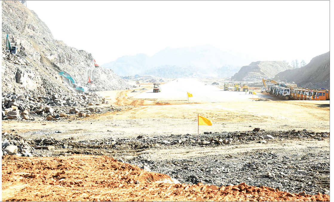
ဒုတိယသမ္မတ ဦးဟင်နရီဗန်ထီးယူ ဆူရဘုန်လေဆိပ် တည်ဆောက်နေမှုကို ကြည့်ရှုစစ်ဆေးစဉ်။