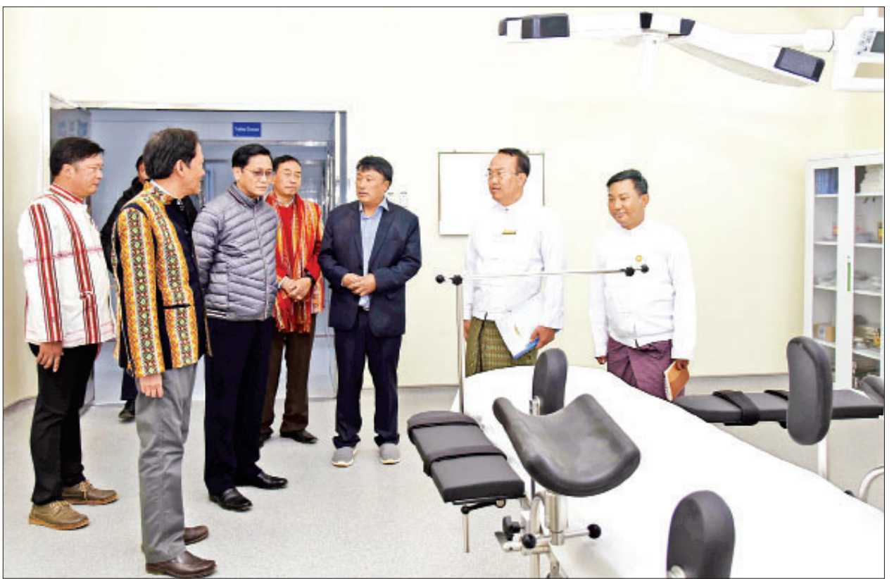
ဒုတိယသမ္မတ ဦးဟင်နရီဗန်ထီးယူ ထန်တလန်မြို့နယ် သိကီးရ်ကျေးရွာ သိကီးရ် ၁၆ ခုတင်ဆုံ တိုက်နယ်ဆေးရုံတွင် ကြည့်ရှုစစ်ဆေးစဉ်။

အဆိုပါ လေဆိပ်သည် ချင်းပြည်နယ်အလယ်ပိုင်းတွင် တည်ရှိပြီး ဖလမ်း မြို့၊ လုံပီးတောင်၊ ဟားခါ၊ ထန်တလန်၊ တီးတိန်နှင့် ရိခဲရေကန် စသည့် ပြည်နယ်၏ မြို့ကြီးများနှင့် ခရီးသွားလည်ပတ်ရန်နေရာများကို အချိန်တိုအတွင်း လာရောက် လည်ပတ်နိုင်သည့်အပြင် မြန်မာနိုင်ငံတစ်ဝန်းရှိ တိုင်းဒေသကြီးနှင့် ပြည်နယ်