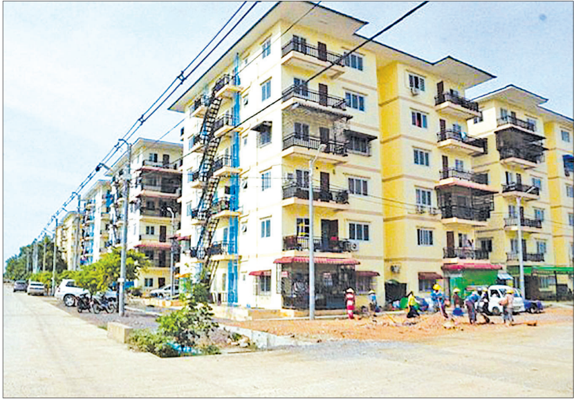
မြရည်နန္ဒာ တန်ဖိုးမျှတအိမ်ရာတိုက်ခန်းများကို တွေ့ရစဉ်။

မန္တလေးမြို့ ခြောက်မြို့နယ်အတွင်း တာဝန် ထမ်းဆောင်လျက်ရှိသော နိုင်ငံဝန်ထမ်းများ၊ အငြိမ်းစားဝန်ထမ်းများ၊ ကုမ္ပဏီဝန်ထမ်းများနှင့် ပြည်သူများအားရောင်းချပေးခဲ့ရာ အရပ်ဘက်နိုင်ငံ ဝန်ထမ်း ၃၈၂၄ စောင်၊ အငြိမ်းစားဝန်ထမ်း ၉၂၉ စောင်၊ ကုမ္ပဏီဝန်ထမ်း အစောင် ၄၇၀၊ ပြည်သူ ၁၂၀၀ စောင် စုစုပေါင်း ဝယ်ယူသွားသည့်လျှောက်လွှာ ၆၄၂၃ စောင် ရှိသည်။ စာမျက်နှာ ၁၆ ကော်လံ ၁ သို့ *