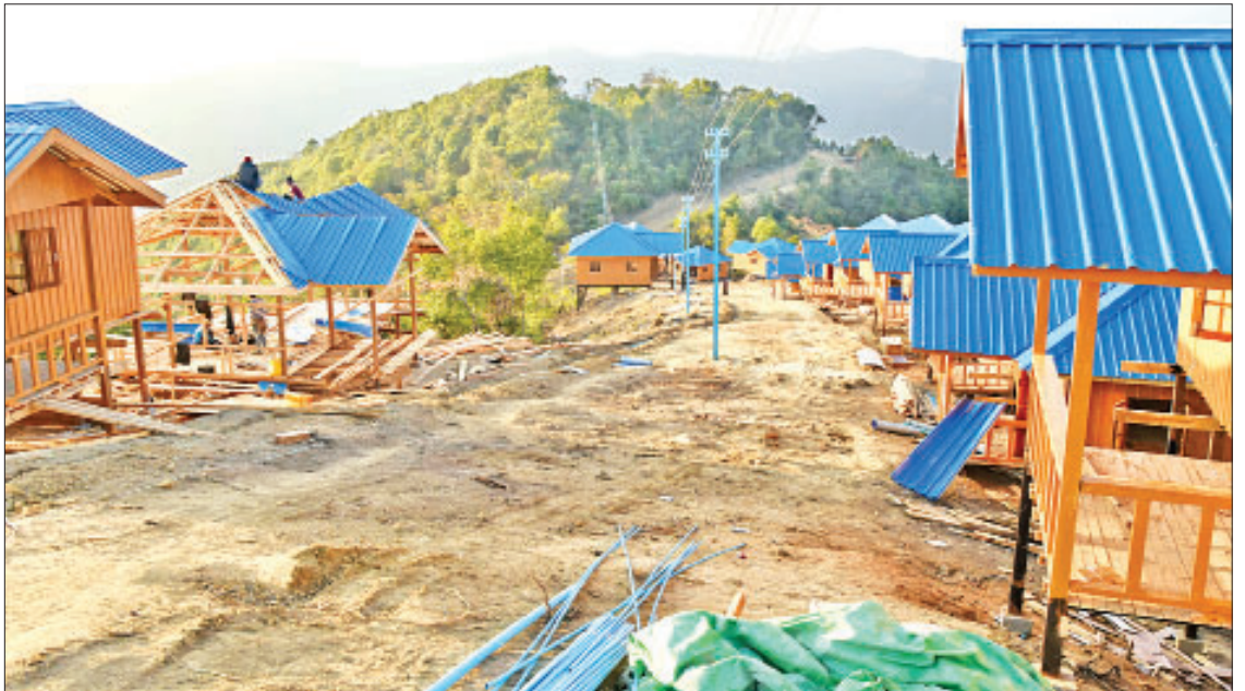
ဒုတိယသမ္မတ ဦးဟင်နရီဗန်ထီးယူ ပလက်ဝမြို့နယ်မှ တိုက်ပွဲရှောင်ပြည်သူများအတွက် သိကီးရ်ကျေးရွာ၌ ဒေါ်ခင်ကြည်ဖောင်ဒေးရှင်းမှ လှူဒါန်းသော နေအိမ်များတည်ဆောက်နေမှုကို ကြည့်ရှုစစ်ဆေးစဉ်။

* ရှေ့ဖိုးမှ လုပ်ငန်းပြီးစီးမှု၊ လေကြောင်းလျှပ်စစ်နှင့် လေကြောင်းဆက်သွယ်ရေးစက်ပစ္စည်း တပ်ဆင်ခြင်းဆောင်ရွက်နေမှု၊ မြေတူးဖြတ်ခြင်းလုပ်ငန်းဆောင်ရွက်နေမှု၊ လေယာဉ်ပြေးလမ်း ပေ ၆၀၀၀ အား ကျောက်ကတ္တရာခင်းခြင်းလုပ်ငန်း ဆောင်ရွက်ပြီးစီးမှု၊ ကျောက်စိမ့်ထိန်းနံရံများ ဆောင်ရွက်ပြီးစီးမှု၊ လေဆိပ် အဆောက်အအုံတည်ဆောက်ပြီးစီးမှု၊ လေကြောင်းထိန်းမောင်းစင်နှင့် မီးသတ် အဆောက်အအုံဆောင်ရွက်ပြီးစီးမှု၊ ဆူရဲဘုန်လေဆိပ်၌ တပ်ဆင်မည့် လေကြောင်းလမ်းညွှန်စက်နှင့် ဆက်သွယ်ရေးစက်ပစ္စည်းများ ရောက်ရှိမှုအခြေ အနေ၊ မိုးလေဝသဆိုင်ရာအချက်အလက်များ အလိုအလျောက်ပေးပို့ စက်ပစ္စည်း ရောက်မှု၊ လေဆိပ်ပိုင်မြေအမည်ပေါက်ရရှိရေး ဆောင်ရွက်ပြီးစီးမှုတို့နှင့် စပ်လျဉ်း၍ ရှင်းလင်းတင်ပြသည်။