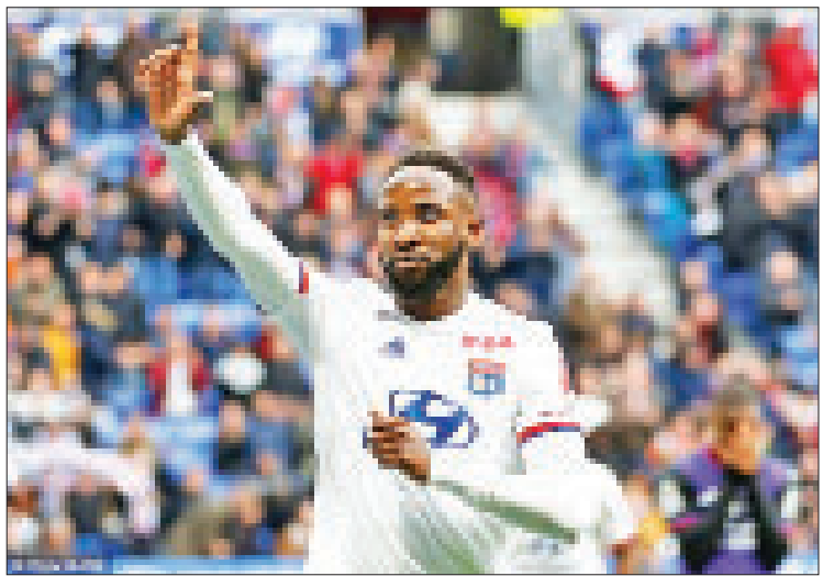
ငွေကြယ် ရေးသားသည်

သမား မခေါ်ယူနိုင်ခဲ့ခြင်းကလည်း မန်ယူ အသင်းရဲ့ရလဒ်ပိုင်းကို အပြောင်းအလဲ ဖြစ်စေ ခဲ့တယ်လို့လည်း နည်းပြဆိုးရှားက ယုံကြည် ထားတာဖြစ်ပါတယ်။