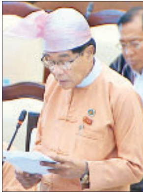
မွန်ပြည်နယ် မဲဆန္ဒနယ်အမှတ်(၁၁)မှ ဦးလှမြင့်(ခ)ဦးလှမြင့်သန်း

လည်းကောင်း၊ မိန်းပန်းကျေးရွာအုပ်စုရှိ မိန်းပန်းကျေးရွာ အခြေခံပညာမူလတန်း ကျောင်းအား အခြေခံပညာမူလတန်း(လွန်)ကျောင်းအဖြစ်လည်းကောင်း အဆင့် တိုးမြှင့်ပေးရန် အစီအစဉ် ရှိ/ မရှိ မေးခွန်းနှင့်စပ်လျဉ်း၍ ဒုတိယဝန်ကြီး ဦးဝင်းမော်ထွန်းက လွှတ်တော်ကိုယ်စားလှယ်တင်ပြထားသည့် ဟိုပန်မြို့နယ် ရွှေဝါကျေးရွာ အခြေခံပညာအလယ်တန်းကျောင်းနှင့် မိန်းပန်းကျေးရွာ အခြေခံ ပညာမူလတန်းကျောင်းတို့ကို ကျောင်းအဆင့်မြှင့်တင်ရေးမူများနှင့် စိစစ်ပြီး အဆင့်မြှင့်တင်ဆောင်ရွက်ပေးမည်ဖြစ်ပါကြောင်း ဖြေကြားသည်။