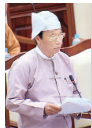
ဒုတိယဝန်ကြီး ဦးလှကျော်