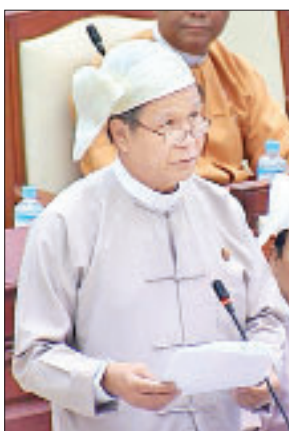
ဒုတိယဝန်ကြီး ဦးအောင်ထူး

ကင်းသည့် အိမ်ထောင်စုများကို မြေယာလျော်ကြေး၊ သီးနှံ လျော်ကြေးနှင့် လူမှုရေးအရ ထောက်ပံ့မှုများကို အဆင့် အလိုက် ပွင့်လင်းမြင်သာစွာ စီစဉ်ဆောင်ရွက်ပေးလျက်ရှိ ပါကြောင်း။ သို့ပါ၍ မြို့ပြနှင့်အိုးအိမ်ဦးစီးဌာနက လွှဲပြောင်းပေးထားသည့် မြေနှင့် လက်ရှိအသုံးချပြီး ကျန်ရှိနေသည့်မြေများကို သီလဝါအထူးစီးပွားဇုန် စီမံခန့်ခွဲမှု ကော်မတီက နောက်ထပ်ပြောင်းရွှေ့လာမည့် အိမ်ထောင်စု