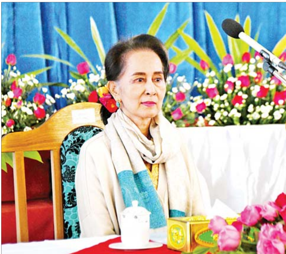
နိုင်ငံတော်၏အတိုင်ပင်ခံပုဂ္ဂိုလ် ဒေါ်အောင်ဆန်းစုကြည် ဗိုလ်ချုပ်အောင်ဆန်း၏ (၁၀၅)နှစ်မြောက်မွေးနေ့အထိမ်းအမှတ်အဖြစ် အာဟာရကျွေးမွေးခြင်းအခမ်းအနားသို့ တက်ရောက်စဉ်။