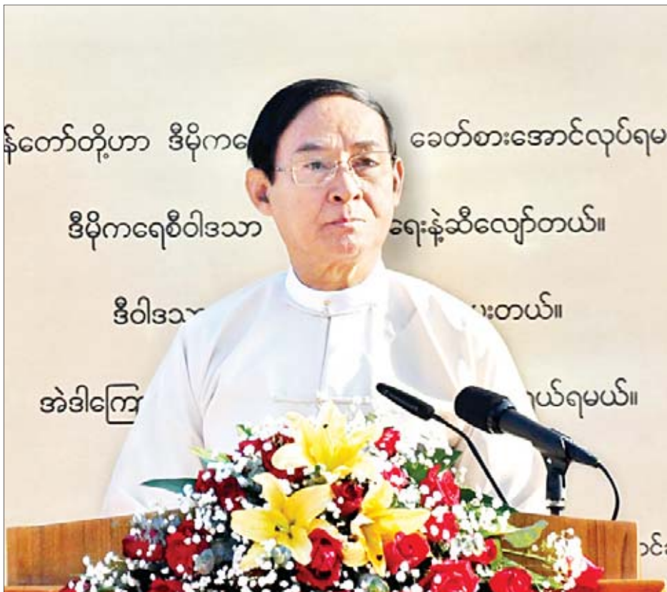
နိုင်ငံတော်သမ္မတဦးဝင်းမြင့် ဗိုလ်ချုပ်အောင်ဆန်းကြေးရုပ်တုဖွင့်ပွဲအခမ်းအနားတွင် မိန့်ခွန်းပြောကြားစဉ်။