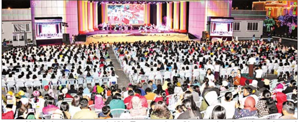
များ၊ ဌာနဆိုင်ရာဝန်ထမ်းများ၊ ကျောင်းသားကျောင်းသူများနှင့် ဖိတ်ကြားထားသူများ တက်ရောက်ကြသည်။ ဖျော်ဖြေပွဲအခမ်းအနားကို မြန်မာ့အသံနှင့် ရုပ်မြင်သံကြားမှ တေးသံရှင်များက မြန်မာ့အသံနှင့် ရုပ်မြင်သံကြားတီးဝိုင်းအဖွဲ့နှင့် တွဲဖက်ကာ “ရွှေအဆင်းနဲ့ ပြည်မြန်မာ” တေးသီချင်းဖြင့် သီဆိုဖွင့်လှစ်သည်။

နေပြည်တော် ဖေဖော်ဝါရီ ၁၃ ယနေ့ကျရောက်သည့် ပြည်ထောင်စု၏ ဗိသုကာ အမျိုးသားခေါင်းဆောင်ကြီး ဗိုလ်ချုပ်အောင်ဆန်း၏ (၁၀၅)နှစ်မြောက် မွေးနေ့အထိမ်းအမှတ်နှင့် နေပြည်တော် ဗိုလ်ချုပ်အောင်ဆန်းကြေးရုပ်တုဖွင့်ပွဲအထိမ်းအမှတ်ဖျော်ဖြေပွဲကို ယနေ့ညနေပိုင်းက နေပြည်တော်ရှိ မြို့တော်ခန်းမ လဟာပြင်ဇာတ်ရုံ၌ ကျင်းပသည်။ တက်ရောက် ဖျော်ဖြေပွဲသို့ သာသနာရေးနှင့် ယဉ်ကျေးမှုဝန်ကြီးဌာန ပြည်ထောင်စုဝန်ကြီး သူရဦးအောင်ကို၊ နေပြည်တော်ကောင်စီဥက္ကဋ္ဌ ဒေါက်တာမျိုးအောင်နှင့် ဇနီး၊ သာသနာရေးနှင့် ယဉ်ကျေးမှုဝန်ကြီးဌာန ဒုတိယဝန်ကြီး ဦးကြည်မင်း၊ နေပြည်တော်စည်ပင်သာယာရေးကော်မတီ ဒုတိယမြို့တော်ဝန် ဦးရဲမင်းဦး၊ ဌာနဆိုင်ရာအကြီးအကဲများနှင့် ၎င်းတို့၏ဇနီး