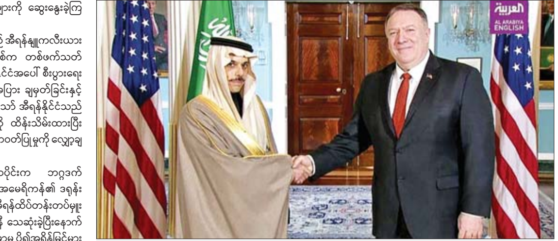
ဆော်ဒီနိုင်ငံခြားရေးဝန်ကြီး ဖိုင်ဆာဘင်ဖာဟန်အယ်လ်ဆောဒ်နှင့် အမေရိကန်နိုင်ငံခြားရေးဝန်ကြီး မိုက်ပွန်ပီယို တွေ့ဆုံစဉ်။

ရောက်ရှိရေးအတွက် လိုအပ်သည်များကို ဆွေးနွေးခဲ့ကြ ကြောင်း သိရသည်။ အမေရိကန်ပြည်ထောင်စုသည် အီရန်ချူကလီးယား သဘောတူစာချုပ်မှ ၂၀၁၈ ခုနှစ်က တစ်ဖက်သတ် နုတ်ထွက်ခဲ့ချိန်ကတည်းက အီရန်နိုင်ငံအပေါ် စီးပွားရေး ဆိုင်ရာ အရေးယူပိတ်ဆို့မှုအများအပြား ချမှတ်ခြင်းနှင့် အတူ ဖိအားပေးလျက်ရှိသည်။ သို့သော် အီရန်နိုင်ငံသည် ၎င်း၏ ခိုင်မာသောရပ်တည်ချက်ကို ထိန်းသိမ်းထားပြီး ချူကလီးယားဆိုင်ရာ ၎င်း၏ ကတိကဝတ်ပြုမှုကို လျော့ချ မည်ဖြစ်သည်။ ယခုနှစ် ဇန်နဝါရီလအစောပိုင်းက ဘဂ္ဂဒတ် အပြည်ပြည်ဆိုင်ရာလေဆိပ်အနီး အမေရိကန်၏ ဒရုန်း လေယာဉ်ဖြင့် တိုက်ခိုက်မှုကြောင့် အီရန်ထိပ်တန်းတပ်မှူး ဗိုလ်ချုပ်ကြီး ကာဆမ်းဆိုလန်းမန်းနီ သေဆုံးခဲ့ပြီးနောက် အမေရိကန်နှင့် အီရန်အကြားတင်းမာမှု ပို၍အရှိန်မြင့်မား လာခဲ့သည်။ ကိုးကား - ဆင်ဟွာ၊ ဘာသာပြန် - ဂျေတီ