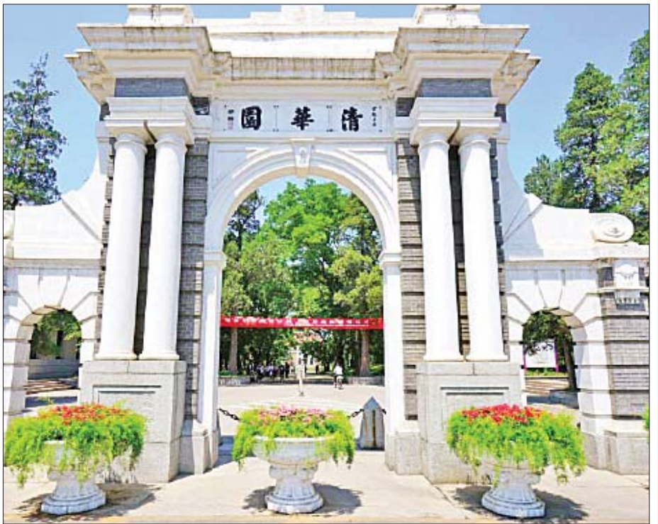
တရုတ်နိုင်ငံ ပေကျင်းမြို့ရှိ ဆင်တူတက္ကသိုလ် (Tsinghua University) ကို တွေ့ရစဉ်။

University Ranking 2020) ထိုထိပ်တန်းရောက် တက္ကသိုလ်အားလုံးနီးပါးသည် ကိုယ်ပိုင်အုပ်ချုပ်ခွင့်ရတက္ကသိုလ်များ (Autonomy University) ဖြစ်ကြသည်။ ပါမောက္ခချုပ် (Rector/ Vice-Chancellor/ University President) နှင့် တက္ကသိုလ်အုပ်ချုပ်ရေးအဖွဲ့ကောင်စီ (University Council/ Senate/ Board of Governors/ Steering Committee) တို့က အပြန်အလှန် ထိန်းကျောင်းပေးရင်း မိမိတက္ကသိုလ်က ပြုလုပ်နေသော သုတေသနများမှ ကမ္ဘာသူ ကမ္ဘာသားများအကျိုးရှိမှု၊ စီးပွားရေးဖွံ့ဖြိုး တိုးတက်မှု များများလုပ်နိုင်လေလေ၊ ကမ္ဘာ့ထိပ်တန်းဝင် နိုဗယ်လ်ဆုရရှိသူ များများမွေးထုတ်ပေးနိုင်လေလေ၊ မိမိတက္ကသိုလ်ထွက်ဘွဲ့ရများက သင်ကြားပေးလိုက် သောဘာသာရပ်များနှင့် ကိုက်ညီသော အလုပ်အကိုင် များများ ရနိုင်လေလေ၊ နိုင်ငံတကာမှ တက္ကသိုလ် အချင်းချင်း ပါမောက္ခ ဆရာ ဆရာမများ၊ ကျောင်းသား ကျောင်းသူများ အပြန်အလှန် လေ့လာသွားလာနိုင် လေလေ မိမိတက္ကသိုလ် နာမည်ဂုဏ်သတင်း (Reputation) မွေးလေလေဖြစ်သည်အတွက် မြန်မာနိုင်ငံ တက္ကသိုလ်များမှလည်း ထိုတက္ကသိုလ်များကဲ့သို့ အတုယူရင်း အမိနိုင်ငံတော် ဂုဏ်သတင်းဆောင်နိုင်ကြ