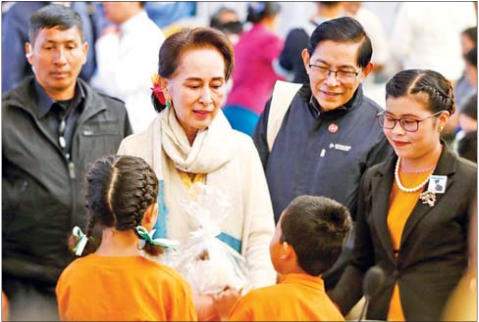
နိုင်ငံတော်၏အတိုင်ပင်ခံပုဂ္ဂိုလ် ဒေါ်အောင်ဆန်းစုကြည် ဗိုလ်ချုပ်အောင်ဆန်း၏ (၁၀၅)နှစ်မြောက် မွေးနေ့အထိမ်းအမှတ်အခမ်းအနားသို့ တက်ရောက်လာသည့် ကလေးငယ်များအား အမှတ်တရလက်ဆောင်ပစ္စည်းများ ပေးအပ်စဉ်။

စုကြည်သည် အဖွဲ့ဝင်များနှင့်အတူ အထူးလေယာဉ်ဖြင့် ရှမ်းပြည်နယ် (တောင်ပိုင်း) ဟံဟိုးမြို့မှ ထွက်ခွာလာရာ မွန်းလွဲပိုင်းတွင် နေပြည်တော်သို့ ပြန်လည်ရောက်ရှိကြသည်။ အမျိုးသား ခေါင်းဆောင်ကြီး ဗိုလ်ချုပ်အောင်ဆန်းကို မြန်မာသက္ကရာဇ် ၁၂၇၆ ခုနှစ် တပေါင်းလဆန်း ၁ ရက်၊ ခရစ်နှစ် ၁၉၁၅ ခုနှစ် ဖေဖော်ဝါရီလ ၁၃ ရက် စနေနေ့တွင် မြန်မာပြည်အလယ်ပိုင်း မကွေးခရိုင် နတ်မောက်မြို့၌ အဘဦးဖာ၊ အမိဒေါ်စုတို့က မွေးဖွားခဲ့ပြီး ၂၀၂၀ ပြည့်နှစ် ဖေဖော်ဝါရီ ၁၃ ရက်တွင် (၁၀၅) နှစ်ပြည့်မြောက်ခဲ့ပြီဖြစ်သည်။ သတင်းစဉ်