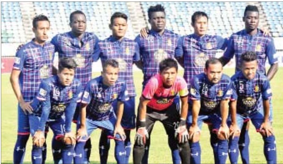
အမှတ်ပေးဇယားထိပ်ဆုံး၌ ဦးဆောင်နေသည့် ဟံသာဝတီအသင်း။

ရန်ကုန် ဖေဖော်ဝါရီ ၁၃ ၂၀၂၀ ဘောလုံးရာသီ MNL အမှတ်ပေး ပြိုင်ပွဲ ပွဲစဉ်(၆)ကို ဖေဖော်ဝါရီ ၁၅၊ ၁၆ ရက်တွင် ကျင်းပမည်ဖြစ်ရာ ထိပ်ဆုံးမှ ဟံသာဝတီအသင်း ပွဲကျပ် ကစားရမည်ဖြစ်ပြီး ဇယားထိပ်ပိုင်းမှ အသင်းအများစု အဝေးကွင်းကစားရ မည်ဖြစ်သည်။