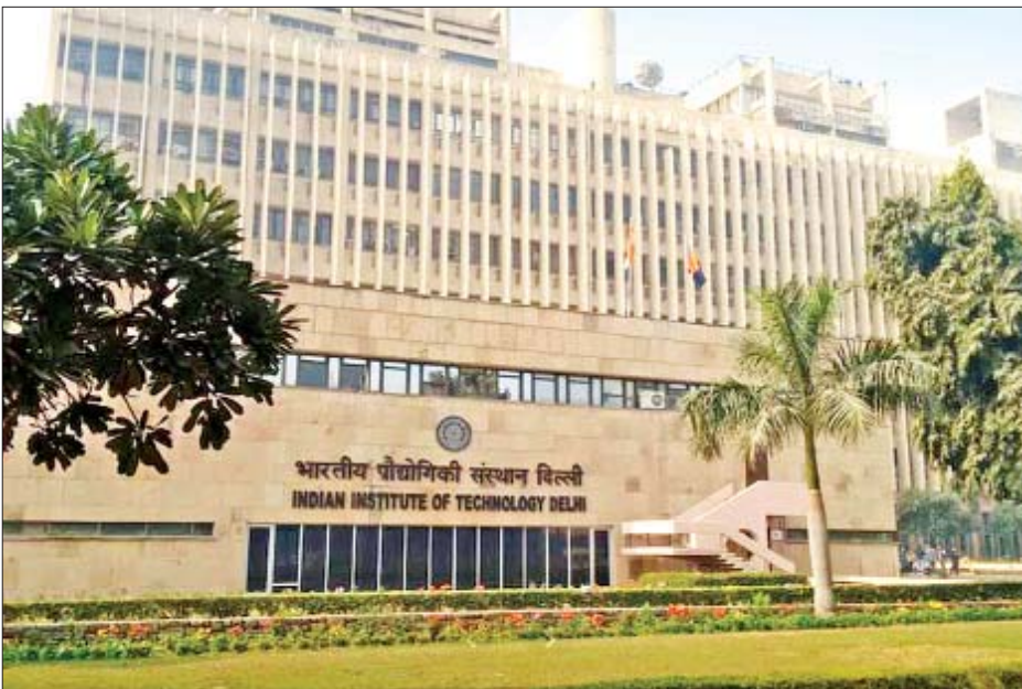
အိန္ဒိယနိုင်ငံ နယူးဒေလီမြို့ရှိ အိန္ဒိယနည်းပညာတက္ကသိုလ်ကို တွေ့ရစဉ်။

အိန္ဒိယနိုင်ငံ လူဦးရေနှင့် နီးပါးတူညီသော တရုတ်နိုင်ငံ အဆင့်မြင့်ပညာရေးကို လေ့လာကြည့်မည်ဆိုလျှင် ၁၉၅၀ ပြည့်နှစ်မှ ၁၉၈၀ ပြည့်နှစ်အတွင်း တက္ကသိုလ်များ၏ ၂၀၁၉ ခုနှစ် ကမ္ဘာ့အတော်ဆုံး တက္ကသိုလ်အဆင့် သတ်မှတ်ချက် (QS World University Ranking) တွင် အကောင်းဆုံး တက္ကသိုလ် ၄၀၀ ထဲတွင် အိန္ဒိယမှ တက္ကသိုလ် ခုနစ်ခုသာ ပါဝင်သည်။ ဤတက္ကသိုလ် ခုနစ်ခုတွင် ခြောက်ခုက အိန္ဒိယ နည်းပညာတက္ကသိုလ် များဖြစ်