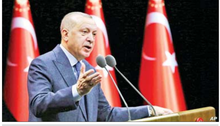
တူရကီသမ္မတ ရီစက်တေယက်အာဒိုဂန်

ဒေသတွင်း၌ ဆီးရီးယားတပ်ဖွဲ့များက ချီတက်မှုများ ပြုလုပ်နေခြင်းကြောင့် တူရကီ နှင့် ဆီးရီးယားတို့မှာ ပဋိပက္ခတစ်ခု ဖြစ်လာ နိုင်ဖွယ်ရှိကြောင်း လေ့လာသူများက ပြော သည်။ ကိုးကား-ပရက်စ်တီစီ ဘာသာပြန်-ကျော်ထိုက်စိုး