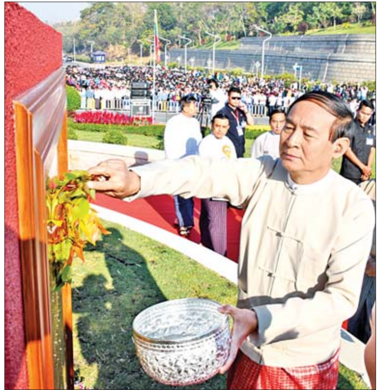
နိုင်ငံတော်သမ္မတ ဦးဝင်းမြင့် ကမ္ဘည်းမော်ကွန်းကြေးပြားကို အမွှေးနံ့သာရည် ပက်ဖျန်းပေးစဉ်။

❖ နိုင်ငံတော်သမ္မတမှ ပြည်ထောင်စု စာရင်းစစ်ချုပ်၊ ပြည်ထောင်စုရုထူးဝန်အဖွဲ့ ဥက္ကဋ္ဌ၊ ငြိမ်းချမ်းရေးကော်မရှင် ဥက္ကဋ္ဌ၊ နေပြည်တော်ကောင်စီ ဥက္ကဋ္ဌ၊ မြန်မာနိုင်ငံတော်ဗဟိုဘဏ်ဥက္ကဋ္ဌ၊ အဂတိလိုက်စားမှုတိုက်ဖျက်ရေးကော်မရှင် ဥက္ကဋ္ဌ၊ မြန်မာနိုင်ငံ အမျိုးသားလူ့အခွင့်အရေးကော်မရှင် ဥက္ကဋ္ဌ၊ လွှတ်တော်ရေးရာကော်မတီ ဥက္ကဋ္ဌများ၊ နေပြည်တော်တိုင်းစစ်ဌာနချုပ် တိုင်းမှူး၊ ဒုတိယဝန်ကြီးများနှင့် ၎င်းတို့၏ ဇနီးများ၊ လွှတ်တော်ကိုယ်စားလှယ်များ၊ ဌာနဆိုင်ရာ တာဝန်ရှိသူများ၊ တိုင်းရင်းသားများ၊ အစိုးရမဟုတ်သော အဖွဲ့အစည်းများ၊ အရပ်ဘက် အဖွဲ့အစည်းများ၊ တက္ကသိုလ်ကျောင်းသား သမဂ္ဂအဖွဲ့၊ ကျောင်းသား ကျောင်းသူများ၊ အလှူရှင်များနှင့် ဒေသခံမိဘပြည်သူများ တက်ရောက်ကြသည်။