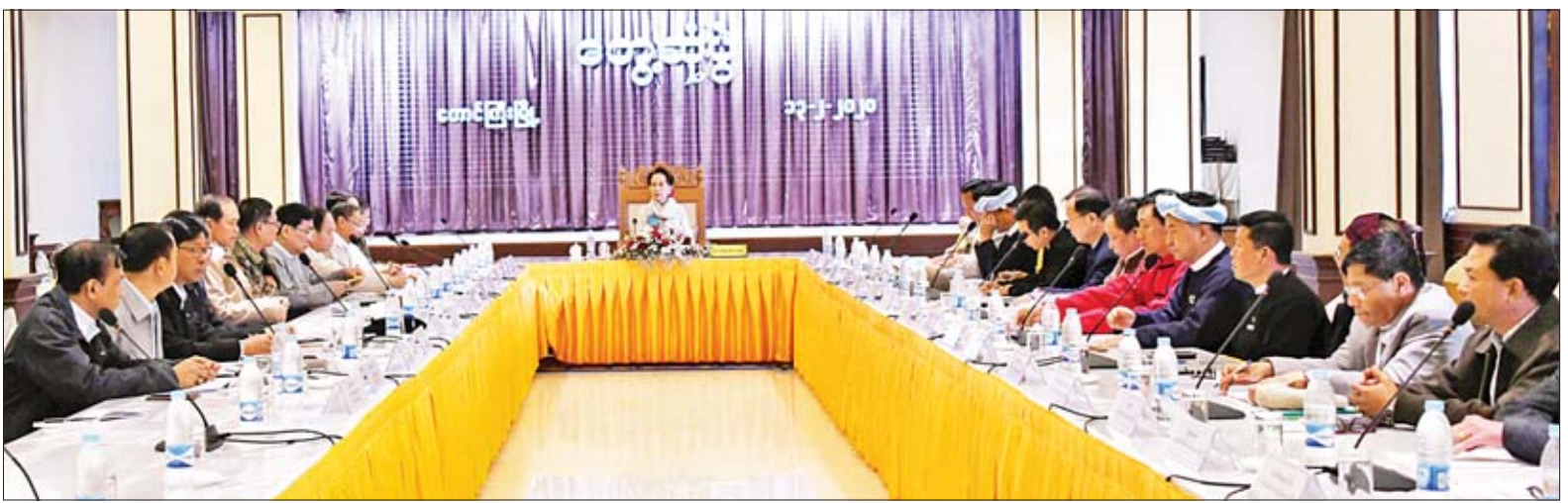
နိုင်ငံတော်၏အတိုင်ပင်ခံပုဂ္ဂိုလ် ဒေါ်အောင်ဆန်းစုကြည် ရှမ်းပြည်နယ်အစိုးရအဖွဲ့ဝင်များနှင့် တွေ့ဆုံစဉ်။

ဝ နိုင်ငံတော်၏အတိုင်ပင်ခံပုဂ္ဂိုလ်မှ ဒုတိယဝန်ကြီး ဗိုလ်ချုပ်အောင်သူနှင့် ဦးလှမော်ဦး၊ ပြည်နယ်ဝန်ကြီးများ၊ “ဝ”ကိုယ်ပိုင်အုပ်ချုပ်ခွင့်ရတိုင်း၊ ပအိုဝ်းကိုယ်ပိုင်အုပ်ချုပ်ခွင့်ရဒေသနှင့် ပလောင်ကိုယ်ပိုင်အုပ်ချုပ်ခွင့်ရဒေသဦးစီးအဖွဲ့ ဥက္ကဋ္ဌများနှင့် ကိုယ်စားလှယ်များ၊ ပြည်နယ်ဥပဒေချုပ်နှင့် တာဝန်ရှိသူများ တက်ရောက်ကြသည်။