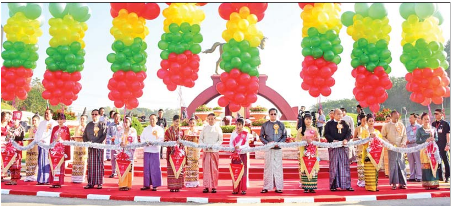
နိုင်ငံတော်သမ္မတ ဦးဝင်းမြင့်၊ ဒုတိယသမ္မတများ၊ ပြည်သူ့လွှတ်တော်ဥက္ကဋ္ဌ၊ အမျိုးသားလွှတ်တော်ဥက္ကဋ္ဌ၊ ပြည်ထောင်စုတရားသူကြီးချုပ်နှင့် နေပြည်တော်ကောင်စီဥက္ကဋ္ဌတို့က နေပြည်တော်ဗိုလ်ချုပ်အောင်ဆန်းကြေးရုပ်တုကို ဖဲကြိုးဖြတ် ဖွင့်လှစ်ပေးစဉ်။

ဆက်လက်၍ နိုင်ငံတော်သမ္မတသည် ဒုတိယသမ္မတများ၊ နိုင်ငံတော်ဖွဲ့စည်းပုံအခြေခံဥပဒေဆိုင်ရာ ခုံရုံးဥက္ကဋ္ဌ၊ ပြည်ထောင်စုအဆင့်ပုဂ္ဂိုလ်များ၊ နေပြည်တော်တိုင်းစစ်ဌာနချုပ် တိုင်းမှူး၊ တိုင်းရင်းသား မောင်မယ်များနှင့်