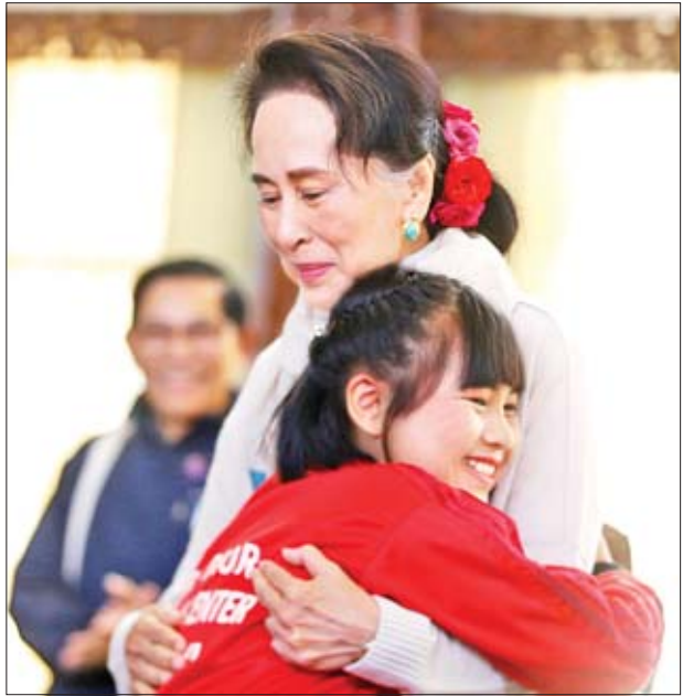
နိုင်ငံတော်၏အတိုင်ပင်ခံပုဂ္ဂိုလ် ဒေါ်အောင်ဆန်းစုကြည် ကလေးငယ်တစ်ဦးအား ရင်းနှီးနှေးထွေးစွာ နှုတ်ဆက်စဉ်။