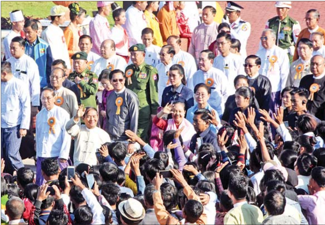
နိုင်ငံတော်သမ္မတ ဦးဝင်းမြင့်နှင့်ဇနီး ဒေါ်ချိုချို အခမ်းအနားသို့တက်ရောက်လာကြသည့် ဧည့်သည်တော်များနှင့် ဒေသခံမိဘပြည်သူများအား ရင်းရင်းနှီးနှီး နှုတ်ဆက်စဉ်။