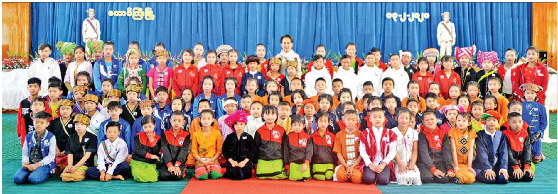
နိုင်ငံတော်၏အတိုင်ပင်ခံပုဂ္ဂိုလ် ဒေါ်အောင်ဆန်းစုကြည် ဗိုလ်ချုပ်အောင်ဆန်း၏ (၁၀၅)နှစ်မြောက် မွေးနေ့အထိမ်းအမှတ်အခမ်းအနားသို့ တက်ရောက်လာသည့် ကလေးငယ်များနှင့်အတူ စုပေါင်းမှတ်တမ်းတင်ဓာတ်ပုံရိုက်စဉ်။