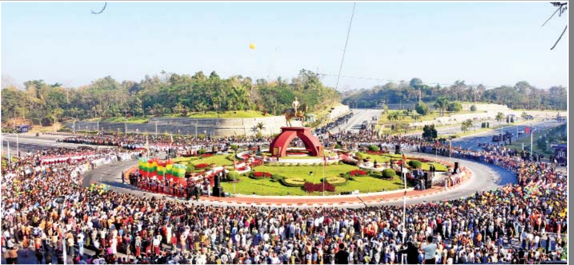
ဖေဖော်ဝါရီ ၁၃ ရက်က နေပြည်တော် မေ့လျော့ရန်မရှိမည် သပြေကုန်းအဝိုင်း၌ ပိုလ်ချုပ်အောင်ဆန်းကြေးရုပ်တုဖွင့်ပွဲအခမ်းအနားကိုကျင်းပရာ လက်ရာမြောက်စွာ ထုဆစ်ပုံဖော်ထားသည့် ပိုလ်ချုပ်မြင်းစီးရုပ်တုနှင့်အတူ သပြေကုန်းအဝိုင်းပတ်ပတ်လည်တွင် ပြည်သူများ ကြက်ပျံမကျစည်ကားလျက်တွေ့မြင်ရစဉ်။ (သတင်း - ရှေ့ဖုံး)