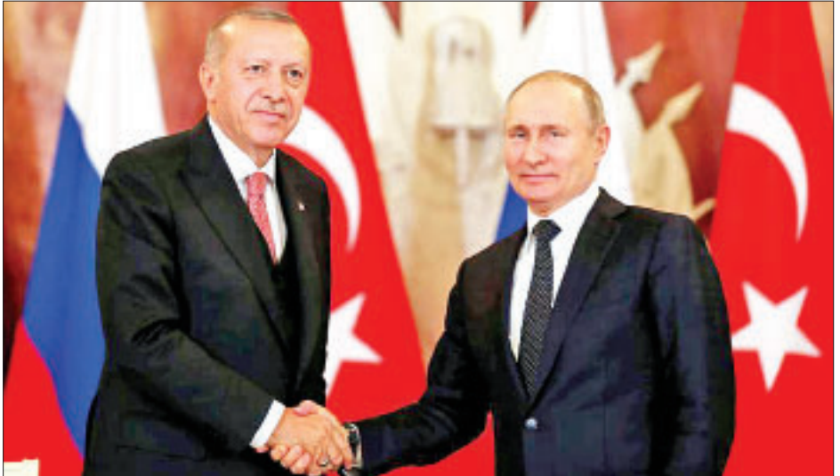
တူရကီသမ္မတ အာဒိုဂန်နှင့် ရုရှားသမ္မတ ဗလာဒီမာပူတင်တို့ ၂၀၁၉ ခုနှစ် အောက်တိုဘာလက ဆိုချိနားမြို့တွင် ဆုံစဉ်။

ရေးစုန်အဖြစ်သို့ရောက်ရှိရေး သဘောတူညီခဲ့ကြောင်း သိရ သည်။ သို့ရာတွင် သူပုန်များကို တင်းမာမှုလျော့ကျရေးစုန်မှ ဖယ်ရှားခြင်းမပြုနိုင်ခဲ့ခြင်းကြောင့် ဆိုချိနားလည်မှုစာချုပ် လွှာနှင့်စပ်လျဉ်း၍ အပြည့်အဝ အကောင်အထည်ဖော်နိုင် ခဲ့ကြောင်း သိရသည်။ ဆီးရီးယားအစိုးရတပ်ဖွဲ့သည် အိဒ်လစ်ဒေသတွင် သူပုန်များအား ဆန့်ကျင်သော ကြီးမားကျယ်ပြန့်သည့် ထိုးစစ်ဆင်မှုများ လုပ်ဆောင်လျက်ရှိခြင်းကြောင့် အိဒ်လစ် ဒေသတွင် တင်းမာမှုများ မကြာခဏဖြစ်ပွားခဲ့ပြီး တူရကီ တပ်ဖွဲ့ဝင်များနှင့် အပြန်အလှန်ပစ်ခတ်မှုများ ဖြစ်ပွားခဲ့ သည့်အပြင် နှစ်ဖက်စလုံးတွင် သေဆုံးမှုများ ဖြစ်ပေါ်စေခဲ့ သည်။ ကိုးကား-ဆင်ဟွာ ဘာသာပြန်-အလင်းသစ်