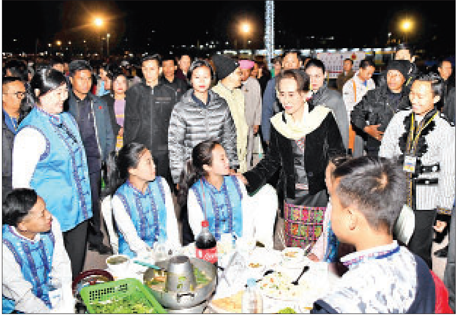
နိုင်ငံတော်၏အတိုင်ပင်ခံပုဂ္ဂိုလ် ဒေါ်အောင်ဆန်းစုကြည် (၇၃)နှစ်မြောက် ပြည်ထောင်စုနေ့ ညစာစားပွဲ အခမ်းအနားသို့ တက်ရောက်ကြသူများအား ရင်းရင်းနှီးနှီးနှုတ်ဆက်စဉ်။

ချုပ်ဆိုနိုင်ခဲ့ကြသည်။ သဘောတူညီချက် ၅၁ ချက် ယင်းပင်လုံသဘောတူညီချက်ကို လက်မှတ်ရေးထိုးနိုင်ခဲ့သည့်အတွက် တောင်တန်းပြည်မပူးပေါင်းပြီး နိုင်ငံ လွတ်လပ်ရေးရယူနိုင်ရန် လမ်းပွင့် သွားခဲ့ပြီး ၁၉၄၈ ခုနှစ် ဇန်နဝါရီ ၄ ရက်တွင် လွတ်လပ်သော အချုပ်အခြာ အာဏာပိုင် မြန်မာနိုင်ငံအဖြစ် ပြန်လည်ပေါ်ထွန်းလာခဲ့ခြင်း ဖြစ် သည်။ (၂၁)ရာစု ပင်လုံညီလာခံဖြင့် ပြည်ထောင်စုကို အတူတကွ တည်ထောင်ခဲ့ခြင်းဖြစ်သည်။ ယခု အစိုးရသစ်လက်ထက်တွင် ပြည်ထောင်စုငြိမ်းချမ်းရေးညီလာခံ- (၂၁)ရာစုပင်လုံကို သုံးကြိမ်တိုင်တိုင် အောင်မြင်စွာ ကျင်းပနိုင်ခဲ့ပြီး ဒီမိုကရေစီနှင့် ဖက်ဒရယ်ဆိုင်ရာ အခြေခံမူ ပြည်ထောင်စုသဘော တူညီချက် ၅၁ ချက် ရရှိခဲ့ပြီးဖြစ် သတင်းစဉ်