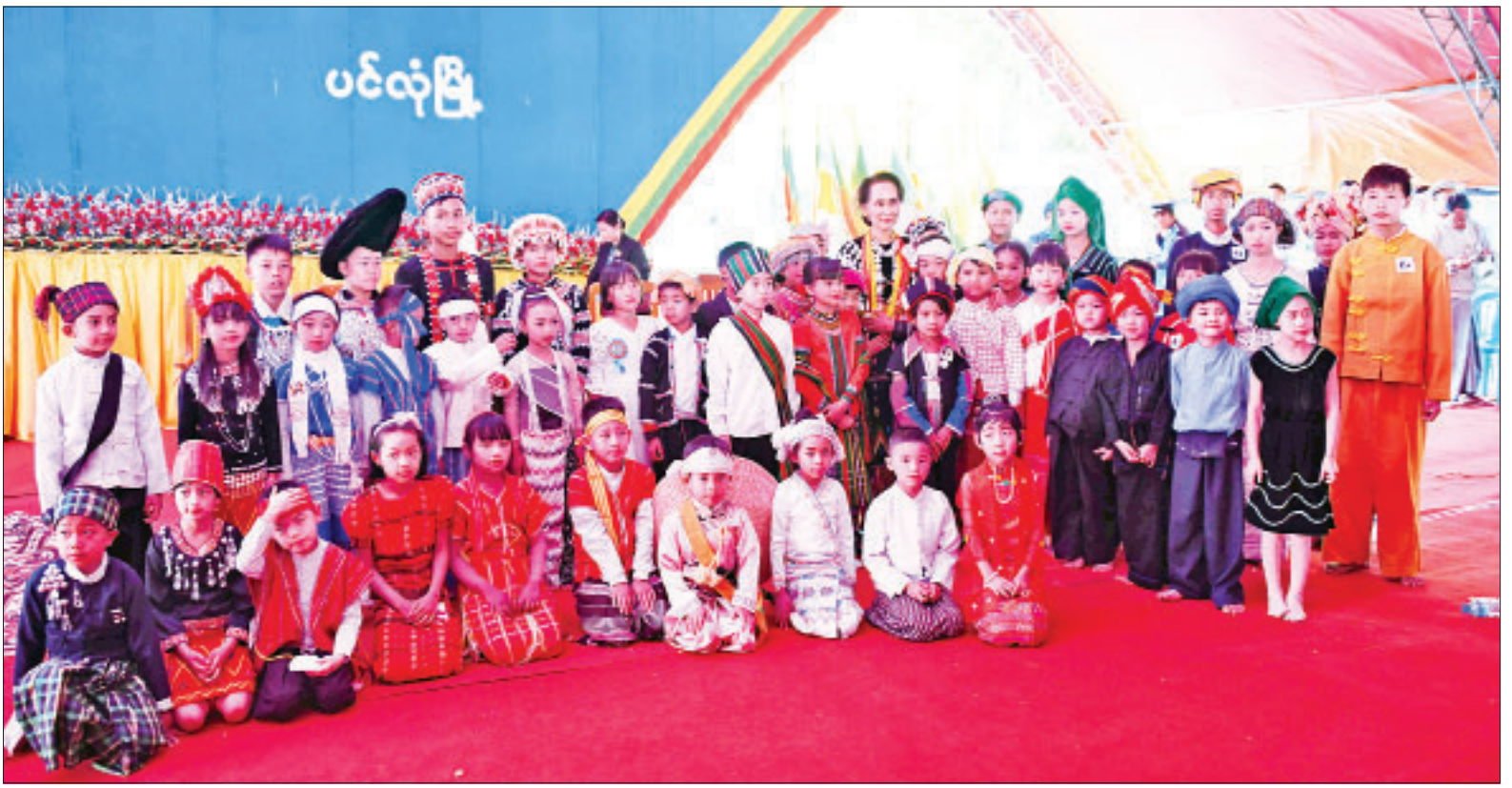
နိုင်ငံတော်၏အတိုင်ပင်ခံပုဂ္ဂိုလ် ဒေါ်အောင်ဆန်းစုကြည် ပင်လုံမြို့၊ ဒေသခံပြည်သူများနှင့် တွေ့ဆုံပွဲတွင် တိုင်းရင်းသား တိုင်းရင်းသူ ကလေးငယ်များနှင့် မှတ်တမ်းတင်ဓာတ်ပုံရိုက်စဉ်။

“ ပြည်ထောင်စုစိတ်ဓာတ်ကို မွေးကြပါ။ နိုင်ငံသားကောင်း စိတ်ဓာတ်ကို မွေးကြပါ။ ပြည်ထောင်စုစိတ်ဓာတ်ဆိုတာ ညီညွတ်ရေးနဲ့ အပေးအယူမျှတရေးအပေါ်မှာ မူတည်ပါ။ ထိုနည်းလည်းကောင်း နိုင်ငံသားကောင်းဆိုတာက အပေး အယူမျှတရေးနဲ့ မူတည်ပါတယ် ”