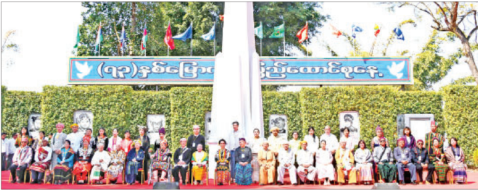
နိုင်ငံတော်၏အတိုင်ပင်ခံပုဂ္ဂိုလ် ဒေါ်အောင်ဆန်းစုကြည် ပင်လုံစာချုပ်တွင် ပါဝင်လက်မှတ်ရေးထိုးခဲ့သော ခေါင်းဆောင်များ၏ မိသားစုဝင်များနှင့် စုပေါင်းမှတ်တမ်းတင်ဓာတ်ပုံရိုက်စဉ်။

◆ နိုင်ငံတော်၏အတိုင်ပင်ခံပုဂ္ဂိုလ်မှ တိုင်းမှူး ဗိုလ်ချုပ်သန်းလှိုင်၊ ဒုတိယ ဝန်ကြီး ဗိုလ်ချုပ်အောင်သူနှင့် ဦးလှမော်ဦး၊ ပြည်နယ်ဝန်ကြီးများ၊ လွှတ်တော်ကိုယ်စားလှယ်များ၊ မြန်မာ နိုင်ငံ ရဲတပ်ဖွဲ့ရဲချုပ် ဒုတိယ ရဲဗိုလ်ချုပ်ကြီး အောင်ဝင်းဦး၊ တိုင်းရင်းသား လူမျိုးရေးရာဝန်ကြီးများ၊ ဓနကိုယ်ပိုင် အုပ်ချုပ်ခွင့်ရဒေသ ဦးစီးအဖွဲ့၊ ပလောင်ကိုယ်ပိုင်အုပ်ချုပ်ခွင့်ရဒေသ ဦးစီးအဖွဲ့နှင့် ပအိုဝ်းကိုယ်ပိုင်အုပ်ချုပ် ခွင့်ရဒေသ ဦးစီးအဖွဲ့ဥက္ကဋ္ဌများ၊ နိုင်ငံရေးပါတီများမှ ကိုယ်စားလှယ် များ၊ ပင်လုံစာချုပ်တွင် လက်မှတ် ရေးထိုးခဲ့ကြသည့် ခေါင်းဆောင်များ ၏သားသမီးများနှင့် ဆွေမျိုးတော်စပ် သူများ၊ ပြည်နယ်အဆင့် ပစ်ခတ် တိုက်ခိုက်မှုရပ်စဲရေး ပူးတွဲစောင့်ကြည့် ရေး ကော်မတီဝင်များ၊ ငြိမ်းချမ်းရေး ဆွေးနွေးပွဲတွင် ပါဝင်ဆွေးနွေးကြမည့် တိုင်းရင်းသားများ၊ ဖိတ်ကြားထား သူများနှင့် ဒေသခံတိုင်းရင်းသား ပြည်သူများ တက်ရောက်ကြ သည်။