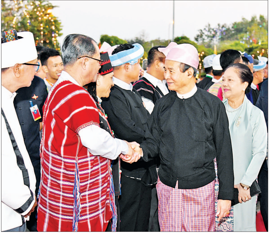
နိုင်ငံတော်သမ္မတ ဦးဝင်းမြင့်နှင့် ဇနီးဒေါ်ချိုချိုတို့ ပြည်ထောင်စုနေ့အထိမ်းအမှတ် ဂုဏ်ပြုညစာစားပွဲသို့ တက်ရောက်လာကြသူများအား ရင်းရင်းနှီးနှီး နှုတ်ဆက်စဉ်။

နေပြည်တော် ဖေဖော်ဝါရီ ၁၂ ပြည်ထောင်စုသမ္မတမြန်မာနိုင်ငံတော် နိုင်ငံတော်သမ္မတ ဦးဝင်းမြင့်နှင့် ဇနီး ဒေါ်ချိုချိုတို့က တည်ခင်းဧည့်ခံသည့် ၂၀၂၀ ပြည့်နှစ် (၇၃) နှစ်မြောက် ပြည်ထောင်စုနေ့အထိမ်း အမှတ်ဂုဏ်ပြုညစာစားပွဲအခမ်းအနားကို ယနေ့ညပိုင်းတွင် နေပြည်တော်ရှိ မြို့တော်ခန်းမ ဥပစာရင်ပြင်၌ ကျင်းပသည်။ နိုင်ငံတော်သမ္မတ ဦးဝင်းမြင့်နှင့် ဇနီးဒေါ်ချိုချိုတို့သည် ညနေ ၆ နာရီတွင် ဂုဏ်ပြု ညစာစားပွဲအခမ်းအနား ကျင်းပ သည့် မြို့တော်ခန်းမ ဥပစာရင်ပြင်သို့ ရောက်ရှိကြရာ ဒုတိယသမ္မတ ဦးမြင့်ဆွေနှင့် ဇနီး ဒေါ်ခင်သက်ဌေး၊ ပြည်ထောင်စုဝန်ကြီး ဒေါက်တာဖေမြင့်နှင့် ဇနီး၊ ပြည်ထောင်စုဝန်ကြီး ဦးအုန်းမောင်၊ ပြည်ထောင်စုဝန်ကြီး နိုင်သက်လွင်နှင့် ဇနီး၊ နေပြည်တော်ကောင်စီဥက္ကဋ္ဌ ဒေါက်တာမျိုးအောင်နှင့် ဇနီးတို့က ကြိုဆိုနှုတ်ဆက် ကြသည်။ စာမျက်နှာ ၃ ကော်လံ ၁ သို့ ၀