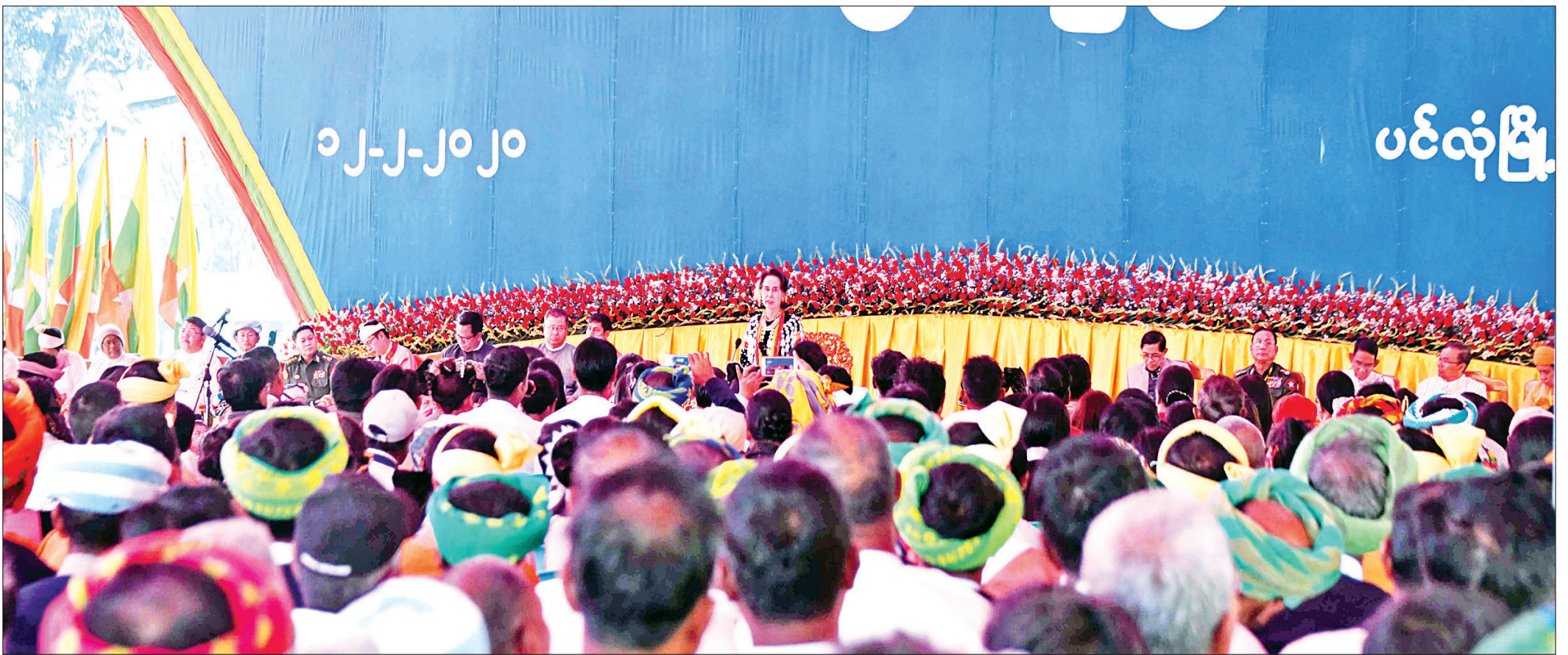
နိုင်ငံတော်၏အတိုင်ပင်ခံပုဂ္ဂိုလ် ဒေါ်အောင်ဆန်းစုကြည် ပင်လုံမြို့မှဒေသခံပြည်သူများနှင့် တွေ့ဆုံစဉ်။