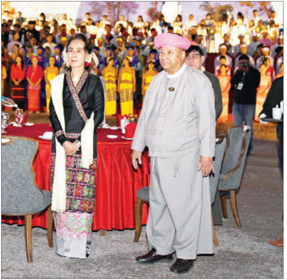
နိုင်ငံတော်၏အတိုင်ပင်ခံပုဂ္ဂိုလ် ဒေါ်အောင်ဆန်းစုကြည် (၇၃)နှစ်မြောက် ပြည်ထောင်စုနေ့ ညစာစားပွဲအခမ်းအနားတွင် (၂၁)ရာစု စတုတ္ထအကြိမ် ပင်လုံညီလာခံကို ကြိုဆိုသောအားဖြင့် စိန်နားပန်းမီးပုံးပျံကြီးတစ်လုံးလွှတ်တင်မှုကို ကြည့်ရှုအားပေးစဉ်။

တွင် ဗိုလ်ချုပ်အောင်ဆန်း ခေါင်းဆောင် သည့် ဘုရင်ခံအမှုဆောင်ဝန်ကြီးများ၊ နယ်ခြားဒေသ အုပ်ချုပ်ရေးအဖွဲ့မှ အရာရှိများ၊ မြန်မာပြည်နိုင်ငံရေးအဖွဲ့ အသီးသီးမှ ကိုယ်စားလှယ်များ၊ သတင်းစာဆရာများ၊ နိုင်ငံခြား သံကိုယ်စားလှယ် ကောင်စစ်ဝန်များ၊ ထင်ရှားကျော်ကြားသူ တစ်သီးပုဂ္ဂလ များ၊ ရှမ်းစော်ဘွားကိုယ်စားလှယ်များ နှင့် လူထုကိုယ်စားလှယ်များ၊ ကချင် တိုင်းရင်းသားနှင့် ချင်းတိုင်းရင်းသား ကိုယ်စားလှယ်များ ပါဝင်တက်ရောက် ခဲ့ကြသည်။