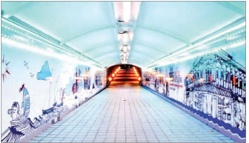
မြေအောက်လျှောက်လမ်းပုံစံပုံကို တွေ့ရစဉ်။

ယင်းမြေအောက်လျှောက်လမ်း စီမံကိန်းသည် ပြည်လမ်းမကြီးအား ဖြတ်သန်းကာ မြေအောက်မှ တူးဖော် တည်ဆောက်နေသည့်အတွက် လျှောက်လမ်းကြီးပြီးလျှင် သွားလာကြမည့် ပြည်သူများအတွက် လုံခြုံရေးစနစ်များ၊ စည်ကားစေရန် ဈေးဆိုင်များ၊ အကွန်းနှင့် လျှပ်စစ်မီးတိုင် များကို စနစ်တကျထားရှိမည်ဖြစ်ကြောင်း သိရသည်။ ထိုမြေအောက်လျှောက်လမ်းပြီးစီးလျှင် ရန်ကုန်ပညာရေး တက္ကသိုလ်/တက္ကသိုလ်လေ့ကျင့်ရေးကျောင်းမှ ကျောင်းသား ကျောင်းသူများ၊ ဆရာ ဆရာမများ၊ Junction Square နှင့် Times City Shopping Mail တို့သို့ နေ့စဉ်နှင့်အမျှ ကူးလူး