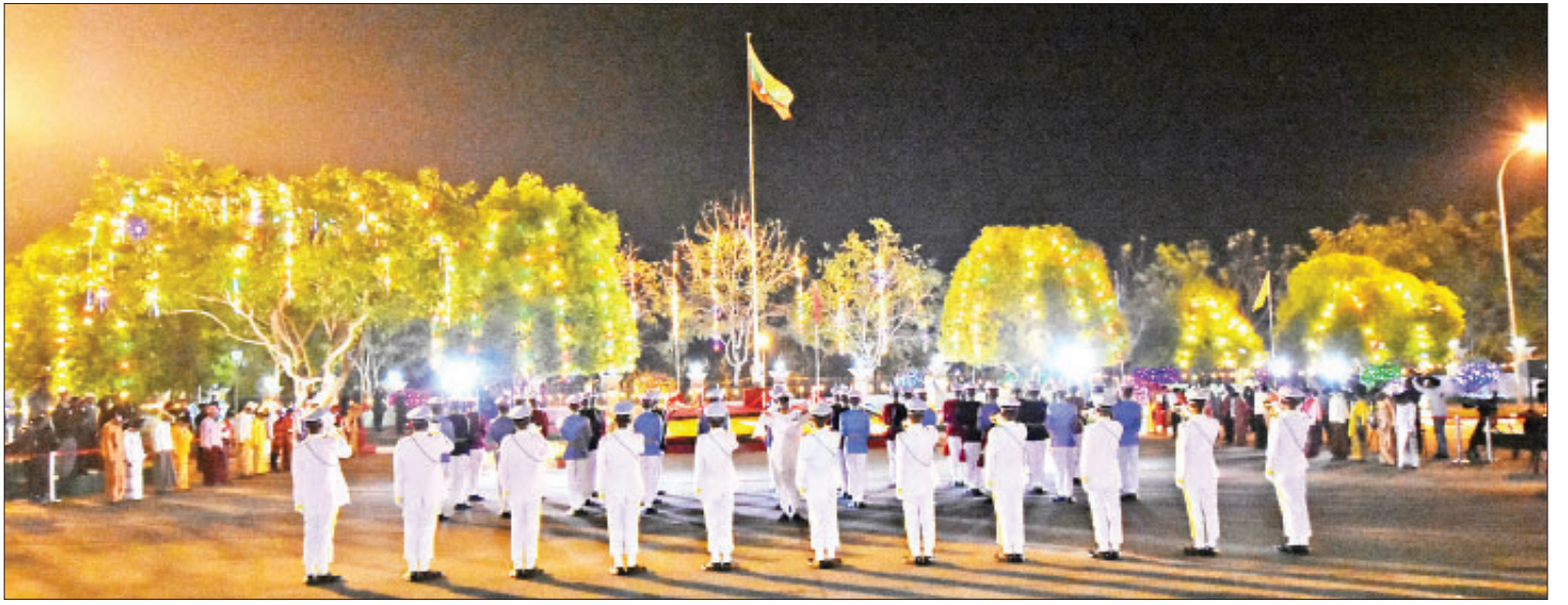
(၇၃)နှစ်မြောက်ပြည်ထောင်စုနေ့ နိုင်ငံတော်အလံတင်အခမ်းအနားကျင်းပစဉ်။

နိုင်ငံတော်အလံအလေးပြုပွဲအခမ်းအနားကို နံနက် ၇ နာရီတွင် ကျင်းပရာ တပ်မတော် (ကြည်း၊ ရေ၊ လေ) ဂုဏ်ပြုတပ်ဖွဲ့က မြို့တော်ခန်းမ ဥပစာရင်ပြင်သို့ ချီတက်နေရာယူသည်။