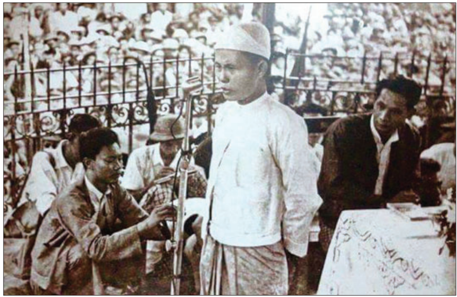
လူငယ်အများလေးစားအတုယူဖွယ်ရာ ဗိုလ်ချုပ်အောင်ဆန်း၏ လူငယ်ဘဝမှတ်တမ်း..

ဗိုလ်ချုပ်အောင်ဆန်းမှာ ဖေဖော်ဝါရီလ ၁၃ ရက်နေ့ တွင် မကွေးခရိုင် နတ်မောက်မြို့တွင် အဘ ဦးဖာ၊ အမိ ဒေါ်စုတို့မှ ၁၉၁၅ခုနှစ် ဖေဖော်ဝါရီလ ၁၃ ရက် စနေနေ့တွင် မွေးဖွားခဲ့ပြီး အသက် ၃၃ နှစ်အရွယ်တွင် လုပ်ကြံမှု ကြောင့် ကျဆုံးခဲ့ရသည်။ ဗိုလ်ချုပ်ကျဆုံးသွားသော်လည်း ဗိုလ်ချုပ်၏အမည်မှာ ယနေ့အထိမသေဘဲ ကျန်ရှိနေ သည်။ ထိုအမည်မှာ စာတင်အမည်မှာ ထိန်းလင်းဖြစ် သည်။ နောက်ပိုင်း ကျောင်းဝင်အမည်မှစတင်ကာ အောင်ဆန်းအမည်ဖြင့် ပြောင်းလဲခဲ့သည်။ နိုင်ငံရေးလောက ထဲ ဝင်ရောက်ချိန်တွင် သခင်အောင်ဆန်းဖြစ်ပြီး တရုတ် နိုင်ငံ အမြိုင်မြို့သို့ ထွက်သွားချိန်တွင် ထန်လှရောင် အမည်ဖြင့်လည်းကောင်း၊ ဂျပန်နိုင်ငံတွင် စစ်ပညာသင် ချိန်တွင် အိုမိုဒါမွန်ဂျီအမည်ဖြင့် လည်းကောင်း ပြောင်းလဲခဲ့ပြီး မြန်မာပြည်အတွင်း ပြန်လည်ဝင်ရောက် လာချိန် စစ်ဘက်အခေါ် အမည်မှာ ဗိုလ်တေဖြစ်သည်။ ဖက်ဆစ်ဆန့်ကျင်ရေး လုပ်ငန်းများတွင် လျှို့ဝှက်အမည် ဦးနောင်ချိုဖြစ်ပြီးနောက်ဆုံး အာရှနှင့် ကမ္ဘာတစ်လွှား သိသောအမည်မှာ ဗိုလ်ချုပ်အောင်ဆန်းဟူ၍ ဖြစ်သည်။ ဗိုလ်ချုပ်မှာ လူပင်သေသော်လည်း နာမည်ကသေမသွားဘဲ ယနေ့အချိန်ထိ သူလုပ်ဆောင်ခဲ့သည့် အလုပ်များ၌ သူ့ အမည် သူမှတ်တမ်းများ ကျန်နေခဲ့သည်ကို တွေ့ရသည်။