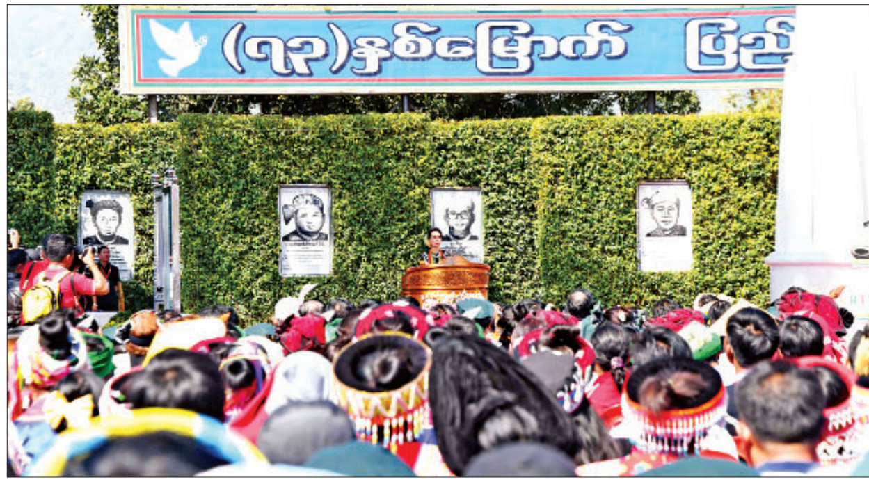
နိုင်ငံတော်၏အတိုင်ပင်ခံပုဂ္ဂိုလ် ဒေါ်အောင်ဆန်းစုကြည်(၇၃)နှစ်မြောက် ပြည်ထောင်စုနေ့အခမ်းအနားတွင် မိန့်ခွန်းပြောကြားစဉ်။

ဝေဖန်ဆန်းစစ်တဲ့အမြင် သမိုင်းကိုပြန်ကြည့်တဲ့အခါ တစ်ဦး ကိုတစ်ဦး အပြစ်တင်တဲ့ အပြစ်ရှာတဲ့