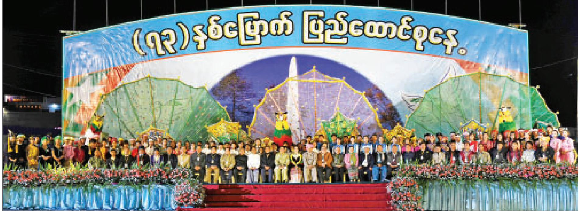
နိုင်ငံတော်၏အတိုင်ပင်ခံပုဂ္ဂိုလ် ဒေါ်အောင်ဆန်းစုကြည် (၇၃)နှစ်မြောက် ပြည်ထောင်စုနေ့ ညစာစားပွဲအခမ်းအနားတွင် တက်ရောက်လာသူများ၊ ကပြဖျော်ဖြေကြသည့် တိုင်းရင်းသားရိုးရာယဉ်ကျေးမှုအကအဖွဲ့များနှင့် စုပေါင်း မှတ်တမ်းတင်ဓာတ်ပုံရိုက်စဉ်။