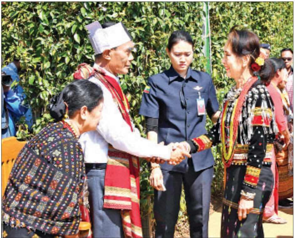
နိုင်ငံတော်၏အတိုင်ပင်ခံပုဂ္ဂိုလ် ဒေါ်အောင်ဆန်းစုကြည် ပင်လုံစာချုပ်တွင် လက်မှတ်ရေးထိုးခဲ့သည့် ခေါင်းဆောင်တစ်ဦး၏ မိသားစုဝင်အား ရင်းရင်းနှီးနှီး နှုတ်ဆက်စဉ်။

ယင်းနောက် နိုင်ငံတော်၏ အတိုင်ပင်ခံပုဂ္ဂိုလ်သည် ပင်လုံစာချုပ် တွင် ပါဝင်လက်မှတ်ရေးထိုးခဲ့သော ခေါင်းဆောင်များ၏ မိသားစုဝင်များ နှင့်လည်းကောင်း၊ ဒေသခံတိုင်းရင်းသား တိုင်းရင်းသားများနှင့် လည်းကောင်း၊ တိုင်းရင်းသားလက်နက်ကိုင် အဖွဲ့ အစည်းများမှ ခေါင်းဆောင်များနှင့် ကိုယ်စားလှယ်နှင့် လည်းကောင်း၊ ပြည်ထောင်စုဝန်ကြီးများ၊ ပြည်နယ် ဝန်ကြီးချုပ်နှင့် အရှေ့အလယ်ပိုင်း တိုင်းစစ်ဌာနချုပ်တိုင်းမှူး၊ ဒုတိယ ဝန်ကြီးများ၊ ပြည်နယ်ဝန်ကြီးများနှင့် လည်းကောင်း စုပေါင်းမှတ်တမ်းတင် ဓာတ်ပုံရိုက်သည်။ ထို့နောက် နိုင်ငံတော်၏အတိုင်ပင်ခံ ပုဂ္ဂိုလ်သည် ပင်လုံမြို့ရှိ ပြည်ထောင်စု ကျောက်တိုင်ကွင်း သတ်မှတ်နေရာ