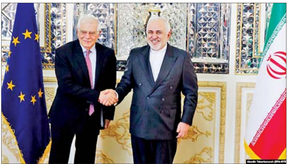
အီရန်နိုင်ငံခြားရေးဝန်ကြီး မိုဟာမက်ဂျာဗတ်ဇာရစ်ဖ်နှင့် ဥရောပသမဂ္ဂ၏ ပြည်ပရေးရာနှင့် လုံခြုံရေးမူဝါဒဆိုင်ရာ အဆင့်မြင့်ကိုယ်စားလှယ် ဂျိုးဆက်ဘော်ရဲလ်တို့ တွေ့ဆုံစဉ်။