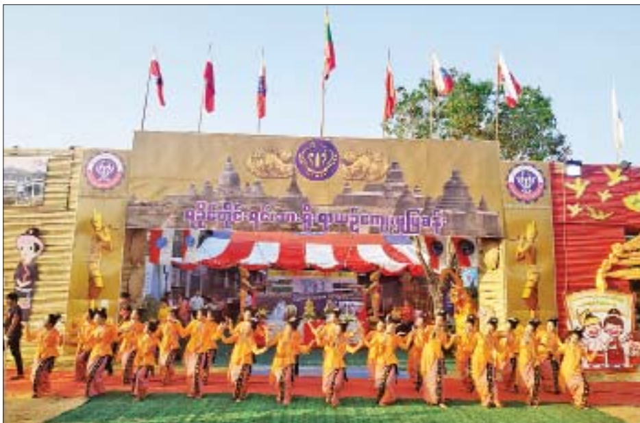
ရခိုင်တိုင်းရင်းသားရိုးရာအကဖြင့် ဖျော်ဖြေစဉ်။

မင်းနေမြို့တော်မြို့ဟောင်းများ ပြကွက်အပြားတွင် ရှေးရခိုင်တိုင်းရင်းသားတို့ ရေးသားခဲ့သည့် အက္ခရာများကို ခေတ်လေးခေတ် ကျောက်စာချပ်များဖြင့် ပြသထားရာ အက္ခရာအရေးအသားများ အဆင့်ဆင့် ပြောင်းလဲလာပုံကို လေ့လာခွင့်ရမည့်အပြင် ဧည့်ဝတီခေတ်-မြို့တော်အက္ခရာ၊ ဝေသာလီခေတ်-ဒေဝနာဂရီအက္ခရာ၊ လေးမြို့ခေတ်-ရက္ခဝတ္ထုအက္ခရာ၊ မြောက်ဦးခေတ်-ယနေသုံးအက္ခရာ