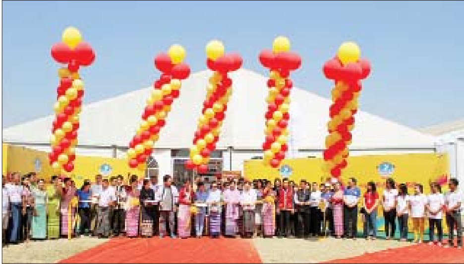
ရရှိစေရန်၊ မြန်မာနိုင်ငံ၏ ငြိမ်းချမ်းရေးလုပ်ငန်းများတွင် တစ်ဖက်တစ်လမ်းမှ အထောက်အကူပြုစေရန်၊ တိုင်းရင်းသားအချင်းချင်း စည်းလုံးညီညွတ်မှုများ တိုးတက် ဖြစ်ထွန်းစေရန်၊ ရိုးရာအစားအစာများနှင့် ယဉ်ကျေးမှုများ

ဖွင့်ပွဲအခမ်းအနားကို တိုင်းရင်းသားလူမျိုးများရေးရာ ဝန်ကြီးဌာန ပြည်ထောင်စုဝန်ကြီး နိုင်သက်လွင်၊ အာခါ တိုင်းရင်းသားလူမျိုးရေးရာဝန်ကြီး ဦးအာဗေလ၊ ဗမာ တိုင်းရင်းသားလူမျိုးရေးရာဝန်ကြီး ဦးခင်မောင်မြင့်(ခ) ဦးဒိတ်၊ မြန်မာနိုင်ငံတိုင်းရင်းသားလုပ်ငန်းရှင်များအသင်း ဥက္ကဋ္ဌ ဦးယောဆက်နှင့် တာဝန်ရှိသူများက ဖဲကြိုးဖြတ် ဖွင့်လှစ်ပေးကြသည်။