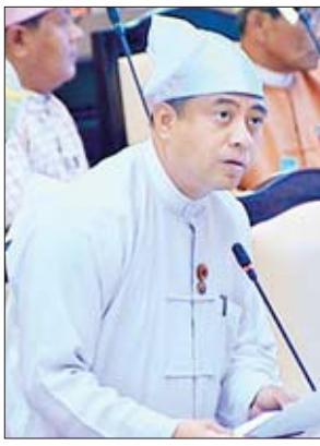
ဒုတိယဝန်ကြီး ဦးတင်လတ်

ထောက်ကြံ့မြို့ရောင်လမ်း မိုင်တိုင်(၀/၀)မှ (၀/၄)အကြား လမ်းဘေး ဝဲ/ ယာ ရှိ လမ်းနယ် ပေ ၃၀၀ တွင် ကျေးကျွဲနေသည့် အဆောက်အအုံ ၄၄ လုံးအား ၂၀၁၉ ခုနှစ် စက်တင်ဘာ ၁၀ ရက်တွင် ပထမအကြိမ်၊ ဒီဇင်ဘာ ၃ ရက်တွင် ဒုတိယအကြိမ် Notice စာ ပေးပို့ထားပြီးဖြစ်ပါကြောင်းနှင့် ဒီဇင်ဘာ