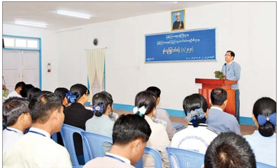
ယနေ့ဖွင့်လှစ်သည့်သင်တန်းသို့ တိုင်းဒေသကြီးနှင့် သင်တန်းသူ ၃၅ ဦးက ဖေဖော်ဝါရီ ၂၈ ရက်ထိ တက်ရောက် ပြည်နယ်များမှ မြို့နယ်ဦးစီးမှူးအဆင့် သင်တန်းသား ကြမည်ဖြစ်သည်။ သတင်းစဉ်

ပြန်ကြားရေးနှင့် ပြည်သူ့ဆက်ဆံရေးဦးစီးဌာန အနေဖြင့် ဝန်ကြီးဌာန၏ရည်မှန်းချက်များနှင့် ဦးစီးဌာန၏ လုပ်ငန်းများကို စွမ်းဆောင်ရည်မြှင့်မားစွာ အကောင်အထည်ဖော်ဆောင်ရွက်နိုင်ရေးနှင့် ကျွမ်းကျင်သည့်ဝန်ထမ်းများ ပေါ်ထွန်းလာစေရန်ရည်ရွယ်၍ စွမ်းရည်မြှင့်သင်တန်းများကို ဖွင့်လှစ်သင်ကြားပေးလျက်ရှိသည်။