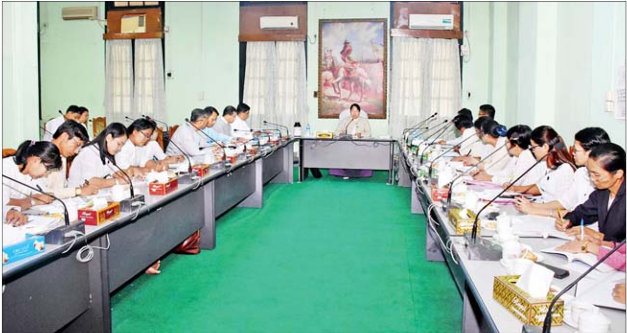
တိုးတက်ရေးဆိုင်ရာကိစ္စရပ်များကို ဆွေးနွေးတင်ပြကြရာ ပြည်ထောင်စုဝန်ကြီး က ညှိနှိုင်းပေါင်းစပ်၍ စီမံဆောင်ရွက်ပေးသည်။ စာပေဗိမာန်ကို အမျိုးသားခေါင်းဆောင်ကြီး ဗိုလ်ချုပ်အောင်ဆန်း၏ လမ်းညွှန်ချက်နှင့်အညီ ၁၉၄၇ ခုနှစ် ဩဂုတ် ၂၆ ရက်မှစတင်၍ "အမှောင်ခွင်း၍ အလင်းဆောင်အံ့" (Light, where Darkness was) ဆောင်ပုဒ်ဖြင့် ပြည်သူ့လူထု အသိပညာဗဟုသုတ ဖွံ့ဖြိုးတိုးတက်စေရန် ရည်ရွယ်ချက်ဖြင့် စာပေထုတ်ဝေရေး

တွေ့ဆုံပွဲတွင် ၂၀၁၉ ခုနှစ် နိုဝင်ဘာ ၂၇ ရက်က နိုင်ငံတော်သမ္မတ ဦးဝင်းမြင့် စာပေဗိမာန်သို့ ရောက်ရှိစစ်ဆေးစဉ် လမ်းညွှန်မှာကြားချက်များ အပေါ် လိုက်နာဆောင်ရွက်မှုအခြေအနေ၊ စာပေဗိမာန်မှ ဆောင်ရွက်လျက်ရှိ သော မြန်မာ့စွယ်စုံကျမ်း ပြန်လည်ထုတ်ဝေရေး၊ မြန်မာဂန္ထဝင်အတွဲ ၁၀၀ စာစဉ် ဆက်လက်ထုတ်ဝေရေး၊ ရွှေသွေးဂျာနယ်ထုတ်ဝေရေး၊ စာအုပ်အသင်းဝင်