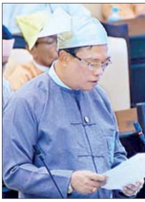
ဒုတိယဝန်ကြီး ဒေါက်တာကျော်လင်း