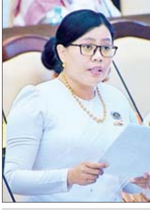
ရခိုင်ပြည်နယ် မဲဆန္ဒနယ် အမှတ် (၁၁)မှ ဒေါ်ထုမေ

၂၄ ရက်တွင် ကျူးကျော်နေသူများအား တတိယအကြိမ်သတိပေးအကြောင်းကြား စာပေးပို့ပြီးဖြစ်၍ ဖယ်ရှားရင်းလင်းပေးခြင်းမရှိပါက လမ်းမကြီးများဥပဒေနှင့် အညီ ဆက်လက်ဆောင်ရွက်သွားမည်ဖြစ်ပါကြောင်း၊ လမ်းနယ်အတွင်း ကျူးကျော်ဝင်ရောက်မှုများအား ဖယ်ရှားရင်းလင်းဆောင်ရွက်ပြီးပါက ထောက်ကြံ့မြို့ရောင်လမ်းအား ပိုမိုအဆင်ပြေချောမွေ့စွာ သွားလာအသုံးပြု နိုင်မည်ဖြစ်ပါကြောင်း ဖြေကြားသည်။