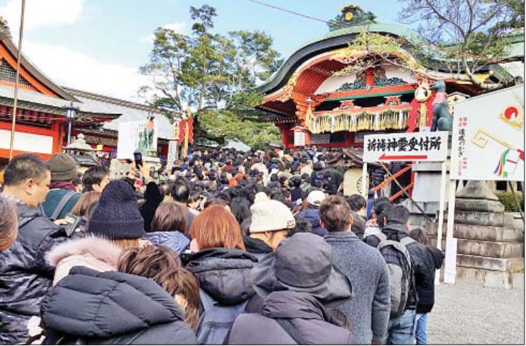
ကျိုတိုမြို့ရှိ ဖူရီမိအိနားရိနတ်ကွန်းရှေ့၌ ဆုတောင်းဝတ်ပြုရန် ကြိတ်ကြိတ်တိုးတန်းစီ စောင့်နေသည့် လူအုပ်ကြီးအား တွေ့ရစဉ်။

ဖူရီမိအိနားရိနတ်ကွန်း၏ သမိုင်းသည် များစွာရှည်လျားပြီး မြို့တော်ကို ကျိုတိုသို့