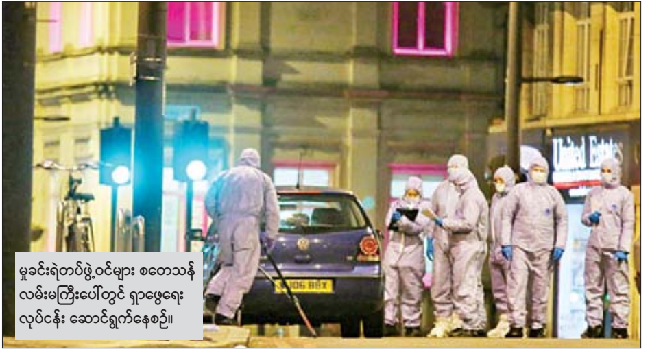
မူခင်းရဲတပ်ဖွဲ့ဝင်များ စတော့သန် လမ်းမကြီးပေါ်တွင် ရှာဖွေရေး လုပ်ငန်း ဆောင်ရွက်နေစဉ်။