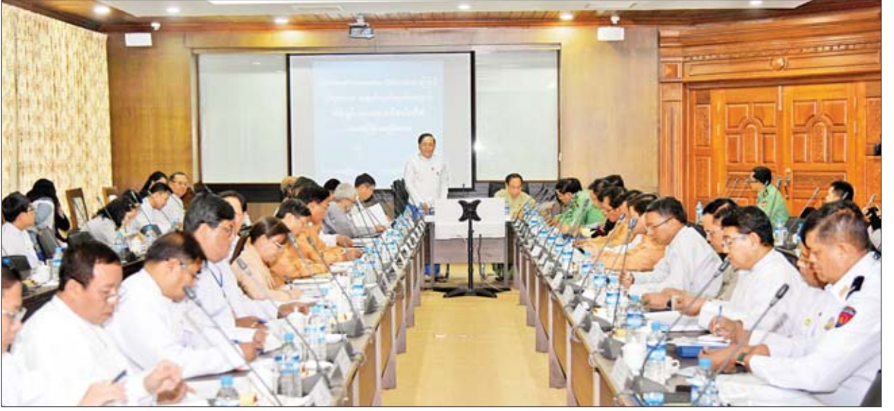
2019 Novel Coronavirus (2019-nCoV) ကြောင့် ဖြစ်ပွားသော အဆုတ်ရောင်ရောဂါ ကာကွယ်၊ ထိန်းချုပ်၊ ကုသရေးဗဟိုကော်မတီ၏ ပထမအကြိမ်အစည်းအဝေးတွင် ဗဟိုကော်မတီဥက္ကဋ္ဌ ပြည်ထောင်စုဝန်ကြီး ဦးကျော်တင် အမှာစကားပြောကြားစဉ်။

ဟိုတယ်များနှင့် တည်းခိုခန်းများမှ တာဝန်ရှိသူများ၊ ခရီးသွားလမ်းညွှန်များ၊ အငှားကား၊ ဘတ်(စ်)ကားနှင့် အဝေးပြေးယာဉ်မောင်းနှင်သူများနှင့် ယာဉ်နောက်လိုက်များအနေဖြင့် နိုင်ငံတကာခရီးသည်များတွင် ရောဂါဖြစ်ပွားမှု သံသယရောဂါလက္ခဏာများတွေ့ရှိရခြင်း၊ နာမကျန်းဖြစ်ခြင်းတို့ကို တွေ့ရှိပါက နီးစပ်ရာကျန်းမာရေးဌာနသို့ ချက်ချင်း တယ်လီဖုန်းဖြင့် အကြောင်းကြားပေးရန်မှာ အရေးကြီးပါကြောင်း၊ ကျန်းမာရေးနှင့် အားကစားဝန်ကြီးဌာနအနေဖြင့်