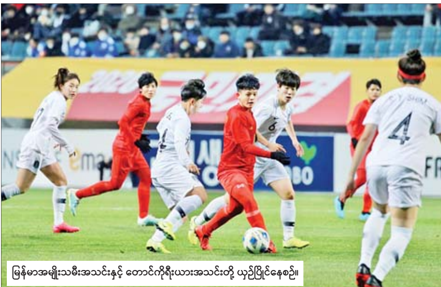
မြန်မာအမျိုးသမီးအသင်းနှင့် တောင်ကိုရီးယားအသင်းတို့ ယှဉ်ပြိုင်နေစဉ်။