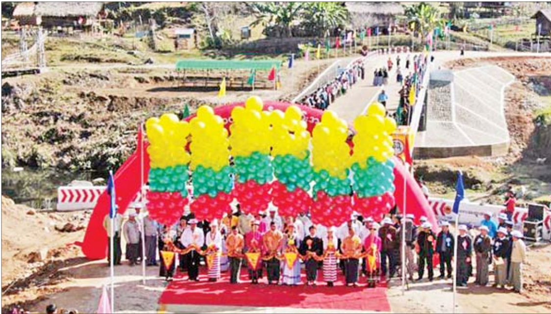
ထိခတ်တားဖွင့်ပွဲကျင်းပစဉ်။