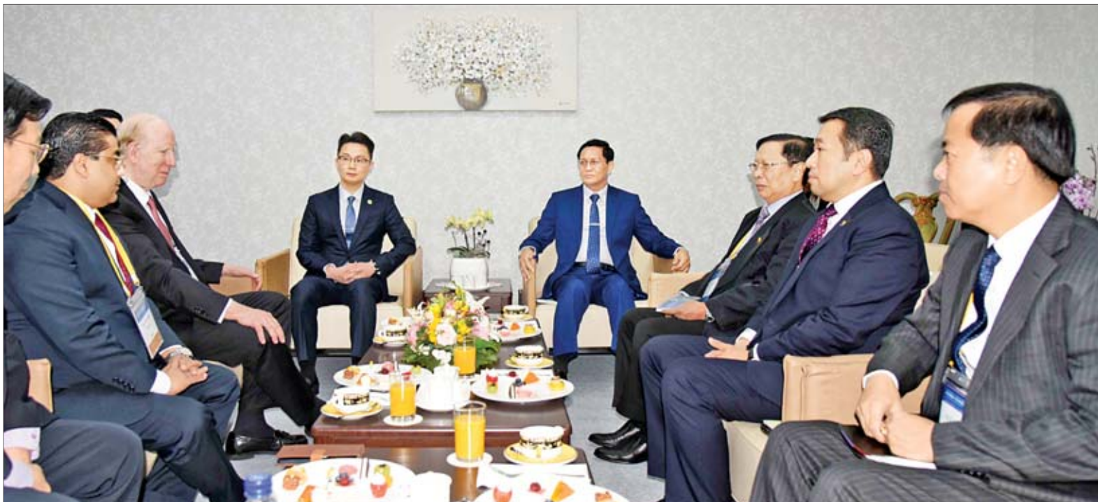
ဒုတိယသမ္မတ ဦးဟင်နရီဗန်ထီးယူ ငြိမ်းချမ်းရေး၊ လုံခြုံရေးနှင့် လူသားတိုးတက်မှုဆိုင်ရာ ကမ္ဘာ့ထိပ်သီးအစည်းအဝေး- ၂၀၂၀ ၏ အထွေထွေအတွင်းရေးမှူး Dr. Young Ho Yun အား လက်ခံတွေ့ဆုံစဉ်။

ဆိုးလ် ဖေဖော်ဝါရီ ၃ ငြိမ်းချမ်းရေး၊ လုံခြုံရေးနှင့် လူသား တိုးတက်မှုဆိုင်ရာ ကမ္ဘာ့ထိပ်သီးအစည်း အဝေး - ၂၀၂၀ သို့ တက်ရောက်ရန် ဒုတိယသမ္မတ ဦးဟင်နရီဗန်ထီးယူ သည် သာသနာရေးနှင့် ယဉ်ကျေးမှု ဝန်ကြီးဌာန ပြည်ထောင်စုဝန်ကြီး သူရဦးအောင်ကို တာဝန်ရှိသူများနှင့် အတူ ဖေဖော်ဝါရီ ၂ ရက် ညပိုင်းတွင် လေကြောင်းခရီးဖြင့် ရန်ကင်းမြို့မှ ကိုရီးယားသမ္မတနိုင်ငံသို့ ထွက်ခွာရာ ဖေဖော်ဝါရီ ၃ ရက် ဒေသစံတော်ချိန် နံနက် ၇ နာရီ ၁၅ မိနစ်တွင် ဆိုးလ်မြို့ သို့ ရောက်ရှိသည်။