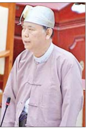
ဒုတိယဝန်ကြီး ဦးဝင်းမော်ထွန်း

အစဉ် ရှိ မရှိ မေးခွန်းနှင့်စပ်လျဉ်း၍ ဒုတိယဝန်ကြီး ဦးဝင်းမော်ထွန်းက ထနောင်း ကုန်းအခြေခံပညာမူလတန်းလွန်ကျောင်းသည် ကျောင်းသက်တမ်းအဆင့် နှစ် ၃၀ ခန့်ရှိပြီဖြစ်ပါကြောင်း၊ ကျောင်းသားဦးရေအနေဖြင့် ၁၉ ဦးသာ ရှိသော်လည်း ထိုကျောင်းသားဦးရေပြည့်မီခြင်းမရှိသည့်အတွက် အဆင့်တိုး မပေးပါက ကျောင်းသား ကျောင်းသူများအနေဖြင့် အခွင့်အလမ်းများရရှိမည် မဟုတ်ပါကြောင်း၊ လမ်းပန်းဆက်သွယ်ရေးအနေဖြင့်လည်း အနီးဆုံးကျောင်းနှင့် ၉ မိုင် ကွာဝေးပါကြောင်း၊ ထို့ကြောင့် သတ်မှတ်ချက်များရှိသော်လည်း ဖြေလျှော့ ပေးပြီး ၂၀၂၀-၂၀၂၁ ပညာသင်နှစ် ကျောင်းအဆင့်တိုးမြှင့်ခြင်းများ ဆောင်ရွက်ချိန်တွင် စိစစ်ဆောင်ရွက်ပေးမည်ဖြစ်ပါကြောင်း ရှင်းလင်းဖြေကြား သည်။