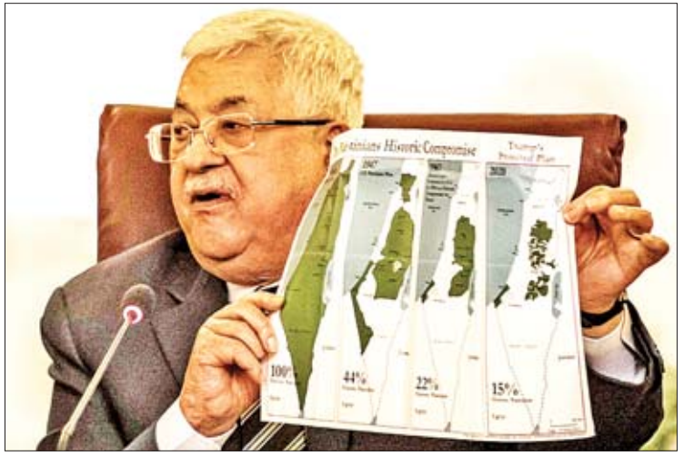
ပါလက်စတိုင်းသမ္မတ မာမူတ်အဘတ် အာရပ်အဖွဲ့ချုပ် အစည်းအဝေး၌ အမေရိကန်က အဆိုပြုထားသည့် အရှေ့အလယ်ပိုင်းဒေသ ငြိမ်းချမ်းရေးအစီအစဉ်နှင့်စပ်လျဉ်း၍ ဆွေးနွေးစဉ်။

အာရပ်အဖွဲ့ချုပ်သည် ဖေဖော်ဝါရီ ၂ ရက်တွင် အာရပ်အဖွဲ့ချုပ်ဌာနချုပ်ရှိရာ အီဂျစ်နိုင်ငံ