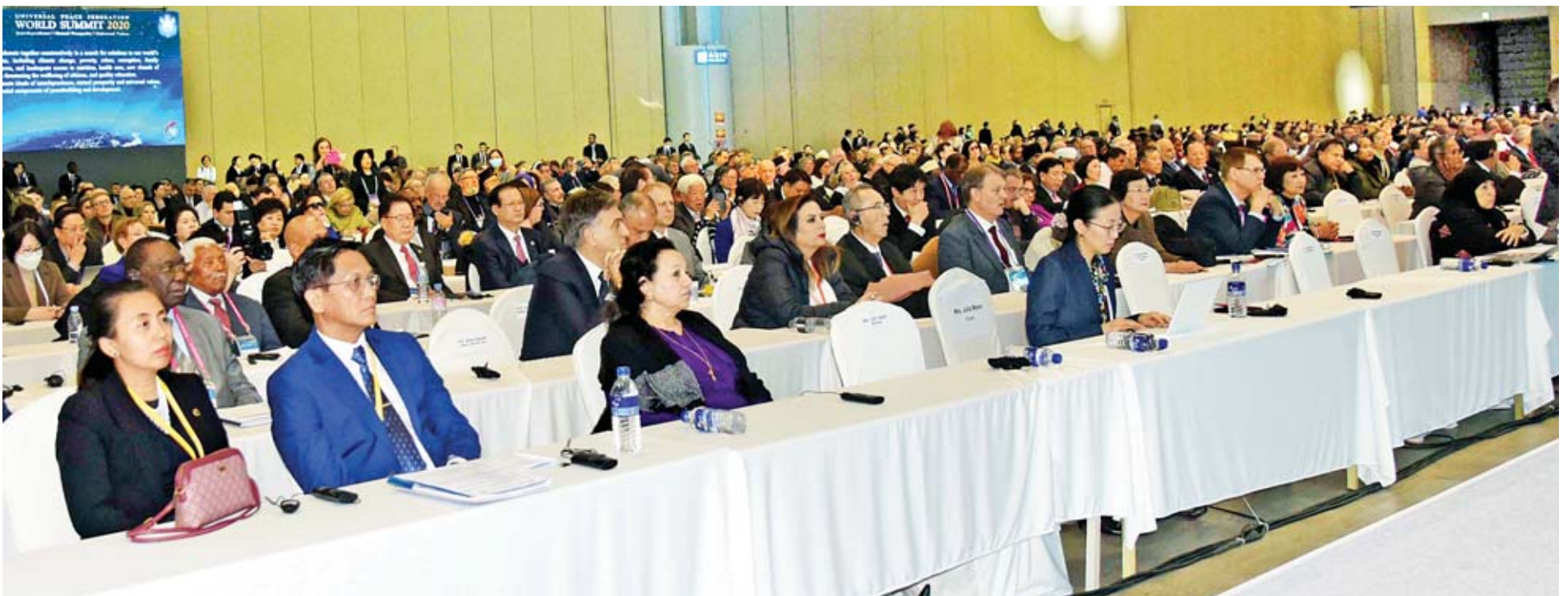
ဒုတိယသမ္မတ ဦးဟင်နရီဗန်ထီးယူ ငြိမ်းချမ်းရေး၊ လုံခြုံရေးနှင့် လူသားတိုးတက်မှုဆိုင်ရာ ကမ္ဘာ့ထိပ်သီးအစည်းအဝေး - ၂၀၂၀ ဖွင့်ပွဲအခမ်းအနားသို့ တက်ရောက်စဉ်။

[ဗိုလ်ချုပ်အောင်ဆန်း၏ ၂၃-၁-၁၉၄၆ ရက်နေ့တွင် ဗဆပလ ပြည်လုံးကျွတ် ညီလာခံသဘင်ကြီးသို့ ရှင်းလင်းတင်သွင်းသည့် ညီညွတ်ရေးအဆိုမှ ကောက်နုတ်ချက်]