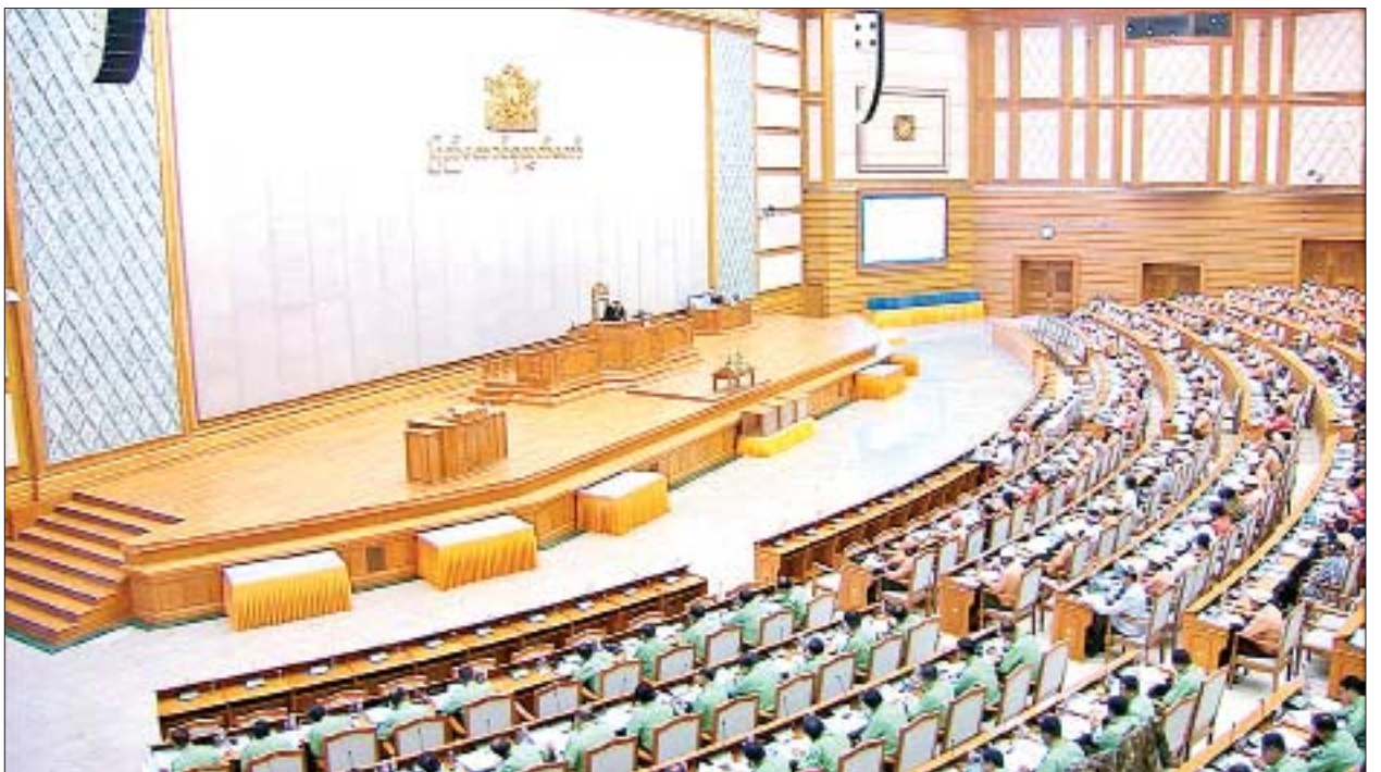
ဒုတိယအကြိမ် ပြည်ထောင်စုလွှတ်တော် (၁၅)ကြိမ်မြောက် ပုံမှန်အစည်းအဝေး ပထမနေ့ ကျင်းပစဉ်။

မြန်မာနိုင်ငံတော်ဗဟိုဘဏ်ဥပဒေပုဒ်မ ၆၆ တွင် “ဗဟိုဘဏ်သည် မည်သည့်ငွေစက္ကူ အမျိုးအစားကိုမဆို ပြောင်းလဲသုံးစွဲရန်လိုအပ်ပါက အစိုးရ အဖွဲ့၏ သဘောတူညီချက်ဖြင့် ဆောင်ရွက်နိုင်သည်။ ယင်းဆောင်ရွက်ချက် အခြေအနေကို အနီးစပ်ဆုံးကျင်းပသည့် ပြည်ထောင်စုလွှတ်တော်အစည်းအဝေး သို့ တင်ပြ၍ အတည်ပြုချက်ရယူရမည်” ဟု ပြဋ္ဌာန်းထားပါကြောင်း၊ ထို့ကြောင့် မြန်မာနိုင်ငံတော်ဗဟိုဘဏ်က ငွေစက္ကူ၏ မျက်နှာစာဘက်တွင် အမျိုးသား