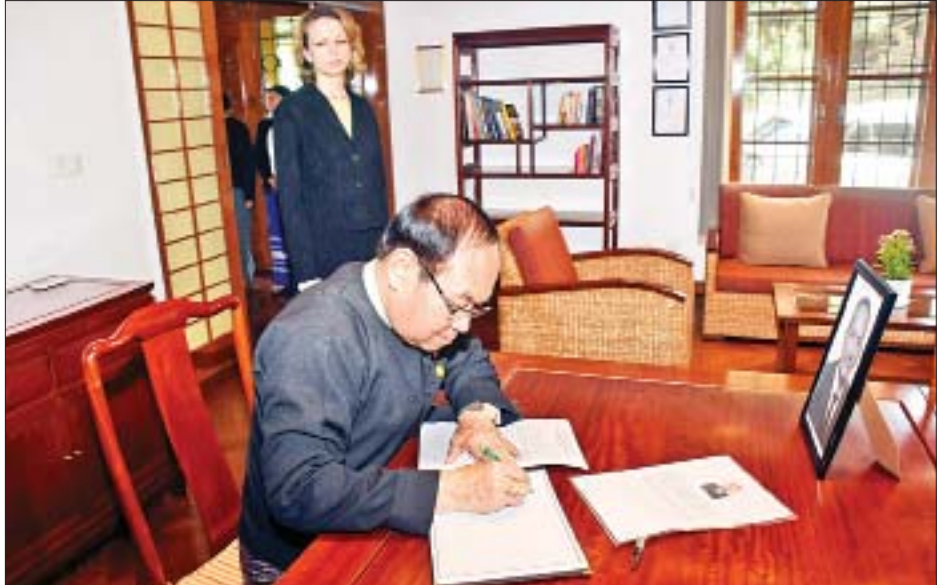
ပြည်ထောင်စုဝန်ကြီး ဒေါက်တာမြင့်ထွေး ချက်သမ္မတနိုင်ငံ၏ President of the Senate of the Parliament ဖြစ်သူ