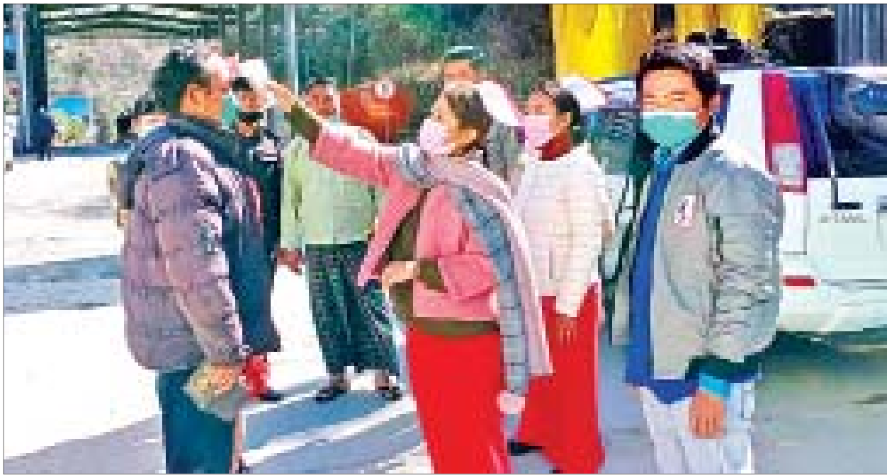
ကချင်ပြည်နယ် မြန်မာ - တရုတ် နယ်စပ် ဝင်/ထွက် ဂိတ်တစ်ခု၌ ကိုရိုနာဗိုင်းရပ်စ် တားဆီးကာကွယ်ရေးအတွက် ကျန်းမာရေးစစ်ဆေးစဉ်။