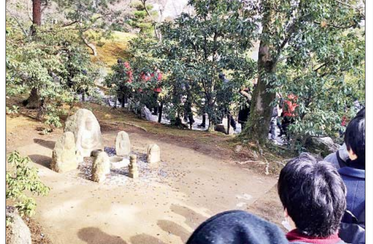
ခင်ခခုဂျိဘုရားကျောင်းဝင်းအတွင်းမှ လမ်းဘေးကုန်းမြင့်ငယ်များပေါ်ရှိ ငွေအကြွေစ များ ပစ်ထည့်ကာ ဆုတောင်းရသည့် ဗုဒ္ဓဆင်းတုတော်ငယ်များအား တွေ့ရစဉ်။

ထို့နောက် အတွင်းသို့ လက်မှတ်ဝယ်ပြီး (တစ်ဦးလျှင် ယန်း ၄၀၀ ကျသင့်ပါသည်) ဝင်ရောက်ရာ ရေကန်ကြီးနှင့် ရေကန် တစ်ဖက်ကမ်းစပ်တွင် လှပသောသစ်ရွာ တည်ရှိနေသော ရွှေကျောင်းတော်အား တွေ့ရပါသည်။ လူများစွာသည် ကျောင်း နောက်ခံဖြင့် ဓာတ်ပုံများ ရိုက်ယူကြ ပြီးနောက် ကန်ပတ်လမ်းအတိုင်း ရွှေကျောင်း တော်နှင့် နီးရာသို့ တရွေ့ရွေ့သွားနေကြသည်။ စာရေးသူလည်း ကန်ကြီးနှင့်တကွ ရွှေကျောင်း တော်ကြီးအား ဓာတ်ပုံများ ရိုက်လိုက်၊ လူတန်းကြီးနှင့် စီးမျောလိုက်ဖြင့် ရွှေကျောင်း တော်ကြီးအနီးသို့ ရောက်သွားသည်။ ရွှေကျောင်းတော်ကြီးဟု ဆိုရငြားလည်း အမှန်တော့ ကန်ရေပြင်အစပ်တွင် တည်ရှိ သော ရိုးရှင်းလှပသည့် ရွှေချထားသော သုံးထပ် အဆောက်အအုံလေးတစ်ခုသာ ဖြစ်ပါသည်။ လေတိုက်လျှင်ပင် လွင့်သွားမည့် စက္ကူကျောင်းဆောင် အရုပ်လေးသဖွယ် ခံစားတွေ့မြင်ရသည်။ သို့သော် တန်ခိုးကား ကြီးမားလှသည်။ နှစ်စဉ် ကမ္ဘာအနှံ့မှ သောင်း၊ သိန်းချီသော လူများစွာသည် ကျိုတိုသို့ ရောက်ရှိလည်ပတ်ခိုက် အဆိုပါ ရွှေကျောင်းတော်အား မျက်မြင်ကြည့်ရှုရန် ခင်ခခုဂျိဘုရားကျောင်းသို့ မပျက်မကွက် ရောက်ရှိကြသည်။ ရွှေကျောင်းတော်အား ကြည့်ရှုလေ့လာပြီးနောက် ရွှေကျောင်းတော် မှ ဘုရားကျောင်း ထွက်ပေါက်သို့ ပြန်ထွက်ရာ လမ်းတစ်လျှောက်တွင် တောအုပ်ငယ်လေး များ၊ ရေတံခွန် စိမ့်စမ်းငယ်လေးများ၊