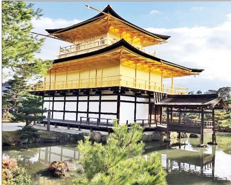
ခင်ခခုဂျိဘုရားကျောင်းဝင်းအတွင်းရှိ ရွှေကျောင်းတော်။

ကျိုတိုမြို့သို့ ရောက်ရှိနေသည့်မှာ သုံးလ အတိတ်ရှိခဲ့ပြီ ဖြစ်သည်။ ကျိုတိုသည် ဂျပန် နိုင်ငံ၏ နှစ်ပေါင်း ၁၀၀၀ ကျော်မက တည်တံ့ ခဲ့သော မြို့တော်ဟောင်းဖြစ်ခဲ့သည့်အတွက် လေ့လာကြည့်ရှုလည်ပတ်စရာ ဂျပန်ရိုးရာ ရှင်တိုနတ်ကျွန်းများ (Shrines)၊ ဗုဒ္ဓဘာသာ ဘုရားကျောင်းများ (Temples) အထူးပေးစာများ လှပါသည်။ စာရေးသူနေထိုင်သော အဆောင် နှင့် မလှမ်းမကမ်းတွင် ရှေးကျကြီးမားလှ သော နတ်ကျွန်းများ၊ ဘုရားကျောင်းများ ရှိပါသည်။ အဆောင်အနောက်ဘက် ကပ်လျက်တွင်ပင် အတန်အသင့် ကြီးမား သော ဘုရားကျောင်းတစ်ခု ရှိနေသည့်ဖြစ်ရာ ထိုနေရာများသို့ အလှည့်သွားသလို ရောက်ရှိ ဖြစ်သော်လည်း ကျိုတိုရှိ အခြားထင်ရှား သော နတ်ကျွန်းများနှင့် ဘုရားကျောင်းများ သို့မူ ယခုတိုင် မရောက်ရှိသေးပါချေ။ ကျိုတိုတွင် ဂျပန်နိုင်ငံတွင်သာမက နိုင်ငံ တကာအထိတွင် လူသိများထင်ရှားသော ဘုရားကျောင်းတစ်ခုမှာ ခင်ခခုဂျိ ဘုရားကျောင်း ဖြစ်ပါသည်။ ခင်ခခုဂျိအား ရွှေကျောင်းတော်ဟုလည်း လူသိများ ပါသည်။