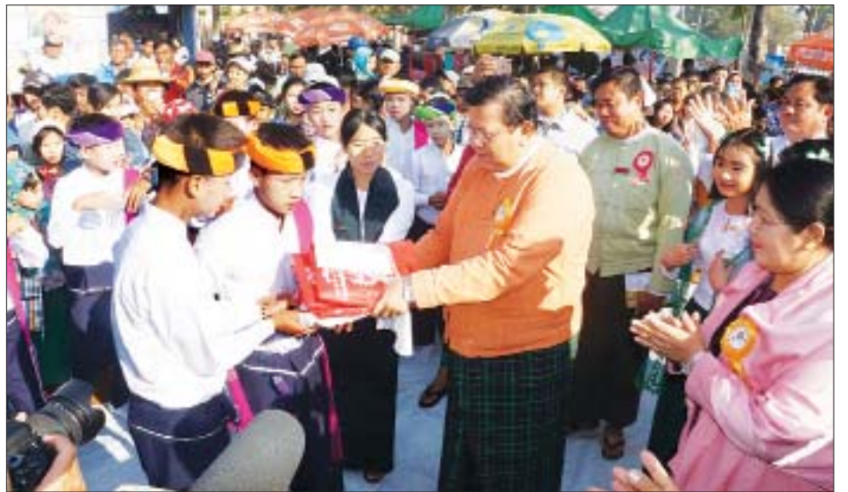
တန်းကျောင်း၌ ဇန်နဝါရီ ၂၇ ရက်မှ ၂၈ ရက်အထိ နေ့စဉ် မည်သူမဆို လွတ်လပ်စွာ ပါဝင်ဆင်နွှဲနိုင်ကြောင်း သိရ နံနက် ၉ နာရီမှညနေ ၅ နာရီအထိ ကျင်းပသွားမည်ဖြစ်ရာ သည်။ တိုင်းဒေသကြီး(ပြန်/ဆက်)

ထို့နောက်တိုင်းဒေသကြီးဝန်ကြီးချုပ်နှင့်ညှိညှိတော် များသည် ကလေးစာပေပွဲတော် (ကြိမ်) ၌ ခင်းကျင်းပြသ ထားသည့် ထူးချွန်ထင်ရှားစရာဝတ်တိုင်းသားများပြခန်း၊ ကလေးစာဖတ်ခန်း၊ ပြိုင်ပွဲများ၊ ပညာရေး၊ ရဲတပ်ဖွဲ့၊ စိုက်ပျိုး ရေးနှင့်သစ်တော၊ မွေးမြူရေးနှင့်ကုသရေး၊ စည်ပင်သာယာ ရေးအဖွဲ့၊ ကျေးလက်ဒေသ ဖွံ့ဖြိုးတိုးတက်ရေးဦးစီးဌာန ပြခန်း၊ ကျန်းမာရေးနှင့်ကြက်ခြေနီတပ်ဖွဲ့ပြခန်းနှင့် ရင်ခွင်မဲ့ ကလေးငယ်များလျှော့ချရေးနှင့် ကာကွယ်စောင့်ရှောက် ရေးအသင်းပြခန်းများ၊ မြန်မာ့ဆက်သွယ်ရေးလုပ်ငန်း၏ Unicode စနစ်ပြောင်းလဲရေး ဝန်ဆောင်မှုပေးခြင်းဆောင် ရွက်နေမှုများ၊ အားကစားပြိုင်ပွဲများ ယှဉ်ပြိုင်နေမှု၊ တိုင်း ဒေသကြီးရဲတပ်ဖွဲ့မှူးရုံး၏ မှုခင်းအသိပညာပေး မော်တော် ယာဉ်ဖြင့် အသိပညာပေးဆောင်ရွက်နေမှုများနှင့် စာအုပ် အရောင်းဆိုင်များအား လှည့်လည်ကြည့်ရှုအားပေးခဲ့သည်။ ရောဂါတိုင်းဒေသကြီးအတွင်းရှိမြို့နယ် ၂၆ မြို့နယ်၌ ကလေးစာပေပွဲတော်များကို ကျင်းပလျက်ရှိရာ ကလေး စာပေပွဲတော်(ကြိမ်)ကို အမှတ် (၁)အခြေခံပညာ အထက်