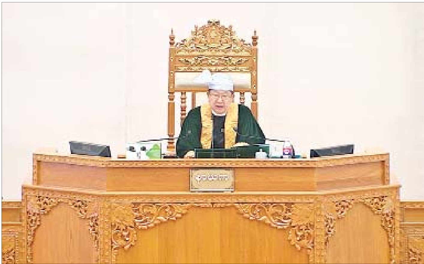
ပြည်ထောင်စုလွှတ်တော်နာယက ဦးတိခွန်မြတ်။