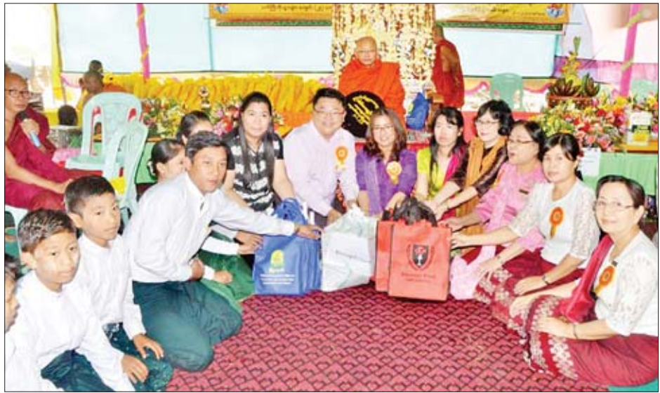
အစည်းက ဆက်ကပ်လှူဒါန်းသည့် Ph.D, Buddhism တို့ကို ရရှိတော်မူခဲ့သည်။ လှူဒါန်းမှုတွင် ဆရာတော်နှင့် ဒါယကာ ဒါယိကာမ များ စုစုပေါင်းလှူဒါန်းငွေ ကျပ်သိန်း ၆၀၀ ကျော် လှူဒါန်း ခဲ့ကြောင်း သိရသည်။