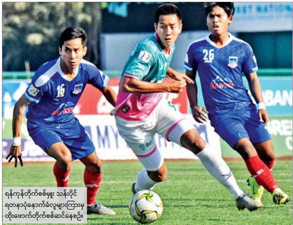
ရန်ကုန်တိုက်စစ်မှူး သန်းပိုင် ရတနာပုံနောက်ခံလူများကြားမှ ထိုးဖောက်တိုက်စစ်ဆင်နေစဉ်။