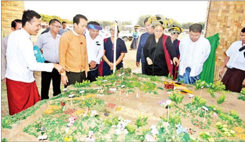
ရန်ကုန်တိုင်းဒေသကြီး ဝန်ကြီးချုပ် ဦးဖြိုးမင်းသိန်း သွေးချင်းတို့ရဲ့ပွဲတော်ဆီ ပွဲတော်ကျင်းပနိုင်ရေး ပြင်ဆင် ဆောင်ရွက်ထားရှိမှုအခြေအနေများ ကြည့်ရှုစစ်ဆေးစဉ်။

ထို့နောက် မြန်မာနိုင်ငံ တိုင်းရင်းသားလုပ်ငန်းရှင်များ အသင်းဥက္ကဋ္ဌ ဦးယောဆက်၊ ကယားတိုင်းရင်းသား လုပ်ငန်းရှင်များအသင်းဥက္ကဋ္ဌ ဦးထွန်းကျော်နှင့် ကော်မတီ အသီးသီးမှ တာဝန်ရှိသူများက ပွဲတော်ကြီးအောင်မြင်စွာ ကျင်းပနိုင်ရေးအတွက် ပြင်ဆင်ဆောင်ရွက်ထားရှိမှုနှင့် လိုအပ်ချက်များကို ရှင်းလင်းတင်ပြကြသည်။