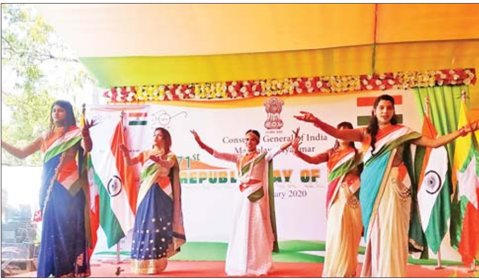
ဂုဏ်ကျေးဇူးကို အောက်မေ့သတိရသောအားဖြင့် ကျင်းပ ခြင်းဖြစ်ကြောင်း၊ အိန္ဒိယပြည်သူများက နိုင်ငံ၏ လွတ်လပ်မှု၊ မျှတမှု၊ တရားဥပဒေစိုးမိုးမှု၊ စီးပွားရေးဖွံ့ဖြိုး တိုးတက်မှုနှင့် အမျိုးသား အမျိုးသမီး သာတူညီမျှမှုတို့ အတွက် ဖွဲ့စည်းပုံအခြေခံဥပဒေကို သူတို့ကိုယ်တိုင် ဖော်ဆောင်ခဲ့ကြပါကြောင်း၊ နှစ်နိုင်ငံနယ်နိမိတ်ဖြစ်သည့် တမူး-မိုးရေးနယ်စပ်တွင် အပြည်ပြည်ဆိုင်ရာနယ်စပ်ဂိတ် ဖွင့်လှစ်ပြီးနောက် နှစ်နိုင်ငံလုံးမှ ကုန်သွယ်ရေး၊ ယဉ်ကျေးမှု အားကစား၊ စီးပွားရေးကိုယ်စားလှယ်များ၊ ဆေးကုသရေး၊ ခရီးသွားလုပ်ငန်း၊ ဘုရားဖူးခရီးသွားနှင့် ပြည်သူများ အပြန်အလှန်ကူးသန်းဆက်စပ်မှုများကို နယ်စပ်အသုံးပြုခြင်းအားဖြင့် ပိုမိုများပြားစွာလုပ်ဆောင်နိုင် ကြောင်း ပါရှိသည်။ ထို့နောက် မန္တလေးမြို့ပေါ်မှ အဆိုအကအဖွဲ့တို့က ယဉ်ကျေးမှုအကသီချင်းများ၊ ဇာတ်မာန်တေးသီချင်းတို့ ဖြင့် ဖျော်ဖြေတင်ဆက်ကြပြီး ကောင်စစ်ဝန်ချုပ်နှင့် တာဝန် ရှိသူများက ကပြဖျော်ဖြေသီချင်းများအား ဂုဏ်ပြု မှတ်တမ်းလွှာများ ပြန်လည်ပေးအပ်၍ စုပေါင်း မှတ်တမ်းတင်ဓာတ်ပုံရိုက်ကြကာ တက်ရောက်လာသည့် ဧည့်သည်တော်များအား အိန္ဒိယအစားအစာဖြင့် ဂုဏ်ပြု ကျွေးမွေးဧည့်ခံကြောင်း သိရသည်။ တင်မောင်မန်းကိုယ်ပွား

မန္တလေး ဇန်နဝါရီ ၂၆ (၇၁) နှစ်မြောက် အိန္ဒိယသမ္မတနိုင်ငံအမျိုးသားနေ့ အခမ်းအနားကို မန္တလေးမြို့အခြေစိုက် အိန္ဒိယကောင်စစ်ဝန် ချုပ်ရုံးက ကြီးမှူး၍ မန္တလေးမြို့၊ ချမ်းမြသာစည်မြို့နယ် မြို့သစ်ရှိ အိန္ဒိယကောလိပ် ဇန်နဝါရီ ၂၆ ရက် နံနက် ၁၀ နာရီတွင် ကျင်းပခဲ့သည်။ အခမ်းအနားသို့ အိန္ဒိယကောင်စစ်ဝန်ချုပ်နှင့်ဇော်စိုး၊ တာဝန်ရှိသူများ၊ အားကစားနှင့် ကာယပညာသိပ္ပံ ကျောင်းအုပ်ကြီး ညွှန်ကြားရေးမှူး ဦးမျိုးမြင့်အောင်နှင့် ဌာနဆိုင်ရာများ၊ မန္တလေး ခုနစ်မြို့နယ်နှင့် တောင်ကြီး၊ သာစည်၊ တမူး၊ ကလေး၊ မုံရွာ၊ စစ်ကိုင်း၊ ရွှေဘို၊ ကျောက်ဆည်၊ ပြင်ဦးလွင်၊ မိုးကုတ်၊ မိတ္ထီလာ၊ မြင်းခြံ၊ လားရှိုး စသည့်မြို့တို့မှ အိန္ဒိယမျိုးနွယ်စုများနှင့် မိတ်ဆွေများ၊ အိုင်တီလုပ်ငန်းနှင့် အိန္ဒိယကုမ္ပဏီများတွင် အလုပ်လုပ်နေကြသော အိန္ဒိယလူမျိုးများ၊ ကုန်သည်ကြီး များ၊ မန္တလေးမြို့မှ တာသာရေး၊ လူမှုရေးအသင်းအဖွဲ့များ၊ စာရေးဆရာ၊ သတင်းစာဆရာကြီးများ၊ ကျောင်းဆရာ ဆရာမများ၊ ကျောင်းသား ကျောင်းသူများ၊ အဆိုအကအဖွဲ့ များ၊ ဖိတ်ကြားထားသောဧည့်သည်တော်များ စုစုပေါင်း ၅၀၀ ကျော် တက်ရောက်ကြသည်။ ရှေးဦးစွာ မန္တလေးမြို့အခြေစိုက်အိန္ဒိယကောင်စစ်ဝန် ချုပ် Mr. Nandan Singh Bhaisorla က ဦးဆောင်၍ တက်ရောက်လာသည့် ဧည့်သည်တော်များနှင့်အတူ အစီ အစဉ်အတိုင်း အိန္ဒိယနိုင်ငံတော်အလံကို လွှတ်တင်ပြီး အိန္ဒိယနိုင်ငံသမ္မတ၏ မိန့်ခွန်းကိုဖတ်ကြားရာ မိန့်ခွန်း တွင် လွန်ခဲ့သော နှစ် ၇၀ က အိန္ဒိယနိုင်ငံ လွတ်လပ်ရေး အတွက် စွန့်လွှတ်အနစ်နာခံခဲ့ကြသော ခေါင်းဆောင်တို့၏