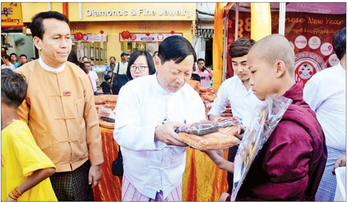
အခမ်းအနားအပြီးတွင် ပြည်ထောင်စုဝန်ကြီး၊ တိုင်းဒေသကြီးဝန်ကြီးချုပ်၊ နီပေါသံအမတ်ကြီး၊ အလှူရှင်များက ဆရာတော်၊ သံဃာတော် အပါး ၁၀၀၀ နှင့် သီလရှင်ဆရာလေး အပါး ၅၀၀ တို့အား ဆွမ်းဆန်စိမ်းလောင်းလှူကြသည်။ သတင်းစဉ်

ယင်းနောက်နိုင်ငံတော်သံဃမဟာနာယကအဖွဲ့ဥက္ကဋ္ဌ ဗန်းမော်ကျောင်းတိုက် ဆရာတော်ထံမှ ပြည်ထောင်စုဝန်ကြီး၊ တိုင်းဒေသကြီးဝန်ကြီးချုပ်၊ နီပေါသံအမတ်ကြီး၊ အလှူရှင်များနှင့် ဧည့်ပရိသတ်တို့က ရေစက်ချအနုမောဒနာတရား နာယူကြပြီး လှူဒါန်းမှုအစုစုတို့အတွက် ရေစက်သွန်းလောင်းအမျှပေးဝေကြပြီး အခမ်းအနားကို ရုပ်သိမ်းလိုက်သည်။