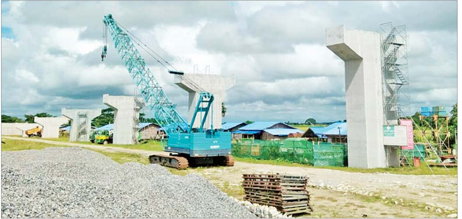
ကျွန်းပြသဒ်မြစ်ကူးတံတားတည်ဆောက်နေမှုကို တွေ့ရစဉ်။