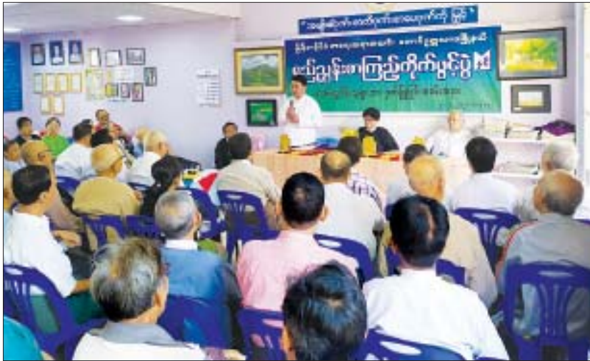
ထိုပြင် မဂ္ဂဇင်းများ၊ ဝတ္ထုတိုစာအုပ်များ၊ ရာဇဝင်များကိုထားရှိ၍ နေ့စဉ်နံနက် ၈ နာရီမှ ဆောင်းပါးပေါင်းချုပ်နှင့် မြန်မာ့စွယ်စုံကျမ်းအနစ်ချုပ်၊ နက္ခတ္တရောင်ခြည် မဂ္ဂဇင်းစာတွဲများနှင့် အခြားစာပေအမျိုးမျိုးအပါအဝင် စာအုပ်ပေါင်း ၂၀၀၀ ကျော်ရှိပြီး နေ့စဉ်ထုတ်သတင်းစာများ၊ ဂျာနယ်များကိုထားရှိ၍ နေ့စဉ်နံနက် ၈ နာရီမှ ညနေ ၄ နာရီအထိ ဖွင့်လှစ်ကာ စာအုပ်များ ငှားရမ်းပေးမည်ဖြစ်ကြောင်း သိရသည်။

ထိုရည်ညွှန်းစာကြည့်တိုက်သည် မြေအကျယ်ပေ ၃၀-၃၅ ပတ်လည်တွင် နှစ်ထပ်အုတ်ညှပ်အဆောက်အအုံအဖြစ် တည်ဆောက်ထားပြီး တောင်ဥက္ကလာပမြို့နယ်၏ အမျိုးသားစာပေဆု၊ တစ်သက်တာစာပေဆုရ စာရေးဆရာကြီးများ၏ ရေးသားသော စာအုပ်များကို အဓိကထားရှိမည်ဖြစ်ပြီး မြန်မာနိုင်ငံစာရေးဆရာအသင်းမှ နာမည်ကျော် စာရေးဆရာကြီးများ၏ သုတ၊ ရသ စာပေအမျိုးမျိုးကို ထားရှိမည်ဖြစ်သည်။