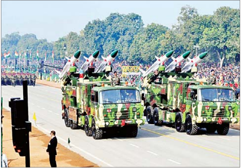
အခမ်းအနား၌ ဂုဏ်ထူးဆောင်ဧည့်သည်အဖြစ် ကျားကို တွစ်တာမှတစ်ဆင့် နှုတ်ခွန်းဆက်ခဲ့သည်။ တက်ရောက်ခဲ့သည်။ ဝန်ကြီးချုပ် နရန်ဒရာမိုဒီက ကိုးကား - ဆင်ပွား အိန္ဒိယသမ္မတနိုင်ငံ အမျိုးသားနေ့တွင် တိုင်းသူပြည်သား တာသာပြန် - အောင်ဇော်လင်း

အဆိုပါအခမ်းအနားသို့ နိုင်ငံခြားတိုင်းပြည်များမှ အကြီးအကဲများလည်း တက်ရောက်ခဲ့ကြသည်။ ဘရာဇီး သမ္မတ ဂျဲမက်ဆီးယက်စ်ဘောဆိုနိုရီသည် စစ်ရေးပြပွဲ