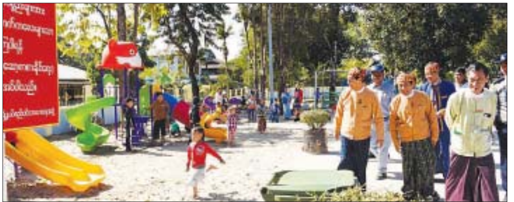
ကချင်ပြည်နယ်ဝန်ကြီးချုပ် တိုင်းရင်းသားစာပေနှင့် ယဉ်ကျေးမှုအဖွဲ့များနှင့်တွေ့ဆုံ