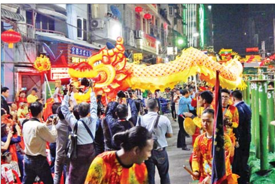
ခြင်္သေ့နဂါးအကအလှ စွမ်းရည်ပြိုင်ပွဲစဉ်။

ရန်ကုန် ဇန်နဝါရီ ၂၆ ၂၀၂၀ ပြည့်နှစ် တရုတ်နှစ်သစ်ကူး ပွဲတော် (ရန်ကုန်)အထိမ်းအမှတ်အဖြစ် မြန်မာနိုင်ငံ ခြင်္သေ့နှင့် နဂါးအကအဖွဲ့ ချုပ်က ကြီးပွားကျင်းပသော (၁၅) ကြိမ် မြောက် တရုတ်ရိုးရာ ခြင်္သေ့နဂါးအက အလှ စွမ်းရည်ပြိုင်ပွဲကို စဥ့်အိုးတန်း အထက်လမ်း၌ ယနေ့ညပိုင်းမှစတင်၍ ကျင်းပရာ ဖွင့်ပွဲ၌ ပေအရှည်ဆုံးဖြစ် သည့်နဂါးအကဖြင့် လှည့်လည်သရုပ် ပြသ၍ ကပြဖျော်ဖြေခဲ့ကြောင်း သိရ သည်။