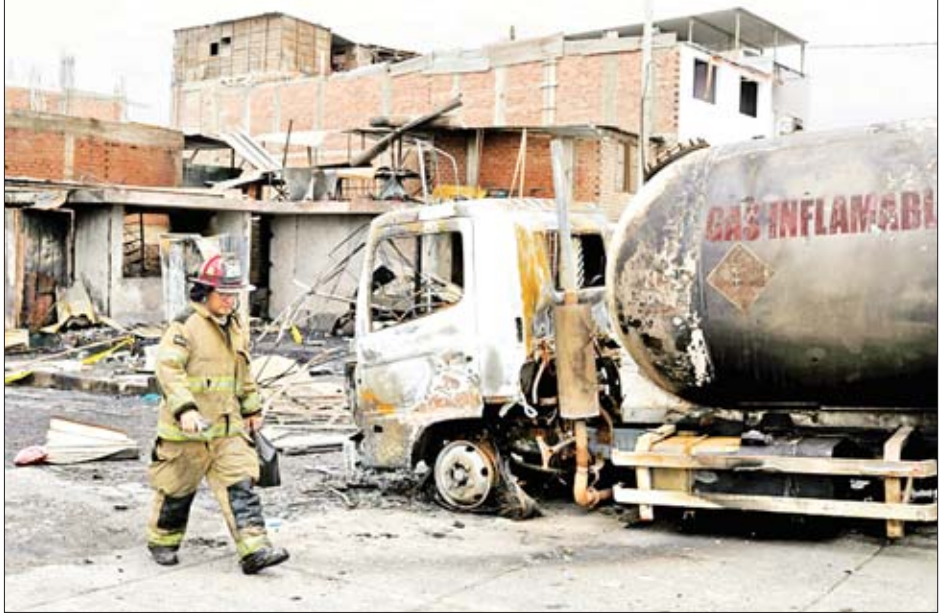
ပေါက်ကွဲမှုဖြစ်ပေါ်ခဲ့သော လောင်စာဆီတင်ယာဉ်ကို တွေ့ရစဉ်။

ကိုးကား - အေအက်ဖ်ပီ တာသာပြန် - ကျော်ထိုက်စိုး