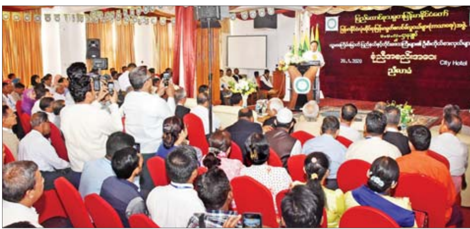
သာသနာရေးနှင့် ယဉ်ကျေးမှုဝန်ကြီးဌာန ပြည်ထောင်စုဝန်ကြီး သူရဦးအောင်ကို မြန်မာနိုင်ငံလုံးဆိုင်ရာ မြန်မာ့မွတ်စလင်လူငယ်များ(ဘာသာရေး)အဖွဲ့ဌာနချုပ် ပဉ္စမအကြိမ်မြောက် ပြည်နယ်နှင့် တိုင်းဒေသကြီးများ၏ ဦးစီးကိုင်စားလှယ်များ စုံညီအစည်းအဝေးညီလာခံတွင် အမှာစကားပြောကြားစဉ်။

ရန်ကုန် ဇန်နဝါရီ ၂၆ မြန်မာနိုင်ငံလုံးဆိုင်ရာ မြန်မာ့မွတ်စလင်လူငယ်များ(ဘာသာရေး)အဖွဲ့ (မ - မ - လ ဌာနချုပ်)၏ ပဉ္စမအကြိမ်မြောက် ပြည်နယ်နှင့် တိုင်းဒေသကြီးများ၏ ဦးစီးကိုင်စားလှယ်များ စုံညီအစည်းအဝေးကို ယနေ့နံနက် ၉ နာရီခွဲတွင် ရန်ကုန်မြို့၊ City Hotel Yangon ၌ ကျင်းပသည်။