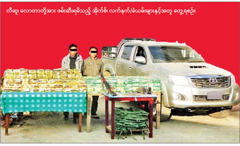
လီဆူ၊ လောတာတို့အား ဖမ်းဆီးရမိသည့် အိုက်စစ်၊ လက်နက်/ခဲယမ်းများနှင့်အတူ တွေ့ရစဉ်။

ထို့အတူ ယင်းနေ့ ၂၆ နာရီတွင် မူးယစ်ဆေးဝါး တားဆီးနှိမ်နင်းရေးရဲတပ်ဖွဲ့မှ တပ်ဖွဲ့ဝင်များပါဝင်သော ပူးပေါင်းအဖွဲ့သည် တာချီလိတ်မြို့နယ် မိုင်းကိုးကျေးရွာ အုပ်စု မယ်လိတ်ပါကော်ကျေးရွာအနီး မယ်လိတ်ပါကော်-လွမ်းစေတီသွားလမ်း သစ်ခေါက်ခြံတောလမ်းပေါ်၌ ဆိုင်ကယ်တစ်စီးနှင့် Toyota Hilux Vigo ယာဉ်တစ်စီးတို့ ရပ်တန့်ထားသည်ကို တွေ့ရှိသဖြင့် စစ်ဆေးရှာဖွေရာ ဆိုင်ကယ်ဘေးမှ စိတ်ကြွေးသွပ်ဆေးပြား ၃၆၀၀၀ ကို လည်းကောင်း၊ အလားတူ တာချီလိတ်မြို့နယ် မိုင်းကိုး ကျေးရွာအုပ်စု မယ်လိတ်ပါကော်-လွမ်းစေတီသွားလမ်း သစ်ခေါက်ခြံအနီး၌ Toyota Hilux Vigo ယာဉ်တစ်စီး ရပ်တန့်ထားသည်ကို တွေ့ရှိသဖြင့် စစ်ဆေးရှာဖွေရာ ကဖင်း ၁၀၀၀ ကီလို စုစုပေါင်းငွေကျပ် သိန်းပေါင်း ၄၆၀၀ တန်ဖိုးရှိ မူးယစ်ဆေးဝါးများကို သိမ်းဆည်းရမိခဲ့သဖြင့် ၎င်းတို့အား မူးယစ်ဆေးဝါးနှင့် စိတ်ကြွေးသွပ်ဆေးဝါးများ ဆိုင်ရာ ဥပဒေအရ အရေးယူထားကြောင်း သိရသည်။ ရဲပြန်ကြား