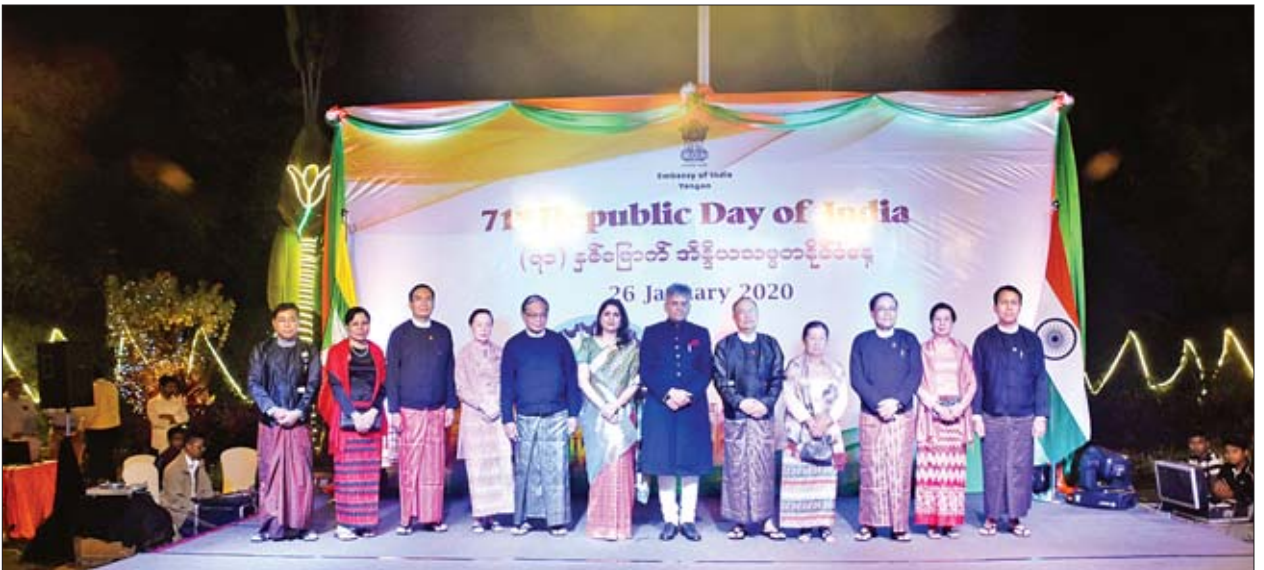
ထွန်းထွန်းနောင်နှင့်ဇော်စိုး၊ ဒုတိယဗိုလ်ချုပ်ကြီး မင်းနောင်နှင့်ဇော်စိုး၊ ရန်ကုန်တိုင်း ဒေသကြီး စစ်ဌာနချုပ်တိုင်းမှူး ဗိုလ်ချုပ်သက်ပုံနှင့်ဇော်စိုး၊ ကာကွယ်ရေးဝန်ကြီးဌာန ဒုတိယဝန်ကြီး ဗိုလ်ချုပ်မြင့်နွယ်၊ ပြန်ကြားရေးဝန်ကြီးဌာန ဒုတိယဝန်ကြီး ဦးအောင်လှထွန်းနှင့်ဇော်စိုး၊ ရန်ကုန်တိုင်းဒေသကြီး ရခိုင်တိုင်းရင်းသားလူမျိုး ရေးရာဝန်ကြီး ဦးဇော်အေးမောင်၊ တပ်မတော်အရာရှိကြီးများ၊ ရန်ကုန်မြို့ရှိ နိုင်ငံခြားသံရုံးများမှ သံအမတ်ကြီးများ၊ သံရုံးယာယီတာဝန်ခံများ၊ ကုလသမဂ္ဂ ဆိုင်ရာ ဌာနကော်မတီဝင်များနှင့် ဖိတ်ကြားထားသူများ တက်ရောက်ကြ သတင်းစဉ်

ရန်ကုန် ဇန်နဝါရီ ၂၆ အိန္ဒိယသမ္မတနိုင်ငံ၏ (၇၁)နှစ်မြောက် အမျိုးသားနေ့အထိမ်းအမှတ် ညွှန်ပွဲ အခမ်းအနားကို ယနေ့ ည ၇ နာရီတွင် ရန်ကုန်မြို့၊ ဒဂုံမြို့နယ် သံတမန်လမ်း အမှတ် (၃၅) ရှိ အိန္ဒိယသမ္မတနိုင်ငံသံအမတ်ကြီး နေအိမ်ဝင်း၌ ကျင်းပသည်။ ရှေးဦးစွာ ပြည်ထောင်စုသမ္မတမြန်မာနိုင်ငံတော်သီချင်းနှင့် အိန္ဒိယသမ္မတ နိုင်ငံ နိုင်ငံတော်သီချင်းတို့ဖြင့် အခမ်းအနားကို စတင်ဖွင့်လှစ်သည်။ ထို့နောက် မြန်မာနိုင်ငံဆိုင်ရာ အိန္ဒိယသမ္မတနိုင်ငံ သံအမတ်ကြီး မစ္စတာ ဆော်ရက်(ဘ်)ကူမားနှင့် ပို့ဆောင်ရေးနှင့် ဆက်သွယ်ရေးဝန်ကြီးဌာန ပြည်ထောင်စုဝန်ကြီး ဦးသန့်စင်မောင်တို့က နှုတ်ခွန်းဆက်စကားပြောကြားကြ သည်။