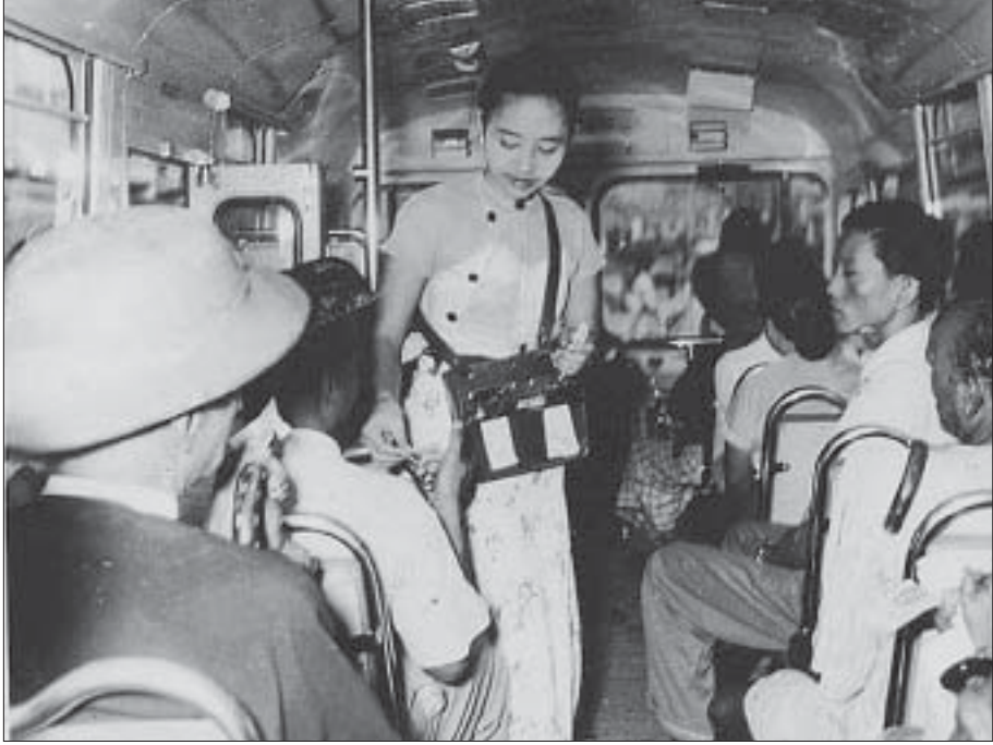
ဟီးနီးကားနှင့် စပယ်ယာ။

ကျုံးနံဘေးမှာ... မီးလုံး၊ မီးပွင့်၊ မီးချောင်း၊ မီးမောင်း ဖိတ် ဖိတ်လက်လို့...။ တစ်မြို့လုံးကလမ်းတွေမှာလည်း လမ်းမီး ထိန်းထိန်းလင်းလို့...။ ဓာတ်စက်ရုံကြီးထဲက ရေနေ့ငွေ အင်ဂျင်ကြီးကလည်း မီးခိုးခြောင်းခြောင်းထဲမှ အစွမ်းပြပြီး လောပိတလျှပ်စစ်အားကို အကူအညီပေးလို့...။ တစ်မြို့ လုံးလည်း သိမ်သိမ်လှူလှူ ပွဲတော်ဆီဦးတည်လို့...။ ထိုအချိန်မျိုးဆိုလျှင် ကျုံးနံဘေးပတ်ပတ်လည်မှာ မီးရောင်စုံတွေထိန်းထိန်းလင်းလင်း ထွန်းညှိထားသည်။ မြို့ရိုး၏အထက် သူရဲခိုကလနားများအတိုင်း လျှပ်စစ် မီးလုံးတွေဆင်ထားသည်။ မြို့ရိုးပေါ်ရှိ ပြာသာဒ်ကြီးများ မှာလည်း မီးလုံးရောင်စုံတွေ သီးပွင့်နေ၏။