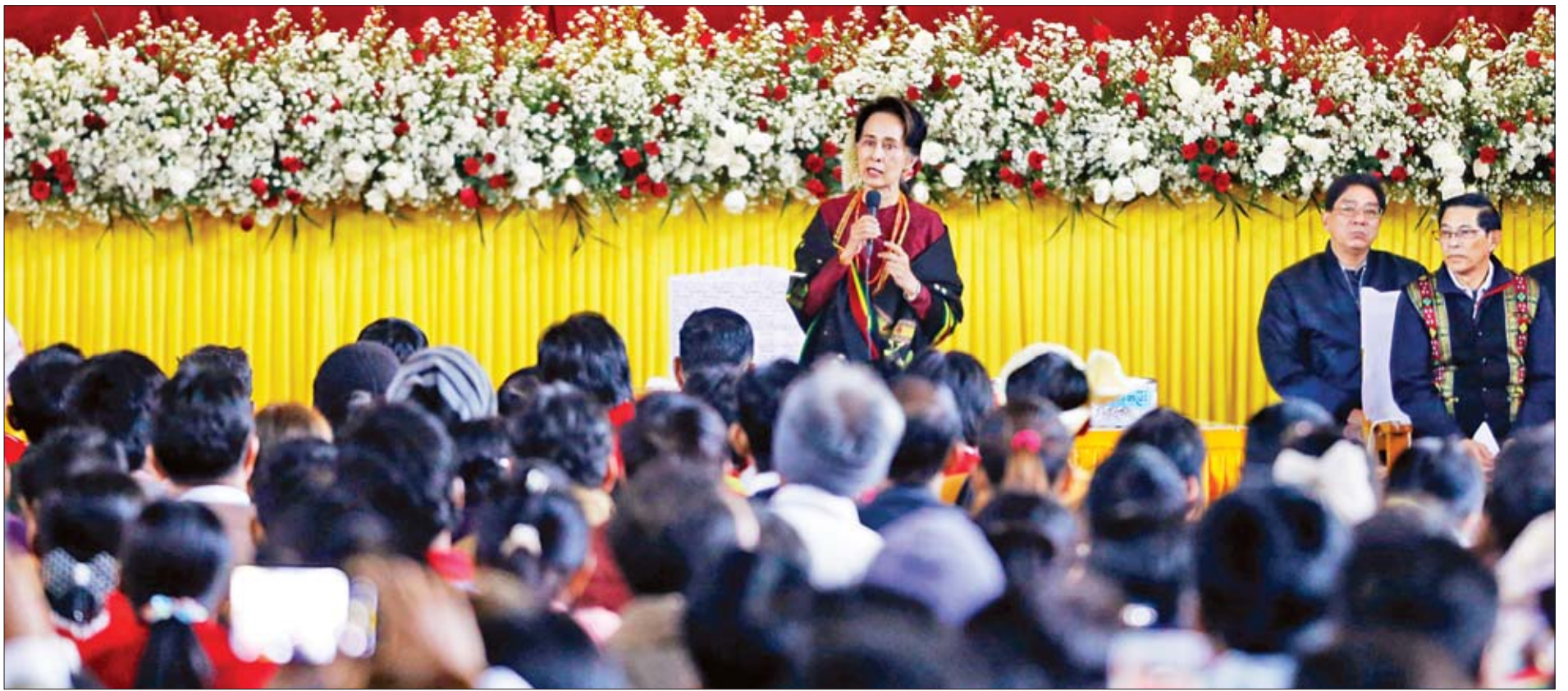
နိုင်ငံတော်၏အတိုင်ပင်ခံပုဂ္ဂိုလ် ဒေါ်အောင်ဆန်းစုကြည် တမူးမြို့၊ ဒေသခံပြည်သူများနှင့် တွေ့ဆုံပွဲတွင် အမှာစကား ပြောကြားစဉ်။

□ ရှေ့ဖို့မှ နိုင်ငံတော်၏ အတိုင်ပင်ခံပုဂ္ဂိုလ် နှင့်အဖွဲ့အား လွှတ်တော်ကိုယ်စား လှယ်များနှင့် တာဝန်ရှိသူများ၊ ဒေသခံ တိုင်းရင်းသား တိုင်းရင်းသားများက ရင်းရင်းနှီးနှီး ကြိုဆိုနှုတ်ဆက်ကြ သည်။ သောင်းသောင်းဖြူကြိုဆိုနှုတ်ဆက် ထို့ပြင် တမူးမြို့တွင်း လမ်းမ တစ်လျှောက်၌ ဒေသခံပြည်သူများက သောင်းသောင်းဖြူ ကြိုဆိုနှုတ်ဆက် ကြသည်။ ထို့နောက် နိုင်ငံတော်၏အတိုင် ပင်ခံပုဂ္ဂိုလ်သည် တမူးမြို့နယ် စက်ရောင်ဘီလူးခန်းမ၌ ဒေသခံ ပြည်သူများနှင့် တွေ့ဆုံသည်။ တွေ့ဆုံပွဲတွင် နိုင်ငံတော်၏ အတိုင်ပင်ခံပုဂ္ဂိုလ်က "ဒီနေ့ တမူးကို လာပြီး ပြည်သူပြည်သားတွေနဲ့ တွေ့ဆုံရတဲ့အတွက် ကျွန်မ အင်မတန် မှ ဝမ်းသာပါတယ်။ ကျွန်မတို့ကို သိုက်သိုက်ဝန်းဝန်း ကြိုဆိုတဲ့အတွက် လည်း ကျေးဇူးတင်ပါတယ်။ ကျွန်မ ဘယ်ကိုသွားသွား ပြည်သူတွေရဲ့ ကြိုဆိုမှု၊ ပြည်သူတွေရဲ့ နွေးထွေးမှုက ကျွန်မတို့အတွက် အင်အားတစ်ခု ဖြစ်ပါတယ်။ ဒီအင်အားတွေကို စုပြီး ပြည်သူတွေအတွက် ပြန်ပြီးသုံးဖို့ ရည်ရွယ်ပါတယ်။ ဘယ်တော့မှ မမေ့သင့် ကျွန်မ တမူးကိုလာတဲ့အခါ တိုင်းရင်းသားပေါင်းစုံကို တွေ့ခဲ့ရပါ တယ်။ အဲဒီပြည်သူတွေထဲမှာ တမူး ဘက်မှာအနေများတဲ့ ဂေါ်ရခါးမျိုးနွယ် ပြည်သူတွေကိုလည်း တွေ့ရပါတယ်။ ဒီလိုတွေရင် ကျွန်မ အင်မတန်မှ ဝမ်းသာပါတယ်။ ကျွန်မတို့ တိုင်းပြည် အတွင်းသာမက တစ်ကမ္ဘာလုံးမှာ လူသားတွေအချင်းချင်း အဆက်အစပ် ရှိတယ်ဆိုတာကို ဘယ်တော့မှ မမေ့ သင့်ပါဘူး။ တမူးမှာ နီပေါမျိုးနွယ်ဖြစ်တဲ့ ဂေါ်ရခါးမျိုးနွယ်တွေကို တွေ့ရပါ တယ်။ ကျွန်မ နီပေါကိုသွားတဲ့အခါ နီပေါနိုင်ငံသူ နိုင်ငံသားတွေက နွေးနွေးထွေးထွေး ကြိုဆိုကြပါတယ်။