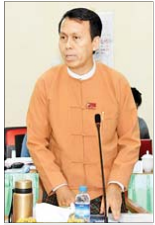
ရန်ကုန်တိုင်းဒေသကြီးဝန်ကြီးချုပ် ဦးဖြိုးမင်းသိန်း

စီးပွားရေးတိုးမြှင့်ဖော်ဆောင် ၂၀၂၀ ပြည့်နှစ် မေလအတွင်း ကျင်းပရန် လျာထားသည့် တိုင်းရင်း သားလူမျိုးများ၏ စဉ်ဆက်မပြတ် ဖွံ့ဖြိုးတိုးတက်ရေးဖိုရမ်ကို တိုင်းရင်း သားလုပ်ငန်းရှင်များ အချင်းချင်း ဆက်သွယ်ချိတ်ဆက်နိုင်မှုအားကောင်း လာစေရန်၊ စီးပွားရေးတိုးမြှင့်ဖော် ဆောင်ရာတွင် တိုင်းရင်းသားကဏ္ဍ ပိုမိုပါဝင်လာနိုင်စေရန်၊ ဒေသထုတ် ကုန်များကို တန်ဖိုးမြှင့်ထုတ်ကုန်များ အဖြစ် နိုင်ငံတကာသို့ ထိုးဖောက်နိုင် စေရန်၊ စီးပွားရေးဈေးကွက် အခွင့် အလမ်းများ ပိုမိုအားကောင်းလာစေ ရန်နှင့် နိုင်ငံတကာစီးပွားရေးလုပ်ငန်း ရှင်များကို ဖိတ်ခေါ်၍ တိုင်းရင်းသား ဒေသများတွင် ရင်းနှီးမြှုပ်နှံမှုများ ပိုမို ဆောင်ရွက်နိုင်စေရန်စသည့် ရည်ရွယ် ချက်များဖြင့် ဆောင်ရွက်သွားမည် ဖြစ်သည်ကို သိရှိရပါကြောင်း။