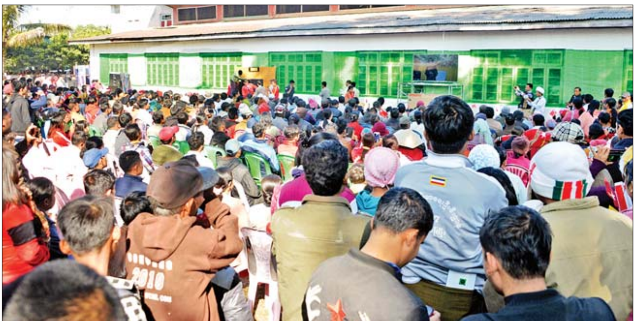
နိုင်ငံတော်၏အတိုင်ပင်ခံပုဂ္ဂိုလ် ဒေါ်အောင်ဆန်းစုကြည် တမူးမြို့နယ် စက်ရောင်ဘီလူးခန်းမ၌ ဒေသခံပြည်သူများနှင့် တွေ့ဆုံမှုအား ခန်းမအပြင်ဘက်ရှိ တီဗွီမှ တိုက်ရိုက်ပြသမှုကို ကြည့်ရှုအားပေးနေကြသည့် ဒေသခံပြည်သူများအား တွေ့ရစဉ်။

အများအတွက် စဉ်းစားခြင်းက ကိုယ့်အတွက် အများကြီး အကျိုးရှိ တယ်။ အများရဲ့ အမြင်နဲ့ မြင်ဖို့ကြိုးစား ခြင်းက ကိုယ့်အမြင်ကျယ်လာပါ တယ်။ အများရဲ့အတွေးနဲ့ တွေးနိုင်ဖို့ ကြိုးစားခြင်းက ကိုယ့်ရဲ့ဦးနှောက်ကို ပိုပြီးထက်သန်လာတယ်ဆိုပြီး အဲဒီလို မြင်စေချင်ပါတယ်။ အဲဒီလို မြင်မယ် ဆိုရင် ပြည်သူ့ပြည်သားတွေ တစ်နေ့ ထက်တစ်နေ့ တိုးတက်ဖို့ပဲ ရှိပါတယ်။ ဘာဖြစ်လို့လဲဆိုတော့ ကိုယ့်ပတ်ဝန်း ကျင်မှာ လူတွေ ဘယ်လောက်များ သလဲ၊ ကျောင်းတက်တဲ့ ကလေးတွေ ဘာဖြစ်လို့လဲဆိုတော့ ကိုယ့်ပတ်ဝန်း ကျင်မှာ လူတွေ ဘယ်လောက်များ သလဲ၊ ကျောင်းတက်တဲ့ ကလေးတွေ ဆိုရင် တစ်တန်းတည်းမှာ ကလေးတွေ ဘယ်လောက်များသလဲ၊ တခြားကိုယ် နဲ့ မတူတဲ့ကလေးတွေရဲ့ အမြင်တွေ၊ သူတို့ရဲ့ အားသာချက်တွေ၊ ဒါတွေကို လေ့လာမယ်၊ အားသာချက်အတွက်