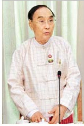
ပြည်ထောင်စုဝန်ကြီး နိုင်သက်လွင်

သွေးချင်းတို့ရဲ့ပွဲတော်ဆီ ပထမအကြိမ် တိုင်းရင်းသားလူမျိုး များ၏ ရိုးရာယဉ်ကျေးမှုနှင့် ခရီးသွား လုပ်ငန်းမြှင့်တင်ရေးပွဲတော် “သွေးချင်း တို့ရဲ့ပွဲတော်ဆီ”ကို ၂၀၁၉ ခုနှစ် ဇန်နဝါရီ ၂၅ ရက်မှ ၃၁ ရက်အထိ ရန်ကုန်တိုင်းဒေသကြီး ကျိုက္ကဆံ အားကစားကွင်းတွင် စည်ကားသိုက် မြိုက်စွာကျင်းပခဲ့ပြီး ကချင်ရိုးရာ မနောအကကို ပွဲတော်အကအဖြစ် ဆောင်ရွက်ခဲ့ကြပါကြောင်း။ ယခုနှစ် “သွေးချင်းတို့ရဲ့ပွဲတော်ဆီ” ပွဲတော်ကို ၂၀၂၀ ပြည့်နှစ် ဖေဖော်ဝါရီ ၁ ရက်မှ ၇ ရက်အထိ ကျင်းပဆောင်ရွက်သွား မည်ဖြစ်ပြီး အဓိကအကကို ကယား ရိုးရာတံခွန်တိုင်းအကဖြင့် ကျင်းပသွား မည်ဖြစ်ပါကြောင်း။