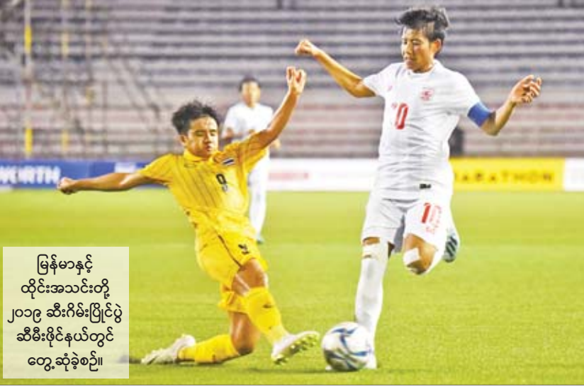
မြန်မာနှင့် ထိုင်းအသင်းတို့ ၂၀၁၉ ဆီးဂိမ်းပြိုင်ပွဲ ဆီမီးဖိုင်နယ်တွင် တွေ့ဆုံခဲ့စဉ်။

ရန်ကုန် ဇန်နဝါရီ ၂၃ မြန်မာ့လက်ရွေးစင် အမျိုးသမီးအသင်းနှင့် ထိုင်းလက်ရွေးစင်အမျိုးသမီးအသင်းတို့သည် ၂၀၂၂ တိုက်ပွဲအဖြစ် အမျိုးသမီးခြေစမ်းပွဲ တတိယအဆင့်အတွက် ကြိုတင်ပြင်ဆင်သည့် အနေဖြင့် မန္တလေးမြို့၌ ခြေစမ်းပွဲယှဉ်ပြိုင်ကစားမည်ဖြစ်သည်။ မြန်မာအသင်းနှင့် ထိုင်းအမျိုးသမီးအသင်းတို့သည် ဇန်နဝါရီ ၂၅ ရက်နှင့် ၂၈ ရက်တို့တွင် ခြေစမ်းပွဲနှစ်ပွဲ ကစားမည်ဖြစ်ပြီး ယင်းခြေစမ်းပွဲများကို ညနေ ၅ နာရီတွင် မန္တလေးမြို့ရှိ မန္တလေးသီရိကင်း၌ ကျင်းပမည်ဖြစ်သည်။ မြန်မာနှင့် ထိုင်းအမျိုးသမီးအသင်းသည် အာဆီယံ အမျိုးသမီးဘောလုံးလောကတွင် ထိပ်တန်းအဆင့်ရှိသည့် အသင်းများဖြစ်ပြီး မြန်မာဘောလုံးပရိသတ်များအနေဖြင့် ယင်းနှစ်သင်း၏ အားပြိုင်မှုကို အခမဲ့ကြည့်ရှုအားပေးနိုင်မည်ဖြစ်သည်။ မြန်မာနှင့် ထိုင်းအသင်းသည် ၂၀၁၈ ခုနှစ်တွင် ထိုင်းနိုင်ငံ၌ ခြေစမ်းပွဲနှစ်ပွဲကစားပြီးနောက်ပိုင်း ယခုမှ စာမျက်နှာ ၇ ကော်လံ ၁ သို့ ❖