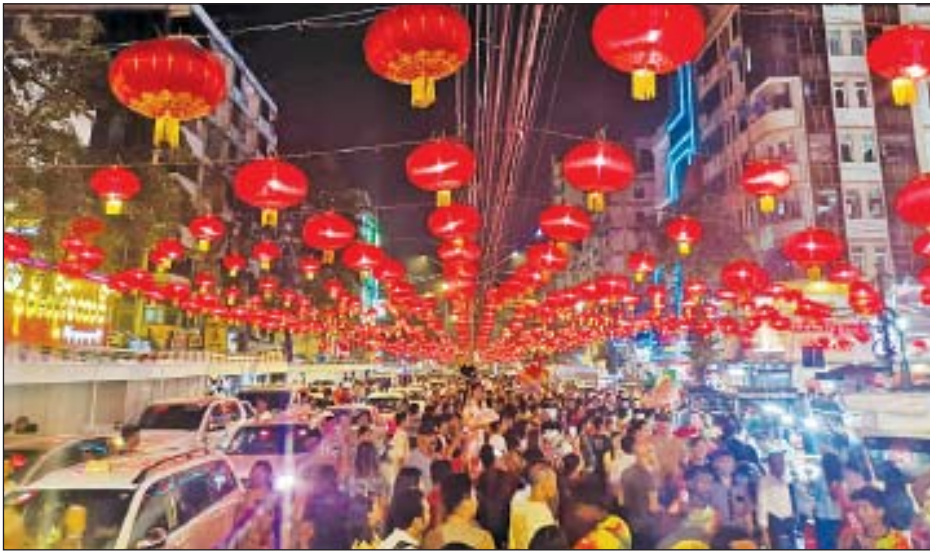
ဆိုင်ဇုန်နေရာတစ်ခုကိုထပ်မံတိုးချဲ့၍ ပွဲတော်၌ ရိုးရာဈေးဖြေရေးအစီ မြှုပ်စွာပြုလုပ်သွားမည်ဖြစ်ကြောင်း ဇုန်နေရာလေးခုကို ထားရှိရန် စီစဉ် အစဉ်များ၊ ပျော်ပွဲရွှင်ပွဲများနှင့် Live သိရသည်။ သတင်း-ပွင့်သစ္စာ လိုက်ခြင်းဖြစ်သည်။ show အစီအစဉ်များဖြင့် စည်ကားသိုက်

ရန်ကုန် ဇန်နဝါရီ ၂၃ တရုတ်နှစ်သစ်ကူးပွဲတော်(ရန်ကုန်) ကို ရန်ကုန်မြို့၊ လသာမြို့နယ် (တရုတ် တန်း) ၌ ဇန်နဝါရီ ၂၅ ရက်နှင့် ၂၆ ရက် တို့တွင် ကျင်းပမည်ဖြစ်ရာ ပွဲတော်၌ ယခုနှစ်အတွက် ထူးခြားစွာပြုလုပ်မည့် ညဈေးတန်း စားသောက်ဆိုင်များ အတွက် ဇုန်(Zone) နေရာများအား ထပ်မံတိုးချဲ့ ဖွင့်လှစ်သွားမည်ဖြစ်ကြောင်း သိရသည်။ တရုတ်နှစ်သစ်ကူးပွဲတော်(ရန်ကုန်) ၌ ယခုနှစ်အတွက် ထူးခြားစွာပါဝင် လာသောညဈေးတန်းနေရာအတွက် စားသောက်ဆိုင်ခန်း ၃၀ ဝန်းကျင် ပါဝင်သည့်ဇုန်နေရာသုံးခုကိုစီစဉ်ထား ရာ လာရောက်လည်ပတ်ကြမည့်သူ များနှင့် မုန့်စားကတ်မဲများစွာ ပါဝင်လာသောကြောင့် စားသောက်