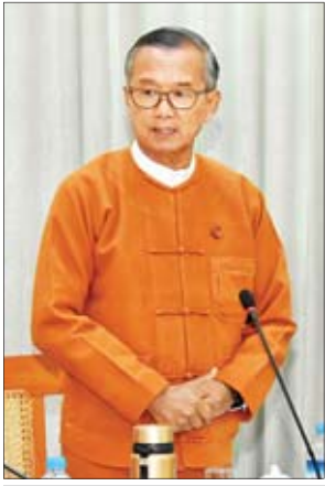
ပြည်ထောင်စုဝန်ကြီး ဦးအုန်းမောင်

✧ ကျော့ဖိုးမှ ပြည်နယ်တိုင်းရင်းသားလူမျိုးရေးရာ ဝန်ကြီးများ၊ ကိုယ်ပိုင်အုပ်ချုပ်ခွင့်ရတိုင်း နှင့် ဒေသဦးစီးအဖွဲ့ဝင်များနှင့် တာဝန် ရှိသူများ တက်ရောက်ကြသည်။ အစည်းအဝေးတွင် ဒုတိယသမ္မတ က ယနေ့အစည်းအဝေးသည် တိုင်း ရင်းသားလူမျိုးများ၏ ရိုးရာယဉ်ကျေး မှုနှင့် ခရီးသွားလုပ်ငန်းမြှင့်တင်ရေး ပွဲတော် “သွေးချင်းတို့ရဲ့ပွဲတော်ဆီ” ကျင်းပနိုင်ရေးနှင့် ၂၀၂၀ ပြည့်နှစ် မေလအတွင်း ကျင်းပရန်လျာထား သည့် တိုင်းရင်းသားလူမျိုးများ စဉ်ဆက်မပြတ် ဖွံ့ဖြိုးတိုးတက်ရေး ဖိုရမ်နှင့်စပ်လျဉ်းသည့် ညှိနှိုင်းအစည်း အဝေးဖြစ်ပါကြောင်း။