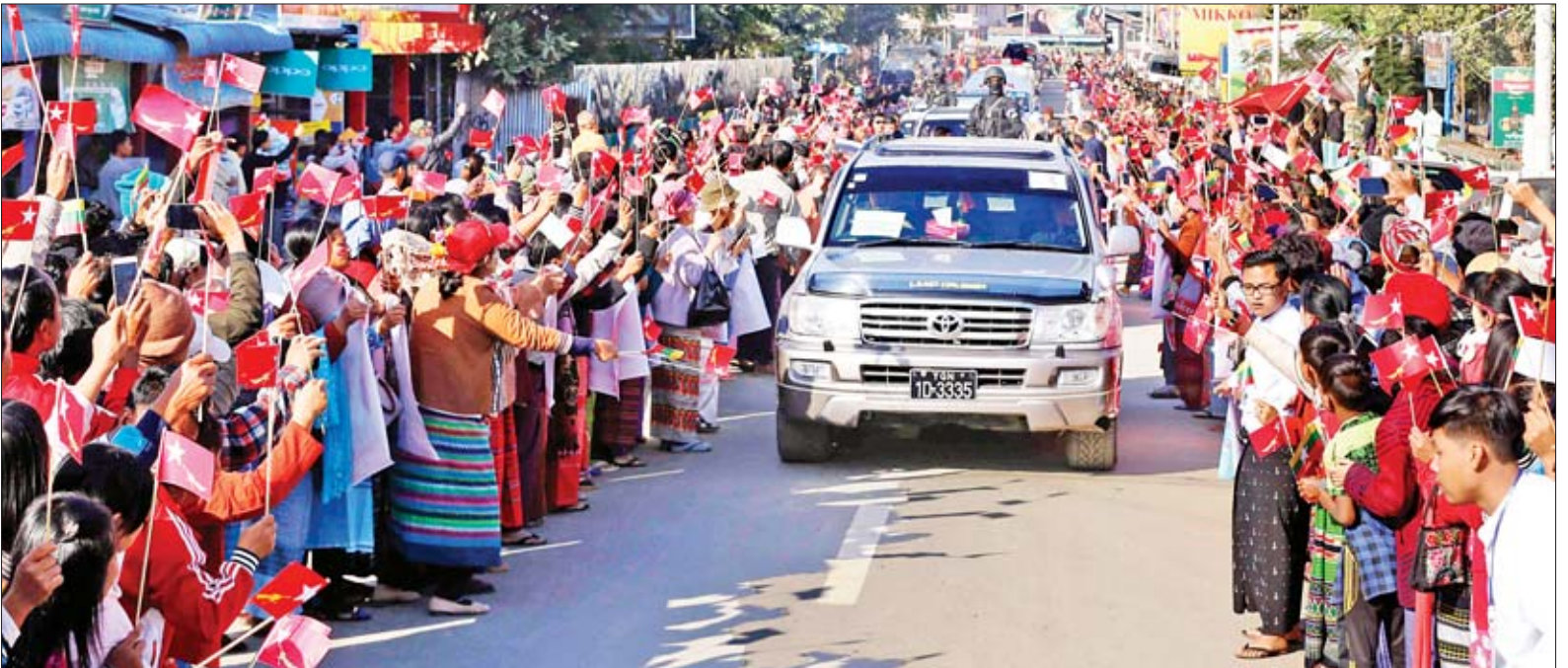
နိုင်ငံတော်၏အတိုင်ပင်ခံပုဂ္ဂိုလ် ဒေါ်အောင်ဆန်းစုကြည်အား တမူးမြို့တွင်းလမ်းတစ်လျှောက်၌ ဒေသခံပြည်သူများက သောင်းသောင်းဖြူ ကြိုဆိုနှုတ်ဆက်ကြစဉ်။

ဒီဆုတွေ တကယ်ပြည့်ဖို့ဆိုတာ ကာယကံရှင်ကိုယ်တိုင်က လုပ်ယူရမှာ ဖြစ်ပါတယ်။ တာဝန်ရှိတယ်ဆိုတာကို သဘောပေါက်စေချင် ကျွန်မက ကျန်းမာပါစေလို့ ဆုပေးလိုက်ပေမယ့် ကျန်းမာအောင် လုပ်ဖို့က ဆုပေးခံရတဲ့ ကာယကံရှင်က ကိုယ့်ကိုယ်ကိုယ် ကျန်းမာအောင်နေမှ ကျန်းမာမှာပါ။ ဆုပေးတဲ့သူက ဘယ်လိုစေတနာ၊ မေတ္တာနဲ့ ဘယ်လို ဆန္ဒတွေနဲ့ပေးပေး ယူတဲ့ကာယကံ ရှင်က ကျန်းမာအောင် မနေရင် ကျန်းမာမှာ မဟုတ်ပါဘူး။ ကျွန်မက ထပ်တလဲလဲ နိုင်ငံသူနိုင်ငံသားတွေ၊ ပြည်သူပြည်သားတွေနဲ့ အထူးသဖြင့် လူငယ်တွေ ကျန်းမာပါစေလို့ ဆုပေး ပေး လူငယ်တွေ ကျန်းမာအောင်မနေ ရင် ကျန်းမာမှာ မဟုတ်ပါဘူး။ ဒါကြောင့် ကိုယ့်ကိုပေးလိုက်တဲ့ဆုကို တန်ဖိုးထားပြီး ဒီဆုပြည့်ဖို့အတွက် ကိုယ့်မှာ တာဝန်ရှိတယ်ဆိုတာကို သဘောပေါက်စေချင်တယ်။ စာမျက်နှာ ၄ သို့ □