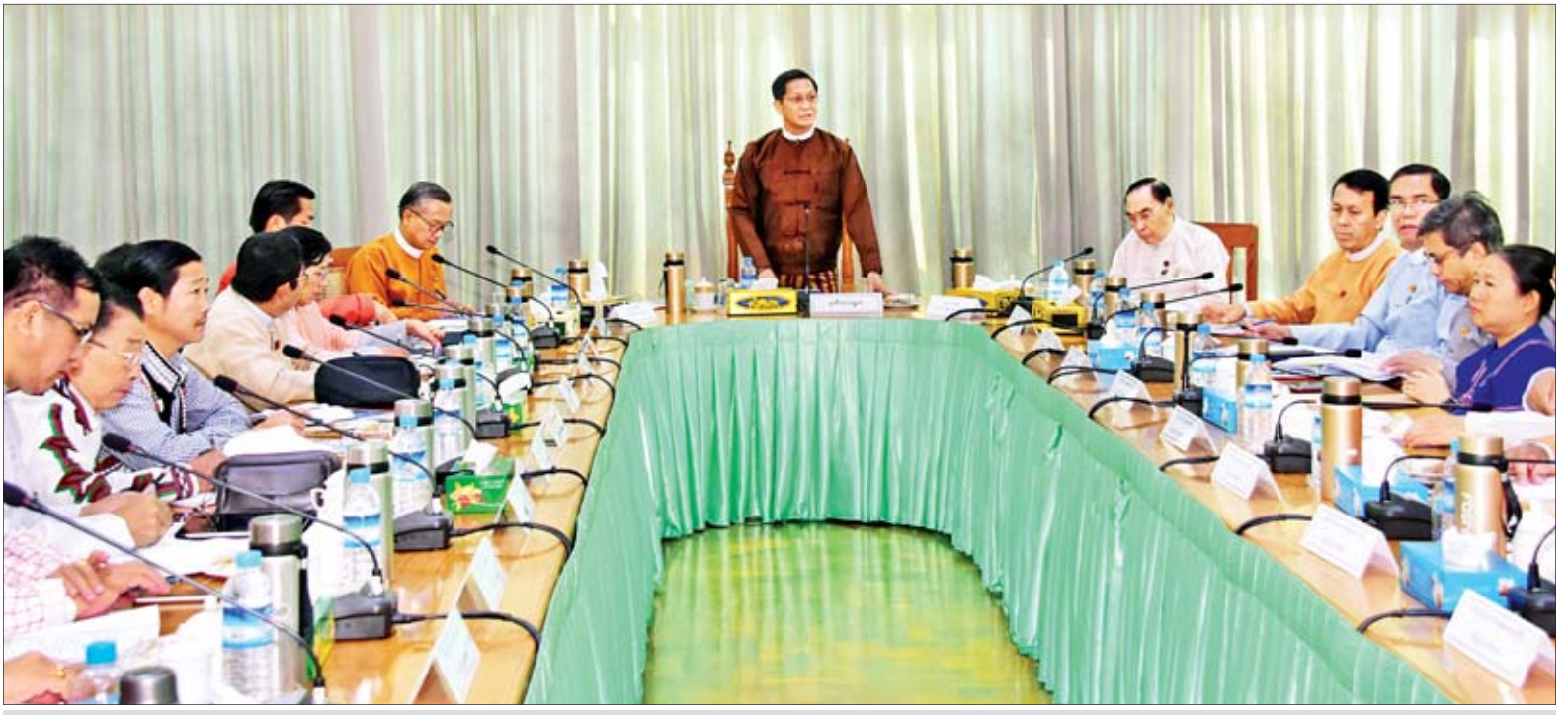
ဒုတိယသမ္မတ ဦးဟင်နရီဗန်ထီးယူ “သွေးချင်းတို့ရဲ့ပွဲတော်ဆီ ၂၀၂၀” ပွဲတော်နှင့် တိုင်းရင်းသားလူမျိုးများ စဉ်ဆက်မပြတ်ဖွံ့ဖြိုးတိုးတက်ရေးဖိုရမ်တို့နှင့်စပ်လျဉ်းသည့် ညှိနှိုင်းအစည်းအဝေးတွင် အမှာစကားပြောကြားစဉ်။

နေပြည်တော် ဇန်နဝါရီ ၂၃ “သွေးချင်းတို့ရဲ့ ပွဲတော်ဆီ ၂၀၂၀” ပွဲတော်နှင့် တိုင်းရင်းသားလူမျိုးများ စဉ်ဆက်မပြတ် ဖွံ့ဖြိုးတိုးတက်ရေး ဖိုရမ်တို့နှင့်စပ်လျဉ်းသည့် ညှိနှိုင်းအစည်းအဝေးကို ယနေ့နံနက် ၉ နာရီတွင် နေပြည်တော်ရှိ တိုင်းရင်းသား လူမျိုးရေးရာဝန်ကြီးဌာန အစည်းအဝေးခန်းမ၌ကျင်းပရာ တိုင်းရင်းသား ရေးရာ၊ ပြည်သူ့ရေးရာစီမံခန့်ခွဲမှုနှင့် ဝန်ဆောင်မှုရေးရာ ကော်မတီဥက္ကဋ္ဌ ဒုတိယသမ္မတ ဦးဟင်နရီဗန်ထီးယူ တက်ရောက်အမှာစကား ပြောကြားသည်။ အစည်းအဝေးသို့ ပြည်ထောင်စု ဝန်ကြီးများဖြစ်ကြသည့် ဦးအုန်းမောင်နှင့် နိုင်သက်လွင်၊ တိုင်းဒေသကြီးနှင့် ပြည်နယ်ဝန်ကြီးချုပ်များဖြစ်ကြသည့် ဦးဖြိုးမင်းသိန်းနှင့် ဦးအယ်လ်ဖောင်းရှိ၊ ဒုတိယဝန်ကြီးများ ဖြစ်ကြသည့် ဦးအောင်လှထွန်း၊ ဒေါက်တာမြလေးစိန်နှင့် ဦးတင်လတ်၊ တိုင်းဒေသကြီးနှင့် စာမျက်နှာ ၇ ကော်လံ ၁ သို့ ။