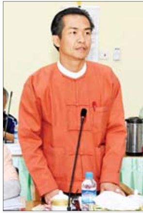
ကယားပြည်နယ်ဝန်ကြီးချုပ် ဦးအယ်လ်ဖောင်းရှိ

ခရီးသွားလုပ်ငန်းများကိုမြှင့်တင်နိုင် မြန်မာနိုင်ငံသည် သဘာဝအလှအပ များနှင့် ပြည့်စုံကြွယ်ဝသည့် နိုင်ငံ တစ်ခုဖြစ်သည့်အတွက် သဘာဝ အခြေပြု ခရီးသွားလုပ်ငန်းများကို မြှင့်တင်နိုင်ခြင်းဖြင့် တိုင်းရင်းသား ဒေသ ဖွံ့ဖြိုးတိုးတက်ရေးကို များစွာ အထောက်အကူဖြစ်စေနိုင်မည်ဖြစ်ပါ ကြောင်း။ တိုင်းရင်းသားများ၏ ရိုးရာ ယဉ်ကျေးမှုနှင့် ခရီးသွားလုပ်ငန်းများ ကို ပြည်တွင်းနှင့် နိုင်ငံတကာမှ သိရှိနိုင် စေရန် မီဒီယာများ၏ အခန်းကဏ္ဍ သည် အရေးပါသည့်အတွက် မီဒီယာ များအနေဖြင့် ပူးပေါင်းဆောင်ရွက်ပေး ကြပါဟု တိုက်တွန်းလိုပါကြောင်း။