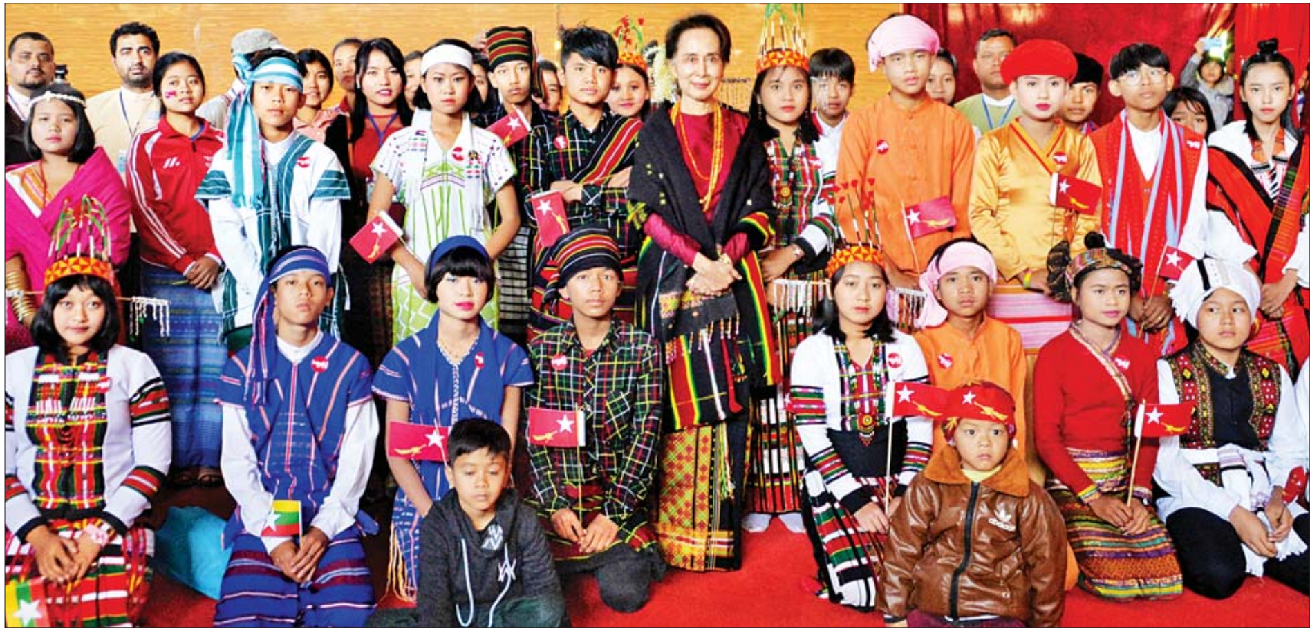
နိုင်ငံတော်၏အတိုင်ပင်ခံပုဂ္ဂိုလ် ဒေါ်အောင်ဆန်းစုကြည် တမူးမြို့မှ ဒေသခံတိုင်းရင်းသား တိုင်းရင်းသူများနှင့် မှတ်တမ်းတင်ဓာတ်ပုံရိုက်စဉ်။

ဦးအုန်းဝင်းနှင့် ဒေါက်တာမြင့်ထွေး၊ ဒုတိယဝန်ကြီး ဗိုလ်ချုပ်အောင်သူနှင့် ဦးလှမော်ဦး၊ မြန်မာနိုင်ငံရဲတပ်ဖွဲ့ ရဲချုပ် ဒုတိယရဲဗိုလ်ချုပ်ကြီးအောင်ဝင်းဦး၊ တာဝန်ရှိသူများနှင့်အတူ ယနေ့နံနက်ပိုင်းတွင် ကလေးမြို့မှ ရဟတ်ယာဉ်များဖြင့် ထွက်ခွာကြရာ စစ်ကိုင်းတိုင်းဒေသကြီး တမူးမြို့သို့ ရောက်ရှိကြသည်။ စာမျက်နှာ ၃ ကော်လံ ၁ သို့