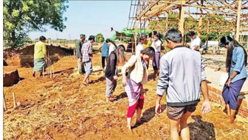
တည်ဆောက်လျက်ရှိကာ နွေကာလမတိုင်မီ ပြီးစီး ပါက လူဦးရေ ၂၀၀ ခန့် စတင်နားနေနိုင်တော့မည် ဖြစ်သည်။