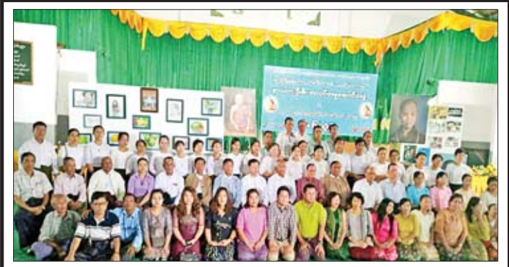
သမိုင်းမြို့မ(အထက - ၁ မရမ်းကုန်း)၏ ငွေရတုအထိမ်းအမှတ် အမှတ်တရပန်းချီ ဓာတ်ပုံပြပွဲ ဖွင့်လှစ်ခြင်းအခမ်းအနားကို ဇန်နဝါရီ ၂၁ ရက်က စန္ဒီမာခန်းမ အထက - ၁ မရမ်းကုန်း၌ ကျင်းပရာ ကျောင်းသား ကျောင်းသူများနှင့် သက်ကြီးအာစရိယပူဇော်ပွဲကော်မတီဝင်များ၊ ကျောင်းအုပ်ကြီး(ငြိမ်း)များ၊ အထက - ၁ မရမ်းကုန်းမှ တာဝန်ထမ်းဆောင်ဆဲ ဆရာ ဆရာမ များ တက်ရောက်ကြည့်ရှုအားပေးပြီး အမှတ်တရဓာတ်ပုံရိုက်ကြစဉ်။ ကိုဌေး

ယင်းနောက် တက်ရောက်လာကြသည့် သတင်းဌာနအသီးသီးတို့က သိရှိလိုသည်များ ကို မေးမြန်းရာ တပ်မတော်သတင်းမှန် ပြန်ကြားရေးအဖွဲ့မှ တာဝန်ရှိသူများက လည်းကောင်း၊ ICC နှင့် ICJ ဆိုင်ရာကိစ္စရပ်များ၊ ICOE အစီရင်ခံစာနှင့်ပတ်သက်သည့် ကိစ္စရပ် များ၊ စစ်တရားရုံးစစ်ဆေးစီရင်မှုဆိုင်ရာကိစ္စ ရပ်များအား ကာကွယ်ရေးဦးစီးချုပ်ရုံး(ကြည်း) စစ်ဥပဒေချုပ်ရုံးမှ ဒုတိယစစ်ဥပဒေချုပ် ဗိုလ်ချုပ် သောင်းနိုင်ကလည်းကောင်း၊ ပြန်လည်ရှင်းလင်း ပြောကြားခဲ့ကြောင်း တပ်မတော်ကာကွယ်ရေး ဦးစီးချုပ်ရုံး၏ သတင်းထုတ်ပြန်ချက်အရ သိရသည်။ သတင်းစဉ်