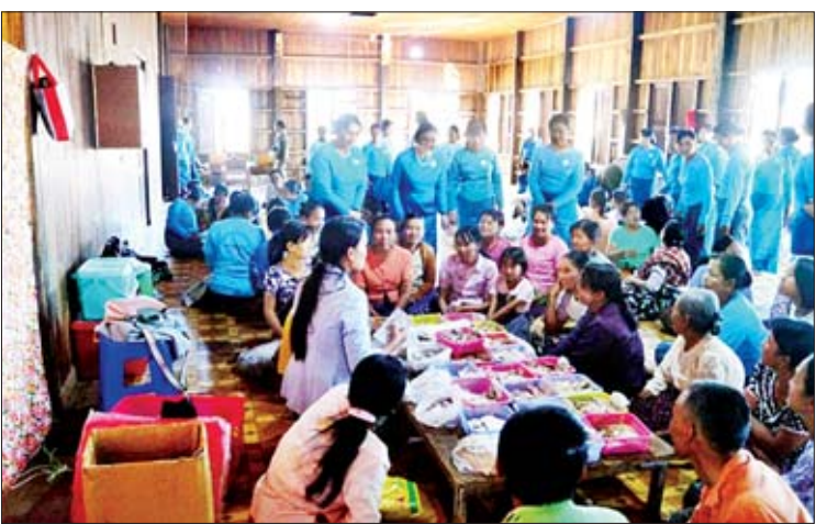
အဆိုပါ နယ်လှည့်တိုင်းရင်းဆေး အား ဆေးကုသမှုဆောင်ရွက်ပေးခဲ့ကြောင်း ကုသရေးတွင် ပြည်နယ်ဦးစီးမှူးပါ ကိုးဦးအဖွဲ့ သိရသည်။ က ဒေသခံတိုင်းရင်းသား စုစုပေါင်း ၁၃၅ ဦး စိုင်းအယ်ဘဲ

တိုင်းရင်းဆေးဖြင့် ဆေးဝါးကုသမှုဆောင်ရွက်ခြင်း၊ ကြပ်ထုပ်ထိုးခြင်း၊ အကြောပြင်ခြင်းတို့ကို ဆောင်ရွက်ပေးသည်။ ဆက်လက်ပြီး ပြည်နယ်အမျိုးသမီးရေးရာအဖွဲ့ နာယကနှင့် အဖွဲ့ဝင်များသည် အင်းပေါ်ခရီးကူးရွာရှိ အသက်(၈၅)နှစ်အထက်ဘိုးဘွားများကို ကန်တော့လက်ဆောင်ပစ္စည်းများပေးအပ်ခဲ့ပြီး ကျေးရွာအမျိုးသမီးရေးရာဆယ်အိမ်စုမှူးများနှင့် ကိုယ်ဝန်ဆောင်မိခင်များကို လက်ဆောင်ပစ္စည်းများ ပေးအပ်ခဲ့ကြသည်။