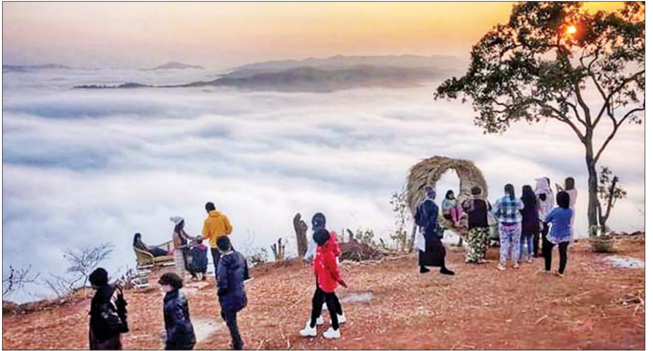
မန္တလေး - လမ်းရှိုးလမ်းမှတစ်ဆင့် နောင်ချို - ရပ်စောက်ကားလမ်းအတိုင်း တစ်နာရီခန့်သွားရကြောင်း သိရသည်။ တိမ်ပင်လယ်အလှကို တောင်စောင်း

အဆိုပါ နောင်ချိုတိမ်ပင်လယ်ရှုခင်းအလှရှိရာ နောင်ချိုကြီးရွာသို့