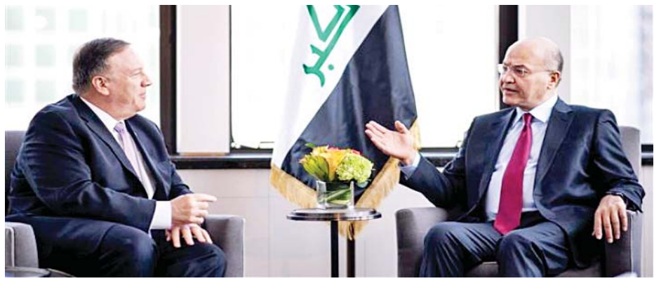
၂၀၁၉ ခုနှစ် မေလက အီရတ်နိုင်ငံ ဘဂ္ဂဒတ်မြို့တွင် အီရတ်သမ္မတ ဘာဟ်ဆာလီနှင့် အမေရိကန် နိုင်ငံခြားရေးဝန်ကြီး မိုက်ပွန်ပီယိုတို့ တွေ့ဆုံစဉ်။