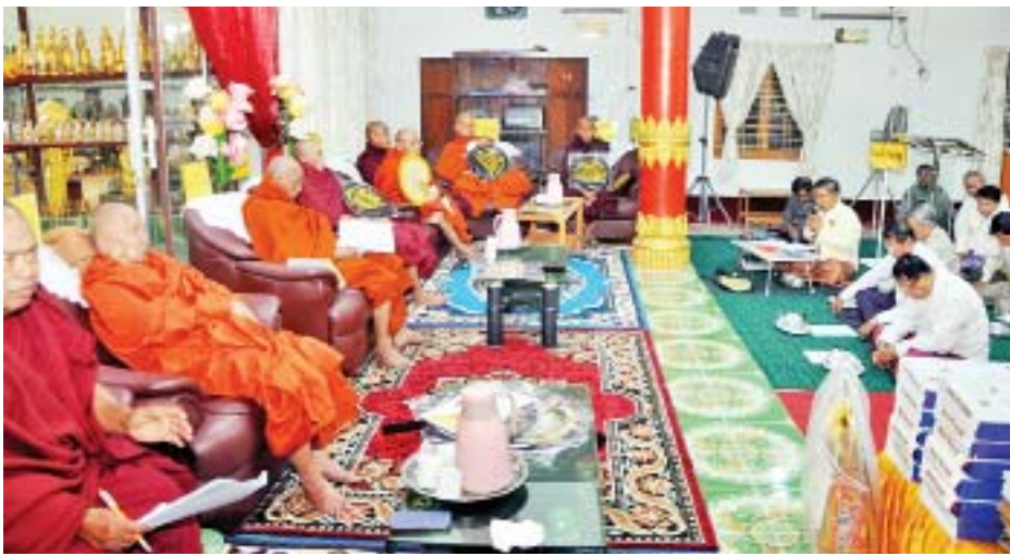
လှူဖွယ်ပစ္စည်းများ ဆက်ကပ်လှူဒါန်း ဆရာတော်ထံမှ အနုမောဒနာ များပေးအပ်ကာ ဗုဒ္ဓသာသနံစိရိတိဋ္ဌတု ကြကာ ပင်မဓမ္မာရုံ တိုးချဲ့ဆောင် သုံးကြိမ်ရွတ်ဆို ဆုတောင်း၍ အခမ်း ယင်းနောက် ဂေါပကအဖွဲ့က အလှူ အနားကို ရုပ်သိမ်းခဲ့သည်။ မှုအစုစုတို့အတွက် စစ်ကိုင်း ရှင်များအား ဂုဏ်ပြုမှတ်တမ်းလွှာ တင်ကြည် (သင်္ဃန်းကျွန်း)

ရန်ကုန် ဇန်နဝါရီ ၁၉ ရန်ကုန်တိုင်းဒေသကြီး သင်္ဃန်းကျွန်း မြို့နယ် သုဝဏ္ဏမြို့ သုဝဏ္ဏမြို့ဦး ဆုတောင်းပြည့်စေတီတော်မြတ်ကြီး (၂၆) ကြိမ်မြောက် ဗုဒ္ဓပူဇော်ပွဲတော် ကြီး၏ ဗုဒ္ဓါဘိသေကအနေကတော်ပွဲ၊ ဩဝါဒသံယုဉ်းနှင့် တိုးချဲ့ဓမ္မာရုံသစ် ဆောက်လုပ်လှူဒါန်းရေစက်ချ အလှူ တော်မင်္ဂလာ အခမ်းအနားကို ယနေ့ နံနက် ၇ နာရီက မဟာသုခချမ်းသာ အနောက်ဘက် အာရုံခံတန်ဆောင်း၌ ကျင်းပသည်။