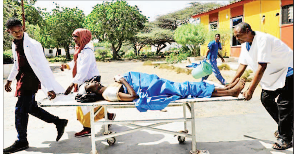
ဆိုမာလီယာနိုင်ငံ ပုံးခွဲတိုက်ခိုက်မှုတွင် ဒဏ်ရာရရှိသူတစ်ဦးအား သယ်ဆောင်လာသည်ကို တွေ့ရစဉ်။

အန်ကာရာ ဇန်နဝါရီ ၁၉ တူရကီနိုင်ငံသား ခြောက်ဦးဒဏ်ရာရရှိခဲ့သည့် ဆိုမာလီယာ နိုင်ငံ မြို့တော်မိုဂါဒစ်ရှူး၌ ဖြစ်ပွားခဲ့သော အကြမ်းဖက် တိုက်ခိုက်မှုကို တူရကီက ဇန်နဝါရီ ၁၈ ရက်တွင် ပြစ်တင် ဝေဖန်ခဲ့သည်။