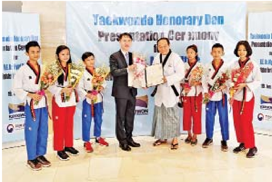
ကိုယ်လက်လှုပ်ရှားအားကစား ပိုမိုလေ့ကျင့်လိုစားခြင်း ဖြင့် ကျန်းမာကြံ့ခိုင်ရေး၊ ထူးချွန်ထက်မြက်သော မျိုးဆက် သစ်အားကစားသမားများ ပေါ်ထွက်လာရေးကို ဆောင်ရွက်

ယင်းနောက် ပြည်ထောင်စုဝန်ကြီး ဒေါက်တာ မြင့်ထွေးက ဝန်ကြီးဌာနအနေဖြင့် ပြည်သူများအကြား