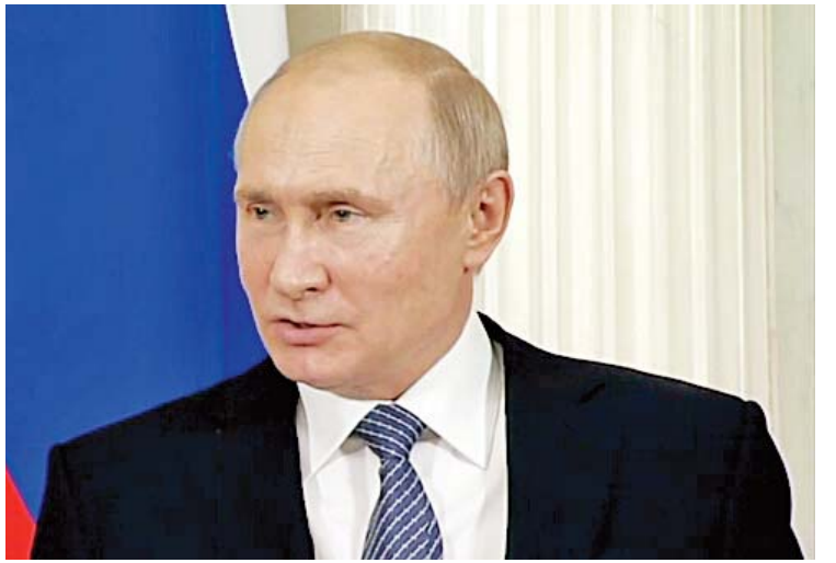
သွားရန် ကြိုးပမ်းသွားဖွယ်ရှိနေကြောင်း၊ ယင်းသို့ ကြိုးပမ်းသွားရာတွင် သမ္မတပူတင်သည် နှစ်ပတ်လည်အောင်မြင်မှုအထိမ်းအမှတ်အခမ်းအနားများကို အသုံးပြုပြီး ရုရှားမျိုးချစ်စိတ်ကို မြှင့်တင်စေကာ ၎င်းအား ထောက်ခံမှုကို အားကောင်းစေမည်ဟု ရုရှားနိုင်ငံရေးဆန်းစစ်လေ့လာသူများက ပြောကြားသည်။ ကိုးကား-အင်န်အိတ်ချ်ကော့ဘာသာပြန်-ဇော်ဝင်း

ဆိုဗီယက်ယူနီယံခေတ်မှ အောင်မြင်မှု အထိမ်းအမှတ်အဖြစ် ဂုဏ်ပြုရန် သမိုင်းဝင် ပြတိုက်တစ်ခု ဆောက်လုပ်ရန် ၎င်းတွင် အစီအစဉ်ရှိကြောင်း ပြောကြားခဲ့သည်။ ဇန်နဝါရီ ၁၅ ရက်တွင် ရုရှားသမ္မတပူတင်က နှစ်ပတ်လည်နိုင်ငံတော်အခြေပြ မိန့်ခွန်းတစ်ရပ် ပြောကြားရာတွင် အခြေခံဥပဒေဆိုင်ရာ ပြုပြင်ပြောင်းလဲမှုများ ပြုလုပ်မည်ဟု အဆိုပြုခဲ့သည်။ ယင်းမိန့်ခွန်း ပြောကြားပြီးနောက်တွင် ဝန်ကြီးချုပ် အပါအဝင် အစိုးရအဖွဲ့အား ပြင်ဆင်ပြောင်းလဲခဲ့သည်။ ၂၀၂၄ ခုနှစ်တွင် သမ္မတရာထူးသက်တမ်း ကုန်ဆုံးမည့်ပူတင်သည် သမ္မတရာထူးသက်တမ်း ကုန်ဆုံးပြီးနောက်တွင် အာဏာကို ဆက်စွဲကိုင်