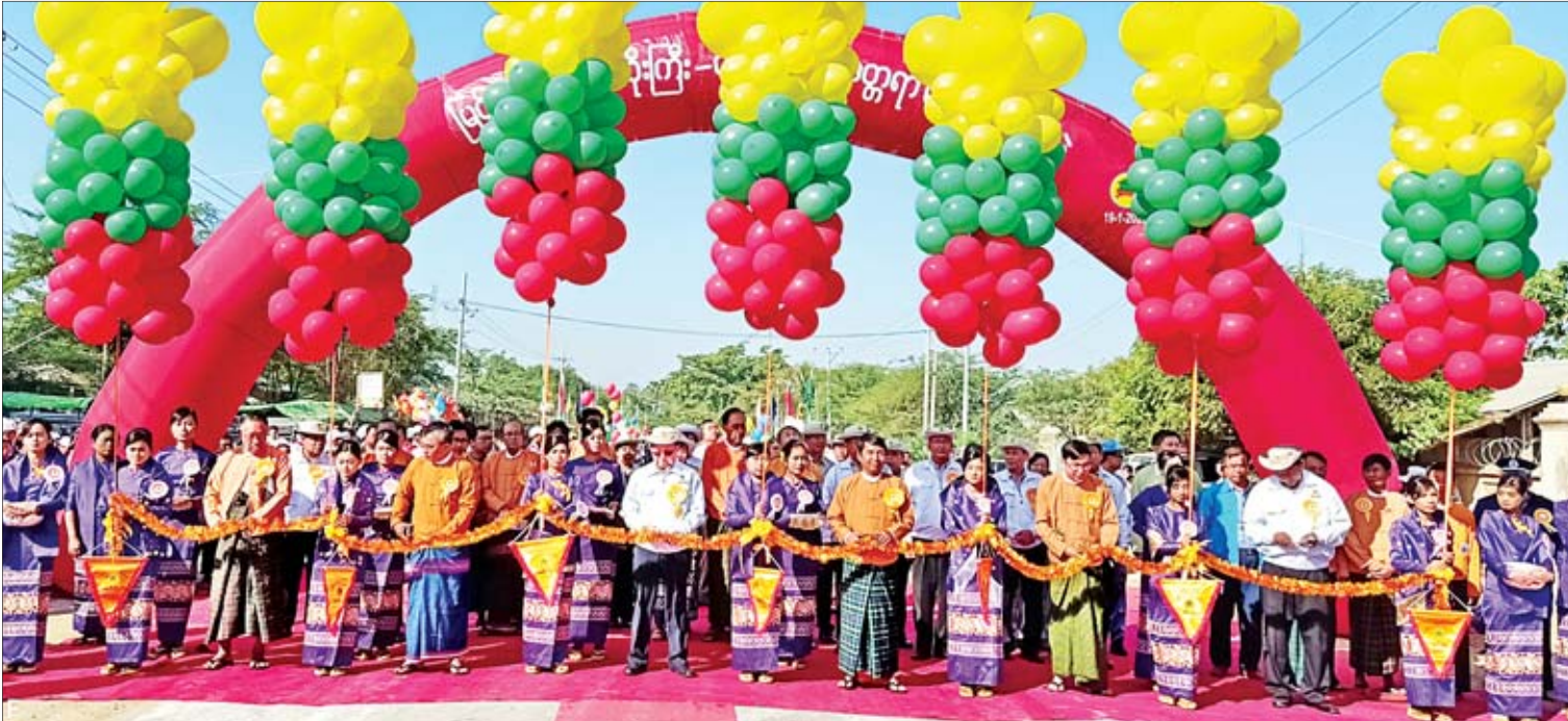
ပြည်ထောင်စုဝန်ကြီး ဦးဟန်ဇော်၊ မန္တလေးတိုင်းဒေသကြီး ဆေးဝန်ကြီးချုပ် ဦးဇာနည်အောင်၊ တိုင်းဒေသကြီးလွှတ်တော် ဒုတိယဥက္ကဋ္ဌ ဒေါက်တာခင်မောင်ဌေးနှင့် တာဝန်ရှိသူများ နွားထိုးကြီး-တောင်သာ ကတ္တရာလမ်းသစ်ကို ဖွင့်ပွဲအခမ်းအနားကြိုတင်ဖွင့်လှစ်ပေးကြစဉ်။