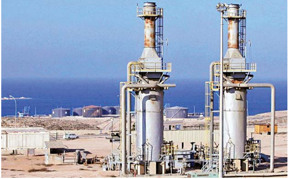
လစ်ဗျားနိုင်ငံအတွင်းရှိ ရေနံထုတ်လုပ်ရေးဆိပ်ကမ်းတစ်ခုအား တွေ့ရစဉ်။

ထိန်းချုပ်ခဲ့ပြီး လုပ်ငန်းရှင်များအား ရေနံဆိပ်ကမ်းများကို ပိတ်သိမ်းရန် တောင်းဆိုခဲ့ကြောင်း ဒေသန္တရမီဒီယာများက သတင်းဖော်ပြသည်။ မျိုးနွယ်စုခေါင်းဆောင်များက လစ်ဗျားအရှေ့ပိုင်း တပ်ဖွဲ့ခေါင်းဆောင် ခါလီဖာ အက်ဖ်တာ ဦးဆောင်သည့် လက်နက်ကိုင်အဖွဲ့ကို ထောက်ခံလျက်ရှိသည်။ ထို့ကြောင့် လစ်ဗျားအစိုးရသည် ရေနံရောင်းရငွေနှင့် ၎င်း၏တပ်ဖွဲ့များကို ထောက်ပံ့ပေးလျက်ရှိသည်ဟု လူမျိုးနွယ်စုခေါင်းဆောင်များက စွပ်စွဲပြောကြားခဲ့သည်။ လစ်ဗျားအစိုးရတပ်ဖွဲ့နှင့် ခေါင်းဆောင် ခါလီဖာ အက်ဖ်တာ ဦးဆောင်သည့် လက်နက်ကိုင်အဖွဲ့သည် ဧပြီလ အစောပိုင်းကစပြီး စစ်ဆင်ရေးများ အပြန်အလှန်ဆင်နွှဲလျက်ရှိသည်။ အဆိုပါစစ်ဆင်ရေးများအတွင်း လူထောင်ပေါင်းများစွာ သေဆုံး (သို့မဟုတ်) ဒဏ်ရာများ ရရှိခဲ့သည်။ ပြည်သူ ၁၅၀၀၀ ခန့်သည် နေရပ်စွန့်ခွာကာ အိမ်နီးချင်းနိုင်ငံများသို့ ထွက်ခွာသွားခဲ့ကြသည်။ ဇန်နဝါရီ ၁၉ ရက်တွင် ဒေသတွင်းနိုင်ငံများနှင့် ကမ္ဘာ့နိုင်ငံများအပါအဝင် လစ်ဗျားအစိုးရတပ်ဖွဲ့ ကိုယ်စားလှယ်များနှင့် ခေါင်းဆောင် ခါလီဖာ အက်ဖ်တာ၏ လက်နက်ကိုင်အဖွဲ့မှ ကိုယ်စားလှယ်များသည် လစ်ဗျားအရေးနှင့်ပတ်သက်ပြီး ဂျာမနီနိုင်ငံ ဘာလင်မြို့တွင် ဆွေးနွေးခဲ့သည်။ အဆိုပါအစည်းအဝေးတွင် ပြည်တွင်းစစ်ပွဲများကို အဆုံးသတ်ရန်နှင့် စေ့စပ်ညှိနှိုင်းမှုများ လုပ်ဆောင်ရန် အစိုးရတပ်ဖွဲ့နှင့် အစိုးရဆန့်ကျင် လက်နက်ကိုင်တပ်ဖွဲ့တို့အား တိုက်တွန်းပြောကြားခဲ့သည်။ ကိုးကား-ဆင်ဟွာဘာသာပြန်-အောင်ကျော်ကျော်