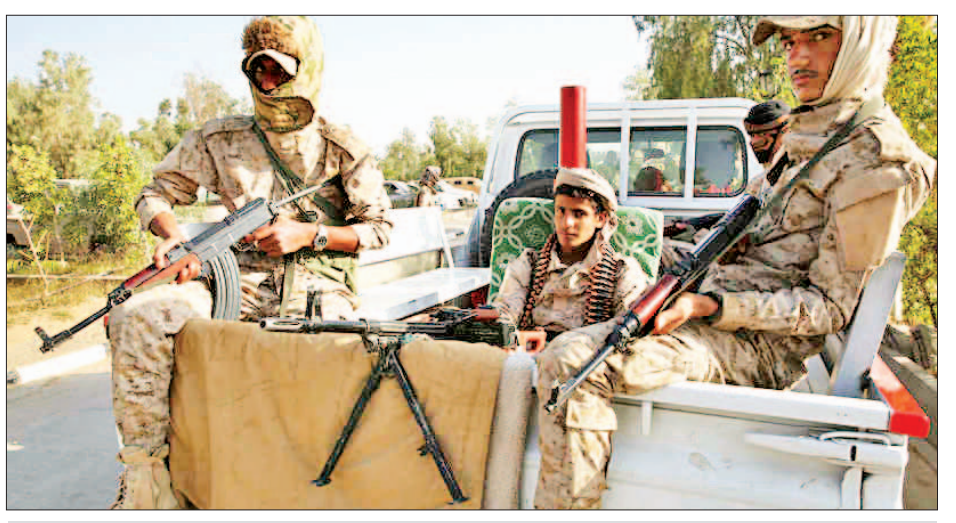
မာရစ်ပြည်နယ်ရှိ စစ်အခြေစိုက်စခန်းတစ်ခုမှ ယီမင်တပ်ဖွဲ့ဝင်များ။

ဆိုင်ရာ သတင်းရပ်ကွက်က အေအက်ဖ်ပီသို့ ပြောကြားသည်။ ယင်း တိုက်ခိုက်မှုတွင် အနည်းဆုံး ယီမင် တပ်ဖွဲ့ဝင် ၇၀ သေဆုံးခဲ့ကြောင်း သေကျေဒဏ်ရာရသူများကို ပို့ဆောင် သည့် မာရစ်မြို့ ဆေးရုံမှ ပြောကြားခဲ့ သည်။ ယင်းတိုက်ခိုက်မှုနှင့် စပ်လျဉ်း၍ တာဝန်ရှိကြောင်း ဟူသီသူပုန်များက ချက်ချင်းမှတ်ချက်ပြုခဲ့ခြင်းမရှိပေ။ ဟူသီသူပုန်တို့၏ ပဲ့ထိန်းခုံးကျည် ဖြင့် ပစ်ခတ်ခြင်းသည် သူရဲဘော် ကြောင့်ပြီး အကြမ်းဖက်သည့် တိုက်ခိုက်မှုဖြစ်ကြောင်း ယီမင်နိုင်ငံ သမ္မတ မန်ဆောဟာဒီက ပြစ်တင် ပြောကြားခဲ့သည်ကို နိုင်ငံ၏တရားဝင် သတင်းအေဂျင်စီ ဆာဘာက ဖော်ပြ ခဲ့သည်။ ၂၀၁၅ ခုနှစ် မတ်လအတွင်း ဖြစ်ပွားခဲ့သည့် ယီမင်ပဋိပက္ခ၌ ဟူသီသူပုန်တို့ကို ဆန့်ကျင်ရာတွင် ယီမင်အစိုးရအား အထောက်အပံ့ပေး ရန် ဆော်ဒီအာရေဗျနှင့် ၎င်း၏ မဟာ မိတ်ဖွဲ့များက ကြားဝင်ဖျန်ဖြေပေးခဲ့ သည်။ ယင်းပဋိပက္ခတွင် အရပ်သား အများစု အပါအဝင် လူထောင်ပေါင်း များစွာ သေဆုံးခဲ့သည်။ ၂၀၁၄ ခုနှစ် နောက်ပိုင်းတွင် ဟူသီသူပုန်တို့သည် မြို့တော်ဆာနားကို စီးနင်းတိုက်ခိုက်ခဲ့ ပြီး ယီမင်နိုင်ငံ၏ မြောက်ပိုင်းဒေသ အများစုကို ထိန်းချုပ်ထားခဲ့သည်။ ကိုးကား - အေအက်ဖ်ပီ ဘာသာပြန် - အလင်းသစ်