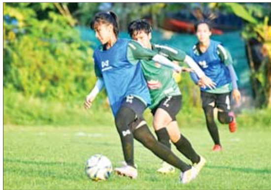
၂၀၁၉ ခုနှစ်က ဖွဲ့စည်းခဲ့သည့် မြန်မာလူငယ်အမျိုးသမီးအသင်း