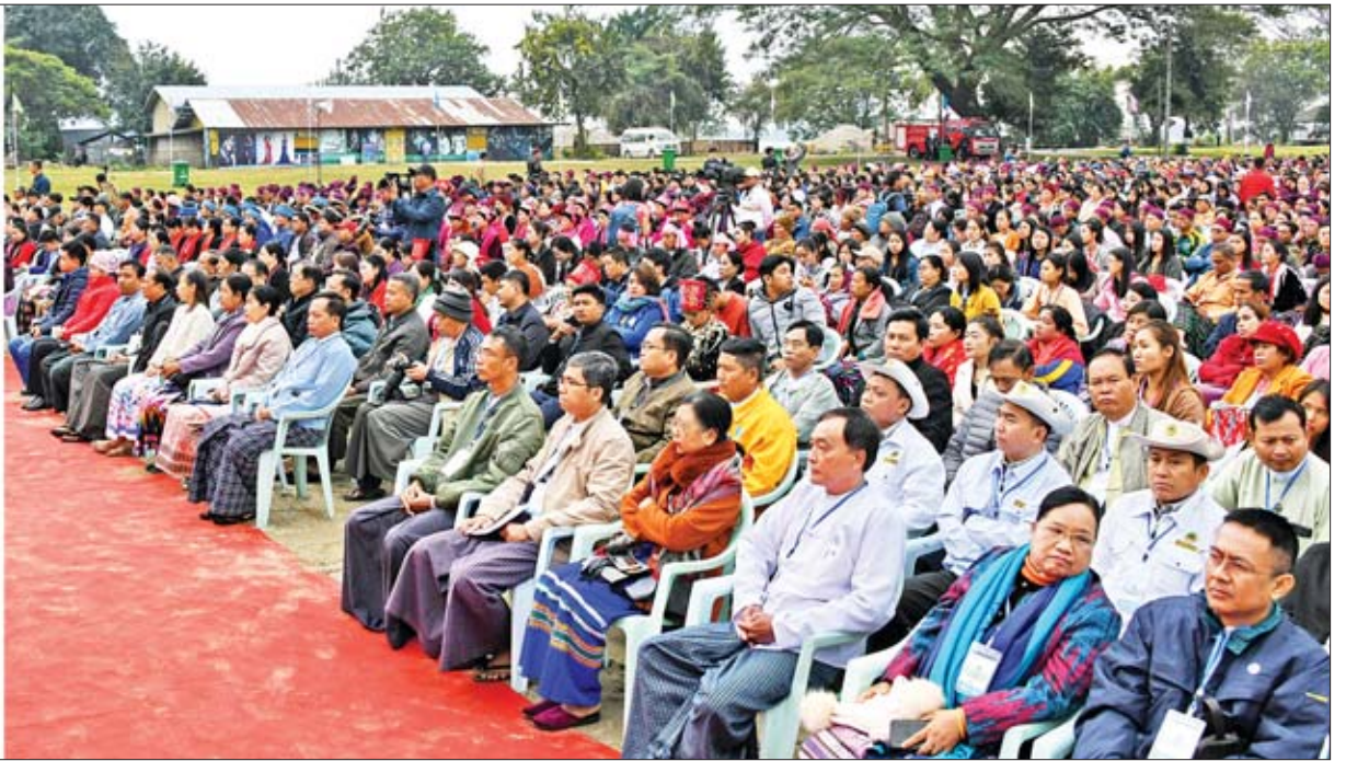
နိုင်ငံတော်၏အတိုင်ပင်ခံပုဂ္ဂိုလ် ဒေါ်အောင်ဆန်းစုကြည် (၇၂)နှစ်မြောက် ကချင်ပြည်နယ်နေ့အခမ်းအနားတွင် မိန့်ခွန်းပြောကြားစဉ်။

အရှေ့ဖုံးမှ (နိုင်ငံတော်၏ အတိုင်ပင်ခံပုဂ္ဂိုလ် ဒေါ်အောင်ဆန်းစုကြည်၏ (၇၂)နှစ်မြောက် ကချင်ပြည်နယ်နေ့ အခမ်းအနားတွင် ပြောကြားသည့် မိန့်ခွန်းအပြည့်အစုံအား စာမျက်နှာ-၅ တွင် ဖော်ပြထားပါသည်။ ထို့နောက် မြစ်ကြီးနားမြို့ စီတာပုနှစ်ခြင်း အသင်းတော်မှ သိက္ခာတော်ရ ဦးကျော်ခင်က ပြည်ထောင်စုသမ္မတ မြန်မာနိုင်ငံတော်နှင့် နိုင်ငံသူ နိုင်ငံသားများ၊ နိုင်ငံတော်၏အတိုင်ပင်ခံ ပုဂ္ဂိုလ်နှင့် တာဝန်ရှိသူများ၊ (၇၂)နှစ်မြောက် ကချင်ပြည်နယ်နေ့ အခမ်းအနားနှင့် မနောပွဲတော်အတွက် ကောင်းချီးမင်္ဂလာရရှိစေရန် ဆုတောင်းပေးသည်။ ယင်းနောက် နိုင်ငံတော်၏အတိုင်ပင်ခံ ပုဂ္ဂိုလ်၊ ပြည်ထောင်စုဝန်ကြီး ဒုတိယဗိုလ်ချုပ်ကြီး ရဲအောင်၊ ပြည်နယ်ဝန်ကြီးချုပ် ဒေါက်တာ ခက်အောင်၊ ပြည်နယ်လွှတ်တော်ဥက္ကဋ္ဌ ဦးထွန်းတင်နှင့် ကချင်နှစ်ခြင်းခရစ်ယာန်အဖွဲ့ ချုပ် အထွေထွေအတွင်းရေးမှူး သိက္ခာတော်ရ ဖော်ယောင်တူးမိုင်တို့က (၇၂)နှစ်မြောက် ကချင်ပြည်နယ်နေ့ အထိမ်းအမှတ် မနောပွဲ တော်ကို ဖြစ်ကြီးဖြတ်ဖွင့်လှစ်ပေးကြသည်။ ပါဝင်ဆင်နွှဲ ထို့နောက် နိုင်ငံတော်၏အတိုင်ပင်ခံပုဂ္ဂိုလ်၊ ပြည်ထောင်စုဝန်ကြီးများ၊ ပြည်နယ်ဝန်ကြီး ချုပ်၊ တာဝန်ရှိသူများသည် တိုင်းရင်းသားရိုးရာ ယဉ်ကျေးမှုအဖွဲ့များ၊ ဒေသခံပြည်သူများနှင့် အတူ မနောအကဖြင့် ပါဝင်ဆင်နွှဲသည်။ ယင်းနောက် နိုင်ငံတော်၏အတိုင်ပင်ခံ ပုဂ္ဂိုလ်သည် မနောအိမ်တော်၌ မနောရိုးရာအဖွဲ့