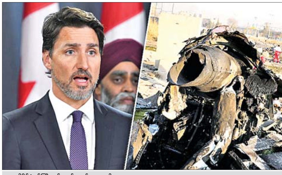
ကနေဒါနိုင်ငံဝန်ကြီးချုပ် ဂျက်စတင် ထရူးဒေါ

အော့တဝါ ဇန်နဝါရီ ၁၀ ဇန်နဝါရီ ၈ ရက်တွင် ယူကရိန်းခရီးသည်လေယာဉ် ပျက်ကျခဲ့ခြင်းနှင့်ပတ်သက်ပြီး အီရန်နိုင်ငံအပေါ် ကနေဒါ၊ ဗြိတိန်နှင့် အမေရိကန်နိုင်ငံများက သင်္ကာမကင်း ဖြစ်လျက်ရှိသည်။ အဆိုပါလေယာဉ်အား အီရန်နိုင်ငံက ခိုးကျွတ်ဖြင့် ပစ်ချခဲ့ခြင်းဖြစ်သည်ဟု သံသယများ မြင့်တက်လျက်ရှိသော်လည်း စွပ်စွဲချက်များကို အီရန်နိုင်ငံက ငြင်းပယ်ခဲ့သည်။ ဇန်နဝါရီ ၈ ရက်က ခရီးသည် ၁၈၀ နီးပါး သယ်ဆောင်လာသော ယူကရိန်းလေကြောင်း UIA Airlines မှ ဘိုရင်း ၇၃၇ ခရီးသည်တင်လေယာဉ်သည် တီဟီရန်မြို့လေဆိပ်မှ ထွက်ခွာလာပြီးနောက် မကြာမီအချိန်တွင် ပျက်ကျခဲ့ခြင်းဖြစ်သည်။ လိုက်ပဲစီးနင်းလာသူအားလုံး သေဆုံးခဲ့သည်။ အဆိုပါလေယာဉ်ပေါ်တွင် အီရန်နိုင်ငံသား ၈၂ ဦးနှင့် ကနေဒါနိုင်ငံသား ၆၃ ဦးတို့ လိုက်ပဲစီးနင်းခဲ့ကြောင်းနှင့် ယူကရိန်း၊ ဆွီဒင်၊ အာဖဂန်နစ္စတန်၊ ဂျာမနီနှင့် ဗြိတိန်နိုင်ငံသားများလည်း ပါဝင်သည်ဟု ယူကရိန်းအစိုးရက ဆိုသည်။ ယူကရိန်းလေယာဉ်ပျက်ကျခြင်းသည် အီရန်နိုင်ငံ၏ ခိုးကျွတ်ပစ်ခတ်မှုကြောင့် ဖြစ်သည်ဆိုသည့် သက်သေအထောက်အထားများရှိပါကြောင်း ကနေဒါနိုင်ငံဝန်ကြီးချုပ်ဂျက်စတင်ထရူးဒေါက ဇန်နဝါရီ ၉ ရက်တွင် ပြောကြားခဲ့သည်။ ဗြိတိန်ဝန်ကြီးချုပ် ဘောရစ်ဂျွန်ဆင်က အဆိုပါလေယာဉ်ကို အီရန်တပ်ဖွဲ့က မရည်ရွယ်ဘဲ ခိုးကျွတ်ဖြင့် ပစ်ချခဲ့သည်ဆိုသော သတင်းအရင်းအမြစ်တစ်ခု ရှိပါ