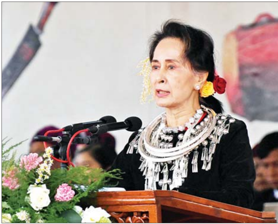
နိုင်ငံတော်၏အတိုင်ပင်ခံပုဂ္ဂိုလ် ဒေါ်အောင်ဆန်းစုကြည် (၇၂) နှစ်မြောက် ကချင်ပြည်နယ်နေ့ အခမ်းအနားတွင် မိန့်ခွန်းပြောကြားစဉ်။

ကျွန်မအနေနဲ့ ယခုလို (၇၂) နှစ်မြောက် ကချင်ပြည်နယ်နေ့ကို လာရောက်နိုင်တဲ့အတွက် အင်မတန်မှ ဝမ်းသာပါတယ်။ ကျွန်မတို့ရဲ့ ပြည်ထောင်စုသားချင်းတွေနဲ့အတူ ဒီနေရာမှာရှိနေရတယ်ဆိုတာဟာ ကျွန်မတို့ရဲ့ပြည်ထောင်စုအတွက် ကျွန်မတို့ဘယ်လောက် အလေးထားတယ်၊ ဘယ်လောက် ကျွန်မတို့ရဲ့ပြည်ထောင်စုကို တိုးတက်စေချင်တယ်၊ ဘယ်လောက်ခိုင်မြဲစေချင်တယ်ဆိုတာကို ပြခွင့်ရတဲ့အတွက်အင်မတန်မှ ကျေးဇူးတင်ပါတယ်။ နှစ်ဦးပိုင်းမှာလည်းဖြစ်လို့ ကျွန်မတို့ရဲ့ ကချင်ပြည်နယ်မှာရှိတဲ့ တိုင်းရင်းသား ညီအစ်ကိုမောင်နှမတွေ အားလုံးကို နှစ်ဦးအတွက် ဒီနှစ်သစ်အတွက် ဆုမွန်ကောင်းတွေလည်း တောင်းပေးချင်ပါတယ်။ အားလုံးကျန်းမာချမ်းသာစွာနဲ့ နှလုံးစိတ်ဝမ်းအေးချမ်းနိုင်ကြပါစေလို့ ကျွန်မအနေနဲ့ ဆုတောင်းပေးပါတယ်။