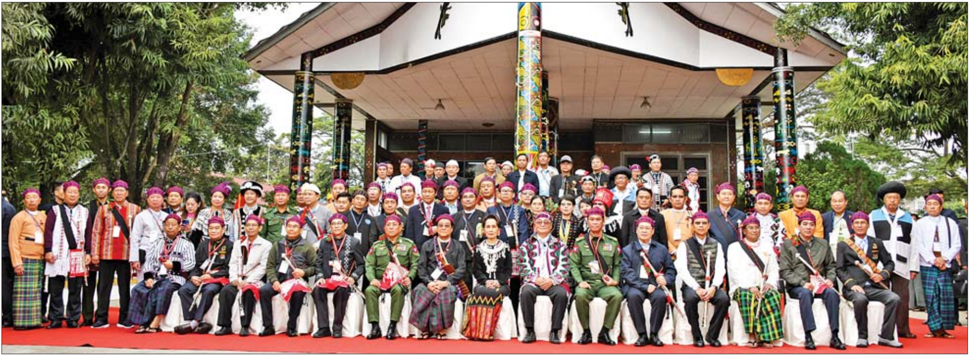
နိုင်ငံတော်၏အတိုင်ပင်ခံပုဂ္ဂိုလ် ဒေါ်အောင်ဆန်းစုကြည်၊ ပြည်ထောင်စုဝန်ကြီးများ၊ ပြည်နယ်ဝန်ကြီးချုပ်နှင့်တာဝန်ရှိသူများ၊ မြန်မာနိုင်ငံ ကချင်လူမျိုးရိုးရာယဉ်ကျေးမှုအသင်းဥက္ကဋ္ဌနှင့်အဖွဲ့ဝင်များ၊ ယဉ်ကျေးမှုအဖွဲ့များနှင့် စုပေါင်း မှတ်တမ်းတင်ဓာတ်ပုံရိုက်စဉ်။

များ၊ မနောရိုးရာအဖွဲ့အကြီးအကဲများ၊ တာဝန် ရှိသူများနှင့်လည်းကောင်း မှတ်တမ်းတင် ဓာတ်ပုံရိုက်ကြသည်။ (၇၂)နှစ်မြောက် ကချင်ပြည်နယ်နေ့ အတွက် တပ်မတော်ကာကွယ်ရေးဦးစီးချုပ် ဗိုလ်ချုပ်မှူးကြီးမင်းအောင်လှိုင်၊ Peace Creation Group(PCG)နှင့် ကချင်တိုင်းရင်းသား လုပ်ငန်းရှင်များအသင်းတို့ကလည်း သဝဏ် လွှာများ ပေးပို့ထားကြောင်း သိရသည်။ ယင်းနောက် နိုင်ငံတော်၏အတိုင်ပင်ခံ ပုဂ္ဂိုလ်သည် မြစ်ကြီးနားမြို့ ရွှေစက်ရပ်ကွက်ရှိ စာမျက်နှာ ၄ သို့