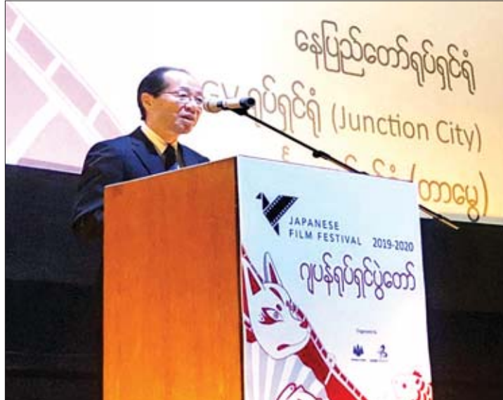
ဂျပန်သံအမတ်ကြီး မစ္စတာ အိချိရော မာရယာမ အမှာစကား ပြောကြားစဉ်။

ရန်ကုန် ဇန်နဝါရီ ၁၀ ဂျပန်သံရုံးနှင့် ဂျပန်ဖောင်ဒေးရှင်းတို့က ကြီးမှူးကျင်းပသည့် ဂျပန်ရုပ်ရှင်ပွဲတော် ၂၀၁၉-၂၀၂၀ကို ယနေ့ညနေ ၆ နာရီတွင် ရန်ကုန်မြို့ရှိ နေပြည်တော်ရုပ်ရှင်ရုံ၌ မြန်မာနိုင်ငံဆိုင်ရာ ဂျပန်သံအမတ်ကြီး မစ္စတာ အိချိရော မာရယာမနှင့် တာဝန်ရှိသူများ၊ ပြန်ကြားရေးနှင့် ပြည်သူ့ဆက်ဆံရေးဦးစီးဌာန၊ ရုပ်ရှင်မြှင့်တင်ရေးဌာနမှ ညွှန်ကြားရေးမှူး ဦးသိန်းနိုင်တို့ တက်ရောက်ပြီး “Masquerade Hotel” ဂျပန်ရုပ်ရှင်ဇာတ်ကားဖြင့် ဖွင့်လှစ်ပြသသည်။ ဖွင့်ပွဲအခမ်းအနားတွင် ဂျပန်သံအမတ်ကြီး မစ္စတာ အိချိရော မာရယာမက ယနေ့ ဂျပန်ရုပ်ရှင်ပွဲတော်သည် ဂျပန်-မြန်မာ ချစ်ကြည်ရေး အခွန်ရှည်တည်တံ့ခိုင်မြဲမှုနှင့် ဂျပန်ရုပ်ရှင်များမှ တစ်ဆင့် ဂျပန်လူမျိုးများနှင့် ပိုမိုနီးကပ်ရင်းနှီးလာစေရန်၊ ဂျပန်နိုင်ငံအကြောင်း ပိုမိုသိရှိနားလည်နိုင်စေရန် ဖြစ်ပါကြောင်း၊ ဂျပန်ရုပ်ရှင်ကားကောင်းများကို မြန်မာပြည်သူများ ပရိသတ်များအနေဖြင့် ကြိုက်နှစ်သက်မည်ထင်ပါကြောင်း ပြောကြားသည်။ ဂျပန်ရုပ်ရှင်ပွဲတော်ကို နေပြည်တော်ရုပ်ရှင်ရုံတွင် ဇန်နဝါရီ ၁၀ ရက်မှ ၁၉ ရက်အထိ လည်းကောင်း၊ JCGV ရုပ်ရှင်ရုံ (Junction City) တွင် ၁၁ ရက်နှင့် ၁၂ ရက်တို့တွင် လည်းကောင်း၊ မင်္ဂလာ (တာမွေ) ရုပ်ရှင်ရုံတွင် ၁၈ ရက်နှင့် ၁၉ ရက်တို့တွင် လည်းကောင်း ဂျပန်ရုပ်ရှင်ကား (၁၀)ကားဖြင့် ပြသမည်ဖြစ်ကြောင်း သိရသည်။ အဆိုပါဂျပန်ရုပ်ရှင်ပွဲတော်ကို နေပြည်တော်ရှိ အောင်သပြေရုပ်ရှင်ရုံ၌ ၂၀၁၉ ခုနှစ် ဒီဇင်ဘာ ၂၀ ရက်နှင့် ၂၁ ရက်တို့တွင် ကျင်းပခဲ့ပြီး ဆက်လက်၍ မန္တလေးမြို့ရှိ ဝင်းလိုက်ရုပ်ရှင်ရုံတွင် ဇန်နဝါရီ ၃၁ ရက်မှ ဖေဖော်ဝါရီ ၂ ရက်အထိ ကျင်းပရန် ရှိကြောင်း သိရသည်။ ဟန်လင်းအောင် (FDC)