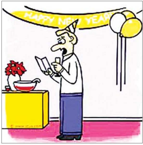
(စ) လွှတ်တော်အစည်းအဝေးများတွင် သတိမှတ်ထားသည့် စည်းကမ်း များကို လိုက်နာဆောင်ရွက်ခြင်းတို့ဖြစ်ပါသည်။ (စာ- ၃၄၅)