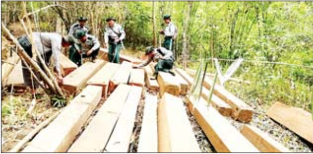
ရမိခဲ့သည်။

နေပြည်တော် ဇန်နဝါရီ ၁၀ ပြည်သူ့ပေါင်းပါဝင်မှုဖြင့် လူထုအခြေပြုစောင့်ကြပ်ကြည့်ရှုသတင်းပို့စနစ် (CMRS) ဖြင့် သတင်းပေးပို့ချက်အရ ဇန်နဝါရီ ၆ ရက်မှ ၇ ရက်အထိ သစ်တော ဦးစီးဌာနမှ ဝန်ထမ်းများပါဝင်သော ပူးပေါင်းအဖွဲ့သည် တရားမဝင်သစ်များ ရှာဖွေသိမ်းဆည်းလျက်ရှိသည်။