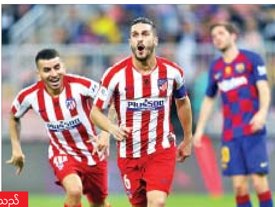
ငွေကြယ် - ရေးသားသည်

အဲဒါကြောင့် ရီးယဲလ်မက်ဒရစ်အသင်းဟာ ဗလင်စီယာ အသင်းနဲ့ စပိန်ကိုပါဒယ်ရေးဖလား ဆီမီးပိုင်နယ်ကစားခွင့် ရရှိခဲ့ပြီး အဲဒီနှစ်သင်းပွဲစဉ်မှာ ရီးယဲလ်မက်ဒရစ်အသင်းဟာ ဗလင်စီယာအသင်းကို သုံးဂိုး-တစ်ဂိုးနဲ့ အနိုင်ရရှိခဲ့တာကြောင့် အက်သလက်တီကိုမက်ဒရစ်အသင်းဟာ ဗိုလ်လု ပွဲစဉ်မှာ ရီးယဲလ်မက်ဒရစ်အသင်းနဲ့ ယှဉ်ပြိုင်ကစားရမှာ ဖြစ်ပါတယ်။