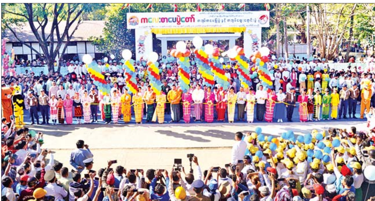
ပြည်ထောင်စုဝန်ကြီး ဒေါက်တာဖေမြင့်၊ ရောဂါတိုင်းဒေသကြီး ဝန်ကြီးချုပ် ဦးလှမိုးအောင်၊ တာဝန်ရှိသူများ၊ ထူးချွန် ကျောင်းသား ကျောင်းသူများနှင့်အတူ ကလေးစာပေပွဲတော်ကို ဖဲကြိုးဖြတ်ဖွင့်လှစ်ပေးစဉ်။

ဖြစ်ပါကြောင်း၊ ခရိုင်အဆင့် မြို့ကြီး များတွင်လည်း (၄၃) ကြိမ်ကျင်းပခဲ့ပြီး ဖြစ်သကဲ့သို့ စိတ်ပါဝင်စားသူများ စုပေါင်းပြီးလည်း ဒေသအစီအစဉ်ဖြင့် (၁၁) ကြိမ် ကျင်းပခဲ့ပြီးဖြစ်ပါကြောင်း။ နိုင်ငံတစ်ဝန်းတွင်လည်း ကလေး စာပေပွဲတော်များ ဆက်လက်ကျင်းပ ရန်လည်း စီစဉ်ဆောင်ရွက်လျက်ရှိပါ ကြောင်း၊ ရောဂါတိုင်းဒေသကြီး အစိုးရအဖွဲ့အနေဖြင့် ယမန်နှစ်က ပုသိမ်မြို့တွင် ကလေးစာပေပွဲတော် ကျင်းပခဲ့စဉ် တိုင်းဒေသကြီးအတွင်းရှိ မြို့နယ်အားလုံးမှကလေးများ ကလေး စာပေပွဲတော်များတွင် ပါဝင်ဆင်နွှဲနိုင် စေရန် ဆန္ဒရှိမှုကြောင့် တိုင်းဒေသကြီး အတွင်းရှိ (၂၆) မြို့နယ်တွင် ယခုကဲ့သို့ အကောင်အထည်ဖော် စီစဉ်ဆောင် ရွက်နေခြင်းဖြစ်ကြောင်း သိရှိရသဖြင့် အထူးဝမ်းသာအားရ ဖြစ်မိပါကြောင်း၊ ထိုသို့ ကျင်းပရာတွင် ဌာနဆိုင်ရာ တာဝန်ရှိသူများအပြင် ရပ်မီ၊ ရပ်ဖများ နှင့် စေတနာရှင် ပြည်သူများကလည်း စိတ်အားထက်သန်စွာ ပူးပေါင်းပါဝင် ပံ့ပိုးကူညီဆောင်ရွက်မှုများကြောင့် ကလေးစာပေပွဲတော်များ စည်ကား သိုက်မြိုက်စွာဖြင့် ကျင်းပနေမှုကို တွေ့မြင်ရသကဲ့သို့ ပွဲတော်များတွင် ကလေးများ ပျော်ရွှင်တက်ကြွစွာ ပါဝင်ဆင်နွှဲကြမှုကို မြင်တွေ့ရသဖြင့် လည်း ပွဲတော်ဖြစ်မြောက်အောင် စီမံ ဆောင်ရွက်ကြသူအားလုံးကို အထူး