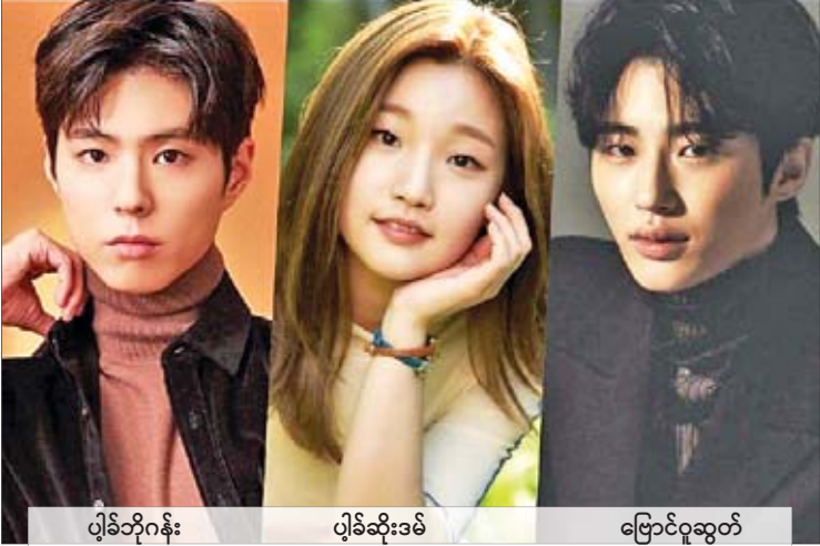
"Record of Youth" မှာ မော်ဒယ်လ် လောကအကြောင်း တွေ့မြင်ခံစားရမှာ ဖြစ်ပါတယ်။ မော်ဒယ်လ်လောကမှာ လှုပ်ရှားနေတဲ့ လူငယ်တွေရဲ့ ရုန်းကန်မှုတွေလည်း ပါဝင် မှာပါ။ ဒီဇာတ်လမ်းတွဲကို ယခုနှစ် နှစ်လယ် ပိုင်းမှာ စတင်ပြသသွားဖို့ရည်ရွယ်ထားပြီး လက်ရှိမှာ ဆွေးနွေးမှုတွေ ပြုလုပ်နေကြောင်း လည်း သိရပါတယ်။

ဇန်နဝါရီ ၁၀ ရက်မှာ အဆိုပစ်ဇာတ်လမ်း တွဲကို ရိုက်ကူးထုတ်လွှင့်သွားမယ့် tvN ရုပ်သံ လိုင်းက ဇာတ်လမ်းတွဲရဲ့ အဓိကဇာတ်ဆောင် တွေကို ထုတ်ဖော်ပြောကြားလာတာ ဖြစ်ပါတယ်။ ဒီဇာတ်လမ်းတွဲကို "Record of Youth" လို့ ယာယီအမည်ပေးထားပြီး ကျော်ကြားတဲ့ မင်းသားတစ်ဦးဖြစ်သူ ပျိုခိုက်နန်း၊ ရွှေကမ္ဘာလုံး ဆုကို ဆွတ်ခူးနိုင်ခဲ့တဲ့ ပထမဆုံးသော တောင်ကိုရီးယားရုပ်ရှင် Parasite ရဲ့ မင်းသမီး ပျိုခိုက်ဆိုးဒမ်နဲ့ မင်းသား ပြောင်ဝူဆွတ်တို့ အဓိကပါဝင်သွားမှာဖြစ်ပြီး သရုပ်ဆောင်ရွေးချယ်မှုတွေ ပြီးဆုံးချိန်မှာ ဇာတ်ကားကို စတင်ရိုက်ကူးသွားမှာဖြစ်တယ် လို့လည်း သိရပါတယ်။