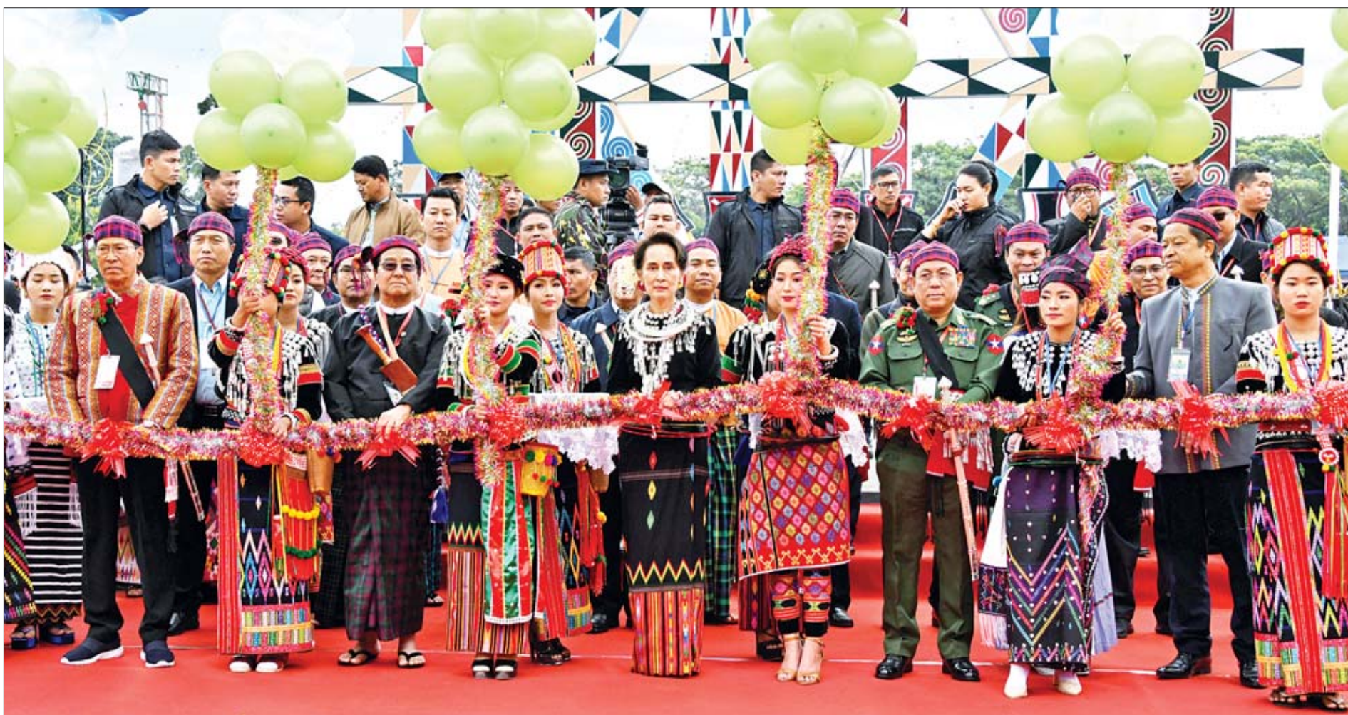
နိုင်ငံတော်၏အတိုင်ပင်ခံပုဂ္ဂိုလ် ဒေါ်အောင်ဆန်းစုကြည်၊ ပြည်ထောင်စုဝန်ကြီး ဒုတိယဗိုလ်ချုပ်ကြီးရဲအောင်၊ ပြည်နယ်ဝန်ကြီးချုပ် ဒေါက်တာခက်အောင်၊ ပြည်နယ်လွှတ်တော်ဥက္ကဋ္ဌ ဦးထွန်းတင်နှင့် ကချင်နှစ်ခြင်းခရစ်ယာန်အဖွဲ့ချုပ် အထွေထွေအတွင်းရေးမှူး သိက္ခာတော်ရ ဖော်ယောင်ကျင်းမိုင်တို့က (၇၂)နှစ်မြောက် ကချင်ပြည်နယ်နေ့ အထိမ်းအမှတ် မနောပွဲတော်ကို ဖဲကြီးဖြတ်ဖွင့်လှစ်ပေးကြစဉ်။