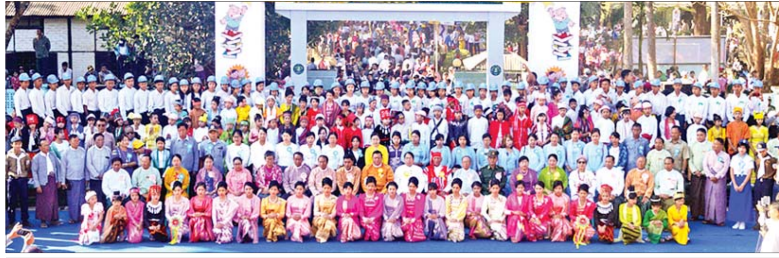
ပြည်ထောင်စုဝန်ကြီး ဒေါက်တာဖေမြင့်၊ ရောဂါတိုင်းဒေသကြီးဝန်ကြီးချုပ် ဦးလှမိုးအောင်၊ တာဝန်ရှိသူများ၊ ကလေးစာပေပွဲတော်သို့ တက်ရောက်လာကြသူများနှင့်အတူ စုပေါင်းမှတ်တမ်းတင် ဓာတ်ပုံရိုက်စဉ်။