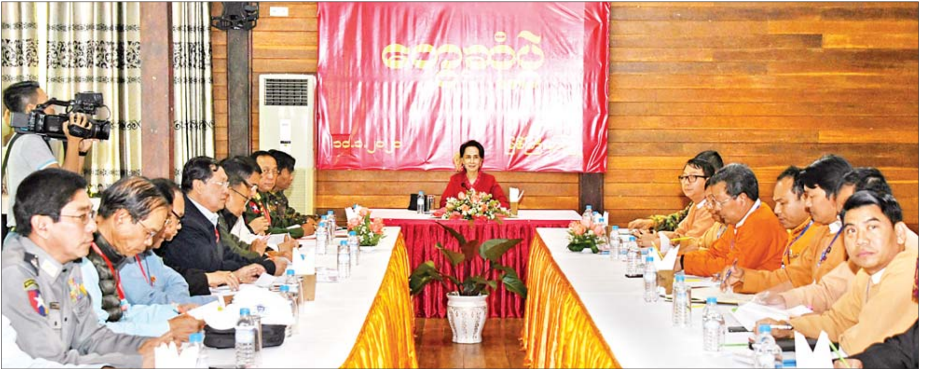
နိုင်ငံတော်၏အတိုင်ပင်ခံပုဂ္ဂိုလ် ဒေါ်အောင်ဆန်းစုကြည် ကချင်ပြည်နယ်ဝန်ကြီးချုပ် ဒေါက်တာခင်အောင်နှင့် ပြည်နယ်ဝန်ကြီးများနှင့်တွေ့ဆုံစဉ်။