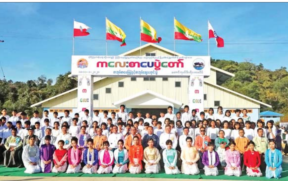
ရခိုင်ပြည်နယ်ဝန်ကြီးချုပ် ဦးညီပု၊ ပြန်ကြားရေးဝန်ကြီးဌာန ဒုတိယဝန်ကြီး ဦးအောင်လှထွန်း၊ ပြည်နယ်ဝန်ကြီးများ၊ မြို့မိမြို့ဖများနှင့် ကျောင်းသား ကျောင်းသူများ စုပေါင်းမှတ်တမ်းတင်ဓာတ်ပုံရိုက်စဉ်။

တောင်ကုတ် ဇန်နဝါရီ ၁၀ ရခိုင်ပြည်နယ်အစိုးရအဖွဲ့၏ ဦးဆောင်မှုဖြင့် ပြန်ကြားရေးနှင့် ပြည်သူ့ဆက်ဆံရေးဦးစီးဌာန၊ အခြေခံပညာဦးစီးဌာနနှင့် တောင်ကုတ်မြို့နယ် စီမံခန့်ခွဲရေးကော်မတီတို့ ပူးပေါင်းကျင်းပသော ကလေးစာပေပွဲတော်၊ စာအုပ်ပြပွဲနှင့် စာအုပ်ဈေးရောင်းပွဲကို ယနေ့ မှန်းလွဲပိုင်းက တောင်ကုတ်ဒီဂရီကောလိပ်တွင် စည်ကားသိုက်မြိုက်စွာ ကျင်းပသည်။