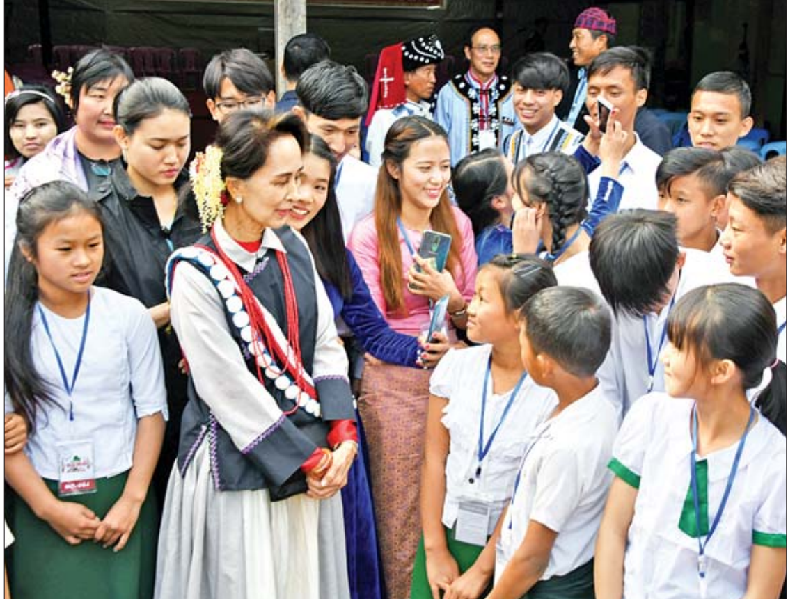
နိုင်ငံတော်၏အတိုင်ပင်ခံပုဂ္ဂိုလ် ဒေါ်အောင်ဆန်းစုကြည် လူမှုဝန်ထမ်းဦးစီးဌာန အသိအမှတ်ပြု တောင်တန်းဒေသ ကျောင်းသား ကျောင်းသူများ ပြုစုစောင့်ရှောက်ရေးဂေဟာမှ ကျောင်းသား ကျောင်းသူများနှင့် ရင်းရင်းနှီးနှီးတွေ့ဆုံစဉ်။

ဝန်ကြီးများနှင့်တွေ့ဆုံပြီး ကချင်ပြည်နယ်တွင် ငြိမ်းချမ်းရေးကို အနှောင့်အယှက်ဖြစ်စေနိုင်သည့် မဖြစ်ပေါ်စေရန် ပြည်နယ်အစိုးရက တာဝန်ယူဆောင်ရွက်ရန်ဖြစ်ကြောင်း၊ ပုံမှန် ဖွံ့ဖြိုးရေးလုပ်ငန်းများကို ဆောင်ရွက်နေချိန်တွင် ငြိမ်းချမ်းရေးကို အထူးဂရုစိုက်ဆောင်ရွက်ရန်လိုကြောင်း၊ ယမန်နေ့က ပြည်သူများ၏ တင်ပြချက်များကို အထူးအလေးထားပြီး ဆောင်ရွက်ပေးရန် လိုအပ်ကြောင်း၊ လူထုတွေ့ဆုံပွဲများသို့ မျှော်လင့်ချက်ဖြင့် တက်ရောက်ကာ တင်ပြလာသည့် ကိစ္စရပ်များကို ပြည်သူ့အသံအဖြစ် တန်ဖိုးထားပြီး အလေးအနက်ထား ဆောင်ရွက်ပေးရန် လိုအပ်ကြောင်း၊ အမြန်ဆုံးပြီးနိုင်သည့်များကို အချိန်မဆိုင်းဘဲ ချက်ချင်းဆောင်ရွက်ပေးရန် လိုအပ်ကြောင်း၊ ကချင်ပြည်နယ်နေ့ ကျင်းပရေးနှင့်စပ်လျဉ်းသည့် အခေါ်အဝေါ် ဝေါဟာရဆိုင်ရာ အငြင်းပွားမှုများရှိနေသည်ကို ပြည်နယ်အစိုးရက ဦးဆောင်တာဝန်ယူကာ အားလုံးလက်ခံသဘောတူသည့် အဖြေကို ရှာပေးရန် ဖြစ်ကြောင်း၊ တိုင်းရင်းသားပေါင်းစုံ နေထိုင်ကြသဖြင့် မတူကွဲပြားမှုများကြောင့် ပြဿနာများမဖြစ်စေဘဲ ညီညီညွတ်ညွတ် ဖြစ်စေရန် ပြည်နယ်အစိုးရက ဆောင်ရွက်ပေးရန်ဖြစ်ကြောင်း၊ ပြည်ထောင်စုအစိုးရက တွေ့ဆုံဆွေးနွေးမှုများ ဆောင်ရွက်နေချိန်တွင် ပြည်နယ်အစိုးရက မျိုးနွယ်စုများအကြား သဟဇာတဖြစ်စေရေး ကူညီဆောင်ရွက်ပေးရန် လိုအပ်ကြောင်းပြောကြားသည်။