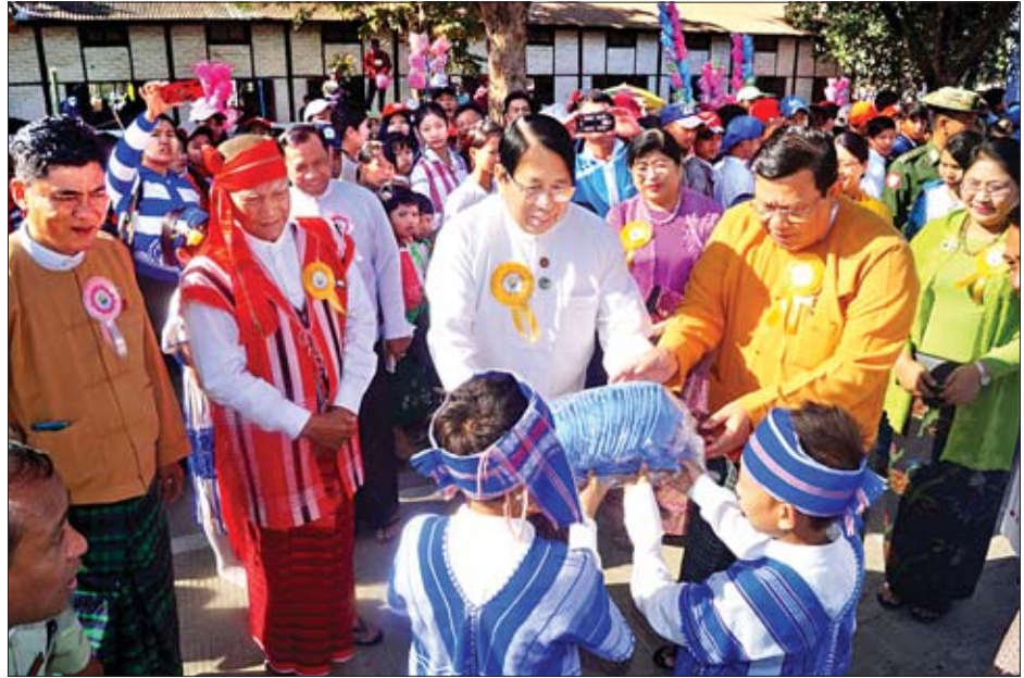
ပြည်ထောင်စုဝန်ကြီး ဒေါက်တာဖေမြင့်နှင့် ရောဂါတိုင်းဒေသကြီး ဝန်ကြီးချုပ် ဦးလှမိုးအောင်တို့ ကလေးများအား လက်ဆောင်ပစ္စည်းများ ပေးအပ်စဉ်။

သတင်း-နေဝင်း(ပြန်/ဆက်)