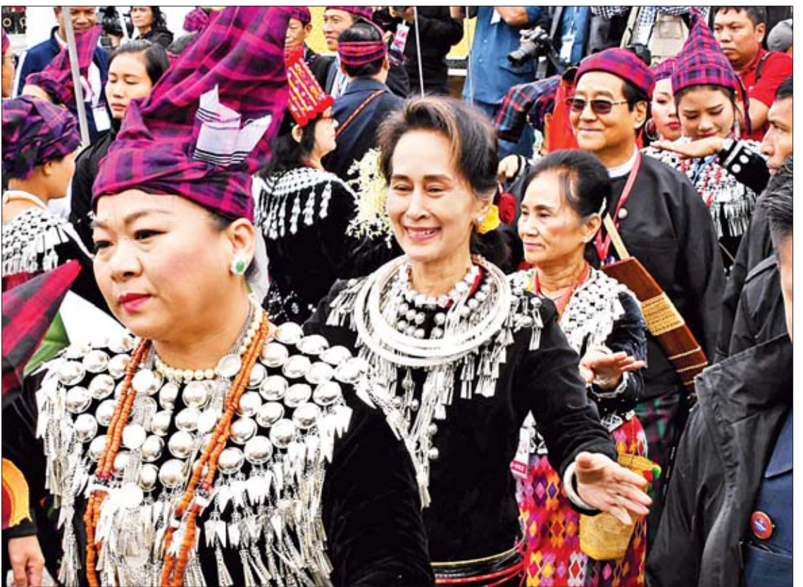
နိုင်ငံတော်၏အတိုင်ပင်ခံပုဂ္ဂိုလ် ဒေါ်အောင်ဆန်းစုကြည် ဒေသခံပြည်သူများနှင့်အတူ မနောအကဖြင့် ပါဝင်ဆင်နွှဲစဉ်။

အကြီးအကဲများ၊ မြန်မာနိုင်ငံ ကချင်လူမျိုး ရိုးရာယဉ်ကျေးမှုအသင်းဥက္ကဋ္ဌ ဦးထိုပူးဒဂုဏ် နှင့် အဖွဲ့ဝင်များအား ရင်းရင်းနှီးနှီးတွေ့ဆုံ သည်။ ဂါရဝပြုပေးအပ် တွေ့ဆုံပွဲတွင် နိုင်ငံတော်၏အတိုင်ပင်ခံ ပုဂ္ဂိုလ်အား မြန်မာနိုင်ငံ ကချင်လူမျိုးရိုးရာ ယဉ်ကျေးမှုအသင်းမှ တိုင်းရင်းသား၊ တိုင်းရင်း သူများက ကချင်ရိုးရာ ကောက်ညှင်းပလိင်းနှင့် ကချင်ရိုးရာပန်းချီကားကို ဂါရဝပြုပေးအပ်ကြ သည်။ ထို့နောက် မြန်မာနိုင်ငံ ကချင်လူမျိုးရိုးရာ ယဉ်ကျေးမှုအသင်းဥက္ကဋ္ဌ ဦးထိုပူးဒဂုဏ်က နှုတ်ခွန်းဆက်စကားပြောကြားသည်။ ယင်းနောက် နိုင်ငံတော်၏အတိုင်ပင်ခံ ပုဂ္ဂိုလ်က ကချင်ပြည်နယ်မနောပွဲသို့ တက် ရောက်ပြီး ပါဝင်ဆင်နွှဲခွင့်ရသည့်အတွက် ဂုဏ်ယူ ဝမ်းမြောက်ပါကြောင်း၊ နောင်နှစ်မနောပွဲများ တွင်လည်း မိမိနှင့်အားလုံး ပါဝင်ဆင်နွှဲနိုင်မည် ဟု မျှော်လင့်ပါကြောင်း၊ ကချင်ပြည်နယ်မှာ ရှိကြသည့် ပြည်ထောင်စုတိုင်းရင်းသား ညီအစ်ကိုမောင်နှမများ ကျန်းမာချမ်းသာကြပါ စေ၊ နှစ်တိုင်းနှစ်တိုင်း ပျော်ရွှင်ပွဲများဖြင့် အောင်မြင်ကြပါစေကြောင်း ပြောကြားသည်။ မှတ်တမ်းတင်ဓာတ်ပုံရိုက် ထို့နောက် နိုင်ငံတော်၏အတိုင်ပင်ခံ ပုဂ္ဂိုလ်၊ ပြည်ထောင်စုဝန်ကြီးများ၊ ပြည်နယ် ဝန်ကြီးချုပ်နှင့် တာဝန်ရှိသူများသည် မြန်မာ နိုင်ငံ ကချင်လူမျိုးရိုးရာယဉ်ကျေးမှုအသင်း ဥက္ကဋ္ဌနှင့်အဖွဲ့ဝင်များ၊ ယဉ်ကျေးမှုအဖွဲ့များ နှင့်လည်းကောင်း၊ လွှတ်တော်ကိုယ်စားလှယ်