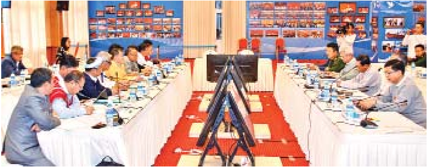
(၈)ကြိမ်မြောက် တစ်နိုင်ငံလုံးပစ်ခတ်တိုက်ခိုက်မှုရပ်စဲရေးသဘောတူစာချုပ် အကောင်အထည်ဖော်ရေး ညှိနှိုင်းအစည်းအဝေး (JICM) သဘောတူဆုံးဖြတ်ချက်များ အကောင်အထည်ဖော်ရေးဆိုင်ရာ ညှိနှိုင်းအစည်းအဝေး ကျင်းပစဉ်။

တစ်ဖက်နှင့်တစ်ဖက် အတိုးအလျှော့ဖြင့် ဆောင်ရွက်ဆက်လက်၍လည်း JICM ၏ နောက်ဆက်တွဲ အကောင်အထည်ဖော် ဆွေးနွေးညှိနှိုင်းရမည့်ကိစ္စရပ်များကိုလည်း အတွင်းရေးမှူးအဖွဲ့များ၊ ညှိနှိုင်းဆွေးနွေးမှု အကောင်အထည်ဖော်ရေးအဖွဲ့များအနေဖြင့် တိုင်းရင်းသား ပြည်သူများအားလုံး လိုလားတောင့်တနေသည့် စစ်မှန်