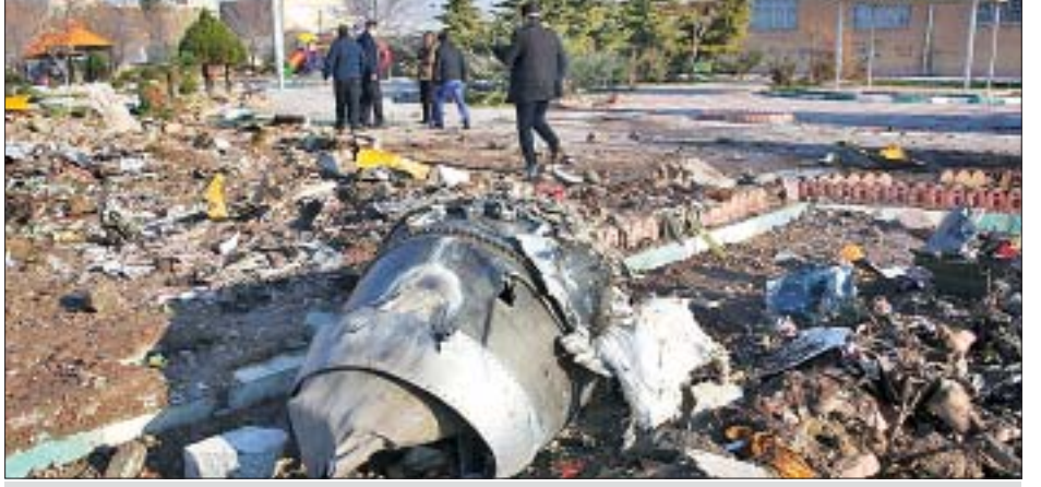
ယူကရိန်း ခရီးသည်တင်လေယာဉ်တစ်စင်း အီရန်နိုင်ငံ တီဟီရန်မြို့တော်ရှိ အိုင်မမ်ခိုမေန် အပြည်ပြည်ဆိုင်ရာ လေဆိပ်မှ ပျက်ကျပြီးနောက် ပျက်ကျစဉ်။

၎င်းက ပြောသည်။ ယနေ့နံနက်ပိုင်းတွင် လေဆိပ်မှပျံတက် သွားသည့် ယူကရိန်းအပြည်ပြည်ဆိုင်ရာလေကြောင်းလိုင်း မှ ဘိုးရင်း ၇၃၇-၈၀၀ လေယာဉ်မှာ ပျံတက်ပြီး ချက်ချင်း ဆိုသလို အချက်အလက်များပေးပို့မှု ရပ်တန့်သွားခဲ့ကြောင်း လေဆိပ်မှ လေကြောင်းခရီးစဉ် အချက်အလက်များက ပြသနေသည်။ မှတ်ချက်စကားပြောကြားရန် အဆိုပါ ယူကရိန်းလေကြောင်းလိုင်းသို့ ဆက်သွယ်ခဲ့သော်လည်း ပြန်လည်လက်ခံဖြေကြားခြင်းမရှိပေ။ ဘိုးရင်း ၇၃၇-၈၀၀ လေယာဉ်မှာ တာတို၊ တာလတ်လေကြောင်းခရီးစဉ်များ အတွက် အသုံးပြုသော အင်ဂျင်နစ်လုံးတပ် ဂျက်လေယာဉ် ဖြစ်သည်။ ကမ္ဘာတစ်ဝန်းရှိ လေကြောင်းလိုင်းများက ထောင်နှင့်ချီသော အဆိုပါလေယာဉ်များကို အသုံးပြုကြ သည်။ ၁၉၉၀ ပြည့်နှစ်များအတွင်း စတင်အသုံးပြုခဲ့သည့် ဘိုးရင်း ၇၃၇-၈၀၀ လေယာဉ်မှာ လူပေါင်းများစွာ သေဆုံးခဲ့ သည့် လေယာဉ်ပျက်ကျမှုနှစ်ကြိမ်ကြောင့် ၁၀ လန်းပါးကြာ အနားပေးခဲ့သည့် ဘိုးရင်း ၇၃၇ မတ်စ်လေယာဉ်ထက် ပို ၍သက်တမ်းကြာမြင့်နေပြီဖြစ်သည့် လေယာဉ်အမျိုးအစား တစ်မျိုးဖြစ်သည်။ ပြီးခဲ့သောနှစ်များအတွင်း လူအသေ အပျောက်များစွာရှိခဲ့သည့် လေယာဉ်ပျက်ကျမှုများတွင် မြောက်မြားလှစွာသော ဘိုးရင်း ၇၃၇-၈၀၀ လေယာဉ်များ ပါဝင်ခဲ့သည်။ ကိုးကား-ဆင်ဟွာ၊ အင်န်အိတ်ချီကေ ဘာသာပြန်-ကျော်ထိုက်စိုး