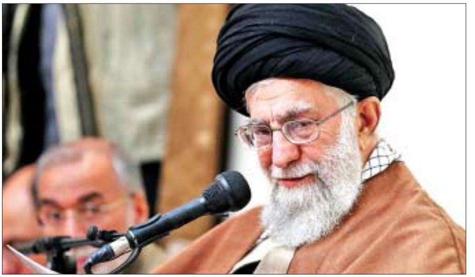
အီရန်ထိပ်တန်းခေါင်းဆောင် အယာတိုလာအာလီခါမေန်