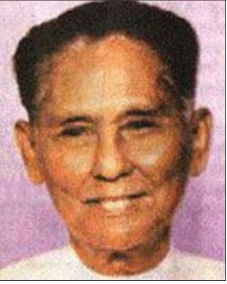
ဂန္ထဝင်မြန်မာ့ရုပ်ရှင်သုခမိန် အကယ်ဒမီများရှင် စာရေးဆရာ ဒါရိုက်တာကြီး (ဦး)သုခ

၁၉၄၆ ခုနှစ်မှ ၁၉၇၀ ပြည့်နှစ်အထိ ကာလမှာ မြန်မာ့ရုပ်ရှင်ရွှေရတုခေတ် ဖြစ်သည်။ ၁၉၄၂ ခုနှစ်မှ ၁၉၄၅ ခုနှစ် အတွင်းကာလမှာ ဒုတိယကမ္ဘာစစ်ကာလဖြစ်၍ မြန်မာ့ရုပ်ရှင်အနုပညာရှင်များအနေဖြင့် ရုပ်ရှင်ကား သစ်များ လုံးဝရိုက်ကူးထုတ်လုပ်နိုင်ခြင်း မရှိခဲ့ချေ။ ရုပ်ရှင်အနုပညာရှင်အချို့မှာ အလုပ်လက်မဲ့ဖြစ်သွားကြပြီး အချို့မှာ ပရိယေသနာဝမ်းစာအတွက် ကုန်သည်အလုပ်တွင် ဝင်ရောက်လုပ်ကိုင်ခဲ့ကြရသလို အချို့မှာ နယ်လှည့်ကာ ပြဇာတ်များက၍ အသက်မွေးဝမ်းကျောင်းမှ ပြုခဲ့ကြရသည်။