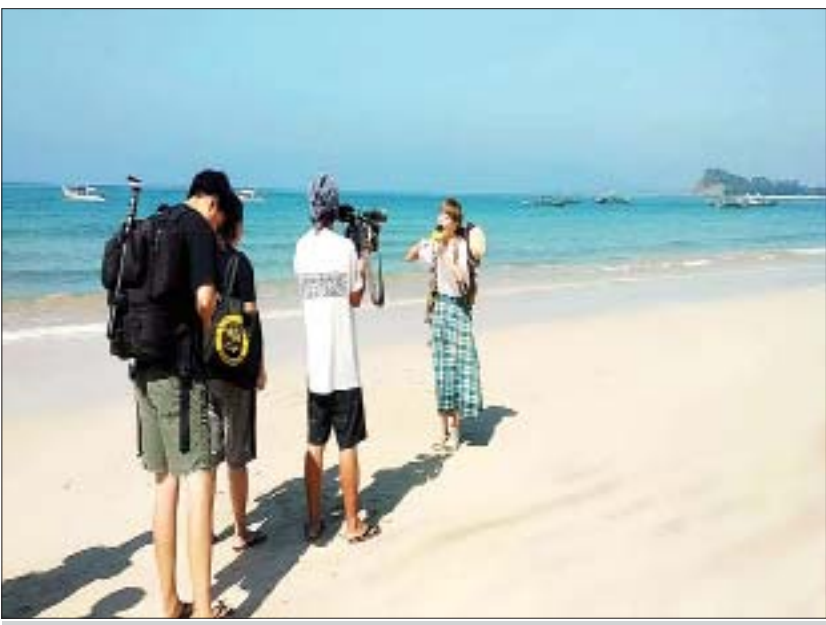
ငပလီကမ်းခြေတွင် မှတ်တမ်းတင်ရိုက်ကူးစဉ်။

ရန်ကုန် ဇန်နဝါရီ ၈ ဂျပန်နိုင်ငံ TBS ရုပ်သံရိုက်ကူးရေးအဖွဲ့သည် ယနေ့ တွင် ရခိုင်ပြည်နယ် သံတွဲခရိုင် ငပလီကမ်းခြေ၊ ပုလဲ ကျွန်းနှင့် သဲဖြူကျွန်းတို့တွင် မှတ်တမ်းရိုက်ကူးသည်။ အဆိုပါရိုက်ကူးရေးအဖွဲ့သည် ယမန်နေ့က ရန်ကုန်မြို့ရှိ ရွှေတိဂုံစေတီတော်နှင့် ၁၉ လမ်း အလယ်ရှိ စားသောက်ဆိုင်များတွင်လည်းကောင်း၊ ရခိုင်ပြည်နယ် သံတွဲခရိုင် ငပလီမြို့ရှိ Hilton Hotel၊ Sandoway Resort၊ Ngapali Paradise Hotel နှင့် Ocean Pearl Sea Food စားသောက်ဆိုင်တို့တွင် လည်းကောင်း မှတ်တမ်းရိုက်ကူးခဲ့ပြီး ဇန်နဝါရီ ၁၁ ရက်အထိ ငပလီကမ်းခြေတွင် ဆက်လက်ရိုက်ကူး မည် ဖြစ်ကြောင်း သိရသည်။ ထိုသို့ရိုက်ကူးထားရှိမှုများကို ဂျပန်နိုင်ငံနှင့် ကမ္ဘာတစ်ဝန်းရှိ ခရီးသွားဧည့်သည်များ ပိုမိုသိရှိပြီး မြန်မာနိုင်ငံသို့ ကမ္ဘာလှည့်ခရီးသည်များ လာရောက် လည်ပတ်နိုင်ရန်ရည်ရွယ်ချက်ဖြင့် ဂျပန်နိုင်ငံ TBS ရုပ်သံလိုင်း၏ "World Summers Resort" အစီအစဉ် တွင် ထုတ်လွှင့်ပြသမည်ဖြစ်ကြောင်း သိရသည်။ မျိုးဝင်းအောင်(FDC)