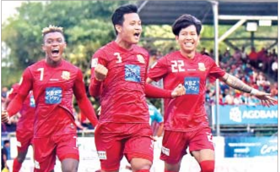
အဖွင့်ပွဲတွင် အဝေးကွင်းကစားရမည့် လက်ရှိချန်ပီယံ ရှမ်းယူနိုက်တက်အသင်း။

ရန်ကုန် ဇန်နဝါရီ ၈ မြန်မာနေရှင်နယ်လိဂ်ကော်မတီက ကြီးမှူးကျင်းပမည့် ၂၀၂၀ ရာသီ MNL အမှတ်ပေးပြိုင်ပွဲကို ဇန်နဝါရီ ၁၀ ရက်တွင် စတင်ကျင်းပမည် ဖြစ်ပြီး အဖွင့်ပွဲအဖြစ် လက်ရှိ ချန်ပီယံ ရှမ်းယူနိုက်တက်အသင်းနှင့် တန်းတက်အား/ကာသိပွဲအသင်းတို့ ၏ အားပြိုင်မှုကို တွေ့မြင်ရမည်ဖြစ် သည်။ MNL အမှတ်ပေးပြိုင်ပွဲကို ၂၀၀၉ ခုနှစ်တွင် စတင်ကျင်းပခဲ့ပြီး ယခုနှစ် တွင် ၁၂ ရာသီမြောက် ကျင်းပခြင်း ဖြစ်သည်။ ပြီးခဲ့သည့် ရာသီတွင် နယ်ပရိသတ်အားပေးမှု မြှင့်တက် လာသည့် MNL အမှတ်ပေးပြိုင်ပွဲ ကို ယခုနှစ်တွင်လည်း ပရိသတ် အားပေးမှု စိတ်ဝင်စားမှုဆက်ရှိ မရှိ စာမျက်နှာ ၁၂ ကော်လံ ၁ သို့ ၀