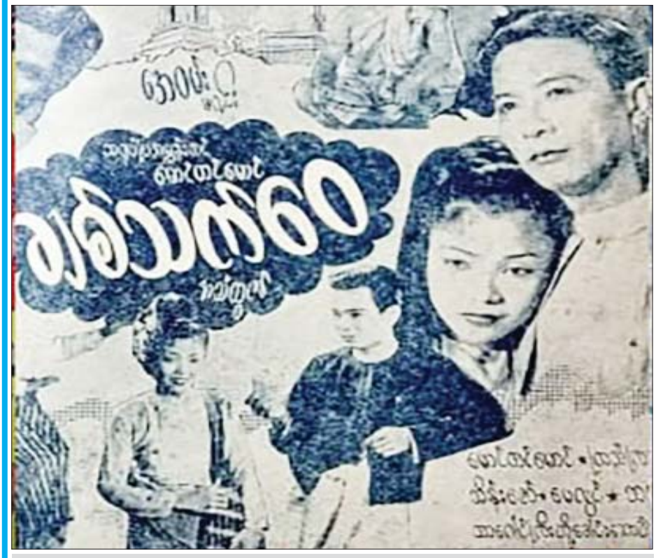
သရုပ်ဆောင် ဒါရိုက်တာ အဝမ်းဦးတင်မောင်၏ ချစ်သက်ဝေ ရုပ်ရှင်ဇာတ်ကားကြော်ငြာ(၁၉၅၂)။

ထိုဆောင်ရွက်ချက်များကို ကြည့်ခြင်းအားဖြင့် မြန်မာ့ရုပ်ရှင် အနုပညာရှင်များသည် အမျိုးသားရေးနှင့်ယှဉ်လာလျှင် မျိုးချစ်စိတ်ဓာတ်အရင်းခံဖြင့် ရုပ်ရှင်ဇာတ်ကားများကို ရိုက်ကူးထုတ်လုပ်ရုံသာမက အမျိုးသားရေးလိုအပ်ချက်အရ လိုအပ်လာလျှင် တိုင်းပြည်ကာကွယ်ရေးများကိုပါ ပါဝင်ခဲ့ကြသည်ကို ဂုဏ်ယူအားရဖွယ် လေ့လာတွေ့ရှိရ