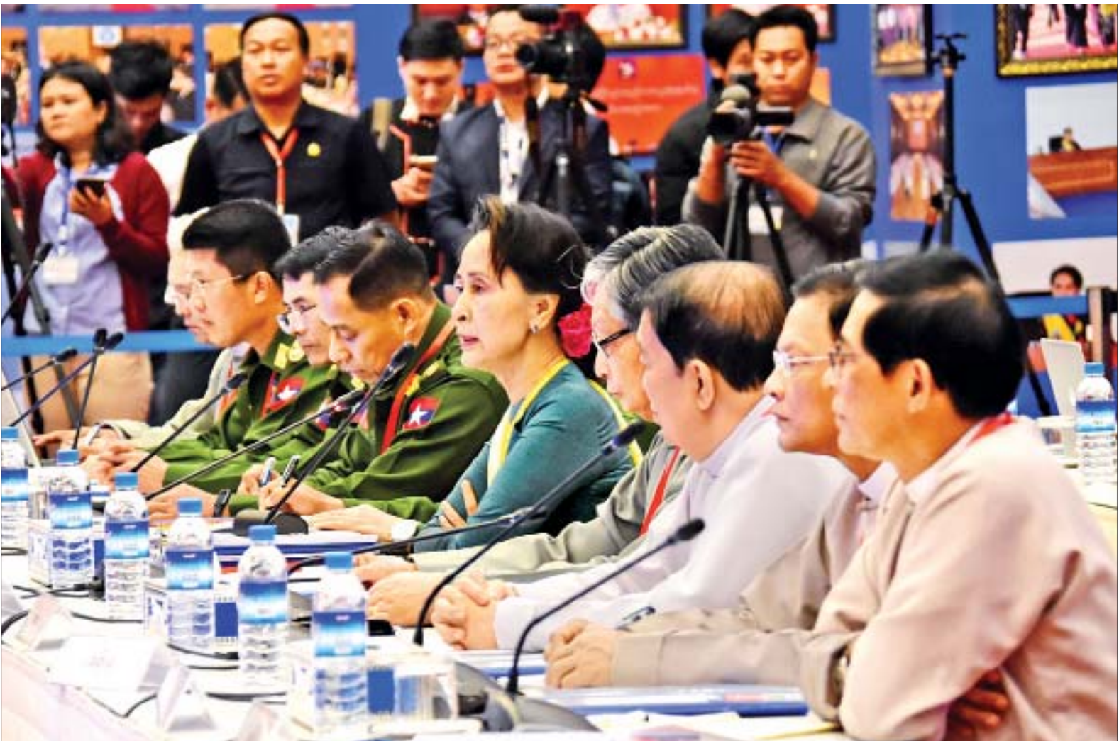
နိုင်ငံတော်၏အတိုင်ပင်ခံပုဂ္ဂိုလ် ဒေါ်အောင်ဆန်းစုကြည် (၈) ကြိမ်မြောက် တစ်နိုင်ငံလုံးပစ်ခတ်တိုက်ခိုက်မှု ရပ်စဲရေးသဘောတူစာချုပ် အကောင်အထည်ဖော်မှုဆိုင်ရာ ညှိနှိုင်းအစည်းအဝေး (JICM) တွင် မိန့်ခွန်းပြောကြားစဉ်။

နေပြည်တော် ဇန်နဝါရီ ၈ (၈)ကြိမ်မြောက် တစ်နိုင်ငံလုံးပစ်ခတ်တိုက်ခိုက်မှုရပ်စဲရေး သဘောတူစာချုပ် အကောင်အထည်ဖော်မှုဆိုင်ရာ ညှိနှိုင်းအစည်းအဝေး (JICM) ကို ယနေ့ နံနက် ၁၀ နာရီတွင် နေပြည်တော်ရှိ အမျိုးသားပြန်လည်သင့်မြတ်ရေးနှင့် ငြိမ်းချမ်းရေးဗဟိုဌာန (NRPC) ၌ ကျင်းပရာ အမျိုးသားပြန်လည်သင့်မြတ်ရေးနှင့် ငြိမ်းချမ်းရေးဗဟိုဌာန ဥက္ကဋ္ဌ နိုင်ငံတော်၏အတိုင်ပင်ခံပုဂ္ဂိုလ် ဒေါ်အောင်ဆန်းစုကြည် တက်ရောက် မိန့်ခွန်းပြောကြားသည်။