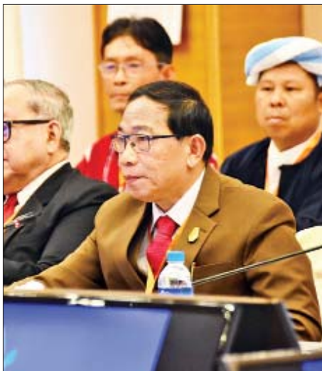
သျှမ်းပြည် ပြန်လည်ထူထောင်ရေးကောင်စီ (RCSS) ဥက္ကဋ္ဌ စဝ်ယွက်စစ် အမှာစကားပြောကြားစဉ်။