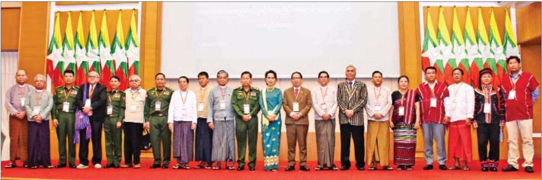
နိုင်ငံတော်၏အတိုင်ပင်ခံပုဂ္ဂိုလ် ဒေါ်အောင်ဆန်းစုကြည်၊ ဒုတိယတပ်မတော်ကာကွယ်ရေးဦးစီးချုပ် ကာကွယ်ရေးဦးစီးချုပ်(ကြည်း) ဒုတိယဗိုလ်ချုပ်မှူးကြီး စိုးဝင်းနှင့် အဖွဲ့ဝင်များ၊ တိုင်းရင်းသားလက်နက်ကိုင်အဖွဲ့အစည်းများမှ ခေါင်းဆောင်များနှင့် ကိုယ်စားလှယ်များ စုပေါင်းမှတ်တမ်းတင်ဓာတ်ပုံရိုက်ကြစဉ်။

★ စာမျက်နှာ ၃ မှ “လုပ်ငန်းစဉ်တစ်ခု၊ တည်ဆောက်မှုတစ်ခုကို လုပ်ဆောင်ရာမှာ အခြေခံအုတ်မြစ် foundation ဆိုတာ မရှိမဖြစ်လိုအပ်ရာ ကျွန်တော်တို့ရဲ့ JICM ဟာ မြန်မာနိုင်ငံသူ နိုင်ငံသားအားလုံး ပြင်းပြတဲ့စိတ်ဆန္ဒအရ လိုလားတောင့်တ နေတဲ့ ဒီမိုကရေစီနှင့် ဖက်ဒရယ်စနစ်ကို အခြေခံသော ပြည်ထောင်စုကို နိုင်ငံရေးဆွေးနွေးပွဲ ရလဒ်များနှင့်အညီ တည်ဆောက်နိုင်ရေးနှင့် စစ်မှန်တဲ့ထာဝရငြိမ်းချမ်းရေး အတွက် အချိန်ကာလယန္တရား လျှော့ချမှုအတွင်း ညှိနှိုင်း ဆွေးနွေးကြပြီးနောက် ကောင်းမွန်တဲ့ရလဒ် အဖြေများ ရယူရာမှာ အဓိက Foundation တစ်ခုဖြစ်ပြီး ကျွန်တော်တို့ ကလည်း Founder ဖြစ်တယ်လို့ ခံယူလျက် စိတ်ဆန္ဒ ပြင်းပြစွာနဲ့ အောင်မြင်မှုအသီးအပွင့်ကို ခံစားလိုကြတဲ့ ပြည်ထောင်စုဖွဲ့တိုင်းရင်းသားပြည်သူများ အားလုံးအတွက် စစ်မှန်တဲ့ ထာဝရငြိမ်းချမ်းရေး၊ တည်ငြိမ်ရေးနှင့် ဖွံ့ဖြိုး တိုးတက်ရေး အမြန်ဆုံးရရှိအောင် ယနေ့မှစ၍ အားသွန် ခွန်စိုက် ရိုးသားမှု အမှန်တကယ် ငြိမ်းချမ်းရေးရယူလိုမှု၊ အပြန်အလှန်ယုံကြည်မှု၊ လေးစားမှုအပေါ် အခြေခံလျက်