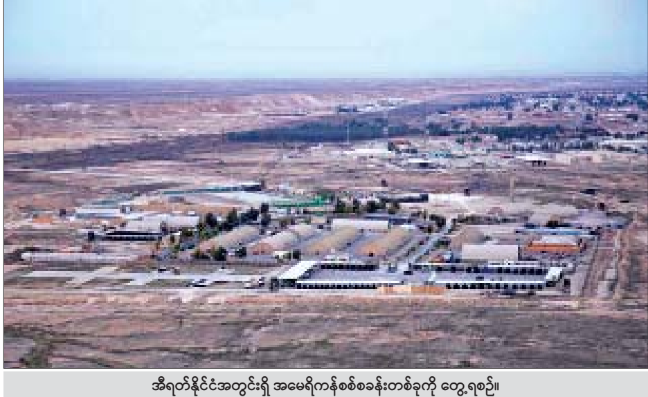
အီရတ်နိုင်ငံအတွင်းရှိ အမေရိကန်စစ်စခန်းတစ်ခုကို တွေ့ရစဉ်။