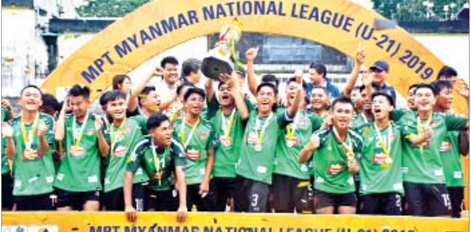
၂၀၁၉ရာသီ MNL ယူ-၂၁ပြိုင်ပွဲတွင် ဗိုလ်စွဲခဲ့သည့် MFF Youth အသင်း

ရန်ကုန် ဇန်နဝါရီ ၇ - မြန်မာနေရှင်နယ်လိဂ်ကော်မတီက ကြီးမှူးကျင်းပမည့် ၂၀၂၀ ရာသီ MNL ယူ-၁၉ နှင့် ယူ-၂၁ လူငယ်လိင်ပြိုင်ပွဲကို ယခုလအတွင်း စတင်ကျင်းပမည် ဖြစ်သည်။ ပြိုင်ပွဲနှစ်ခုသာ ကျင်းပမည် မြန်မာနေရှင်နယ်လိဂ် ကော်မတီသည် ယခုရာသီတွင် လူငယ်လိင်ပြိုင်ပွဲ ကျင်းပသည့်ပုံစံကို ပြောင်းလဲခဲ့ပြီး ပြိုင်ပွဲလေးခု ကျင်းပမည့်အစား ယူ-၂၁ နှင့် ယူ-၁၉ လိင်ပြိုင်ပွဲနှစ်ခုသာ ကျင်းပမည်ဖြစ်ကာ ကစားသမားများ ပွဲကစားခွင့်ပိုမိုရရှိစေရန် ဆောင်ရွက်ခဲ့သည်။ စာမျက်နှာ ၁၁ ကော်လံ ၃ □