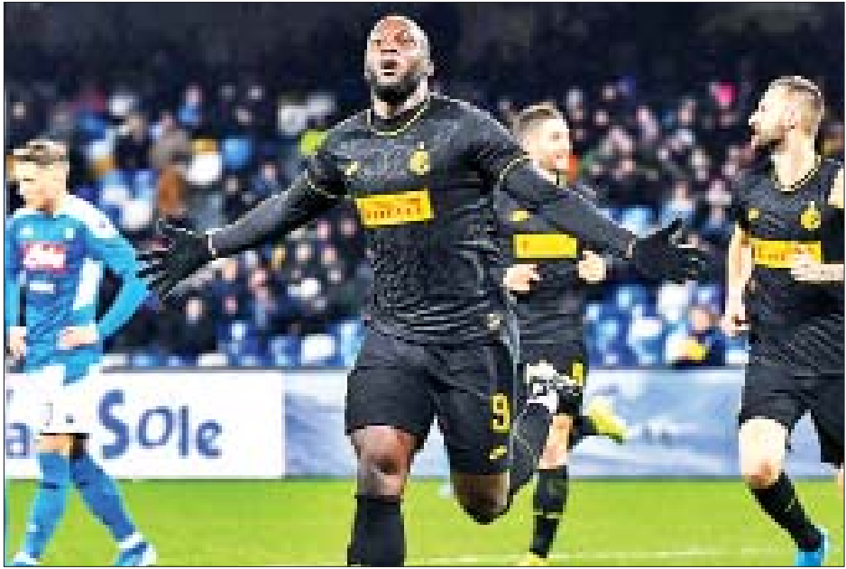
အင်တာမီလန်အသင်းနဲ့အတူ အီတလီစီးရီးအေသွင်းဂိုး ၁၄ ဂိုးအထိ ရှိသွားပြီလည်း ဖြစ်ပါတယ်။ လက်ရှိ အီတလီစီးရီးအေ ဂိုးသွင်းအများဆုံး ကစားသမားတွေထဲမှာ လူကာကူက သွင်းဂိုး ၁၄ ဂိုးနဲ့ ဒုတိယဂိုးသွင်းအများဆုံးကစားသမားအဖြစ် ရပ်တည်နေပြီး လာဇီယိုတိုက်စစ်မှူး အင်မိုဘိုင်းက သွင်းဂိုး ၁၉ ဂိုးနဲ့ ဂိုးသွင်းအများဆုံး ကစားသမားအဖြစ် ရပ်တည်နေပါတယ်။ ဂျူဗင်တပ်တိုက်စစ်မှူး စီရိုနယ်လီဒိုကတော့ သွင်းဂိုး ၁၃ ဂိုးနဲ့ တတိယဂိုးသွင်းအများဆုံးကစားသမားအဖြစ် ရပ်တည်နေတာ ဖြစ်ပါတယ်။

နာပိုလီအသင်းနဲ့ အင်တာမီလန်အသင်းတို့ဟာ အီတလီ စီးရီးအေပွဲစဉ် ၁၈ အဖြစ် ယှဉ်ပြိုင်ကစားခဲ့ရာ တိုက်စစ်မှူး လူကာကူရဲ့သွင်းဂိုးနှစ်ဂိုးအပါအဝင် အင်တာမီလန်အသင်းက နာပိုလီအသင်းကို သုံးဂိုး-တစ်ဂိုးနဲ့ အနိုင်ရရှိခဲ့ပါတယ်။ အဲဒီပွဲစဉ်မှာ အင်တာမီလန်အသင်းအတွက် သွင်းဂိုး တွေကို တိုက်စစ်မှူး လူကာကူက ပွဲကစားချိန် ၁၄ မိနစ်နဲ့ ၃၃ မိနစ်မှာ နှစ်ဂိုးနဲ့ မာတီနက်ဇ်က ၆၂ မိနစ်မှာ တစ်ဂိုး အသီးသီးသွင်းယူပေးခဲ့ကြပြီး နာပိုလီအသင်းအတွက် ချေပဂိုးတစ်ဂိုးကိုတော့ ၃၉ မိနစ်မှာ မီလစ်က သွင်းယူပေး ခဲ့တာ ဖြစ်ပါတယ်။ ဂျူဗင်တပ်အသင်းဟာ ပွဲစဉ် ၁၈ ကို အင်တာမီလန် အသင်းထက် စောပြီးကစားခဲ့ရကာ ကာဂလီယာယီ အသင်းကို တိုက်စစ်မှူး စီရိုနယ်လီဒိုရဲ့ ဟက်ထရစ်သွင်းဂိုး အပါအဝင် လေးဂိုးပြတ်နဲ့ အနိုင်ရရှိခဲ့တာကြောင့် အမှတ်ပေး ဇယားကို ယာယီဦးဆောင်ခွင့်ရရှိခဲ့ပေမယ့် အင်တာမီလန် အသင်းက နာပိုလီအသင်းကို အနိုင်ရရှိလိုက်တာကြောင့် အင်တာမီလန်အသင်းက အမှတ်ပေးဇယားထိပ်မှာ ဂျူဗင် တပ်အသင်းနဲ့ ရမှတ်တူဂိုးကွာခြားချက်နဲ့ ထိပ်ဆုံးက ဦးဆောင်နိုင်ခဲ့တာ ဖြစ်ပါတယ်။ လက်ရှိ အီတလီစီးရီးအေမှာ အင်တာမီလန်အသင်းနဲ့ ဂျူဗင်တပ်အသင်းကသာ ထိပ်ဆုံးက ဦးဆောင်နေပြီး တတိယနေရာက လာဇီယိုအသင်းကို ခြောက်မှတ်အထိ ဖြတ်ထားနိုင်ခဲ့တာ ဖြစ်ပါတယ်။ အင်တာမီလန်အသင်းက အခုပွဲစဉ်မှာ နှစ်ဂိုးသွင်းယူ ပေးနိုင်ခဲ့တဲ့ တိုက်စစ်မှူး လူကာကူဟာ မန်ယူအသင်းမှ ပြောင်းရွှေ့ကြေး ပေါင် ၇၄ သန်းနဲ့ ရောက်ရှိလာခဲ့ပြီးနောက်