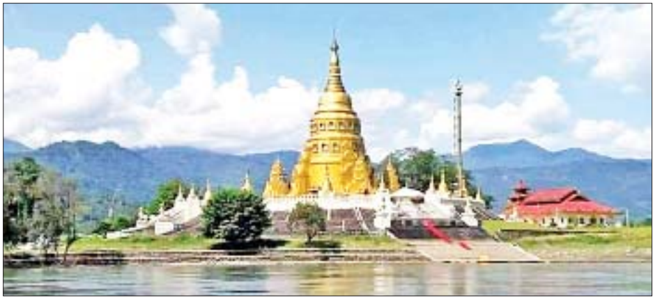
မြေပိုင်းပြဇာတ်များ ကပြခြင်း၊ လှေဖောင်ဖြင့်ပဒေသာပင် ဆောင်များကိုလည်း ကြိုတင်ပြင်ဆင်ဆောင်ရွက်လျက်ရှိ လှည့်ခြင်းများ၊ နိဗ္ဗာန်ဈေးပွဲတော်နှင့် ဧည့်သည်နားနေ ကြောင်း သိရှိရသည်။