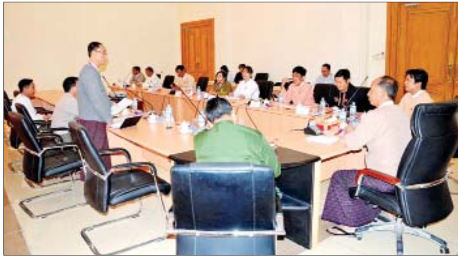
အမျိုးသားလွှတ်တော် အစိုးရမဟုတ်သော ပြည်တွင်း ပြည်ပ အဖွဲ့အစည်းများဆိုင်ရာကော်မတီ ဟိုတယ်နှင့် ခရီးသွားလာရေးဝန်ကြီးဌာနမှ တာဝန်ရှိသူများနှင့် လုပ်ငန်းညှိနှိုင်းအစည်းအဝေးပြုလုပ်စဉ်။

ဖြေ။ ။ အရပ်ဘက်လူမှုအဖွဲ့အစည်းတွေက ကျန်းမာရေး စောင့်ရှောက်မှုတွေပုံစံဖြစ်ပုံစံ၊ ပညာရေးဝန်ဆောင်မှု၊ သဘာဝပတ်ဝန်းကျင်စီမံကိန်းစီမံခန့်ခွဲရေး စသည့်အားဖြင့် ဒေသဖွံ့ဖြိုးရေးလုပ်ငန်းတွေကို ဆောင်ရွက်တဲ့အခါ ပြည်သူလူထုထံ တကယ်ရောက်ပြီး ထိရောက်အကျိုးရှိစေချင်တယ်။ ကျွန်တော်တို့က သူတို့ကို ပွင့်ပွင့်လင်းလင်း ဝေဖန်ပါတယ်။ အရပ်ဘက်လူမှုအဖွဲ့အစည်းထဲမှာပါတဲ့ ဒေသခံသော်လည်းကောင်း ဆွေမျိုးသော်လည်းကောင်း အဲဒီလိုလူတွေပြောတဲ့