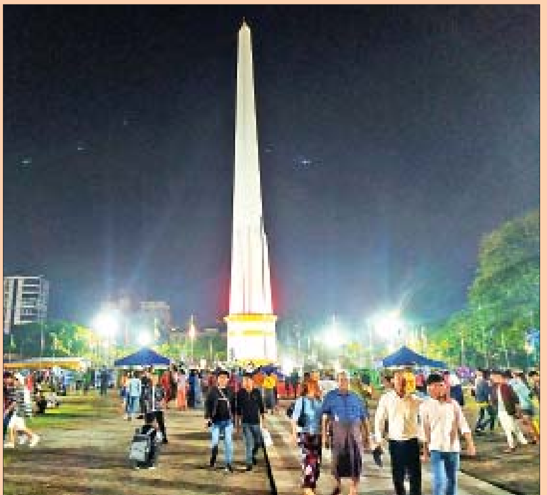
ရန်ကုန်မြို့၊ မဟာဗန္ဓုလပန်းခြံတွင် အပန်းဖြေအနားယူကြသူများဖြင့် စည်ကားလျက်ရှိသည်ကို တွေ့ရစဉ်။