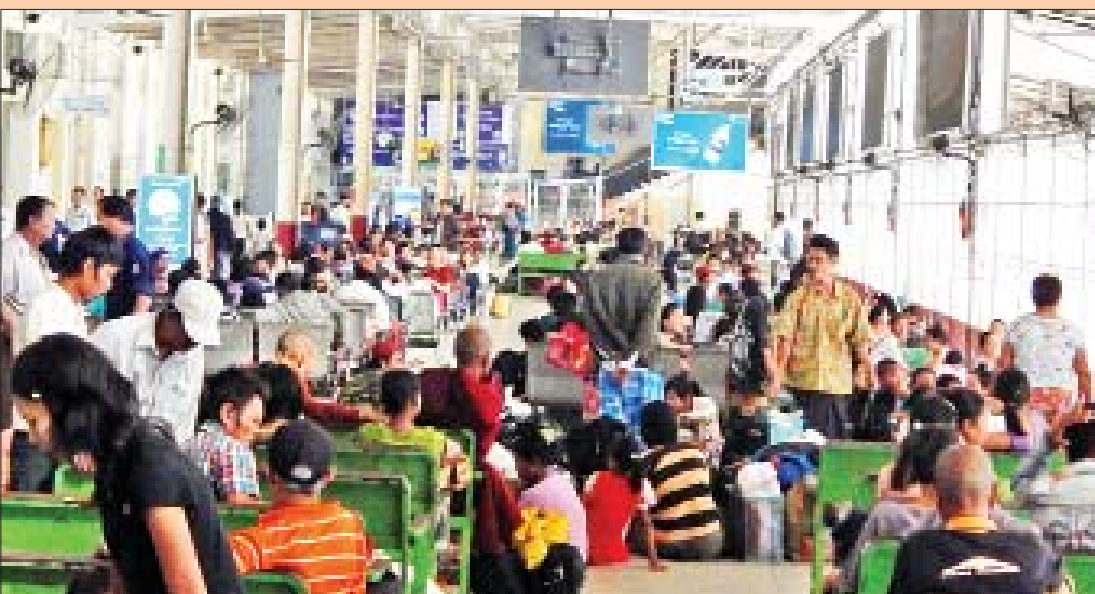
ရထားစီးခရီးသည်များ များပြားစည်ကားနေသည်ကို ယနေ့ညနေပိုင်းက ရန်ကုန်ဘူတာကြီး၌ တွေ့ရစဉ်။