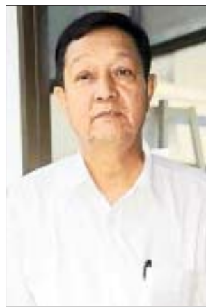
ညီညီထွန်းလွင်