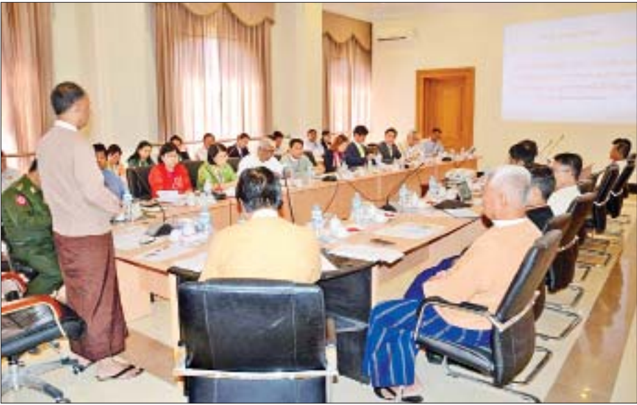
အမျိုးသားလွှတ်တော် အစိုးရမဟုတ်သော ပြည်တွင်း ပြည်ပ အဖွဲ့အစည်းများဆိုင်ရာကော်မတီ ဟိုတယ်နှင့် ခရီးသွားလာရေးဝန်ကြီးဌာနနှင့် INGOs အဖွဲ့အစည်းများမှ တာဝန်ရှိသူများနှင့် လုပ်ငန်းညှိနှိုင်းအစည်းအဝေး ပြုလုပ်စဉ်။

ပြည်တွင်း ပြည်ပ အရပ်ဘက်လူမှုအဖွဲ့အစည်းတွေရဲ့ အခန်းကဏ္ဍကလည်း ဒီအချိန်မှာ အရေးပါပါတယ်။ အထူးသဖြင့် အသွင်ကူးပြောင်းရေးကာလမှာ ဘတ်ဂျက်အနေအထားအရသော်လည်းကောင်း၊ နယ်ပယ်အစုံကနေ ဖွံ့ဖြိုးရေးကိစ္စတွေကို တစ်ပြိုင်နက်တည်း ပြုပြင်ပြောင်းလဲရေးလုပ်နေရတဲ့ အခါမျိုးမှာသော်လည်းကောင်း၊ အစိုးရက အပြည့်အဝမလုပ်ပေးနိုင်တာတွေ၊ လိုအပ်ချက်ကို အပြည့်အဝဖြည့်ဆည်းမပေးနိုင်တဲ့ နေရာဒေသတွေရှိပါတယ်။ အဲဒီလိုအခါမျိုးတွေမှာ အစိုးရက ပြီးမြောက်အောင်မြင်အောင် ဆောင်ရွက်နေတဲ့အပိုင်းတွေမှာ ပိုမိုပိုပြင်အောင်၊ အကောင်အထည်ပေါ်သွားအောင် လိုက်ပါဆောင်ရွက်ပေးနိုင်မယ်ဆိုရင် အရပ်ဘက်လူမှုအဖွဲ့အစည်း တွေရဲ့အခန်းကဏ္ဍ ပိုမိုအရေးပါလာပြီး ပြည်သူလူထုရဲ့ ယုံကြည်အားကိုးမှုလည်း ပိုရလာမှာဖြစ်