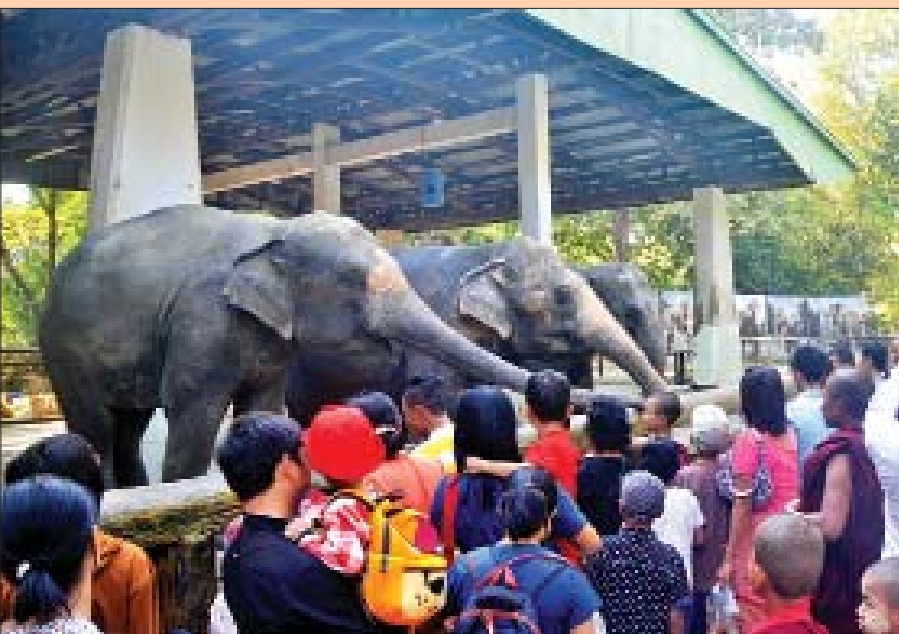
တိရစ္ဆာန်ဥယျာဉ်(ရန်ကုန်)၌ လာရောက်လည်ပတ် အပန်းဖြေသူများဖြင့် စည်ကားလျက်ရှိသည်ကို တွေ့ရစဉ်။