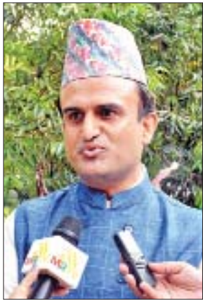
ဦးလျှင်မန်း