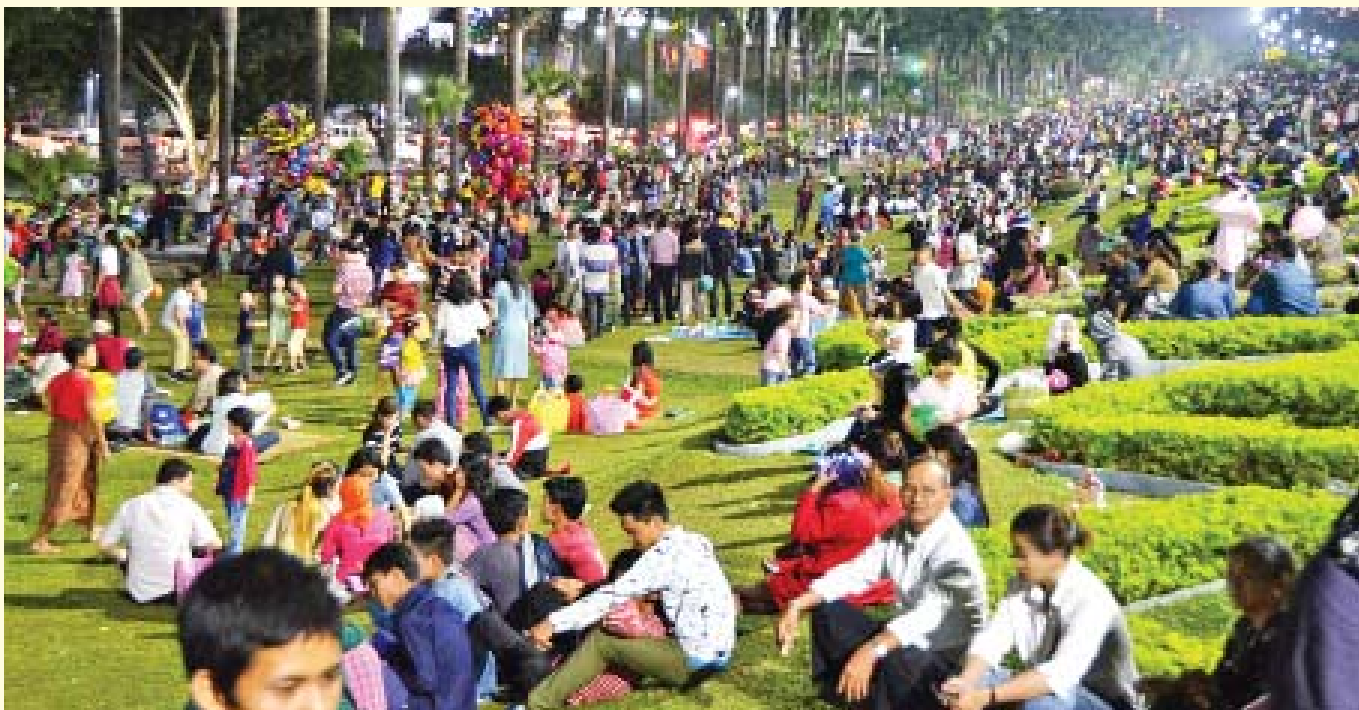
ဒီဇင်ဘာ ၃၁ ရက်က ရန်ကုန်မြို့ အင်းလျားကန်ပေါင်တွင် နှစ်သစ်ကို ကြိုဆိုကြသူများဖြင့် စည်ကားလျက်ရှိသည်ကို တွေ့ရစဉ်။