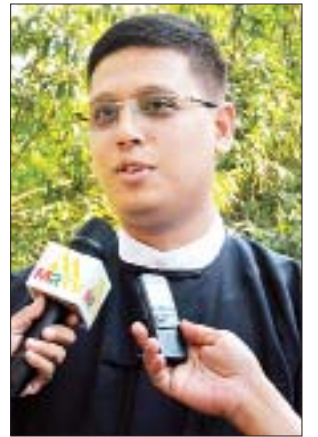
ဦးတင်ဇော်မင်း

မြန်မာနိုင်ငံ ဘာသာပေါင်းစုံ ချစ်ကြည်ညိုသောရေးအဖွဲ့ (ဗဟို) ဥက္ကဋ္ဌ ဦးသောင်းထိုက်