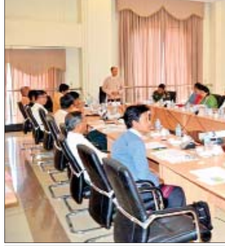
အမျိုးသားလွှတ်တော် အစိုးရမဟုတ်သော ပြည်တွင်း ပြည်ပ အဖွဲ့အစည်းများဆိုင်ရာကော်မတီ ဆောက်လုပ်ရေး ဝန်ကြီးဌာနနှင့် INGO အဖွဲ့အစည်းများမှ တာဝန်ရှိသူများနှင့် လုပ်ငန်းညှိနှိုင်းအစည်းအဝေးပြုလုပ်စဉ်။

ထို့အပြင် သဘာဝဘေးဒဏ်ကြောင့် ပျက်စီးယိုယွင်း ခဲ့သော စာသင်ကျောင်းများကို အသစ်ဆောက်လုပ်ခြင်း၊ ပြုပြင်ခြင်းနှင့် ပြန်လည်ထူထောင်ရေးလုပ်ငန်းများကို ဆောင်ရွက်ခြင်း၊ မသန်စွမ်းသည့် ကလေးသူငယ်များ ပညာသင်ယူမှုနှင့်အခြားခြင်းမရှိစေရန် ကျွမ်းကျင်ပညာရှင်