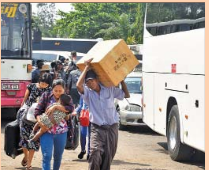
ရန်ကုန်မြို့၊ အောင်မင်္ဂလာကားကွင်း၌ အနယ်နယ်အရပ်ရပ်မှ ခရီးသွားလာသူများကို တွေ့ရစဉ်။