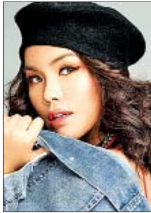
နီနီခင်ဇော်