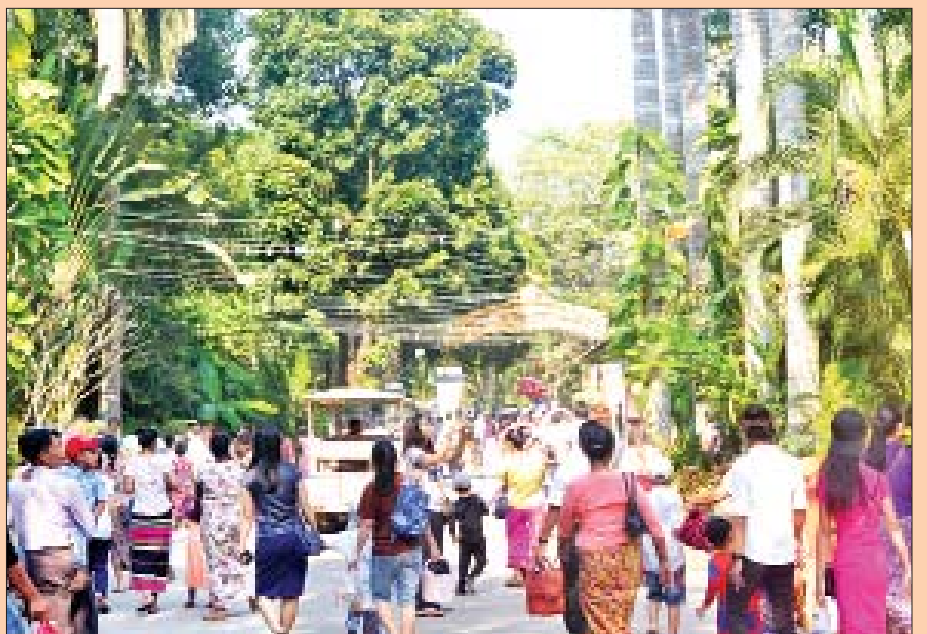
တိရစ္ဆာန်ဥယျာဉ်(ရန်ကုန်)၌ လာရောက်လည်ပတ် အပန်းဖြေသူများဖြင့် စည်ကားလျက်ရှိသည်ကို တွေ့ရစဉ်။