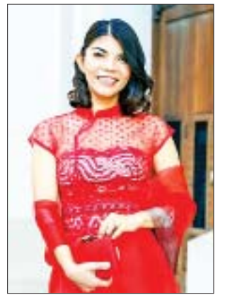
ခရစ်စတီးနားခီ