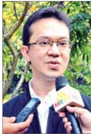
ဦးဆယ်စိဆယ်မူအယ်