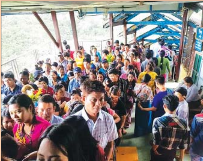
ပုပ္ပားတောင်ကလပ်တွင် ခရီးသွားဧည့်သည်များဖြင့် စည်ကားလျက်ရှိသည်ကို တွေ့ရစဉ်။