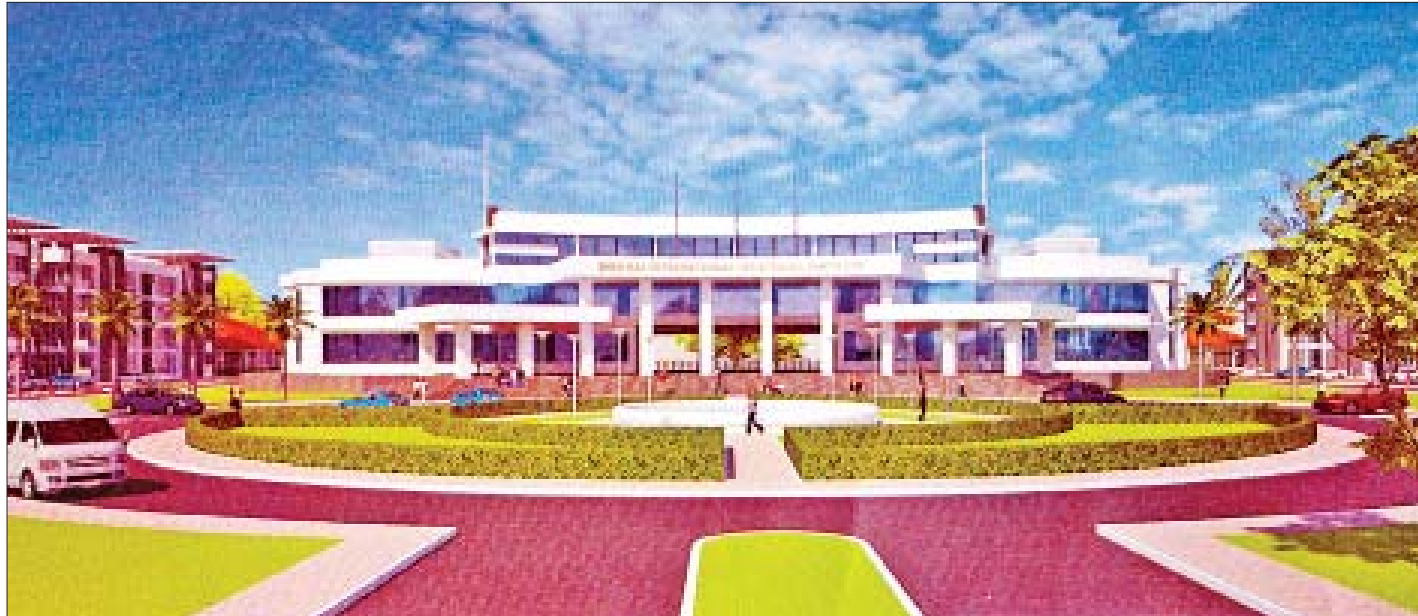
SHIN RAI INTERNATIONAL VOCATIONAL INSTITUTE ပုံစံငယ်ကို တွေ့ရစဉ်။