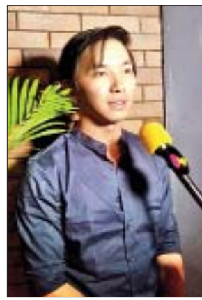
သရုပ်ဆောင် စိုင်းစည်တွမ်ခမ်း