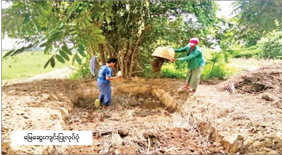
မြေဆွေးကျင်းပြုလုပ်ပုံ

လူသားများ ကျန်းမာစွာ အသက်ရှင်ရန်အတွက် အစားအစာအာဟာရသည် အရေးကြီးသောလိုအပ်ချက်တစ်ရပ်ဖြစ်သည်။ ထို့အတူ သီးနှံပင်များ ကြီးထွားဖွံ့ဖြိုးမှုအတွက်လည်း အစားအစာအာဟာရနှင့် ရေကို လိုအပ်ပေသည်။ လူသားများအတွက် အစားအစာအာဟာရအပေါ် မှီခိုရသကဲ့သို့ သီးနှံပင်များအတွက်လည်း အာဟာရဓာတ်စုံလင်စွာ လိုအပ်ပါသည်။ အပင်များအတွက် လိုအပ်သော အာဟာရဓာတ်များမှာ အများလို အာဟာရဓာတ် (macronutrient) နှင့် အနည်းလိုအာဟာရဓာတ် (micronutrient) ဟူ၍ ရှိပေသည်။ အများလိုအာဟာရဓာတ် ကိုးမျိုးအနက် ကာဗွန်(C)၊ အောက်ဆီဂျင်(O)၊ ဟိုက်ဒရိုဂျင်(H) သည် လေထုထဲရှိ ကာဗွန်ဒိုင်အောက်ဆိုက်(CO 2 )နှင့် ရေ (H 2 O) တို့မှရရှိပြီး နိုက်ထရိုဂျင်(N)၊ ဖော့စဖရပ်(P)၊ ပိုတက်စီယမ်(K)၊ ကယ်လီစီယမ်(Ca)၊ မဂ္ဂနီစီယမ်(Mg)၊ ဆာလဖာ (S) တို့ကို မြေကြီးမှ ရရှိသည်။ အပင်များကြီးထွားရန် အနည်းလိုအာဟာရဓာတ် ရှစ်မျိုးမှာ သံဓာတ်(Fe)၊ မဂ္ဂနီစီယမ်(Mn)၊ ကော့ပီး(Cu)၊ ဇင့်(Zn)၊ ဗိုလစ်ဘီယမ်(Mo)၊ ဘိုရန်(လက်ချား)(Bo)၊ ကလိုရင်း(Cl)၊ နီကယ်(Ni) တို့ဖြစ်ကြသည်။ ဆီလီကော(Si)နှင့် ဆီလီနီယမ်(Se) နှစ်မျိုးတို့လည်း အနည်းလိုအာဟာရဓာတ်များတွင် ပါဝင်လာပေသည်။