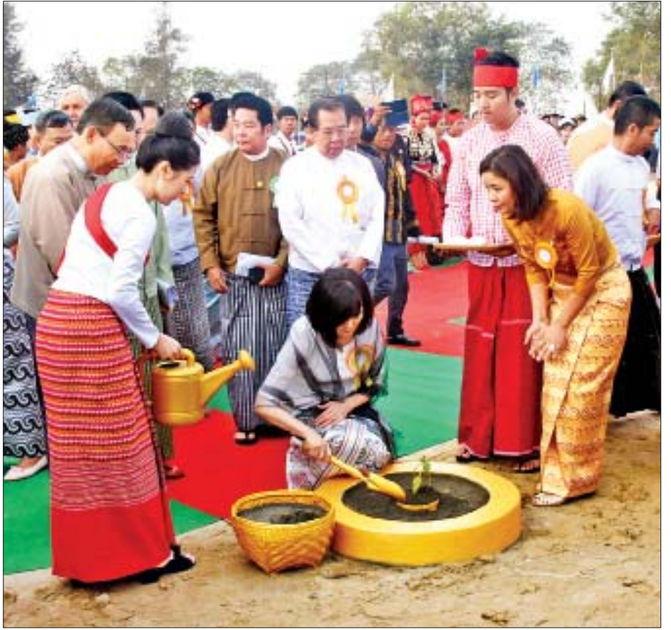
ဂျပန်နိုင်ငံဝန်ကြီးချုပ် မစ္စတာ ရှင်ဇီအာဘေး၏ ဇနီး မစ္စမိ အိအိအာဘေး SHIN RAI INTERNATIONAL VOCATIONAL INSTITUTE ပန္နက်တင်ပွဲအခမ်းအနားတွင် အမှတ်တရ ချယ်ရီပင်ကို စိုက်ပျိုးပေးစဉ်။