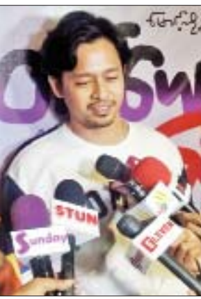
သရုပ်ဆောင် ဒေါင်း

“ဒီကားမှာပါသမျှအဖွဲ့ဝင်တိုင်းက ကျရာတာဝန်ကို ကိုယ်စွမ်းညစ်စွမ်းရှိသမျှ အစွမ်းကုန်ကြိုးစားထားပါတယ်။ ရုံတင်တဲ့အခါ ပရိသတ်ကြီးလာကြည့်ပေးပါ။ ကြိုးစားထား