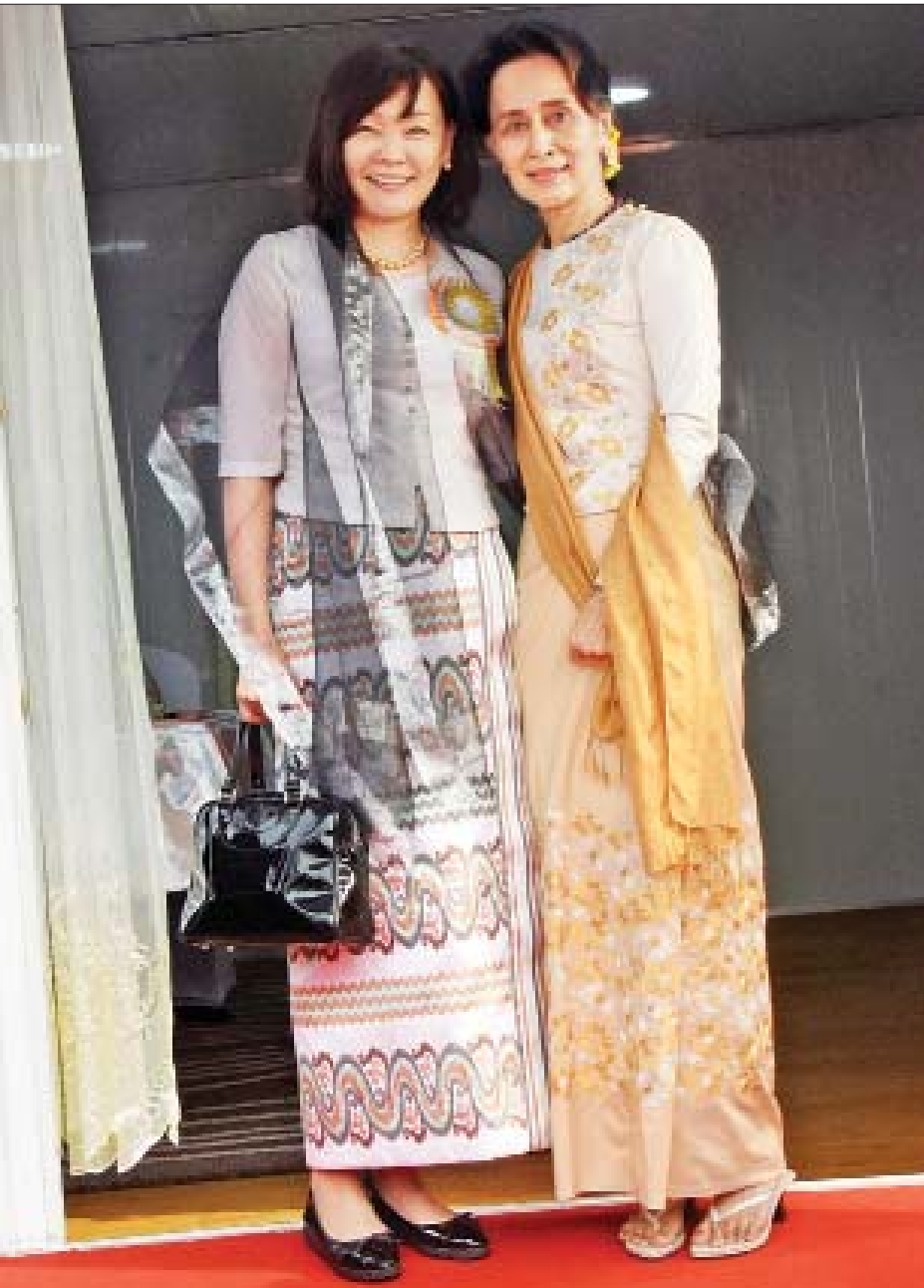
နိုင်ငံတော်၏အတိုင်ပင်ခံပုဂ္ဂိုလ် ဒေါ်အောင်ဆန်းစုကြည်နှင့် ဂျပန်နိုင်ငံဝန်ကြီးချုပ် မစ္စတာ ရှင်ဇီအာဘေး၏ ဇနီး မစ္စမိ အိအိအာဘေးတို့ မှတ်တမ်းတင်ဓာတ်ပုံရိုက်စဉ်။

ကျွန်မစောစောကပြောသလို ကျွန်မတို့က ဖွံ့ဖြိုးမှု နောက်ကျတဲ့ နိုင်ငံတစ်နိုင်ငံရဲ့ အကျိုးတွေလည်းခံစားရ တယ်။ ဆိုးကျိုးလည်းရှိတာပဲ။ ကျွန်မတို့က ဘာကိုဆောင်ရွက် မယ်။ ဘာကိုရှောင်ရွယ်ဆိုတာ ပိုပြီးတော့သိနိုင်ပါတယ်။