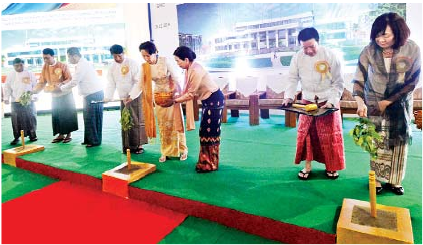
နိုင်ငံတော်၏အတိုင်ပင်ခံပုဂ္ဂိုလ် ဒေါ်အောင်ဆန်းစုကြည်၊ ဂျပန်နိုင်ငံဝန်ကြီးချုပ် မစ္စတာ ရှင်ဇီအာဘေး၏ ဇနီး မစ္စမိ အိအဲအာဘေးနှင့် ရန်ကုန်တိုင်းဒေသကြီး ဝန်ကြီးချုပ် ဦးဖြိုးမင်းသိန်းတို့ SHIN RAI INTERNATIONAL VOCATIONAL INSTITUTE ဆောက်လုပ်မည့်နေရာတွင် ပန္နက်တင်ပေးပြီး အမွှေးနံ့သာရည်များ ပက်ဖျန်းပေးစဉ်။

ယှဉ်ပြိုင်ပြီးတော့သွားနေ ဘဝမှာ ရင်ဆိုင်ရမယ့်အရည်အချင်းတွေ စိန်ခေါ်မှု တွေကို ရင်ဆိုင်နိုင်ခဲ့ဘူးဆိုရင် သင်ထားတဲ့ပညာတွေဟာ တကယ်တော့ စာအုပ်ထဲမှာပဲရှိပြီး ကိုယ့်ရဲ့ဘဝအတွက် အကျိုးမဖြစ်ပါဘူး။ ကိုယ့်ရဲ့ပတ်ဝန်းကျင်အတွက်လည်း အကျိုးမဖြစ်ပါဘူး။ ဒါကြောင့်မို့ ကျွန်ုပ်တို့ကနေပြီးတော့ အသက်မွေးဝမ်းကျောင်းပညာစနစ်၊ နည်းပညာသင်ကြား တွဲစနစ်တွေကို အင်မတန်မှ အားပေးနေတာပါ။ ကမ္ဘာပေါ်မှာ အတိုးတက်ဆုံး၊ အဖွံ့ဖြိုးဆုံးနိုင်ငံတွေ တချို့မှာဆိုရင် တက္ကသိုလ်ပညာရေးစနစ်နဲ့ အသက်မွေးဝမ်းကျောင်း