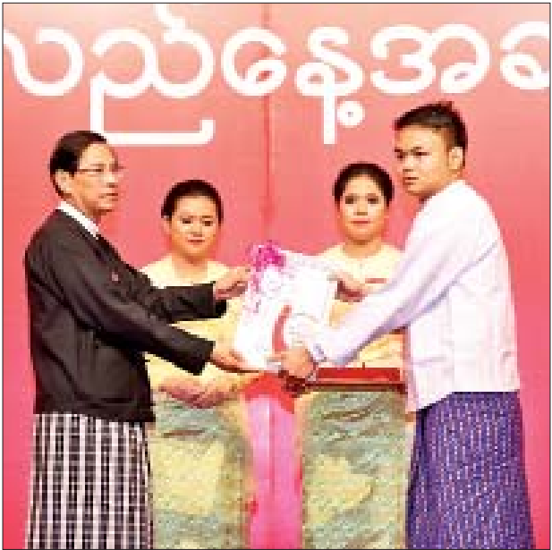
ပြည်ထောင်စုဝန်ကြီး ဦးမင်းသူ စံပြုသင်တန်းသားဆုရရှိသူတစ်ဦးအား ဂုဏ်ပြုဆုနှင့် ဂုဏ်ပြုမှတ်တမ်းလွှာ ပေးအပ်ချီးမြှင့်စဉ်။

ယင်းနောက် ပြည်ထောင်စုဝန်ကြီး၊ ဒုတိယဝန်ကြီး၊ အမြဲတမ်းအတွင်းဝန်နှင့်