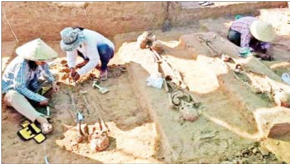
အဆောင်ပစ္စည်းတွေကို ဖော်ထုတ်တွေ့ရှိခြင်းအားဖြင့် မြန်မာ့ရေမြေဒေသမှာ ရှေးဦးမြန်မာလူမျိုးတွေဟာ လွန်ခဲ့တဲ့ နှစ်ပေါင်း ၂၅၀၀ ကျော် မြို့ပြစတင်မီကတည်းက အစောဆုံးနေထိုင်ခဲ့ကြပြီး သံခေတ်ယဉ်ကျေးမှု လူ့အဖွဲ့အစည်းတွေ ထွန်းကားခဲ့တယ်ဆိုတာကို အခုတွေ့ရှိခဲ့တဲ့ အထောက်အထားတွေနဲ့ ခိုင်ခိုင်မာမာ ဖော်ထုတ်ပြသနိုင် တော့မှာဖြစ်တဲ့အတွက် မြန်မာ့သမိုင်းမှာ အမျိုးဂုဏ်၊ ဇာတိဂုဏ်တွေ ပိုမိုထွန်းပြောင်စေမှာဖြစ်ပါတယ်။ လက်ရှိမှာ

မန္တလေး ဒီဇင်ဘာ ၂၈ ရန်ကုန်-မန္တလေး အမြန်လမ်းဘေး မိုင်တိုင်အမှတ် ၃၃၀ အရှေ့ဘက် ပေ ၁၅၀၀ အကွာရှိ မန္တလေးတိုင်းဒေသကြီး နွားထိုးကြီးမြို့နယ် ပဒေါင်ကျေးရွာအုပ်စုအတွင်း၌ သံခေတ်ယဉ်ကျေးမှုလူ့အဖွဲ့အစည်းဆိုင်ရာ ရုပ်ကြွင်းရှစ်ခု အား တူးဖော်တွေ့ရှိခဲ့ကြောင်း ရှေးဟောင်းသုတေသန နှင့် အမျိုးသားပြတိုက်ဦးစီးဌာန (မန္တလေးဌာနခွဲ)မှ လက်ထောက်ညွှန်ကြားရေးမှူးဦးလှရွှေက ပြောကြားသည်။