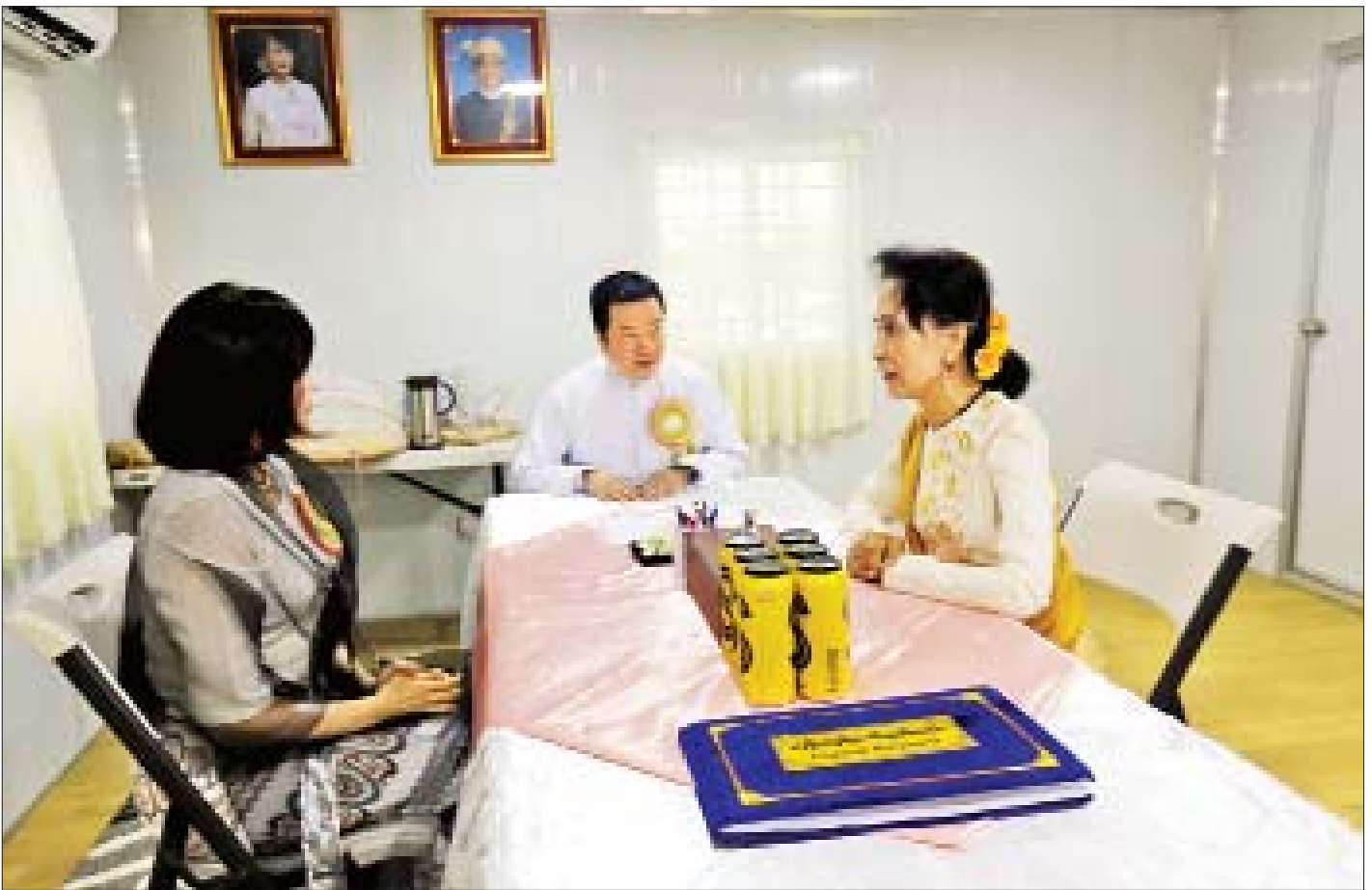
နိုင်ငံတော်၏အတိုင်ပင်ခံပုဂ္ဂိုလ် ဒေါ်အောင်ဆန်းစုကြည်နှင့် ဂျပန်နိုင်ငံဝန်ကြီးချုပ် မစ္စတာ ရှင်ဇီအာဘေး၏ဇနီး မစ္စမိ အိအဲအာဘေးတို့ သီးခြားတွေ့ဆုံဆွေးနွေးစဉ်။

နောက်ပြီး နိုင်ငံခြားဘာသာစကားတွေ သင်ပေးမယ် ဆိုတာကလည်း ကျွန်မတို့ရဲ့ကမ္ဘာကြီးကို အင်မတန်မှ ကျယ်ပြန့်သွားစေပါတယ်။ ကျွန်မတို့နိုင်ငံတစ်ခုလုံးတင် မဟုတ်ဘဲ ကမ္ဘာကြီးနဲ့ဆက်သွယ်နိုင်မယ့် အခြေအနေကို ဖြစ်ပေါ်စေပါတယ်။ ဒါကြောင့်မို့နည်းပညာခေတ်နဲ့ကိုက်ညီတဲ့ နည်းပညာတွေကို သင်ပေးမယ့်ဆိုလို့ ကျွန်မတို့အင်မတန်မှ ဝမ်းသာပါတယ်။ ဒါကြောင့်မို့ လိုအပ်ချက်တွေပဲ။ နောက်ပြီး ပေါင်းသင်းဆက်ဆံရေး ကျွန်မတို့နဲ့မှန်းရတာတော့ တစ်ကမ္ဘာလုံးမှာရှိတဲ့ ကျွန်မတို့ရဲ့ မိတ်ဆွေများနဲ့ အခုချိန်မှာ မိတ်ဆွေ မဖြစ်သေးပေမယ့် နောင်မိတ်ဆွေဖြစ်မယ့် ပုဂ္ဂိုလ်များနဲ့