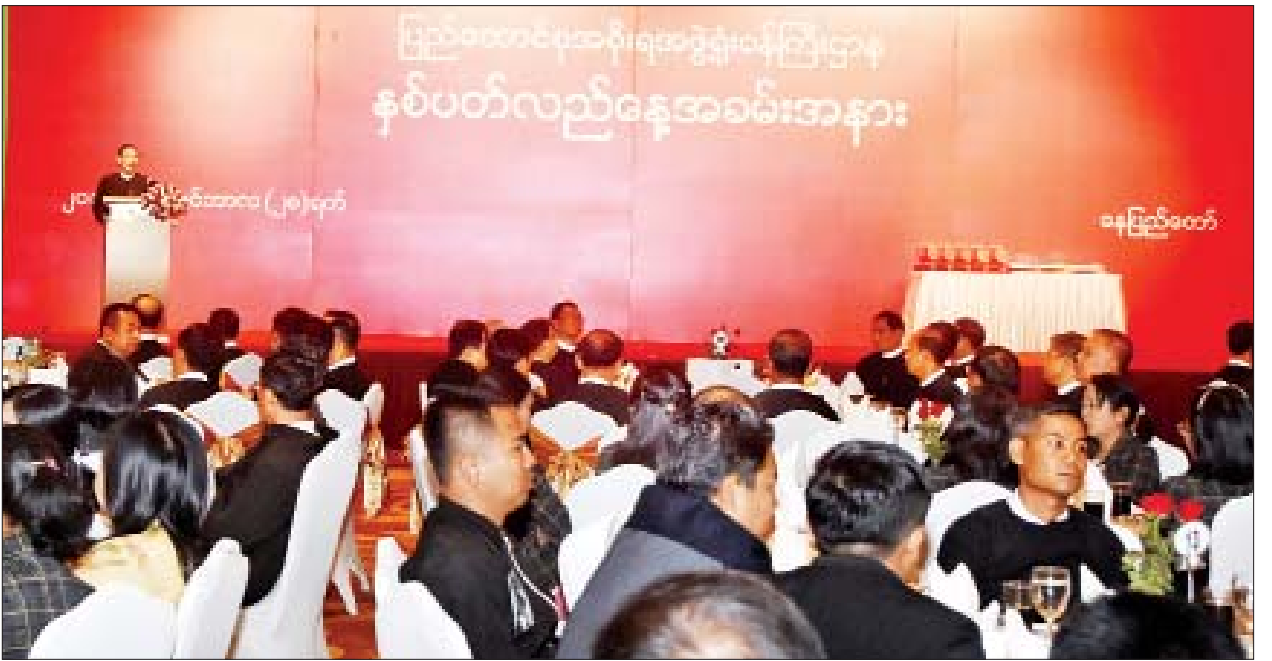
ပြည်ထောင်စုဝန်ကြီး ဦးမင်းသူ ပြည်ထောင်စုအစိုးရအဖွဲ့ရုံးဝန်ကြီးဌာန နှစ်ပတ်လည်နေ့အခမ်းအနားတွင် အမှာစကားပြောကြားစဉ်။

နိုင်ငံတော်၏အတိုင်ပင်ခံပုဂ္ဂိုလ်က ငြိမ်းချမ်းပြီးသာယာပြောသည့် ဒီမိုကရေစီဖက်ဒရယ်ပြည်ထောင်စုစနစ်ဖြစ်လာရန် ဖော်ဆောင်ရာတွင် "မြန်မာနိုင်ငံ၏ ရေရှည်တည်တံ့ခိုင်မြဲပြီး ဟန်ချက်ညီသော ဖွံ့ဖြိုးတိုးတက်မှုစီမံကိန်း (MSDP)" ကို မူဘောင်တစ်ခုအဖြစ် ထားရှိဆောင်ရွက်ကြရန် လမ်းညွှန်ထားပြီး