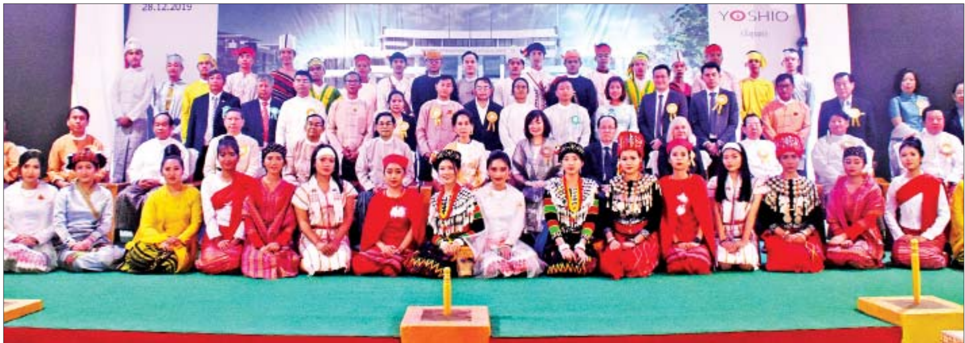
နိုင်ငံတော်၏အတိုင်ပင်ခံပုဂ္ဂိုလ် ဒေါ်အောင်ဆန်းစုကြည်၊ ဂျပန်နိုင်ငံဝန်ကြီးချုပ် မစ္စတာ ရှင်ဇီအာဘေး၏ ဇနီး မစ္စမိ အိအဲအာဘေး၊ ပြည်ထောင်စုဝန်ကြီးများ၊ တိုင်းဒေသကြီးဝန်ကြီးချုပ်၊ ဂျပန်သံအမတ်ကြီးနှင့် အခမ်းအနားသို့ တက်ရောက် လာသူများ စုပေါင်းမှတ်တမ်းတင်ဓာတ်ပုံရိုက်စဉ်။

သွားချင်လာတာကိုမြင်ရပါတယ်။ ဘာဖြစ်လို့လဲဆိုတော့ ပညာသင်ပြီးတာနဲ့ အလုပ်လို့ချင်ကြတယ်။ ဒါလည်း မှန်ကန်တဲ့ရပ်တည်ချက်ပဲ။ ပညာသင်ပြီးတာနဲ့ ကိုယ့်ဟာ ကိုယ် ကိုယ့်ရဲ့အစွမ်းအစပေါ်မှာ ရပ်တည်ချင်ကြတယ်။ ကိုယ့်ရဲ့မိဘတွေကို ပြန်ပြီးကျေးဇူးဆပ်ချင်ကြတယ်။ ကိုယ့်ရဲ့မိသားစုကို ပြန်ပြီး ကူညီချင်ကြတယ်။ ဒါကြောင့်မို့ ပညာရေးပြီးတာနဲ့ အလုပ်ရဖို့ဆိုတာ အင်မတန်မှ အရေးကြီး လာပါတယ်။ အဲဒါကိုလည်း အင်မတန်မှ အားထားလာကြပါ တယ်။ ဒါကိုလည်း ကျွန်ုပ်တို့ စာမျက်နှာ ၄ သို့ ၀