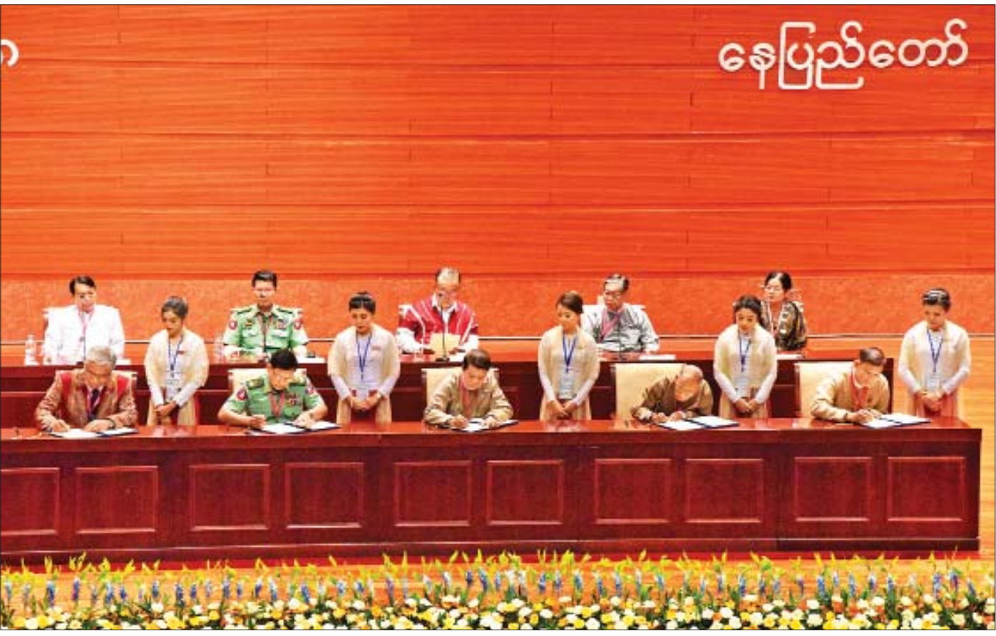
၂၀၁၈ ခုနှစ် ဇူလိုင် ၁၆ ရက်က ကျင်းပသည့် ပြည်ထောင်စုငြိမ်းချမ်းရေးညီလာခံ - (၂၁) ရာစုပင်လုံ တတိယအစည်းအဝေးမှ အတည်ပြုထားသော သဘောတူညီချက်များကို တာဝန်ရှိသူများက လက်မှတ်ရေးထိုးကြစဉ်။

နိုင်ငံတစ်နိုင်ငံဟာ လွတ်လပ်သော အချုပ်အခြာ အာဏာပိုင် နိုင်ငံတစ်နိုင်ငံ ဟုတ်၊ မဟုတ် အက်ဖြတ်ရာမှာ ဥပဒေပြုရေးအာဏာ၊ အုပ်ချုပ်ရေးအာဏာနဲ့ တရားစီရင်