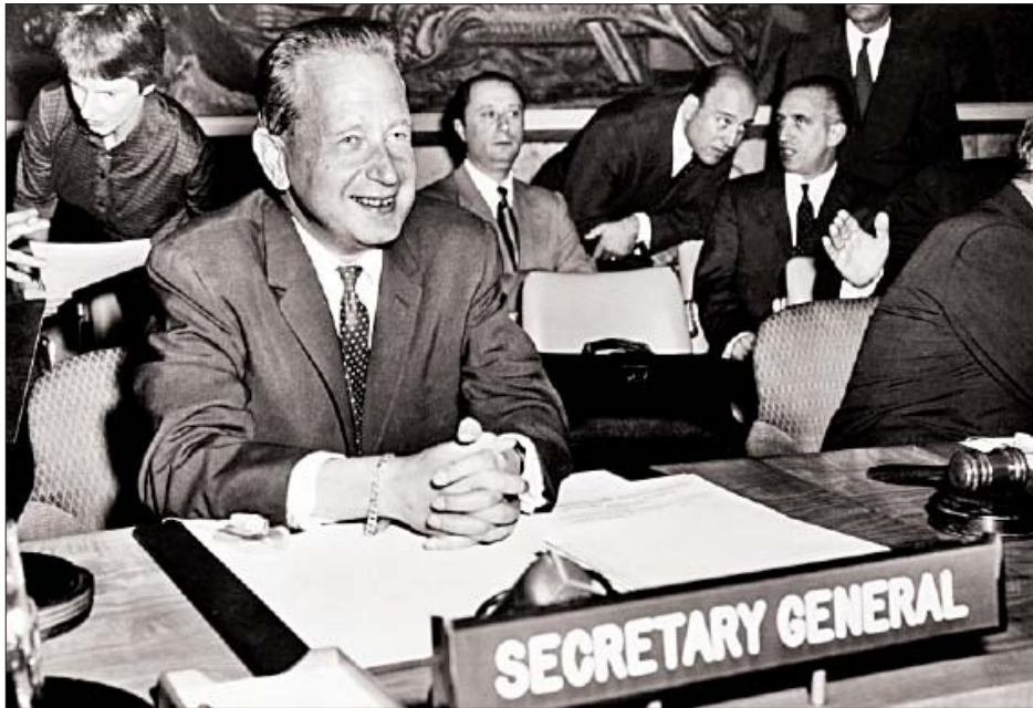
ဟုသိကြသည့် ယခုဇော်ဘီယာနိုင်ငံရှိ အန်ဒိုလာမြို့အနီး၌ ၎င်းတို့ စီးနင်းလိုက်ပါသည့် လေယာဉ် ၁၉၆၁ ခုနှစ် စက်တင်ဘာ ၁၈ ရက်တွင် ပျက်ကျ၍ သေဆုံးခဲ့သည်။ ထိုအချိန်က ဒက်ဟမ္မားရှိုးသည် သယ်ဇာတပေါ်ကြွယ်ဝ

ကုလသမဂ္ဂ ဒီဇင်ဘာ ၂၈ ကုလသမဂ္ဂအတွင်းရေးမှူးချုပ်ဟောင်း ဒက်ဟမ္မားရှိုး၏ ၁၉၆၁ ခုနှစ်က ပဟေဠိဆန်ဆန် သေဆုံးမှုအပေါ် စုံစမ်းစစ်ဆေးမှုများကို ဆက်လက်လုပ်ဆောင်ရန် ဆုံးဖြတ်ချက် တစ်ခုကို ကုလသမဂ္ဂအထွေထွေညီလာခံက သေကြာနေ့က အတည်ပြုခဲ့သည်။ ဆွီဒင်လူမျိုး ဒက်ဟမ္မားရှိုးသည် တောင်အာဖရိကဒေသတွင် တာဝန်တစ်ခုဖြင့် ခရီးသွားနေစဉ်အတွင်း ၎င်းစီးနင်းသည့် လေယာဉ်ပျက်ကျ၍ သေဆုံးခဲ့ခြင်းဖြစ်သည်။