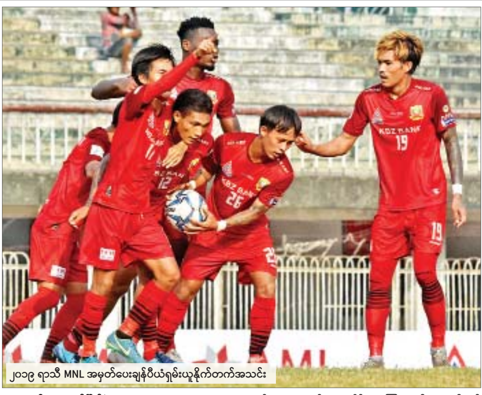
၂၀၁၉ ရာသီ MNL အမှတ်ပေးချန်ပီယံရှမ်းယူနိုက်တက်အသင်း

□ ဝန်ကြီးဌာနပေါင်းစုံမှ ဆက်လက်၍ ဝဏ္ဏသိဒ္ဓိအားကစားလေ့ကျင့်ရေးကွင်း(၁)နှင့် (၂)ကြား တွင် လွန်ခဲ့သောကစားပြိုင်ပွဲ အမျိုးသား၊ အမျိုးသမီး၊ ပြိုင်ပွဲများ၊ ထုတ်ဆီးတိုး ပြိုင်ပွဲများနှင့် TC-1 တွင် ယှဉ်ပြိုင်ကစားသော ပိုက်ကျော်ခြင်း(အမျိုးသား) ပြိုင်ပွဲများ ယှဉ်ပြိုင်ကစားကြသည်။ ထို့နောက် ဖူဆယ်အားကစားပြိုင်ပွဲများ ယှဉ်ပြိုင်ကစားကြရာ လူမှုဝန်ထမ်း၊ ကယ်ဆယ်ရေးနှင့် ပြန်လည်နေရာချထားရေးဝန်ကြီးဌာန အသင်းက ပြန်ကြားရေးဝန်ကြီးဌာနအသင်းအား ငါးဂိုး - သုံးဂိုး၊ ဆောက်လုပ် ရေးဝန်ကြီးဌာနအသင်းက အစိုးရအဖွဲ့ရုံးအသင်းအား ခုနစ်ဂိုး - နှစ်ဂိုး၊ ပြည်ထဲရေး ဝန်ကြီးဌာနအသင်းက ပြည်သူ့လွှတ်တော် အသင်းအား ကိုးဂိုး - တစ်ဂိုး၊ နေပြည်တော်စည်ပင်အသင်းက ပညာရေးဝန်ကြီး ဌာနအသင်းအား လေးဂိုး- သုံးဂိုး၊ ဟိုတယ်နှင့်ခရီးသွားလာရေးဝန်ကြီးဌာနအသင်းက ပြည်ထောင်စု အစိုးရအဖွဲ့ရုံးဝန်ကြီးဌာနအသင်းအား ကိုးဂိုး-တစ်ဂိုး၊ သာသနာရေးနှင့် ယဉ်ကျေးမှုဝန်ကြီးဌာန အသင်းက တိုင်းရင်းသားလူမျိုးများရေးရာဝန်ကြီး ဌာနအသင်းအား သုံးဂိုး- နှစ်ဂိုး၊ ကျန်းမာရေးနှင့်အားကစားဝန်ကြီးဌာန အသင်းက နိုင်ငံခြားရေးဝန်ကြီး ဌာနအသင်းအား ရှစ်ဂိုး - တစ်ဂိုးတို့ဖြင့် အသီးသီးအနိုင်ရရှိခဲ့သည်။ ဆက်လက်၍ ဝဏ္ဏသိဒ္ဓိအားကစားရုံ(C)တွင် ဘော်လီဘော(အမျိုးသား) ပွဲစဉ်များ ယှဉ်ပြိုင်ကစားကြရာ ကာကွယ်ရေးဝန်ကြီးဌာနအသင်းက ကျန်းမာ ရေးနှင့် အားကစားဝန်ကြီးဌာနအသင်းအား သုံးပွဲပြတ်ဖြင့်လည်းကောင်း၊ ပြည်ထဲရေးဝန်ကြီးဌာနအသင်းက ပညာရေးဝန်ကြီးဌာနအသင်းအား သုံးပွဲ ပြတ်ဖြင့်လည်းကောင်း အသီးသီးအနိုင်ရရှိခဲ့ကြောင်း သိရသည်။ အား/ကာ