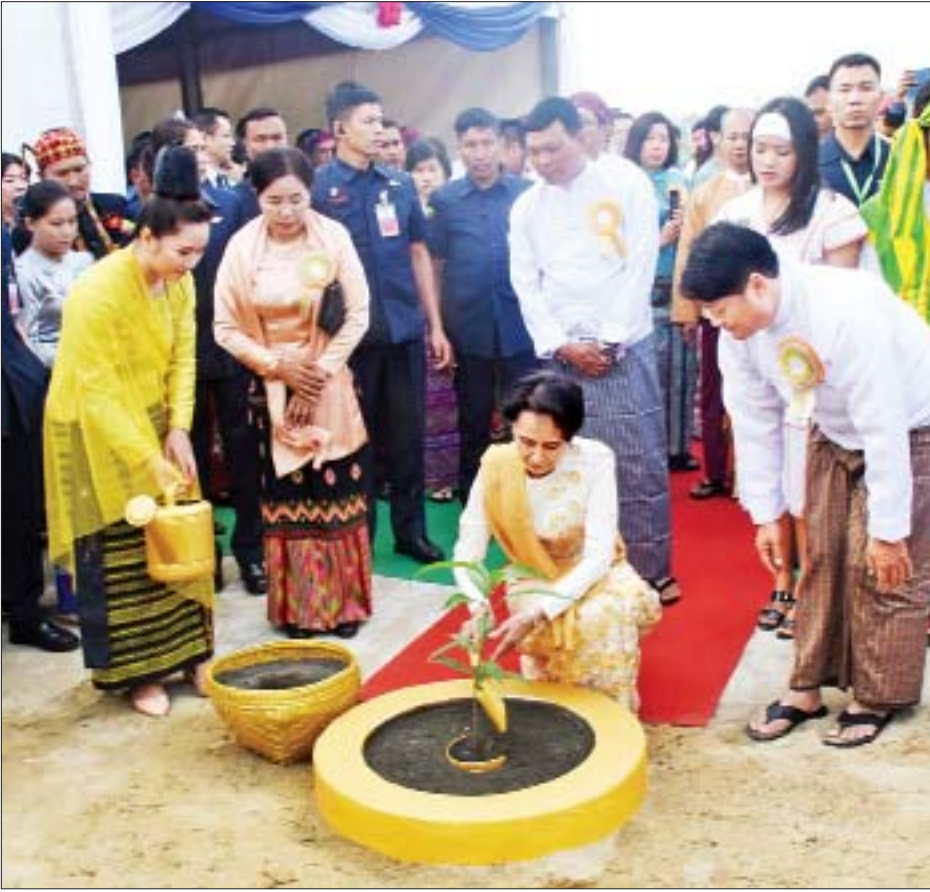
နိုင်ငံတော်၏အတိုင်ပင်ခံပုဂ္ဂိုလ် ဒေါ်အောင်ဆန်းစုကြည် SHIN RAI INTERNATIONAL VOCATIONAL INSTITUTE ပန္နက်တင်ပွဲအခမ်းအနားတွင် အမှတ်တရ သရက်ပင် စိုက်ပျိုးပေးစဉ်။