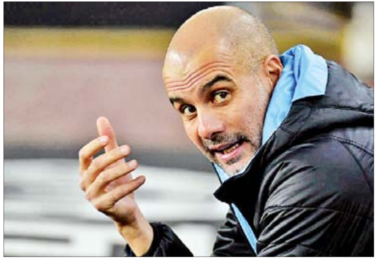
အကျောပွဲစဉ် ယှဉ်ပြိုင်ကစားရမှာဖြစ်ပါတယ်။ ဒါပေမယ့် အက်ဖ်အေဖလားနဲ့ အိအက်ဖ် အယ်လ်ဖလားတို့ဟာ အသင်းအတွက် အဓိက ဦးစားပေးပြိုင်ပွဲတွေမဟုတ်ကြောင်းနဲ့ လာမယ့် ဘောလုံးရာသီမှာ ဥရောပဝင်ခွင့် တစ်နေရာ ရရှိဖို့ကသာ အဓိကဖြစ်တယ်လို့ နည်းပြ ဂျွန်နီယိုလာက ဆိုပါတယ်။

မန်စီးတီးအသင်းဟာ အခုနှစ်ဘောလုံး ရာသီမှာ ဖလားတစ်လုံးပိုင်ဆိုင်ထားပြီး အဲဒီဖလားကတော့ ဩဂုတ်လအတွင်းက လီဗာပူးအသင်းကို ပင်နယ်တီအဆုံးအဖြတ်နဲ့ အနိုင်ရရှိပြီး ရယူနိုင်ခဲ့တဲ့ ကွန်မြူနတီဒိုင်းပဲ ဖြစ်ပါတယ်။ ပြည်တွင်းဖလားပြိုင်ပွဲအားလုံး ကစားရဖို့ ကျန်နေသေးတဲ့ မန်စီးတီးအသင်းဟာ ချန်ပီယံ လိဂ် ၁၆ သင်းအဆင့်မှာ ရိုးယဲလ်မက်ဒရစ် အသင်းနဲ့ ယှဉ်ပြိုင်ကစားရမှာဖြစ်ပြီး ဇန်နဝါရီ ၄ ရက်မှာ လိဂ်တူးကလပ် ပိုလာလီအသင်းနဲ့ ကစားရမှာဖြစ်ကာ ဇန်နဝါရီ ၇ ရက်မှာတော့ မန်ချက်စတာမြို့ခံပြိုင်ဘက် မန်ယူအသင်းနဲ့ အိအက်ဖ်အယ်လ်ဖလားဆီမီးဖိုင်နယ် ပထမ