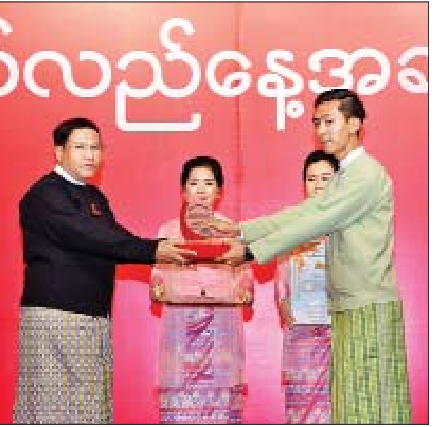
ဒုတိယဝန်ကြီး ဦးတင်မြင့် ပထမဆုရရှိသူတစ်ဦးအား ဂုဏ်ပြုဆုနှင့် ဂုဏ်ပြုမှတ်တမ်းလွှာ ပေးအပ်ချီးမြှင့်စဉ်။

ယခုကဲ့သို့ ပြည်ထောင်စုအစိုးရအဖွဲ့ရုံးဝန်ကြီးဌာန (၁)နှစ်ပြည့် နှစ်ပတ်လည်ရောက်သည့်အချိန်တွင် အသွင်သဏ္ဍာန် ပြုပြင်ပြောင်းလဲရေးလုပ်ငန်းစဉ်များကို (၆)လအတွင်း မျှော်မှန်းထားသကဲ့သို့ အကောင်အထည်ဖော် ဆောင်ရွက်နိုင်ခဲ့ပြီးဖြစ်ပါကြောင်း၊ အဓိကကျသည့် အနှစ်သာရပြုပြင်ပြောင်းလဲရေး လုပ်ငန်းစဉ်များကို အကောင်အထည်ဖော်ဆောင်ရွက်နိုင်ရန်အတွက် ဥပဒေပြဋ္ဌာန်းသတ်မှတ်