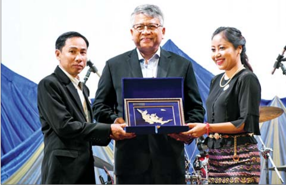
AIR KBZ လေကြောင်းလိုင်းရှိ ဌာနများအနက် Best Performance ဆုရရှိသည့် ဌာနများမှ တာဝန်ရှိသူများကို ဆုတံဆိပ်နှင့် ဂုဏ်ပြုဆုငွေများ ချီးမြှင့်စဉ်။

ရန်ကုန် ဒီဇင်ဘာ ၂၇ ပြည်တွင်းခရီးစဉ်များကို လုံခြုံစိတ်ချစွာဖြင့် ပျံသန်းပေးပေးလျက်ရှိသော မြန်မာနိုင်ငံသားပိုင် AIR KBZ လေကြောင်းလိုင်း၏ ရှစ်နှစ်ပြည့် အထိမ်းအမှတ်ဂုဏ်ပြုပွဲကို ယနေ့ညနေပိုင်းက ရန်ကုန်မြို့ရှိ နိဗ္ဗိတယ် ဟိုတယ်၌ ကျင်းပသည်။ အခမ်းအနားတွင် ရှေးဦးစွာ AIR KBZ လေကြောင်းလိုင်းရှိ ဌာနများ အနက် Best Performance ဆုရရှိသည့် ဌာနများမှ တာဝန်ရှိသူများကို ဆုတံဆိပ်နှင့် ဂုဏ်ပြုဆုငွေများ၊ AIR KBZ လေကြောင်းလိုင်းနှင့် အကျိုးတူစီးပွားဖက် ဆောင်ရွက်နေသည့် Agent များကို Valuable Partner 2019 အဖြစ် အမှတ်တရဂုဏ်ပြုလက်ဆောင်များ ပေးအပ်သည်။ ယင်းနောက် ဩဂုတ် ၁ ရက်မှ ဒီဇင်ဘာ ၂၅ ရက်အတွင်း AIR KBZ လေကြောင်းလိုင်း ခရီးစဉ်များတွင် လိုက်ပါစီးနင်းခဲ့သော ခရီးသည်များကို ကျေးဇူးတုံ့ပြန်သောအားဖြင့် တတိယအကြိမ် ကံစမ်းမဲအစီအစဉ်ကို AIR KBZ ၏ Ambassador ဖြစ်သူ ရုပ်ရှင်သရုပ်ဆောင်နှင့် အဆိုတော် စိုင်းစိုင်းခမ်းလှိုင်က ကံစမ်းမဲလက်မှတ်များကို ရွေးချယ်ပေးရာ တတိယဆု