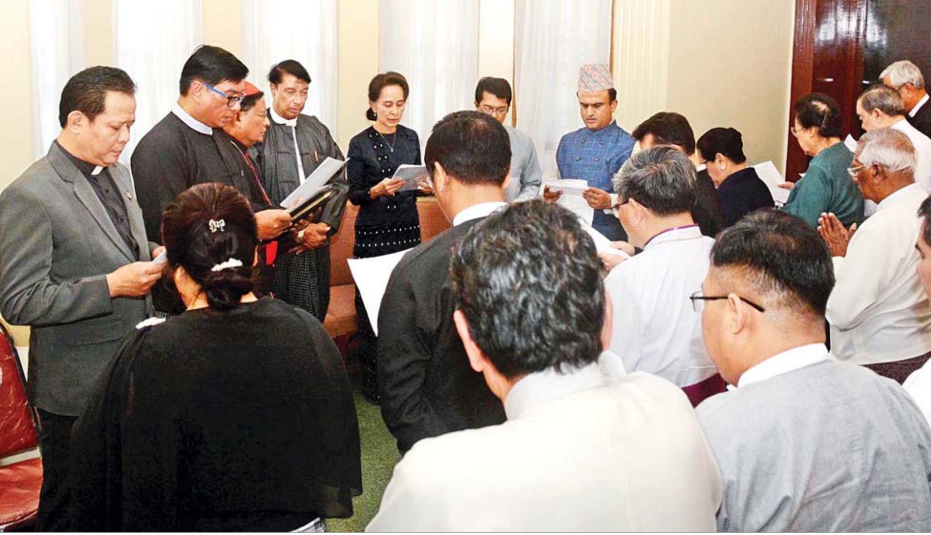
ဘာသာပေါင်းစုံမှ ဘာသာရေးခေါင်းဆောင်များက နိုင်ငံတော်၏အတိုင်ပင်ခံပုဂ္ဂိုလ် ဒေါ်အောင်ဆန်းစုကြည်၏မိခင်ကြီး ဒေါ်ခင်ကြည်အတွက် ဘာသာအလိုက် အောက်မေ့ဖွယ်ရာ ဆုတောင်းမေတ္တာများပို့သကြစဉ်။

ရန်ကုန် ဒီဇင်ဘာ ၂၇ အမျိုးသားခေါင်းဆောင်ကြီး ဗိုလ်ချုပ်အောင်ဆန်း၏ဇနီး ဒေါ်ခင်ကြည် ကွယ်လွန်ခြင်း (၃၁)နှစ်ပြည့် နှစ်ပတ်လည် ဆွမ်းကျွေးအလှူကို ယနေ့ နံနက် ၁၀ နာရီက ရန်ကုန်မြို့ တက္ကသိုလ်ရိပ်သာလမ်း အမှတ် (၅၄) ရှိ သမီးဖြစ်သူ နိုင်ငံတော်၏ အတိုင်ပင်ခံပုဂ္ဂိုလ် ဒေါ်အောင်ဆန်းစုကြည်၏ နေအိမ်၌ ပြုလုပ်သည်။ စာမျက်နှာ ၃ ကော်လံ ၁ သို့ ●