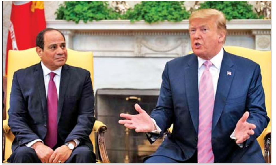
အမေရိကန်သမ္မတ ဒေါ်နယ်ထရပ်စ်နှင့် အီဂျစ်သမ္မတ အယ်လီဖီဖီထိုဟ် ၂၀၁၉ ခုနှစ် ဧပြီ ၉ ရက် တွင် ဝါရှင်တန်မြို့ရှိ အိမ်ဖြူတော်၌ တွေ့ဆုံစဉ်။

ထို့အပြင် ကုလသမဂ္ဂ ကျောထောက်နောက်ခံပြုသည့် လစ်ပျားအစိုးရ၏ ပြည်ထဲရေးဝန်ကြီး ဖာသီဘရားဂါက လစ်ပျားအစိုးရအား ပိုမိုကူညီရန်အတွက် တူရကီ-တူနီးရှား-အယ်လ်ဂျီးရီးယားတို့ပါဝင်သော မဟာမိတ်အဖွဲ့တစ်ခုကို ဖွဲ့စည်းထူထောင်ခဲ့သည်ဟု ဒီဇင်ဘာ ၂၆ ရက်တွင် ပြောကြားသည်။