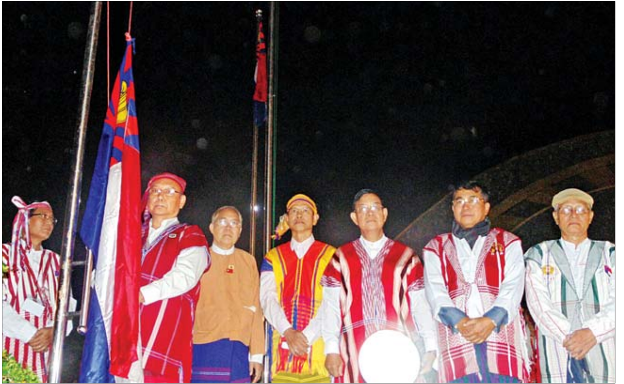
အမျိုးသားလွှတ်တော်ဥက္ကဋ္ဌမန်းဝင်းခိုင်သန်း ကရင်အမျိုးသားနှစ်သစ်ကူးနေ့ အလံတင်အခမ်းအနားတွင် ကရင်အမျိုးသားအလံ လှူငှားပေးနေစဉ်။