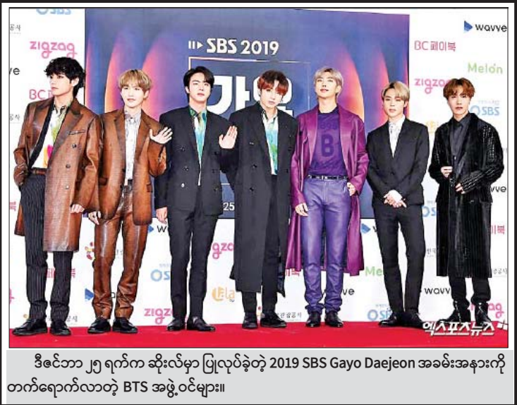
ဒီဇင်ဘာ ၂၅ ရက်က ဆိုးလ်မှာ ပြုလုပ်ခဲ့တဲ့ 2019 SBS Gayo Daejeon အခမ်းအနားကို တက်ရောက်လာတဲ့ BTS အဖွဲ့ဝင်များ။