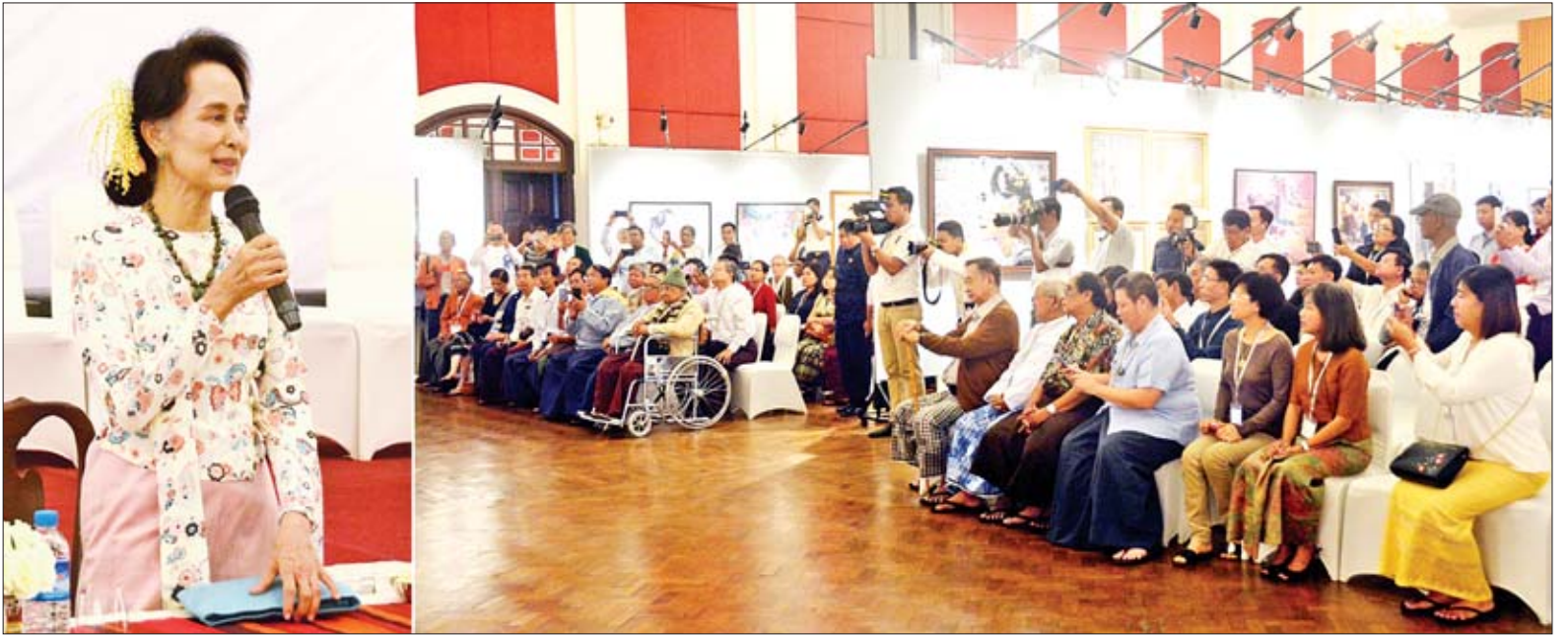
နိုင်ငံတော်၏အတိုင်ပင်ခံပုဂ္ဂိုလ် ဒေါ်အောင်ဆန်းစုကြည် ဟေမန္တပန်းချီပြပွဲဖွင့်ပွဲအခမ်းအနားတွင် အမှာစကားပြောကြားစဉ်။

ပထမ ကျွန်မလည်း နည်းနည်းပါးပါး မျက်နှာလိုက်တဲ့ သဘောရှိလား၊ ဓမ္မဓိဋ္ဌာန်ကျကျမြင်တာ ဟုတ်မှ ဟုတ်ရဲ့လားပေါ့နော်။ ကျွန်မတို့ရဲ့နိုင်ငံက ပန်းချီဆရာတွေဟာ အရှေ့တောင်အာရှမှာ အတော်ဆုံးလို့ မြင်ပါတယ်။ ကျွန်မမျက်စိထဲမှာ အရှေ့တောင်အာရှ ပန်းချီဆရာတွေထဲမှာ ကျွန်မတို့ ပန်းချီဆရာတွေ ရေးဆွဲတဲ့ပန်းချီကားတွေက ပိုပြီးအဓိပ္ပာယ်ရှိတယ်။ လှလည်း လှတယ်ပေါ့နော်။ လှတယ်ဆိုတာကို ကျွန်မပြောချင်ပါတယ်။ တချို့တွေက အနုပညာနဲ့ပတ်သက်ပြီး လှဖို့မလိုဘူးလို့ ပြောတဲ့သူတွေလည်း ရှိပါတယ်။ အဲဒါကို ကျွန်မ သဘောမတူပါဘူး။ အနုပညာဆိုတာ လှဖို့လုပ်တာ၊ လှတာ