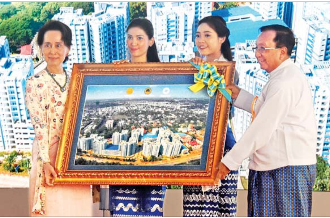
နိုင်ငံတော်၏အတိုင်ပင်ခံပုဂ္ဂိုလ် ဒေါ်အောင်ဆန်းစုကြည်ထံ ဆောက်လုပ်ရေးဝန်ကြီးဌာန ပြည်ထောင်စုဝန်ကြီး ဦးဟန်ဇော်က မင်းမေပညာ ရပ်သာအပ်နှံမှုအထိမ်းအမှတ် မှတ်တမ်းဓာတ်ပုံကို ပေးအပ်စဉ်။

ဆက်လက်ပြီးတော့ ကျန်ရှိနေသေးတဲ့ ရှစ်ထပ်တိုက် လေးလုံး၊ ၁၂ ထပ်တိုက် ၁၁ လုံးမှ အိမ်ခန်းပေါင်း ၂၁၈၆ ခန်းကိုလည်း သတ်မှတ် ထားတဲ့အတိုင်း ၂၀၂၀ ပြည့်နှစ်နဲ့ ၂၀၂၁ ခုနှစ် တွေမှာ အပ်နှံနိုင်ရေးအတွက် သက်ဆိုင်ရာ အစိုးရဌာနတွေနဲ့ Myanmar Imperial Vega