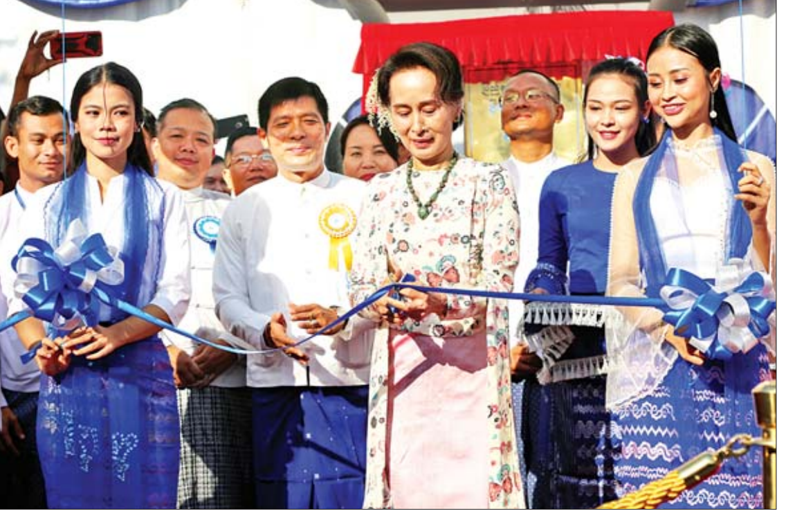
နိုင်ငံတော်၏အတိုင်ပင်ခံပုဂ္ဂိုလ် ဒေါ်အောင်ဆန်းစုကြည် မင်းဓမ္မပညာ့ရိပ်သာ ဆရာများအိမ်ရာ၊ လှိုင်ပညာ့ရိပ်သာ ဝန်ထမ်းအိမ်ရာနှင့် သိပ္ပံပစ္စည်းစက်ရုံသစ် ဖွင့်ပွဲအခမ်းအနားကို ဖဲကြိုးဖြတ်ဖွင့်လှစ်ပေးစဉ်။

ထက်မြက်တဲ့ ဆရာကောင်း၊ ဆရာမကောင်း တွေ ပေါ်လာရေးဟာ ပညာရေးစနစ်နည်းတူ အရေးကြီးလှပါတယ်။ ပညာရေးနယ်ပယ် တိုးတက်မြှင့်မားရေးကို အာရုံစိုက်ပြီး ဆောင်ရွက်နိုင်ဖို့အတွက် ဆရာ ဆရာမတွေ အတွက် နေချင်စဖွယ် ပတ်ဝန်းကျင်၊ အိမ်ရာ၊ လူနေမှုဘဝအခြေအနေတွေ တိုးတက်ကောင်း မွန်လာဖို့ ကျွန်မတို့အမြဲပဲအလေးအနက်ထား နည်းလမ်းတွေ ရှာနေပါတယ်။ စာမျက်နှာ ၄ သို့ *