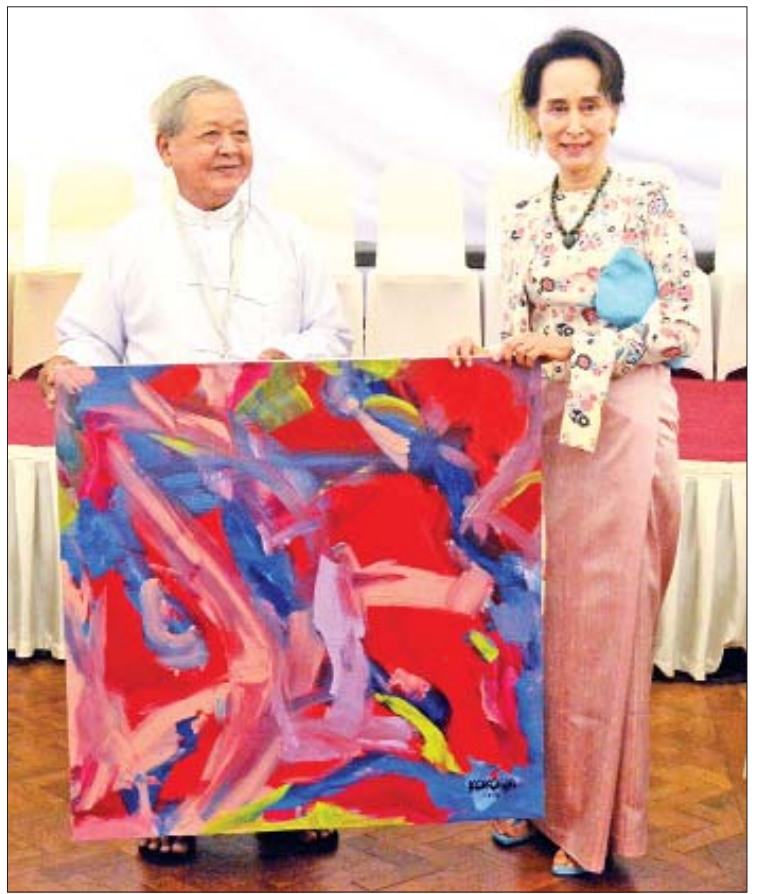
နိုင်ငံတော်၏အတိုင်ပင်ခံပုဂ္ဂိုလ် ဒေါ်အောင်ဆန်းစုကြည်ထံ ပန်းချီပညာရှင်တစ်ဦးက ပန်းချီကားလက်ဆောင်ပေးအပ်စဉ်။

မယ့် စိန်ခေါ်မှုတွေကို ဘယ်လိုကျော်လွှားရမလဲ ဆိုတာကို နိစ္စရူဝ ပူပန်စဉ်းစားပြီး အဖြေရှာ နေရတာပါပဲ။ လူတိုင်း တွေ့မြင်နေရသလိုပါပဲ။ နိုင်ငံရေးသမားကလည်း နိုင်ငံရေးနေရာကနေ၊ အနုပညာရှင်ကလည်း အနုပညာရှင်နေရာ ကနေ ဒီလိုမစဉ်းစားရင်တောင်မှ နောက်ဆုံး ဒီလောကကြီးရဲ့ နိစ္စရူဝ မနက်နိုးလာ ကတည်းက ညအိပ်တဲ့အထိ၊ မွေးကတည်းက သေတဲ့အထိ ရင်ဆိုင်ရတဲ့ စိန်ခေါ်မှုတွေကို ဘယ်လိုနည်းနဲ့ တို့အကောင်းဆုံးကျော်လွှားရ မလဲ။ ဘယ်လိုနည်းနဲ့ ငါတို့ရဲ့ ဘဝတွေကို အဓိပ္ပာယ်ရှိအောင် နေသွားမလဲဆိုတာကို လူတိုင်းရဲ့ မသိစိတ်မှာရှိလိမ့်မယ်လို့ ကျွန်မ ယုံကြည်ပါတယ်။ တန်ဖိုးရှိတဲ့အနုပညာရှင်တွေ အဲဒီတော့ အနုပညာရှင်တွေ၊ ပန်းချီဆရာ ဆရာမတွေကလည်း တခြားသူတွေထက် စာရင် ပိုပြီးတော့တောင် စဉ်းစားရတဲ့ အတွေး အခေါ်တွေ ပိုပြီးဖြစ်မယ်လို့ ယုံကြည်ပါတယ်။ ဒါကြောင့်ပဲ ကျွန်မတို့ရဲ့နိုင်ငံအတွက် အင်မတန် မှအရေးကြီးပြီး တန်ဖိုးရှိတဲ့ အနုပညာရှင်တွေနဲ့ အခုလိုတွေ့ရတဲ့အတွက်လည်း ဝမ်းသာပါ တယ်။ ကျွန်မတို့ နိုင်ငံတော်အတွက် ဒီလို တန်ဖိုးရှိတဲ့အလုပ်တွေကို လုပ်ပေးတဲ့အတွက် လည်း ကျေးဇူးတင်ပါတယ်လို့ ကျွန်မပြောရင်း နဲ့ နိဂုံးချုပ်ပါတယ်”ဟု ပြောကြားသည်။ ထို့နောက် နိုင်ငံတော်၏အတိုင်ပင်ခံ ပုဂ္ဂိုလ် ဒေါ်အောင်ဆန်းစုကြည်ထံ ပန်းချီပညာ ရှင်ကြီးများ၊ ပန်းချီဆရာ ဆရာမများက ၎င်းတို့ ရေးဆွဲထားသည့် ပန်းချီကားများကို လက် ဆောင်ပေးအပ်ကြသည်။ ယင်းနောက် နိုင်ငံတော်၏အတိုင်ပင်ခံ ပုဂ္ဂိုလ်သည် ပန်းချီပညာရှင်ကြီးများ၊ ပန်းချီ