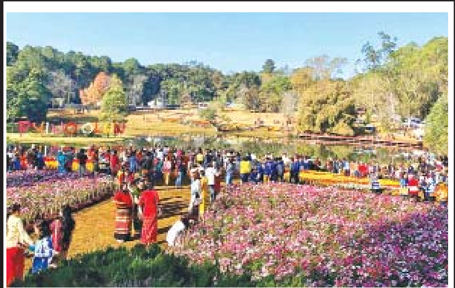
ကရင်နှစ်သစ်ကူးနေ့ ဒီဇင်ဘာ ၂၆ ရက်က ပြင်ဦးလွင်မြို့ အမျိုးသားကန်တော်ကြီးဥယျာဉ်တွင် မြန်မာပြည်အနှံ့မှ လာရောက်လည်ပတ် အပန်းဖြေသူများဖြင့် စည်ကားနေသည်ကို တွေ့ရစဉ်။

ဝန်းသို ဒီဇင်ဘာ ၂၆ စစ်ကိုင်းတိုင်းဒေသကြီး ဝန်းသိုမြို့နယ် ပြန်ကြားရေးနှင့် ပြည်သူ့ဆက်ဆံရေးဦးစီးဌာန၌ (၇၂)နှစ်မြောက် လွတ်လပ်ရေးနေ့အကြို အထိမ်းအမှတ် ပုံတူပန်းချီပြိုင်ပွဲကို ဒီဇင်ဘာ ၂၄ ရက် နံနက် ၁၀ နာရီက ကျင်းပသည်။ အထက်တန်းဆင့် ကျောင်းသား ကျောင်းသူ ၂၀ တို့ ပါဝင်ယှဉ်ပြိုင်ခဲ့ကြပြီး ဆုရရှိသော ကျောင်းသား ကျောင်းသူများအား မြို့နယ်ပြန်ကြားရေးနှင့် ပြည်သူ့ဆက်ဆံရေးဦးစီးမှူးက ဆုများချီးမြှင့်ပေးအပ်ခဲ့သည်။ ကျော်မြိုင်(ပြန်/ဆက်)