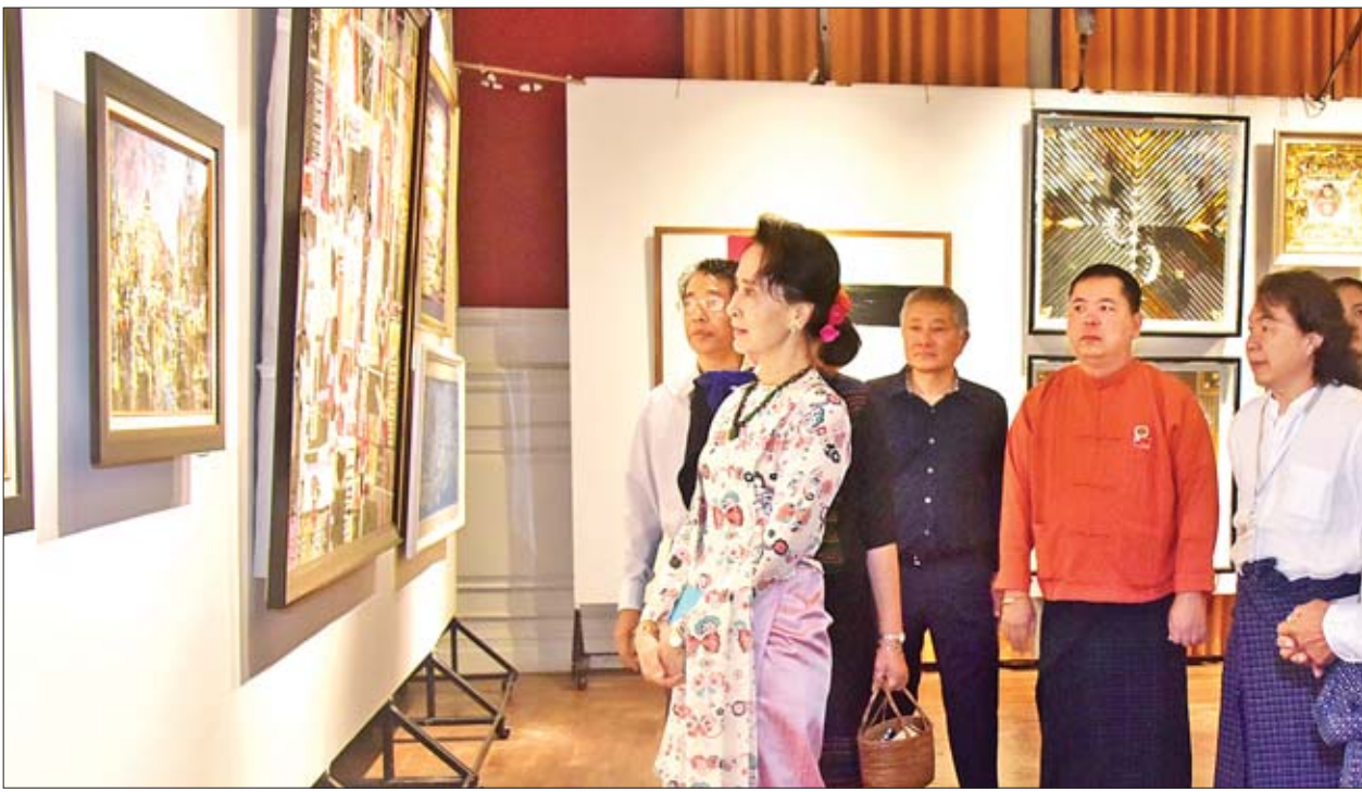
နိုင်ငံတော်၏အတိုင်ပင်ခံပုဂ္ဂိုလ် ဒေါ်အောင်ဆန်းစုကြည် ခင်းကျင်းပြသထားသည့် ပန်းချီကားများကို လှည့်လည်ကြည့်ရှုစဉ်။