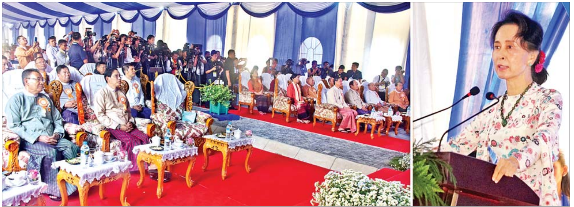
နိုင်ငံတော်၏အတိုင်ပင်ခံပုဂ္ဂိုလ် ဒေါ်အောင်ဆန်းစုကြည် မင်းဓမ္မပညာ့ရိပ်သာ ဆရာများအိမ်ရာ၊ လှိုင်ပညာ့ရိပ်သာ ဝန်ထမ်းအိမ်ရာနှင့် သိပ္ပံပစ္စည်းစက်ရုံသစ် ဖွင့်ပွဲအခမ်းအနားတွင် အမှာစကားပြောကြားစဉ်။

* ရှေ့ပိုးမှ ထို့နောက် နိုင်ငံတော်၏အတိုင်ပင်ခံပုဂ္ဂိုလ် ဒေါ်အောင်ဆန်းစုကြည်က အမှာစကား ပြောကြားရာတွင် “ဒီကနေ့ ကျင်းပတဲ့ မင်းဓမ္မ ပညာ့ရိပ်သာ ဆရာများအိမ်ရာ၊ လှိုင်ပညာ့ ရိပ်သာဝန်ထမ်းအိမ်ရာနဲ့ သိပ္ပံပစ္စည်းစက်ရုံသစ် ဖွင့်ပွဲအခမ်းအနားကို တက်ရောက်လာတဲ့ ဧည့်သည်တော်အားလုံးကို ကြိုဆိုနှုတ်ခွန်း ဆက်ပါတယ်။ မျှော်လင့် ကျွန်မတို့ ဒီကိုလာရတာ အင်မတန်မှ အားရပါတယ်။ အခုနပြသွားတဲ့ ပုံတွေအရ ဆိုရင် အင်မတန်မှကောင်းတဲ့ ဝန်ထမ်းအိမ်ရာ တစ်ခုဖြစ်ပါတယ်။ ဒီလိုဝန်ထမ်းအိမ်ရာတစ်ခု နဲ့ ထိုက်တန်တဲ့ဝန်ထမ်းတွေ ပေါက်ဖွားလာ မယ်လို့ မျှော်လင့်ပါတယ်။ ကျွန်မတို့အစိုးရရဲ့ ရည်မှန်းချက်ကတော့ နိုင်ငံရဲ့ငြိမ်းချမ်းရေး၊ ရေရှည်တည်တံ့ခိုင်မြဲရေး နဲ့ ခေတ်မီဖွံ့ဖြိုးတိုးတက်ရေးတို့ကို ဆောင်ကြဉ်းပေးနိုင်မယ့် ဒီမိုကရေစီဖက်ဒရယ် ပြည်ထောင်စုတစ်ခု တည်ဆောက်နိုင်ဖို့ဖြစ်ပါ တယ်။ ဒီလိုတည်ဆောက်ရာမှာ လူသား စွမ်းရည်သာမက၊ စိတ်ပိုင်းဆိုင်ရာသာမက ရုပ်ပိုင်းဆိုင်ရာ အခြေခံအဆောက်အအုံတွေ လည်း လိုအပ်ပါတယ်။ ဒါတွေကိုလည်း အဆင့်မြင့်ပေးဖို့လည်း လိုအပ်ပါတယ်။ ဖွံ့ဖြိုးဆဲနိုင်ငံတစ်နိုင်ငံဖြစ်တဲ့ မြန်မာနိုင်ငံ အနေနဲ့ ကျွန်မတို့ပြည်သူတွေအတွက် စိန်ခေါ် မှုတွေ၊ အခက်အခဲတွေကို တွေ့ကြုံရင်ဆိုင်နေ ရတာ အားလုံးအသိပဲဖြစ်ပါတယ်။ စိန်ခေါ်မှု တွေ၊ အခက်အခဲတွေကြားကပဲ အခွင့်အလမ်း တိုးတက်မှုတွေကို ရယူနိုင်ဖို့ ကျွန်မတို့အားလုံး ကြိုးစားအားထုတ်ကြဖို့လည်း လိုပါတယ်။ အဲဒီမှာဆိုရင် ကျွန်မတို့ရဲ့ ဝန်ထမ်းများ အထူးသဖြင့် ဆရာ ဆရာမများဟာ အင်မတန်