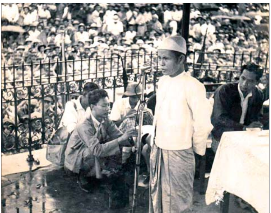
အမျိုးသားခေါင်းဆောင်ကြီး ဗိုလ်ချုပ်အောင်ဆန်း ရန်ကုန်မြို့ မဟာဗန္ဓုလပန်းခြံတွင် လွတ်လပ်ရေးအတွက် လူထုကိုစည်းရုံးဟောပြောခဲ့စဉ်။

စည်းကမ်းထိန်းသိမ်းသူနှင့် စည်းကမ်းလိုက်နာရ မည့်သူများမှာ လိုက်တမ်းပြေးတမ်းဆော့သကဲ့သို့ ဖြစ်နေ သည်မှာ ခေတ်အဆက်ဆက်ဖြစ်သည်။ ပြည်သူများ၏ စားဝတ် နေရေးကို ငဲ့ညှာရာမှ စည်းကမ်းထိန်းသိမ်းလိုက်၊