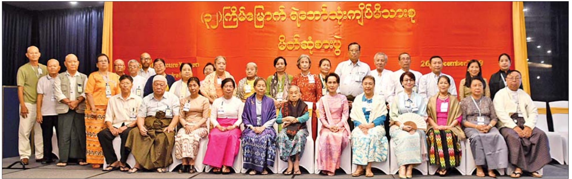
နိုင်ငံတော်၏အတိုင်ပင်ခံပုဂ္ဂိုလ် ဒေါ်အောင်ဆန်းစုကြည် မိတ်ဆုံစားပွဲသို့တက်ရောက်လာကြသည့် ရဲဘော်သုံးကျိပ်ဝင်မိသားစုများနှင့် စုပေါင်းမှတ်တမ်းတင်ဓာတ်ပုံရိုက်စဉ်။

ရန်ကုန် ဒီဇင်ဘာ ၂၆ ရဲဘော်သုံးကျိပ်မိသားစု သာရေးနာရေးအဖွဲ့ (၃၂)ကြိမ်မြောက် မိသားစုမိတ်ဆုံစားပွဲကို ယနေ့ညပိုင်းက ရန်ကုန်မြို့ တောင်ငူလူ့အဖွဲ့နယ်ရှိ Grand Mercure Yangon Golden Empire Hotel ၌ ကျင်းပရာ နိုင်ငံတော်၏အတိုင်ပင်ခံပုဂ္ဂိုလ် ဒေါ်အောင်ဆန်းစုကြည် တက်ရောက်ချီးမြှင့်သည်။