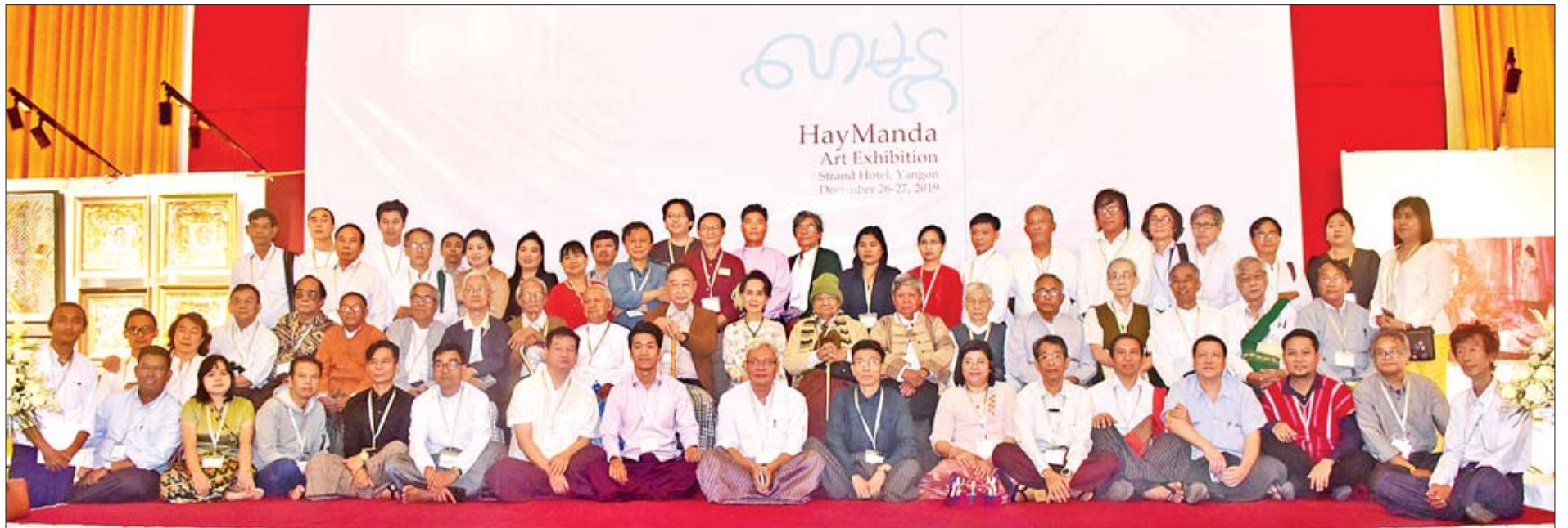
နိုင်ငံတော်၏အတိုင်ပင်ခံပုဂ္ဂိုလ် ဒေါ်အောင်ဆန်းစုကြည် ပန်းချီပညာရှင်ကြီးများ၊ ပန်းချီဆရာ ဆရာမများနှင့်အတူ စုပေါင်းမှတ်တမ်းတင်ဓာတ်ပုံရိုက်စဉ်။