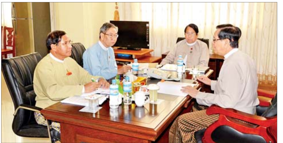
အဖွဲ့ဝင် ပြည်ထောင်စုရှေ့နေချုပ်ရုံး ဒုတိယရှေ့နေချုပ် ဦးဝင်းမြင့်တို့ တက်ရောက်ခဲ့ကြသည်။ အဆိုပါ အစည်းအဝေးတွင် မူကြမ်းကို တည်းဖြတ်ပြင်ဆင်ခဲ့ကြ ကော်မတီအဖွဲ့ဝင်များသည် ကော်မတီ မှ ရေးသားပြုစုထားသည့် အစီရင်ခံစာ သတင်းစဉ်

နေပြည်တော် ဒီဇင်ဘာ ၂၀ ရခိုင်ပြည်နယ် တည်ငြိမ်အေးချမ်းရေး အထောက်အကူပြုကော်မတီ အစည်း အဝေးကို ကော်မတီဥက္ကဋ္ဌ အမျိုးသား လွှတ်တော် ဒုတိယဥက္ကဋ္ဌ ဦးအေးသာ အောင် ဦးဆောင်၍ ယနေ့မနက် ၁၂ နာရီတွင် အမျိုးသားလွှတ်တော် ရေးရာဆောင် (1-20) ၌ ကျင်းပ သည်။