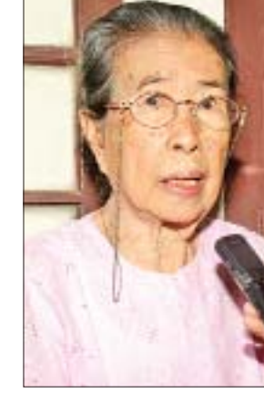
ဒေါ်မာလေး