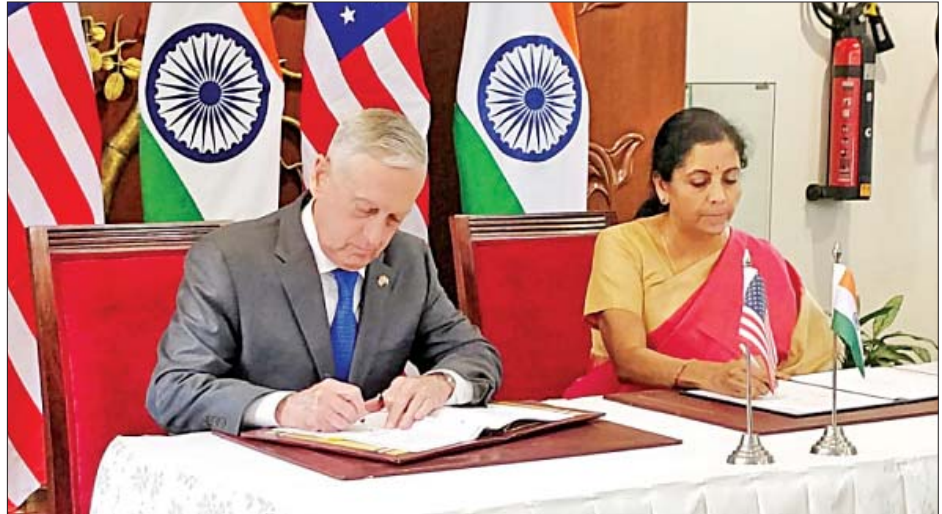
အမေရိကန်ကာကွယ်ရေးဝန်ကြီး မာ့ခ်အက်စ်ပါနှင့် အိန္ဒိယကာကွယ်ရေးဝန်ကြီး ရာဂျီနတ်ဆင်းတို့ လက်မှတ်ရေးထိုးစဉ်။

ကိုးကား - အင်န်အိတ်ချ်ကေ ဘာသာပြန် - အောင်ကျော်ကျော်