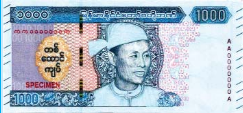
မျက်နှာစာဘက်

လက်ရှိသုံးစွဲလျက်ရှိသော တစ်ထောင်ကျပ်တန် ငွေစက္ကူများသည်လည်း တရားဝင်ငွေအဖြစ် ဆက်လက်တည်ရှိမည်ဖြစ်ပါသည်။