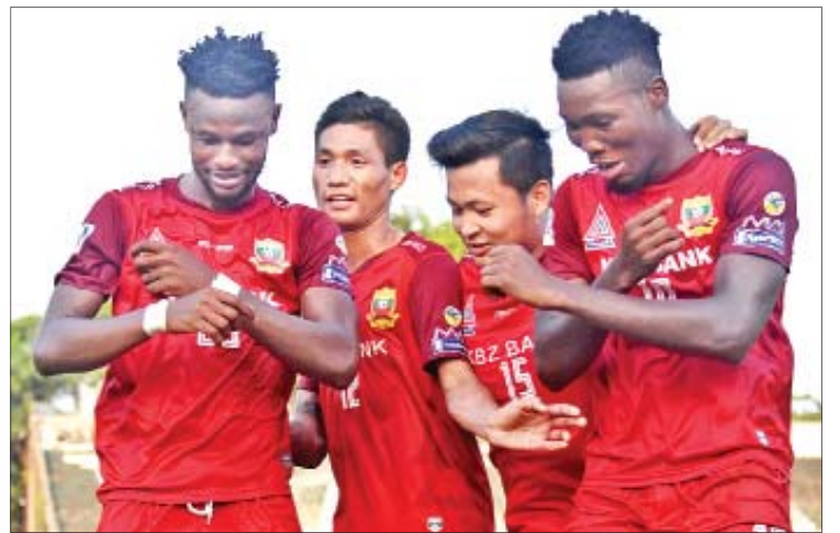
ရှမ်းယူနိုက်တက်အသင်း ကစားသမားများကို တွေ့ရစဉ်။