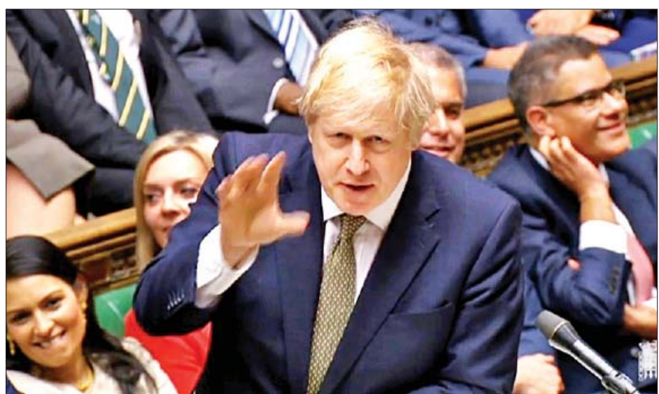
အလဲကာလအတွင်း ကုန်သွယ်ရေး၊ လုံခြုံရေးနှင့် အချက် အလက်များ ကာကွယ်ရေးတို့အပါအဝင် ပြီးပြည့်စုံသော သဘောတူညီချက်တစ်ရပ်အတွက် ညှိနှိုင်းဆောင်ရွက်မည် ဖြစ်သည်။ ကိုးကား - အေအက်ဖ်ပီ၊ ဘာသာပြန် - စိုးသူရ

လွန်ခဲ့သောသီတင်းပတ်က ကျင်းပခဲ့သည့် ရွေးကောက်ပွဲတွင် ဂျွန်ဆင်၏ ကွန်ဆာဗေးတစ်ပါတီက