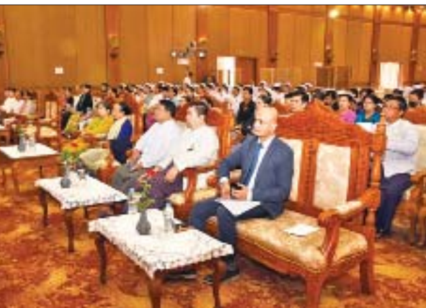
သေဆုံးမှုနှင့် ကာကွယ်ဆေးဖြင့် ကာကွယ်နိုင်သောရောဂါများ ဖြစ်ပွားမှုကို ပိုမိုလျော့နည်းကျဆင်းလာမည်ဖြစ်ကြောင်း၊ ထို့ကြောင့် မြန်မာနိုင်ငံသားဖွားစွမ်းအားစုဆိုင်ရာ မူဝါဒကို အမျိုးသား ကျန်းမာရေးစီမံကိန်း