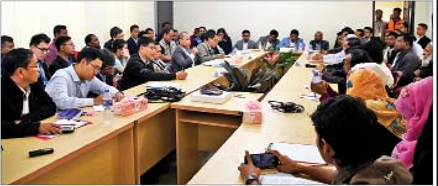
မြန်မာကိုယ်စားလှယ်အဖွဲ့နှင့် ASEAN-ERAT အဖွဲ့ဝင်များ ကော့စ်ဘဇားရှိ တိုးချဲ့စခန်းအမှတ်(၄)တွင် နေရပ်စွန့်ခွာသူများနှင့်တွေ့ဆုံ၍ နေရပ်စွန့်ခွာသူများ ပြန်လည်လက်ခံရေးနှင့်ပတ်သက်သည့် မြန်မာအစိုးရမှ ဆောင်ရွက်လျက်ရှိသည့်ကိစ္စရပ်များကို ရှင်းလင်းပြောကြားစဉ်။

နိုင်ငံခြားရေးဝန်ကြီးဌာန၊ အပြည်ပြည်ဆိုင်ရာအဖွဲ့အစည်းများနှင့် စီးပွားရေးဦးစီးဌာန ညွှန်ကြားရေးမှူးချုပ် ဦးဆောင်သော အဖွဲ့ဝင် (၉)ဦးပါ မြန်မာကိုယ်စားလှယ်အဖွဲ့သည် အာဆီယံအတွင်းရေးမှူးချုပ်ရုံးနှင့် AHA Centre မှ ကိုယ်စားလှယ်များပါဝင်သည့် ASEAN-ERAT အဖွဲ့ဝင်များနှင့်အတူ ဘင်္ဂလားဒေ့ရှ်နိုင်ငံ၊ ကော့စ်ဘဇားစခန်းသို့ ၁၈-၁၂-၂၀၁၉ ရက်နေ့မှ ၁၉-၁၂-၂၀၁၉ ရက်နေ့အထိ သွားရောက်ခဲ့သည်။