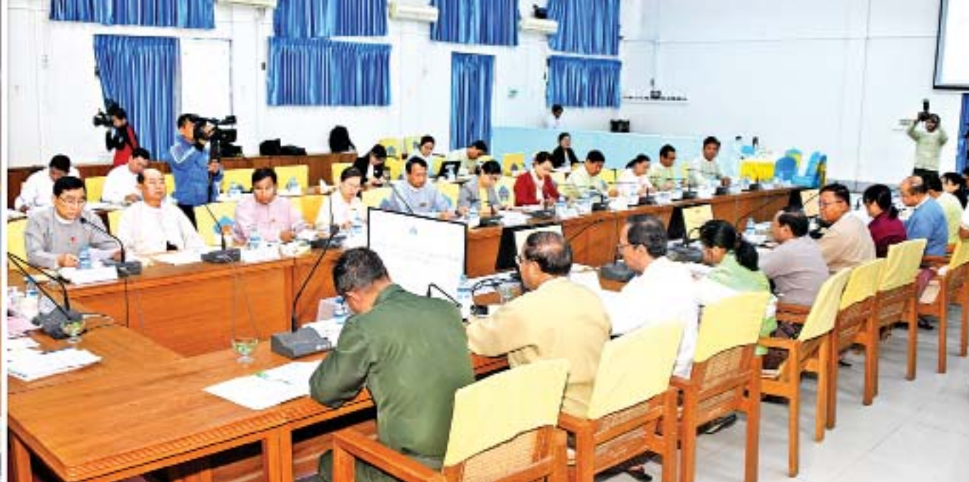
ဒုတိယသမ္မတ ဦးမြင့်ဆွေ လူမှုကာကွယ်စောင့်ရှောက်ရေးဆိုင်ရာ အမျိုးသားကော်မတီ၏ တတိယအကြိမ် အစည်းအဝေးတွင် အမှာစကားပြောကြားစဉ်။

နေပြည်တော် ဒီဇင်ဘာ ၂၀ လူမှုကာကွယ်စောင့်ရှောက်ရေးဆိုင်ရာ အမျိုးသားကော်မတီ၏ တတိယအကြိမ် အစည်းအဝေးကို ယနေ့နံနက် ၉ နာရီခွဲတွင် နေပြည်တော်ရှိ လူမှုဝန်ထမ်း၊ ကယ်ဆယ်ရေးနှင့် ပြန်လည်နေရာချထားရေးဝန်ကြီးဌာန အစည်းအဝေးခန်းမ၌ ကျင်းပရာ လူမှုကာကွယ်စောင့်ရှောက်ရေးဆိုင်ရာ အမျိုးသားကော်မတီဥက္ကဋ္ဌ ဒုတိယသမ္မတ ဦးမြင့်ဆွေ တက်ရောက်အမှာစကားပြောကြားသည်။ အစည်းအဝေးသို့ လူမှုကာကွယ်စောင့်ရှောက်ရေးဆိုင်ရာ အမျိုးသားကော်မတီ ဒုတိယဥက္ကဋ္ဌ(၁)၊ လူမှုဝန်ထမ်း၊ ကယ်ဆယ်ရေးနှင့် ပြန်လည်နေရာချထားရေး