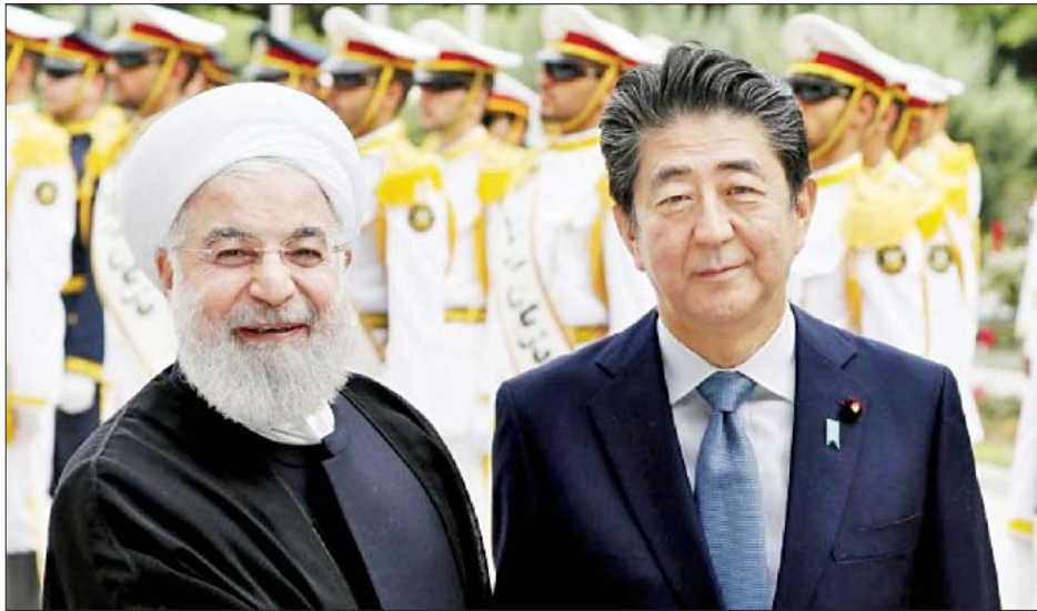
ဂျပန်နိုင်ငံ၏ ရေနံစိမ်းတင်သွင်းမှု စာချုပ်ရရှိရေးအတွက် အီရန်အလယ်ပိုင်းဒေသမှ ဖြစ်သည့်အတွက် အရှေ့အလယ်ပိုင်းဒေသအတွင်း ရှင်ဇီအာဘေးက ဆိုသည်။ အရေးပါကြောင်း ဝန်ကြီးချုပ်အာဘေးက ဆိုသည်။ ဟော်မုစ်ရေလက်ကြားအတွင်း ဘေးကင်းလုံခြုံမှု ရှိစေရန်မှာ အဓိကရလဒ်ကြောင်းတစ်ခု ပိုင်ဆိုင်ထားသော အီရန်နိုင်ငံတွင် အဓိကတာဝန်ရှိပါကြောင်း ဝန်ကြီးချုပ်

တိုကျို ဒီဇင်ဘာ ၂၀ ဂျပန်နိုင်ငံသို့ အလည်အပတ်ရောက်ရှိနေသော အီရန်သမ္မတ ရိုဟာနီတို့သည် ဂျပန်ဝန်ကြီးချုပ် ရှင်ဇီအာဘေးနှင့် တွေ့ဆုံပြီး နှစ်နိုင်ငံအရေးကိစ္စများကို ဆွေးနွေးခဲ့သည်။