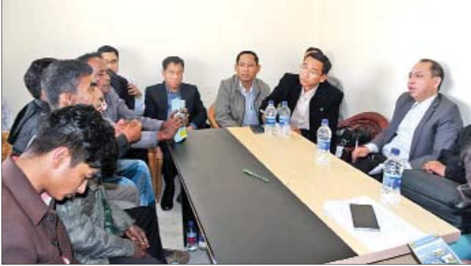
မြန်မာကိုယ်စားလှယ်အဖွဲ့ ကော့စ်ဘဇားရှိ တိုးချဲ့စခန်းအမှတ်(၄)တွင် နေရပ်စွန့်ခွာသူ ဟိန္ဒူဘာသာဝင်များနှင့် တွေ့ဆုံ၍ နေရပ်စွန့်ခွာသူများ ပြန်လည်လက်ခံရေးနှင့်ပတ်သက်သည့် မြန်မာအစိုးရမှ ဆောင်ရွက်လျက်ရှိသည့် ကိစ္စရပ်များကို ရှင်းလင်းပြောကြားစဉ်။