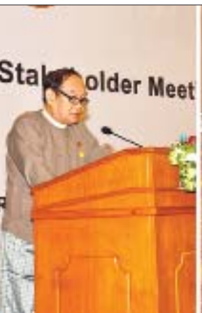
ကျောင်း၊ သားဖွားဆရာမများ၏ ကျွမ်းကျင်မှုနှင့် စွမ်းဆောင်ရည်များ ပိုမိုမြှင့်တင်ရေးအတွက် မြန်မာနိုင်ငံသားဖွားစွမ်းအားစုဆိုင်ရာမူဝါဒပေါ်ထွက်လာရန် အရေးကြီး

အစည်းအဝေးတွင် ပြည်ထောင်စုဝန်ကြီး ဒေါက်တာမြင့်ထွေးက အရည်အသွေးပြည့်ဝပြီး ကျင့်ဝတ်နှင့်ညီသော သားဖွားဆရာမများ မွေးထုတ်ရေး၊ သားဖွားဆရာမများအတွက် သင်ကြားသင်ယူမှုစနစ်များ ကောင်းမွန်ရေး၊ လုပ်ငန်းတက်လမ်းတိုးတက်ကောင်းမွန်ရေးအပေါ်အဝင် သားဖွားဆရာမများ၏အခန်းကဏ္ဍ မြှင့်တင်ရေးနှင့် လုပ်ငန်းခွင်အဆင်ပြေ ချောမွေ့ရေးအတွက် မြန်မာနိုင်ငံသားဖွားစွမ်းအားစုဆိုင်ရာမူဝါဒပေါ်ထွက်လာရန် အရေးကြီး