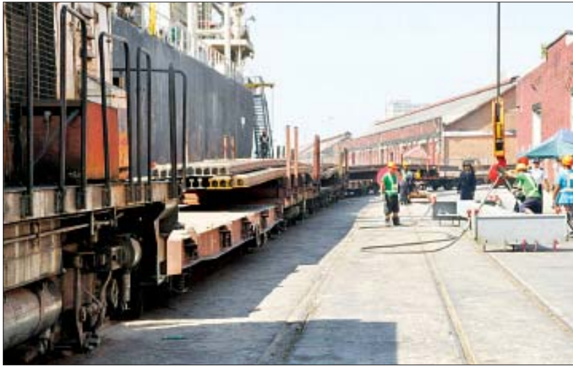
ဒသမ ၅ မိုင်ရှည်လျားပြီး အမြန်ရထားခုတ်မောင်း ချိန်မှာ ၁၅ နာရီမှ ၁၆ နာရီကျော်ထိ ကြာမြင့်သော ကြောင့် ခရီးသွားလာမှုမြန်ဆန်ချောမွေ့စေရန် ရှစ် နာရီဖြင့် မန္တလေးသို့ရောက်ရှိမည့် ကီလိုမီတာ ၁၀၀ ဖြင့် မောင်းနှင်နိုင်သော ဂျပန်နိုင်ငံမှ ရထားတွဲဆိုင် များကို အစားထိုးပြေးဆွဲသွားမည်ဖြစ်သည်။ သစ္စာ