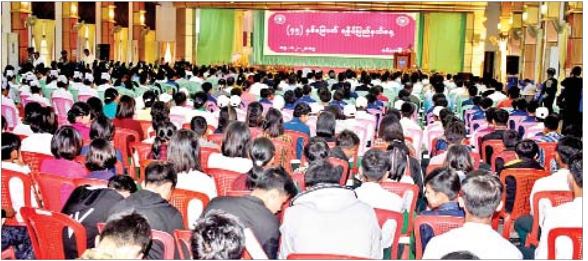
(၄၅) နှစ်မြောက် ရခိုင်ပြည်နယ်နေ့ အခမ်းအနားကို စစ်တွေမြို့၊ ဦးဥတ္တမခန်းမ၌ ကျင်းပစဉ်။