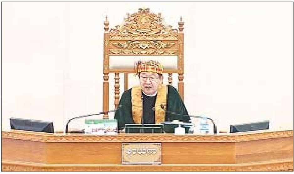
ပြည်ထောင်စုလွှတ်တော်နာယက ဦးတီခွန်မြတ်

ဆက်လက်၍ လွှတ်တော်နှစ်ရပ် သဘောကွဲလွဲသော အမျိုးသားမှတ်တမ်းနှင့် မော်ကွန်းဥပဒေကြမ်း နှင့်စပ်လျဉ်း