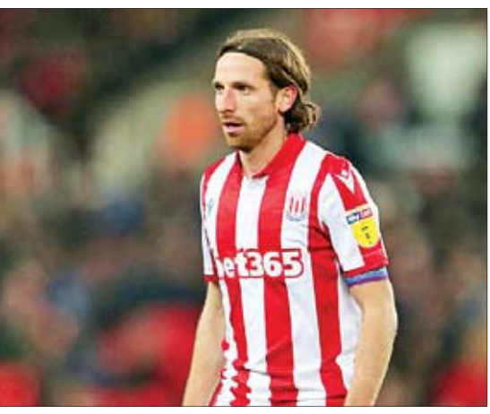
ငွေကြယ်- ရေးသားသည်

ဝက်စ်ဟမ်းအသင်းဟာ စတုတ်စီးတီးအသင်းက လာမယ့်ဇန်နဝါရီ ရှေးကွက်အတွင်းမှာ ထွက်ခွာဖို့ရှိနေတဲ့ ကွင်းလယ်ကစားသမား ဂျိုးအယ်လ်လန်းကို ခေါ်ယူဖို့ စောင့်ကြည့်မှုတွေ ပြုလုပ်နေတယ်လို့ သိရပါတယ်။ ဝက်စ်ဟမ်းအသင်းက ဂျိုးအယ်လ်လန်းကိုခေါ်ယူဖို့ ပြောင်းရွှေ့ ကြေးပေါင်ရှစ်သန်းသတ်မှတ်ထားပေမယ့် စတုတ်စီးတီးအသင်းကတော့ ပြောင်းရွှေ့ကြေးပေါင် ၁၅ သန်းပေးဖို့ တောင်းဆိုထားတာ ဖြစ်ပါတယ်။ ဝေးလံကွင်းလယ်ကစားသမား ဂျိုးအယ်လ်လန်းအား ဝက်စ်ဟမ်း အသင်းက ခေါ်ယူဖို့ ပစ်မှတ်ထားနေတဲ့အပြင် ဘန်လေအသင်း၊ ဝုလ်ဗာ ဟမ်းတန်အသင်း၊ နယူးကာဆယ်အသင်းတို့ကလည်းခေါ်ယူဖို့ စီစဉ်နေ တာဖြစ်ပါတယ်။ စတုတ်စီးတီးအသင်းဟာ ဂျိုးအယ်လ်လန်းကို ၂၀၁၆ ခုနှစ်က လီဗာပူးအသင်းဆီကနေ ပြောင်းရွှေ့ကြေးပေါင် ၁၃ သန်းနဲ့ စာချုပ် ချုပ်ဆိုခေါ်ယူခဲ့တာ ဖြစ်ပါတယ်။