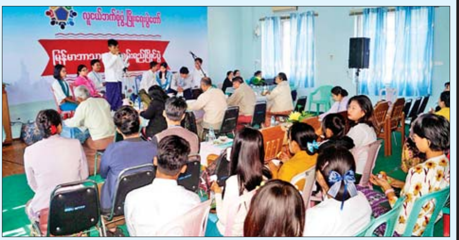
မြန်မာဘာသာစကားပြောစွမ်းရည်ပြိုင်ပွဲတွင် လူငယ်တစ်ဦး ပါဝင်ယှဉ်ပြိုင်စဉ်။