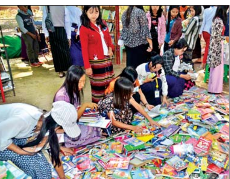
စာအုပ်အရောင်းဆိုင်တွင် စာအုပ်များ ဝယ်ယူဖတ်ရှုလေ့လာသူများပြား။

လူငယ်ဘက်စုံဖွံ့ဖြိုးရေးပွဲတော်(မကွေး) ၏ တတိယနေ့အဖြစ် ဒီဇင်ဘာ ၁၆ ရက်တွင် နံနက် ၉ နာရီမှ ညနေ ၅ နာရီအထိ ဆက်လက်ကျင်းပသွားမည်ဖြစ်ရာ မည်သူမဆိုပါဝင်ဆင်နွှဲနိုင်ကြောင်း သိရသည်။ သတင်း-လင်းဟန်ဇေ၊ ဓာတ်ပုံ-ဝေလျှို၊ ရဲမိုး