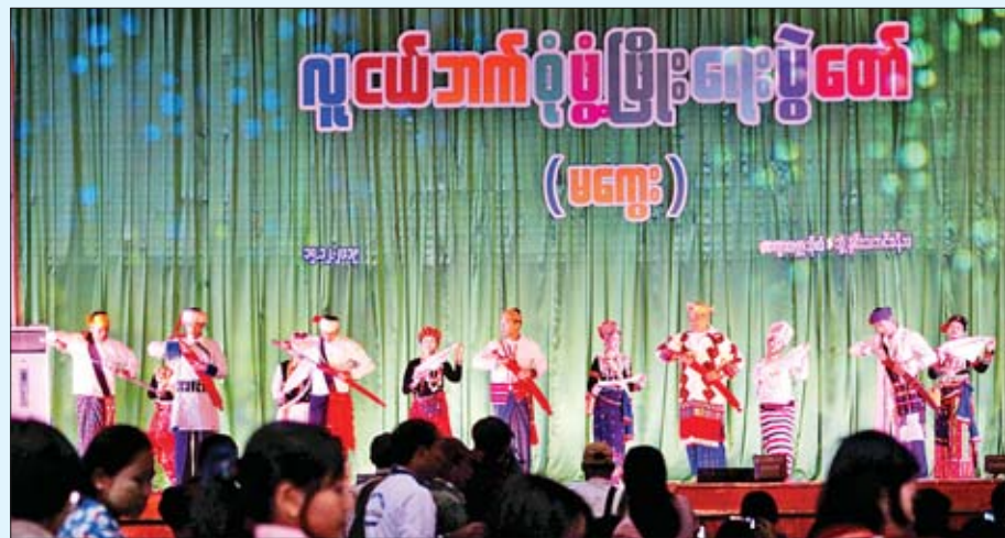
တိုင်းရင်းသားရိုးရာယဉ်ကျေးမှုအကဖြင့် ဖျော်ဖြေတင်ဆက်စဉ်။