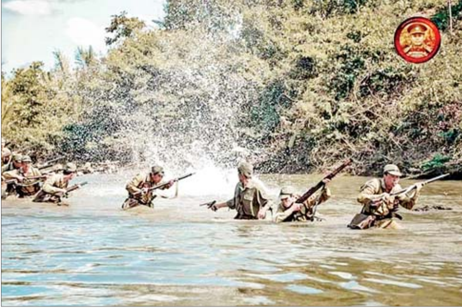
အောင်ဆန်းရုပ်ရှင်ဇာတ်ကားတွင်ပါဝင်မည့် ရဲဘော်သုံးကျိပ်ဇာတ်ဝင်ခန်းအတွက် ပြင်ဆင်လေ့ကျင့်နေမှုများနှင့် ရိုက်ကူးနေကုန်သည့် ရုပ်ရှင်ဇာတ်ကားအတွက် ဇာတ်ဝင်ခန်းပေါင်း ၅၃ ခန်း ရိုက်ကူးပြီးစီးခဲ့ကြောင်း ဒါရိုက်တာ အကယ်ဒမီလူမင်းက ပြောသည်။

ရန်ကုန် ဒီဇင်ဘာ ၁၅ ဗိုလ်ချုပ်အောင်ဆန်း၏ အတ္ထုပ္ပတ္တိကို ရိုက်ကူးနေသည့် အောင်ဆန်းရုပ်ရှင် ဇာတ်ကားအတွက် ဇာတ်ဝင်ခန်းပေါင်း ၅၃ ခန်း ရိုက်ကူးပြီးစီးနေပြီဖြစ်ကြောင်း ဒါရိုက်တာ အကယ်ဒမီလူမင်းက ပြောသည်။