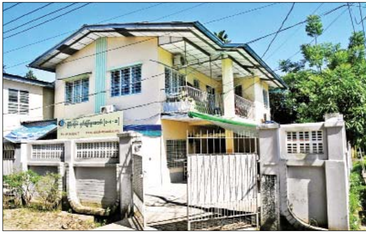
မြန်မာနိုင်ငံမျက်မမြင်များအသင်းရုံး။

၀ စာမျက်နှာ ၁၀ မှ စာကောင်းပေးကောင်းတွေကို အလွယ်တကူ မျှဝေဖလှယ်လို့ရအောင် လုပ်ဆောင်တာ ဖြစ်ပါတယ်။ အခုခေတ်မှာ သတင်းမီဒီယာ တွေက ပွင့်လင်းတယ်။ ရယူနိုင်ဖို့ အချက် အလက် များပြားတယ်။ ဒါပေမယ့် မျက်စိ မမြင်တဲ့သူတွေအတွက် တစုတစည်းတည်း ရှာယူနိုင်ဖို့ အနည်းငယ်ခက်ခဲပါတယ်။ ဒါကြောင့် ဒီဆော့ဖ်ဝဲလ်ကို အကောင်အထည် ဖော်ရခြင်း ဖြစ်ပါတယ်။