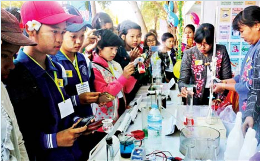
စာတိုက်အဖွဲ့ဝင်များတွင် လက်တွေ့ပြုလုပ်မှုများကို ကျောင်းသား ကျောင်းသူများ ကြည့်ရှုလေ့လာစဉ်။