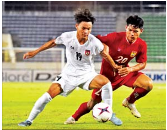
၂၀၁၈ အာဆီယံပြိုင်ပွဲယှဉ်ပြိုင်ခဲ့သည့် မြန်မာ့လက်ရွေးစင်အသင်း။

ငါးသင်းနှစ်အုပ်စုခွဲကာ ကျင်းပမည် ၂၀၂၀ ပြိုင်ပွဲအုပ်စုအဆင့်ပွဲစဉ်များကို နိုဝင်ဘာ ၂၁ ရက်မှ ဒီဇင်ဘာ ၈ ရက်အထိ ကျင်းပမည်ဖြစ်ပြီး ဆီမီးဖိုင်နယ်ပထမအကျော့ကို ဒီဇင်ဘာ ၁၃၊ ၁၄ ရက်၊ ဒုတိယအကျော့ကို ဒီဇင်ဘာ ၁၇၊ ၁၈ ရက်၊ ဗိုလ်လုပွဲကို ဒီဇင်ဘာ ၂၃ ရက်နှင့် ၂၄ ရက်တို့တွင် ကျင်းပမည်ဖြစ်သည်။ ပြိုင်ပွဲကျင်းပ သည့်ပုံစံကို ၂၀၁၈ ပြိုင်ပွဲအတိုင်း စာမျက်နှာ ၁၇ ကော်လံ ၁ သို့ ၂