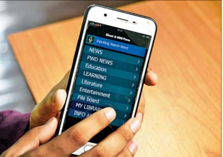
Siloam & MNAB Myanmar Phone Application ဖြင့် သတင်းများနားထောင်ရန် ပြုလုပ်နေစဉ်။

Information Accessible ဆိုတာ အလွန်အရေးကြီးတဲ့ ကဏ္ဍတစ်ခုပါ။ ဥပမာ- ရုပ်သံဆိုရင် ရုပ်ပိုင်းဆိုင်ရာကို အဓိကဖော်ပြသွားတာရှိမယ်။ ရေဒီယိုဆိုရင်လည်း ကျွန်မတို့က အချိန်ပြည့် ရေဒီယိုနားထောင်နိုင်တဲ့ အခြေအနေမရှိဘူး။ အခုလိုဆော့ဖ်ဝဲလ်နဲ့ တင်ထားခြင်းအားဖြင့် မိမိကြိုက်နှစ်သက်တဲ့ဘယ်ရက်ကသတင်းကို ပြန်နားထောင်ချင်တယ်ဆိုရင် ပြန်ရှာပြီးယူလို့ရတယ်။ နောက် Download ဆွဲပြီး သိမ်းထားလို့ရတယ်။ တစ်နေရာမှာ အားလုံးစုပေါင်းပေးထားတာပေါ့။ ဒီ Software ရဲ့ အနှစ်သာရက သတင်းပိုင်းဆိုင်ရာ ဖြန့်ချိမှုတစ်ပိုင်းတည်း မဟုတ်ပါဘူး။ အသံထွက်စာအုပ်တွေ လုပ်တယ်။ စာပေဗဟုသုတရစေမယ့် စာကောင်းပေးကောင်းတွေကို အသံအလှူရှင်တွေနဲ့ စာဖတ်တယ်။ အသံစတူဒီယိုထဲမှာ တည်းဖြတ်တယ်။ ပြီးရင် အခုပြောတဲ့ ဆော့ဖ်ဝဲလ်ပေါ်မှာ တင်ပေးတယ်။ Siloam MNAB Phone ဆော့ဖ်ဝဲလ်သုံးတဲ့ သူတိုင်းက အဲဒီအသံပိုင်တွေကို ရယူနိုင်တယ်။ နောက်ဒီဆော့ဖ်ဝဲလ်ရဲ့ အားသာချက်က မျက်မမြင်တွေ မည်သူမဆို အဲဒီဆော့ဖ်ဝဲလ်မှာ Register လုပ်ထားရင် စာဖတ်ပြပေးလို့ရတယ်။ အဲဒီလိုဖတ်ပြရင် ဒီဆော့ဖ်ဝဲလ်ကို အသုံးပြုသူအားလုံးက နားထောင်လို့ရတယ်။ စာမျက်နှာ ၁၁ သို့ ၀