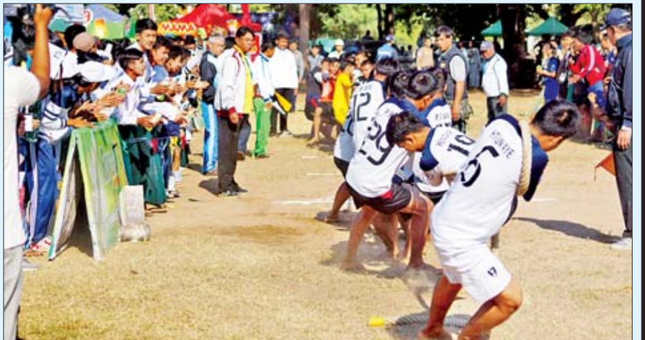
လွန်ဆွဲကစားပြိုင်ပွဲ ပျော်ပျော်ပါးပါးဆင်နွှဲစဉ်။