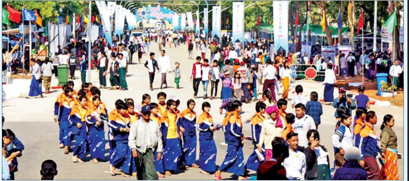
လူငယ်ဘက်စုံဖွံ့ဖြိုးရေးပွဲတော်(မကွေး) ဒုတိယနေ့တွင် လာရောက်ကြည့်ရှုလေ့လာသူများ စည်ကားများပြားစွာ တွေ့ရစဉ်။