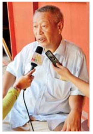
U MORU SHWE (ဥက္ကဋ္ဌ)