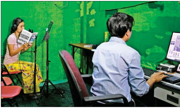
အမြင်အာရုံမသန်စွမ်းသူများ နားထောင်ရန်အတွက် အသံစတူဒီယိုထဲတွင် အသံသွင်း၍ တည်းဖြတ်နေစဉ်။