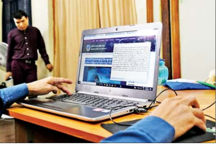
Siloam Phone Application ကို အသုံးပြု၍ ဖုန်းဖြင့်သတင်းနားထောင်နိုင်ရန် ဆောင်ရွက်နေစဉ်။

ဖြေ။ ။ အခုလက်ရှိမှာ သတင်းမီဒီယာပိုင်းဆိုင်ရာ ဗီဒီယိုချန်နယ်တွေ၊ ရေဒီယိုချန်နယ်တွေ အများကြီးရှိပေမယ့်ဘာကြောင့် အပလီကေးရှင်းတွေကိုထပ်ပြီး ဖော်ဆောင်စီစဉ်ရသလဲဆိုရင် မသန်စွမ်းတွေ၊ မျက်မမြင်တွေအနေနဲ့ လက်လှမ်းမီရရှိနိုင်တဲ့