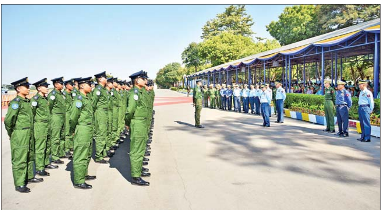
ရေးလုပ်ငန်းများ ထိရောက်စွာဆောင်ရွက်နိုင်စေရန် ပူးတွဲလေ့ကျင့်ခန်းများ အမြဲမပြတ်ပြုလုပ်နေရန် လိုအပ်ကြောင်း။

ပူးတွဲလေ့ကျင့် လက်ရှိကာလတွင် နိုင်ငံတော်အစိုးရ၏ အုပ်ချုပ်မှုယန္တရား၊ လမ်းပန်း ဆက်သွယ်ရေး၊ ပြည်သူ့လူထု၏ အသက်အိုးအိမ်စည်းစိမ်နှင့် အကျိုးစီးပွားများ ကို တိုက်ခိုက်မှုများ၊ တရားမဝင် လက်နက်ကုန်သွယ်မှုများ၊ မူးယစ်ဆေးဝါး ရောင်းဝယ်မှုများ၊ သစ်ခိုးထုတ်မှုများ စသည့် သမားရိုးကျမဟုတ်သည့် စိန်ခေါ် မှုများသည် ပြည်တွင်းငြိမ်းချမ်းရေးနှင့် တည်ငြိမ်ရေးအပေါ် ခြိမ်းခြောက် လျက်ရှိကြောင်း၊ မီးဘေး၊ ရေဘေး၊ လေဘေး၊ မိုးကြိုးဘေး၊ ငလျင်ဘေး၊ ဆူနာမီ ဘေး၊ မြေပြိုဘေး၊ မိုးခေါင်ရေရှားဘေး စသည့် သဘာဝဘေးအန္တရာယ်ကျရောက်မှု များကလည်း ပြည်သူ့လူထုလိုမြို့မြူအပေါ် ခြိမ်းခြောက်လျက်ရှိကြောင်း၊ လူသားချင်းစာနာထောက်ထားမှုနှင့် ဘေးအန္တရာယ်ကယ်ဆယ်ရေး (Humanitarian Assistance and Disaster Relief) လုပ်ငန်းများ ဆောင်ရွက်ရာတွင် တပ်မတော်အနေဖြင့် စနစ်တကျဖွဲ့စည်းထားသော အဖွဲ့အစည်းဖြစ်သည့်အတွက် အားသာသည့် အဖွဲ့အစည်းတစ်ခုဖြစ်ကြောင်း၊ တပ်မတော်၏ အဓိကလုပ်ငန်း တာဝန်ကြီး ၃ ရပ်တွင်လည်း ပြည်သူ့အကျိုးပြုလုပ်ငန်းတာဝန် လုပ်ဆောင်ရန် ဟူ၍ ပါဝင်ကြောင်း၊ ဖွဲ့စည်းပုံအခြေခံဥပဒေတွင်လည်း နိုင်ငံတော်နှင့် နိုင်ငံသား များအတွက် ဘေးအန္တရာယ်ကျရောက်လာလျှင် တပ်မတော်က ကူညီဆောင်ရွက် ရမည်ဟု ပါရှိကြောင်း၊ တပ်မတော် (လေ)သည် ပြည်သူ့အကျိုးပြုလုပ်ငန်းများ၊ သဘာဝဘေးအန္တရာယ် ကယ်ဆယ်ရေးလုပ်ငန်းများ၊ ရှာဖွေကယ်ဆယ်ရေး လုပ်ငန်းများ၊ ပြန်လည်ထူထောင်ရေးလုပ်ငန်းများတွင် အတွေ့အကြုံပေါင်း မြောက်မြားစွာရရှိထားသည်ကို တွေ့မြင်ရမည်ဖြစ်ကြောင်း၊ သဘာဝဘေး အန္တရာယ်ဆိုသည်မှာ အချိန်အခါမရွေးဖြစ်ပေါ်နိုင်ခြင်းကြောင့် ကူညီကယ်ဆယ်