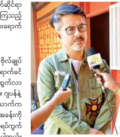
ဒါရိုက်တာ လှမင်း

အောင်ဆန်းရုပ်ရှင်ဇာတ်ကားတွင် ဇာတ်ဝင်ခန်းများအဖြစ်ပါဝင်မည့် တရုတ်နိုင်ငံ အမျိုးမျိုး ကူလန်စုရုပ်ကွက်သို့ သခင်အောင်ဆန်းနှင့် သခင်လှဖေတို့ ရောက်ရှိလာသော ဇာတ်ဝင်ခန်းများ ရိုက်ကူးနိုင်ရန် အနုပညာရပ်ဝန်းအတွင်း၌ ရိုက်ကူးရေးဆက်တင်များ ပြင်ဆင်လျက်ရှိရာ အဆိုပါဝင်ခန်းအတွင်းရှိ အဆောက်အအုံကို တရုတ်ပြည် ကူလန်စုတရုတ်တန်းပုံစံကို မွမ်းမံနေသည့်အပြင် အပေါင်ဆိုင်၊ အရက်ဆိုင်၊ ပရဆေးဆိုင်၊ တရုတ်ကလေးများအတွက် စာသင်ဆောင်၊ တရုတ်လူမျိုးများ ဈေးရောင်း ဈေးဝယ်မှုပုံစံများ ပြင်ဆင်ထားရှိသည်ကို တွေ့မြင်ရသည်။