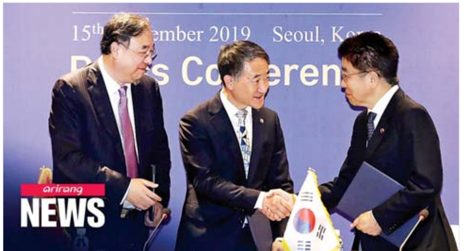
ဂျပန် ကျန်းမာရေး၊ အလုပ်သမားနှင့် လူမှုဖူလုံရေးဝန်ကြီး ကက်ဆူနိုဘူ ကာတို၊ တရုတ်အမျိုးသား ကျန်းမာရေး ကော်မရှင် ညွှန်ကြားရေးမှူး မာရှောင်ဝေနှင့် တောင်ကိုရီးယား ကျန်းမာရေးနှင့် လူမှုဖူလုံရေးဝန်ကြီး ပျိုနန်ဟူးတို့ တွေ့ဆုံစဉ်။

ကိုးကား - အင်န်အိတ်ချ်ဂေ ဘာသာပြန် - အောင်ဇော်လင်း