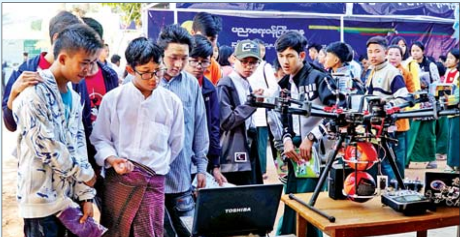
နည်းပညာဆိုင်ရာ အထောက်အကူပြုပြခန်းတွင် ကျောင်းသား ကျောင်းသူများ စိတ်ပါဝင်စားစွာ ကြည့်ရှုလေ့လာကြစဉ်။