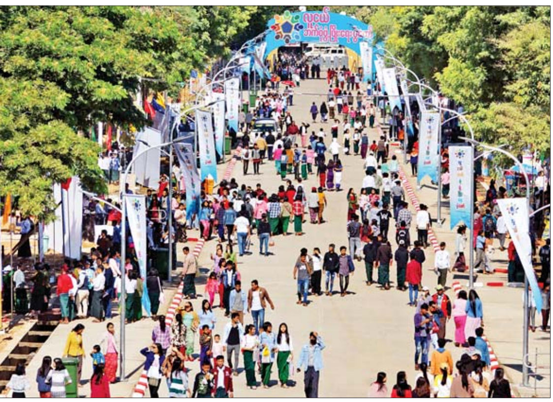
လူငယ်ဘက်စုံဖွံ့ဖြိုးရေးပွဲတော်(မကွေး) ဒုတိယနေ့တွင် လူငယ်များအဖွဲ့လိုက် အဖွဲ့လိုက် လာရောက်လေ့လာကြစဉ်။

ဘွဲ့နှင်းသဘင်ခန်းမအဝင်လမ်း ညာဘက်တွင် စာအုပ်အရောင်းဆိုင်ပေါင်း ၄၀ ကျော် ဖွင့်လှစ်ရောင်းချလျက်ရှိရာ စာပေဝါသနာရှင်များက ဖတ်ရှုအားပေးဝယ်ယူနေကြပြီး ဒေသထွက်ကုန်ပစ္စည်းနှင့် စားသောက်ကုန်များ၊ တိုင်းရင်းဆေးဝါးများ၊ အမှတ်တရလက်ဆောင်ပစ္စည်းများ ရောင်းချသည့် ဆိုင်