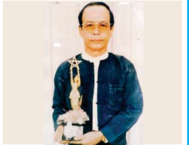
အကယ်ဒမီ မြင့်နိုင်