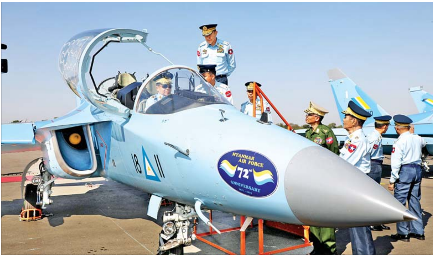
တပ်မတော်ကာကွယ်ရေးဦးစီးချုပ် ဗိုလ်ချုပ်မှူးကြီးမင်းအောင်လှိုင် တပ်တော်ဝင်လေယာဉ်များအား ကြည့်ရှုစစ်ဆေးစဉ်။

နေပြည်တော် ဒီဇင်ဘာ ၁၅ တပ်မတော်(လေ)၏ (၇၂)နှစ်မြောက် နှစ်ပတ်လည်နေ့အခမ်းအနားတွင် နိုင်ငံတော် နှင့် တပ်မတော်၏ လေကြောင်းစွမ်းပကား မြှင့်မားစေရန်အတွက် JF-17 B ဘက်စုံသုံး တိုက်ခိုက်ရေးလေယာဉ် နှစ်စင်း၊ Yak-130 အပေါ့စား တိုက်လေယာဉ် ခြောက်စင်းနှင့် MI-35 P တိုက်ခိုက်ရေးရဟတ်ယာဉ် နှစ်စင်း စုစုပေါင်း လေယာဉ်၊ ရဟတ်ယာဉ် ၁၀ စင်း တပ်တော်ဝင်ခြင်းအခမ်းအနားကို ယနေ့နံနက် ပိုင်းတွင် မိတ္ထီလာတပ်နယ်ရှိ လေကြောင်း အတတ်သင် လေတပ်စခန်းဌာနချုပ်၌ ကျင်းပ သည်။