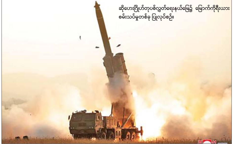
ဆိုဟေးဂြိုဟ်တုပစ်လွှတ်ရေးနယ်မြေ၌ မြောက်ကိုရီးယား စမ်းသပ်မှုတစ်ခု ပြုလုပ်စဉ်။

ကိုးကား-အင်န်အိတ်ချ်ဂေ၊ ဘာသာပြန်-အလင်းသစ်