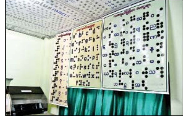
မျက်မမြင်များအသုံးပြုနိုင်ရန်အတွက် မျက်မမြင်စာပုံနှိပ်စက်ဖြင့် မျက်မမြင်ဖတ်စာအုပ် ပုံနှိပ်နေသည်ကို တွေ့ရစဉ်။