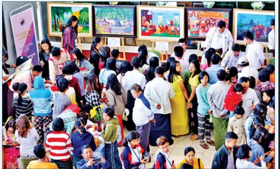
ပန်းချီအနုပညာပြခန်းတွင် ကြည့်ရှုလေ့လာသူများဖြင့် စည်ကားလျက်ရှိစဉ်။