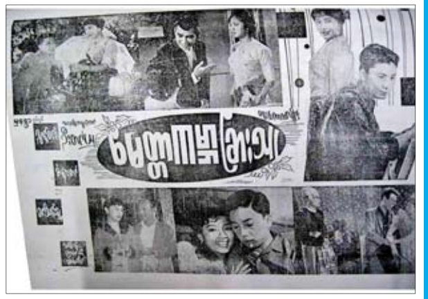
ဆက်လက်ဖော်ပြပါမည်